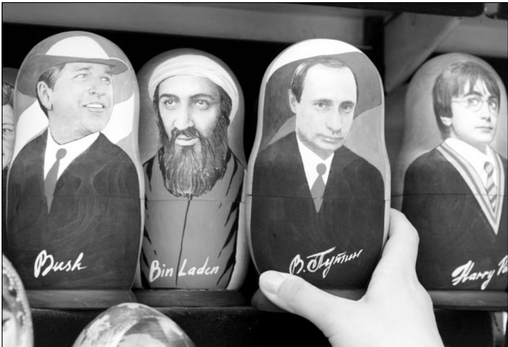
هاري پوتر والرئيس الروسي بوتين واسامة بن لادن وجورج بوش ابطال لعبة الدمي الروسية المتداخلة كما ظهرت في موسكو للتحريخ بالريش الأمريكي