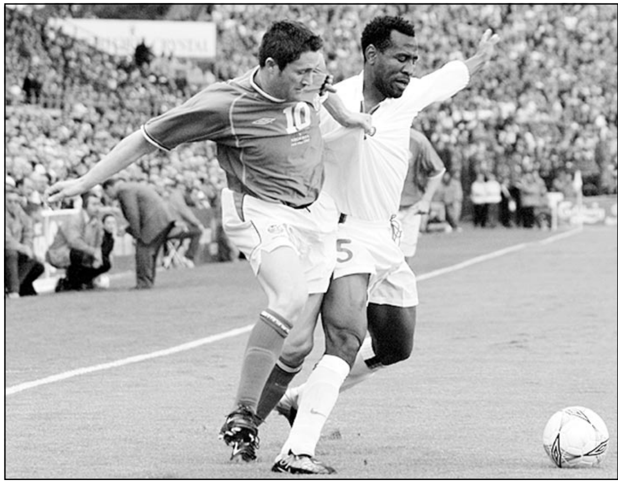
روبي كين لاعب منتخب جمهورية أيرلندا (يسار) في منافسة على الكرة مع أيريك أوكو رونكو لاعب منتخب نيجيريا

وقال الطبيب إن هناك اللاعبين في حالة بدنية أفضل من غيرهم فلا يبي نادي إرسال الإنجليزي باتريك فييرا وتيمير هنري من بين أكثر اللاعبين أرقاباً بعد المشاركة في فوز إرسال بلقبين الدوري الممتاز وكأس الاتحاد الإنجليزي لكرة القدم. ويعاني فييرا من التهاب في كاحل القدم في الوقت الذي يعاني فيه هنري من الألم في الركبة. وقال فيريه «هنري غير قادر على التدريب بشكل طبيعي منذ أن وصل هنا (يوم الثلاثاء) ولا يمكن أن