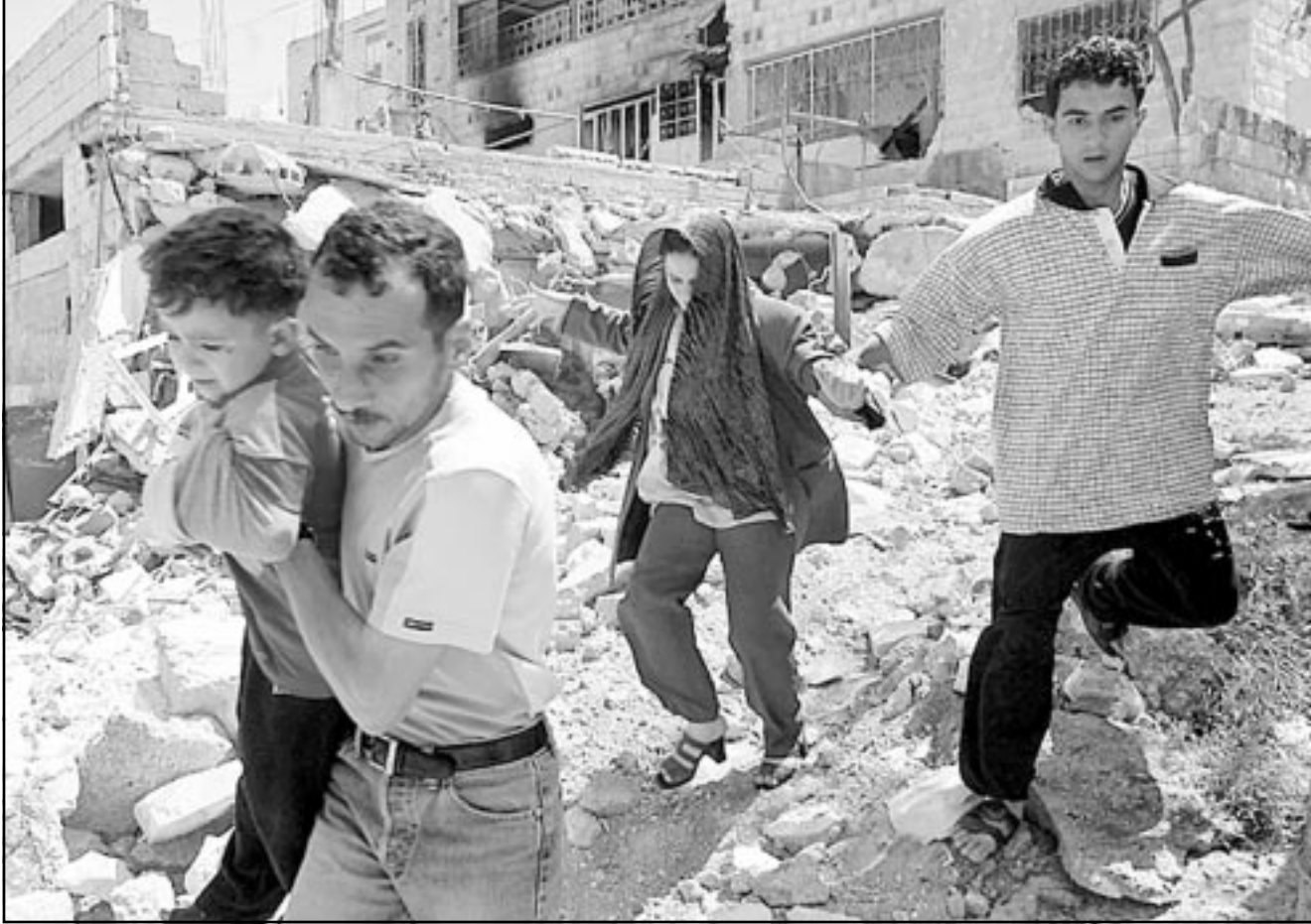
فلسطينيون يهربون من منزلهم بينما جرافات الاحتلال بدأت بدمه في جنين