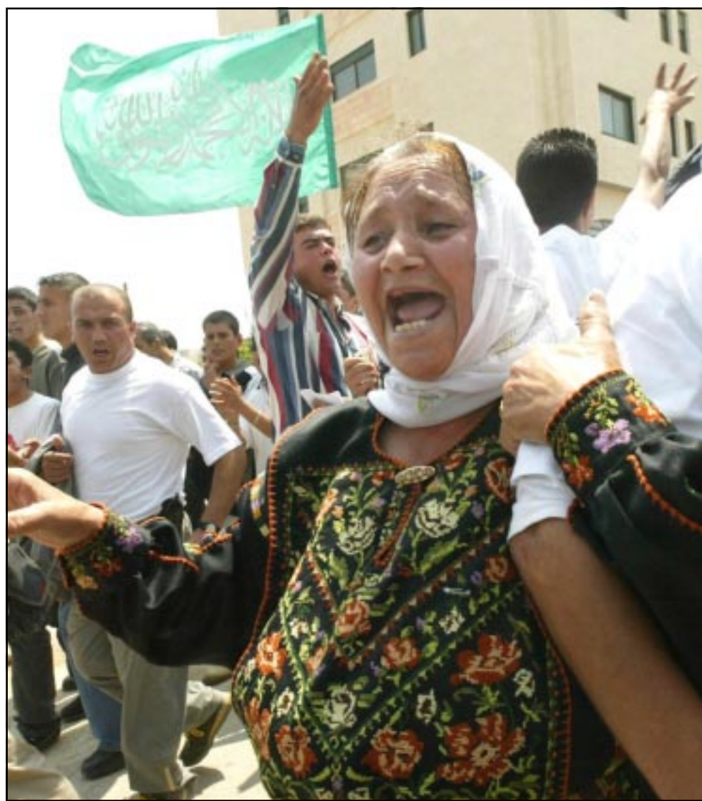
سيدة فلسطينية تشارك في مظاهرة في مدينة رام الله لتأييد السياسة عرفات

الذين اتاروا تساؤلات حول احتمال فشل البيت الابيض في التعامل مع تحذيرات من المخابرات بعد الكشف يوم الاربعاء عن ان بوش تلقى تحذيراً في اب (اغسطس) 2001 من امكانية ان يخطف اعضاء في القاعدة طائرات.