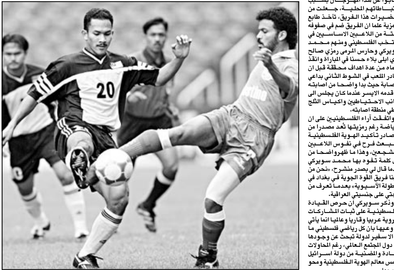
لقطة من إحدى مباريات منتخب فلسطين