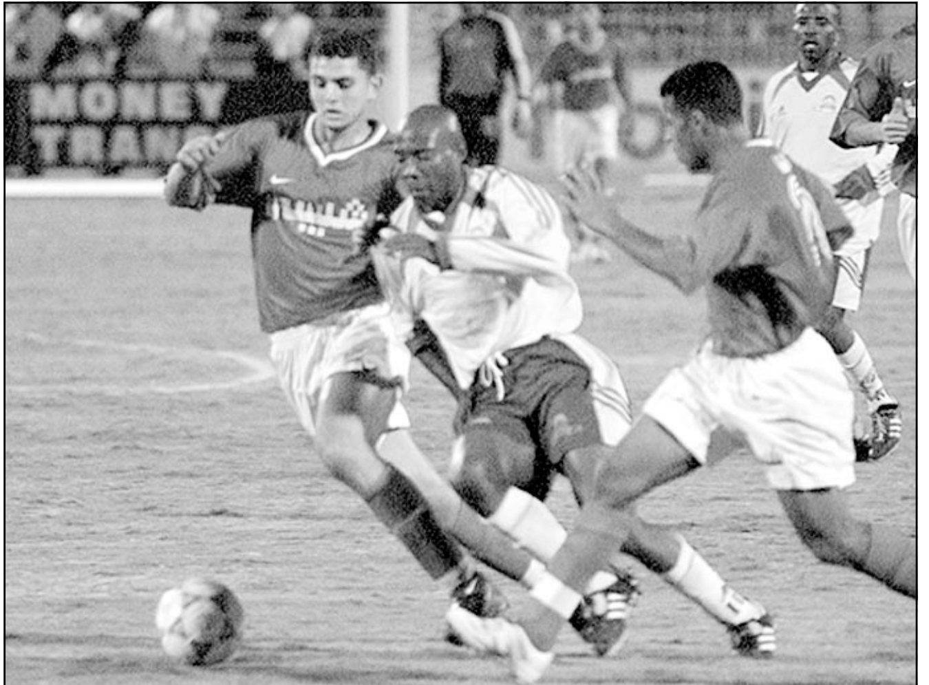
لقطة من إحدى مباريات الاهلي المصري (صورة من الأرشيف)