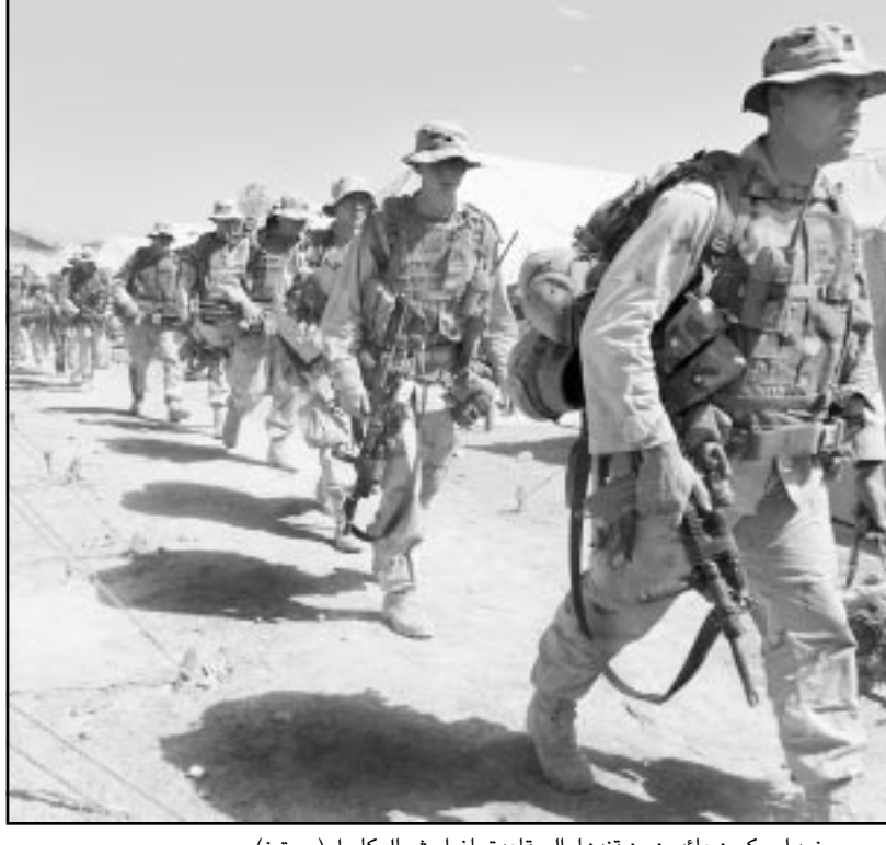
جنود امريكيون عائدون من قندهار الى قاعدة باغرام شمال كابول

وكقاعدة باغرام (افغانستان) - من الكسندر بيريل: اعلن التحالف الدولي الجمعة ان حوالي الف من الجنود البريطانيين والامريكيين وخمسة وعشرون من عناصر حركة طالبان او تنظيم القاعدة في ولاية باكستان شرق افغانستان. وقال قائد القوات البريطانية في القاعدة الجوية لقوات التحالف في باغرام (50 كلم شمال كابول) ان «عملية جديدة تجري حاليا ضد قوات القاعدة وتشارك فيها قوات بريطانية واسترالية» بسانداها الطيران الامريكي. واصف الجنرال البريطاني ان قوات التحالف في اشتباك مع العدو، وبعض المعارك التي استغيا في صفوف قوات التحالف. ووضح الجنرال ليرن ان العملية لم يخطط لها مسبقا، موضحا انها بدأت عندما هاجم مقاتلون من تنظيم القاعدة جنودا استراليين بعد ظهر امس الخميس من عدة مواقع. وقد ارسل الجنود البريطانيون في تعزيزات لسانداة الاستراليين الى المكان، ورفض الجنرال البريطاني تحديد عدد المقاتلين «الإغداء»، مكتفيا بالقول ان جنود قوات التحالف يواجهون «قوة كبيرة» تطلق النار من «رشاشات من العيار الثقيل واسلحة آتية»، ووضح ان المعارك تدور في منطقة معروفة تاريخيا بانها تستخدم من قبل عناصر طالبان والقاعدة، مشيرا الى اكتشاف «عدد من المواقع» التابعة لتنظيمي.