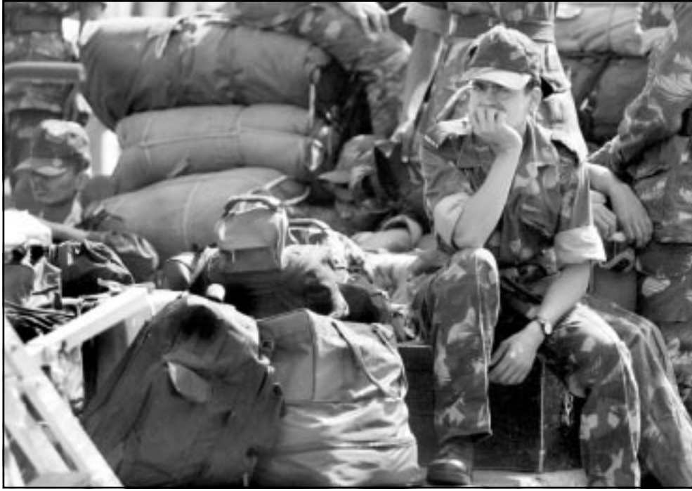
جندي هندي يجلس بالقرب من متعته بعد استعادته الى غامو