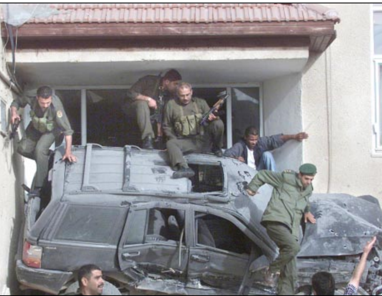
قوات شرطة فلسطينية تحمي مقر الرئاسة الفلسطينية الذي قصفته القوات الإسرائيلية وسدت مداخله بسيارات جيب

الدولتين الفلسطينية والإسرائيلية. على صعيد آخر حمل شمعون بيريس سورية مسؤولية عملية «مجدو» التي نفذتها الإريهاء حركة الجهاد الاسرائيلية واستهدفت حاخمة جنود. وقال بيريس للاذاعة الاسرائيلية «احمل المسؤولية لسورية التي تاوي عشرين منظمة ارهابية في دمشق»، مشيراً الى ان «مضان عبد الله شلح رئيس حركة الجهاد الاسلامي الموجود في دمشق هو الذي امر بتنفيذ هذه الاعداء».