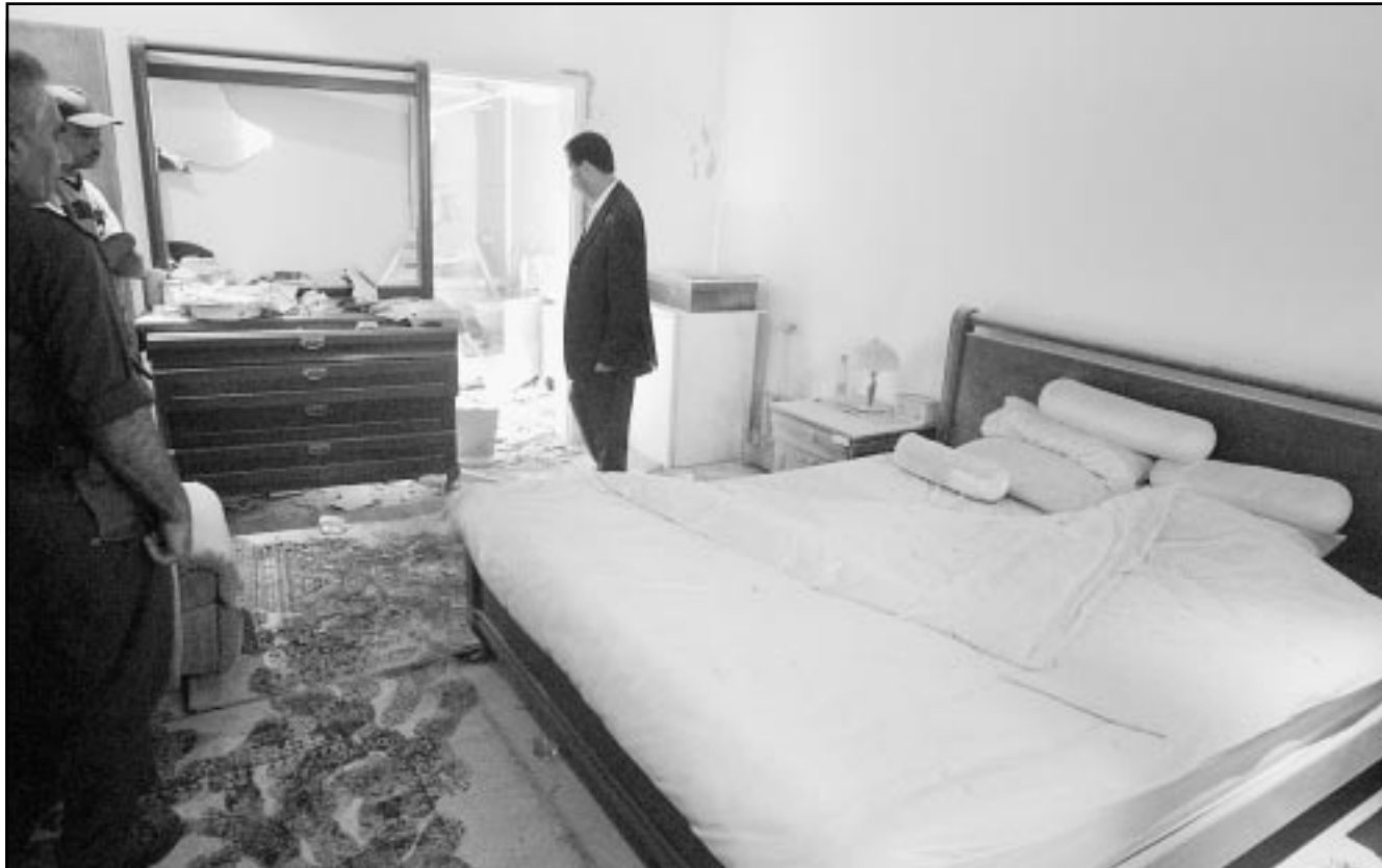
غرفة نوم الرئيس الفلسطيني التي طالها القصف الاسرائيلي امس

■ مدريد- ا ف ب: صرح الرئيس الفلسطيني ياسر عرفات لصحيفة «اي بي سي» الامريكية ان تدمير اسرائيل للسلطة الفلسطينية، يمنع مكافحة العمليات «بفاعلية».