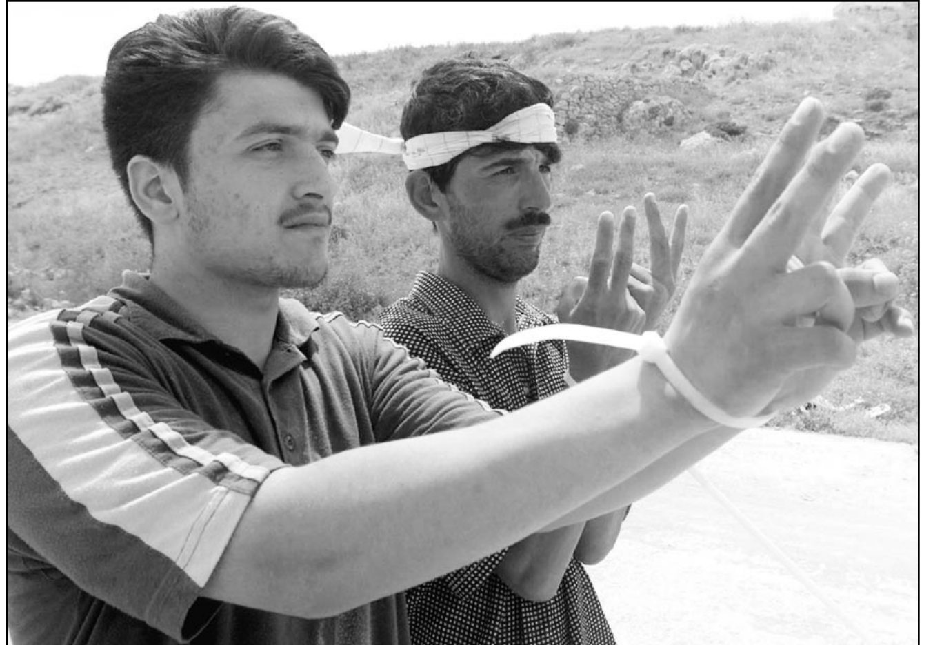
احتجاز الشبان وتكبيهم وتركمهم على الحواجز، احد الاساليب التي يتبعها جنود الاحتلال بكثرة لقمع الشعب الفلسطيني والاذلاله

ولعل اسوأ هذه الحواجز وأكثرها خطورة هو الحاجز القائم على مدخل