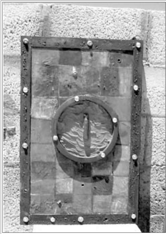
ثلاثة أعمال للفنان