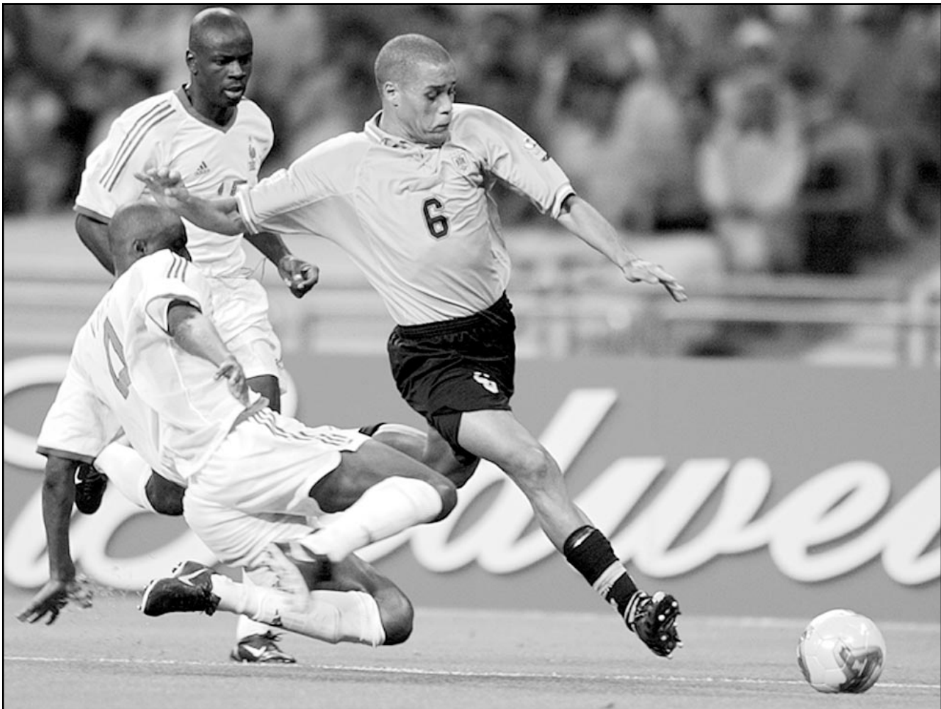
لقطة من المباراة التي جمعت بين منتخبي فرنسا والاورغواي

بارتيز بسهولة (12)، وقام ويلتورد وميكو بلعبة مشتركة رائعة ومرمر الأخير باجتاده هنري داخل المنطقة لم يحسن استغلالها (14).