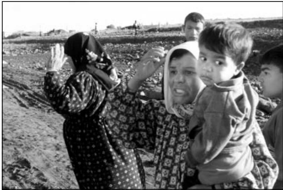
عائلات سورية تبحث عن بقايا منازلها التي جرفها السد

وقرقرور ومشيك التي هجرها سكانها. وأوضح محافظ حماة ان التحقيق مع المسؤولين عن السد مستمر. وقال احد سكان قرية مشيك ان «حجم المياه في السد تخطى المستوى المسموح به».