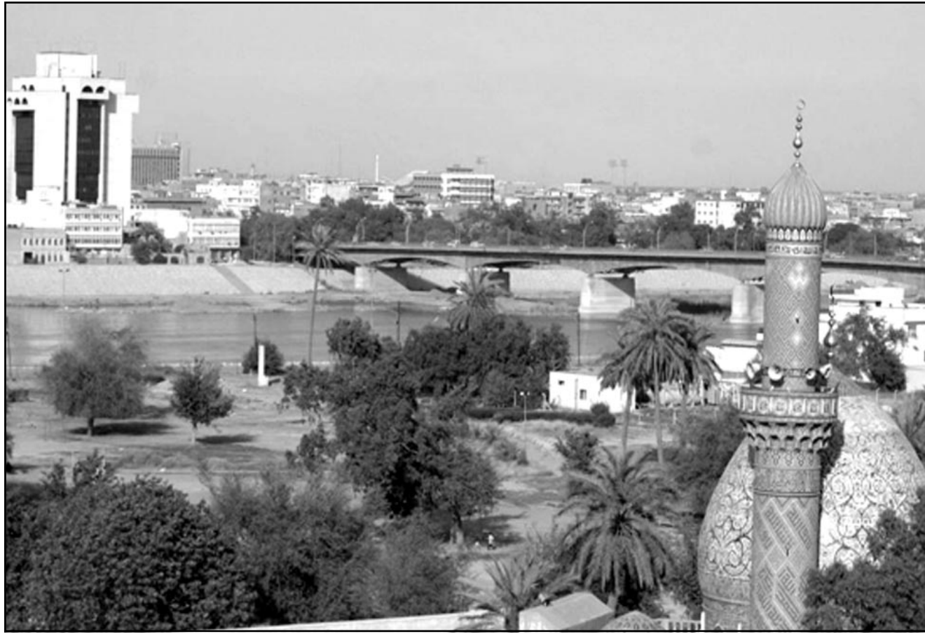
منظر حديث مدينة بغداد التي يقسمها نهر دجلة