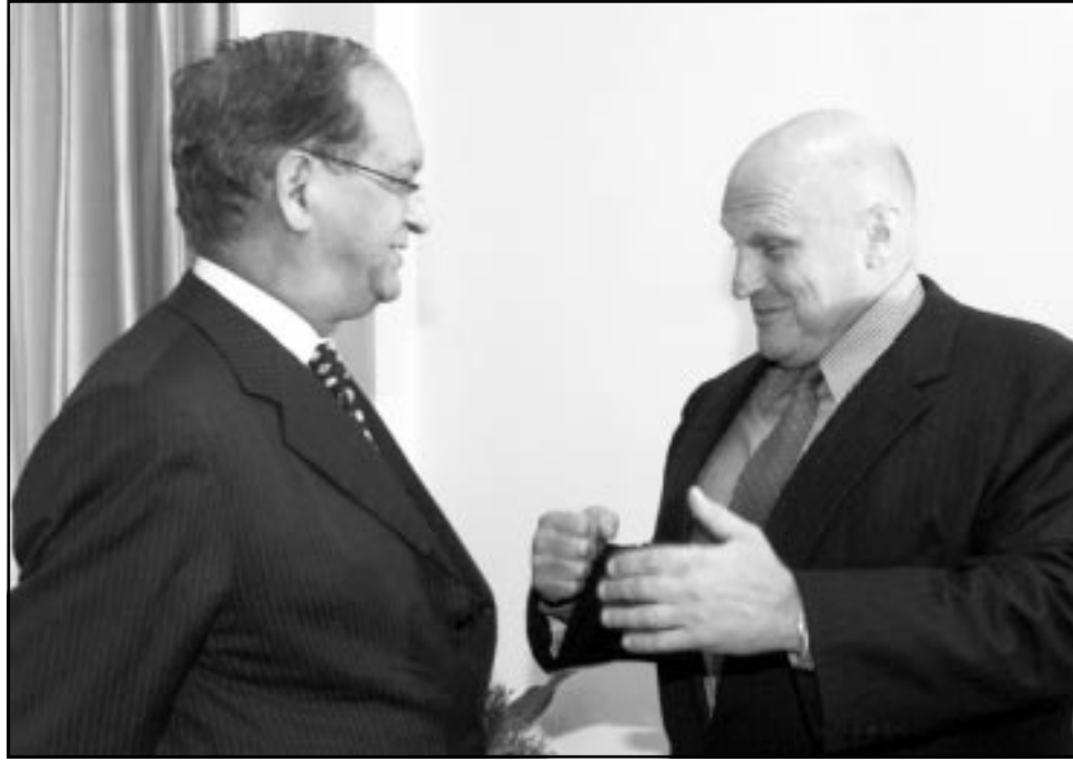
وزير الخارجية الباكستاني عبد الستار يرحب بمساعد وزير الخارجية الامريكي ريتشارد ارميتاج لدى وصوله الى اسلام اباد

وكالات: ما زال خطر اندلاع حرب بين الهند وباكستان كبيراً بعد فشل ساعي المصالحة في مؤتمر الماني، لكن الدبلوماسية الدولية تتمتع حتى الآن بهامش للمناورة من أجل تجنب وقوع الاسوأ في المنطقة التي وصلها امس مسؤول امريكي كبير. وأعلن مساعد وزير الخارجية الامريكي ريتشارد ارميتاج امس الخميس في اسلام اباد انه يريد «تخفيف درجة الحرارة» بين الهند وباكستان. وقال آخر محادثات مع الرئيس الباكستاني برويز مشرف ان «الوضع معقد ومتفرع للغاية». وأضاف للتلفزيون الباكستاني انه متراح لحرص الرئيس الباكستاني على تحاشي الحرب «وهو ما تحرص عليه الهند ايضا». وأوضح ان الجنرال مشرف قال له ان «شيئا لا يجري عبر خط المراقبة» الذي يقسم كشمير بين الدولتين. وردا على سؤال حول افق المستقبل، قال ارميتاج ان «الوقت سيحكم» مقدما نفسه على انه «رجل يحاول القيام بواجبه». وبالإضافة الى ذلك، اشار ارميتاج الذي سيجتمع الى نيودلهي في اطار مهمته، الى «المساعدة المتأخرة» التي تقدمها لباكستان للحرب ضد الارهاب في أفغانستان. ومن المنظر ايضا ان يقوم وزير الدفاع الامريكي دونالد رامسفيلد خلال الياوم المقبلة بزيارة للعاصمتين المتخاصمتين في جنوب آسيا. وقالت الشبكات الهندية امس الخميس ان قوات الانقاذ قتلت بالرصاص زعيم جماعة متشددة موالية لباكستان في الحزة التي تحكمه الهند من كشمير. ويأتي مقتل محمد رفيق لون رئيس جماعة حركة الجهاد الاسلامي التي تقاوم لضم كشمير الى باكستان في الوقت الذي تشهد فيه الهند وباكستان نحو مليون جندي عند حدودهما وتبادل اطلاق النيران والمدفعية. وتصاعدت حدة التوتر بعد تعرض