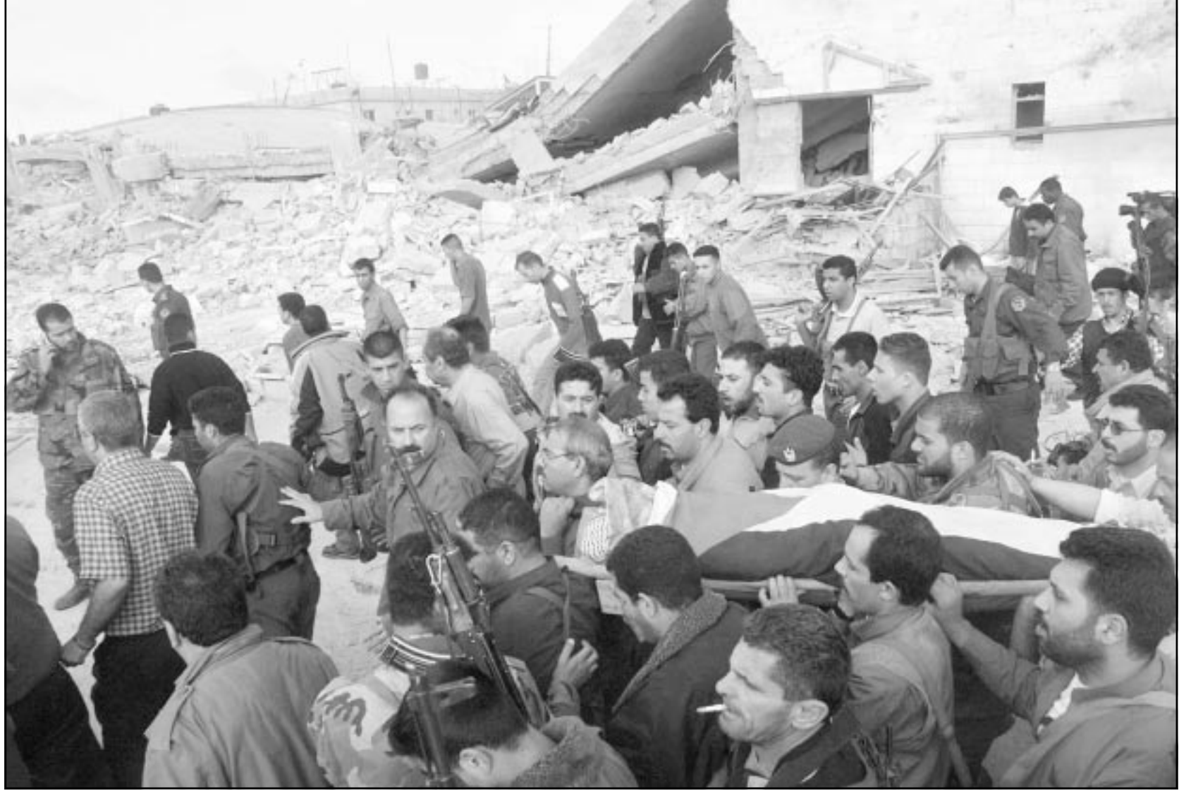
الفلستينيون يخرجون جثمان الشهيد جهاد خندقجي من مقر الرئاسة الذي يبدو في خلف الصورة وقد نفض بعض اجزائه