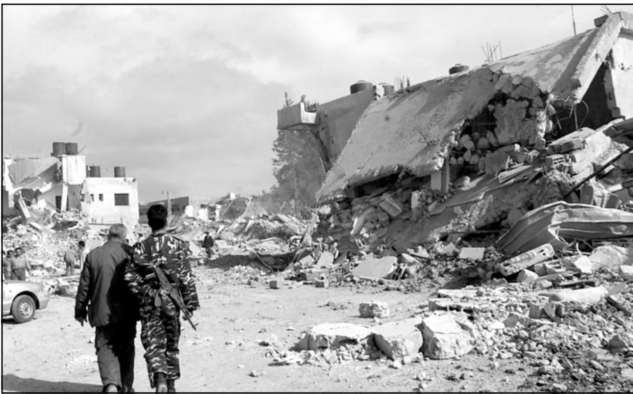
شرفي فلسطيني ومدني يتفقدان مجمع الرئاسة في رام الله بعد تدمير قوات الاحتلال الاسرائيلي جزءا منه أثناء احتفائهم للمدينة

الاربعاء، في الذكرى الخامسة والثلاثين لحرب الأيام الستة، توجهت نحو «الخط الأخضر» ذلك الرسم الصوري الذي لم يعد له ذكر على الارض بل وشطب من الخرائط الرسمية -بضع مجموعات من الاسرائيليين: «الخطوط»، من خط بارليف وحتى خط الحدود اللبنانية- ونزعوا فيما بينهم المراجح من اقامة «جدار الفصل البيني» الذي ليس له أي معنى سياسي، ان الموافقة المفاجئة من رئيس الوزراء، اربيل شارون، على جدار الفصل قد جاءت كمؤشر متردد على «الحق» - «الفصل» مقبول كموقف لمعسكر السلام»- وترسيم خط جدار «الخط الأخضر» كغبار يمان بأن يتداخل وأشجار الزيتون التي زرعه اليسار.