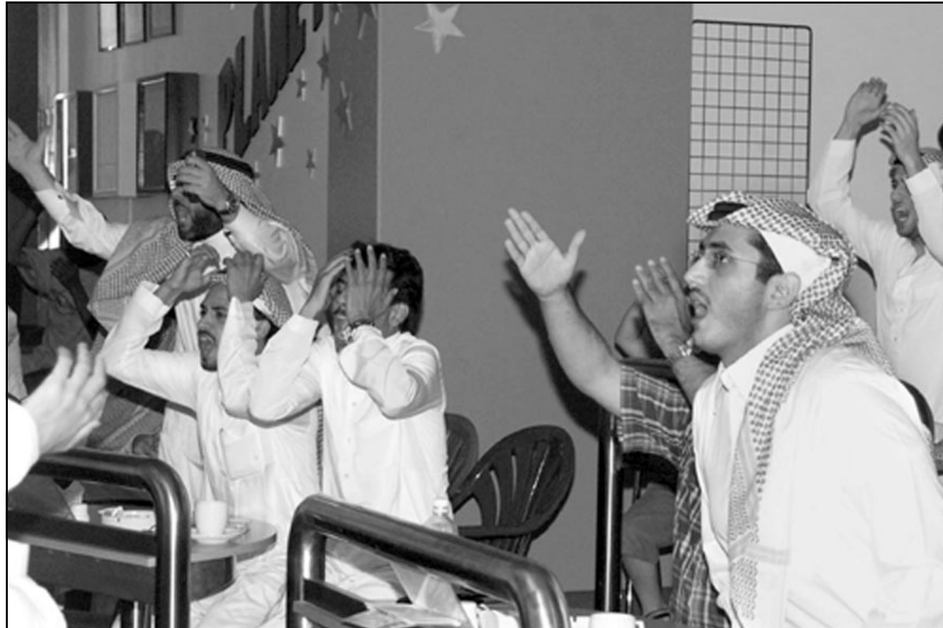
مشجعون سعوديون في مقهى بالرياض يتابعون مباراة منتخب بلدهم ضد المنتخب الكاميروني امس

كما دعت المنظمة السلطات اليمنية إلى «إعادة النظر في قانون الصحافة والمطبوعات المعمول به حالياً، والذي يتضمن عقوبة السجن للصحافيين، ومنعهم من مزاوله المهنة، وجواز مصادرة الصحف أو إغلاقها بالطرق الإدارية، إضافة إلى النصوص المطاطسة المتعلقة بالتهم التي يمكن توجيهها إلى الصحافيين، وقيادات الرأي العام، مثل الإساءة إلى الوحدة الوطنية، وإثارة العنصر الطائفية، وتهديد النظام الجمهوري» على حد تعبير البلاغ الصحافي.