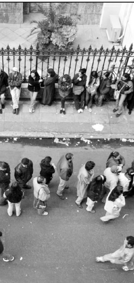
طابور من الارجنتينيين الذين ينتظرون دورهم امام احد البنوك في العاصمة بوينس آيرس لشراء دولارات وسط مخاوف من استمرار تصاعد التضخم وتآكل القدرة الشرائية للعملة الوطنية

■ واشنطن-رويترز: افادت دراسة امريكية ان اليورو الذي تجاهله المستثمرون لدى طرحه قد يصبح بمرور الوقت العملة الرئيسية منخبا الدولار