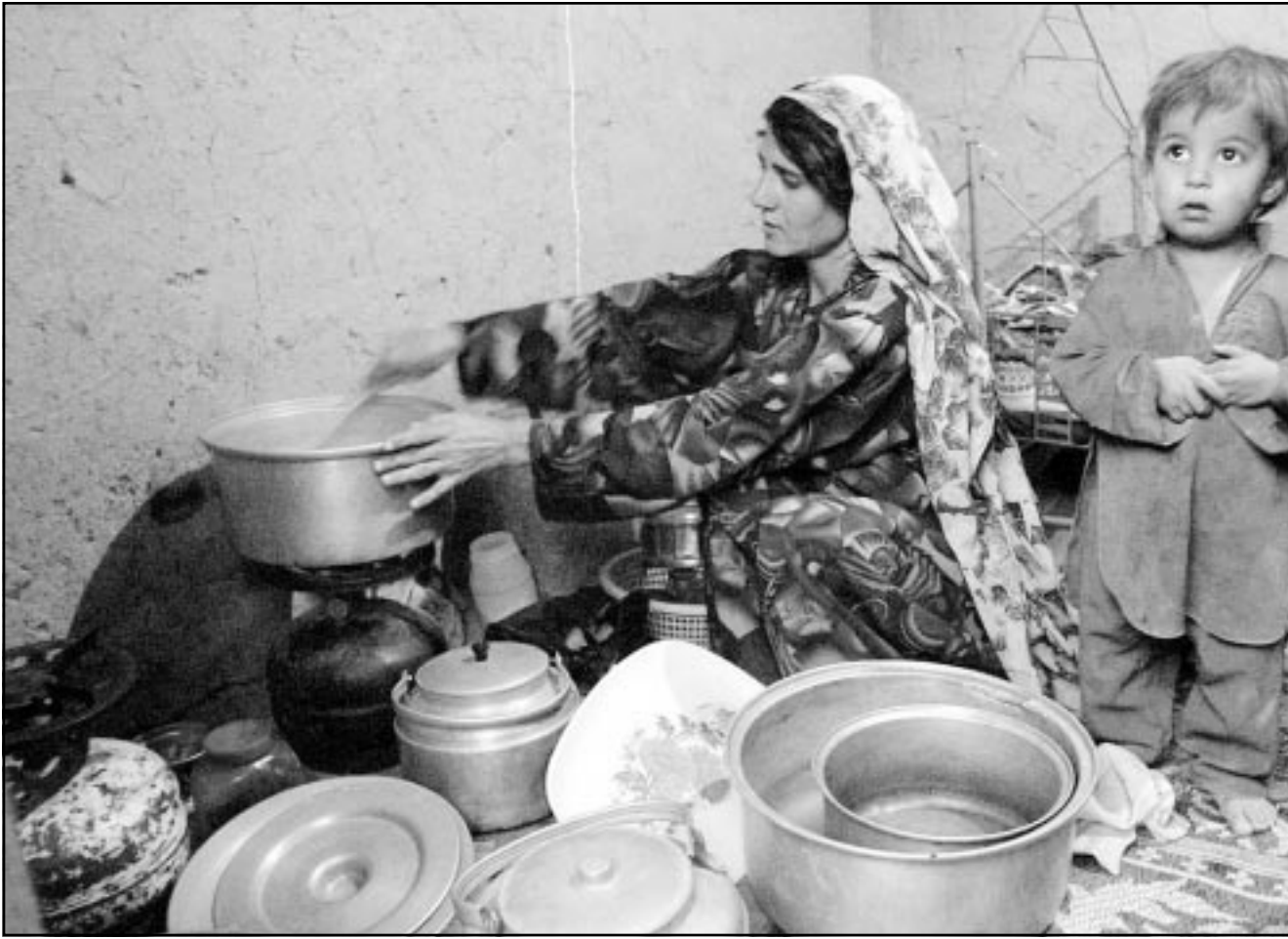
سيدة افغانغية مع طفلها في مخيم للاجئين