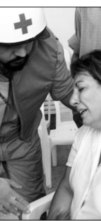
مسعف لبناني يطمئن على سيدة وابنتها كانتا بين الناجين

بيروت - «القدس العربي» - من سعد الياس: جريمة مروعة شهدتها بيروت امس، حين اقدم احد المسلحين على قتل ثمانية موظفين في صندوق التعويضات لافراد الهيئة التعليمية في المدارس الخاصة لاسباب شخصية اقتصادية وفق المعلومات الأولية التي رشحت عن الحقيقات، فيما ذهب بعضهم الى طرح تساؤلات عما اذا كانت هناك ابعاد طائفية للحادث كون معظم القتلى ينتمون الى طائفة معينة، وقد نفى وزير العدل سمير الجسر بشدة هذه التكهنات ووضح انه «لا توجد دواع طائفية، وان الادارة العامة للدولة تضم موظفين من كل الطوائف». كذلك أكد قاضي التحقيق الاول في بيروت حاتم ماضي «ان اسباب الجريمة شخصية مادية وكل من يصرح بان شيء يعاكس او مخالف يعرض نفسه للملاحقة الجزائية لأنه يعرقل اعمال التحقيق».