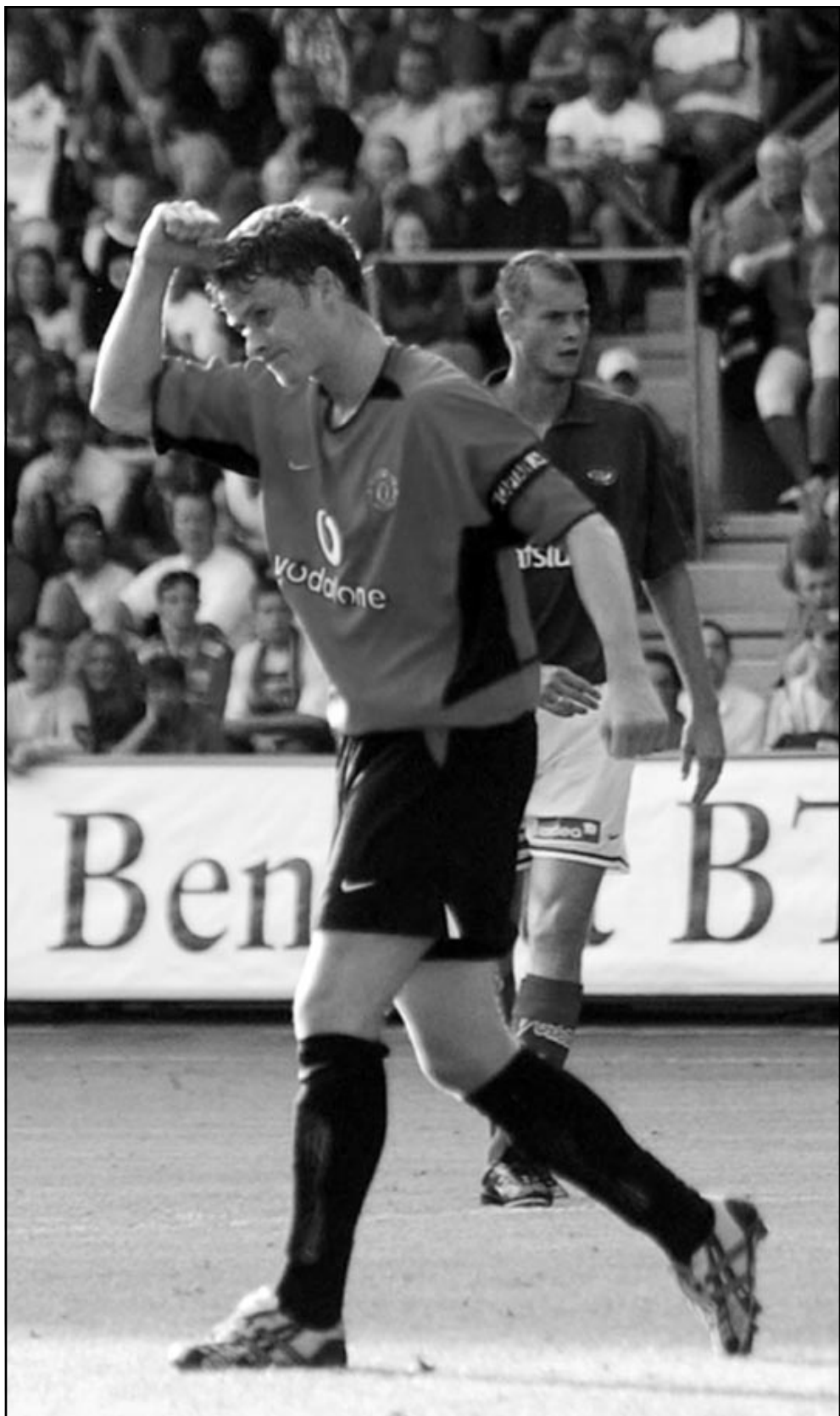
لاعب مانشستر يونايتد اول جونر خلال المباراة الودية مع الفريق النرويجي فاليرينجا (رويترز)

■ مدريد-رويترز/ قال نجم المنتخب البرازيلي لكرة القدم ريفالدو انه سيؤجل وصوله الى فريقه الجديد ميلانو الايطالي لكي يتوقف لفترة في برشلونة. وقال ريفالدو الذي أعلن التغييرات في خطته على موقعه على الانترنت انه سيضم الى فريقه الجديد المتواجد حاليا في مدريد يوم السبت. ويلعب ميلانو في بطولة ودية تضم ثلاثة فرق معه وهي ريال مدريد وليفربول وبايرن ميونخ. وتبدأ المباريات في مطلع الاسبوع وسيكون ريفالدو متواجدا مع زملائه الجدد في مباراتهم امام بايرن ميونخ يوم السبت ولكن من غير المتوقع ان يلعب في المباراة. وقال ريفالدو الذي وقع على عقد مع ميلانو الاسبوع الحالي بعد ان انهى برشلونة الاسباني عقده قبل عام من انتهائه «لن انضم لميلانو يوم الخميس. قبل ان انضم للفريق اود ان اودع المشجعين والصحافيين الاسبان وحتى يتحقق لي ذلك سأعقد مؤتمرا صحافيا يوم الجمعة في فندق ببرشلونة». واستطرد «سأسافر في اليوم التالي الى مدريد للانضمام الى ميلانو».