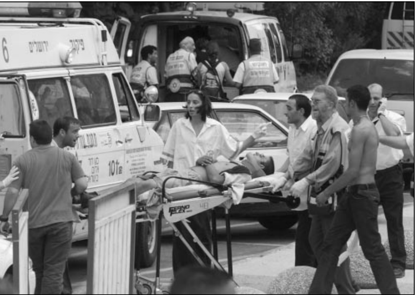
جنود وعامل إغاثة اسرئائليون يسعفون الجرحى من جراء الانفجار أمس

«تشجيع» الهجمات على الاسرائيليين لتجنب اجراء اصلاحات في السلطة الفلسطينية. وقال «ان السلطة الفلسطينية تحاول التخلص من