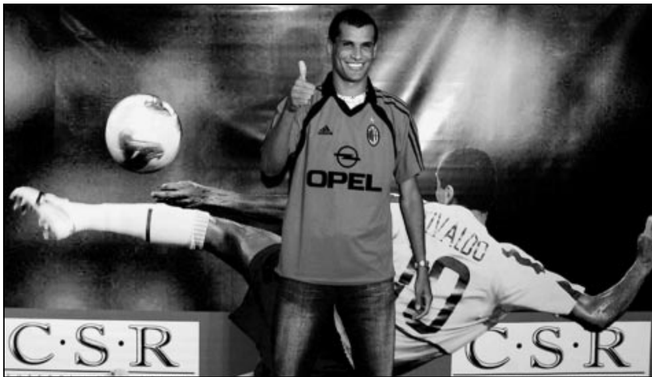
ريفالدو بعد المؤتمر الصحفي الذي أعلن فيه الانضمام الى ميلانو

■ مدريد-رويترز/ قال نجم المنتخب البرازيلي لكرة القدم ريفالدو انه سيؤجل وصوله الى فريقه الجديد ميلانو الايطالي لكي يتوقف لفترة في برشلونة. وقال ريفالدو الذي أعلن التغييرات في خطته على موقعه على الانترنت انه سيضم الى فريقه الجديد المتواجد حاليا في مدريد يوم السبت. ويلعب ميلانو في بطولة ودية تضم ثلاثة فرق معه وهي ريال مدريد وليفربول وبايرن ميونخ. وتبدأ المباريات في مطلع الاسبوع وسيكون ريفالدو متواجدا مع زملائه الجدد في مباراتهم امام بايرن ميونخ يوم السبت ولكن من غير المتوقع ان يلعب في المباراة. وقال ريفالدو الذي وقع على عقد مع ميلانو الاسبوع الحالي بعد ان انهى برشلونة الاسباني عقده قبل عام من انتهائه «لن انضم لميلانو يوم الخميس. قبل ان انضم للفريق اود ان اودع المشجعين والصحافيين الاسبان وحتى يتحقق لي ذلك سأعقد مؤتمرا صحافيا يوم الجمعة في فندق ببرشلونة». واستطرد «سأسافر في اليوم التالي الى مدريد للانضمام الى ميلانو».