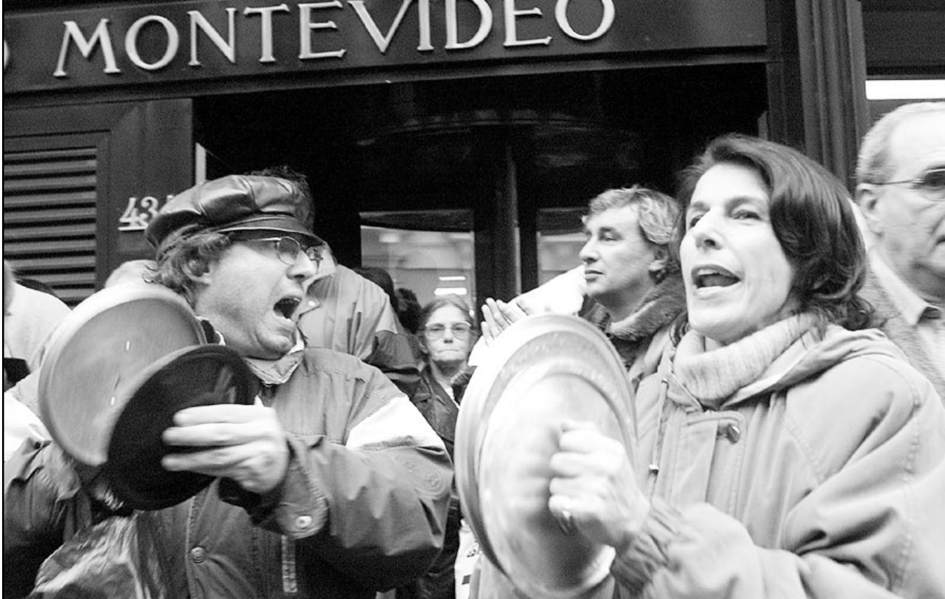
اصحاب حسابات ارجنتينيين يحتجون بقرع اوعية الطعام على تعمد الحكومة ودائعهم بالعملة الاجنبية

بوينس ايرس - اف ب: اعتبر الرئيس الارجنتيني اودارنو روهادلي امس الاربعاء ان الازمة في أمريكا اللاتينية تبين ان نموذج اقتصاد السوق «انهيار» في المنطقة، واقر ان الوضع في بلاده «انتقلت عدواه» الى الازورغواي التي تدهور احتياطي عملاتها الاجنبية بنسبة 79 %.