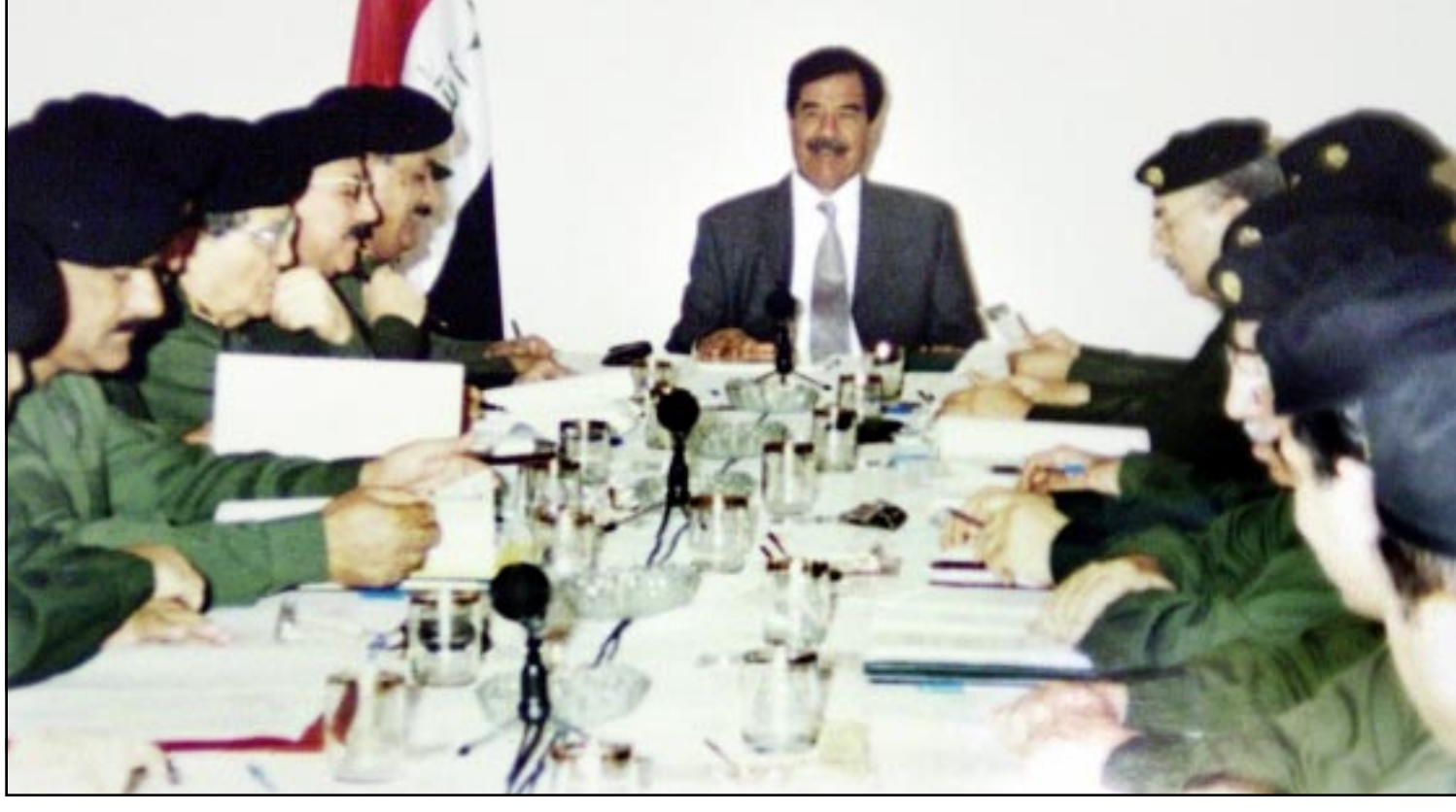
الرئيس العراقي صدام حسين اثناء اجتماع الحكومة اقر مشروع انشاء قمر صناعي للاتصالات والبث التلفزيوني

وقال بيريس «العراق ليس دولة محايدة، انهم يسهون لانتاج حياض نووي، وانا لم ارجاء (هجوم) فرمبا اعتشف