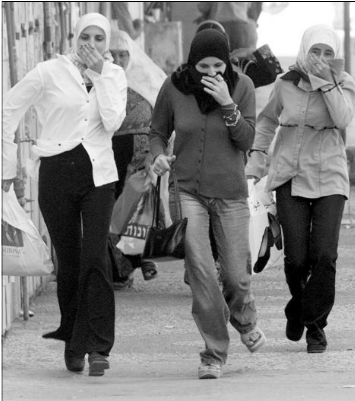
فتيات فلسطينيات يركضن ابتداءً من الإحتلال بعد إعلان فحائي لحظر التجول في مدينة رام الله