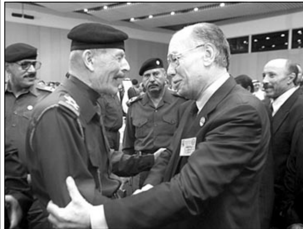
نائب رئيس مجلس قيادة الثورة العراقي عزة ابراهيم يصافح رئيس البرلمان السوري عبد القادر قدورة

صوته الى كل برلمانات العالم وخاصة الكونغرس الامريكي لتوضيح انه ما من سبب لثرب حرب على العراق. واعلن نائب رئيس الوزراء العراقي طارق عزيز الموجود في جوهانسبرغ حيث يحضر قمة الارض ان العراق مستعد للتعاون مع الامم المتحدة للتوصل الى حل شامل لازمة بشرط ان تكون مفاوضات واشنتن فيما يتعلق ببرامج الابدال العسكرية وتفضل صحيحة وليست مجرد حجة