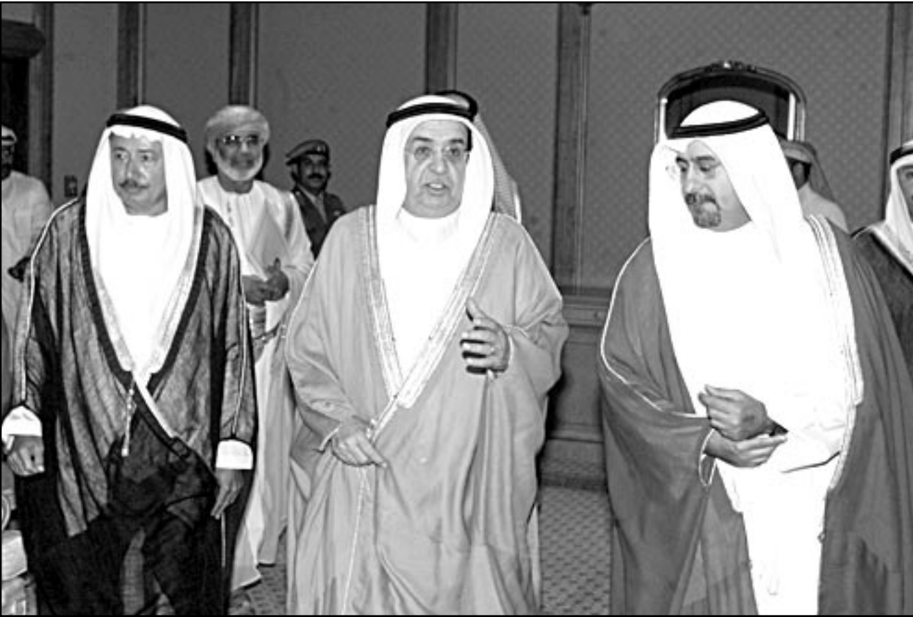
وزراء خارجية مجلس التعاون الخليجي اثناء اجتماعهم في جدة امس

وذلك بهدف اسقاط الصواريخ العراقية. وارتفعت هذه المصادر ان امريكا ستزود اسرائيل خلال الايام القليلة بصواريخ «باتريوت» اخرى. الى ذلك اشارت المصادر ذاتها الى ان الجهة الداخلية في اسرائيل انهدت استعداداتها لمعالجة اصابة مواطنين ومباني بالصواريخ العراقية. وقد انهدت الجبهة الداخلية في نهاية الاسبوع الماضي تمرينا واسعا استمر ثلاثة ايام على مستويات عديدة منها: اصابة مبانٍ بصواريخ تقليدية، اصابة صواريخ لمعسكرات جيش واصابة صواريخ تحمل رؤوسا بيولوجية، الامر الذي سيلزم الجبهة الداخلية على «تطهير» المنطقة المصابة وتوزيع المضاد الحيوي (الانتحيوتيك) على المواطنين المصابين. كما انهدت الجبهة الداخلية استعداداتها لحملة التوعية لطاقم اسرائيل، بما في ذلك طباعة كراس ومواد توعية اخرى ستوزع على جميع السكان. واكدت المصادر الصحافية في تل ابيب انه في الفترة الاخيرة عقدت لقاءات مكثفة اسرائيلية-امريكية بالتنسيق في ما يتعلق بالعدوان على العراق. وكان هدف اللقاءات هو التنسيق الكامل على الصعيد الخابرياتي بين الجيش الامريكي والجيش الاسرائيلي، وخلال هذه الاجتماعات عادت اسرائيل وتطلبت الادارة الامريكية بايلاغا مسبقا