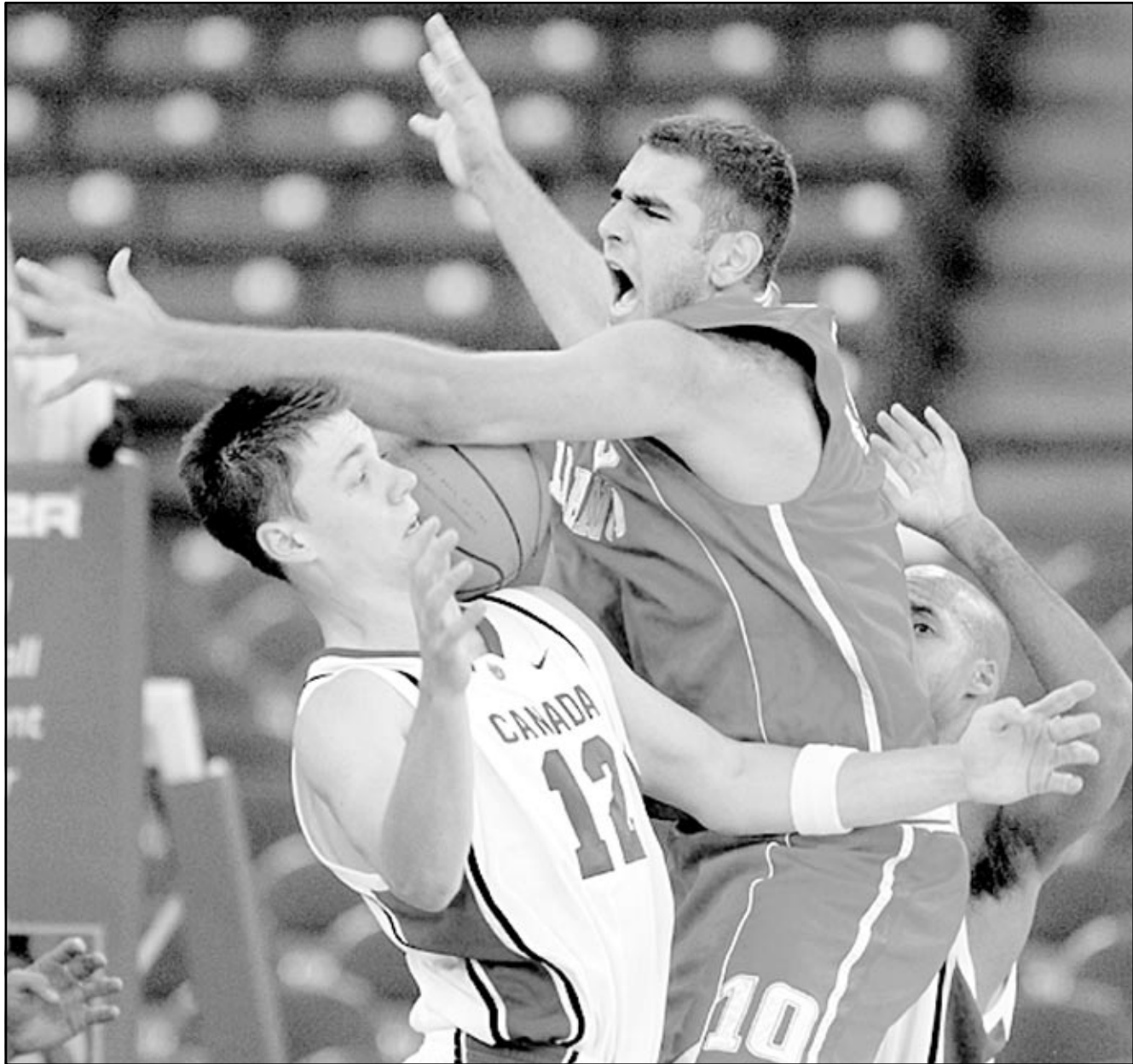
لقطة من مباراة منتخب لبنان