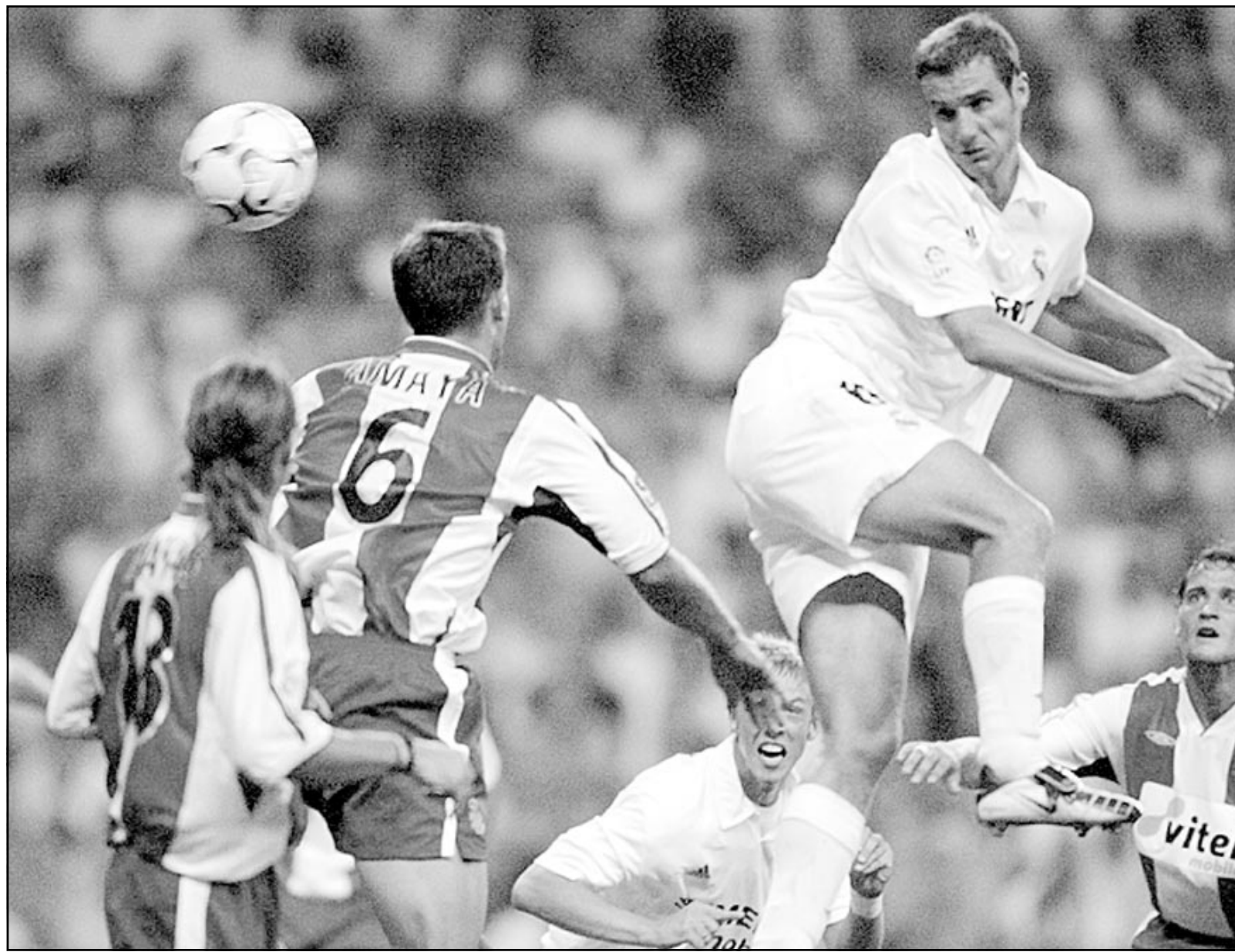
لقطة من إحدى مباريات ريال مدريد (صورة من الأرشيف)