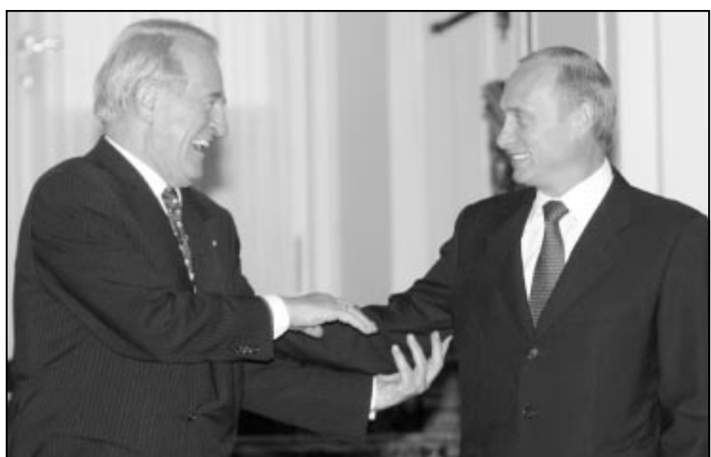
الرئيس الروسي يتبادل اطراف الحديث مع نظيره الالمانى في موسكو

يضع عشرات من الثوار الشيشان ربما الازليون في الوادي بعضهم ينحدرون من اصل عربي. واعتقلت القوات الجورجية حتى الان ثلاثة اشخاص خلال العملية في بانكيسي منهم رجل من اصل عربي يقول مسؤولون امينيون ان له صلة بتطبيقات ارهابية دولية.