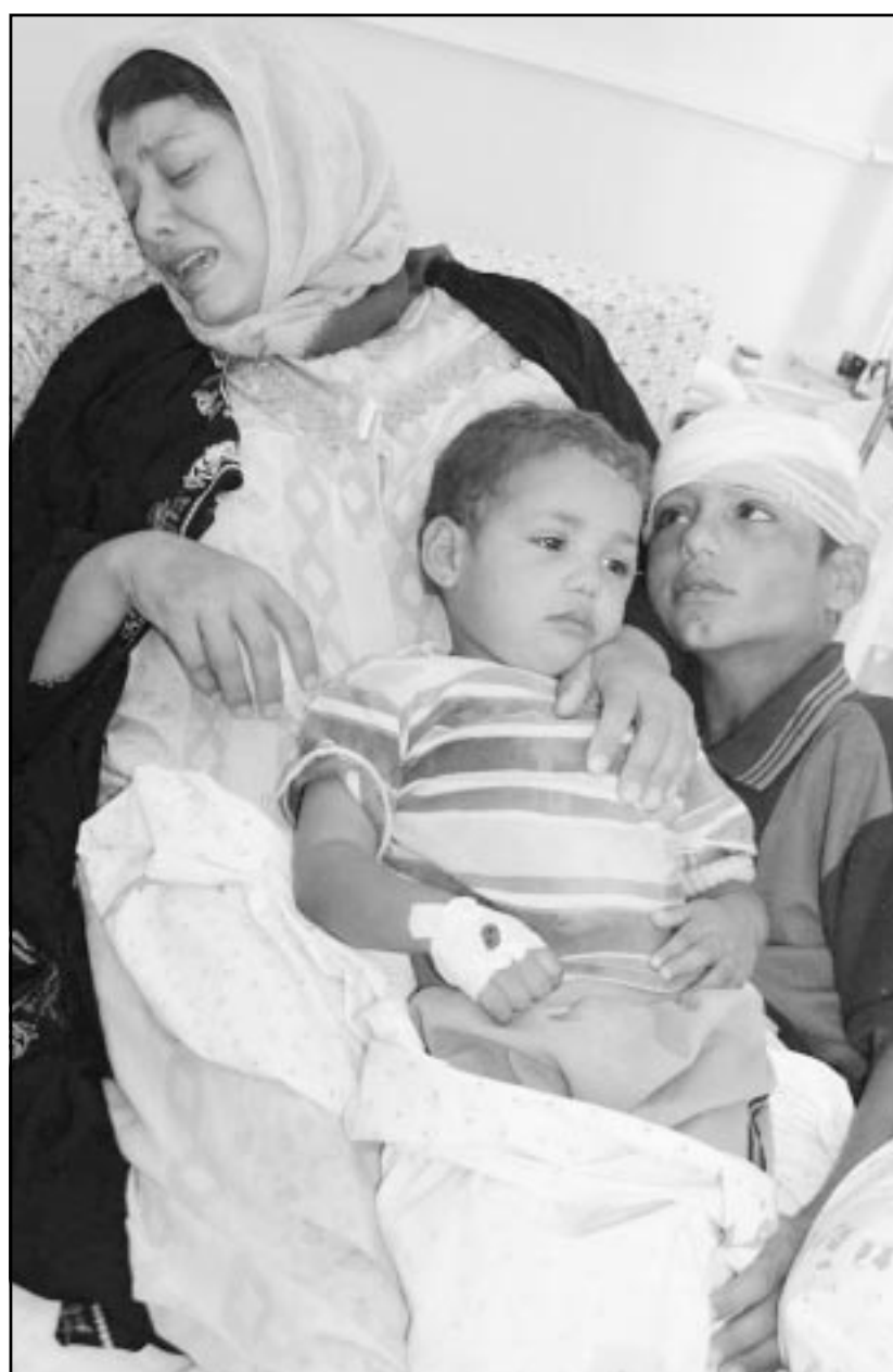
ضحايا الجرائم الاسرائيلية: اطفال يتلقون العلاج بعد ان هدم الاسرائيليون منزلهم عليهم في مخيم رفح

واوضحت المصادر «ان الجيش الاسرائيلي هدم منزلا ايضا في منطقة القرارة (قرب حاجز كيسوفيم العسكري) جنوب قطاع غزة تعود ملكيته لعائلة على الزر بعد ان اخرجوا من كان في داخل المنزل بالقوة».