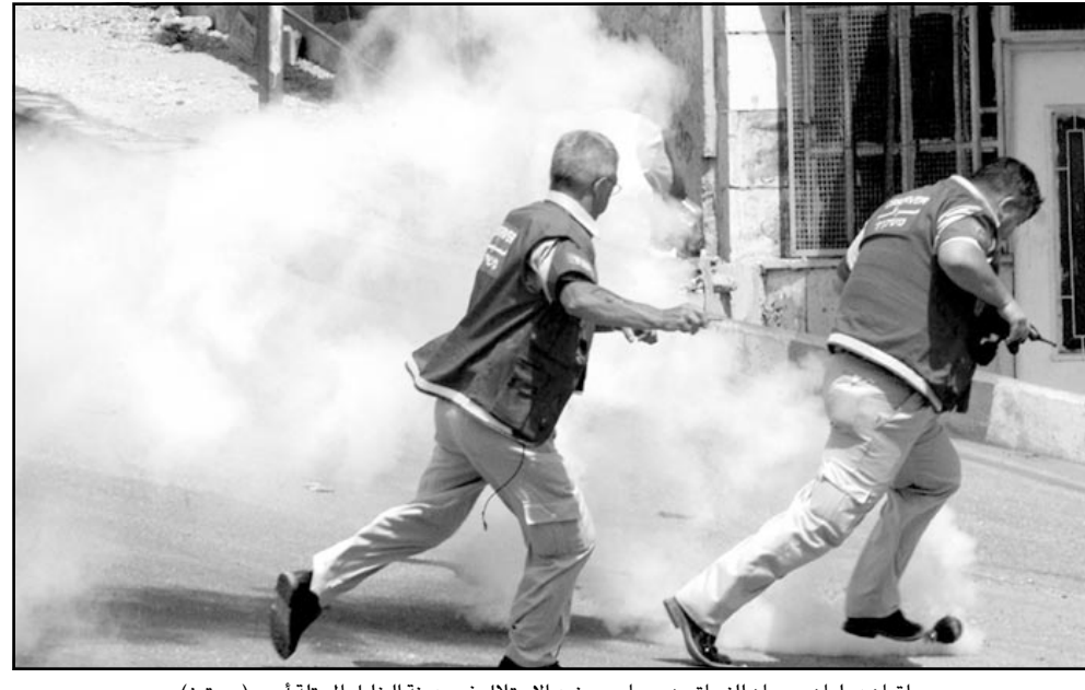
مراقبان دوليان يهرعان للنجاة من رصاص جنود الاحتلال في مدينة الخليل المحتلة أمس