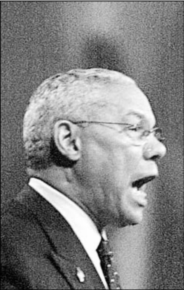
وزير الخارجية الأمريكي كولن باول يلقي كلمة أمام قمة الأرض