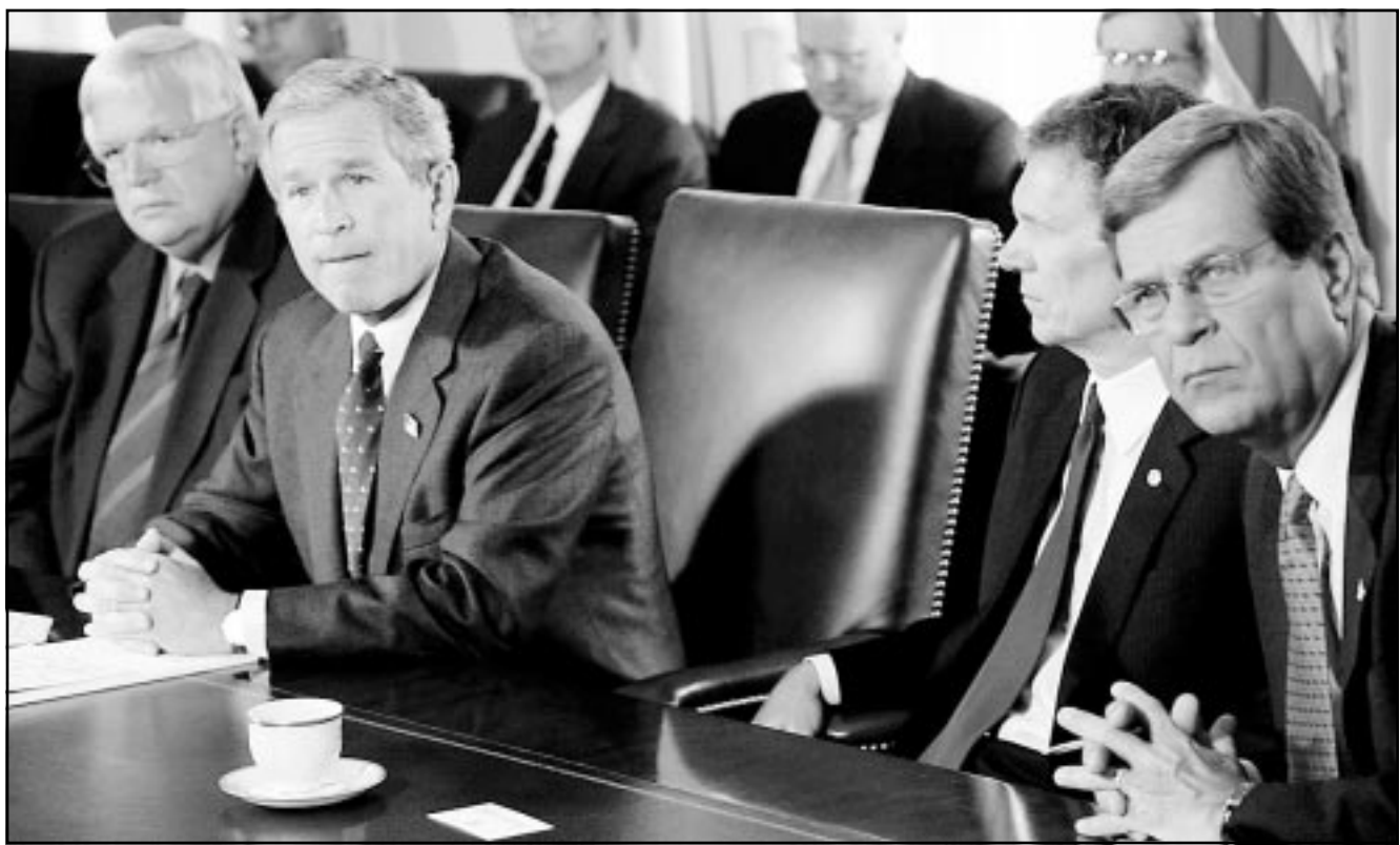
الرئيس الأمريكي جورج دبليو بوش أثناء اجتماعه مع أعضاء الكونغرس أمس في البيت الأبيض