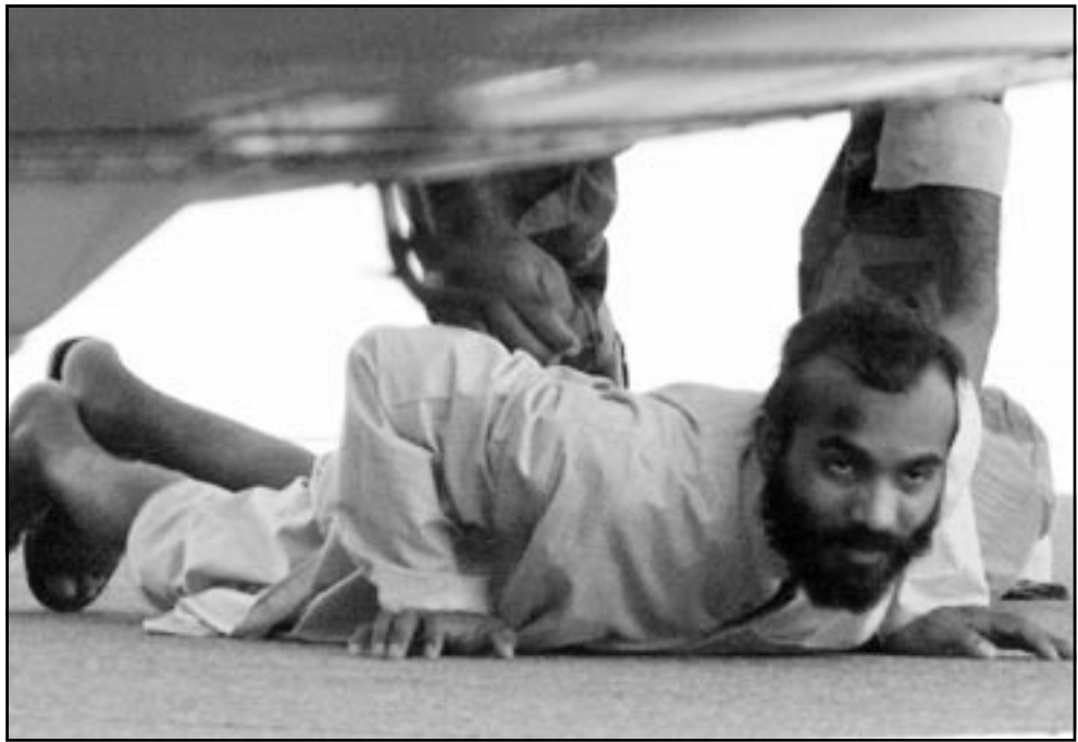
جندي باكستاني يفتش أحد المعتقلين المجرع عنهم