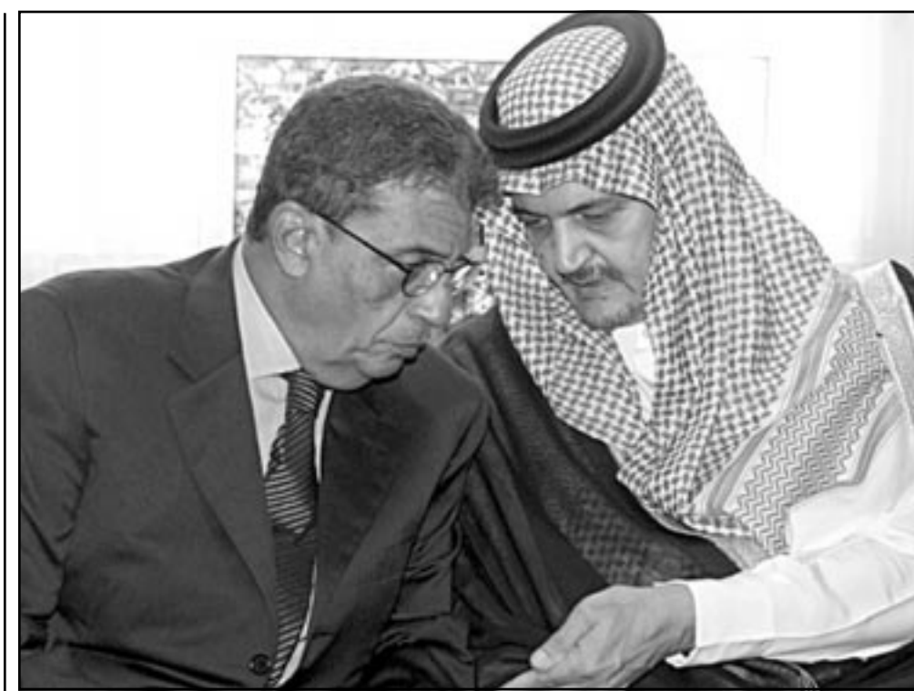
عمرو موسى مع الامير سعود الفيصل اثناء اجتماع الوزراء العرب في القاهرة امس

بغداد - ا ف ب : صرح وزير الخارجية العراقي ناجي صبري في حديث صحفية «الراي العام، الكويتية امس ان العراق يؤيد اقامة «علاقات طبيعية» مع الكويت، مؤكدا اهمية «العمل المشترك» بين البلدين لتسوية مشكلة الاسرى والمقودين في الحرب. وقال صبري ان «عودة الحالة الطبيعية في مصلحة البلدين»، موضحا ان بغداد «واقفت اي اشارة سلبية للكويت في وسائل الاعلام والتشريعات». وكان العراق والكويت اتفقا في القمة العربية التي عقدت في بيروت في نهاية آذار (مارس) على تحسين العلاقات بينهما وتهدت بغداد للمرة الاولى في وثيقة مكتوبة «احترام استقلال وسيادة وامن الكويت». وقال صبري ان العراق «نفذ خطوة اخرى على صعدها إعادة الوثائق الكويتية، وتفاعلا مع الامم المتحدة على الية ارجاع هذه الوثائق الى الاشقاء الكويتيين»، مؤكدا ان «مسألة المقودين الكويتيين واكثر من ضعفيهم من العراقيين تحل بالتفاهم المباشر». وعبر الوزير العراقي عن امله في ان «تتاح الفرصة لزيد من التفاعل والتواصل والعمل المشترك» بين البلدين بهدف «ارجاع العلاقات الى الوضع الطبيعي»، مؤكدا وجود «كل الاسس القانونية لعودة العلاقات الى عهدنا السابق».