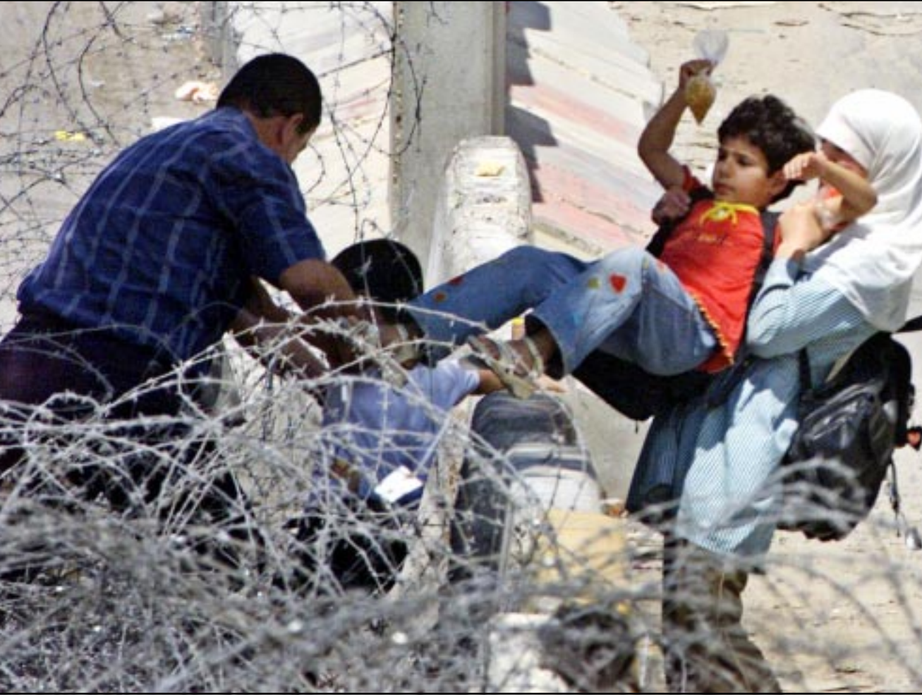
طفلة فلسطينية تساعد شقيقها على اجتياز حاجز شائك نصبه الاسرائيليون للحيلولة دون وصول التلاميذ الى مدارسهم مع بدء العام الدراسي الجديد

■ طهران - اف ب: اكدت ايران مساء امس الاربعة انها قامت منذ مطلع العام بترحيل 150 شخصا يشتبه في انهم على علاقة مع تنظيم القاعدة، الى دييارهم إضافة الى افراد عائلاتهم، وهو عدد يفوق الملن رسميا حتى الآن. واعلن وزير الداخلية الإيراني عبد الواحد موسوي لاري اثناء مؤتمر صحفي مشترك مع نظيره الباكستاني معين الدين حيدر «لقد ابعدنا 150 شخصا الى دييارهم وراقب البعض منهم افراد عائلاتهم». وقال «ان هؤلاء الاشخاص من مختلف الجنسيات دخلوا الى ايران بصورة غير شرعية، لا تعرف ما اذا كانوا اعضاء في القاعدة، لكننا نتأكد ان لهم علاقة باحداث افغانستان». واصف الوزير الإيراني «ان على الدول المعنية ان تحقق باتنماتهم الى القاعدة»، لكنه لم يحدد العدد الدقيق للاشخاص المبعدين ورفض تأكيد ما قاله احد الصحافيين من ان عددهم يصل الى 300 شخص. وفي شباط (فبراير)، اعلنت ايران توقيف 150 شخصا يشتبه في انهم على علاقة مع القاعدة وهم يتحدرون من دول عربية بصورة رئيسية وخصوصا من السعودية والكويت. واعلنت طهران فيما بعد انها ابعدت هؤلاء الاشخاص وبينهم 16 سعوديا. واعلن موسوي لاري ان اللجنة الامنية التي انشأتها ايران وباكستان للتعاون في المجال امام «تعاون يشمل كل ما يتعلق بالحدود ومكافحة تهريب الاشخاص والمخدرات». واغرب عن امله في رؤية افغانستان تنضم الى هذه اللجنة «طالما تاتي المخدرات من هذا البلد» على حشد تعبويه. واعلن حيدر من جهة ان ايران وباكستان «اتخذت الاجراءات الحامية لمنع عمليات تسليح عناصر من القاعدة وازهابيين». وقال «ان ايا من بلدينا لا نلاشخص المبعدين ورفض تأكيد ما يريد ان يصبح ملاداً» لهؤلاء الارهابيين.