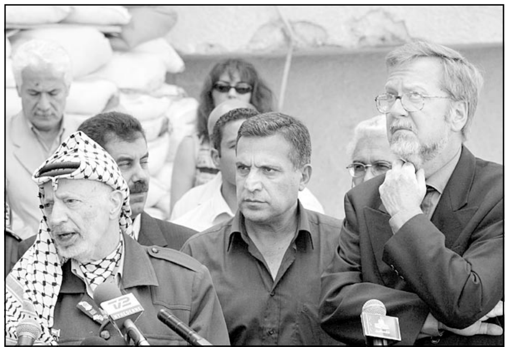
الرئيس عرفات والوزير بيو ستينغ مولر يتحدثان للصحافيين في رام الله امس

وانتصار عجوري الى قطاع غزة. ووصف الرئيس الفلسطيني هذه العقوبة بانها «جريمة ضد حقوق الانسان وانتهاكاً فاضحاً للقانون الدولي». وهو اللقاء الاول بين الزعيم الفلسطيني ومسؤول غربي رفيع مولر منذ لقائه في 25 حزيران (يونيو) وزير الخارجية الفرنسي دومينيك دو فيليبان. ووصل مولر مساء الثلاثاء الى اسرائيل في اطار جولة في المنطقة لشرح خطة السلام الجديدة الأوروبية للشرق الاوسط حسبما افاد مصدر رسمي اسرائيلي. وقد بحث في هذه القضية صباح أمس الاربعاء مع وزير الدفاع الاسرائيلي بنيامين بن اليعازر في تل ابيب والتقى مساء رئيس الوزراء ارييل شارون.