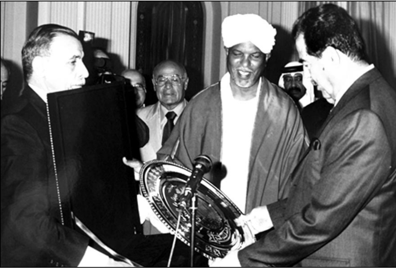
الرئيس العراقي صدام حسين يتسلم هدية تذكارية من وفد البرلمان العربي في بغداد امس

صعدت اسرائيل يوم امس الازعاج وتيرة تهديدها للعراق، حيث صرح نائب وزير الدفاع الاسرائيلي فايتسمان شيري (حزب العمل) في مقابلة صحافية ان اسرائيل سترد على اي هجوم عراقي في جميع الحالات. وشن شيري هجوما ارعن على الرئيس العراقي صدام حسين زاعما انه منذ هتلر لم يقم شخص خطير مثل صدام حسين وبعده بصورة واضحة ومباشرة اغتياله. وجاءت تصريحات نائب وزير الدفاع الاسرائيلي بعد يوم واحد من الاجتماع الذي عقده شارون يوم امس الاول الثلاثاء بمشاركة وزير الدفاع بنيامين بيال وروساء الاجهزة الامنية لتدارس جاهزية اسرائيل للتصدي للهجوم العراقي وسبل الرد عليه. وزاد نائب وزير الدفاع في المقابلة الصحافية: ان اسرائيل سترد في جميع الاحوال اذا تعرضت لهجوم صاروخي عراقي، ولا شك في ذلك. اسرائيل هي التي ستحدد قوة الرد على الهجوم وسيكون ردنا متلائما مع نوع الهجوم العراقي على البلاد. وفي رد على سؤال حول كيفية الرد الاسرائيلي على سقوط صواريخ سكاك عراقية في العمق الاسرائيلي، كما حدث في العام 1991 قال شيري: