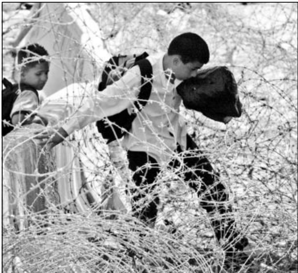
طفلان فلسطينيان يجتازان حاجزا شائكاً في طريقهما الى المدرسة في القدس الشرقية أمس

الجمهورية العربية وقيادتها. لقد اصبح التحريض علينا وتهديدنا الجبال الاساسي لالتفاف بين السياسيين الاسرائيليين وما من شك في ان هذا سيكون موضوعا اساسيا في حملة الانتخابات الاسرائيلية القادمة». وكان «الكنيست»، الاسرائيلي قد نزع الحصانة البرلمانية عن النائب الطيبي قبل اكثر من شهرين، ومن المنتظر ان تبدأ المحكمة العليا ببحث هذه القضية وتحديد حرية حركته خلال الاسابيع القادمة، في حين اصدر الياكيم روبينشتاين المستشار القضائي للحكومة مؤخرا امرا بفتح تحقيق جنائي ضد النائب الطيبي نظرا لدخوله لاحتلال اراضي المحتلة في فترة حصار غاشم. وكان الحاخام الاكبر لديانة صف الحاخام الياهو قد طالب «بطراد النواب العرب من البلاد وعلى راسهم احمد الطيبي» - ينكر ان «الكنيست» الاسرائيلي نزع الحصانة البرلمانية عن النائب عزمي بشارة وقدمت ضده لائحة اتهام في محكمة صلح في الناصرة بسبب خطاب القاه في القراحة السورية في الذكرى الاولى لوفاة الرئيس السوري الراحل حافظ الاسد، وبسبب خطاب آخر القاه في مدينة ام الفحم وقال فيه ان حزب الله هو حركة مقاومة شرعية لاحتلال غير شرعي، وبسبب تنظيم زيارات من اهل ال-48 اقرابهم في سورية.