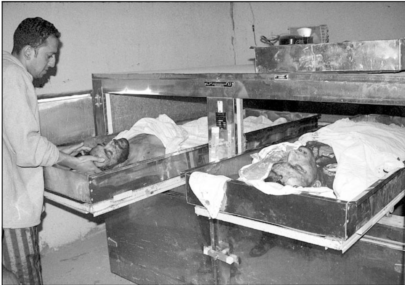
عامل في مستشفى يحفظ جثتي اثنين من الفلسطينيين الثلاثة الذي قتلوا في مخيم الجليل بلبنان أمس

وقد وقع الاشتباك اثر دخول دورية من الجيش باكرا الى مخيم الجليل حيث داهمت مقر الحركة «فتح - المجلس الثوري». واكدت المصادر الامنية اللبنانية ان عناصر الجيش صادرت كمية كبيرة من البنادق الرشاشة والذخائر من مقر حركة فتح - المجلس الثوري بدون ان تقوم بتوقيف اي شخص. وقد فوجئ مسلحون فلسطينيون بدخول الدورية الى المخيم وقاموا باطلاق النار على عناصرها وهي في طريقها لمخيم الجليل مما اسفر عن مقتل احدهم. وقد أكد مصدر عسكري مقتل الجندي. واقام مراسل فرانس برس، ان اهالي المخيم الذين استاءوا من الامر قاموا برشق الحجارة على الجنود اللبنانيين الذين انتشروا بكثرة في محيط المخيم. كما عمدوا الى قطع السير على الطريق المؤدية الى بعلبك لمدة ساعات. يشار الى ان مخيم الجليل، احد اصغر المخيمات الفلسطينية واكثرها بؤسا، يضم نحو ستة آلاف نسمة يقطنون عند المدخل الرئيسي لمدينة بعلبك (85 كلم شمال - شرق بيروت) الواقعة في سهل البقاع حيث تنتشر القوات السورية. وكان الجيش اللبناني قد حضر لعملية المدهامة بنشر عدة وحدات منذ فجر في محيط المخيم. وقال احد سكان المخيم لوكالة «فرانس برس» ان «الناس فوجئوا بالرؤية دورية لبنانية تدخل المخيم. انها المرة الاولى التي يحصل فيها ذلك منذ نحو ثلاثين عاما مما اثار استياء الجميع وجرى تبادل لاطلاق النار». من ناحيتها استنكرت اللجنة الشعبية للمخيم اثر اجتماع عقده مع ضباط من الجيش اللبناني «ما جرى» وطلبت في بيان «دعوات الى التهدئة» بعد «عملية المدهامة التي ولدت وتورا شعبيا». بالمقابل اندر وزير الداخلية اللبناني الياس المر