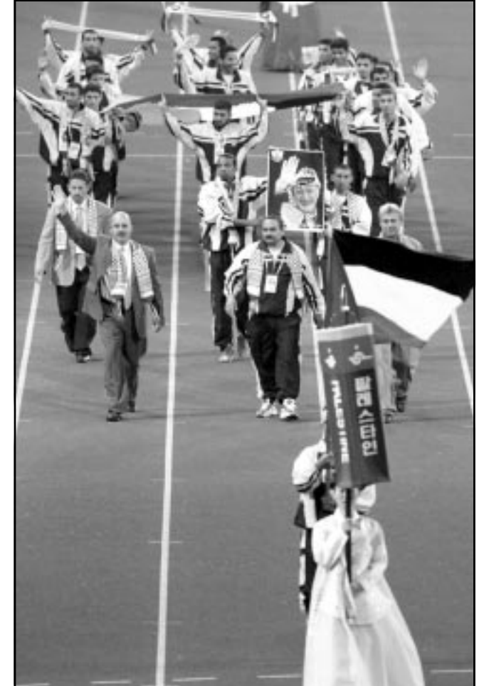
الوفد الفلسطيني في حفل الافتتاح