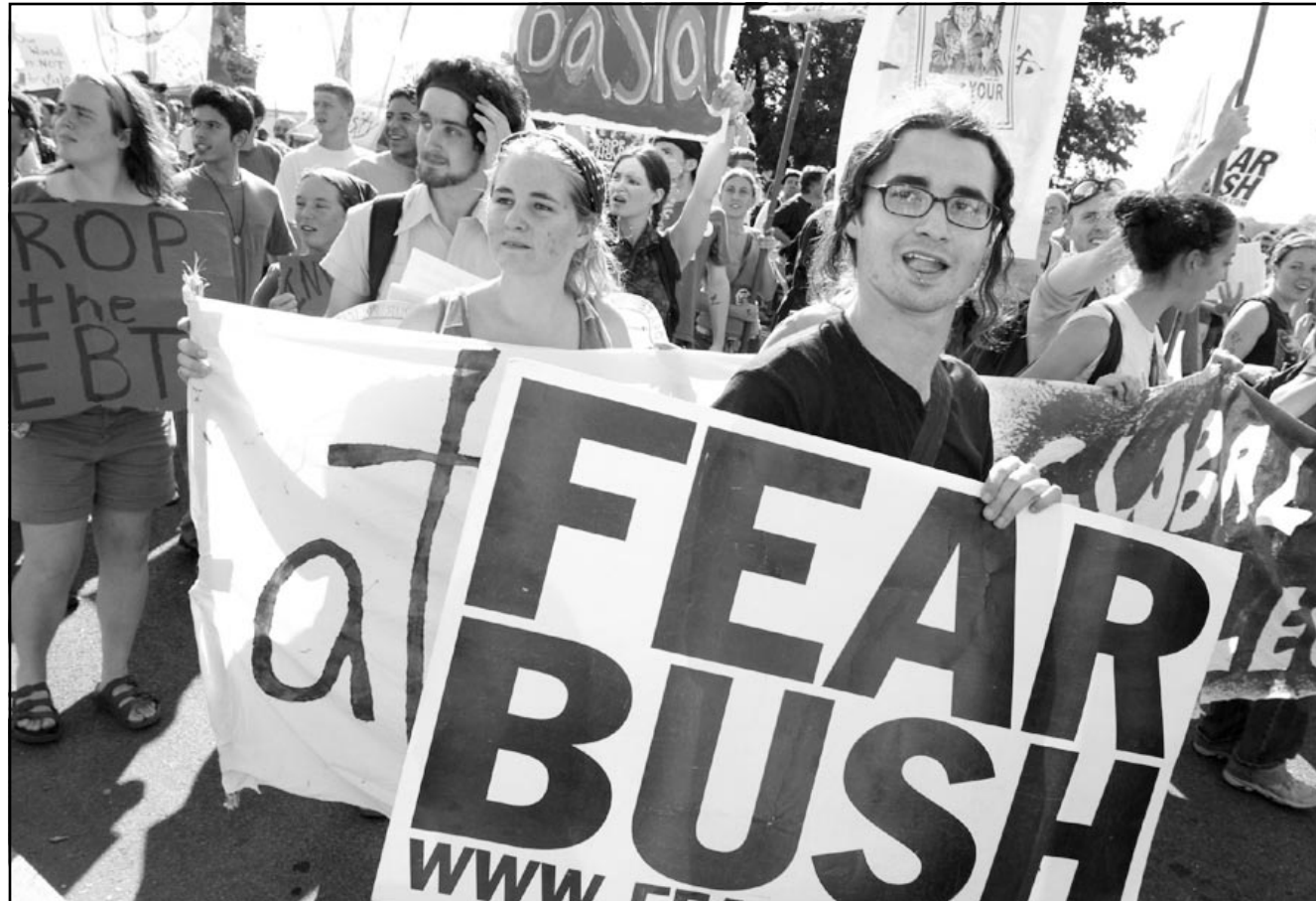
متظاهرون في واشنطن يحملون لافتات ضد سياسات صندوق النقد الدولي

والدولي «سببوا على استعداد لتكثيف سياساتهم عند الضرورة من أجل دعم نمو متين وواسع وتعزيز نشاطهم ودعم (مجهود) دائم في عملية الحد من نسبة الفقر»، وفقا لما قالت اللجنة. ولفتت اللجنة النقدية والمالية الدولية في صندوق النقد الدولي ايضا الى اهمية استقرار الاسواق النفطية «عند اسعار معقولة بالنسبة لكل من المستهلكين والمنتجين». وفي وقت سابق من هذا الاجتماع قال وزير الخزانة الأمريكي بول أونيل «ما زالت أمريكا الشمالية تشكل محورا للالتعاضد العالمي»، وأضاف انه يتعين على آخرين عمل المزيد لتعزيز التوقعات الاقتصادية. ودعت اللجنة لانتعاش الازمات الاقتصادية في اسواق الوظائف والسلع، ودعت اليابان لمواجهة مشكلاتها على صعيد البنوك والشركات حيث «من المنتظر ان يساهم تخفيف القيود النقدية في إنهاء الانكماش الاقتصادي». ولكن في ضوء الاضطرابات التي تعانيها دول كبيرة في أمريكا الجنوبية وتعرض دول أخرى هناك بصورة متزايدة على ما يبدو لمخاطر اقتصادية فإن مسألة منع الازمات الاقتصادية شكلت محور هذا الاجتماع.