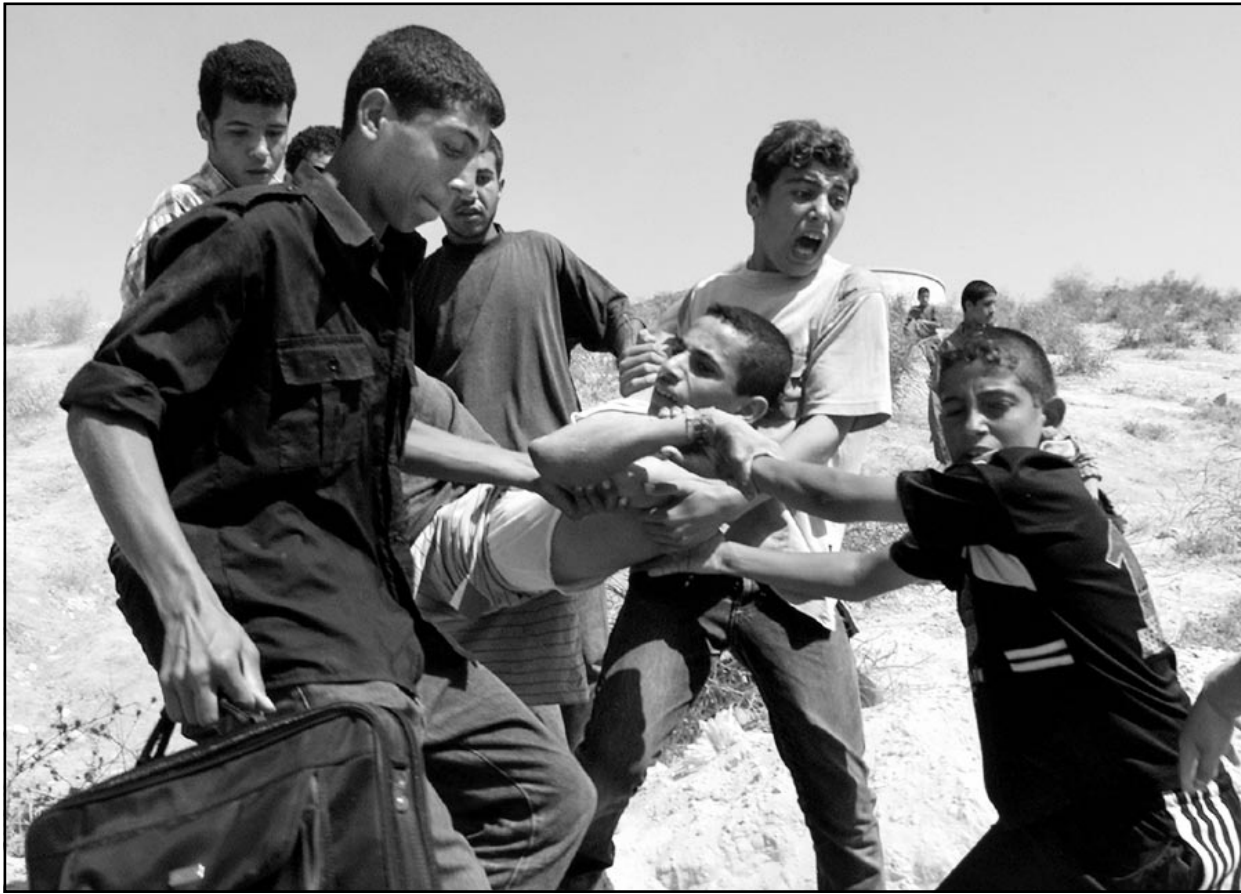
فتيان يتلقون زعيماً لهم أصيب برصاص الاحتلال في غزة أمس