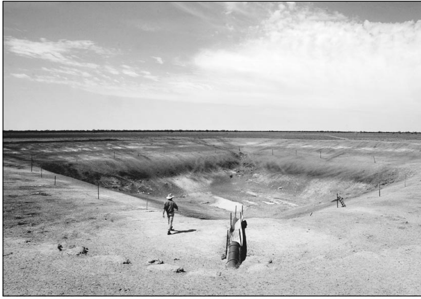
أحد المزارعين يعتقد خزانة مائيا فأرغا في مقاطعة نيو ساوث ويلز الاسترالية التي تعاني من قحط شديد منذ عامين

اعلن رئيس الوزراء البريطاني توني بلير امس الاحد ان احتمال القيام بعمل عسكري ضد العراق لن يؤثر على قراره الخاص بمسألة اجراء استفتاء بشأن الانضمام لبريطانيا للعبة الأوروبية الموحدة. وتبنى بلير لهجة ايجابية بشأن احتمال الانضمام لليورو ورفض تلميحات بأنه يبد من الناحية الفعلية فرص اجراء استفتاء بشأن الانضمام لتلك العملة قبيل الانتخابات العامة التي من المقرر ان تجرى في بريطانيا في حزيران (يونيو) من عام 2006. وردا على سؤال عما اذا كان استبعد فعليا فرصة اجراء استفتاء بشأن اليورو قبل الانتخابات العامة المقبلة في بريطانيا قال بلير لتلفزيون هيئة الاذاعة البريطانية «بالطبع لا لدينا