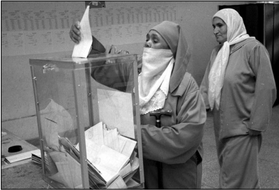
سيداتان مغربيتان بمكتب اقتراع في مدينة مراكش بأقصى جنود البلاد

ما ادلى به جطو لم يكن محل خلاف أو تشكيك الفاعلين السياسيين و26 حزبا شاركت في الانتخابات، دون اغفال بعض الحزقات هنا أو هناك، لكنها كانت خروقات احزاب ومرشحيها، وكانت السلطات تعالجها فور تلقيها اشعارا بذلك، وهكذا نجحت الاغلبية ببرنامج استحقاقات نتائجها محل اجماع مشاركين بها. مخاوف رغم غياب البصري تأخير إعلان النتائج ومرور 24 ساعة على إغلاق صناديق الاقتراع دون تقديم وزارة