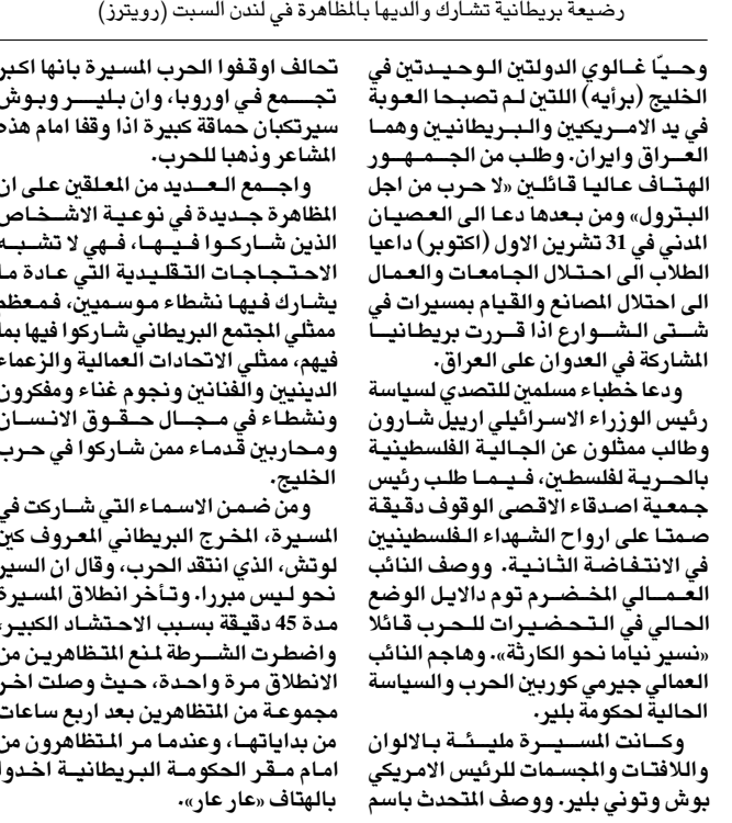
رضيعة بريطانية تشارك والدها بالمظاهرة في لندن السبت

للاوليات المتحدة الامريكية... وايرز ما في هذه المظاهرة بالاضافة الى أطفال البريطانيين الذين رغبوا باعلان تضامنهم مع النساء والاطفال في العراق وفلسطين وانطلقوا في هذه المظاهرة الحاشدة على ضفاف مسافة التيمز وانتهت بحديقة «الهاياد بارك» وسط لندن، وقدرت مصادر الشرطة ان شارك في المظاهرة بين مليون ونصف، فيما قولت الشرطة ان عدد المتظاهرين الذين رفعوا اصواتهم عاليا مطالبين بعدم ضرب العراق، وقتل الابرياء والمدنيين العراقيين انهم تجاوزوا المئة وخمسين الفا، وضعت بعض المصادر الاعلامية العديد بنحو 250 الفا، فيما قالت جماعتا «تحالف ضد الحرب، والارباطه البريطانية ان عدد المتظاهرين تجاوز الاربعة الاف شخص.