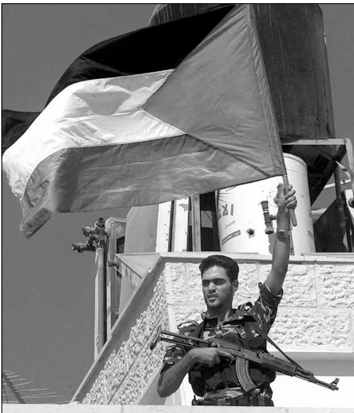
شرفي فلسطيني يعيد رفع العلم الفلسطيني فوق ما تبقى من مقر المقاطعة