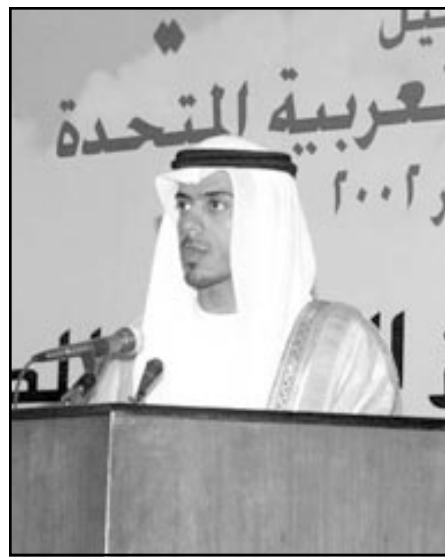
الشيخ سلطان بن طحون آل نهيان يعلن النتائج

ويحتويان أيضا على فيتامين الفوليك الذي وجد أنه مهم للوقاية من أحد أنواع فقر الدم، وكذلك لصحة الأم الحامل وصحة جنينها، كما توجد في الثمر نسبة لا بأس بها من البوتاسيوم المهم للوقاية من ارتفاع ضغط الدم، ويعد الثمر من أفضل الأغذية للأطفال والأشخاص ناقصي الوزن، كما أنه غذاء جيد للرياضيين لتعويض الطاقة المفقودة في أثناء اللعب، وأشار إلى استخدام الثمر في العلاجات الشعبية في دول الخليج العربية، ومن أهمها علاج الصدور والإمساك، وكان يمزج بالين ويعطى للأطفال والمراهقين بوصفه مقويا، كما استخدم الخليجيون عسل الثمر (الديس) في العديد من الوجبات التقليدية، وهو يعتبر من أفضل المحليات الطبيعية، التي تحتوي على