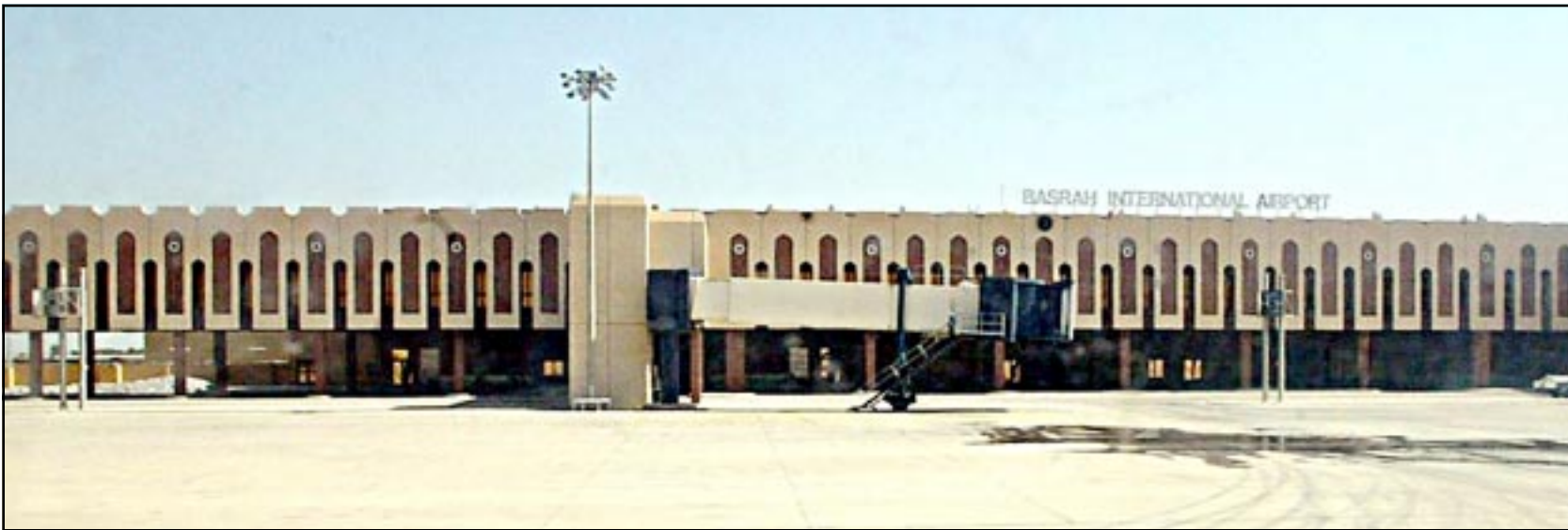
مطار البصرة المدني الذي تعرض للقصف امريكى للمرة الثانية خلال الاسبوع

واصلت الولايات المتحدة تصديدها العسكري ضد العراق بقصف مطار البصرة المدني الدولي للمرة الثانية خلال اسبوع واحد. وقال المتحدث باسم وزارة النقل العراقية في بيان لوكالة الانباء العراقية «استهدفت طائرات العدو الامريكى للمرة الثانية انظمة الرادار المدنية في مطار البصرة ودمرتها». ويأتي القصف الجديد في إطار القضاء على الدفاعات الجوية العراقية تمهيدا لبدء الحملة الجوية التي يتوقع ان تفتتح الهجوم الامريكى المرتقب. من جهة اخرى دعا العاهل الاردني الملك عبد الله الثاني امس الى «تكثيف» الجهود العربية والدولية من اجل تجنب توجيه ضربة اميركية الى العراق محذرا من ان الوضع «خطير جدا» بهذا الخصوص. وجاءت تلك الدعوة في مقابلة مع وكالة الانباء الكويتية (كونا) بقعتها وكالة الانباء الاردنية (بنا) بمناسبة زيارة العاهل الاردني اليوم الى الكويت، وهي الرابعة له منذ ارتقائه العرش عام 1999. واعلن عضو في مجلس الشيوخ الامريكى امس الاحد ان الجيش الامريكى سيكون «من المرجح جدا» في العراق عام 2003، وقال سينااتور