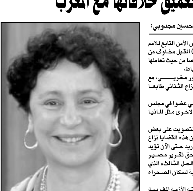
مدريد - «القدس العربي» - من حسين مجدوبي: