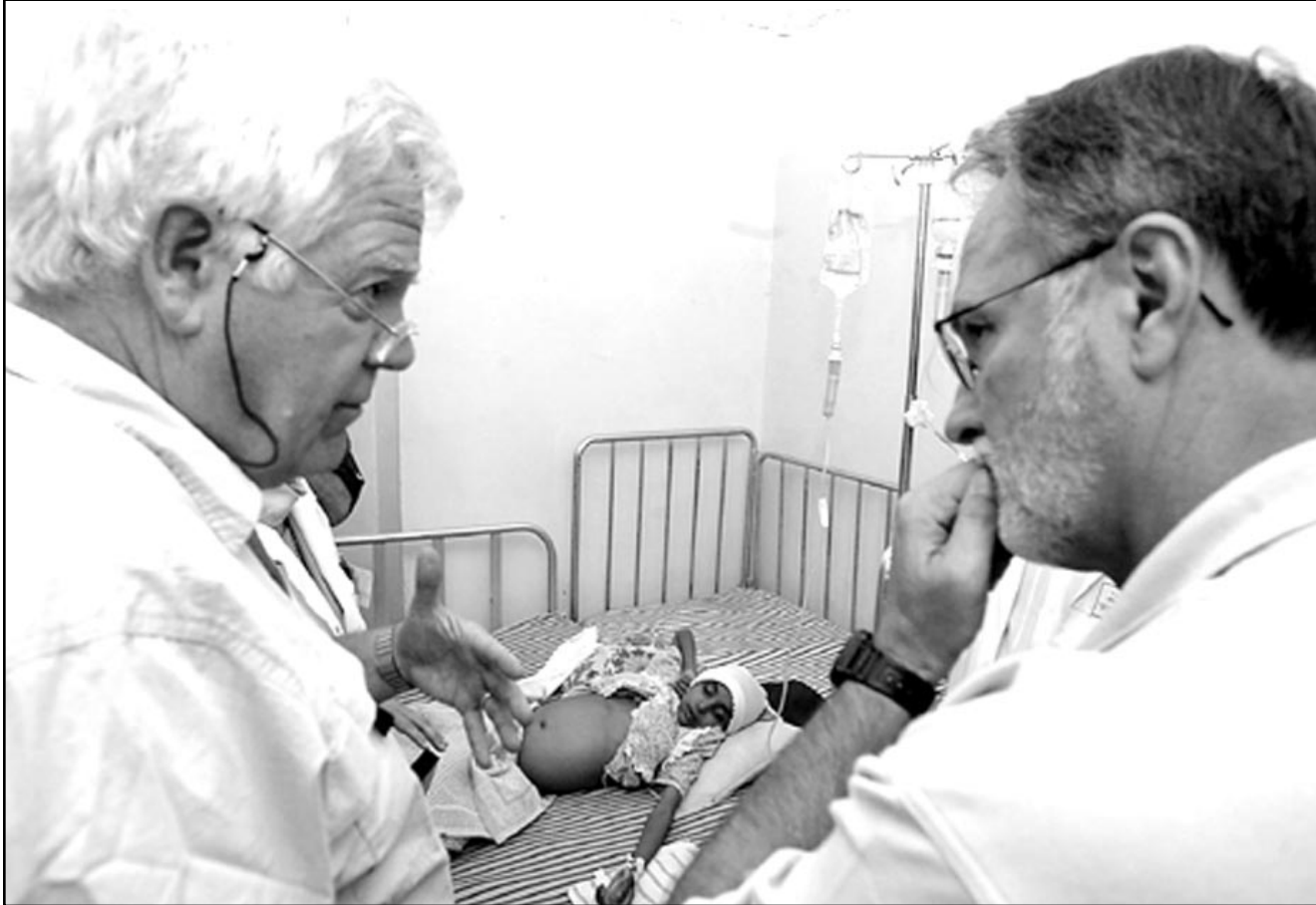
اعضاء في الكونغرس الأمريكي امام طفل عراقي مريض بالوكيميا في مستشفى في البصرة

لكن تركيا عبرت عن قلقها من هجوم من هذا النوع يمكن ان يزعزع استقرار المنطقة ويزيد من حدة التوتر مع الاعراق الذين يعيشون على جانبي الحدود.