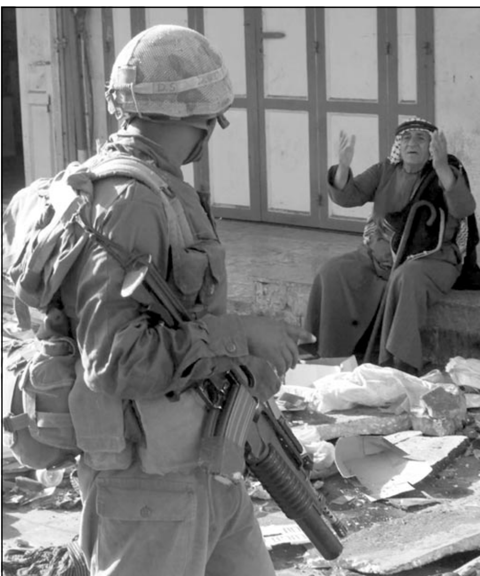
عوز فلسطيني تحدى حظر التجول بجنادل جنديا إسرائيليا في مدينة الخليل المحتلة أمس (ا ف ب)