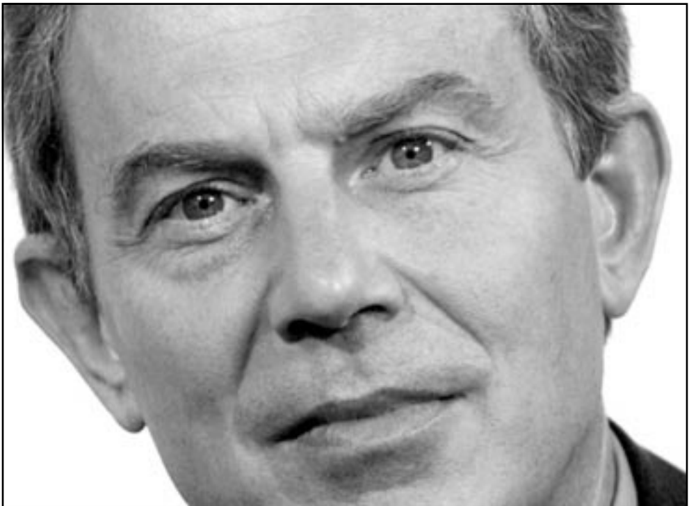
رئيس الوزراء البريطاني توني بلير

لندن - رويترز: لم يستبعد رئيس الوزراء البريطاني توني بلير امس هجوما عسكريا على العراق حتى وان رفضت الامم المتحدة تأييده. كما حذر الرئيس العراقي صدام حسين من انه يواجه اختيارا واضحا بين نزاع الاسلحة او مواجهة اجراء ضده او ضد حكومته. و اضاف بلير انه يجب على الامم المتحدة ان تكون الطريق الذي يستخدمه المجتمع الدولي لمواجهة صدام واجباره على ازالة اسلحة الدمار الشامل ولكنه رفض استبعاد الانضمام الى هجوم تقوده الولايات المتحدة ضد العراق اذا ما فشل ذلك السعي واذا ما رفضت الامم المتحدة اقرار اجراء عسكري. وصرح بلير للتلفزيون بي.بي.سي «يجب ان نوضح تماما ان امام صدام والنظام العراقي خيار واحد.. اما الموافقة على نزاع الاسلحة التي لم يكن يجب ان يمتلكها منذ البداية او مواجهة اجراء».