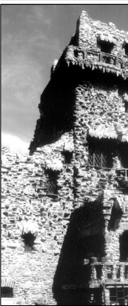
صورة التقطت في 16 أيار (مايو) الماضي لصحيفة جيليت الذي انجز ترميمه مؤخرا، والذي بناه وليام هوكر جيليت الذي اشتهر بتعميره دور شلوك هولز طيلة 34 سنة على المسارح في مختلف أنحاء العالم في مطلع القرن الماضي.

وقدم الدكتور محمد عون أستاذ في علم البستنة في معهد الملك الحسن الثاني للزراعة والعلوم البيطرية ورقة حول إكثار النخيل على نطاق واسع باستخدام تقنيات زراعة الأنسجة النباتية أكد فيها أن شجرة النخيل تعد محصولا استراتيجيا بالنسبة إلى المغرب ودول الشرق الأوسط بسبب أهميتها الاقتصادية والاجتماعية والإيكولوجية، وقال أن النخيل يوفر الغذاء لثمانية ملايين نسمة في شمال إفريقيا ويشكل ما بين 20 إلى 75% من الدخل، وبالإضافة إلى هذا فهو مصدر دائم للغذاء والدخل للفلاحين، بينما مازال كبار السن يحافظون على عاداتهم القديمة بتناول الثمر، التي أصبحت جزءا أساسيا في وجباتهم اليومية، وأن قلة تناول الثمر عند الأطفال والمراهقين ترجع إلى نقص الوعي عند الوالدين بالأهمية الصحية والغذائية للثمر، وعدم محاولة إدخالها ضمن الوجبات اليومية للابناء منذ الصغر، مشيرا إلى أن انتشار الطويات المصنعة والشوكولاته بانواعها ساعد على تقليل استهلاك الثمر، وأكد أن الثمر هو المنتج الجففت للربط، ويتناول أهل الخليج العربي الربط في موسم الصيف والتمر في جميع المواسم، وتختلف القيمة الغذائية لكل من الثنتين، إذ يحتوي الثمر على صفات السرعات الحرارية الموجودة في الربط، ويعد مصدرا غنيا بالمواد الكربوهيدراتية 57% مقارنة بالربط 27%، وأشار إلى أن الربط والتمر يحتويان على نسبة جيدة من الألياف الغذائية التي وجد أنها تساعد على تقليل نسبة الكوليسترول، والوقاية من سرطان القولون والأمعاء، والمفيدة لعلاج السممة وأمراض القلب.