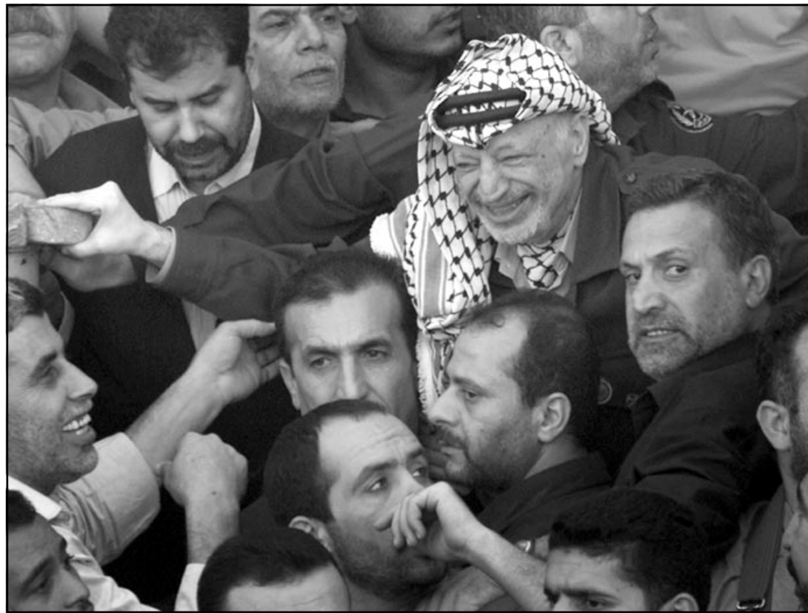
فلسطينيون يلتفون حول الرئيس عرفات بعد خروجه من حصاره

رام الله - «القدس العربي» - وكالات: بعد عشرة ايام على الحصار الشدد الذي فرضته عليه الدبابات الاسرائيلية، خرج الزعيم الفلسطيني ياسر عرفات أمس الأحد من مقره في رام الله محمولا على اكتاف انصاره رافعا اشارة النصر ومبتسما رغم بعض الشحوب الذي علا وجهه. وقام مئات الاشخاص وبعضهم من الذين كانوا محاصرين في المقر بحمل زعيمهم على الاكتفاح في اول خروج له الى الهواء الطلق منذ عشرة ايام وسط انقاص مياثي المقاطعة التي لم يبق منها سوى بناء واحد صالح للسكن. ورفع الزعيم الفلسطيني يديه لتحية المحيطين به ووزع القبلات عليهم قبل ان يعود سريعا الى مكتبه. وفي اول رد فعل له على الانسحاب الاسرائيلي قال عرفات ان «اسرائيل لم تطبق قرار مجلس الامن رقم 1435، متهميا الدولة العبرية بـ«التلاعب بالرأي العام الدولي»». وقور انسحاب القوات الاسرائيلية من محيط المقاطعة سارع نحو ستين شخصا من المحاصرين الى مغادرة المبنى بعد ان احدثوا ثغرة في شريط شائك كان وضعه الجيش الاسرائيلي، وتهيأوا على سيارات وصلت كانت تنقل فاقهه وماء. وقال خالد الضابط في الامن الفلسطيني والفرح باديا على محياه «اول شيء اريد ان اقوم به هو الاستحمام حتى قبل ان ازور عائلتي». وقال ان الاوقات الاصعب كانت لدى قيام الجيش الاسرائيلي بتدمير كل المباني المحيطة بمكتب عرفات، و«اضاف» حوقنا الكبير كان من انهيار المبنى علينا».