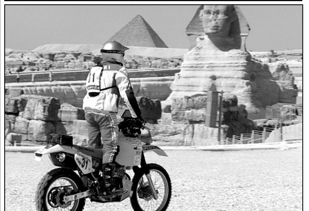
لقطة من بداية سباق رالي الصحراء الذي انطلق في القاهرة امس