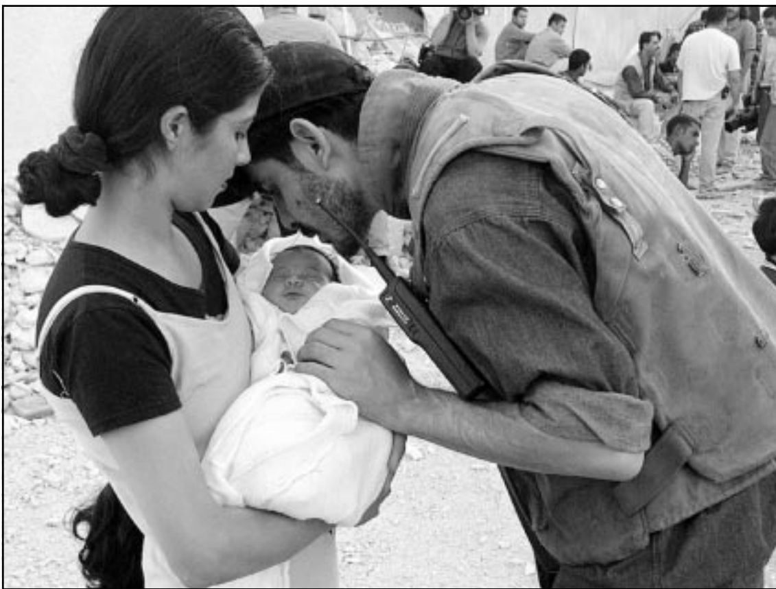
شاب خارج من الحصار يقبل طفله البالغ من العمر اسبوعا