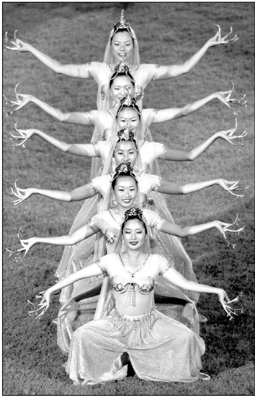
رقصة استعراضية تقليدية كورية جنوبية في حفل الافتتاح