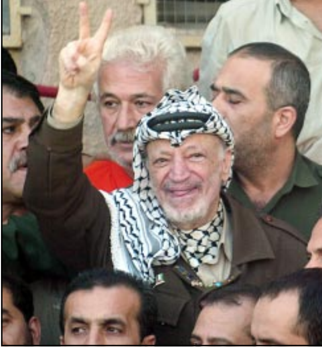
الرئيس عرفات يخرج من حصاره وانفعا نشرة (ا ف ب)

خرج الرئيس الفلسطيني ياسر عرفات امس الاحد وهو يوزع القبلات ويشير بعلامة النصر من مقره الذي تحول معظمه لاطلاق بعد تراجع القوات الاسرائيلية تحت ضغط امريكى لانه حصارها الذي تعرض للانتقادات الدولية. ويعد هذا الانسحاب ترجاعا مرحجا من جانب اسرائيل التي تعهدت بالانتهى الحصار الا بعد القبض على نحو 50 شخصا معه في مقره. وجاء هذا التراجع بعد رسالة بعث بها الرئيس الامريكى جورج بوش الى شارون طالبه فيها بانهاء الحصار على وجه السرعة، حيث تخشى واشنطن ان يؤثر على خططها باحتمال شن حرب على العراق. وقالت الاناعة الاسرائيلية ان القوات ستانسحب الى نقاط تطل على القر على مسافة تسمح لهم برؤية المقر. وقال عرنان جيسين المتحدث باسم رئيس الوزراء الاسرائيلي ارييل شارون «الجيش الاسرائيلي سيبدء جنوده عن مجمع المقاطعة وسيتمركز بطريقة يمكن لأي شخص غير ضالع في الارهاب ان يتحرك دون قيد». وزار تيري رود لارسن مبعوث الامم المتحدة الى الشرق الاوسط مجمع الرئاسة الفلسطيني عقب الانسحاب، وقال للصحافيين «ارى ان هناك ما يدعو