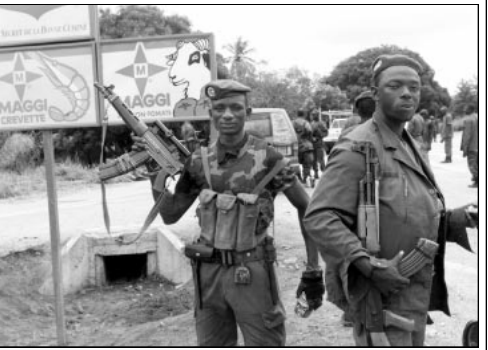
متمردون في مدينة بواكيه يعرضون اسلحتهم وسط المدينة

ابواكيه - ايدجيان - اف ب: افتتحت امس الاحد بعد ظهر امس في اقرا قمة المجموعة الاقتصادية لدول غرب افريقيا محاولة نزع فتيل الازمة التي تشهدها ساحل العاج منذ عشرة ايام والبحث في ارسال قوة سلام الى البلاد حسب ما افاد مراسل وكالة فرانس برس.