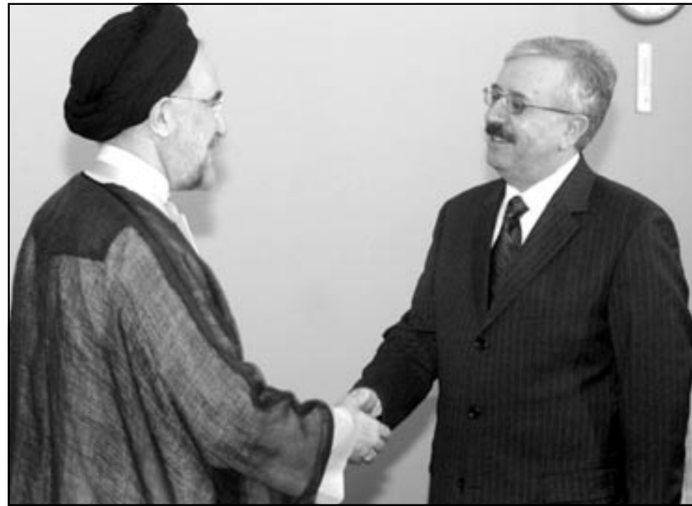
الرئيس الإيراني محمد خاتمي أثناء استقباله وزير الخارجية العراقي ناجي صبري في طهران أمس