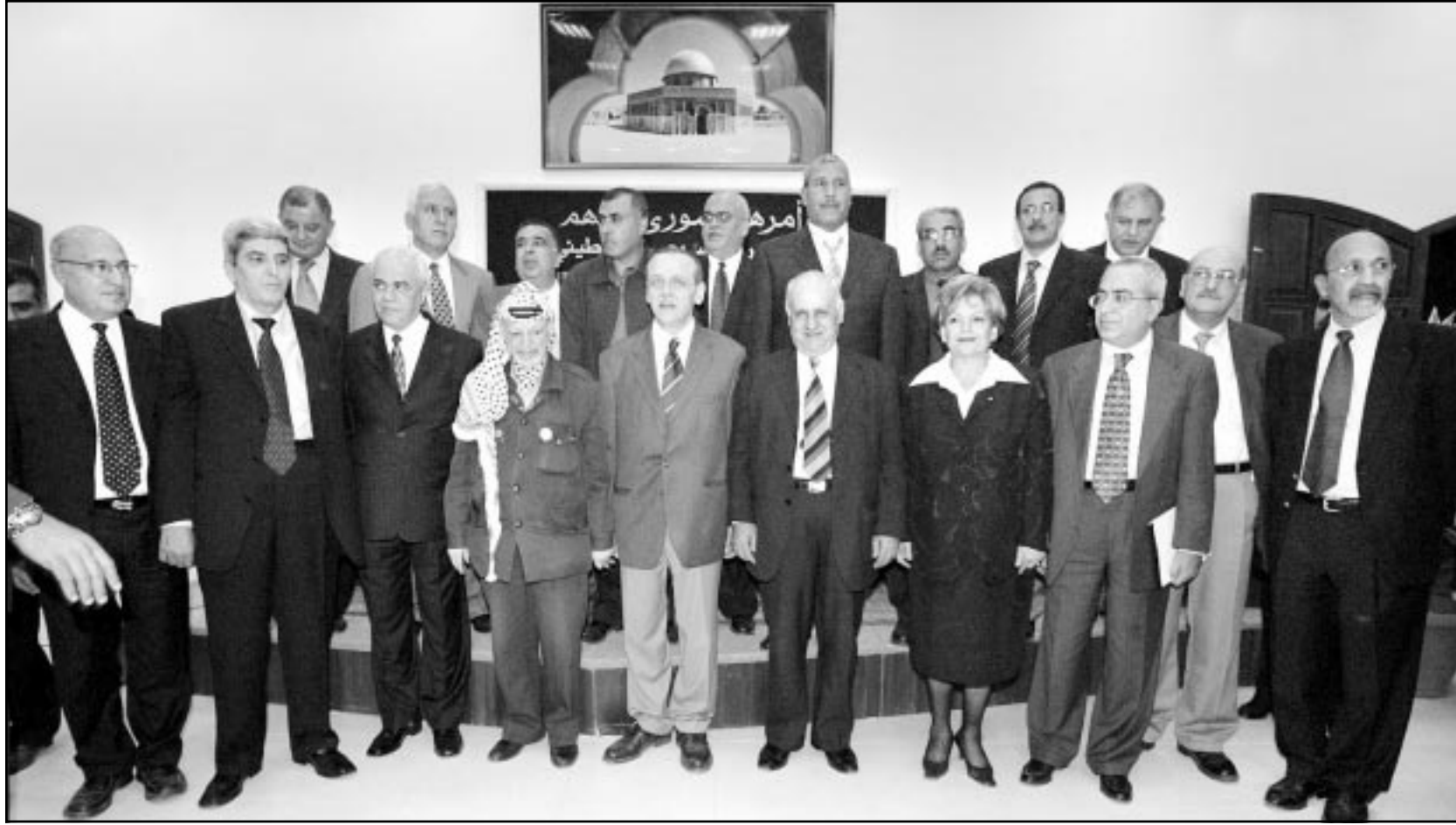
الرئيس عرفات يتوسط اعضاء الحكومة الجديدة