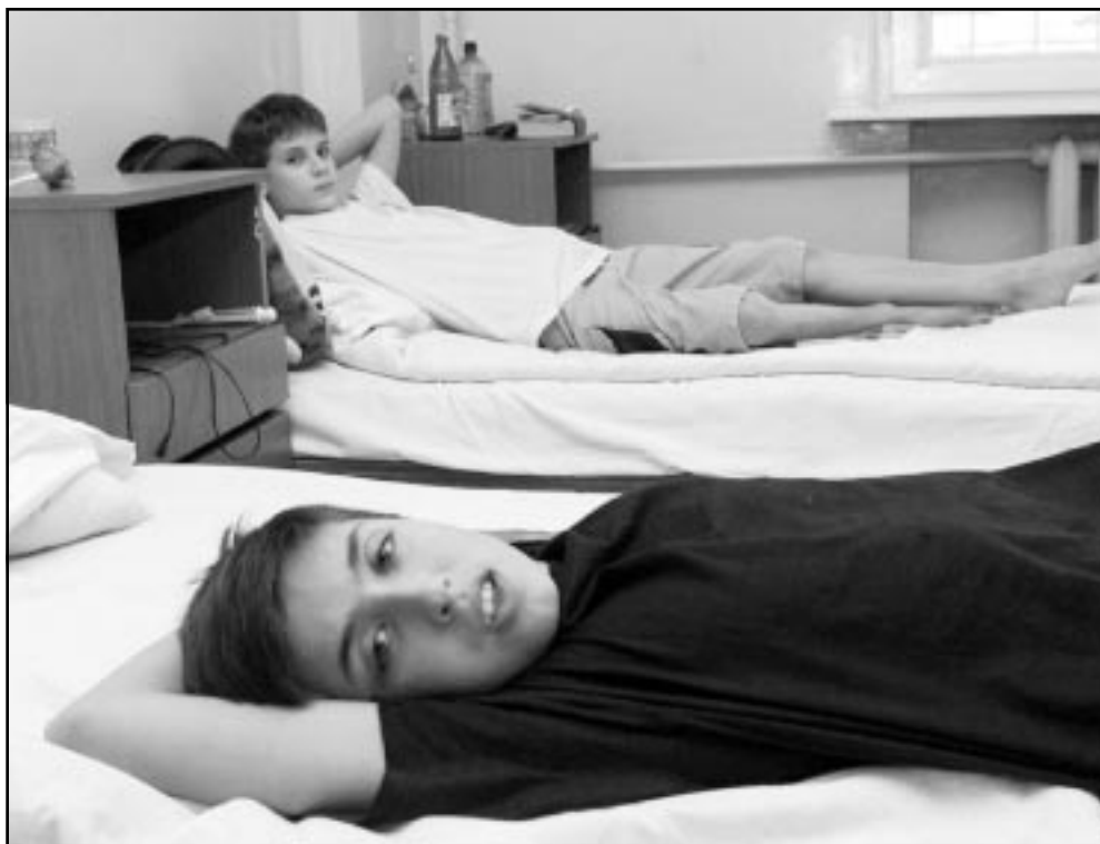
صبيان روسيان يعالجون من آثار الغاز أثناء الاحتجاز في مسرح موسكو

«الدولة التي تتفخر الى العدالة الحقيقية»، بالرغم من القوانين القائمة، في تقرير نشره امس الثلاثاء بعد ايام على انتهاء عملية احتجاز الرهائن ان روسيا ماضية في خطة سحب عملية احتجاز كوماندوس شيشاني رهائن في مسرح في موسكو. وكان وقع اخرى نقلت وكالة ايتار تاس من مصادر روسية امس الثلاثاء ان حوالي مئة شيشاني اعتقلوا خلال الايام الماضية في الشيشان بتهمة المشاركة الفعالة في أنشطة المتمردون الانفصاليين فيما عد وزير الداخلية الروسي بوريس غيريلوف عن تشكيل وزارة داخلية للشيشان قريبا. وافادت قيادة القوات الروسية في شمال الشيشان ان القسم الاكبر من الاعتقالات حصل في المناطق الشرقية والجنوبية (اروس سارتان وشياي ونوغاي-يورت) وتحتفظ القوات الروسية كل يوم تقريبا اعدادا صغيرة من المشتبهين التي تتراوح بين مئتي مئتي مئتي المعتدلين. من جهة اخرى اعلن وزير الداخلية ان الوثائق حول انشاء وزارة داخلية للشيشان ستكون جاهزة في تشرين الثاني (نوفمبر) كما افادت ريا نوفوسني، ومن جهة اخرى اعلن وزير الدفاع