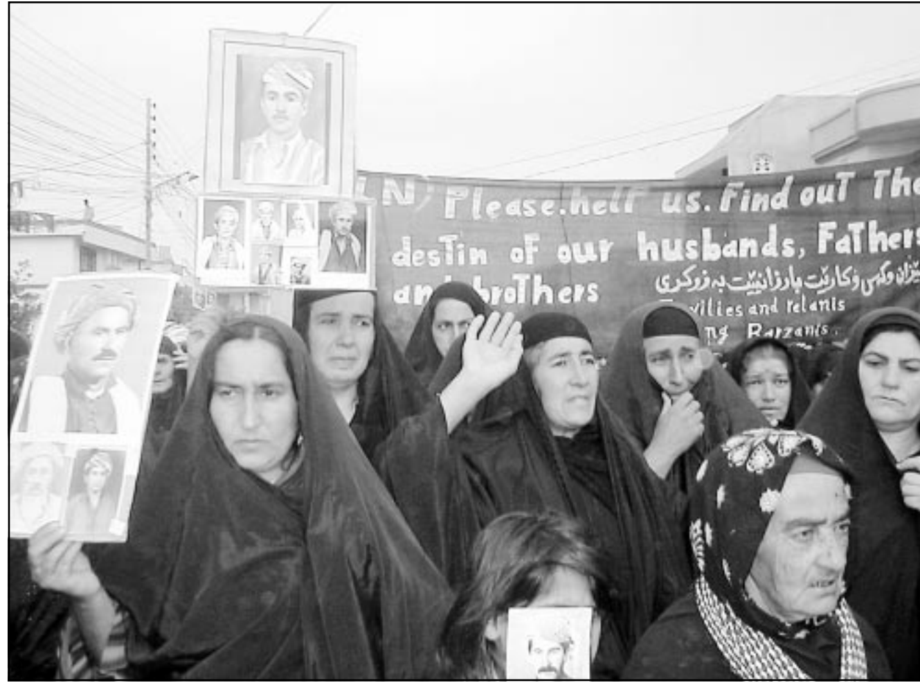
نساء كورديات يتظاهرن في اربيل طلبا لمعلومات عن اقرابين

المنطقة العربية، اما النزعة الى الفاشية الديمقراطية على قواعد عمق». وقال انه «لا توجد امكانية للحفاظ على النظام الوطني من دون تطوير فترة الديمقراطية والانتقال من الانتخابات الشكلية الى تحقيق فكرة الوطنية وتعميق مفهومها كمسألة بين الافراد». واضاف ان «جوهر الديمقراطية يكمن في التنافس بين الافراد من اجل تكوين النخب القيادية لان هناك فرقا بين قيادة منتخبة واخرى مفروضة». موضحا ان «التنافس يجعل النخبة حساسة بالنسبة لمصالح العامة». وختم قائلا ان «النخب المفروضة على العامة تميل الى الجمود والنزاع في الانفتاح أكثر فاشكر مع المجتمع والانفتاح باتجاه مصالحها الخاصة».