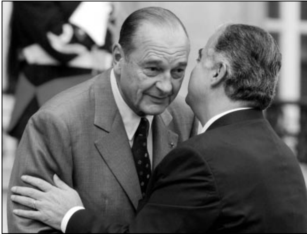
الرئيس الفرنسي جاك شيراك مستقبلاً رئيس الوزراء اللبناني رفيق الحريري في باريس أمس