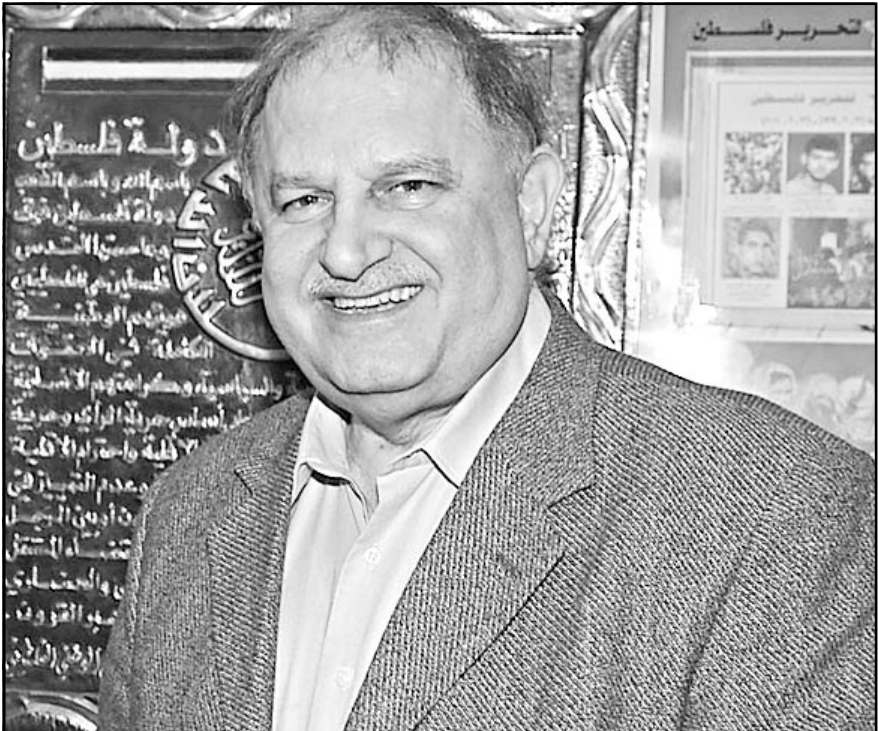
هاني الحسن وزير الداخلية الفلسطيني

يمكن التوصل لاتفاقيات في الامور المركزية من دون تحالفات واسعة داخلها. هاني الحسن ذو خبرة معينة في القوات السرية، فمُنذ عام 1986 كان رئيسا لوفد فلسطيني صغير شارك في لقاءات سرية جرت خلال سنة ونصف في باريس وبروكسيل، وكانوا قد قالوا لاسحق شامير الذي كان وزيرا للخارجية في حينه ان الحداديات هو فتح تدرج حول قضية الأسرى والمفقودين. رئيس الحكومة شمعون بيريس ووزير دفاعها اسحق رابين اعطوا لشلومو غازيت وليرجل «الشاباك» يوسي غينوسار حلا طويلا. المناقشات جرت حول مسائل سياسية وتوقفت إثر اختطاف ايراص رقم 300 وتبادل رئاسة الحكومة بين شامير وبيريس.