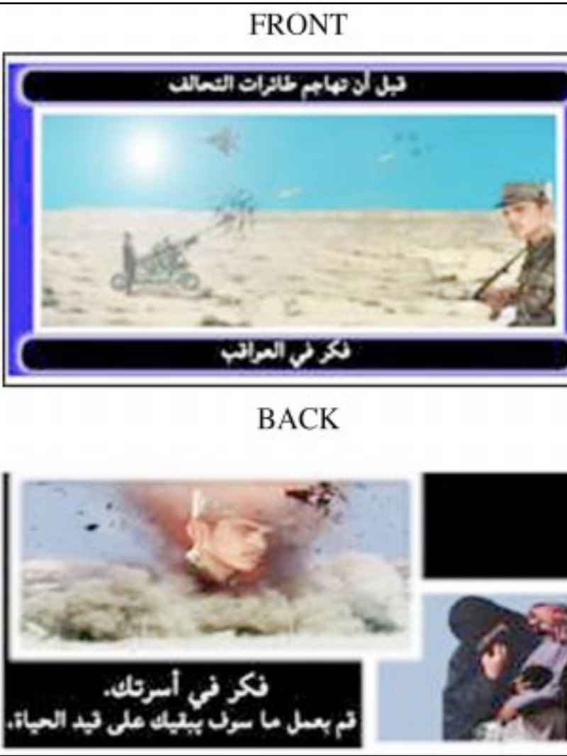
اهد المنشورات التي تلقيها الطائرات الامريكية في جنوب العراق