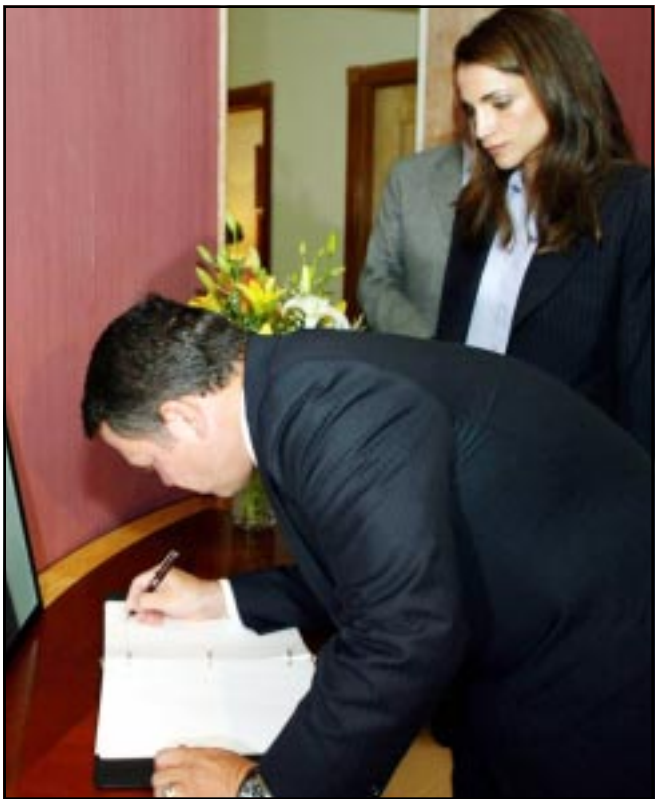
الملك عبد الله يوقع في دفتر العزيزين لدى زيارته وزوجته الملكة رانيا السفارة الامريكية امس