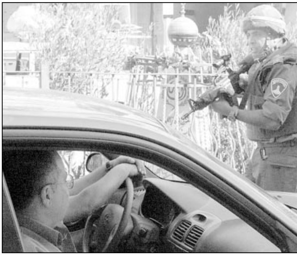
جندي اسرائيلي يصب سلاحه تجاه سيارة مدنية فلسطينية في مدينة الخليل الحلة أمس