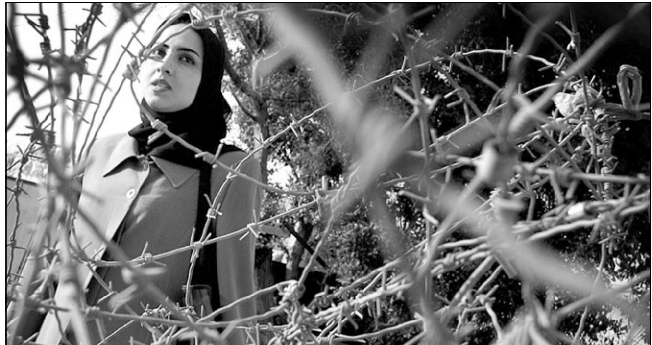
فتاة فلسطينية تحاول اجتياز اسلاك شائكة تغلق الطريق بين رام الله والقدس

مقعداً (10)، وحزب «ميريتس» العماني اليساري على 10 (10)، وحزب شينوي العماني (6) وكنتلة الاتحاد القومي -اسرائيلي بيننا المتشددة من 8 الى 9 مقاعد (8)، وحزب التوراة الموحدة المتشددة 5 (5)، والحزب القومي الديني (يمين) من 4 الى 5 مقاعد (5)، وحزب «عليا» (يمين) من 4 الى 5 (5)، وحزب «مع احاد» (يساري نقابي) على ثلاثة مقابيل الاثني حالياً، ويرى 63 % من الاشخاص الذين شملهم الاستطلاع ان الاعتمادات الخاصة للمستوطنين في مشروع موازنة 2003 غير عادلة، وسيحصل حزب «شاس» المتشدد، بحسب الاستطلاع، على 13 مقعداً (17 حالياً)، والاحزاب العربية على 11