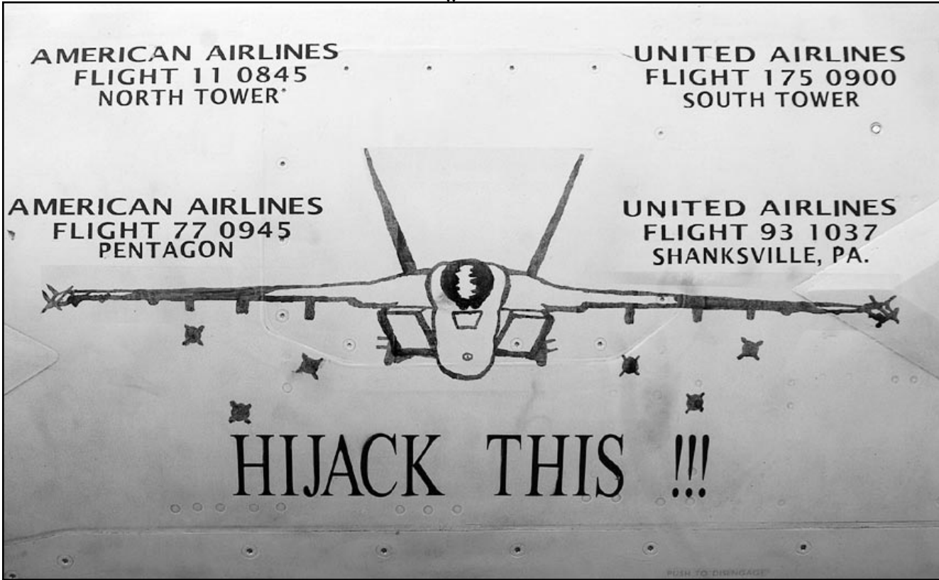
تمد بالخط وتذكير بارقام الرحلات الجوية والطائرات التي استخدمت في هجمات ايلول بالولايات المتحدة وضعا على طائرة مقاتلة تستعد للاقلاع باتجاه العراق

فيها السلطة الاردنية قمع الحريات وتعطيل البرلمان ومراقبة الشارع، ومنع اي صورة من صور الاحتجاج على ما يخطط لبلد عربي قريب، يستفيد الاردن من علاقته معه.