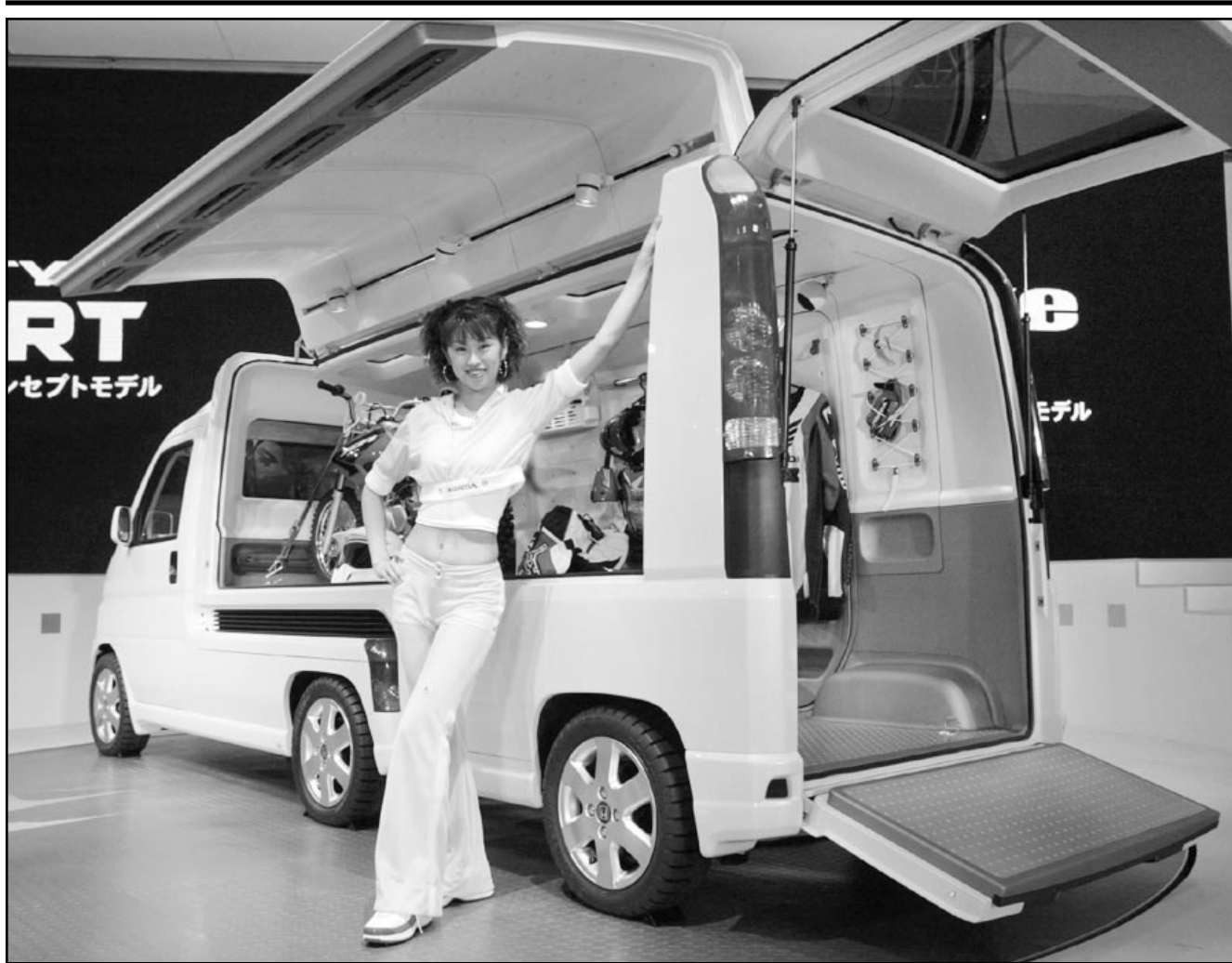
عارضة من شركة هوندا تقدم اقم في معرض طوكيو للسيارات عبرة اعمال ذات مقطورة صغيرة يمكن فتح حيارها اليسر والخلفي كلية لاتاحة تحميلها وتفريغها بسرعة

وبلغ صافي ارباح الشركة في اول تسعة اشهر من العام الماضي 62,33 مليون دينار، وقاتل سوق الاسهم الكويتية في تقرير عن نتائج الشركة صدر امس الثلاثاء ان صافي ارباح في اول اشهر من عام 2002 تضمنت تعويضات قدرها 11,87 مليون دينار حصلت عليها الشركة عن الاضرار التي لحقت بها من جراء الغزو العراقي للكويت في عام 1990.