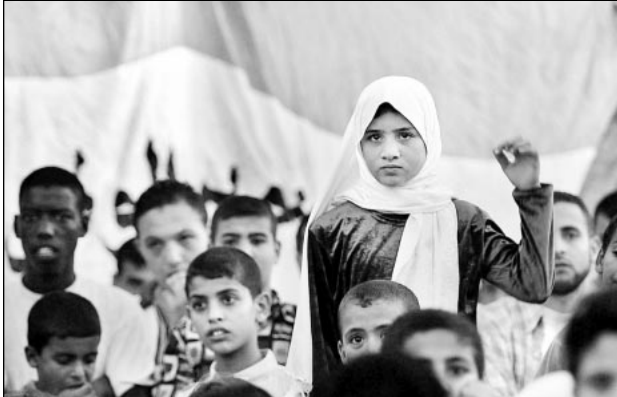
اطفال يشاركون في مهرجان نظم في مخيم البريج الجمعة احياء لذكرى شهداء الانتفاضة

القدس- «القدس العربي»- وكالات: أعلنت الإذاعة الإسرائيلية العامة أن الجيش الإسرائيلي سيخضع الى حد كبير نشاطات مكاتب الارتباط مع الفلسطينيين التي توقفت عن العمل منذ اندلاع الانتفاضة منذ أكثر من 25 شهرا. وتعتبر مكاتب الارتباط التي اقيمت مع قيام نظام الحكم الذاتي الفلسطيني في 1994 احد اخطر رموز التعاون الامني الإسرائيلي الفلسطيني. وعمليا خفضت هذه المكاتب نشاطاتها الى حد كبير حيث ان الدوريات المشتركة توقفت بشكل تام منذ اندلاع الانتفاضة في 28 ايلول (سبتمبر) 2000. وأكد ناطق باسم الإدارة العسكرية الإسرائيلية المكلفة معالجة المسائل المتعلقة بحياة الفلسطينيين اليومية لوكالة «فرانس برس» عملية «إعادة هيكلية المكاتب ليعملها أكثر فعالية نظرا لاطلاق الجديد» الذي أحدثته الانتفاضة. وتصبح هذه المكاتب اعتبارا من كانون الثاني (يناير) برئاسة ضباط اقل رتبة وستكون تابعة مباشرة للإدارة العسكرية وليس لقادة القطاعات بحسب مصدر عسكري. على صعيد آخر اعتقل الجيش الإسرائيلي سبعة فلسطينيين خلال حملة قام بها بالقرب من جنين في الضفة الغربية كما أفادت الجمعة مصادر أمنية فلسطينية.