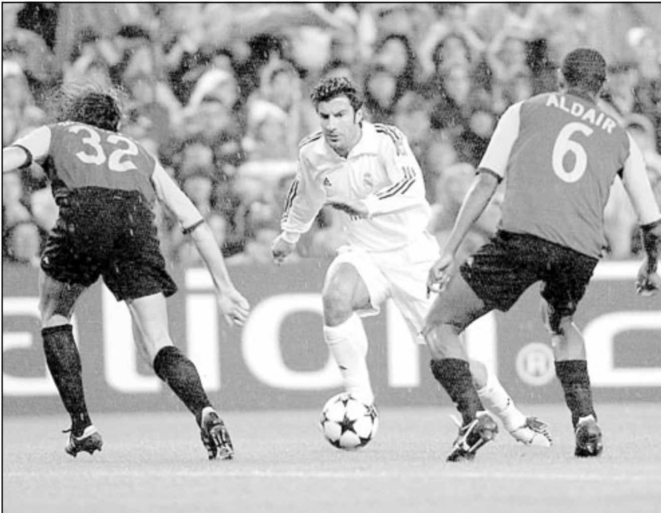
لقطة من إحدى مباريات ريال مدريد

وسيلح ارسنال صيفيا الأحد على فولهام الفريق الحادي عشر في القائمة برصيد 15 نقطة.