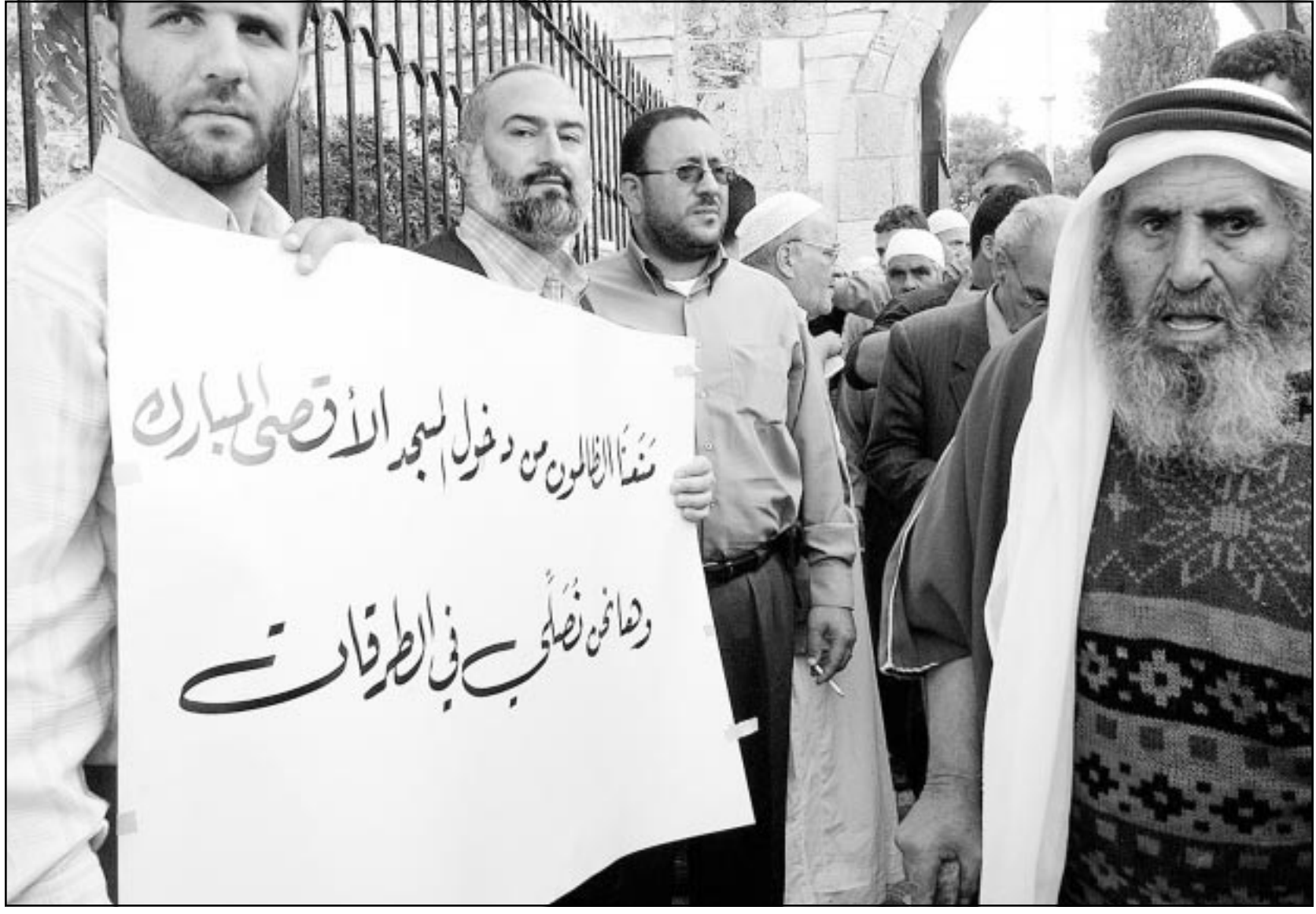
«منعنا الظالمون من دخول المسجد الأقصى...» لافتة حملها محتجون في القدس لم يتكثروا من أداء صلاة الجمعة في المسجد الأقصى

القدس - ق. ب.: لا تزال سلطات الاحتلال الإسرائيلي تحاول تجربة مختلف الوسائل القمعية تجاه الشعب الفلسطيني الذي يقاوم من أجل حقوقه الشرعية والتاريخية في إقامة دولته وتقرير مصيره بعد كفاف دام أكثر من أربعة وخمسين عاما.