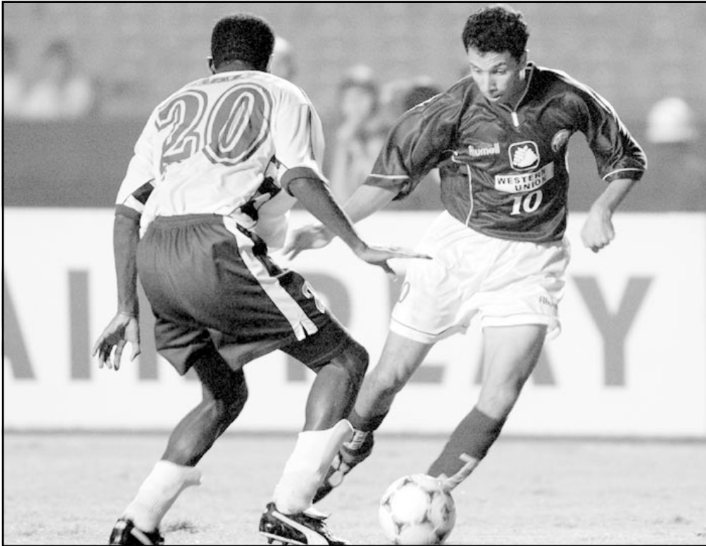
لقطة من مباراة الرجاء البيضاوي

نيقوسيا-اف ب: يخوض الرجاء البيضاوي المغربي والزمالك المصري مباراتين صعبتين في ذهاب الدور نصف النهائي من مسابقة دوري ابطال افريقيا لكرة القدم السبت والاحد. ويحل الرجاء ضيفا على اسكيد ابيدجان العاجي السبت، والزمالك على مازيمي من الكونغو الديموقراطية الاحد، ويسعيان الى تحقيق نتيجتين جديتين ذهابا تساعدهما في مباراتي الاياب في الرباط والقاهرة على التوالي بين 15 و17 من الشهر الحالي ايضا.