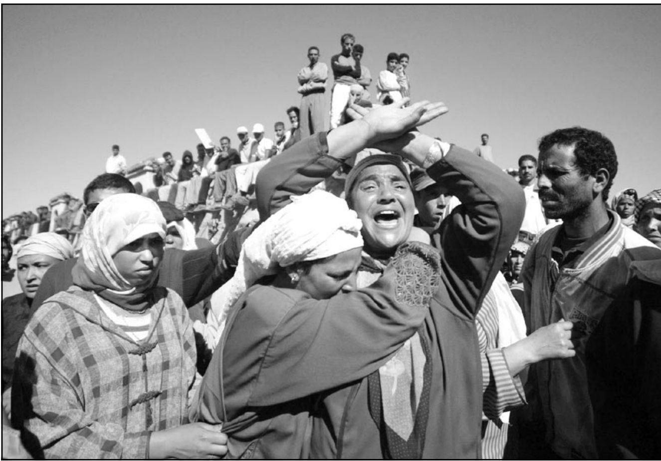
عائلات الضحايا تبكي مصير السجناء الذين لقوا حتفهم في حريق الجمعة

الرباط - باريس - قنا: تكسر بالرباط إن محمد بن عيسى وزير الخارجية والتعاون المغربي سيقوم الأسبوع المقبل بزيارة للعاصمة البلجيكية بروكسل. وقالت وكالة الأنباء المغربية إن بن عيسى سيجري خلال الزيارة مباحثات مع عدد من المسؤولين الأوروبيين من ضمنهم روسانو برودي رئيس المفوضية الأوروبية وتتناول العلاقات بين الجانبين في المجالين الاقتصادي والسياسي بالإضافة الوضع في الشرق الأوسط ولف العراق. من جهة ثانية أعلن رسمياً بباريس يوم الجمعة أن ميشيل اليوت ماري وزيرة الدفاع الفرنسية ستقوم الاثنين القادم بزيارة للمغرب. وقال المتحدث باسم وزارة الدفاع الفرنسية في تصريحات للصحافيين إن هذه الزيارة ستشكل مناسبة لبحث التعاون العسكري بين البلدين والوضع الدولي. وتعقب زيارة اليوت ماري زيارة للرباط أتتها وزير الخارجية الفرنسية قبل ثلاثة أيام دومينيك دو فيليان.