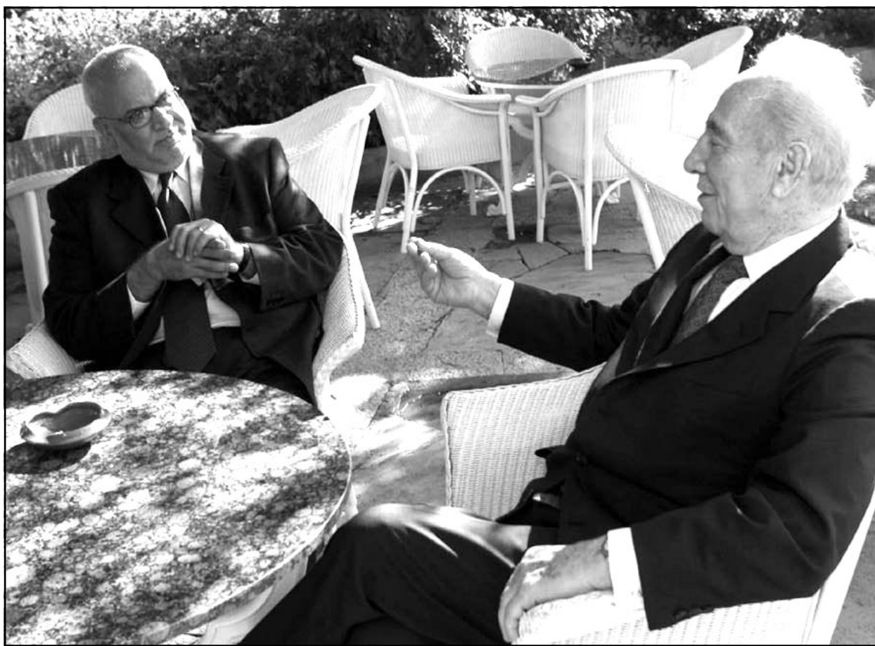
صائب عريقات مجتمعاً مع شمعون بيريس على هامش منتدى فور منتور لدول حوض المتوسط والاتحاد الأوروبي في مالما دي مايو بجزيرة مايوركا الإسبانية

برؤية يوش للسلام في الشرق الاوسط التي قال انها تتضمن قيام دولة فلسطينية. واعرب الفلسطينيون عن قلقهم من عرض شارون لمنصب وزير الدفاع الذي خلا بعد انسحاب بنيامين بن العازر زعيم حزب العمل من الحكومة الائتلافية على شاؤول موفاز رئيس الازكان السابق الذي