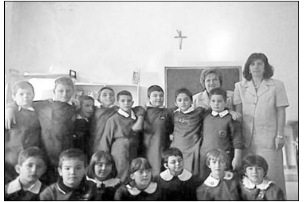
صورة من الايتيف اطفال الحضاة الذين قضاوا تحت الانقاض

وقال ان «مت انتशल 25 جثة» وقال مسؤول وزارة الداخلية ان