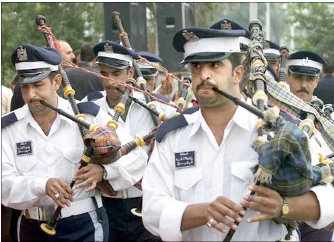
فرقة مراسم عراقية تعزف النشيد الوطني اثناء افتتاح معرض بغداد التجاري الدولي

■ المناقصة، لكن قالت ان الطلب خفض الان الى 319 حاوية، وازدادت الى المناقصة «الغلق لتورها لكن لم يتحدد شيء بعد. الطلب اقل بضع الشيء الان.. انها عملية سرية»، ورفضت لارسن ذكر مزيد من التفاصيل. وتضمنت لنصل خلال تشرين الثاني (نوفمبر) وكانون الاول (ديسمبر). وطرح البحرية ايضا مناقصة لنقل كميات من الذخيرة بين موانئ الخليج في اطار تحركات القوات الامريكية بينما تقرب الامم المتحدة من تبني قرار جديد بشأن نزع سلاح العراق. وتضمنت احدي المناقصات طلب سفينة لنقل 550 حاوية ذخيرة ومتفجرات من الساحل الشرقي للولايات المتحدة الى اربعة موانئ في البحر الاحمر والخليج. وقال مصدر ملاحى اجر سفنا لنقل ذخيرة لوزارة الدفاع البريطانية، هذه كمية كبيرة من الذخيرة، وافاد ان السفينة يمكنها نقل ما يصل الى عشرة الاف طن. واكد تريش لارسن المتحدث باسم وحدة البحرية الامريكية المختصة بنقل الممرعات وغيرها من الامدادات العسكرية للقوات الامريكية اصدار