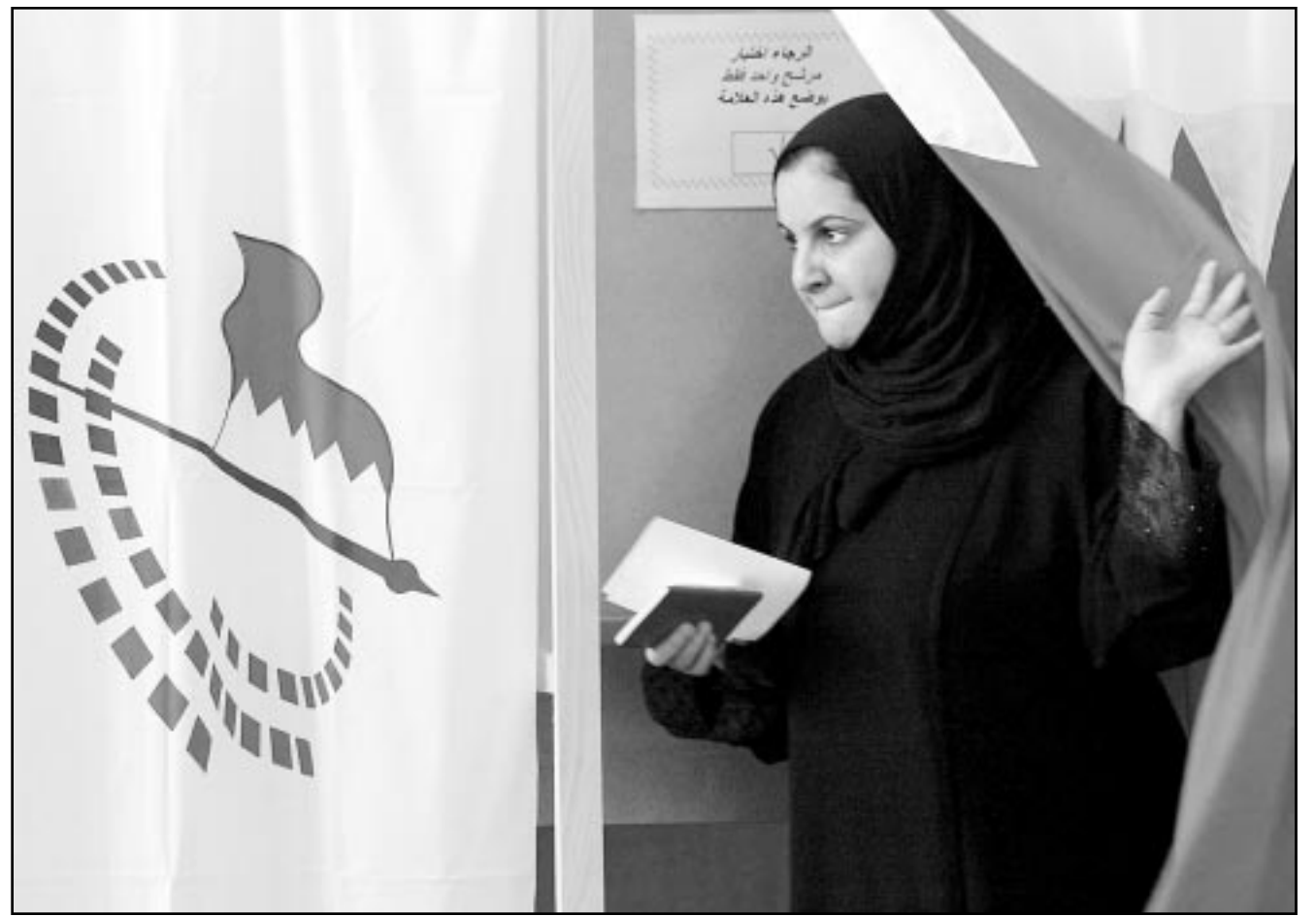
سيدة بحرينية بعد مشاركتها في الانتخابات بالنامة