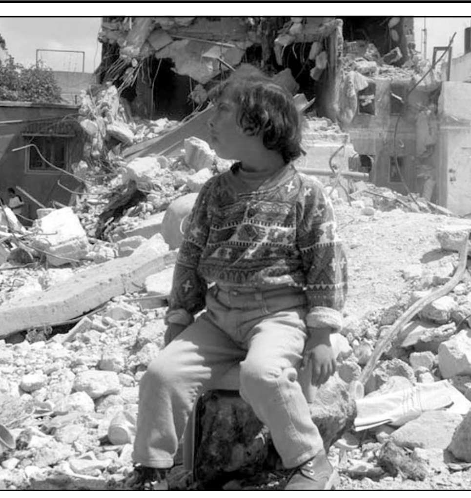
طفلة فلسطينية تجلس وسط الدمار الذي يتراكم يوما بعد يوم في مخيم جنين النكوب

دمشق - ا ف ب: ذكرت وكالة الانباء السورية ان الرئيس السوري بشار الاسد اصدر عفوا عاما عن المتخلفين عن خدمة العلم والذين فروا منها. وقالت الوكالة ان الرئيس الاسد اصدر قانونا بـ«عفو محو عام عن الجرائم المتعلقة بخدمة العلم المرتكبة من قبل الاشخاص الذين لم يؤدوا الخدمة او قاموا بخدومتها وفروا قبل نهايتها». واوضحت ان هذا القرار شمل «كل من قام بوضع نفسه تحت تصرف الشعب الجندية في محافظاتهم وخلال اربعة اشهر من تاريخ صدور هذا القرار ليقوم بتأدية الواجب الوطني واتمام خدمته للمعلم». ويشار الى ان خدمة العلم الزامية في سورية للرجال وتستمر عامين ونصف العام ويستثنى منها الوحيد لعائلته.