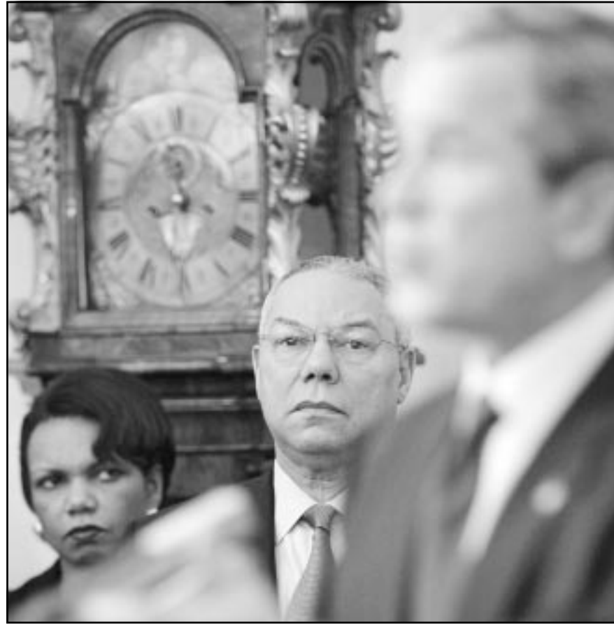
الرئيس الأمريكي مع وزير خارجيته ومستشارة الامن القومي اثناء قمة الاطلسي في براغ امس

بعد العثور الثلاثاء على متفجرة موضوعة تحت احدى العتور الحديدية في احدى ضواحي العاصمة، وانتشر شرطي 4500 عسكري في براغ تحسبا لاحتمال وقوع اعتداء اراهبي، او تظاهرات عنيفة في الشوارع. والى جانب الطيران العسكري التشيكي، تحلق مقاتلات امريكية ومروحيات وطائرة-رادار من طراز «اوكس» في اجواء المدينة. وانفقت الشرطة التشيكية حوالي 20 مليون يورو من اجل تزويد عناصرها في قسم مكافحة الشغب بزيات جديدة للحماية وباليات جديدة، كي لا يتكرر الوضع الذي واجهته في خريف العام 2000 عندما عجزت القوى الامنية عن ضبط التظاهرات التي قام بها ناشطون مناضلون للعودة خلال انعقاد المؤتمر السنوي لصندوق النقد الدولي والبنك الدولي في براغ. وقد اقل عدد كبير من الطرق بشكل تام اصام الاشخاص العاديين واقتصر المرور فيها على العيانت الرسمية في دائرة واسعة حول «مقر الكونغرس» حيث ستعقد القمة. وتفتتح قمة الاطلسي رسميا غدا الخميس، ويلتقي رؤساء الدول والحكومات الـ19 المشاركة في القمة مساء امس في عشاء رسمي يتحدث فيه عميد الرؤساء الرئيس الفرنسي جاك شيراك، وموجهة التي فاتسلاف هافل الذي يهني وايته الرئاسة في براغ.