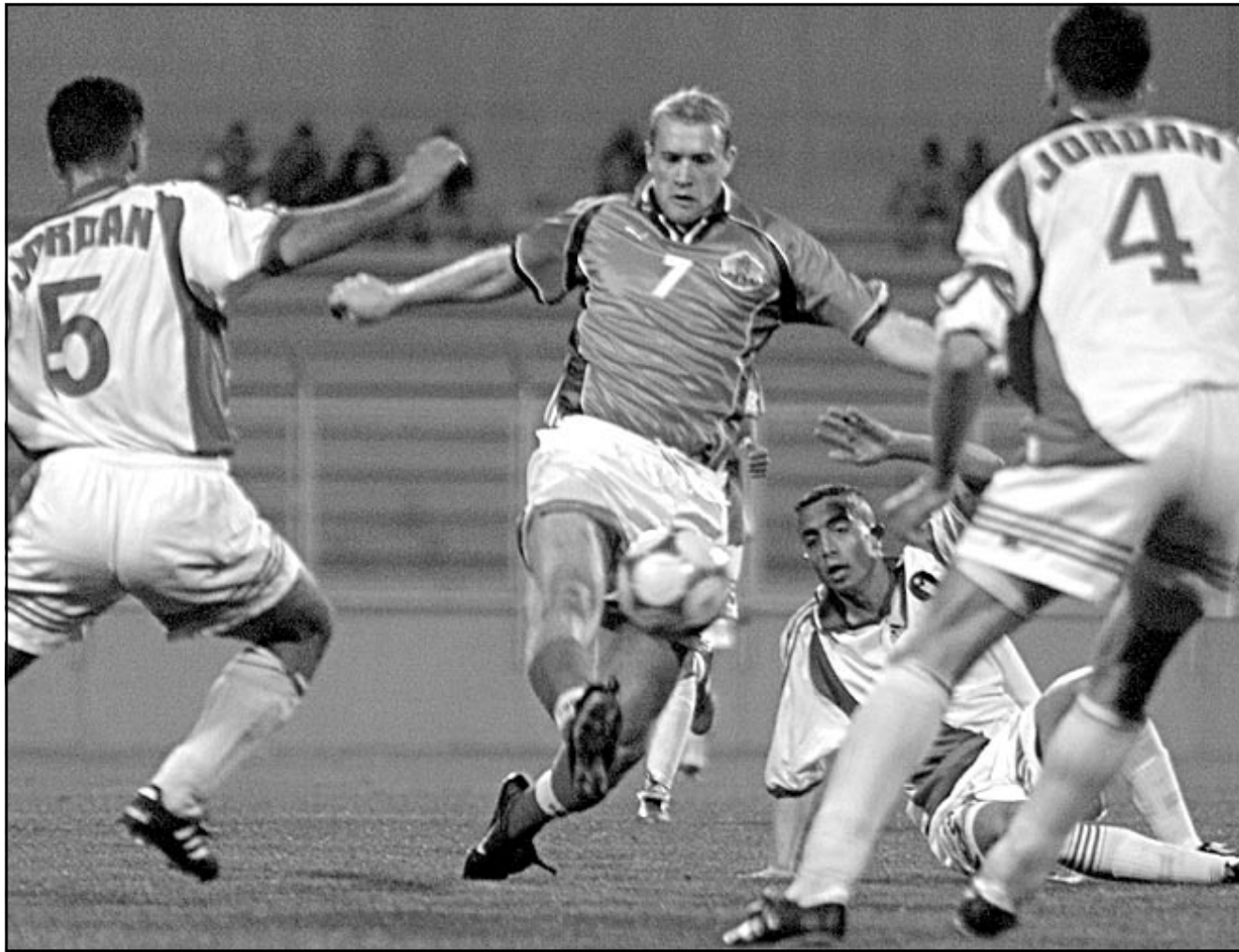
لقطة من إحدى مباريات منتخب الأردن

الاول والوحيد حتى الان ويخوض منتخب الكويت لكرة القدم 4 مباريات ودية خلال معسكره في مدينة أنطاليا التركية من 28 تشرين الثاني/نوفمبر الحالي الى 12 كانون الاول/ديسمبر المقبل استعدادا لكأس العرب التامة المقررة في الكويت من 16 الى 30 منه. وأوضح مدير المنتخب سعد الحوطي ان رحله سيلتقون مع ارسنال كيبف الاوكراني (درجة اولي) وانطاليا سبور التركي (درجة ثانية) واحد اندية الدرجة الاولى في اوكرانيا ايضا واخيرا مع منتخب ازربيجان او احد اندية الدرجة الاولى في تركيا في 1 و 4 و 7 و 11 من الشهر المقبل على التوالي. وكان مدرب منتخب الكويت البيوغوسلافي راديكو افراموفيتش اختار 24 لاعبا لمعسكر المنتخب الذي اوقعته قرعة كأس العرب في المجموعة الثانية الى جانب المغرب والسودان والاردن وفلسطين، فيما ضمت المجموعة الاولى السعودية، حاملة اللقب، وسورية ولبنان والبحرين واليمن.