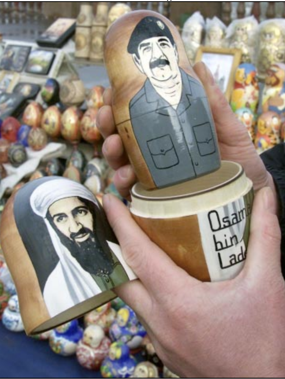
دمى على شكل الرئيس العراقي واسامة بن لادن في محل بومسكو (اف ب)