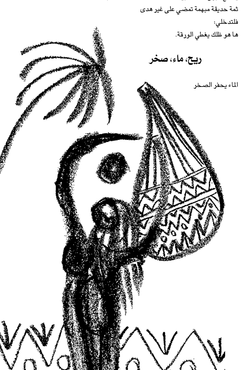
* اشاعر من مصر يقم في ابو ظبي

يلمع، اسفلت من جديد، تعبيرين الشارح انه الرذان الثالث في الليل الليل الغافي في سربوك موح انفاسك اصابعك الهوائية تشعل عيوني نبع خيالات وقيامات اسمعيني كما نسجع المطر تمر السنوات، تعود للحظات هل تسمعين خطاك في الغرفة المجاورة؟ لا هنا ولا هناك، اتسمعيني؟ في زمن اخر هو الان اسمع خطى الزمن خالق الاماكن التي لا وزن لها ولا مكان اسمع المطر يركض على الشرفة يزداد عمق الليل في الغابة يصنع البرق له عشبا بين الاغصان ثمة حديقة مبهمة تضي على غير هدى فلتدخلخي ما هو ذلك يغطي الورقة.