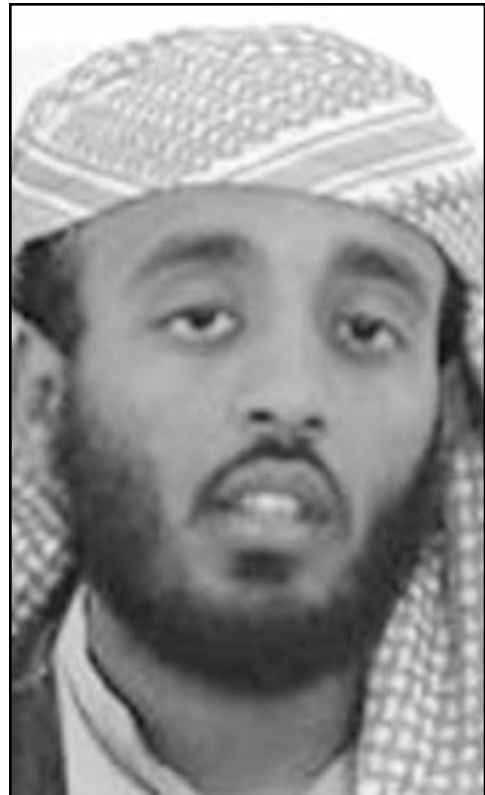
رمزي بن الشيبة

واشنطن - رويترز: - قالت صحيفة واشنطن بوست امس الاربعة ان رمزي بن الشيبة القيادي البارز في تنظيم القاعدة الذي تحتجزه الولايات المتحدة اعترف بوجود صلات بين زكريا موسوي المتهم بالتآمر في هجمات 11 ايلول (سبتمبر) من العام الماضي على نيويورك وواشنطن والرجل الذي تشببه السلطات الامريكية بانه مخطط الهجمات. ونقلت الصحيفة من مصادر مطلعة على التحقيقات قولها ان ابن الشيبة ابغ المحققين الامريكيين بن موسوي التقى مع خالد شيخ حمد في افغانستان في شتاء 2000. وقاتلت واشنطن بوست ان اعترافات ابن الشيبة تكشف ان موسوي كان على اتصال مباشر مع شيخ الذي يعتقد انه مدير الهجمات والذي يقال انه امضى عامين يخطط لها. واضافت ان ابن الشيبة ابغ المحققين بان شيخ قدم لموسوي اسماء شخصيات للاتصال بها في الولايات المتحدة وانه نقل لموسوي اموالا قبل الهجمات.