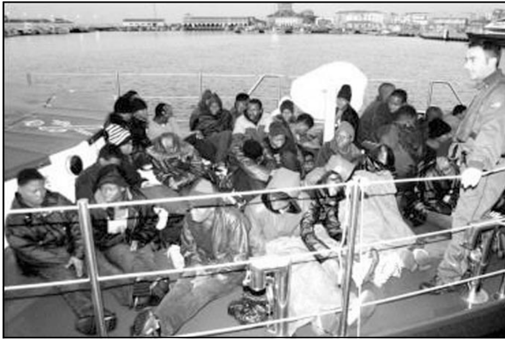
مهاجرون سريون أفارقة في يد الشرطة الإسبانية يوم الخميس الماضي

موراليس كامارو من اليسار الموحد في مجلس الشيوخ هذا الأسبوع. وذكر وزير الداخلية أنجيل أسبسيب في المجلس نفسه أن تلك العملية تدخل في إطار مخصص «فوكوس» الذي دخل حيز التنفيذ مؤخرا لمحاربة الجريمة وليس لمواجهة تعقب المهاجرين، لكن النقابة الموحد للشرطة كذبت تصريحات الوزير وأكدت أن المهاجرين يتكلمون 70% من القبض عليهم ضمن مخطط «فوكوس» لا لارتكابهم الجرائم وإنما لعدم توفرهم على وثائق الإقامة القانونية. وسبق للنقابة نفسها أن انتقدت وبشدة أطروحة الحكومة الرامية إلى ربط الهجرة بارتفاع نسبة الإجرام في المدن الإسبانية، مؤكدة وبمخطبات ميدانية أن نسبة المهاجرين في الإجرام عادية كما هو في باقي الدول الأوروبية الأخرى وأحيانا أقل. ويبدو أن ماسي الهجرة السرية لم تعد تقتصر فقط على مضيق جبل طارق أو جزر الخالدات، فقد أفادت أسبوعية «ماروك» أيبود أنترناسيونال، في عددها الأخير أن 16 إفريقيًا لقوا حتفهم على الحدود المغربية الموريتانية بسبب العطش والجوع، مشيرة إلى أن قضية المهاجرين السريين في الحدود بين البلدين بدأ يسبب في مشاكل بين الرباط وتواكسوط.