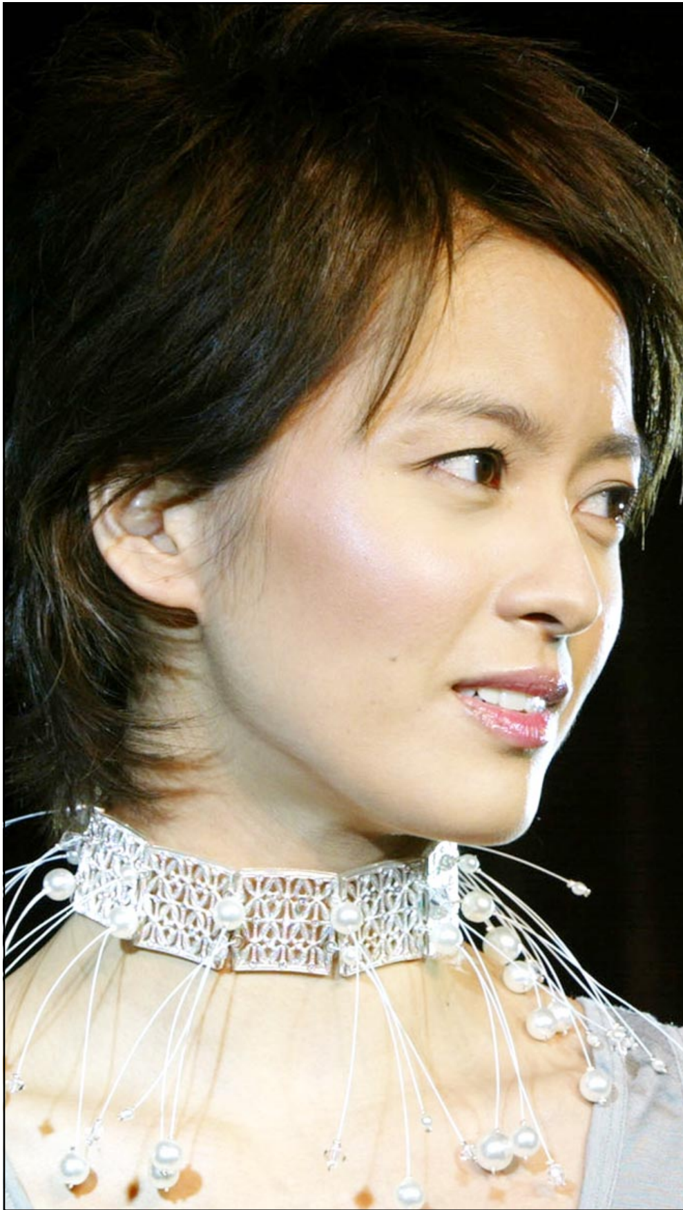
المغنية جيجي ليوغ من مونغ كونغ قامت بعرض هذا العقد الكريستالي من منتجات شاروفسكي في حفل اقيم في غراوغزو بالصين

لندن-رويتز: قال باحثون الجمعة ان تناول مضافات يومية من حمض الفوليك او من الاطعمة المزودة به يمكن ان يساعد على الوقاية من امراض القلب والسكتات الدماغية وتجلط الدم خاصة لدى الاشخاص المعرضين للإصابة بهذه الامراض. وحمض الفوليك هو مركب مؤلف من الفوليت وفيتامين «ب» ويوجد في الخضراوات الورقية الخضراء التي تبين انها تقلل من مخاطر الاصابة بالعيوب الخلقية اذا تناولتها السيدات اثناء فترة الحمل. وقال الباحثون البريطانيون انه يلعب ايضا دورا حيويا في تقليل احتمالات الإصابة بالسكتة الدماغية وامراض القلب والتي تأتي في مقدمة اسباب الوفاة في الغرب وذلك من خلال الحد من مستويات مادة الهوموستاتين في الدم. وقال ديفيد وورد العضائي الاكاديمية في