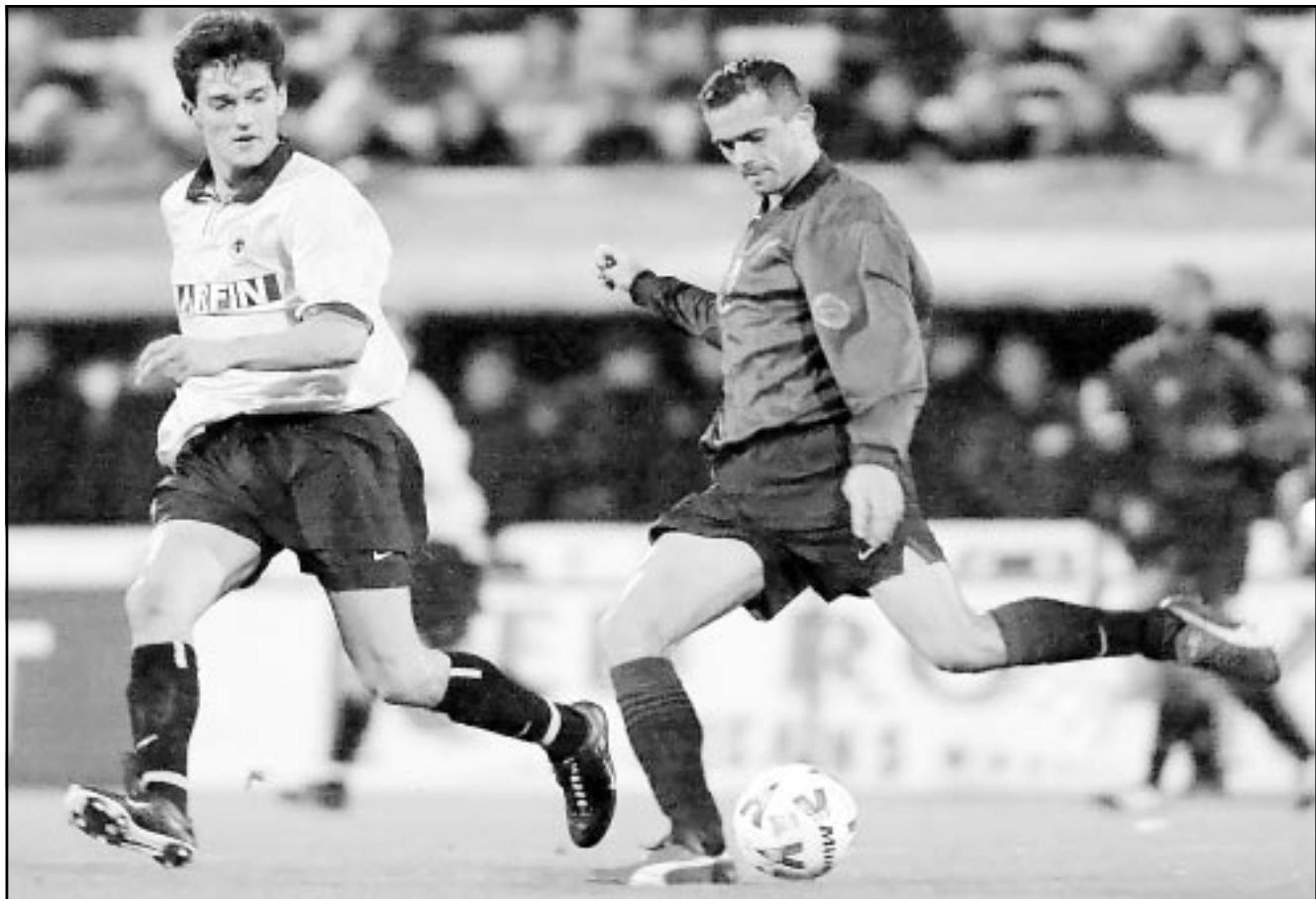
لقطة من إحدى مباريات برشلونة

■ نيقوسيا - أ ف ب: سيكون ملعب نوكامب في برشلونة السبت مسرحاً للمباراة الرقبة بين الغريمين التقليديين برشلونة وريال مدريد في اسبانيا، في حين يحتضن ملعب سان سيرو في اليوم ذاته لقاء دربي بين قطبي مدينة ميلانو الإيطالية.