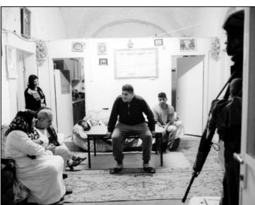
جندي اسرائيلي يستوطن داخل منزل عائلة فلسطينية لاطلاق النار على المارة في احد شوارع بيت جالا التي اغتالها امس (رويتز)

القدس - ا ف ب: اشار استطلاع للرأي الجمعة الى تزايد تقدم رئيس الوزراء الاسرائيلي ارييل شارون خلال هذا الاسبوع على وزير الخارجية بنيامين نتنياهو قبل الانتخابات لرئاسة حزبهما الليكود (يمين). ويسجل شارون قبل اقل من اسبوع على الانتخابات الحزبية تقدما قدره 18 نقطة على منافسه.