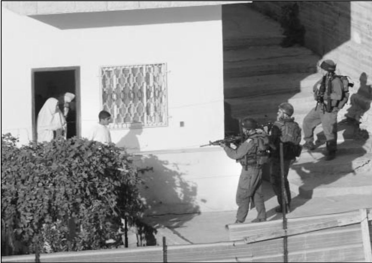
جنود اسرائيليون يشهرون بتأديتهم صوب عائلة فلسطينية في بيت لحم (اس ف ب)

مع زعماء حماس في القاهرة لاقناعهم بوقف الهجمات، وقال «ليس صدفة ان يجيء الحوار بين الحكومة (في اكتوبر) وقبل انتخابات (العمل) الاسرائيلية... والخميس كمر النشاطون موقوفه». وقال خالد الجيش مسؤول الجهاد البارز «هجماتنا المستهدفة التي لم يدينوها. ونحن النشاطون الفلسطينيين من قبل هجمات تزامنت مع الحملة الانتخابية الاسرائيلية. وارات حماس اسقاط مسعودون بيريس رئيس الوزراء عام 1996 بشن سلسلة من الهجمات لتأخر من قتل اسرائيل ليجي عياش الملقب بالهندس لخبرته في تصنيع القنابل. والامن هي قضية رئيسية في الانتخابات الاسرائيلية القادمة. وقال مسؤول رفيع من فتح ان عرفات اراد الاضرار بفرص شارون في الانتخابات القادمة فاولد مؤخرًا مسؤولًا من حركته للتفاوض