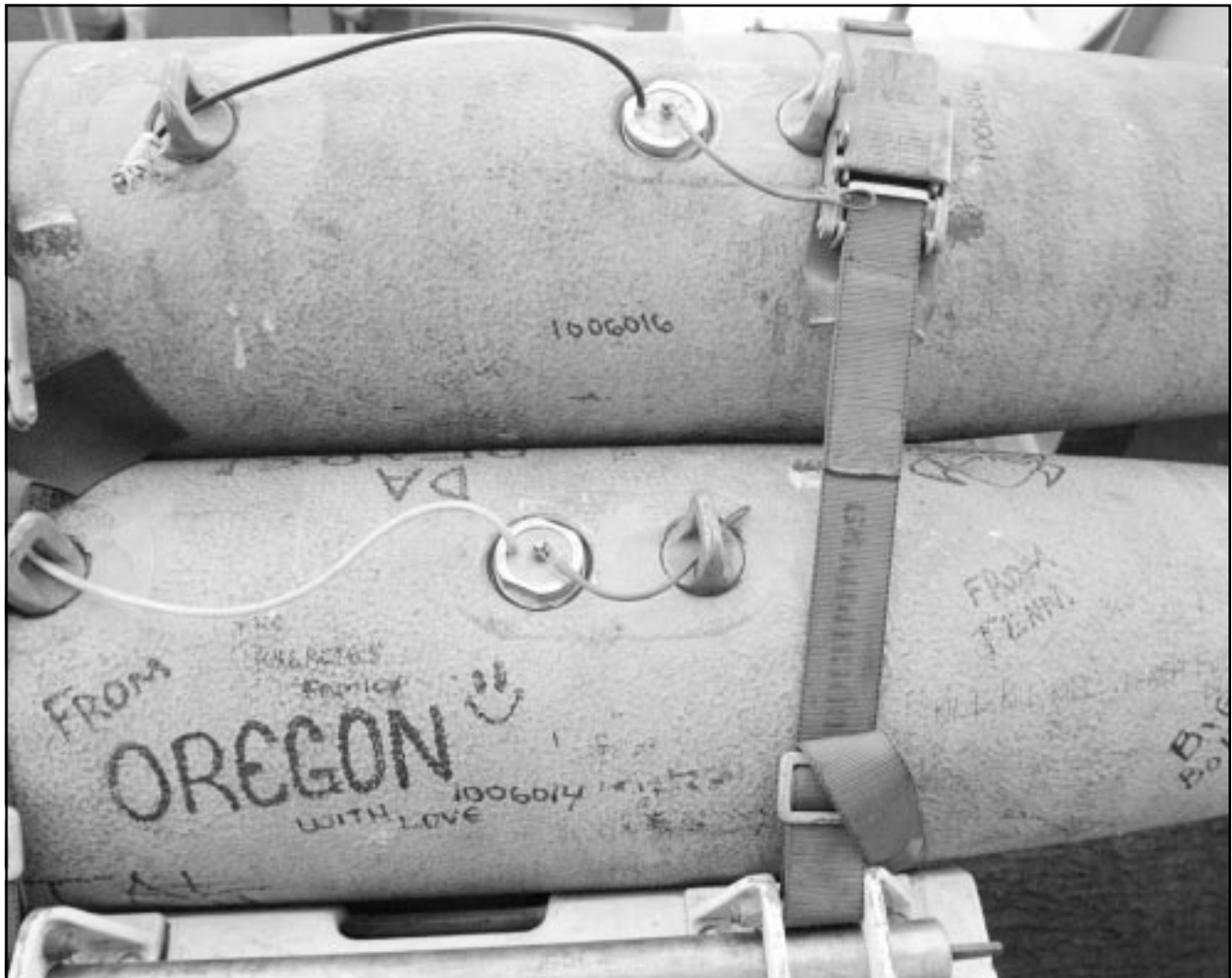
قنبلة أمريكية كتب عليها «أوريجون» على ظهر حاملة الطائرات الأمريكية أبراهام لنكولن