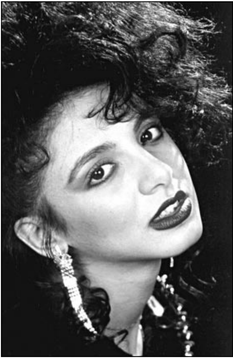
انغام (القدس العربي)

اي لهجة عربية تغربني بالغناء بها طابا اجيدها والسلمة ليست عيبا واللهجة الخليجية سهلة وسلسة، ولا اراها شيئا غريبا، وسبق ان غنى عبد الحليم حافظ باللهجة الكويتية وهي اصعب اللهجات الخليجية.