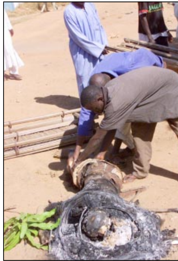
رجلان يرفعان جثة نيجيري قتل اثناء اشتباكات في مدينة كادونا

■ لاغوس - اف ب: قتل 100 شخص على الاقل في صدامات واعمال شغب بين مسيحيين ومسلمين بدأت الاربعاء في مدينة كادونا (شمال نيجيريا) في وقت حاول قادة محليون تهدئة غضب المسلمين اثر نشر مقال عن مسابقة ملكة جمال العالم اعتبر مسيحا للاسلام. وقال شهود عيان ان صدامات وقعت في ابوجا بعد صلاة الجمعة عندما قام مسلمون باضرار النار في سيارات.