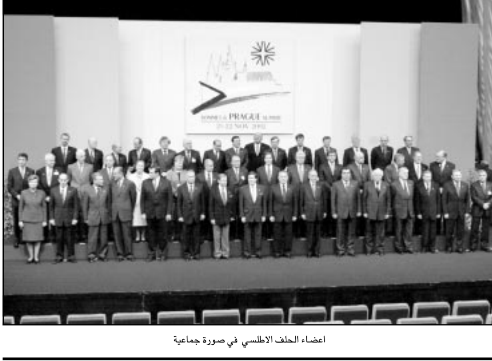
اعضاء الحلف الاطلسي في صورة جماعية

براغ- اف ب: رويترز: اعرب وزير الخارجية الروسي ايجور ايفانوف عن ارتياحه الجمعة في براغ في ختام الاجتماع الاول لمجلس حلف شمال الاطلسي-روسيا الذي شكل في ايار (مايو) الماضي لكنه بدأ متحفظاً حيال توسيع الحلف الذي اقترحه الدول الـ19 مصلحة روسيا العليا. ومن جهته قال جورج روبرتسون الامين العام للحلف انه لم يثيروا مسألة الحملة العسكرية التي شنتها موسكو على الشيشان وابدوا تعاطفهم مع روسيا في واقعة احتجاز مسلحين شيشان لرهائن في مسرح موسكو الشهر الماضي، وابدوا ايفانوف موافقته على توسيع الحلف بقوله للمصاحفين ان تغير الوضع العسكري للحلف يعني انه الآن يواجه التهديدات الراهية نفسها التي تواجهها روسيا. وقال «انا لا اعتبر ان هذا التحول الذي يشهده الحلف يجب الترحيب به». وقال مسؤولون امريكيون ان بوش سيستبعد باحترام مصالح روسيا الاقتصادية في اي عمل عسكري محتمل لنزع اسلحة العراق. وفضل بوتين عدم حضور قمة براغ لتجنب الحرج من ان يبدو وكأنه يبارك رض الحلف لسبع دول منها دول البلطيق استونيا ولاتفيا وليتوانيا التي كانت تابعة لروسيا. وعلى صعيد اخر ذكرت المحسدي باسم قصر الازبكية ان الرئيس الفرنسي جاك