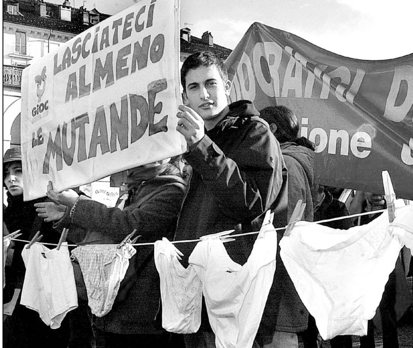
عمال مضربون يتحذون الجمعة في مدينة تورين (شمال) على خطط شركة فيات الإيطالية للسيارات لاعادة هيكلتها وتوزيع 8000 من مستخدميهما، وقد كتبوا على البانطاة الرفوعة قرب جبل للغسيل علق عليه سراويل داخلية «لا أقل أبقا لنا ملابسنا الداخلية».

في الولايات المتحدة الى نحو 70 مليار دولار في العام الماضي، ولكن خسائر الولايات المتحدة من اعمال القرصنة والسطو على حقوق الملكية في صناعة البرمجيات شكلت نحو 30 في المئة من اجمالي الخسائر التجارية البالغة 9,4 مليار دولار.