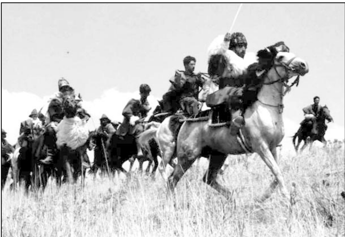
لقطة من العمل

الخيام كافران لختلف جوانب الحياة السياسية والاقتصادية والاجتماعية في ذلك الوقت، ولذلك نجد هناك عدداً كبيراً من الأبطال والخطوط الدرامية والصراعات الأساسية والثانوية والتي تشكل نسج هذا العمل. لكن ماذا عن الخط الدرامي الأساسي للعلم؟