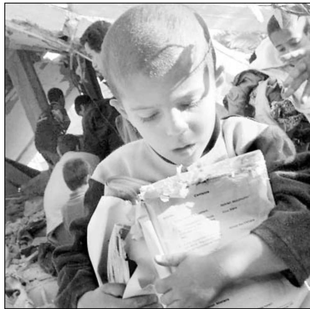
مطل فلسطيني يجمع اوراق كتبه التي تبعتها وسط دمار المنزل الذي هدمه الاسرائيليون في خان يونس الجمعة

واوضح الجبيري ان وجود المستوطنين داخل البلدة القديمة واقامة اليور الاستيطانيات الموقعة بشأن الخليل والرئيسي في التور الحاصل في المدينة، وشهد الجبيري على ضرورة مطالبة الوفد البريطاني لحكومته والمجتمع الدولي بالضغط على حكومة اسرائيل لخطيخ اتفاق الخليل الذي وقع عام 1996 مع رئيس الحكومة بنيامين نتنياهو والذي لم يطبق على الارض، مشيراً الى ان عدم تطبيقه هو السبب الرئيسي في التوتر الحاصل في المدينة وعدم اخراج المستوطنين من داخل المدينة حسب الاتفاق. واكد الجبيري للقطفص البريطاني ان السبب الرئيسي في اشتعال المنطقة والاحداث الصعبة التي تحصل بين الشعبين عدم تطبيق حكومة اسرائيل للاتفاقات الموقعة مع الجانب الفلسطيني وقيام حكومة شارون بالاعلان عن الغاء اتفاق اوسلو وجميع الاتفاقيات التي وقعت مع الطرف الفلسطيني. ومن ناحيتها دانت القوى الوطنية والاسلامية في محافظة الخليل العدوان العسكري الاسرائيلي الذي تتعرض له المدينة وحظر التجول المتواصل عليها وكل اعمال التكتيل الاخرى. واجتمع الوفد البريطاني مع محافظ الخليل عريف الجبيري واستمع منه الى شرح مفصل عن اوضاع المدينة الصعبة جراء فرض حظر التجول المشدد عليه وكذلك الوضع الاقتصادي السيئ في المدينة. واطلع الجبيري الوفد البريطاني على الاعمال الاستفزازية والعريضة التي يقوم بها المستوطنون ضد المواطنين في المدينة وخاصة البلدة القديمة والمنطقة الجنوبية من المدينة بالابتداء على المواطنين وتحطيم نوافذ ابواب المنازل والاثاث المنزلي وحرق الحلات التجارية والاستيلاء على موجوداتها.