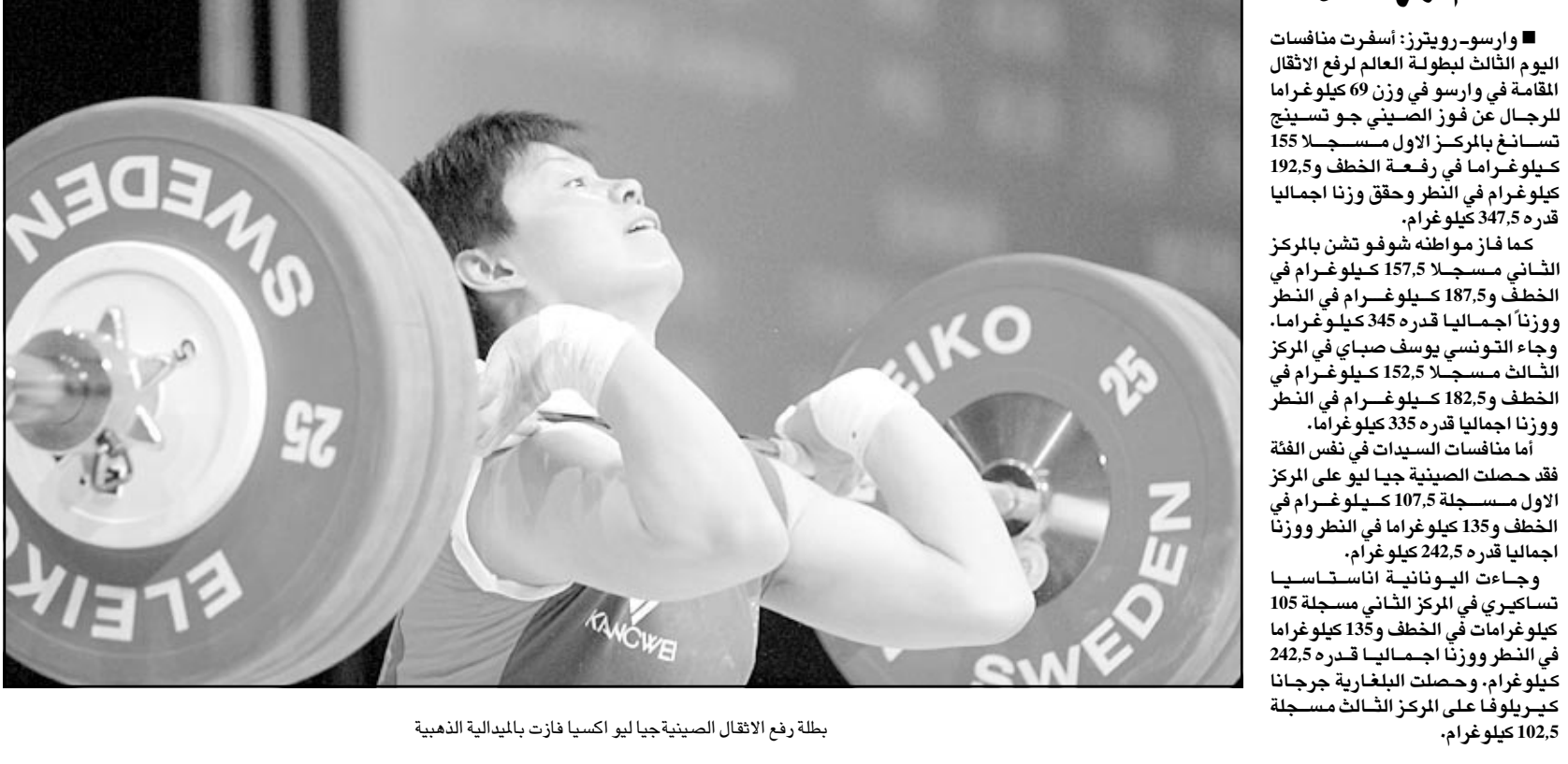
بطلة رفع الاثقال الصينية جيا ليو اكسفا فازت بالميدالية الذهبية