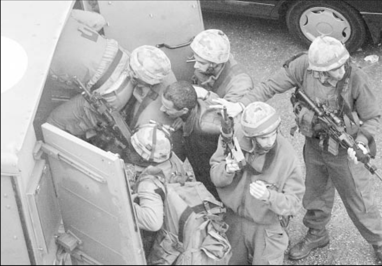
جنود اسرائيليون يعتقلون موظفين في وزارة الشؤون الحلية في رام الله بعد تفشيها