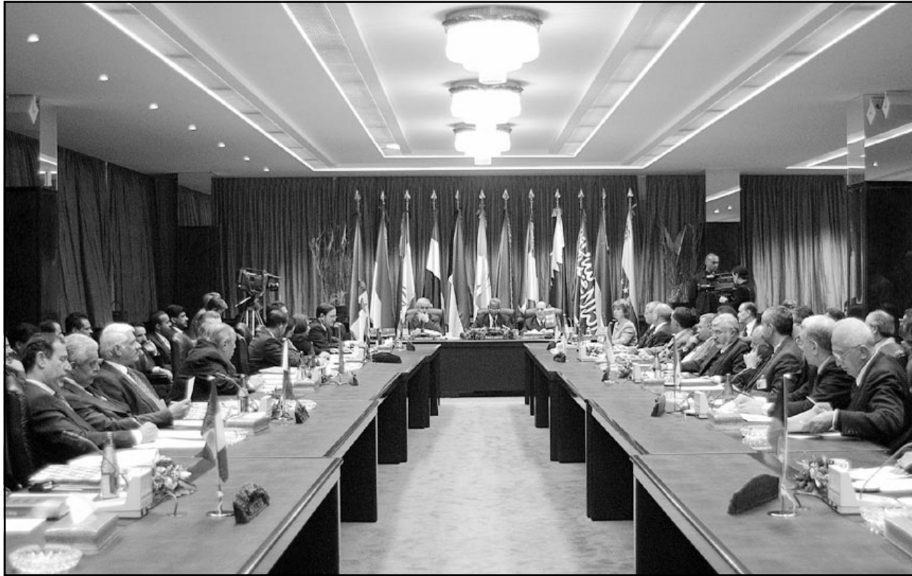
صورة عامة لبدء الاجتماع الوزاري لأوبك امس في فيينا

الف برميل يوميا، وأضاف كوك ان اوبك ستبقى على الأرجح مستوى انتاجها عند 24 مليون برميل يوميا للحفاظ على السعر عند مستوى 25 دولارا للبرميل، واصفا اعلان اوبك عن