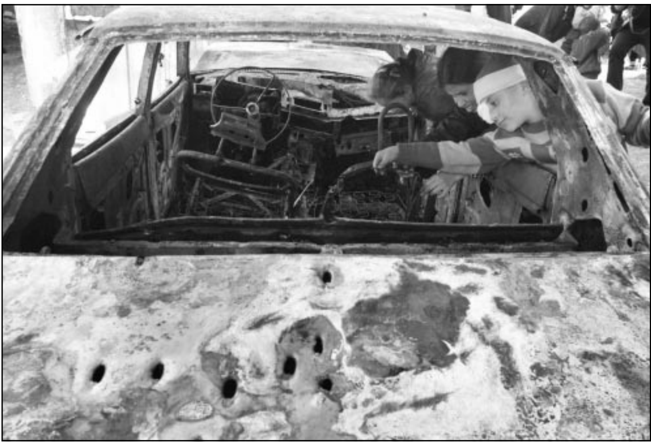
اطفال فلسطينيون يلعبون بسيارة دمرها رصاص الجنود الاسرائيليين في مدينة جنين المحتلة أمس

الناصرة - «القدس العربي» - من زهير اندراوس: قال رئيس الوزراء الاسرائيلي ارييل شارون، ان الهجوم الامريكى المرتقب على العراق سيثبت بصورة غير قابلة للتاويل لجمع الدول العربية ان القوة العسكرية ليست في صالحهم بالرء، وعليه فان العرب سيضطرون الى التمسك بخيار السلام فقط، مؤكدا ان العدوان على العراق سيخلق جوا جديدا في المنطقة، وقالت صحيفة «هارتس» الاسرائيلية في عددها الصادر امس الخميس، ان شارون ادى بهذه الاقوال خلال جلسة مغلقة، وقال شارون ان الفرق الرئيسي بين الحرب في افغانستان والعدوان المرتقب على العراق يكمن في انه في افغانستان كان ما يسمى تحالف الشمال حاضرا وجاهزا لتسلم السلطة في البلاد بعد سقوط نظام طالبان، في حين ان الوضع في العراق مختلف جدا، اذ ان الاحزاب حسب قوله، غير مؤهله ان تقوموا بدور تحالف الشمال، وان دورهم خلال وبعد العدوان سيكون محدودا للغاية. وتابعت «هارتس» ان شارون يعتقد بان العدوان على العراق سيكون «متدرجا» وسيبدأ بعملية عسكرية امريكية سريعة في غرب العراق، وتابع ان العراقيين سيجامون جر القوات الامريكية الغازية الى الحرب في مناطق مأهولة بالسكان، وتحديدًا في العاصمة بغداد وفي مدن اخرى، ولكن الامريكيين باستطاعتهم عدم الانجرار وراء المخطط العراقي، في حال ابعاد الرئيس صدام حسين عن الحكم او طرده من العراق، وكشف شارون ان القوا ت الامريكية عندما