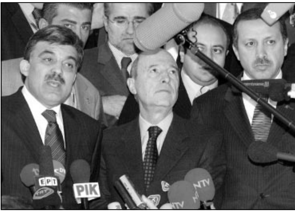
رئيس الوزراء اليوناني يوتسوس نظيره التركي (يسار) وزعيم حزب التنمية والعدالة التركي (يمين) خلال مؤتمر صحفي على هامش قمة كوبنهاغن

وتحظى انقرة بدعم كبير من جانب الرئيس الأمريكي جورج بوش كما انها تتمتع بوسيلة ضغط اضافية تتمثل ببرمجة لاندفاع من قبل تركيا وسيعمل على تسوية القضية في وقت لاحق من الشهر الجاري. في حين تستعد عضر دول حلف شمال الأطلسي من أجل انضمامها الى الاتحاد الاوروبي في وقت لاحق من الشهر الجاري. وفي وقت سابق من الشهر الجاري، أعلن وزير الخارجية التركي عبد الله غول ورئيس الحزب الحاكم في تركيا رجب طيب اردوغان في وقت سابق من الشهر الجاري، ان تركيا ستدعم جهود الاتحاد الاوروبي في تسوية القضية القبرصية في وقت لاحق من الشهر الجاري. وقال غول في وقت سابق من الشهر الجاري، ان تركيا ستدعم جهود الاتحاد الاوروبي في تسوية القضية القبرصية في وقت لاحق من الشهر الجاري. وقال غول في وقت سابق من الشهر الجاري، ان تركيا ستدعم جهود الاتحاد الاوروبي في تسوية القضية القبرصية في وقت لاحق من الشهر الجاري. وقال غول في وقت سابق من الشهر الجاري، ان تركيا ستدعم جهود الاتحاد الاوروبي في تسوية القضية القبرصية في وقت لاحق من الشهر الجاري.