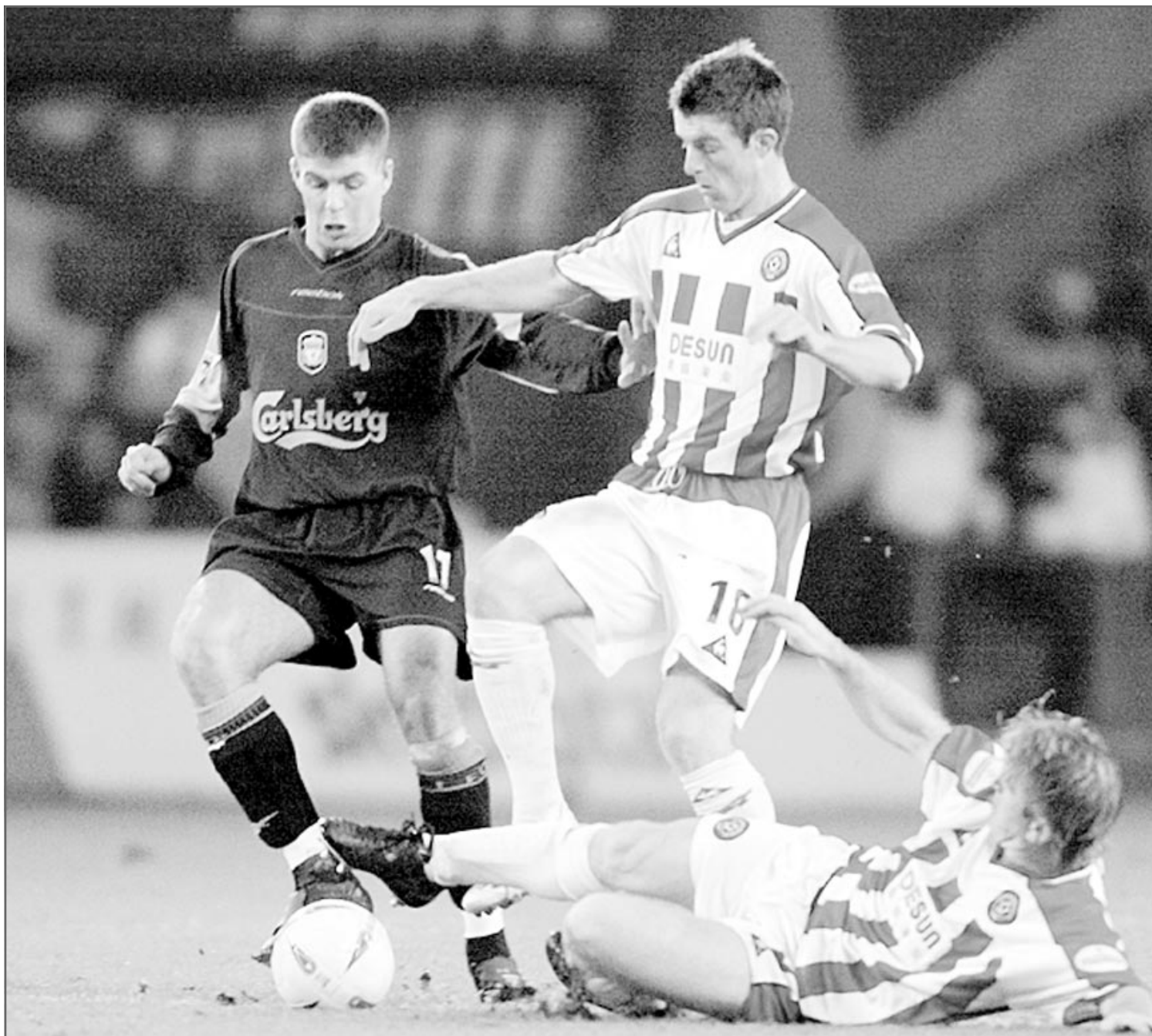
لحظة من مباراة شيفيلد يونايتد مع ضيفه ليفربول عندما هزمه 2-1.