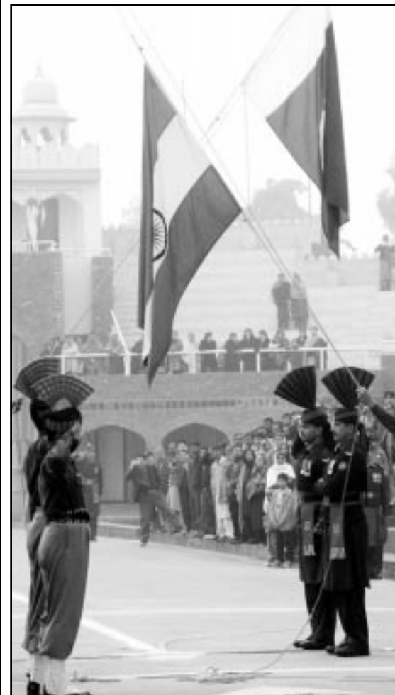
جنود باكستانيون وهنود يتزلون علمي بلديهما امس بالمنطقة الحدودية شمال البنجاب وسط توتر برز من جديد بين العدوين الدوليين

■ كولومبو - رويترز: أعلنت الخارجية السريلانكية أمس الخميس ان كوفي عنان الأمين العام للأمم المتحدة سيوزور البلاد في اواخر شهر شباط (فبراير) مع تواضع الجهود الدبلوماسية لتناهة حرب عرقية مستمرة منذ 19 عاماً. وستكون هذه اول زيارة يقوم بها امين عام للمنظمة الدولية لسريلانكا منذ 35 عاماً وستكون اضافة الى عدد من الشخصيات الدولية التي تظهر اهتماما بعملية السلام الجارية بين الحكومة وثورا التاميل. وجاء في بيان الخارجية «السيد عنان سيوزر خلال فترة وجوده في سريلانكا لمدة يومين جافنا من وزير الخارجية تيرون فرناندو.» وشبه جزيرة جافنا الشمالية هي معقل الثوار التاميل في سريلانكا، ومن المتوقع ان تستخدم اليوم في عملية الحكومة السريلانكية وجبهة ثور تحرير تاميل ايلام الجولة الرابعة من محادثات سلام بالاتفاق على إعادة الإعمار وتوطئ النزاحين الفارين من الحرب.