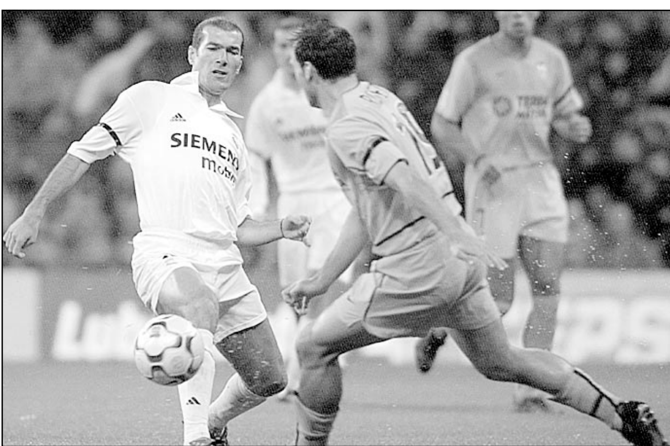
لحظة من مباراة ريال مدريد مع تيراسا