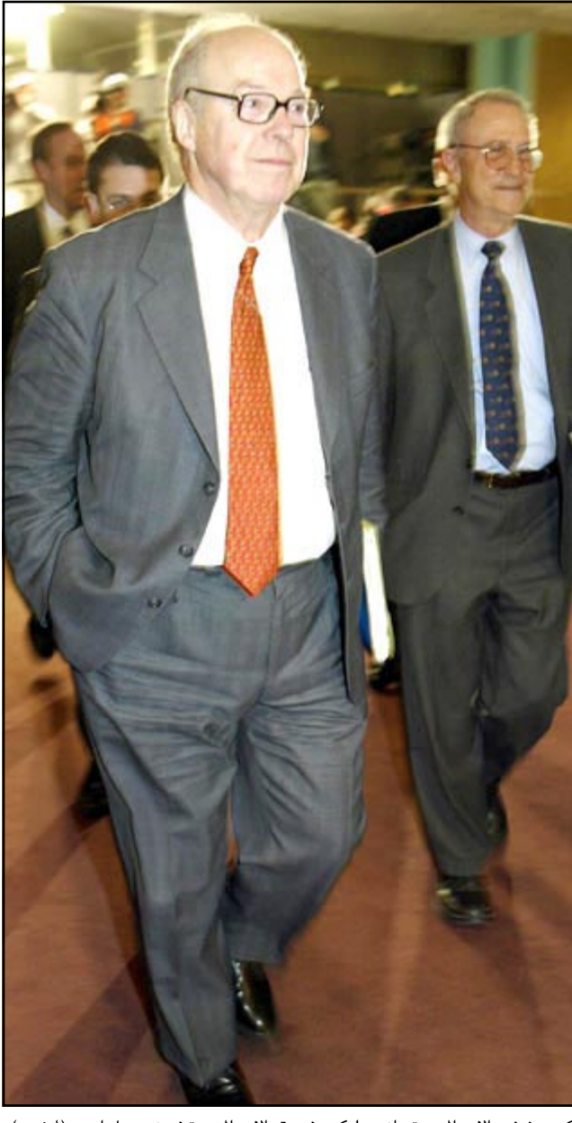
كبير مفتشي الامم المتحدة هانس بليكس في مقر الامم المتحدة في نيويورك امس

بغداد - واشنطن - وكالات: أكد مسؤول عراقي كبير امس الخميس ان بلاده على استعداد لاجابة على ما سئل عن النطاق الملغطة من وجهة نظر اللجنة الخاصة سابقا ولجنة انوفيك حاليا وهي اسئلة اذا كانت هي المصودة فهي لا تتعلق بجوهر نزع السلاح ويمكن التعامل معها.