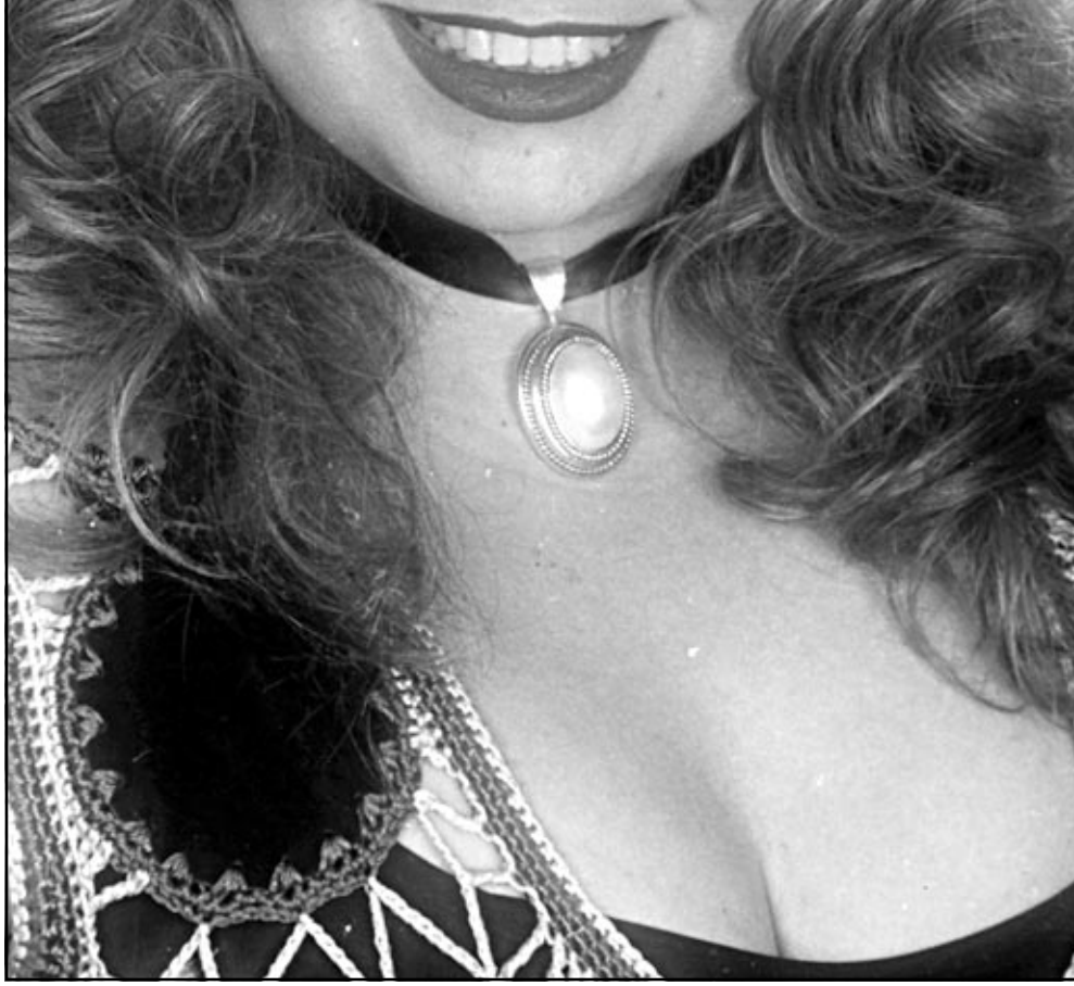
الفنانة المصرية ليلي علوي وافقت على القيام ببطولة المسلسل التلفزيوني الجديد «بنت من شبرا» قصة فتحي غانم وسيناريو وحوار مصطفى ابراهيم، ولم يتم الاستقرار على مخرج العمل بعدا

وحت الاطباء سكان موسكو على ارتداء ملابس ثقيلة واقية من البرد ونصحوا النساء بتجنب الافراط في استخدام مساحيق التجميل التي تسد مسام الجلد وقد تسبب تجمد البشرة. وقالت وكالة انباء ايتار تاس الرسمية ان موجة الطقس القطني التي اجتاحت مناطق شاسعة من البلاد منذ عطلة عيد الميلاد في وقت سابق من الاسبوع أدت الى وفاة 27 على الاقل من قاطني موسكو منذ الاول من كانون الثاني (يناير) الجاري. وتفقا لوزارة الطوارئ الروسية يتجمد أكثر من 300 حتى الموت في شوارع موسكو كل شتاء.. وقالت وكالة انباء (إر.إي.إيه) الروسية انه منذ تشرين الاول (أكتوبر) وحتى الان توفي نحو 239 من قاطني موسكو.