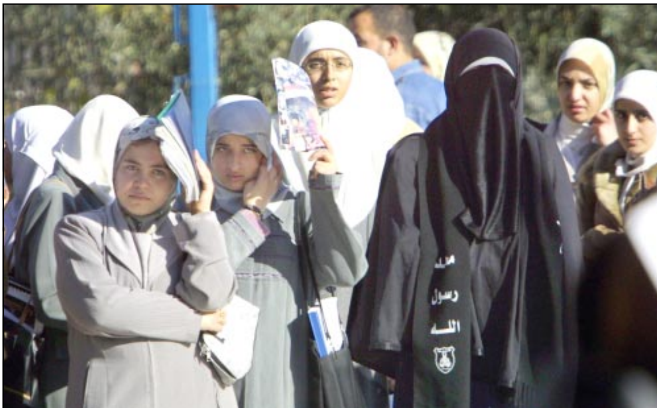
طالبات اردنيات يتظاهرن بتأييد للعراق في عمان

الطاقة الذرية محمد البرادعي اسمن ان المفتشين الدوليين عن الأسلحة المتحدة جون نيفروونتي ان تقرير العراق حول برامجها يشكك في عمليات الانتشار والاستعداد لدعم عملية الحرية الصامدة.. وقال اللواء حسام محمد امين مدير عام دائرة الرقابة الوطنية العراقية في مؤتمر صحافي انه «التأكيد نحن نرحب بآية اسئلة توجه من قبل لجنة الموفيك او الوكالة الدولية للطاقة الذرية وهذه الاسئلة ستعامل معها بكل ايجابية». واعلن المدير العام للوكالة الدولية