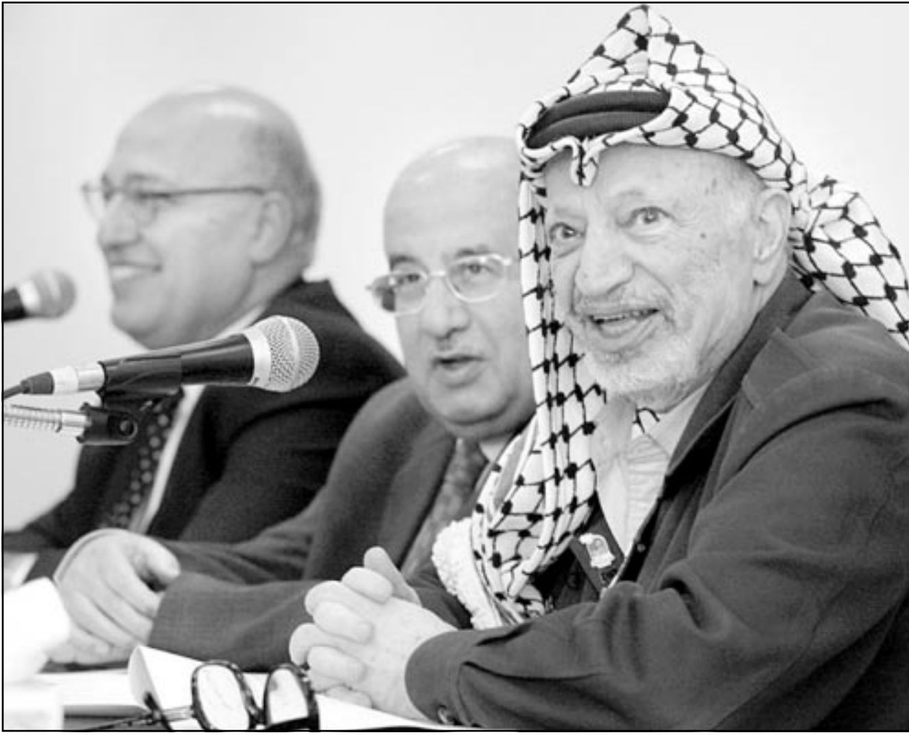
الرئيس عرفات وسليم الزعوتون وتبيل شعت مجتمعين مع عدد قليل من أعضاء المجلس المركزي في رام الله أمس