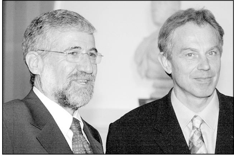
توني بليو مستقلاً وعمام مستعاض في لندن أمس

لندن-رويترز: قالت بريطانيا أمس الخميس إن إسرائيل رفضت نداء بريطانيا للوزراء توني بليو للسماح للفلسطينيين بحضور محادثات سلام في لندن الأسبوع المقبل، لكنها أكدت أن الحوار سوف يستمر «بشكل أو بآخر». وفي علامة على تضاد التوتر بين البلدين قال المتحدث باسم بليو إن إسرائيل سلمت ردها بعد أن أراجت اجتماعاً مقروراً بين رئيس وزرائها إرييل شارون والسفير البريطاني، واعتبرت الإزمة الدبلوماسية اتصالاً هاتفاً غامضاً بين وزيرى الخارجية البريطاني والإسرائيلي يوم الاثنين الماضي اتهم خلاله كل منهما الآخر بأن موقفه من مؤتمر لندن يهدد اتفاق السلام. وقال المتحدث باسم بليو «تلقينا رداً من مكتب رئيس الوزراء شارون رغم أن السفير لم يتمكن حتى الآن من مقابلته». الموقف الإسرائيلي يظل بلا تغيير». وكانت بريطانيا قالت إن سفيرها شيرارد كاوبر كولز سيسلم رسالة من بليو إلى شارون يوم الأربعاء بشأنها على أهمية السماح بإعقاد مؤتمر 14 كانون الثاني (يناير) بشأن السلام والإصلاحات الفلسطينية، وكانت لندن تأمل أن تكون المحادثات بين الفلسطينيين وأعضاء وياغي الوساطة في الشرق الأوسط وهم الأمم المتحدة والاتحاد الأوروبي