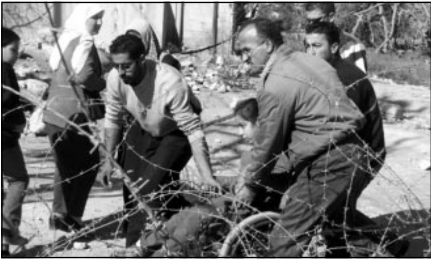
فلسطينيون يساعدون عاجزا للمرور من بين الاسلاك الشائكة التي اقيمت عند نقطة تفتيش كوسية شرقي القدس.

التحتية المدنية السابقة يستوجب اقامة بني تحتية جديدة تحت السلطة الاسرائيلية المباشرة، أو السلطة الفلسطينية الجديدة بنمط آخر. في الماضي، عندما تجاهلنا اوضاعا مشابهة نشأت في المناطق وصلنا الى الهاربة، هكذا كان الحال قبل الانفاضة الاولى والثانية، وحتى لو اصلنا تجاهل هذه المشكلة الحادة وركزنا على الاقتصاد والانتخابات وفساد المسؤولين، فان موضوع السكان الفلسطينيين سيتردى اليها كالسهم المرتد، فهم موجودون قريبا تماما، في داخلنا، ليس في جبال ظلام بعيدة، والآن، في الوضع الناشئ، هم يذنبون ام بخير ذنبهم، هم متعلقون بنا شرا كان ام خيرا. فالحديث بات يدور عن مسؤولية ثقيلة، وكل من يؤمن بأنه يمكن «السير مع الشيء والشعور بانعدام وجوده» في مدى الزمن فإنه يعلم،