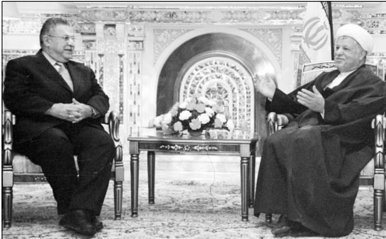
الرئيس الإيراني السابق هاشمي رفسنجاني مستقبلا جلال طالباني زعيم الاتحاد الوطني الكردستاني في طهران أمس

■ طهران - أثيرا - اف ب: نقل التلفزيون الحكومي الإيراني ان المرشد الاعلى للجمهورية الإسلامية آية الله خامنئي أكد ان البلدان الإسلامية لن تتسرع في تترك العراق واباره النفطية..