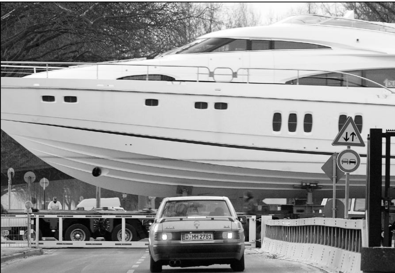
يخت نزهة محمول على شاحنة هائلة يعبر احد شوارع سدسдорف الالمانية في طريقه الى المدينة مخصص للقوارب والبخوت الخاصة

العميل على الوفاء بالتزاماته كما سيخذ البنك الاجراءات والوسائل المتابعة». ولم يذكر البنك الذي يملكه مستثمرون بحرينيون وسعوديون معلومات أخرى، لكن بيانا من مؤسسة نقد البحرين وهي البنك المركزي في الجزيرة قال ان التسهيلات المصرفية منحت «دون اتباع لاسس والانظمة المصرفية المعتادة». واذف البيان «تؤكد المؤسسة الى جميع عملاء وزبائن ومودعي البنك بان البنك لديه الاحتياطات الكافية وبعض الضمانات التي سوف تقلل من مخاطر تلك التجاوزات». وقالت المؤسسة انها مستعدة لتقديم الدعم للبنك لمساعدته على تجاوز الازمة الناتجة عن الديون المشكوك في تحصيلها.