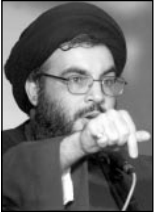
حسن نصر الله

قلب معظم الاسرائيليين مع هذا الموضوع ايضا، فلناهج المميز هو: «هل يفترض بنا نحن ان نهتم بأولئك الناس الذين يبعثون الينا الانتحاريين ويقتلوننا مرة كل عدة ايام؟ فليهتم بهم اخوانهم العرب»، ولوهلة الاولى نشأ فراغ سلطوي ولكن عمليا اسرائيلي هي التي تسيطر فيه وجنودها هم الذين يراطلون على الحدود مع الارن ومصر. فلسطينيون كثيرون كانوا يفضلون سلطة الاسرائيلية مباشرة على الوضع الحالي الذي يكون فيه كل أزعرجل، وفي بعض الاماكن في شمال الضفة وفي قطاع غزة بدأت تعمل عصابات عنيفة تتعامل مع السكان بقسوة. في الوضع الاقتصادي الحالي، فان حكومة اسرائيل التي تسعى الى الحفاظ على كل المستوطنات،