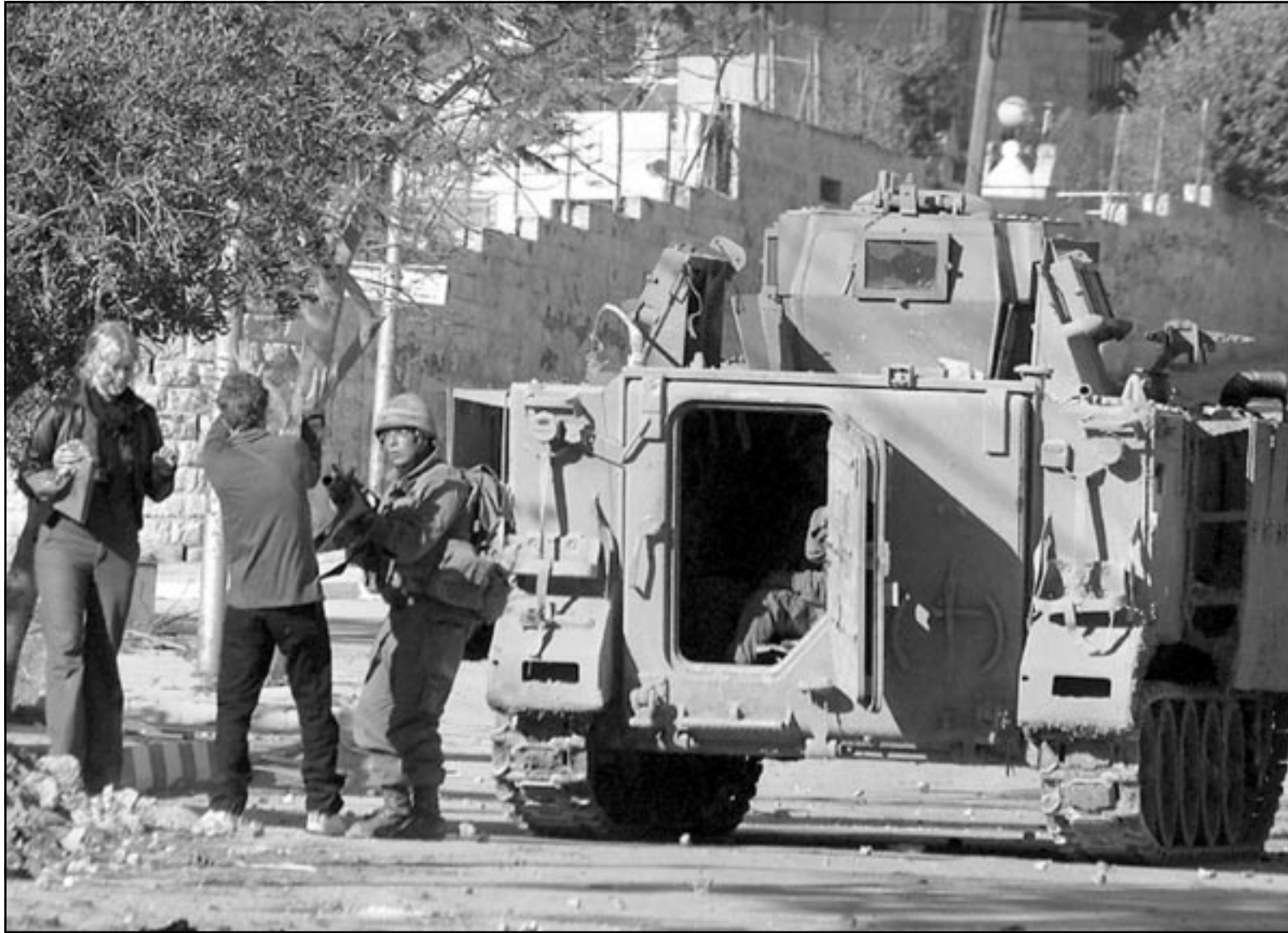
جندي اسرائيلي يشهر سلاحه في وجه ناشطين غربيين في احد شوارع نابلس بالضفة الغربية المحتلة

مع بداية الانتفاضة الفلسطينية الثانية، بادرت ست منظمات هولندية ناشطة في مجالات التنمية والسلام، الى تشكيل ما سمي بـ «اتحاد المدنيين من أجل السلام»، وقد جاءت هذه المبادرة انطلاقا من ايمان القائمين عليها بحاجة الجانب الفلسطيني لوجود مراقبين دوليين للقيام برصد الانتهاكات اليومية لجيش الاحتلال الاسرائيلي وتأثير ذلك على مختلف جوانب الحياة في المجتمع الفلسطيني. وذلك في مواجهة واضحة للصلمت والتجاهل الذي لاقتته ولا تزال تلاقيه الطالبات الفلسطينيات بمجيء مراقبين من الامم المتحدة لرصد الانتهاكات الاسرائيلية وتأمين حماية دولية للشعب الفلسطيني. وكانت المنظمة قد ارسلت العشرات من المراقبين الأوروبيين الذين يتواجد عددهم في مناطق مختلفة من الضفة الغربية وقطاع غزة. وفيما يلي نقدم بعضا من اراء ومشاهدات ثلاثة من المراقبين الأوروبيين اثر عودتهم من الأراضي الفلسطينية، انطلاقا من ايماننا بضرورة ادراك القارئ العربي للحركة والوعي المتزايدين في الشارع الأوروبي تجاه القضية الفلسطينية التي عبر عنها هؤلاء - وآخرون كثير - بشدهم الرحال الى الأراضي الفلسطينية المحتلة لنقل صورة حية وواقعية للعالم عن الواقع الفلسطيني اليومي.