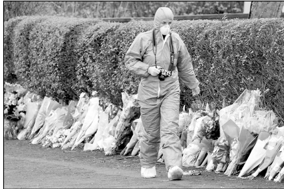
أحد أفراد الشرطة العلمية خارج المبنى الذي وقع به حادث مساء الثلاثاء بمانشستر

■ لندن - «القدس العربي» - وكالات: أعلنت الشرطة البريطانية أمس الخميس ان جزائريا في الثانية والثلاثين من العمر سلم نفسه للشرطة مساء الاربعاء في مانشستر (شمال غرب) واعتقل في اطار قانون مكافحة الارهاب. وقالت شرطة سكوتلانديارد في بيان ان هذا الاعتقال «مرتبط بالتحقيق الذي اطلق في جميع أنحاء البلاد حول الارهاب الدولي». وسيسلم الجزائري الذي لم تكشف هويته، الى رجال الشرطة في قسم مكافحة الارهاب في سكوتلانديارد، وتأتي عملية الاعتقال هذه بعد مقتل شرطي الثلاثاء في مانشستر خلال عملية اعتقال ثلاثة اشخاص يتحدرون من شمال افريقيا اثر العثور مطلع كانون الثاني (يناير) على آثار كميات قليلة من مادة سم الخروع (ريسين) القاتل في شقة في لندن.