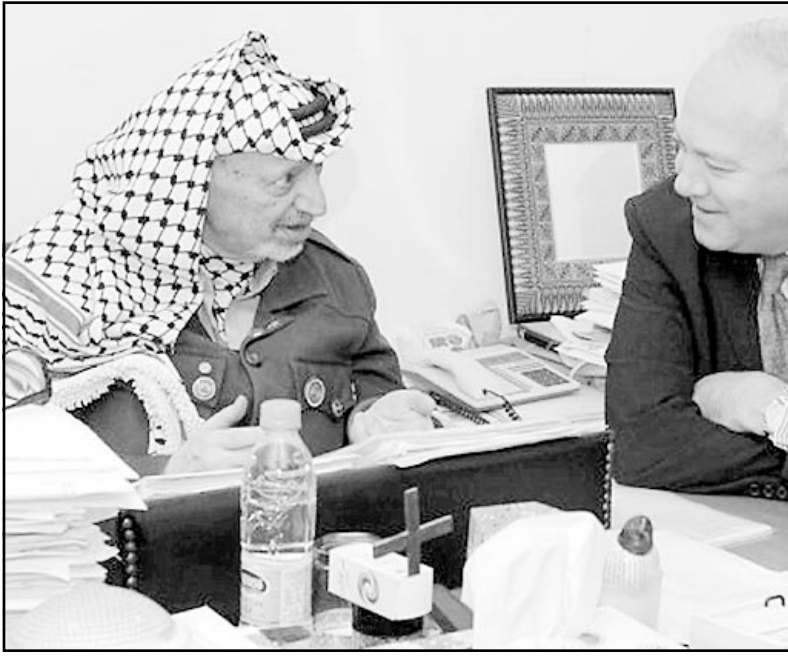
الرئيس عرفات مستقبلا في مكتبه برام الله المبعوث الاوروبي ميغيل مورانتينوس أمس

غزة - نيويورك - ا ف ب: تحدث مسؤول كبير في الامم المتحدة أمس الخميس عن وجود «إجماع دولي واضح، للجهود الهادفة الى التوصل الى حل للصراع في الشرق الاوسط يمكن ان يحقق الا من خلال عملية سياسية تشتمل على اربعة اشهر من المفاوضات الفلسطينية الاسرائيلية والشعب الفلسطيني على السواء». وقال طالب السيادة الفلسطينية المتحدة للشؤون السياسية كيران برينديريغات امام مجلس الامن المنعقد في جلسة علنية انه «لا يوجد اي تحسن ملموس للوضع الانساني في الاراضي الفلسطينية المحتلة». واكد ان «اسرائيل لم تف بالتزاماتها في هذا المجال التي قطعتها في آب (أغسطس) الماضي»، مشيراً بشكل خاص الى الاستمرار في فرض نظام منع التجول والقيود على تنقل الفلسطينيين. كما تحدث برينديريغات عن استشهاد عدد من الاطفال الفلسطينيين مؤخرا بالبرصاص، وقال انه «بالرغم من الدعوات المتكررة فان الحكومة الاسرائيلية لم تتخذ الاجراءات الكافية لتقليص عمليات القتل هذه والتي لا تحاسب الذين يتسبون بها». واشار ايضا الى ان الحكومة الاسرائيلية لم ترد بعد على الرسالة وجهها لها الامين العام للامم المتحدة كوفي عنان وطلب منها فيما تسليمه خطيا نتائج التحقيق حول مقتل موظف بريطاني تابع للامم المتحدة كان قتل نهاية تشرين الثاني