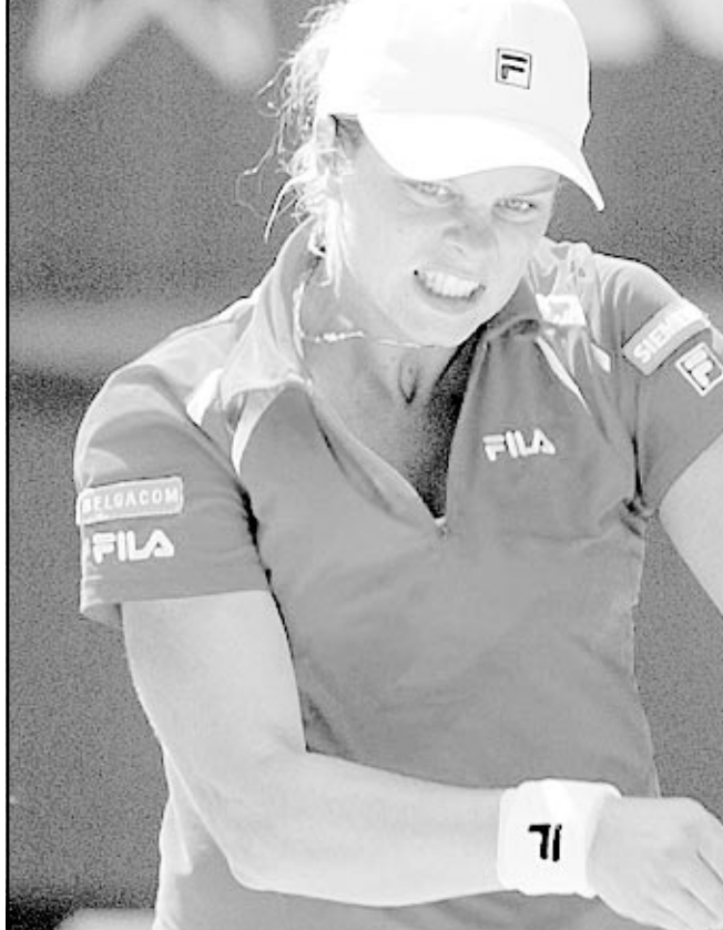
البلجيكية كيم كليسترز

هويت سريع للوبيت وخروج سيليش و احتاج الاسترالي ليعون هويت المصنف اول الى 71 دقيقة فقط ليتأهل الى الدور الثالث من بطولة أستراليا المفتوحة للتنس البالغ مجموع جوائزها 18.18 مليون دولار استرالي 10.59 ( مليون دولار).