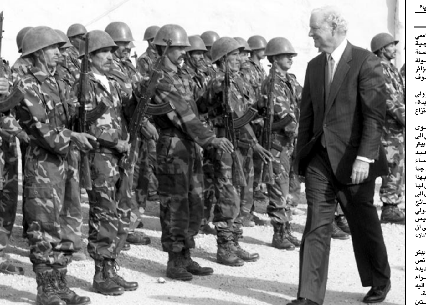
فرقة عسكرية صحراوية في استقبال بيكر لدى وصوله إلى تندوف امس