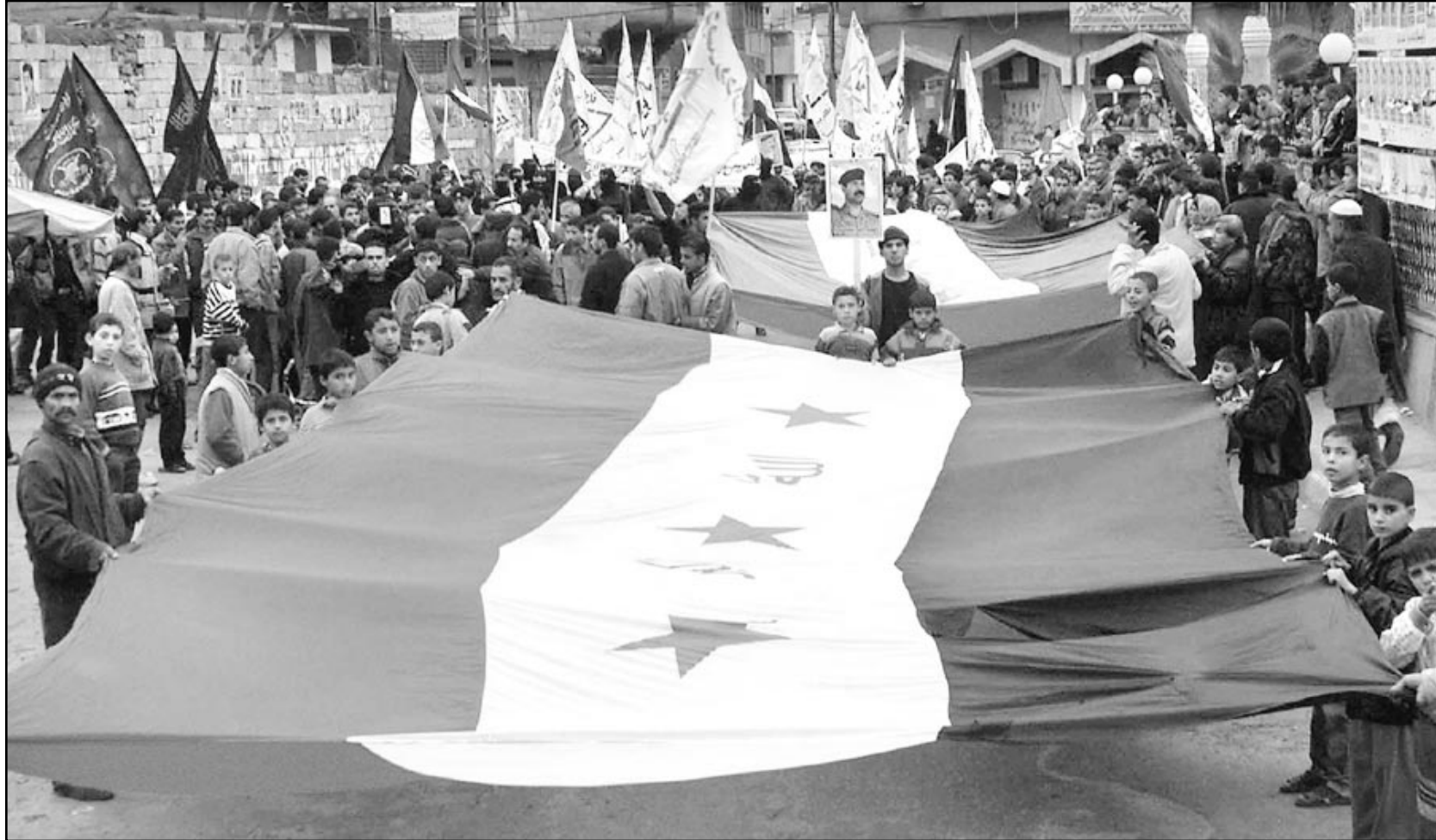
لاجئون فلسطينيون يلوحون بالعلمين الفلسطيني والعراقي في خان يونس أمس