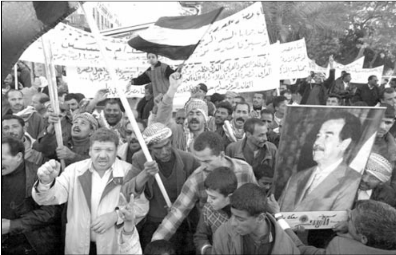
مظاهرات في بغداد مؤيدة للرئيس العراقي صدام حسين

قاومت إدارة الرئيس الأمريكي جورج بوش يوم الخميس نداءات وجهتها دول أخرى، طالبت أمريكا بالحصول على موافقة الأمم المتحدة قبل توجيهه أي ضربة عسكرية ضد العراق. كما أشار البيت الأبيض إلى أنه قد يتخذ قراراً بضرب العراق حتى في حال لم يعثر المفتشون الدوليون على أدلة على امتلاك العراق للأسلحة دمار شامل. وقال مسؤول رفيع المستوى في إدارة بوش إن «جدول اتخاذ قرار بشأن العراق» سيتم وضعه استناداً لـ «جريات الأحداث»، وذلك بعد يوم واحد بعد أن حذر بوش الرئيس العراقي صدام حسين من أن «الوقت بدأ ينفذ»، و«الأحداث» التي أشار إليها المسؤول تتضمن قيام المفتشين الدوليين بتقديم تقرير في 27 من كانون الثاني (يناير) الجاري حول عملهم في العراق، والحصول على «وثائق» بان الرئيس العراقي يتعاون فعلاً مع المفتشين. وقال المسؤول لصحيفة «نيويورك تايمز» الأمريكية أن الإدارة في واشنطن تعبيراً عن بغداد «تأمل وتتملص»، ورأى أن الرئيس العراقي «يكرد» العلماء العراقيين على رفض دعوات للمسفر ولقاء المفتشين الدوليين خارج العراق. وأشار إلى أن العراق أعلن أن أحداً من علمائها يريد أن يجري المفتشون مقابلات معهم في الخارج. وقال المسؤول الأمريكي «من نظام كهذا، يعتبر ذلك اكراهاً بالتهديد». وقال المسؤول إن واشنطن لن ترضى بان يستمر المفتشون بعلمهم لاشهر عديدة من دون اتخاذ قرار بشأن ضرب العراق. وحسب بعض التفسيرات، يعطي