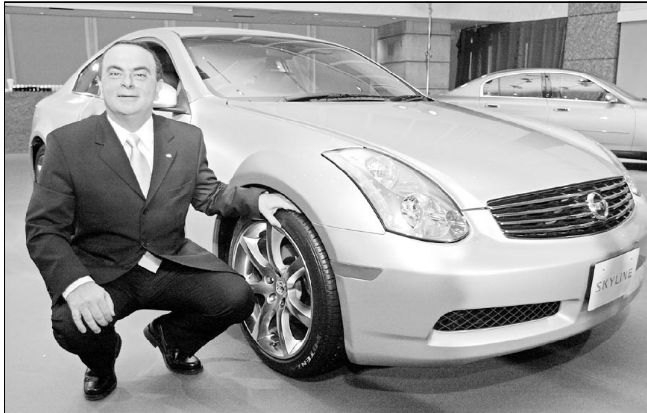
كارلوس غصن رئيس شركة نيسان اليابانية يقدم اس في طوكيو سيارته الرياضية الجديدة سكايا التي لابين سيدا تسويقها محليا بيبعد ايام عند ما يعادل 27,5 الف دولار

وتواجه اسرائيل اسوأ ركود اقتصادي في تاريخها خصوصا بسبب الانتفاضة التي بدأت في ايلول (سبتمبر) 2000 والازمة العالمية، ولا سيما في مجال الصناعات المتطورة.