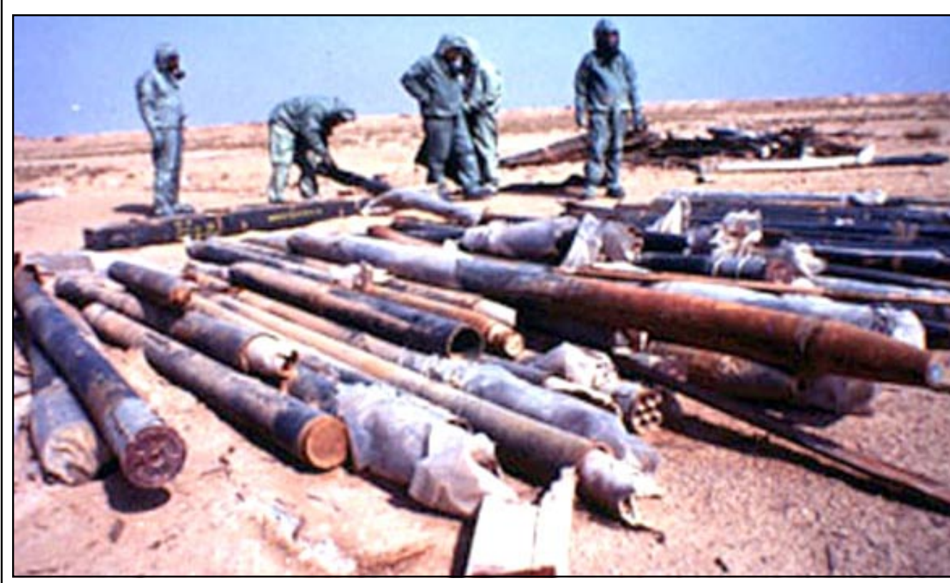
صورة أرشيفية لرؤوس صواريخ من طراز 122 ملم معبأة بغاز السارين السام، ومماثلة لتلك التي زعم المفتشون العثور عليها أمس

لندن - بغداد - واشنطن - «القدس العربي»: بدأت كل الطرق امس تؤدي الى الحرب، بالرغم من دعوة في انقرة لعقد قمة اقليمية لبحث تفاديها. ولكن «دوي» العنور على «رؤوس كيماوية مزعومة» في بغداد، وتهديدات جديدة من الرئيس الامريكى بان «صبره سينفذ» وتصريحات للعاهل الاردني بان «فرص تفادي الحرب ضئيلة» جعلت «شبح الاسواسيد الموقف». واعلن الناطق باسم مفتشي الامم المتحدة في العراق هيريو يواكي مساء امس ان احدى فرق المفتشين عثرت على «رؤوس كيماوية فارغة» خلال عملية تفتيش مستودع ذخائر. وقال يواكي في بيان له ان فريق تفتيش كان يقوم بزيارة مركز لتخزين ذخائر عثر على «11 رؤوس كيماوية» من عيار 122 ملم ورأس سيخضع لتفتيش اضافي. وجاء العثور على الرؤوس بعد وقت قليل من مؤتمر صحافي للمستشار العلمي للرئيس العراقي اكد فيه خلو العراق من اي اسلحة دمار، واستعداده للاجابة عن اي اسئلة حول «الثغرات» التي تحدث عنها رئيس المفتشين هانز بليكس. وقال «ليل التليس هو ان عثر على مخزون كبير من الكيماويات... هذا سيثير اسئلة كثيرة». واعلن الرئيس الاسريكي جورج بوش امس ان صبر الولايات المتحدة تجاه العراق سينفذ يوما، مؤكدا وجود اداة تظهر ان صدام حسين ليس في صدد ازالة اسلحته. وقال في كلمة القاها في سكراتون (بنسلفانيا، شرق ان «الالة تثبت انه ليس في صدد ازالة اسلحته» مضيفا ان «صبر الولايات المتحدة سوف ينقد يوما». واضاف ان امام صدام حسين اتخاذ «خيار» وهو ازالة الاسلحة او عدمه.