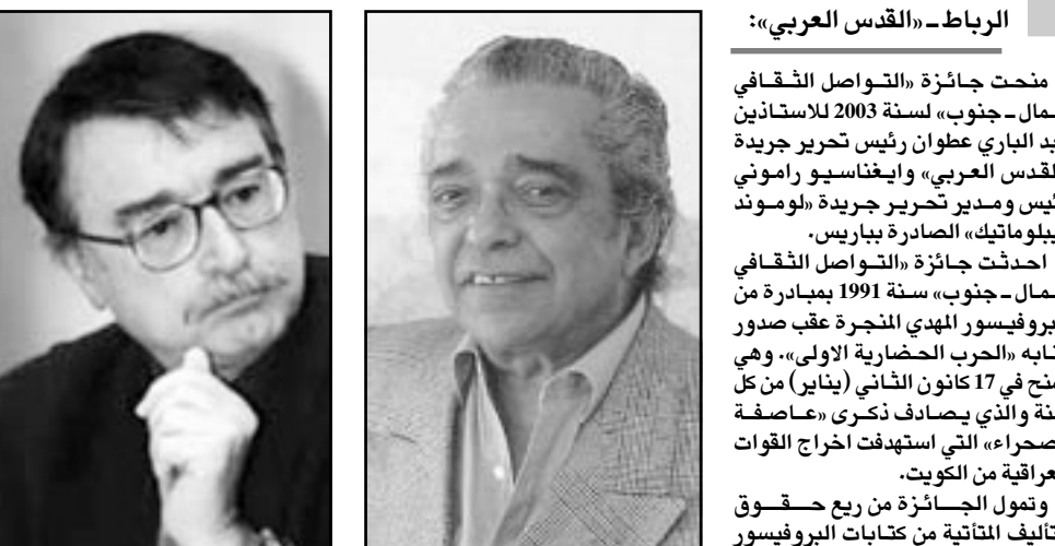
الرباط - «القدس العربي»: المهدي المنجرة، إيفانيسيو راموني

منحت جائزة «التواصل الثقافي شمال - جنوب» لسنة 2003 للاستاذين عبد الباري عوان رئيس تحرير جريدة «القدس العربي»، وإيفانيسيو راموني رئيس ومدير تحرير جريدة «لوموند ديبلوماتيك» الصادرة بباريس.