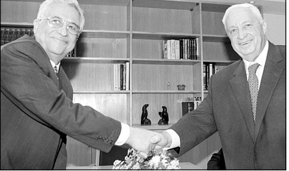
شارون وابو مازن خلال اجتماع لهما العام الماضي

القدس - رويترز: نفى شارون وابو مازن وجود لقاء سري بينهما في القاهرة. وقال شارون ان اللقاء بينه وبين ياسر عرفات جرى في بيروت، ورفض ان يوافق على مقابلة شارون في بيروت. وقال شارون ان اللقاء بينه وبين ياسر عرفات جرى في بيروت، ورفض ان يوافق على مقابلة شارون في بيروت. وقال شارون ان اللقاء بينه وبين ياسر عرفات جرى في بيروت، ورفض ان يوافق على مقابلة شارون في بيروت.