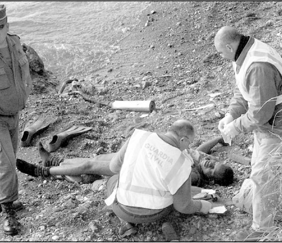
الحرس المدني الإسباني يتفقدون جثة مهاجر افريقي بسواحل جيب سبتة في شمال المغرب

لاسيما بعد اختلاف الروايات بين رجال الاطفاء والشرطة، فالشرطة تؤكد انها فتحت الأبواب في الوقت المناسب لانقاذ المهاجرين، لكن رجال الاطفاء يؤكدون انهم هم الذين فتحوا أبواب المركز وجودوا المهاجرين في وضعية مأساوية. كما تستمر احزاب المعارضة والنقابات في الضغط على وزير الداخلية أنخيل أسبجيس للمثول في البرلمان وتقديم تفسيرات حول هذا الحادث، وتتنو نقابة اللجان العمالية تقديم دعوى ضد حكومة ابراهيم سباهيك في حالة عدم تقديم تفسيرات منطقية ومقنعة أو الامتناع عن المثول في الهيئة التشريعية.