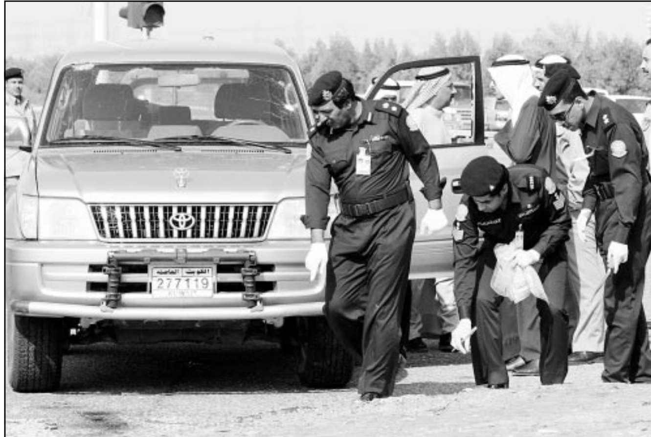
قوات شرطة كويتية تتفقد مسرح العملية التي قتل فيها أمريكي واصيب آخر في الكويت

جنديين أمريكيين بجروح خطيرة على طريق سريع جنوبي مدينة الكويت. وفي الشهر السابق هاجم كويتيين أفراداً من مشاة البحرية الأمريكية كانوا يتدربون على جزيرة فيلكا ما أسفر عن مقتل واحد، ووردت عدة تقارير كذلك عن عصابة تاركة اطلقت على جنود أمريكيين يتدربون في صحراء الكويت. وفي وقت سابق من هذا الاسبوع قال مسؤولون كويتيون ان السلطات اعتقلت جندياً كويتياً يشتبه في انه يتجسس لحساب العراق، وقالت