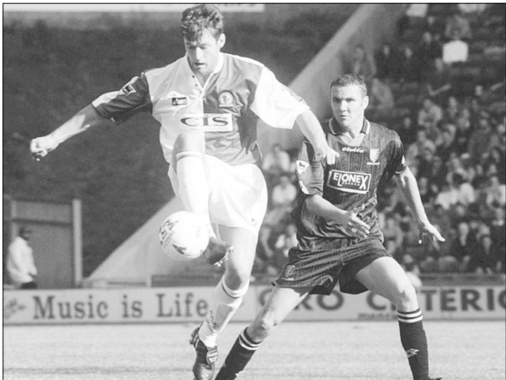
لقطة من مباريات بلاكيون

كما اشاد روبسون المدرب السابق لمنتخب انكلترا ببلاب فرنسي آخر هو اوليفييه بتران الذي انتقل الى نيوكاسل من ليون الفرنسي في تشرين الاول (اكتوبر) عام 2000. وقال عنه «أدى مباراة رائعة». وأضاف «عرفت بلعبتي... ومتى لا يفعل ذلك وهو مهم جدا لانك بحاجة الى عقول لتلعب».