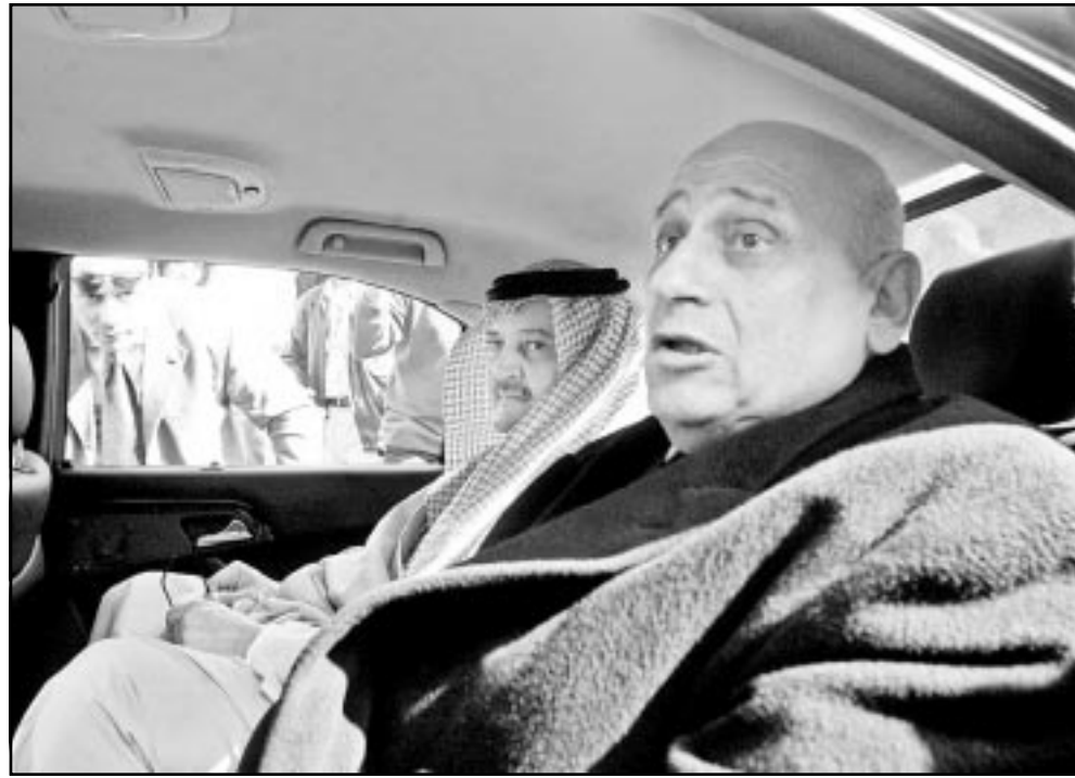
وزير الخارجية المصري يرافق نظيره السعودي بعد مؤتمر صحافي عقده في القاهرة امس

بغداد - اف ب: افادت وكالة الانباء العراقية الرسمية ان الرئيس صدام حسين واصل امس لقاءاته مع كبار المسؤولين العسكريين لبحث الاستعدادات الجارية لصداي هجوم امريكي محتمل على العراق. واوضحت الوكالة ان الاجتماع ضم قصي صدام حسين نجل الرئيس العراقي، الشرف على الخرس الجمهوري ووزير الدفاع الفريق اول الركن سلطان هاشم احمد وامين السمر العام للقيادة العامة للقوات المسلحة الفريق اول الركن حسين رشيد وعدد من قادة و امرى وضباط ركن الوحدات والتشكيلات والصوف في القوات المسلحة. واشارت الوكالة الى ان الرئيس صدام حسين تدارس مع الحاضرين «التصورات والمقترحات التي تهدف لتعزيز الاستعدادات الدفاعية للمقاتلين والاستمرار في تدريبهم وتوثير الاستنزاف التخليقية برقع قدراتهم القتالية والكفاءة والموارد والايالات الى جانب الاهتمام بتبؤن المقاتلين واورهم الحيادية التي تلعب دوراً كبيراً في اعداد القتال وتجهيته للهجمات الوطنية» والقومية». والتقت وكالة ان الرئيس صدام حسين قوله «حتى عندما لا تروني ايتسم فاعلموا بانني ايتسم بمعنى ان قاعدة