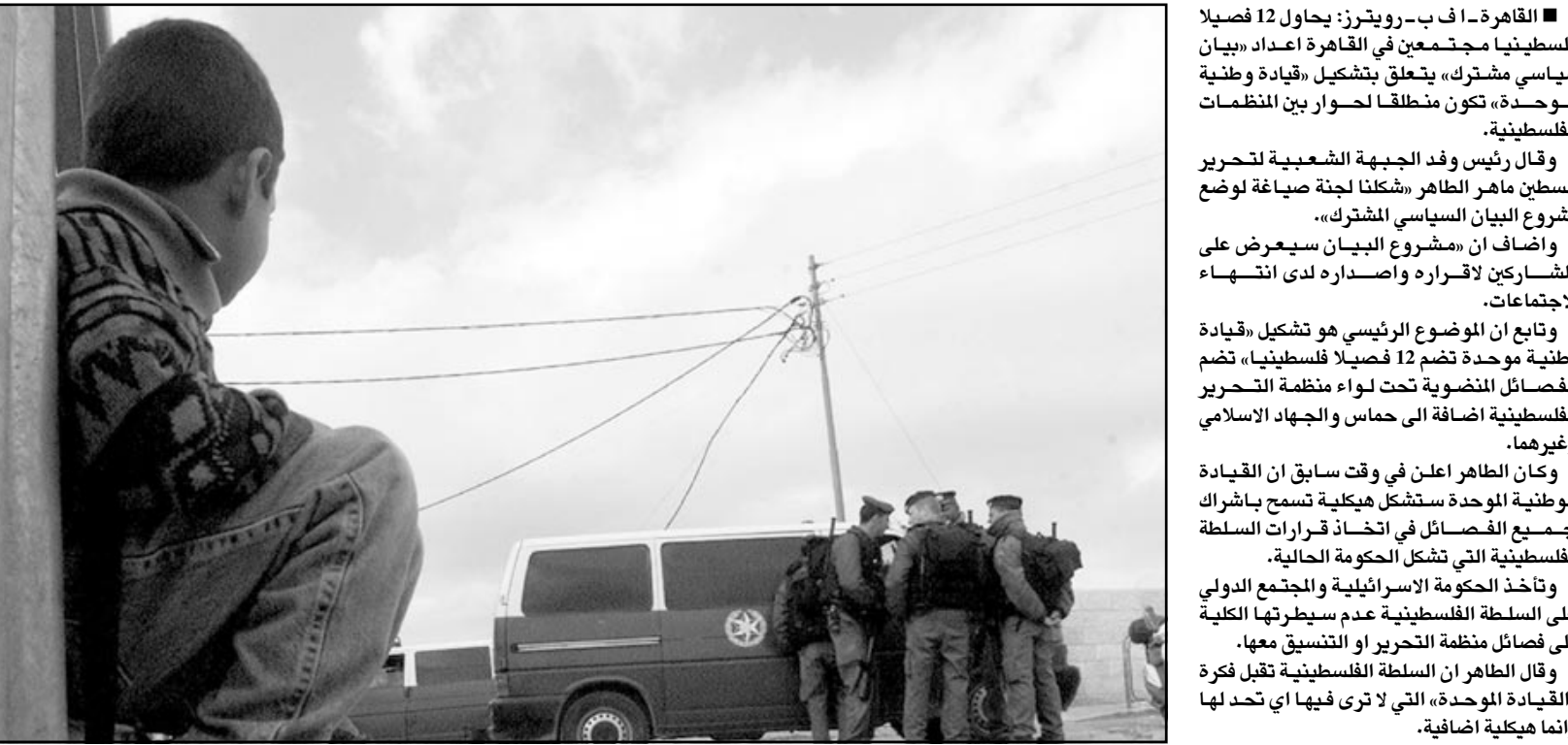
طل فلسطيني ينظر الى مجموعة من جنود الاحتلال عند نقطة تفتيش في القدس المحتلة امس

وقد أعلنت حماس والجهاد الاسلامي وكتائب الاقصى التابعة لحركة فتح انها ترفض وقف العمليات الاستشهادية كما اقترح مصر. وقالت مصادر بارزة قريبة من الحادثات ان الفصائل الفلسطينية فشلت في التوصل الى اتفاق بشأن وقف الهجمات ضد اسرائيل، لكنها تعزم استئناف الحادثات قريباً لتنسيق السياسات. وأضافت المصادر ان اطراف الحادثات سينتبعون مع رئيس جهاز المخابرات المصري عمر سليمان قبل اعلان عدم التوصل خلال محادثات تاريخية استمرت اربعة ايام الى الاتفاق بشأن اقتراح وقف العمليات لمدة عام. وقال مصدر فلسطيني بارز لرويترز لم يتوصل الفصائل الفلسطينية الى اي اتفاق بشأن المشروع (المصري) الخاص بمسألة