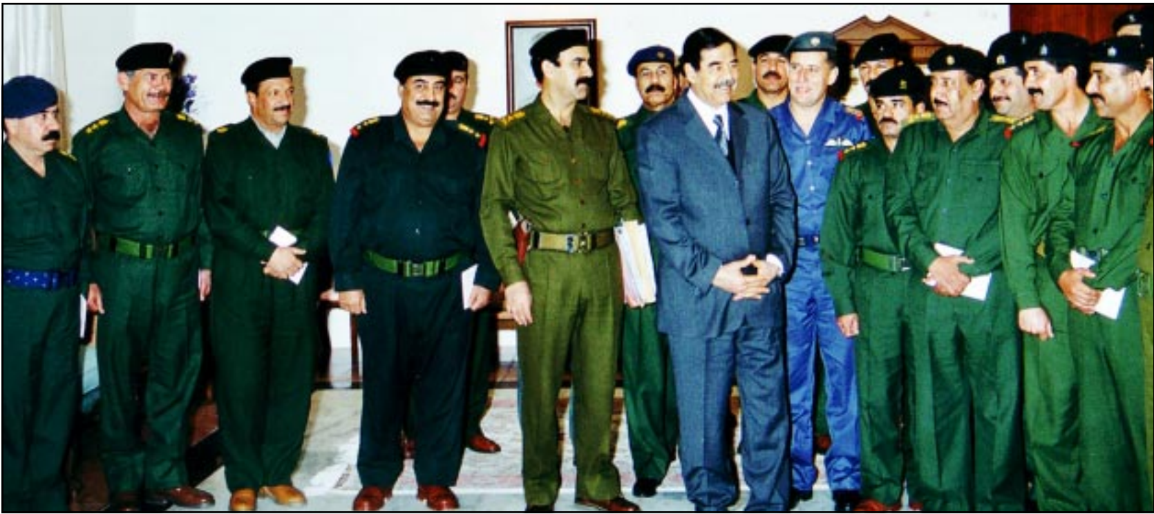
الرئيس العراقي صدام حسين في حديث ودي مع كبار الضباط الذين التقاهم بينما كان هانز بليكس يقدم تقريره امام مجلس الامن (دويتز)

الاطار القياسي صدام حسين في حديث ودي مع كبار الضباط الذين التقاهم بينما كان هانز بليكس يقدم تقريره امام مجلس الامن (دويتز)