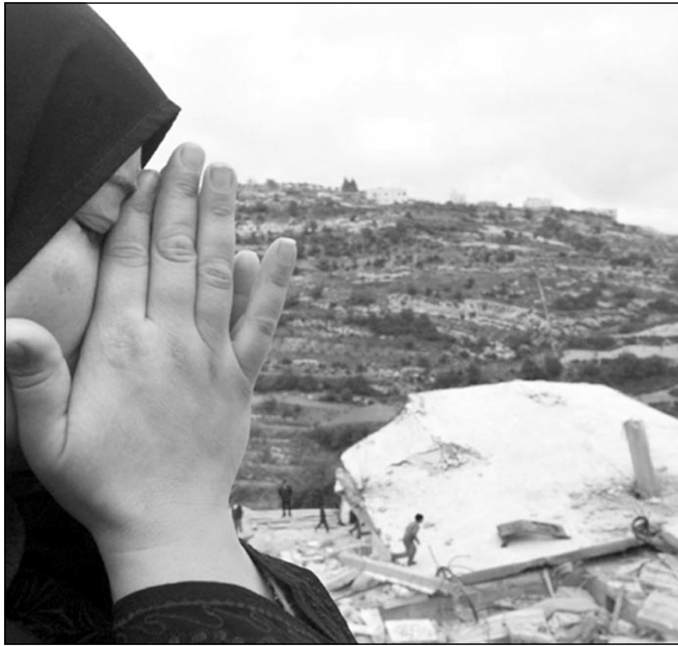
سيدة فلسطينية تبتكي على البيت الذي دمره الاسرائيليون في قرية نفوح قرب الخليل امس

الناصره - «القدس العربي» - من زهير اندراوس: