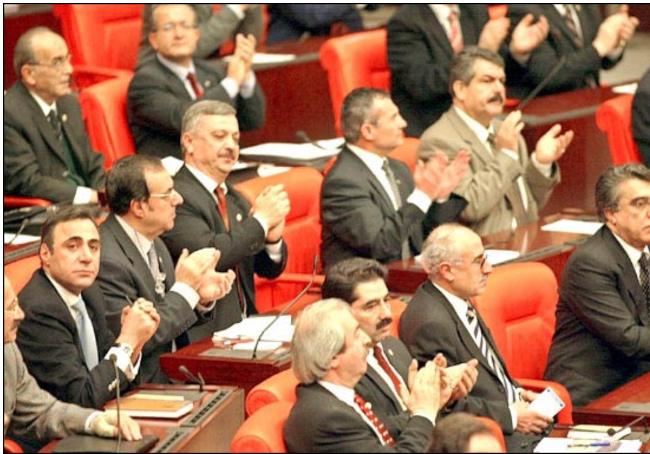
اعضاء في البرلمان التركي اثناء مناقشة الأزمة العراقية

واكد اسماء اعضاء وفد البرلمان الأوروبي الذي يزور العراق حاليا الذين حضروا المؤتمر الصحافي «ان زيارة بليكس والبرادعي الى العراق ليست مبررة بل هي محاولة لخلق صورة سلبية عن العراق، فبعد زارت منشأة ابي الهيثم لصناعة الصواريخ والكلية العسكرية الهندسية قرب بغداد، والنشأة العامة للماء والمجاري، وشركة الابراج للمواد البشوية عن افلام الكارتون ولا تعبر عن شيء حقيقي وسيسدس العراق ردا تفصيليا عليها».