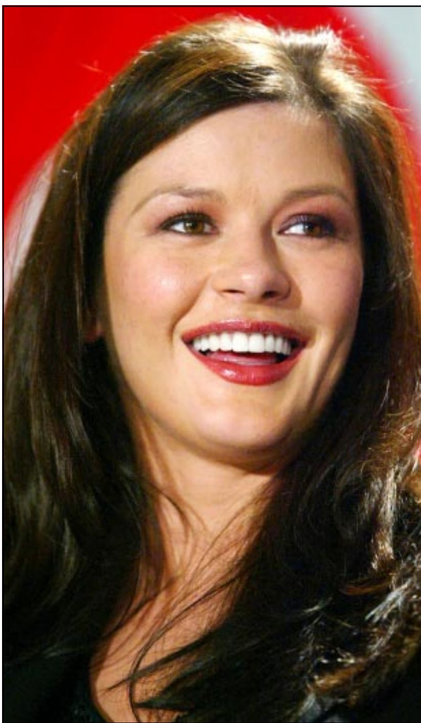
المثلة البريطانية كاثرين زيتا جونز تبتسم أثناء مؤتمر صحافي في مهرجان برلين السينمائي الذي يعقته بعيلهما «شيكافو» الذي يشترك دور البطولة فيه الممثل ريتشارد غير

واشنطن - رويترز: كشفت دراسة امريكية ان الفتيات والشابات اللاتي يحسنن الكحوليات ويتعاطين المخدرات يربح ان يحاولن بدرجة اكبر من الصبية والشبان الانتحار. وقالت الدراسة التي كشفت عنها خلال ندوة بالمركز القومي للادمان ان الفتيات اكثر سرعة في التعلق بالكحوليات والاكوليات من الشبان حتى لو تعاطوا الكليات نفسها او اقل. وقال جوزيف كالفانو رئيس المركز ووزير الصحة السابق في حكومة الرئيس الاسبق جيمي كارتر ان هذه النتائج تكشف الصراحة على طرق مختلفة في العمل على مكافحة ادمان الفتيات والشابات ومعالجتهن. وقال «فشل برامج الوقاية العامة التي طورت بدون اي اعتبار للرجال والتي غالبا ما تستهدف الرجال في التأثير على ملايين الفتيات والشابات».