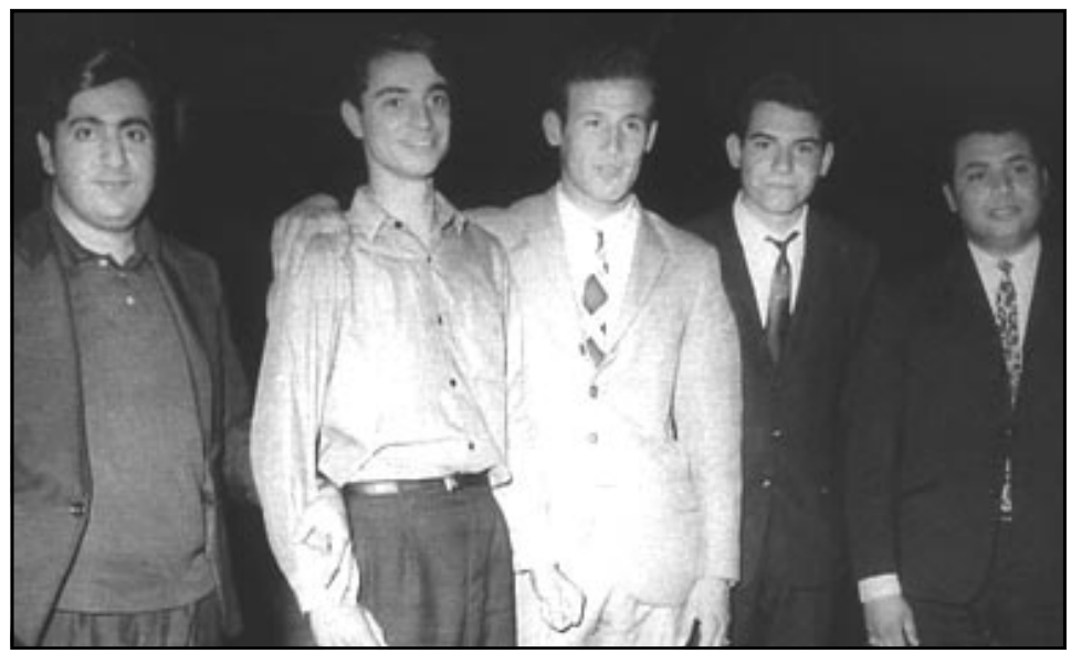
المطرب حسين نعمة الثالث من اليمين ويجواره المحن كوكب حمزة

حيث قدم له بعد ذلك أغنية «ابن آدم» وهي من كلمات الشاعر العراقي الشهيد ذياب كزار أبو سرحان، هذا الشاعر الذي أعدم بيناديك الكتائب بعد أن أسرته القوات الاسرائيلية أثناء اجتياح لبنان عام 1982 حيث كان مقاتلاً مع منظمة التحرير الفلسطينية في بيروت.