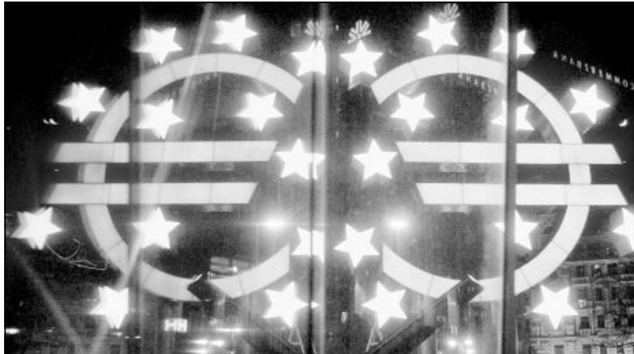
انعكاس رمز اليورو على إحدى نوافذ البنك المركزي الاوروبي في فرانكفورت

■ لندن - رويترز: قفز سعر مزيج برنت، خام القياس الاوروبي، 50 سنتا في المعاملات الاجلة في بورصة البترول الدولية في لندن امس الخميس لسجل اعلى مستوى منذ كانون الاول (ديسمبر) عام 2000 لتزايد المخاوف من نشوب حرب في العراق وانخفاض حاد في مخزون منتجات النفط المكررة في الولايات المتحدة.