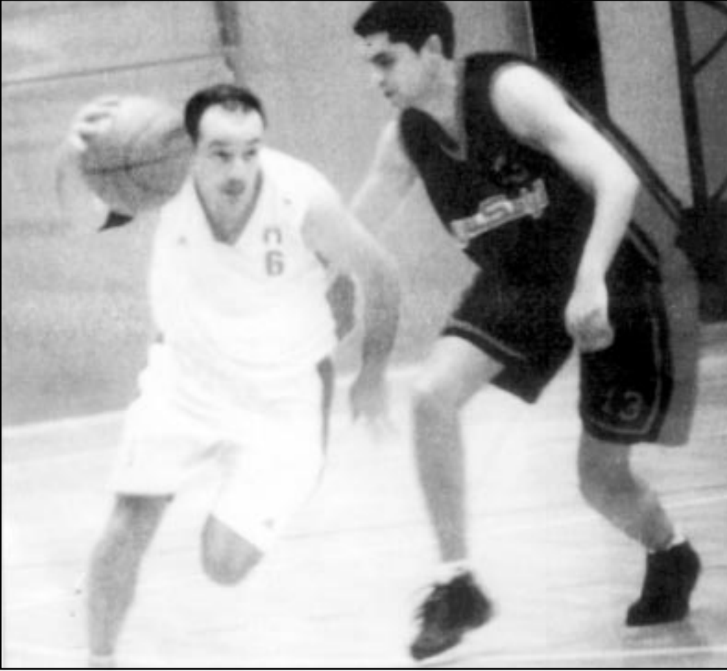
لقطة من مباراة نادي الجزيرة

اللاعب، ولدي مثال في فريقي (الجزيرة) فاللاعب باتس يتميز بالسرعة والتصويب اضافة الى الاختراق ولا يتميز بالمتابعة الدفاعية والهجومية وهذا يتناسب أسلوب فريقي واسلوب تدريبي. وعلى النقيض اللاعب الطويل البنية الثقيل لا يمكن ان ينجح في الجزيرة وقد ينجح في ناد اخر ولا بد من ان يكون المدرّب صاحب القرار النهائي في اختيار اللاعب دون تدخل الادارة او من صلته في الفريق لان اختيار اللاعب من مسؤولية المدرّب ما دامت النتائج ترمى على عاتقه.