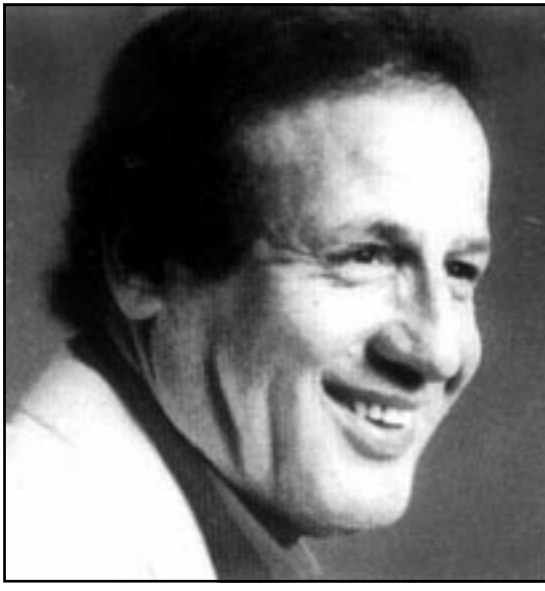
حسين نعمة (القدس العربي)