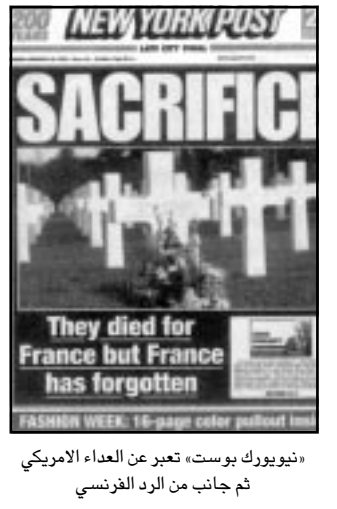
«نيويورك بوست»، تعبر عن العداء الأمريكي ثم جانب من الرد الفرنسي

وجاءت في ذات الأسبوعية كتب جاك جولبير بؤدي في المنطقة بعد ارجاعهم منهها بون حرب يصيب السلطة الأمريكية الحالية في الصميم، هذا النوع من التصريحات هو - بالنسبة لدير نوفل أونيسفارتور - خير دليل على وجود هزيمة أمريكية تمثلها صورة الرجل القومي الذي يقول للخلاق متضرعا «يا