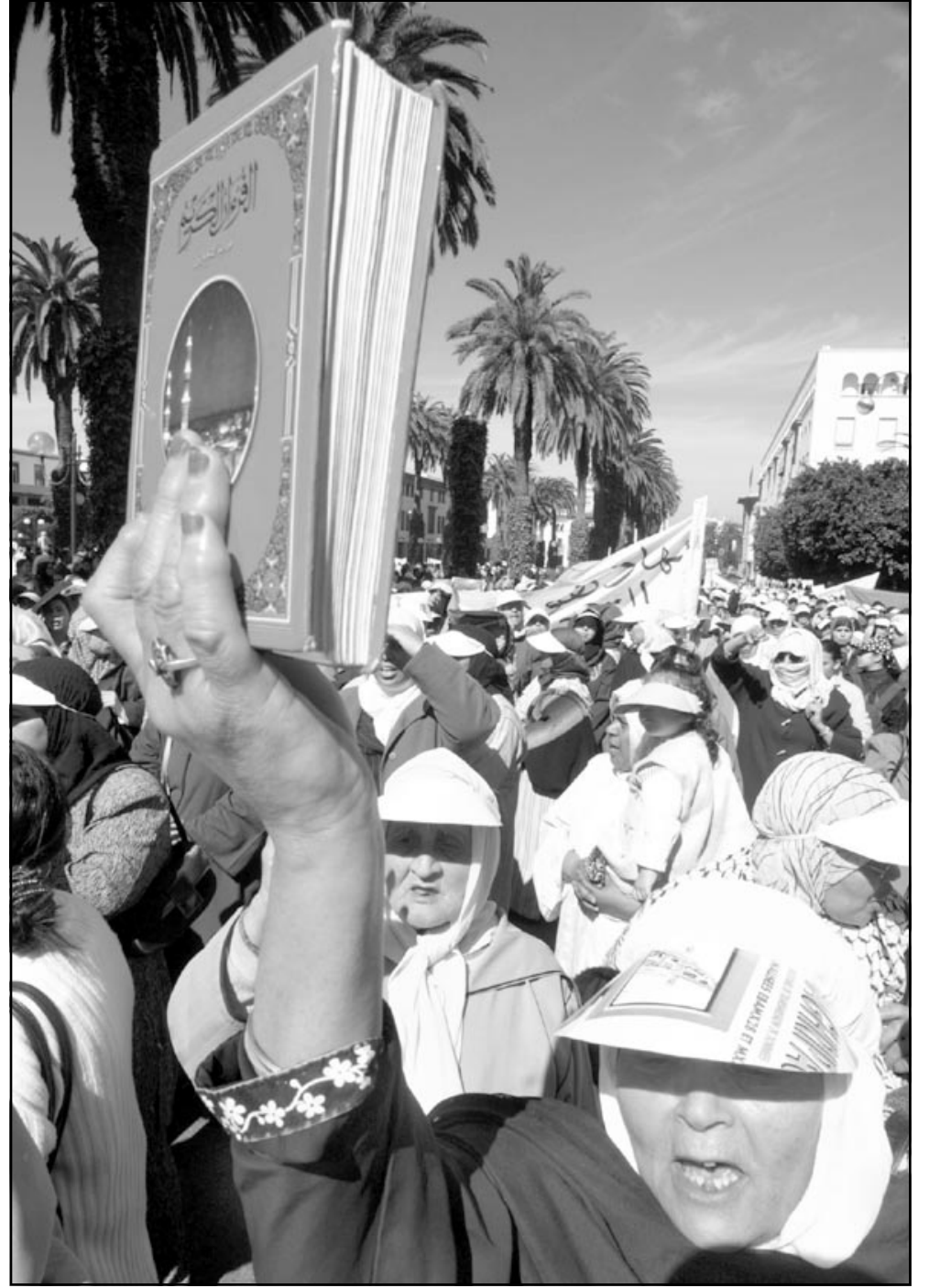
جانب من التظاهرة التي جرت امس بالرباط

وقد اكتفى اصحاب الرسالة بالقول في ديباجتها نحن كوادر الامن في مختلف الرتب، قبل ان يواصلوا سرد «محقاق» استهدفت بصورة مباشرة شخص المدير العقيد علي تونسي. وهذه المرة الاولى التي ينشر فيها