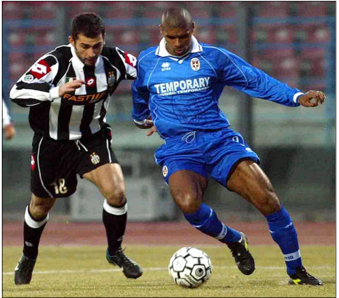
لقطة من مباراة يوفنتوس

■ روما - أ ف ب: يلحق انتر ميلان بيوفنتوس الى الصدارة بفوزه على ضيفه بيئاتشينزا 3-1 امس الأحد في المرحلة الثانية والعشرين من الدوري الإيطالي لكرة القدم. ورفع انتر ميلان رصيده الى 48 نقطة بفارق الأهداف خلف يوفنتوس الذي كان انفراداً موقتها بالصدارة بفوزه على مضيفه كومو 3-1 في افتتاح المرحلة. على استاد «سان سيرو» في ميلانو، استعاد انتر ميلان نغمة الفوز بعد خسارته أمام كومو 2-1