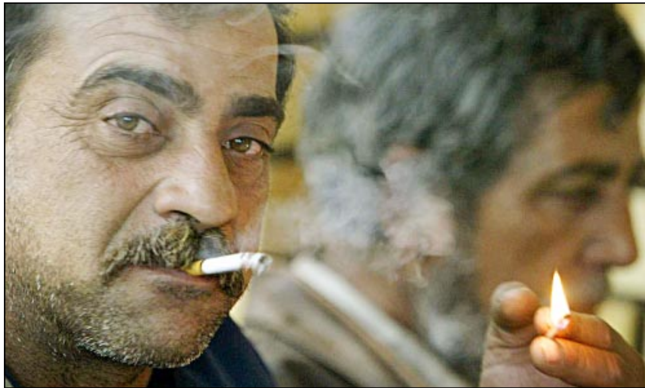
عراقي في مقهى ام كلثوم الشهير بشارع الرشيد

وتابع مبارك الذي كان في طريق عودته من المانيا وفرنسا حيث شارك في القمة الافريقية الفرنسية ان «عددا من القادة الدوليين من بينهم المستشار الاناني (غريهارد) شرودر وغيره سألوه كيف يتحرك العالم كله بتجمعاته ولا تتحرك الدول العربية بل تتحرك (...) الدول العربية ليست هنا وكان الامر لا يعنينها».