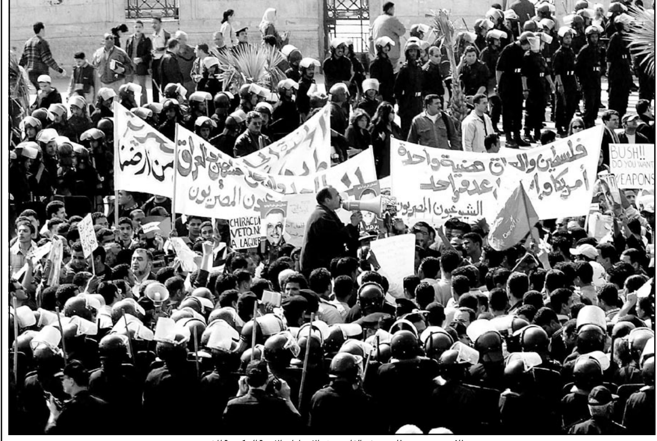
طلاب مصريون يتظاهرون في القاهرة رغم الاجراءات الامنية الحكومية المشددة

الخرطوم - «القدس العربي» من كمال حسن بخيت: اكد لزاراس سيميويو مبعوث سكرتارية الابقاد للسلام في السودان فور وصوله الخرطوم امس انه سيبدأ مشاورات مع السووليين اليوم للتشاور حول موعد واجندة جولة المفاوضات القادمة فيما اعلمت الحكومة استعدادها للاقتناع على اجندة قضايا المناطق الثلاث. وقال سيميويو الذي وصل البلاد في زيارة تستغرق 4 ايام للمصالحين ان موعد استئناف المفاوضات سيحدد لاحقا ووصف العلومات التي نشرتها إحدى الصحف العربية حول وثيقة متفق عليها بين الحكومة والحركة بشأن السلطة والثروة وصفها بانها مشوهة.