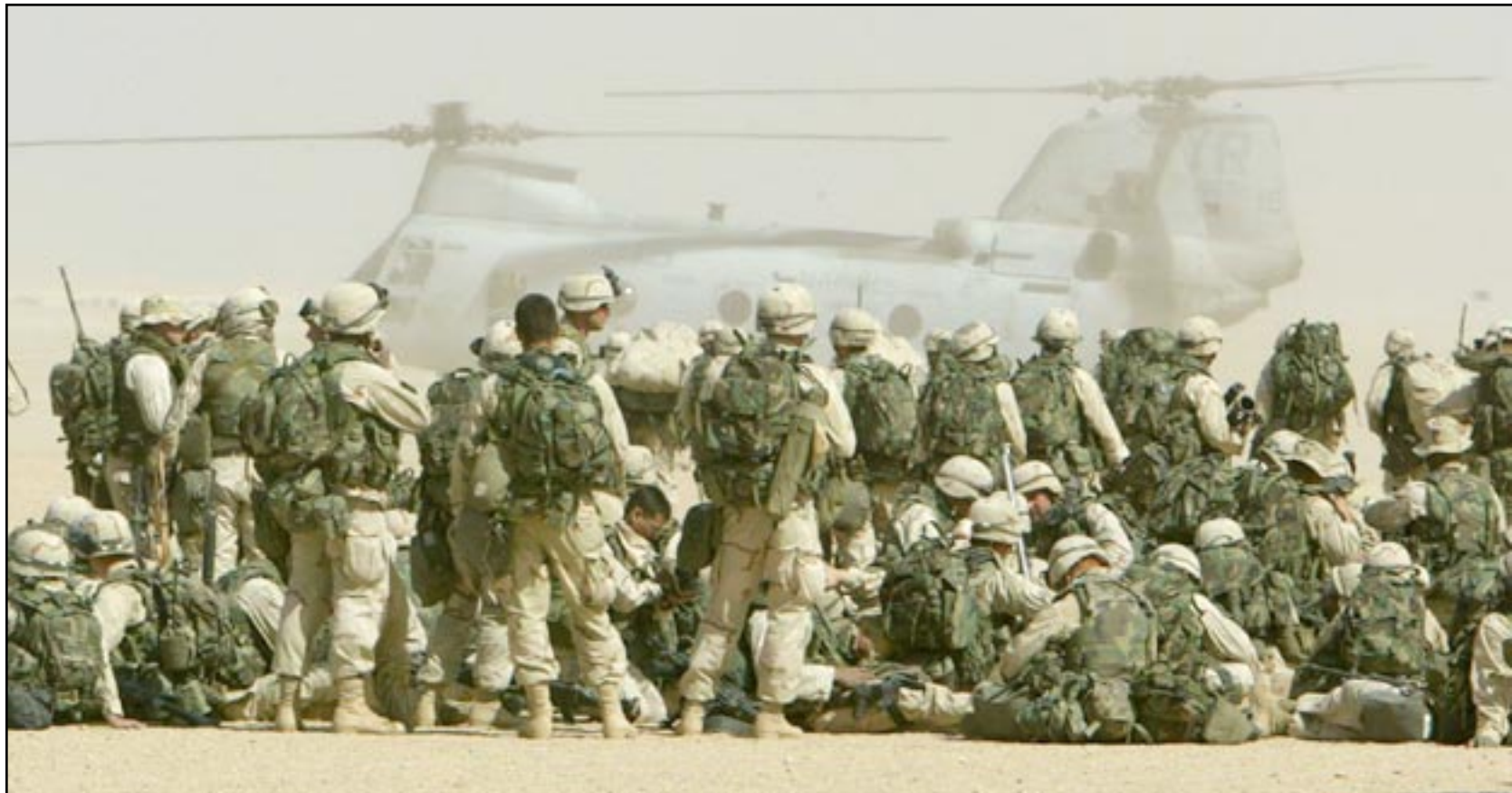
جنود امريكيون في الكويت بالقرب من الحدود مع العراق

وسورية واحدة من الدول العشر ذات العضوية غير الدائمة في مجلس الأمن، وادلى باول امس الأحد بتصويت قوي بشأن الجدول الزمني الذي وضعته واشتغل لشن حرب على العراق قائلا ان مجلس الأمن ينبغي ان يقرر ما اذا كان سيسمر قرارا جديدا بمجرد ان يقدم مفتشو الاسلحة التابعون للامم المتحدة تقريرهم المتوقع في 7 آذار (مارس) القادم.