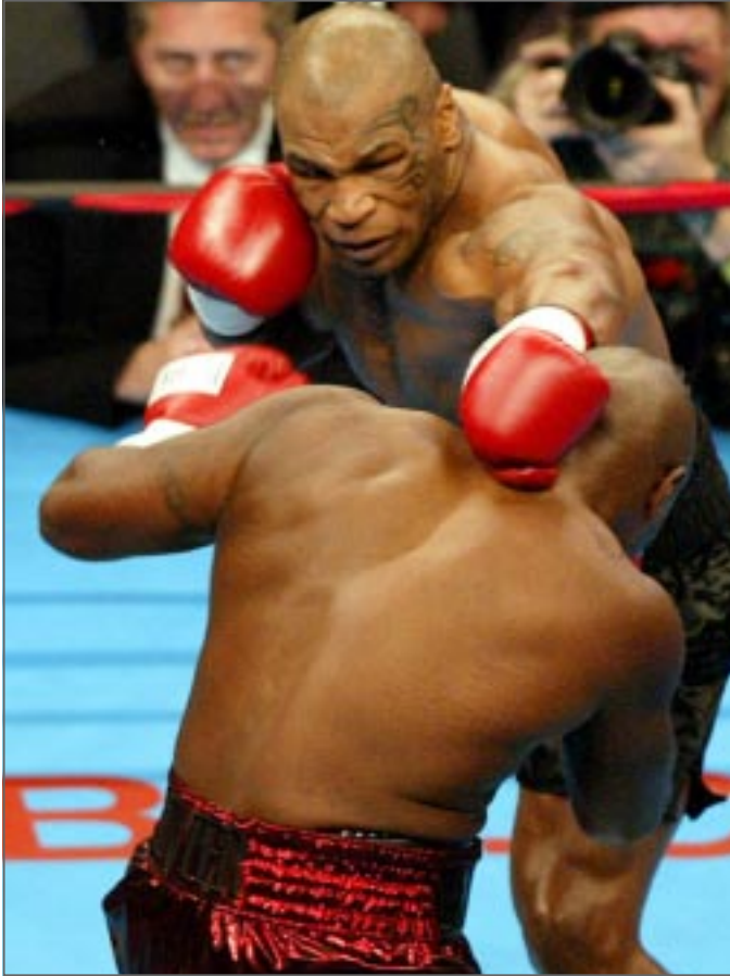
تايسون يهزم اتيان

■ ممفيس (تنيسي) - رويترز: سجل الملاكم الأمريكي مايك تايسون فوزاً كبيراً كان يحتاجه بشدة عندما تغلب على كليفلورد اتيان بالضربة القاضية بعد ثوانٍ من بدء الجولة الاولى من مباراتهما التي كان من المقرر ان تستمر عشر جولات، وبمهد الفوز الكبير الطريق امام تايسون لخوض مباراة جديدة امام البريطاني لينوكس لويس. الا ان تايسون كان الوحيد الذي لا يشعر بالرضا عن مستواه وقال انه غير مهتم بخوض مباراة امام تايسون في الوقت الحالي اذ انه ما زال بحاجة الى الكسب دون ان يعجب احدهما الآخر. وعاد تايسون يتهنى المباراة قبل 49 ثانية اثر لكمة قوية يسبها اخطأ الهدف قبل ان يتبعها باخري يميناه كانت مرعزة اتيان على الحلبة. وقال تايسون في معرضه رده عن سؤال حول مدى جوارحه لمواجهة اتيان