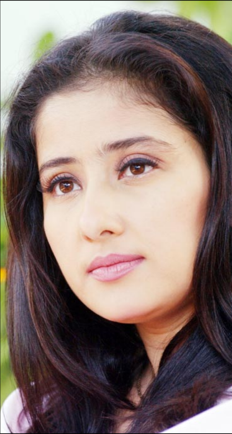
نجمة بوليوود الهندية مانيشا كورايلا في لقطة أثناء تصوير فيلم جديد في بومباي على الرغم من المتاعب الاقتصادية التي تواجهها صناعة السينما في بلدها

افاد المعهد الوطني لابحاث النباتات في الهند ان حمرة شفاه مصنوعة حسب خيرة هندية قديمة في الاعشاب التي تثير الشااعر الجنسية والعاطفية وتساعد على طرد الخمول وتنشط الابداع وتؤدي الي الهدوء الفكري سواء للمرأة او الرجل، ونقلت (سي بي نيوز) الاخبارية عن مدير المعهد الهندي قوله «لقد اصبح للتقبيل معنى جيدا، وظهر البحث ان جسم الانسان يمتص الروائح والايخبر من خلال الجلد، والشفاه هي الاكثر حساسية في جسم الانسان وهي من المناطق المخفزة للجنس».