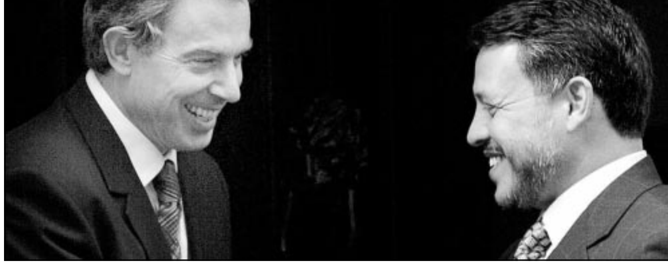
رئيس الوزراء البريطاني توني بليز مستقبلا الملك عبد الله امس

ان ترتيبا يتضمن برنامج تحرك محدد مع عمليات مفتشين معززة وجدول زمني واضح والاستعدادات العسكرية، يقدم إمكانية حقيقية لاعادة توحيد مجلس الامن مع ممارسة ضغوط قصوى على العراق.