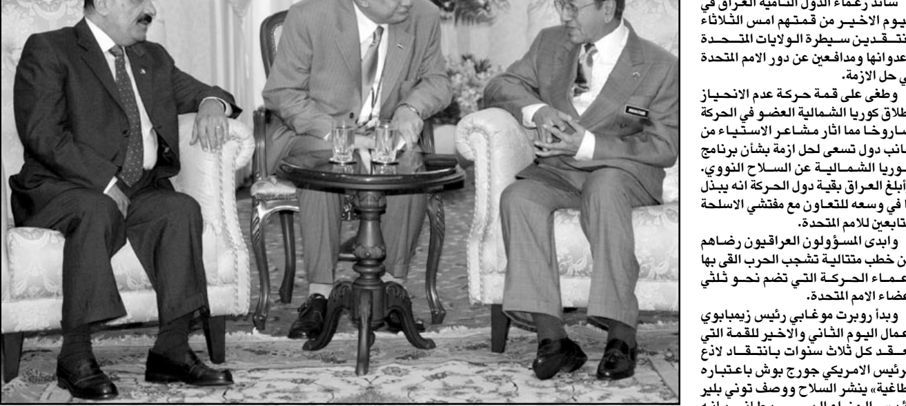
نائب الرئيس العراقي طه ياسين رمضان (يمين) مجتمعاً مع رئيس الوزراء الماليزي مهاتير محمد على هامش قمة عدم الانحياز في كوالالمبور

بغداد تدعو وفدا من الحركة لزيارة البلد للتحقق من تعاونها دول عدم الانحياز تنتقد سياسة امريكا تجاه العراق