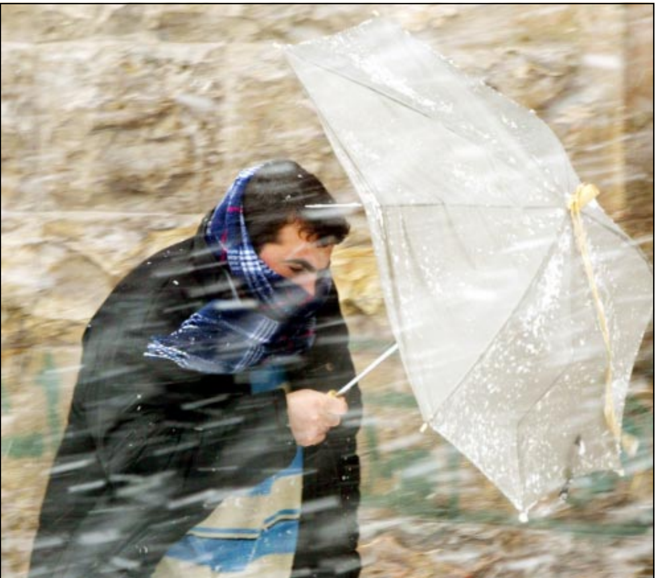
شاب فلسطيني يحاول الالتقاء مع الثلج الذي تساقط بغزارة على مدينة القدس أمس (رويترز)

■ القدس - ق. ب: بالرغم من الأحوال الجوية العاصفة وتساقط الثلوج على مدينة القدس التي اكتست حلة بيضاء، حيث وصل ارتفاع الثلج في بعض المناطق لأكثر من نصف متر، تظاهر نحو عشرة آلاف مقدسي ضد الحرب على العراق. وقال القائمون على هذه المظاهرة بدأت من باحات المسجد الأقصى المبارك في مدينة القدس واخترقت شوارع القدس العتيقة وصولاً إلى باحة كنيسة القيامة، في إشارة رمزية واضحة إلى الوحدة الفلسطينية الوطنية الإسلامية المسيحية وإلى التآخي الديني في فلسطين وتأكيداً على اللحمة الفلسطينية الإسلامية، مشيرين إلى أن الثلوج والطقس البارد لم يثن المقدسين عن التعبير عن رفضهم للحرب. وقد تقدم المسيرة كبار رجال الدين الإسلامي والقسح والشخصيات الفلسطينية المقدسية البارزة، وقد لوحظ مشاركة عدد كبير من الشباب وطالب المدارس حيث اغلقت المدارس بسبب تساقط الثلوج، كما لوحظ في المظاهرة مشاركة العشرات من الأجانب الذين تواجدوا في القدس وأتوا للمظاهرة ضد غزو العراق. هذا وقد رفعت الافتتاح في المظاهرة المنددة بالانحياز الأمريكي لإسرائيل، والمستنكرة للجناز والإرهاب الإسرائيلي بحق الفلسطينيين ولقتات تطالب الانظمة العربية بالتحرك لوقف العدوان على العراق. وما أن وصلت المظاهرة إلى باحة كنيسة القيامة بدأت أجراس الكنيسة تفرع ترحيباً بالمظاهرين وحدا على أزواج الشهداء واستنكاراً وتنديداً بالحرب التي تهدد أمريكا بشنها على العراق.