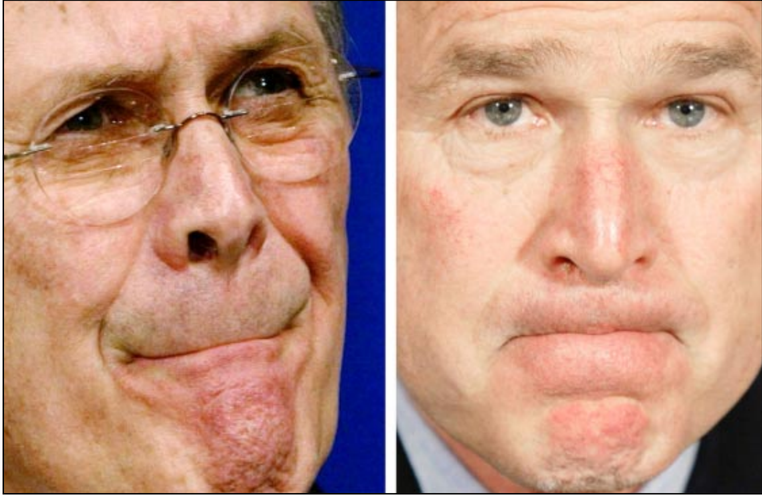
الرئيس الامريكي جورج دبليو بوش ووزير دفاعه دونالد رامسفيلد كما يديا في مؤتمر صحفيين منفصلين في واشنطن امس

شبكة «سي بي اس» دان رازر عن الرئيس العراقي نفيه ان تكون هذه الصواريخ تشكل خرقا لقرارات الامم المتحدة حول العراق واعلانه انه لا ينوي تدميرها ولا التعهد بتدميرها كما طلب منه كبير المفتشين الدوليين هانس بليكس. واعلنت قناة «سي بي اس» ان السلطات العراقية منعت حتى الآن بث مقابلة اجرتها مع الرئيس العراقي. وتحدث الرئيس العراقي نظيره الامريكي الدخول في مناظرة تلفزيونية مباشرة لمناقشة قضية نزع الاسلحة. وأكد الرئيس الامريكي امس ان صدور قرار ثان عن مجلس الامن الدولي حول العراق سيكون «مفيدا» لكن من الممكن