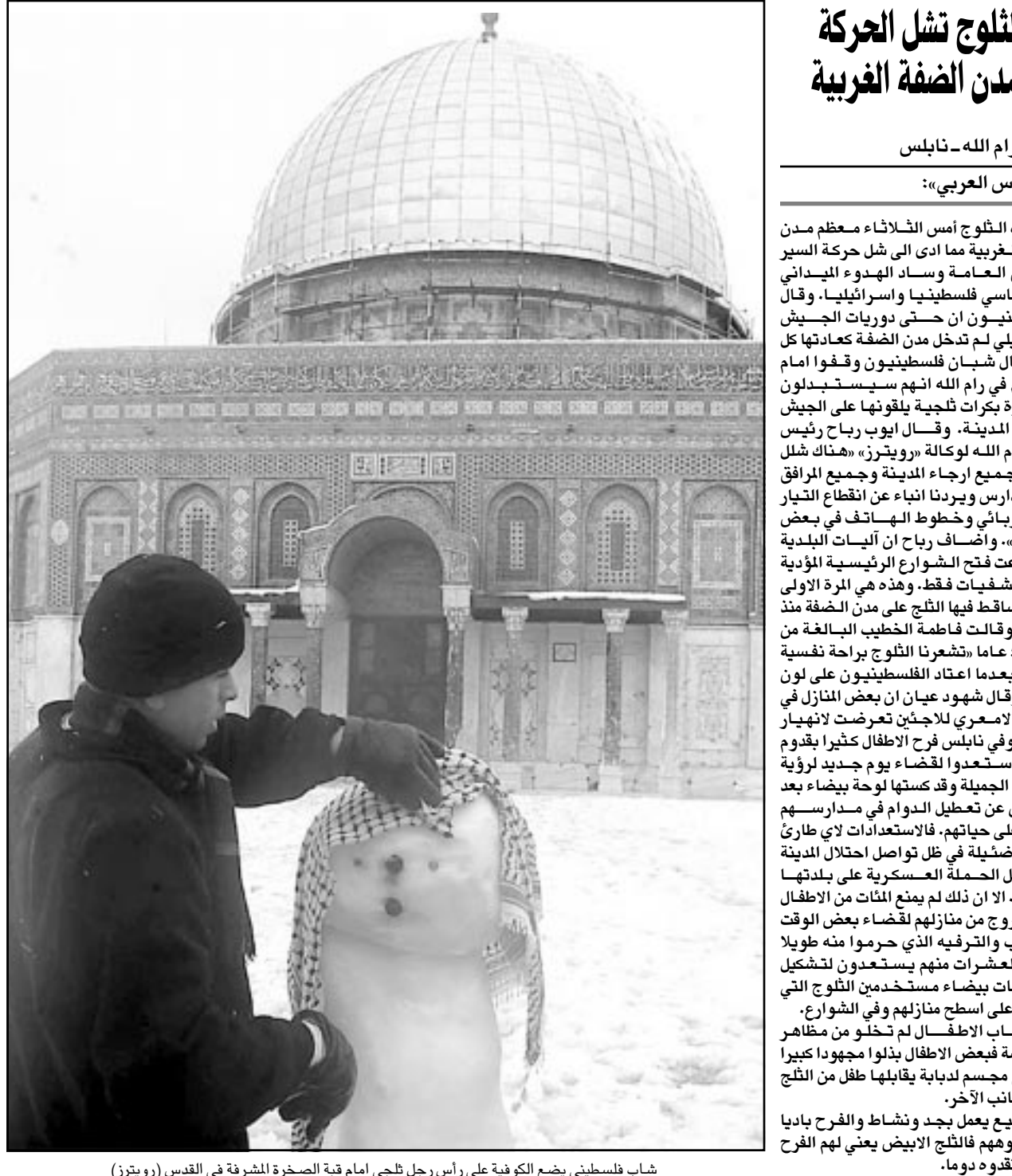
شاب فلسطيني يضع الكفوية على رأس رجل تلجج امام قبة الصخرة المشرفة في القدس