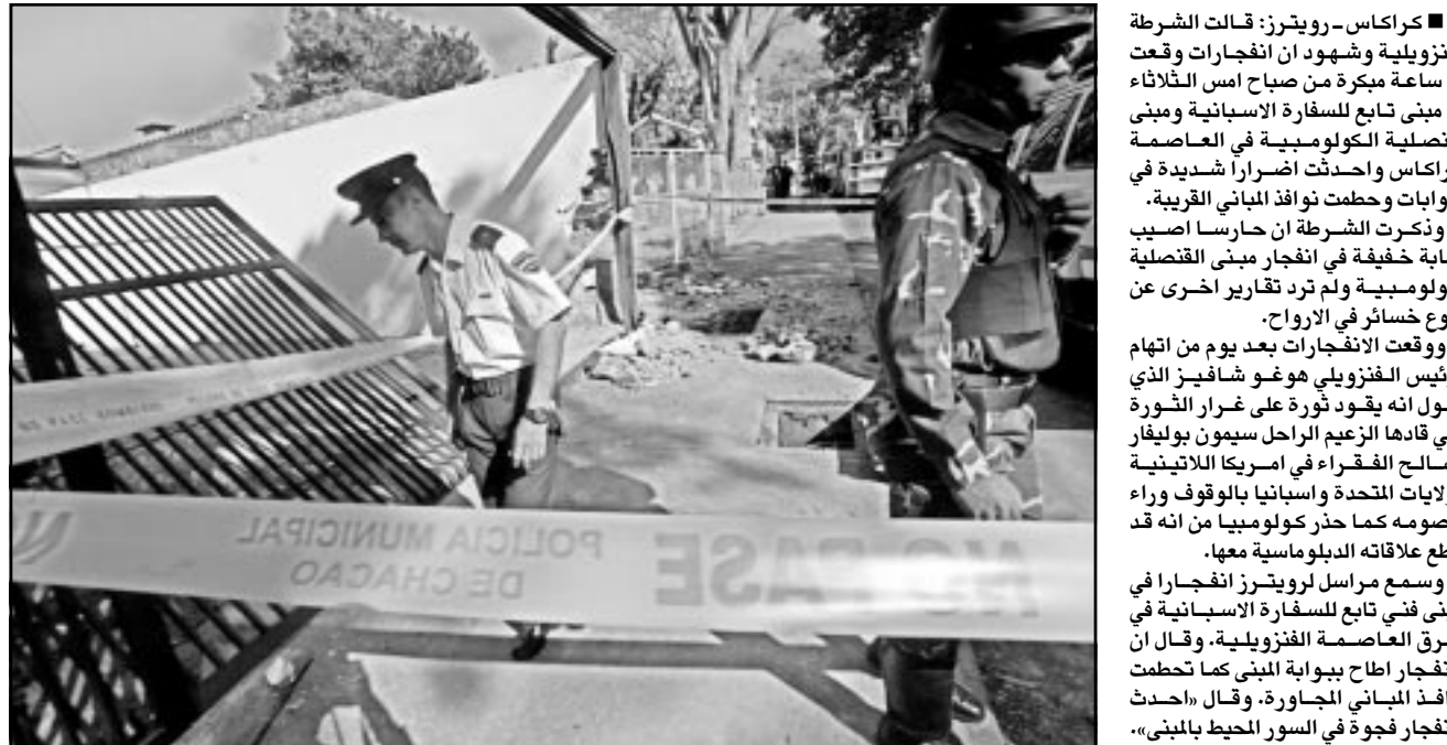
عنصران من قوات الامن الفنزويلية يقفان امام مبنى سفارة اسبانيا في كراكاس

كراكاس - رويترز: قالت الشرطة الفنزويلية وشهود ان انفجارات وقعت في ساعة مبكرة من صباح امس الثلاثاء في مبنى تابع للسفارة الاسبانية ومبنى القنصلية الكولومبية في العاصمة كراكاس واحدثت اضرارا شديدة في البوابات وحطمت نوافذ المباني القريبة. وذكرت الشرطة ان حارسا اصيب اصابة خفيفة في انفجار مبنى القنصلية الكولومبية ولم ترد تقارير اخرى عن وقوع خسائر في الارواح. ووقعت الانفجارات بعد يوم من اتهام يقول انه يقود ثورة على غرار الثورة التي قادها الزعيم الراحل سيمون بوليفار التي قادها الفنزوة في امريكا اللاتينية لصالح الفقراء في امريكا اللاتينية. ويقطع علاقاته بالدبلوماسية معها.