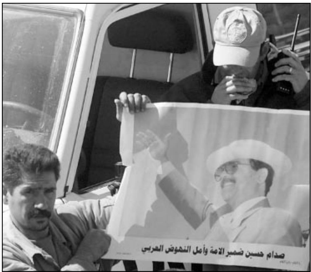
صدام حسين ضمير الامة وأمل النفوس العربي

عاملون في مصنع الفيحاء للدواجن يتظاهرون في بابيل ضد الحرب المحتلة على العراق