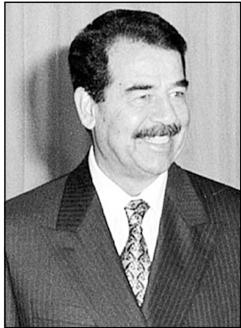
الرئيس العراقي صدام حسين

بغداد - من جاك شارملو: اعتبر دبلوماسيون في بغداد امس الثلاثاء ان الرئيس العراقي صدام حسين بعد مرور اثني عشر عاما على حرب الخليج الثانية، عالق بين سندان المطالب الملحة بضرورة نزع سلاحه وبين مطرقة عمل عسكري امريكي يهدد بالاطاحة به.