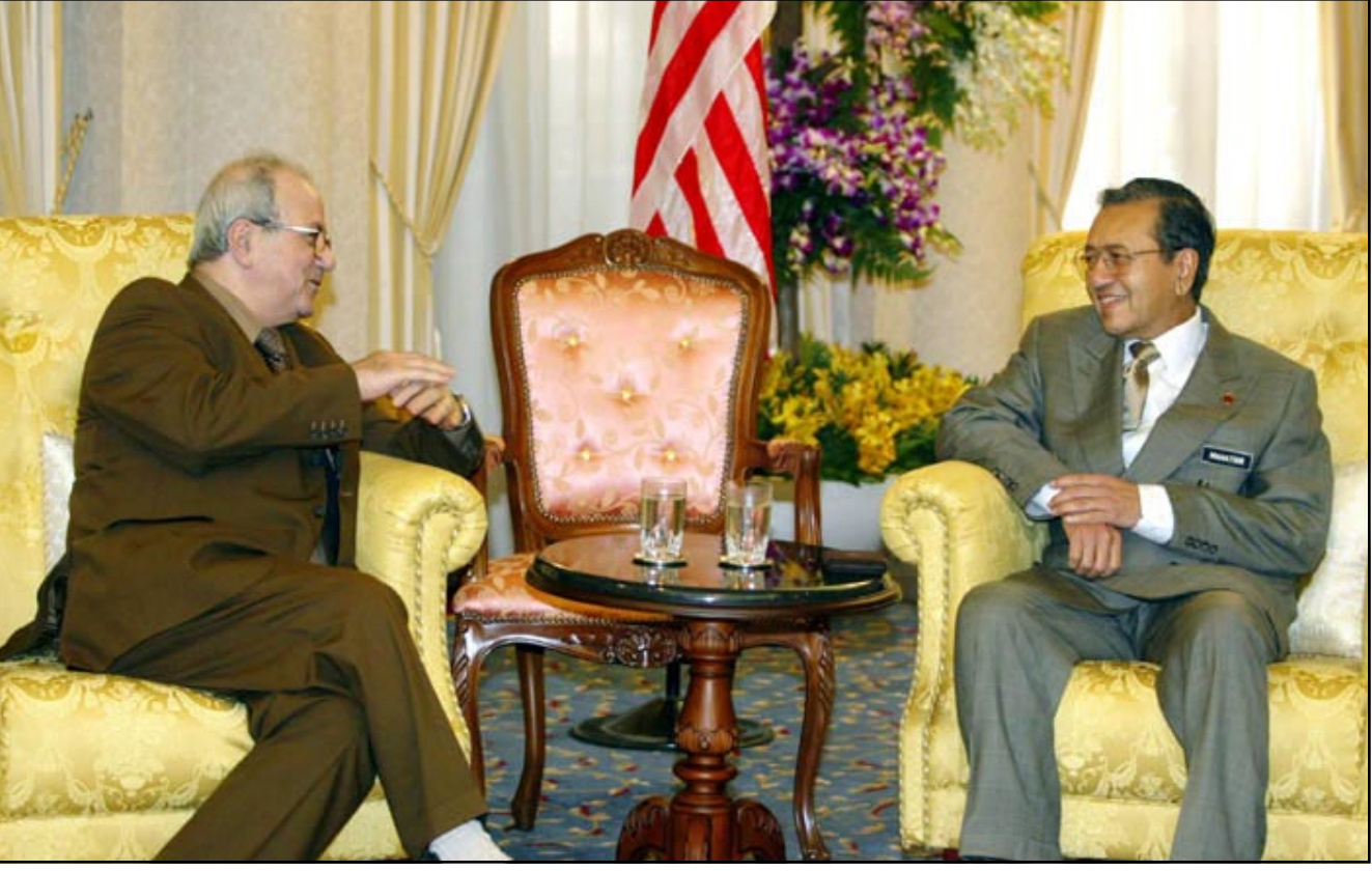
مهاتير مستقبلاً القومى في هاشم قمة دول عدم الانحياز في كوالالمبور أمس

■ كوالالمبور - «القدس العربي» - من جمال المجايدة: كانت فلسطين حاضرة بقوة في قمة عدم الانحياز واجمع العديد من قادة الدول والحكومات المشاركين في القمة على ضرورة توفير حماية دولية عاجلة للشعب الفلسطيني. ووجه الرئيس الفلسطيني ياسر عرفات كلمة إلى القمة عبر الاقمار الصناعية صباح أمس فوبلت بتصفيق حاد من القادة ورؤساء الوفود المشاركة من 113 دولة دعا فيها قادة دول عدم الانحياز إلى ارسال لجنة تقصي حقائق في فلسطين حتى تطلع عن كذب على حقيقة ما يجري على الأرض كما دعا إلى التحرك لتطبيق قرارات الامم المتحدة وخاصة القرار 194 والقرار 181 لاقامة دولة فلسطينية مستقلة وعاصمتها القدس. وابع القادة ان السياسة الاجرامية الواضحة لحكومة اسرائيل هي تقويض لكل مبادرات السلام بدءاً من اتفاقيات اسلو وحتى خارطة الطريق وقال ان القيادة الفلسطينية عملت من أجل القفز عملية السلام ووقف كافة اشكال العنف الا ان اسرائيل واصلت جرائمها ضد المدنيين والقدسيات وممرت البنية التحتية وسرقة اموالنا وحجزها وفرض الحصار الخانق علينا. وقال عرفات أننا نواجه ايشع حملات الظلم والاضطهاد والتسلل والاعتقال والحصار والتدمير على يد الة الحرب الاسرائيلية وخلص إلى