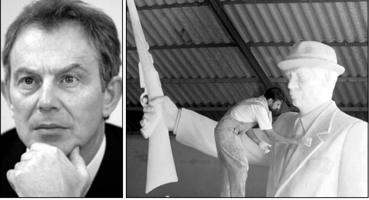
عامل يضع المسامات الاخيرة لتمثال الرئيس العراقي صدام حسين

موافقة الامم المتحدة ستكون خطيرة على حكومتنا وعلى مستقبلنا (...). وعلى مكانها في التاريخ، انها خطيرة للغاية وهذا ما يققني». وقد اثارَت تصريحاتها غضب بلير الذي تحدث اليها مرتين، ولكنه توقف عن زلمها من الحكومة، مؤكدا ان الاولوية امام الحكومة الان ليست الخلافات ولكن التغلب على المساعبات التي تقف امام صدور قرار ثامن من مجلس الامن، حيث وجدت بريطانيا وفرنسا نفسيهما امام لعبة دبلوماسية صعبة وتهدف كل واحدة لنيل الاصوات الكافية بتمثيل او اقتبال القرار الثامن. ولم يشأ بلير في الوقت الحالي عزل شورت حتى لا يحولها لـ «شهيدة» او نقطة يتجمع حولها المعارضون للحرب التي تعترض من اكثر المقربين لتوني بلير نوعاً من الصاعقة في داخل الحكومة، واخذت بلير على حين غرة، فهي جاءت بثناء على طلب منها، وبدون ترديد مع الحكومة، واعتلت في احاديث لبرنامج «ساعة ويستمنستر» في هيئة الاذاعة البريطانية، عن نيحتها للاستقالة اذا دخلت بريطانيا الحرب ضد قرار جديد.