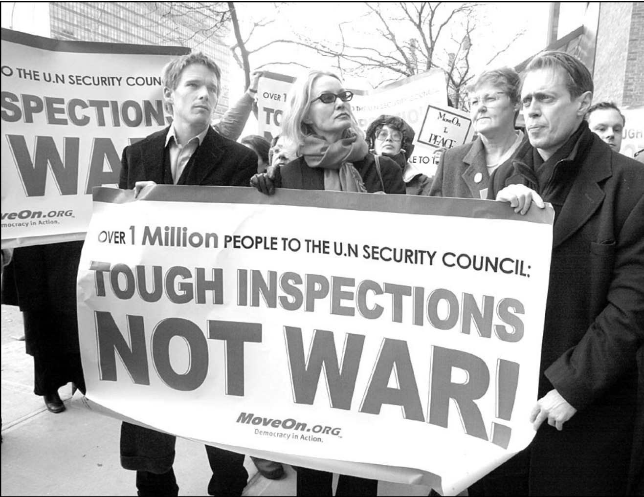
المظنون ستيف بوسيمي وجيسكا لانغ وايتان هوك يشاركون في مظاهرة ب نيويورك ضد الحرب

اي ايه»، ونقلت صحيفة «نيويورك تايمز» عن مصادر في امريكية قولها ان ادارة الرئيس بوش صعدت في الايام القليلة الماضية من جهودها لاقتناع عدد من الدول المعنية بترحيل دبلوماسيين عراقيين. وكانت واشنطن قد طلبت في الاسبوع الماضي من مسؤولين عاملين مع البيضة العراقية في نيويورك مغادرة الولايات المتحدة، ورفض مسؤول امريكي الاشارة الى ان عمليات الطرد لها علاقة بتوقيف الحرب او موعد وقوعها. ولكن مسؤولين في عدد من الدول قالوا ان واشنطن اخبرتهم بالسبب الحقيقي وراء الطرد، وهو ان ادارة بوش وبناء على نصيحة الخبايا الامريكية تريد التوشين على شبكة التجسس العراقية قبل بدء العمليات العسكرية بايام، ولم تقدم واشنطن اي مواعيد نهائية لاتمام عمليات ترحيل الدبلوماسيين العراقيين، ولا يعرف فيما اذا كانت الدول ستلتزم بالطلب الامريكي.. ويقول دبلوماسي ان «طرد من اعتبرهم وواشنطن عملاء عراقيين» يظل اشارة عن حتمية المواجهة العسكرية، لان النظام العراقي لن يكون قادرا على ارسال دبلوماسيين جدد للقيام بنفس المهام التي كان يقوم بها الدبلوماسيون المرحلون والتي تدعي امريكا انهم يقومون بمهام تجسسية.. وقال مسؤول امريكي، «وقت غير جيد» لسفر بجواز سفر عراقي حول العالم. ورفضت ادارة بوش الحديث عن عدد الدول التي طلبت منها ترحيل عراقيين، ولكن الفيلين كانت واحدة من الدول التي قامت بعمل مماثل مثل استراليا، وتتضمن القائمة الامريكية اسما 300