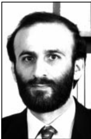
عيسى مخلوف (القدس العربي)