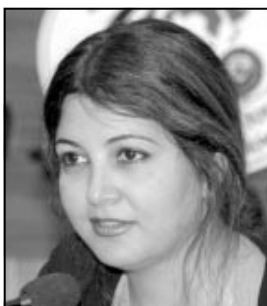
ميرال الطحاري (القدس العربي)