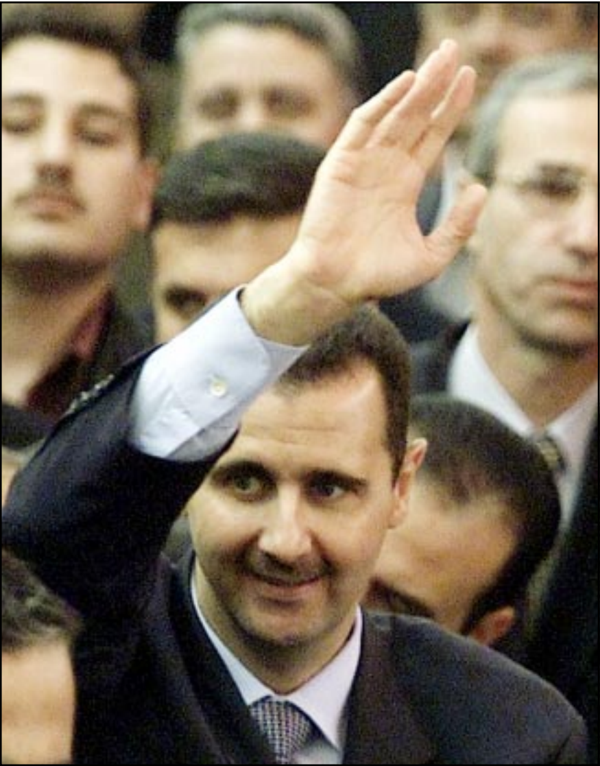
الرئيس السوري يحيى أعضاء المجلس الجديد بعد لقائه خطابه أمس

لندن - دمشق - «القدس العربي» - اف ب: انتقد الرئيس السوري بشار الأسد أمس مواقف العراق من الحرب الأمريكية المزمعة ضد العراق، متهمًا الولايات المتحدة بالضغط على القادة العرب الأحرار لمنع مشاركة سورية في اللجنة التي تشكلت بغرض السفر إلى العراق. وقال الأسد في خطاب أمام البرلمان السوري الجديد صنف الموقف العربي من الأزمة، مشيرًا إلى أن سورية ولبان تلقيا اتهامات كثيرة لتبنيهما مواقف واضحة من رفض الحرب ضد العراق وعدم تقديم تسهيلات للجيش الأمريكي والبريطانية في المنطقة، وقال إن القادة العرب يتعاونون مع أمريكا والغرب، ولا يتعاونون فيما بينهم. وأوضح الأسد أن سورية باعتبارها عضوا غير دائما في مجلس الأمن الدولي «عملت كل ما بوسعها» للحيلولة دون تعرض العراق لضربة عسكرية أمريكية.