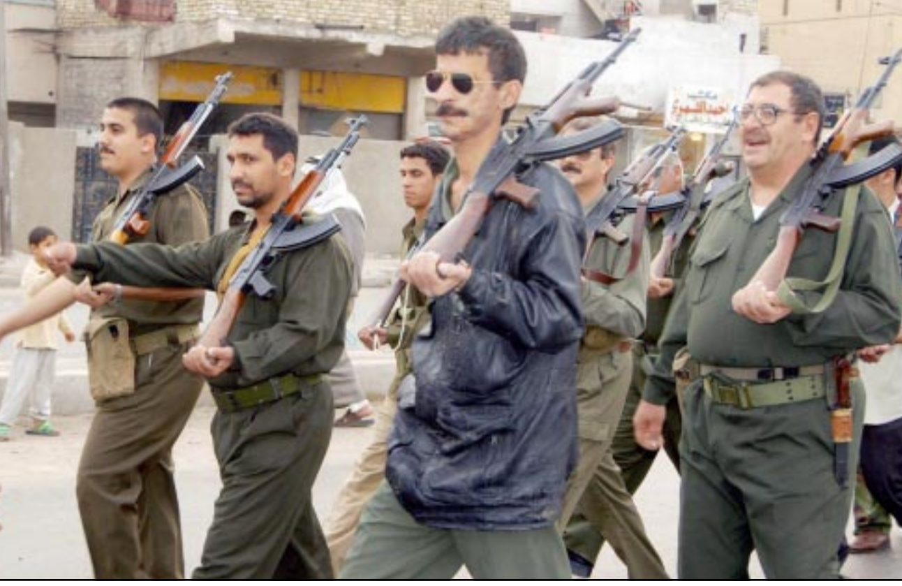
متطوعون عراقيون في جيش القدس أثناء استعراض في مدينة صدام ببغداد امس

«عندما يأتي الاجنبي نأخذه في الاحضان ونسلمه مقاليد امورها» الاسد: القادة العرب عاجزون حتى عن اتخاذ موقف الحياد ■ لندن - دمشق - «القدس العربي» - وكالات: وجه الرئيس السوري بشار الاسد أمس انتقادات حادة لواقعة الزعماء العرب من الحرب الامريكية المزعمة ضد العراق، متهمًا اياهم بالعجز حتى عن اتخاذ موقف الحياد. وانتقد الاسد في خطاب امام البرلمان السوري الجديد ضعف الموقف العربي من الأزمة، مشيرًا الى ان سورية ولبان تلقينا اتهامات كثيرة بـ«التطرف» لتبنيهما مواقف واضحة من رفض الحرب ضد العراق وعدم تقديم تسهيلات للجيش الامريكي والبريطانية في المنطقة، مشيرًا الى ان القادة العرب يتعاونون مع امريكا والغرب، ولا يتعاونون فيما بينهم. وانتقد الاسد الدول العربية لاختلافها حتى في تبني موقف موحد برفض اعطاء تسهيلات للقوات الامريكية في حال وقوع الحرب، ومضى يقول «كلنا نعتبر ونصرح باننا ضد الحرب ولكن ماذا فعلنا... لم نقف حتى على الحياد نحن نؤثر سلبا حتى على هذا العمل (المضاد للحرب)». وتابع «عندما يأتي الاجنبي نتح له الابواب ونأخذه في الاحضان ونسلمه مقاليد امورها وننام في يري العين، هل هو التضامن العربي»، ولكن الاسد لم ذكر دولة عربية بعينها، وتصفى دول الخليج العربية الكويت والبحرين وقطر والسعودية عشرات الآلاف من الجنود الامريكيين استعدادا للحرب تقودها الولايات المتحدة ضد العراق، وفيما دعت سورية الى اغلاق القواعد العسكرية الامريكية في المنطقة فقد طالبت الدول العربية برفض اعطاء تسهيلات لاي جهود عسكرية امريكية وهو مطلب وصفه الرئيس السوري بأنه «ادنى شيء ممكن».