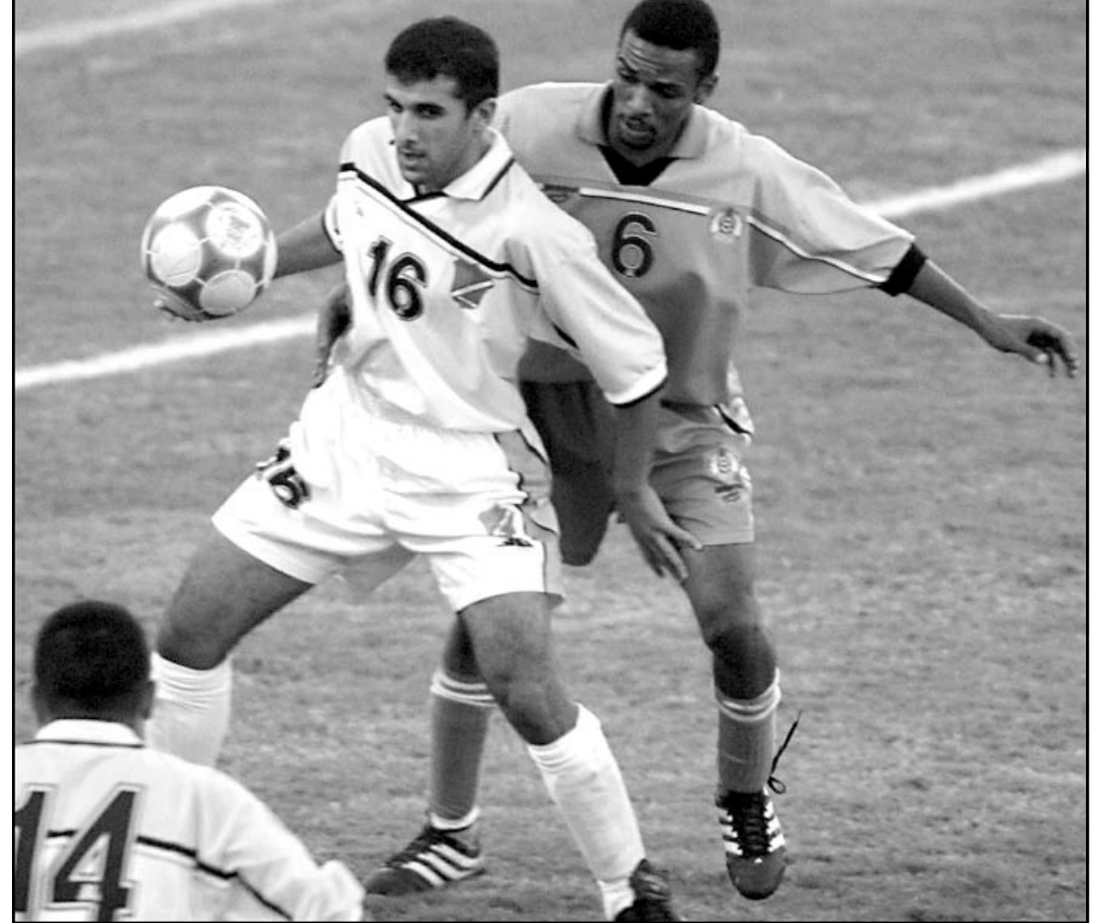
فريق العين الاماراتي