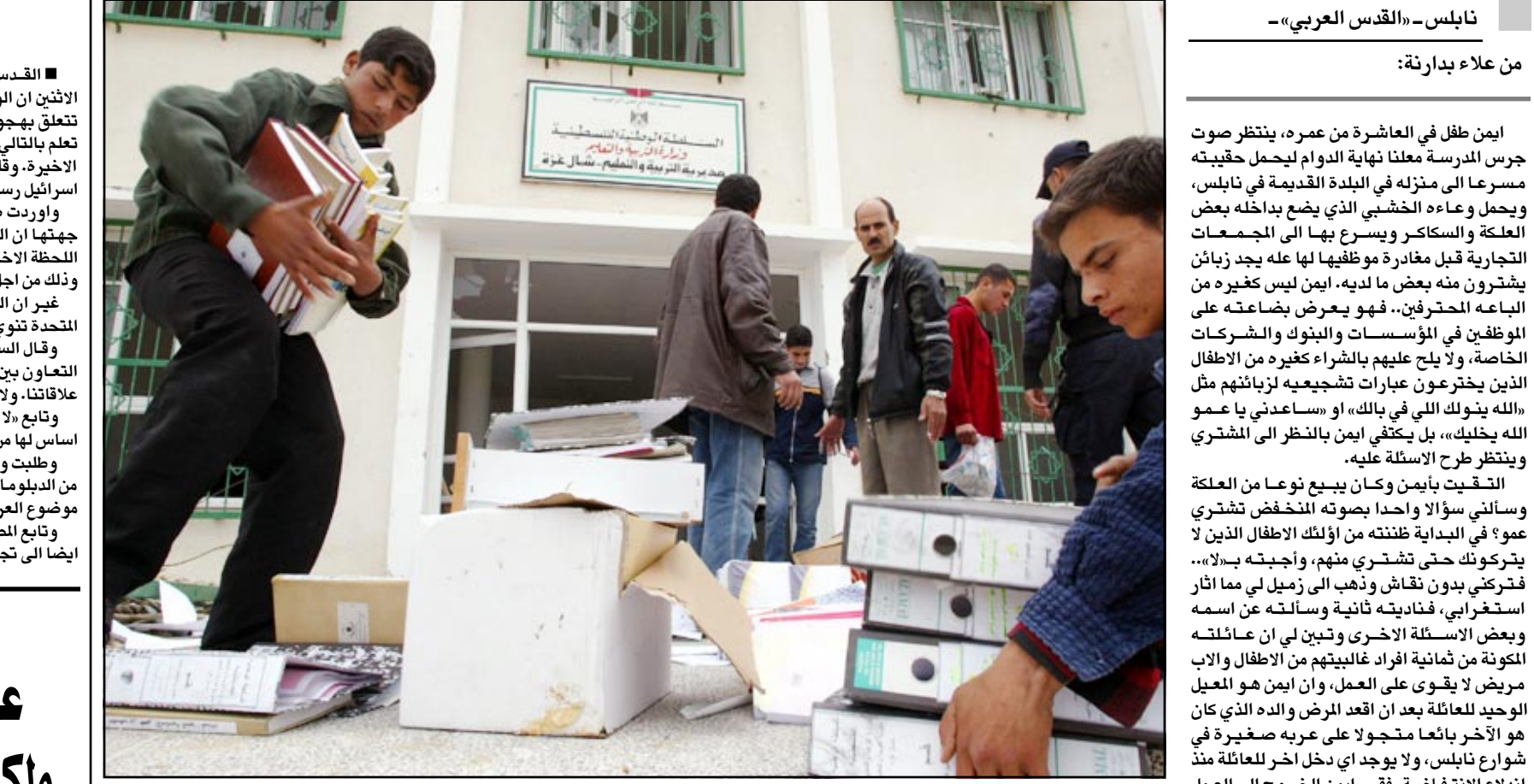
طالبة واساتذة يملمون اوراق ووثائق مديرية التعليم في شمال غزة بعد تعرضها لتدمير وتخريب من قبل قوات الاحتلال

القدس - اف ب: نذكرت اذاعة الجيش الاسرائيلي أمس الاثنين ان الولايات المتحدة شكت من تسريبات في اسرايل تتعلق بهجوم عسكري امريكي ضد العراق، مشيرة الى انها لن تعلم بانثالي الحكومة الاسرائيلية عن شن الهجوم الا في اللحظة الاخيرة، وقالت الاذاعة ان «واشنطن سلمت خلال الايام الاخيرة اسرايل رسالة تعبر فيها عن قلقها» في موضوع التسريبات. واوردت صحيفة «يديعوت احرونوت» الواسعة الانتشار من جيتها ان الولايات المتحدة لن تحذر حليفها الاسرائيلي الا في اللحظة الاخيرة بشأن هجوم على العراق، خلافا لتعهد سابق، وذلك من أجل تجنب أي تسريبات. غير ان السفير الأمريكي في اسرايل نفى ان تكون الولايات المتحدة تنوي اخفاء مشاريعها عن الاسرائيليين. وقال السفير دان كورتز للاذاعة العامة الاسرائيلية «ان التعاون بين بلدينا جيد الى حد لا يصدق ولا مثير له في تاريخ علاقاتنا، ولا يمكن التفكير في ان نتصرف بحيث نفاخي حليفا». وتابع «لا اعلم ما هو مصدر هذه المعلومات الصحافية، لكنها لا اساس لها من الصلة». وطلبت وزارة الخارجية الاسرائيلية على اثر هذه الانتقادات من الدبلوماسيين الاسرائيليين عدم الالاء بتسريبات حول موضوع العراق، بحسب ما علم لدى الوزارة. وتابع المصدر ان هذه التعليمات التي تدعو الى التحفظ تهدف ايضا الى تجنب اعتبار اسرايل طرفا في حرب ضد العراق كما