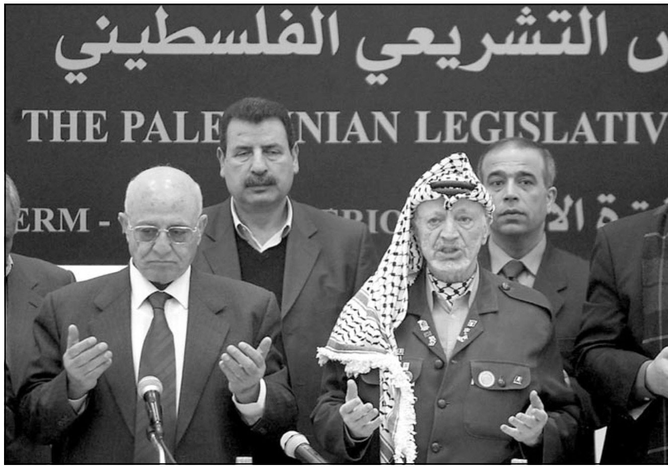
الرئيس عرفات وأعضاء في المجلس التشريعي يقرؤون الفاتحة قبل بدء أعمال المجلس التشريعي في رام الله

التصويت، وكان المجلس المركزي الفلسطيني وافق في بيانه الختامي بعد اجتماعات استمرت يومي السبت والأحد على استحداث المنصب وترشيح أبو مازن لشغله. وجرى التصويت في المجلس التشريعي أمس علناً خلال الجلسة التي عقدت في رام الله فيما شارك سبعة من أعضاء المجلس التشريعي معتمدين إسرائيل من التوجه إلى رام الله عبر الدائرة التلفزيونية المغلقة من مقر المجلس في غزة. هذا واستأنف المجلس بعد التصويت مناقشة الصلاحيات التي ستستند لهذا المنصب بهدف إضافتها إلى النظام الأساسي قبل أن يطرح موضوع الثقة على تعيين محمود عباس (أبو مازن) رئيساً للوزراء. وفي مستهل اجتماع التشريعي الذي عقد في مقر الرئاسة الفلسطينية قبل أن ينتقل إلى مقر المجلس المؤقت دعا الرئيس الفلسطيني في كلمته أمام أعضاء المجلس لاستحداث منصب رئيس الوزراء والموافقة ومنح الثقة أيضاً على تعيين أبو مازن رئيساً للوزراء. وأكدت مصادر فلسطينية أن المجلس التشريعي الذي يحدد صلاحيات رئيس الوزراء سيبقي ملف المفاوضات مع إسرائيل في يد الرئيس عرفات وحقه فيقالة رئيس الوزراء، إضافة إلى كونه القائد الأعلى لقوات الأمن فيما يكون رئيس الوزراء مسؤولاً عن الأمن الداخلي وتعيين الوزراء ومراقبة أدائهم والتشاور مع الرئيس عرفات في القضايا الخارجية. هذا وكانت قدمت للمجلس التشريعي عدة اقتراحات فيما يخص صلاحيات رئيس الحكومة