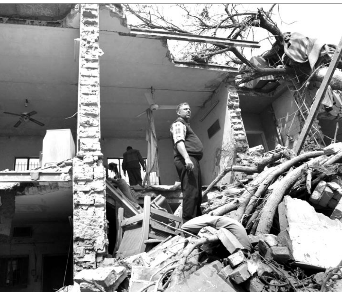
يقف وسط اطلال منزله في بغداد

وقالت «اوبزيرفر»، ان قائدا تركيا في مناطق الحكم الذاتي طلب من جنوده اطلاق عيارات نارية على جنود اترك يدخلون شمال