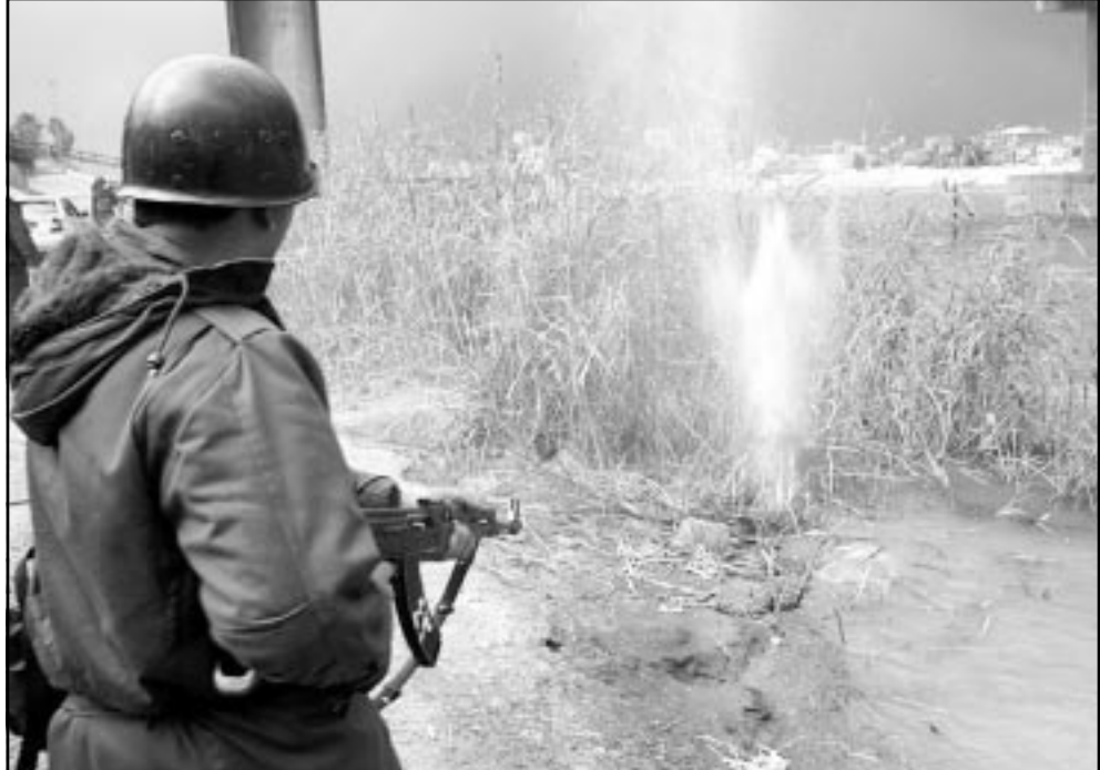
جندي عراقي يمشط منطقة في بغداد بحثاً عن مظلي غربي مبط في نهر دجلة

السيطرة معناها ايضا ان يكون بوسع القوات ان تنفذ اعمال مراقبة، من الجو والارض، لمناطق اساسية، وهكذا فاذاً ما تمكن العراقيون، رغم ذلك، من ان يقدموا في هذا شبيهاً ما واطلاق صاروخ - فستتعلق عليهم دائرة نارية فورية من الارض او من الجو حتى قبل ان يظلقوا الصاروخ. ان لهذه السيطرة على غربي العراق توجده خطة امريكية مرتبة، واذاً لم يحصل اي اخل آخر، فانها ستتكلت حتى منتصف الايلول، بلا حسد.