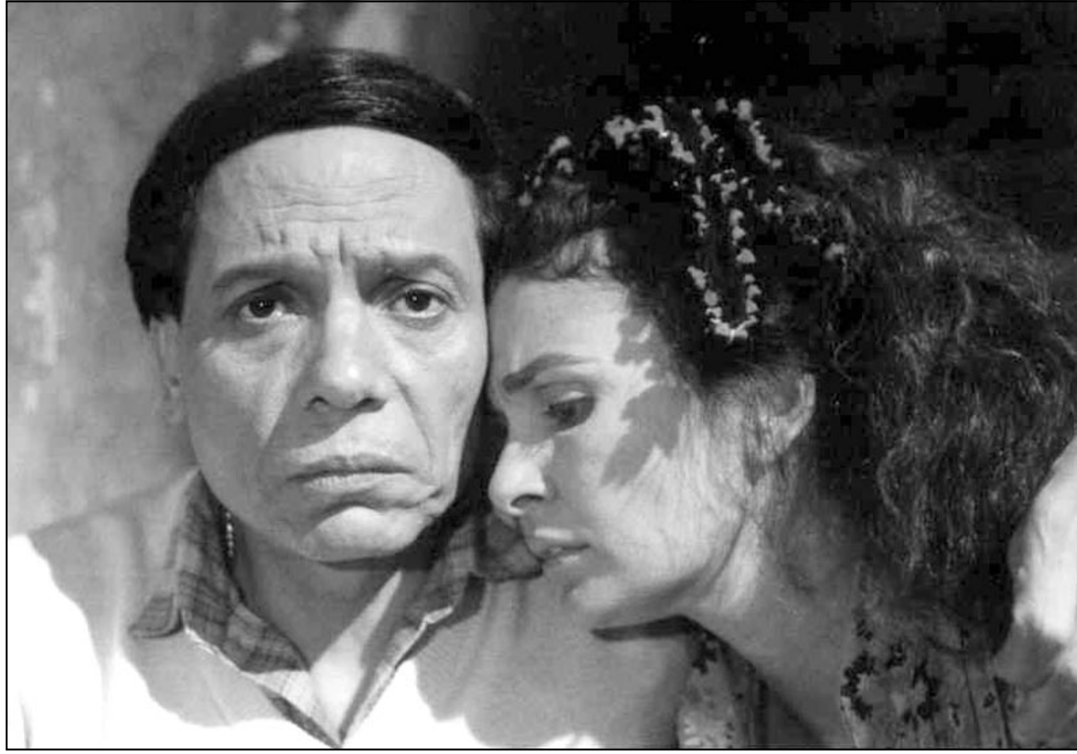
عادل امام ويسرا في لقطة من احد افلامهما

وقال النجم عادل امام: البعض رشح شيرين سيف النصر لكنني رايت انها تحمل السمات الشرقية رغم شعرها الاصفر وعينيها الملونتين، ولذلك بحثت عن مواصفات اخرى حتى عثرت على نيكول سابا التي شاهدتها