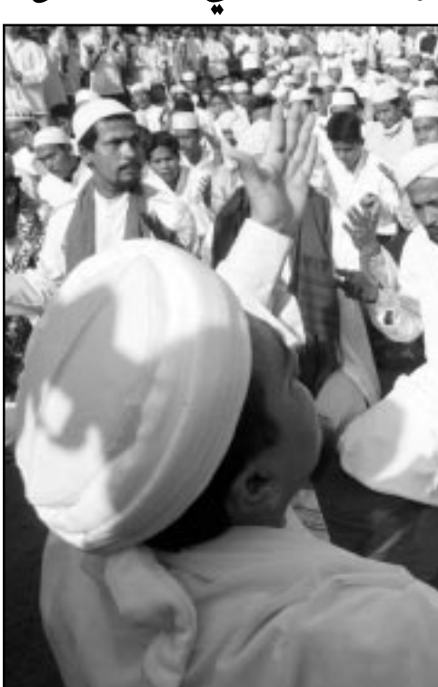
اندونيسيون يتظاهرون امام السفارة الامريكية في جاكركا ضد الحرب على العراق

معرفة باستهدافها الغربيين قد تخطط لنشاط «راهابي» في سوريا ثاني اكبر مدن اندونيسيا والتي شهدت احتجاجات غاضبة ضد الحرب في العراق. واغلقت الولايات المتحدة قنصليتها في سوريا فيما يخص الاجراءات الامنية وسنظل مغلقة لاجل غير سلمي.