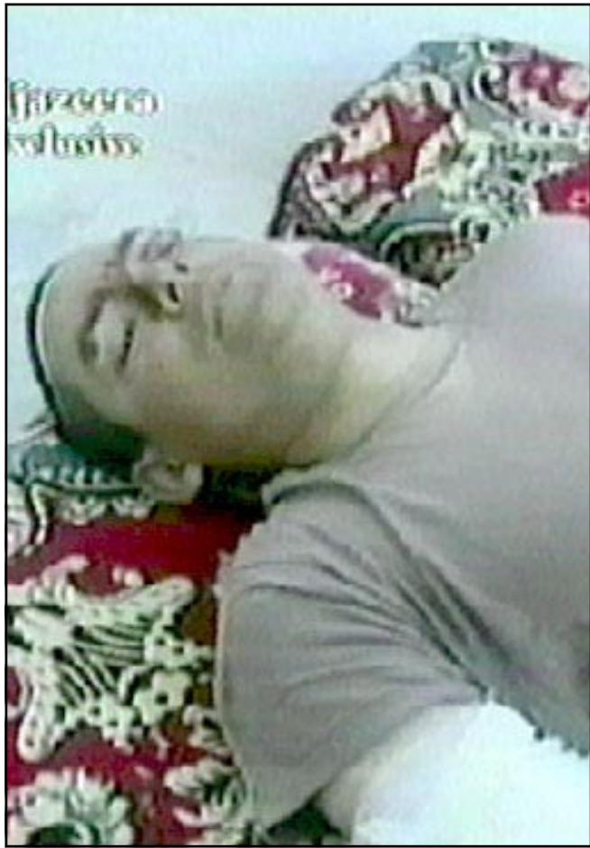
اسرى امريكيون وقعوا بايدي القوات العراقية في الناصرية امس

ومعروف ان بلدة «سوق الشيوخ» قد اعطت العراق معظم شعرائه ومطربيه. وبدا العراقيون وكانهم «استوعبوا» الصدمة الاولى للحرب، حيث عادت بعض مظاهر الحياة الطبيعية الى بغداد والبصرة. وانتشر منطعون من جيش القدس وحزب البعث داخل المدن بشكل كثيف، وتعرضت مدينة الموصل لغارات جديدة اس.