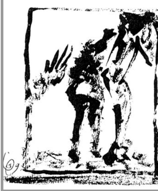
شاعر من اليمن

ما يزال دمي غرض الغزو من عهد كسرى إلى يومنا لننظ هذا وما زال سيف دمي واقفاً في وجه الغزاة هو الحد ما بينهم وعيون لها طرقيها وطني والهوى وأقاصي الرؤى، سكتي عاشق ينادي من الماء للدماء لا تحزني لمني فرح الحوريات اشعليني برعشت وأشعري في وجه الغزاة دمي تسلمي إنه قلعة الأعين الحور روحي هو السور لا تقضي سوف تبقي أنت المنيعة حتى الأبد أسألو عين ذي قار أو حنظلة