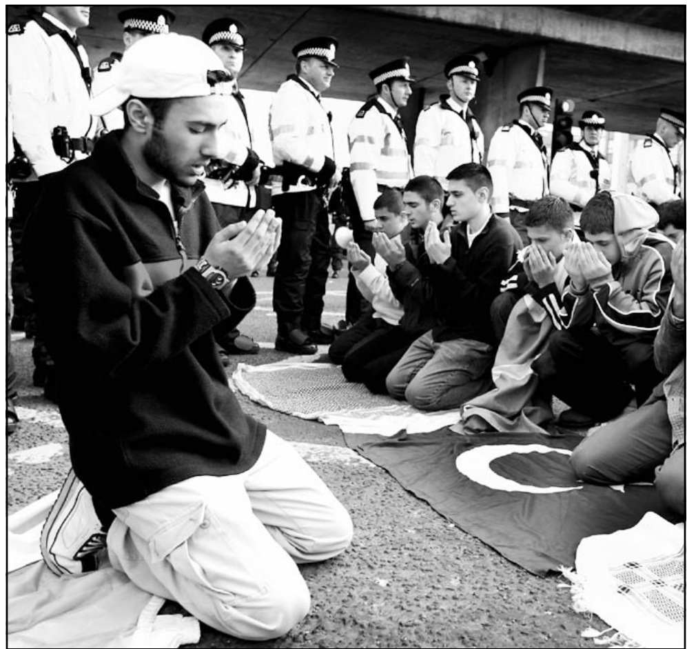
شبان مسلمون يصلون اثناء مشاركتهم في مظاهرة كبرى ضد الحرب جرت في لندن السبت

ويظهر المسلمون الذين يعيشون في المناطق التي شهدت في الاعوام القليلة الماضية اضطرابات عنصرية، مثل اولدهام قرب مانشستر، للحرب بنوع من القلق، ومع احتجاج القادة من المسلمين في الحرب واعتبار البعض بداية الحرب «يوما سودي في التاريخ»، بدا الخطاء في المساجد يوم الجمعة حزين من الحدي صراحة عن الحرب، حيث طالبوا المصلين بالدعاء والوقوف معنوياً مع اخوانهم العراقيين، فيما انتقد خطباء خيار الحرب على اخطاره دون دليل، قالوا ان الحرب لن تحل مشاكلنا طيبة على بريطانيا. وحذر المجلس الاسلامي البريطاني من اثر الحرب السلبية على العلاقات البريطانية العربية ويراقب العراقيون في بريطانيا العرب على بلادهم بمشاعر متزعزجة، فالعراقون لنظام العراقي يعبرون عن خوفهم من الحصار الذي قد تتعرض له