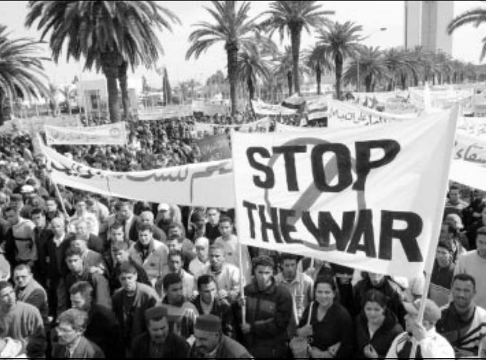
توسيون يتظاهرون ضد الحرب على العراق في تونس

تصعيد مناوشة لوقعتها او يسبب احراجا لها كما ذكر ان الجهات الرسمية حذرت خطباء الجمعة في عدد من المساجد من التطرق إلى في خيمهم إلى العدوان على العراق. فيما تحدثت مصادر من قرار مغربي اتخذ بمصادرة وتجميد الممتلكات العراقية في المغرب دون أن يتسنى التأكد من هذا الموقف المغربي الرسمي ازاء الحرب على العراق