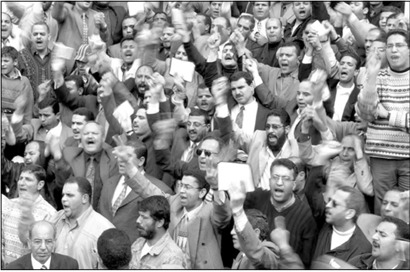
مخامون مصريون يهتفون ضد الحرب الأمريكية على العراق في القاهرة (رويترز)