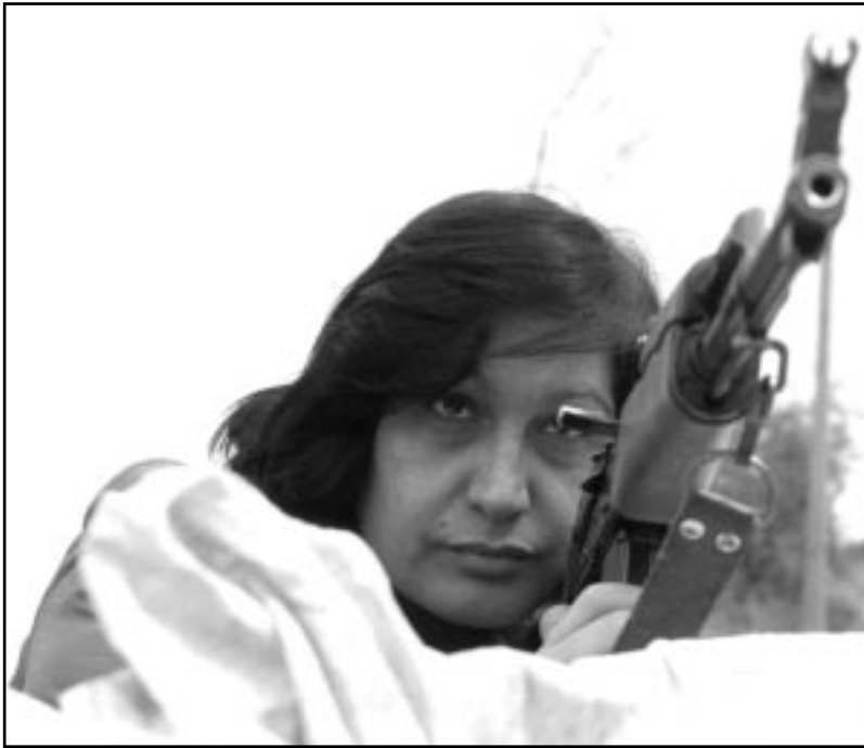
سيدة عراقية تحمل مدفعاً رشاشاً في بغداد (ا ف ب)