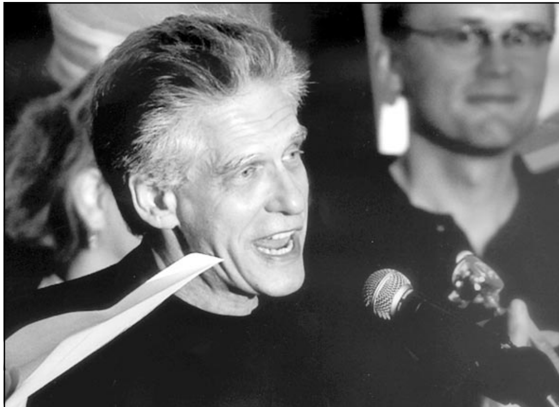
المخرج الكندي دايفيد كروننبرغ يتسلم جائزة افضل فيلم كندي على سبايدر» في مهرجان تورنتو السينمائي في شهر ايلول الماضي

سبايدر الذي يتوهم أشياء، لا يمكن الركون اليه عندما يتعلق الامر بقول الحقيقة، ولا يجوز اعطاء المزيد من التفاصيل عن الفيلم، مما يمكن التحدث براحة عن تعامل ريتشاردسون بمهارة مع ثلاثة ادوار.