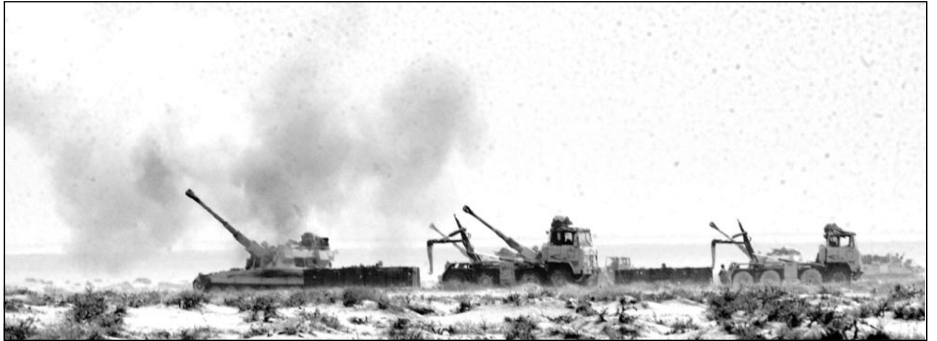
دبابات امريكية في شمال الكويت تصفح مواقع عراقية في ام قصر