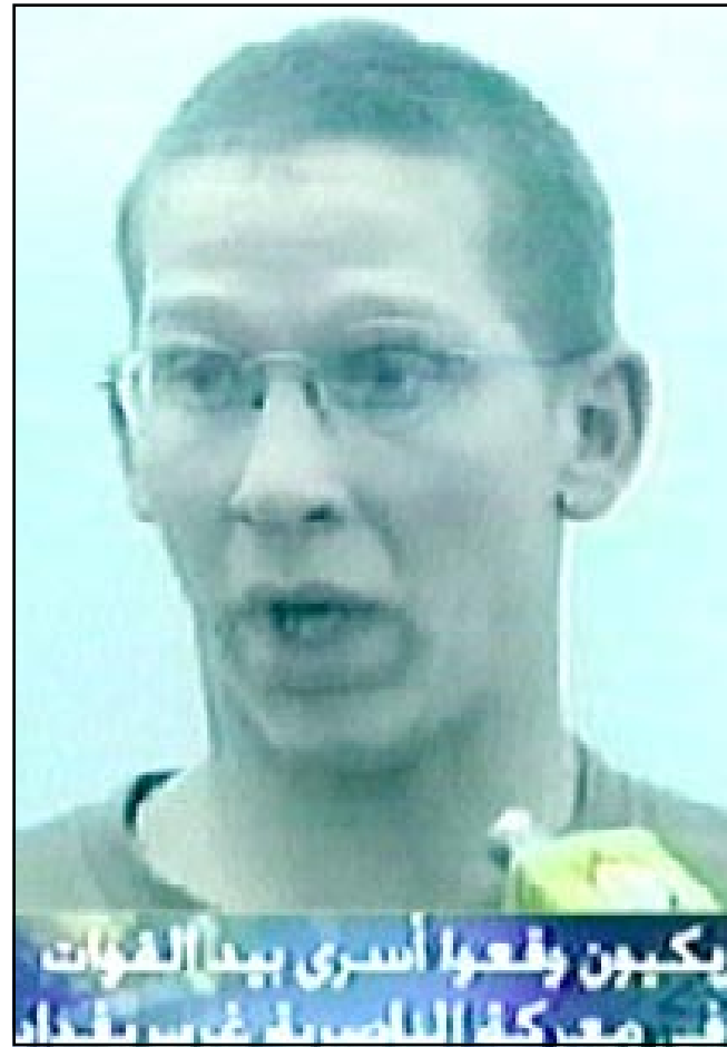
اسرى امريكيون وقعوا بايدي القوات العراقية في الناصرية امس

العراقيون لم يستقبلوا القوات الأمريكية الغازية رقصاً على انغام الدفوف، وبباقات الورود والزياحين، مثلما كان يريد مستشارو البنتاغون من العراقيين التمازكين. وهذا في حد ذاته مؤشر لمدى الورطة التي ورط فيها هؤلاء الرئيس بوش وتابعه بليز «صانحهم» وخبراتهم، العظيمة!