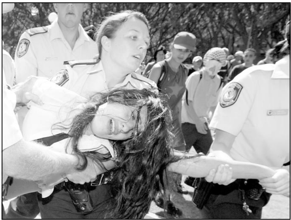
عناصر شرطة يعقلون متظاهراً في سديني أمس

التي يغنيها داريل وورلي والتي دخلت المرتبة 2 في اغاني الموسيقى الشعبية، وتحدثت الاغنية عن اثر احداث 11 ايلول (سبتمبر) وتقول «البعض يقول ان امريكا خرجت تبتت عن قتال.. حسناً.. ايها الرجل.. اقول انها خرجت كهذا.. هل نسيت شعورك ذلك اليوم» وكان المغني قد قضى فترة اعباد الميلاد وهو يعني للقوات الامريكية العام الماضي في افغانستان. ويعتبر كل مغني البوب من المعارضين للحرب، وحاولوا الحديث عن الحرب، ومن بين الاغاني الشهيرة الان في امريكا، اغنية «ميكناكب بواشنطن» واغنية «بيتلزويج علم نهب» واغنية جورج مايكل «القبير» وهي اعادة لاغنية كتبت اثناء حرب فيتنام، وكذلك يستمع الامريكويون لاغنية يوسف اسلام «ملائكة الحرب» التي تعتبر اول اغنية بوب له منذ عام 1978، وعارض مغنون كبار في موسيقى البوب الحرب، مثل شيرلي كرو، ديفيد بيرن، جي زي، ميسي البوت واوت كاست التي قامت بنشاء «فرقة الموسيقيين المتحدون للوقوف بدون حرب» في المقابل دعم كل مغني الموسيقى الشعبية التي تتحدث عن الشاعر الوطنية، والتي غالباً ما تنتشر في التجمعات المحافظة في الجنوب الحرب. ومن بين الغنئين الذين عارضوا الحرب في فيتنام كان تشارلي دايانيل الذي دعم الحرب على العراق بدون اذى منه، وتعرض مغنون كثير من اتباع هذا النوع، حجروا على معارضي الحرب من محطات الاذاعة مثل «ديسكي تشيكي»، فان اغنياتها منعت من البث في هذه الاذاعات، وتراجعت مبيعات