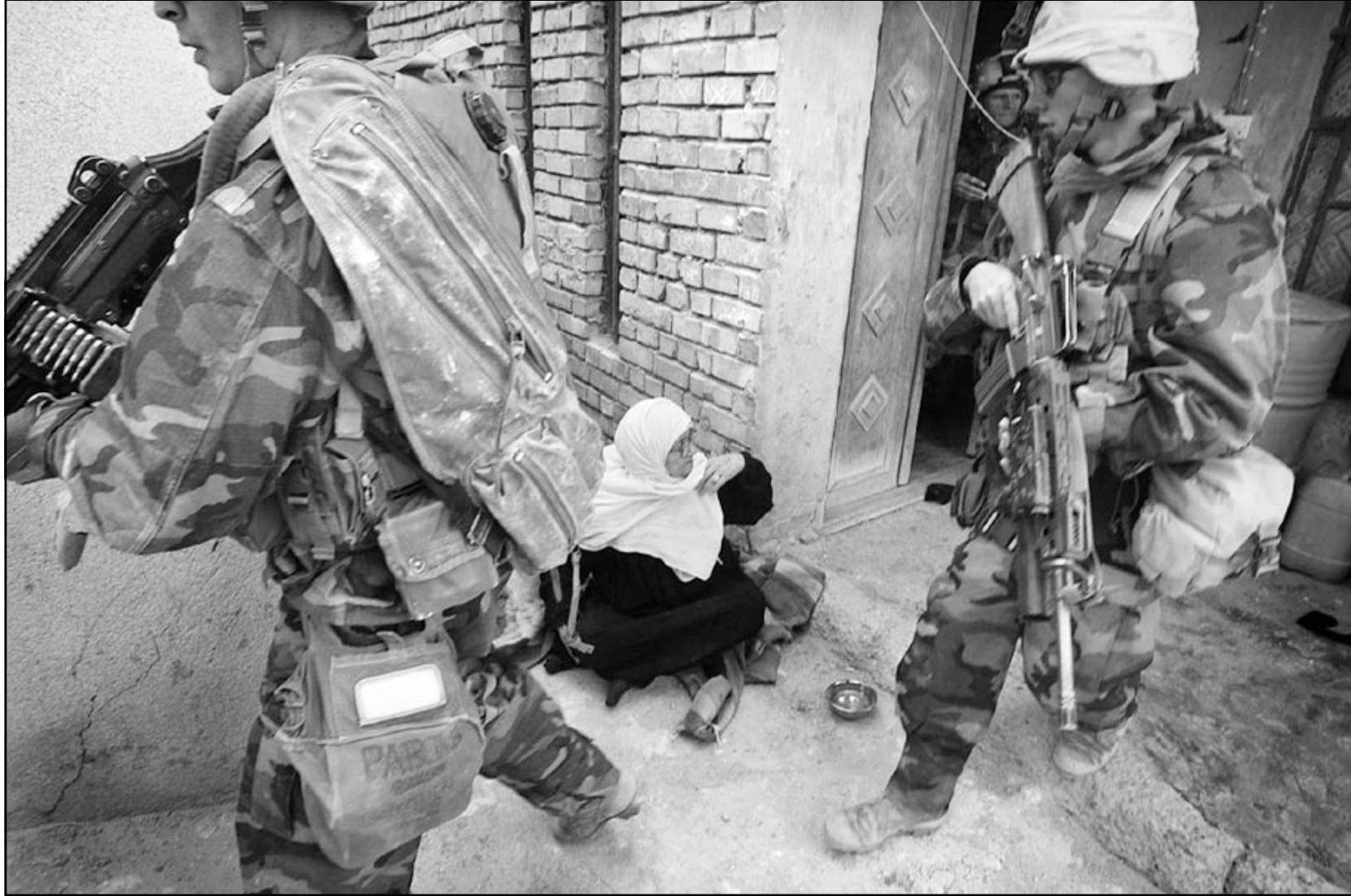
سيدة عراقية تجلس في باحة منزل اقتحمته قوة عسكرية أمريكية لتفتيشها في الناصرية أمس

غالباً كما يقولون. قد يسمى المراقب هذا انتحاراً لكنه فيه شيء من الكبرياء والإباء النابعين من هويتهم وعقيدتهم.