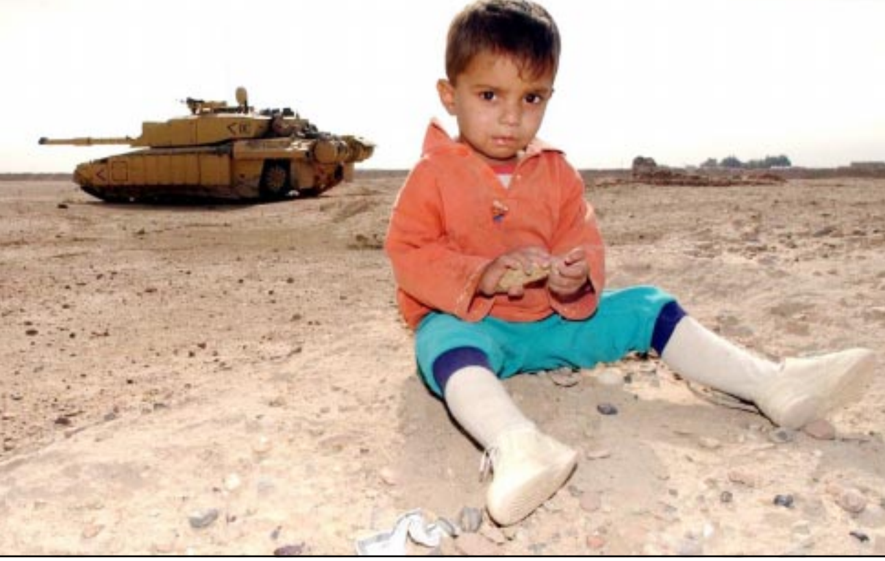
طفل عراقي امام دبابة أمريكية قرب البصرة

مزاعم أمريكية بقتل ألف عراقي قرب النجف ● قال ضابط أمريكي أمس ان القوات الامريكية قتلت ألف عراقي في الساعات الماضية في منطقة النجف. وقال الجنرال جيفرورد بلونت قائد فرقة المشاة الثالثة انه بالإضافة الى 650 عراقي الذين قتلوا في المنطقة في وقت سابق فان 250 عراقي آخرين قتلوا في حادثين منفصلين على الضفة الشرقية من الفرات، وأضاف ان مئة آخرين قتلوا على جسر على النهر. روسيا تطالب بوقف الحرب في أسرع وقت ● دعت روسيا الى انهاء الحرب ضد العراق في أسرع وقت ممكن وذلك بعد اطلاق صاروخين امس على حي شعبي شمال شرق بغداد ما أسفر عن سقوط 14 شهيداً وحوالي 30 جريحاً. وقالت وزارة الخارجية الروسية في بيان «في هذا الوضع نعتقد من الضروري ابقاء المعارك في أسرع وقت ممكن واستئناف عملية التسوية السلمية للمسألة العراقية في إطار مجلس الأمن الدولي».