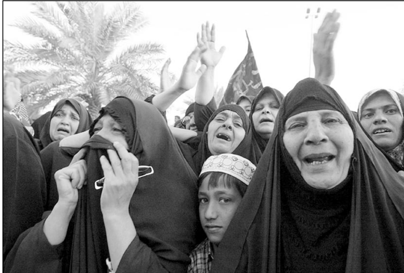
سيدات عراقيات يشاركن بطقوس اربعينية الإمام الحسين في كربلاء امس

وقد تعرض الصدر الذي يقوم الان بهما والده محمد الصدر الذي اغتيل عام 1999 حسيب يعين الاثمة، ويساعدهم ماليًا، بانه علمه بالفقه الشيعي ليس اصيلا. ويؤمن اتباع الصدر على خلاف السيستاني، بدور الامام او المرجع في الامور الدينية والدنيوية على غرار ما كان يدعو اليه اية الله روح الله الحسيني، زعيم الثورة الاسلامية الايرانية. ويطلب بعض اتباعه مرجعية عراقية دينية تحكم العراق بدلا من علماني عراقي.