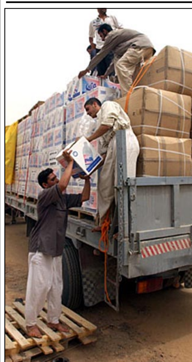
قافلة مساعدات غذائية للعراق

بروكسل - رويترز: قالت منظمة اطباء بلا حدود امس الاربعاء انه لا توجد مؤشرات على ان هناك أزمة انسانية في العراق وان الموقف هناك افضل من اجزاء في افريقيا. وقال مورتن روستروب رئيس منظمة اطباء بلا حدود الذي عاد من مهمة عمل استغرقت خمسة اسابيع في بغداد ان الاوضاع في العراق بعد الحرب لا تقارن بالوضع في دول مثل ليبيا او ساحل العاج حيث من وكالة غوث وتشغيل اللاجئين التابعة للامم المتحدة التي قالت انه لم يترتب على الحرب العراقية حتى الان سوى ظهور عدد صغير من اللاجئين.