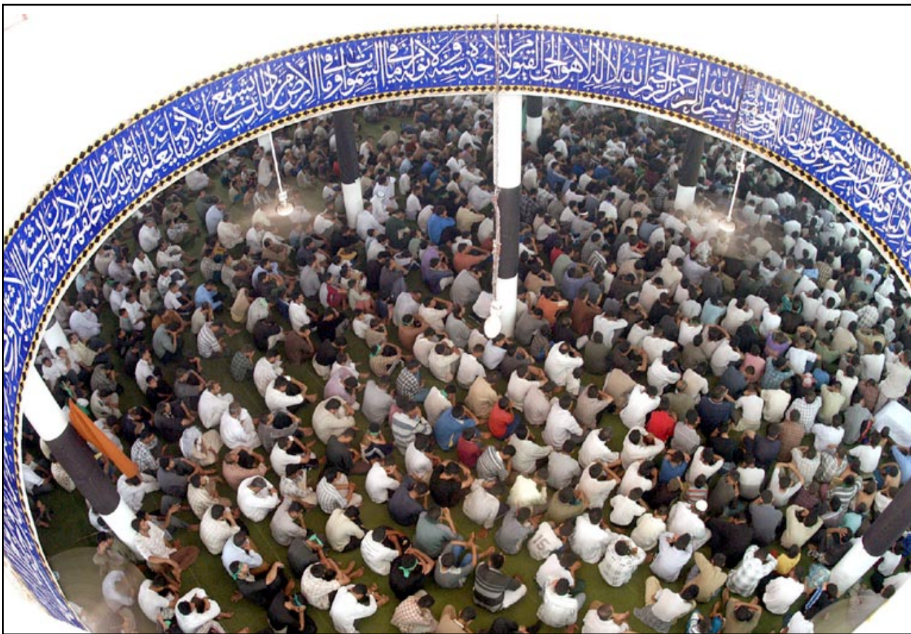
مصلون داخل ضريح الامام الحسين في كربلاء