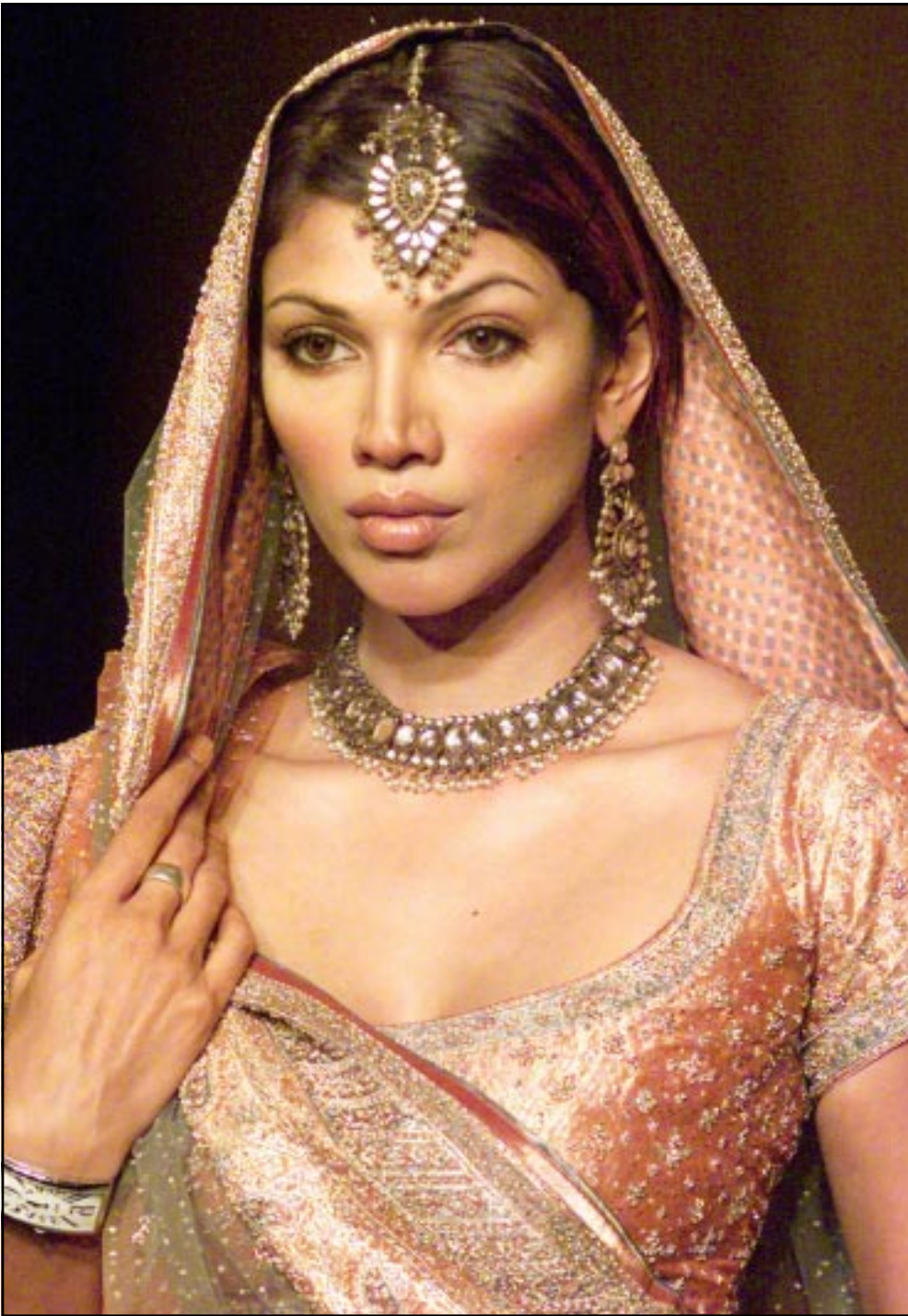
تصميم مبتكر لغفستان زفاف هندي من اعمال المصمم ريتو كورمار قدم خلال عرض اقيم في نيودلهي امس