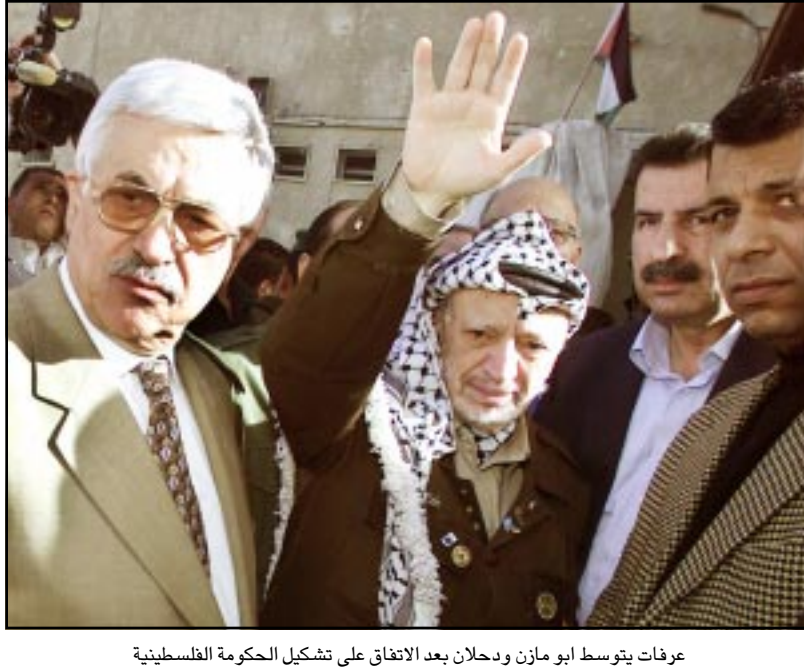
عرفات يتوسط ابو مازن ودحلان بعد الاتفاق على تشكيل الحكومة الفلسطينية