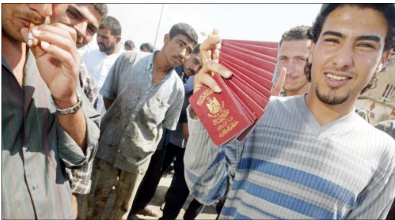
عراقي يبيع جوازات سفر جديدة وكلاشكوف في سوق ببغداد (رويتز)

■ دبي - اف ب: اعرب الشيخ حسن الصفار احد كبار الزعماء الشيعة في المملكة العربية السعودية امس الاربعاء عن الامل بان ينتهي التمييز الذي يستهدف الشيعة السعوديين بعد التغييرات الكبيرة التي حصلت في العراق المجاور. وقال الشيخ الصفار في اتصال أجرته معه وكالة فرانس برس بمزله في القطيف في المنطقة الشرقية «نحن مستمرون في اتصالنا مع المسؤولين في بلادنا، كما في السابق، لمعالجة بعض ما يشكك منه المواطنون الشيعة في المملكة من حالة التمييز المنصبي والطائفي بينهم وبين بقية المواطنين». واضاف في اتصال معه من دبي ان هذا التمييز «يتمثل في عدم السماح لهم بخدمة وطنهم في المجالين العسكري والامن، وكذلك في السلك الدبلوماسي، ومن خلال محدودية وجودهم في مجلس الشورى، وفي عدم اتاحة الفرصة لهم للتعبير عن آرائهم في وسائل الاعلام في المملكة، وفي التصييق عليهم في ممارسة شعائرهم الدينية، وفي حظر نشاطهم الديني والثقافي رسميا حيث تمنع طباعة كتب الشيعة في المملكة ودخولها الى المملكة». وكان الشيخ الصفار من بين 13 شخصية سعودية شيعية من المنطقة