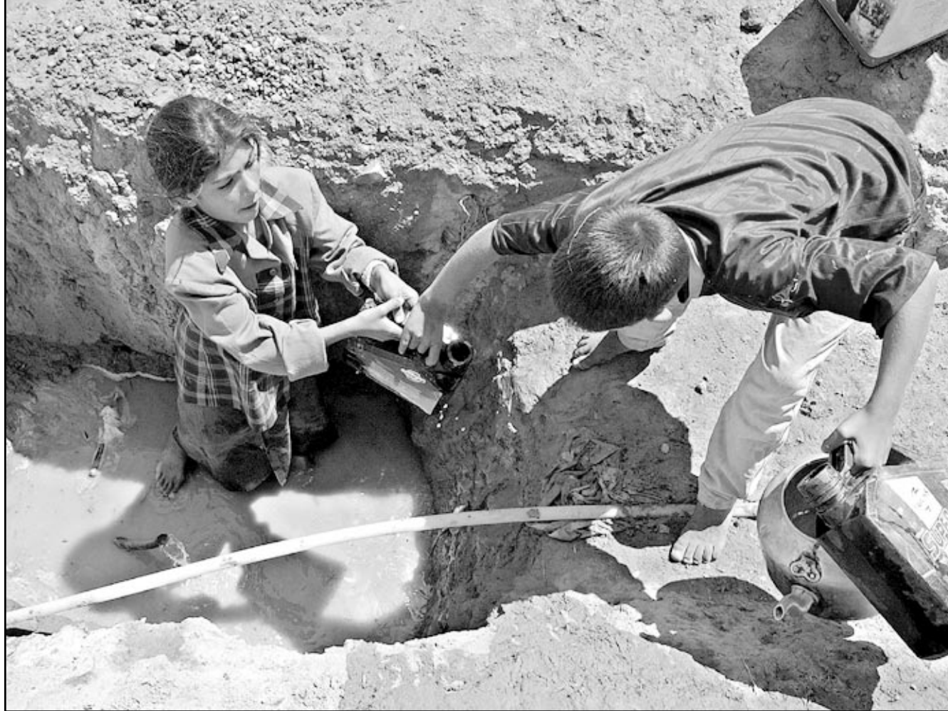
مطلان ينشلان الماء من حوض ملوث في إحدى ضواحي بغداد امس

العاصمة، ويقول محللون ان الخلاف بين الوزارتين يتركز حول الاتهامات التي تقدمها الجهات المحافظة في كلا الوزارتين عن دور الخارجية الذي يرون انه يعوق اي تحرك يقوم به جورج بوش لتطبيق اجندته العالمية، القاضية بملاحقة الارهاب، او مواجهة الدول التي تعتبر عدوة للولايات المتحدة. وكان نوبت غنغريتش الجمهوري المحافظ والناطق السابق باسم الكونغرس، واحد اعضاء لجنة المستشارين المقربين من رامسفيلد قد اتهم الخارجية في كلمة القاها امام المعهد اليميني، المؤيد لشارون «امريكان انتربرايز انستيتيوت»، ودعا غنغريتش لاعادة جدولة واصلاح للخارجية الامريكية، والقيام بفحص الخارجية بقوة عمل مكونة من دبلوماسيين سابقين في الادارة.