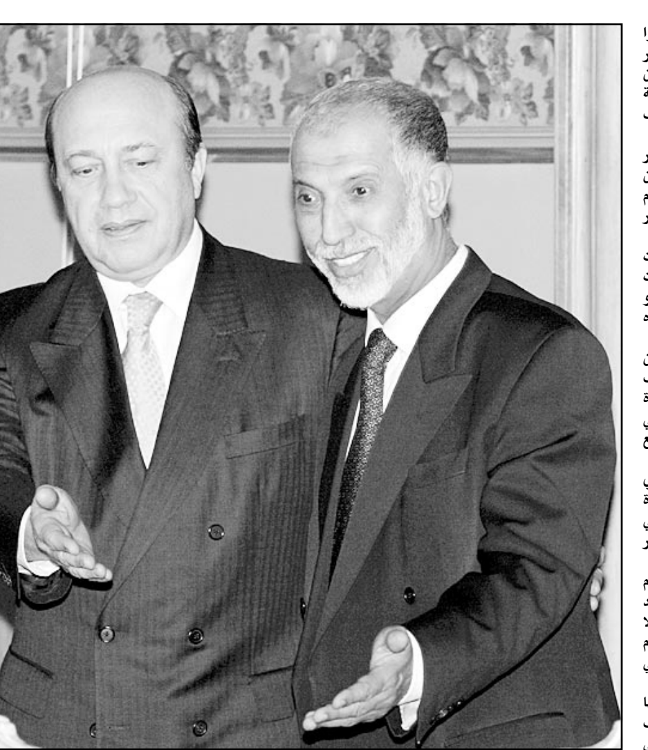
وزير خارجية الجزائر (يمين) عبد العزيز بلخادم ونظيره الروسي إيغافوف

■ موسكو - ا ف ب: دعما وزيراً خارجية روسيا والجزائر إيغافوف وعبد العزيز بلخادم اللذان التقيا أمس الأربعاء في العاصمة الروسية اللواتي المنحدة الى التوقف عن تهديد سورية.