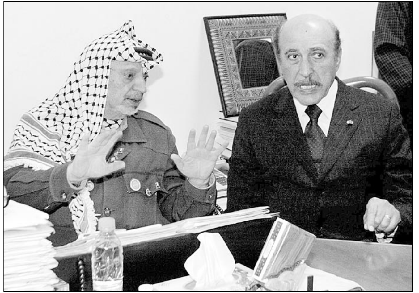
الرئيس الفلسطيني ياسر عرفات مستقبلاً اللواء عمر سليمان مع مكتبه في رام الله

رام الله - «القدس العربي» - من وليد عوض: