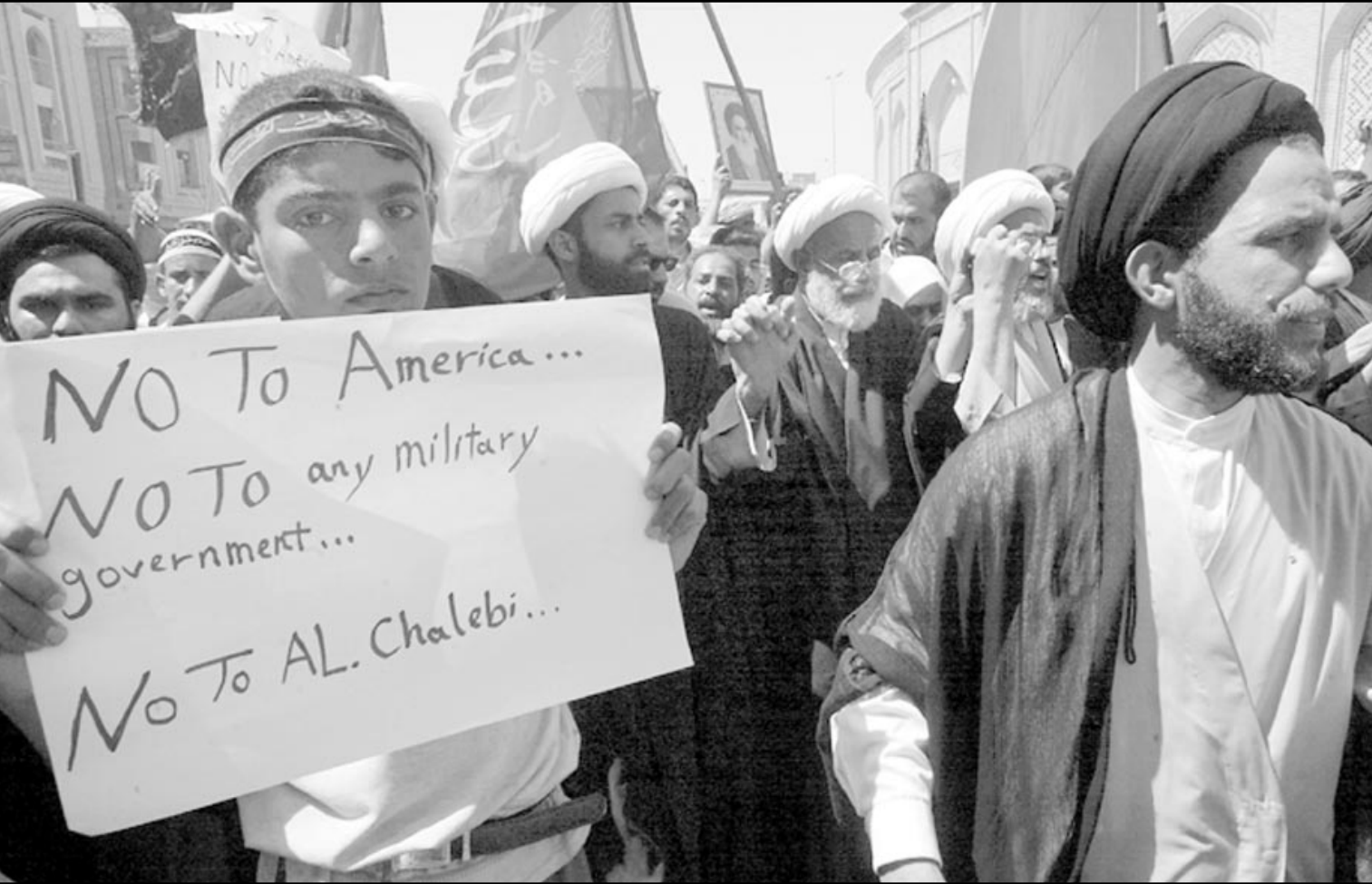
صبي يشارك في مظاهرة للشيعة في كربلاء يحمل لافتة تقول: لا امريكا ولا للحكم العسكري ولا للجلبلي (ا ف ب)

وتقول الصحيفة ان آية الله علي السيستاني ومقره النجف يرفض كثيرون من ائمة العراق النموذج الايراني للحكم الذي يبنح علماء الدين الدور الاعلى في شؤون السياسة الى جانب الشؤون الدينية وان منافسه الوحيد هو مقتدى الصدر ابن آية الله محمد موسى الصدر والذي اتهم اتباعه بالتورط في مقتل الشيخ عبد المجيد الخوئي الامام الشيعي المذموم من الولايات المتحدة. ويعتبر المجلس الاسلامي الاعلى للثورة الاسلامية من اكثر الجماعات الشيعية تنظيماً ولديه قوة عسكرية تتعدى الالاف، وطلبت امريكا من ايران اثناء الحرب الوقوف على الحياد، حيث قام مسؤولون امريكيون ببقاء عدد من المسؤولين الايرانيين وحزبهم، وطلبوا منهم عدم التدخل في شؤون العراق اثناء الحرب.