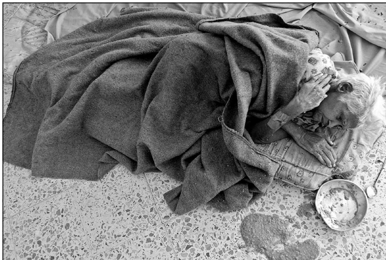
سيدة عراقية تنام على ارضية مستشفى الأمراض العقلية في بغداد الذي لم ينج من عمليات النهب