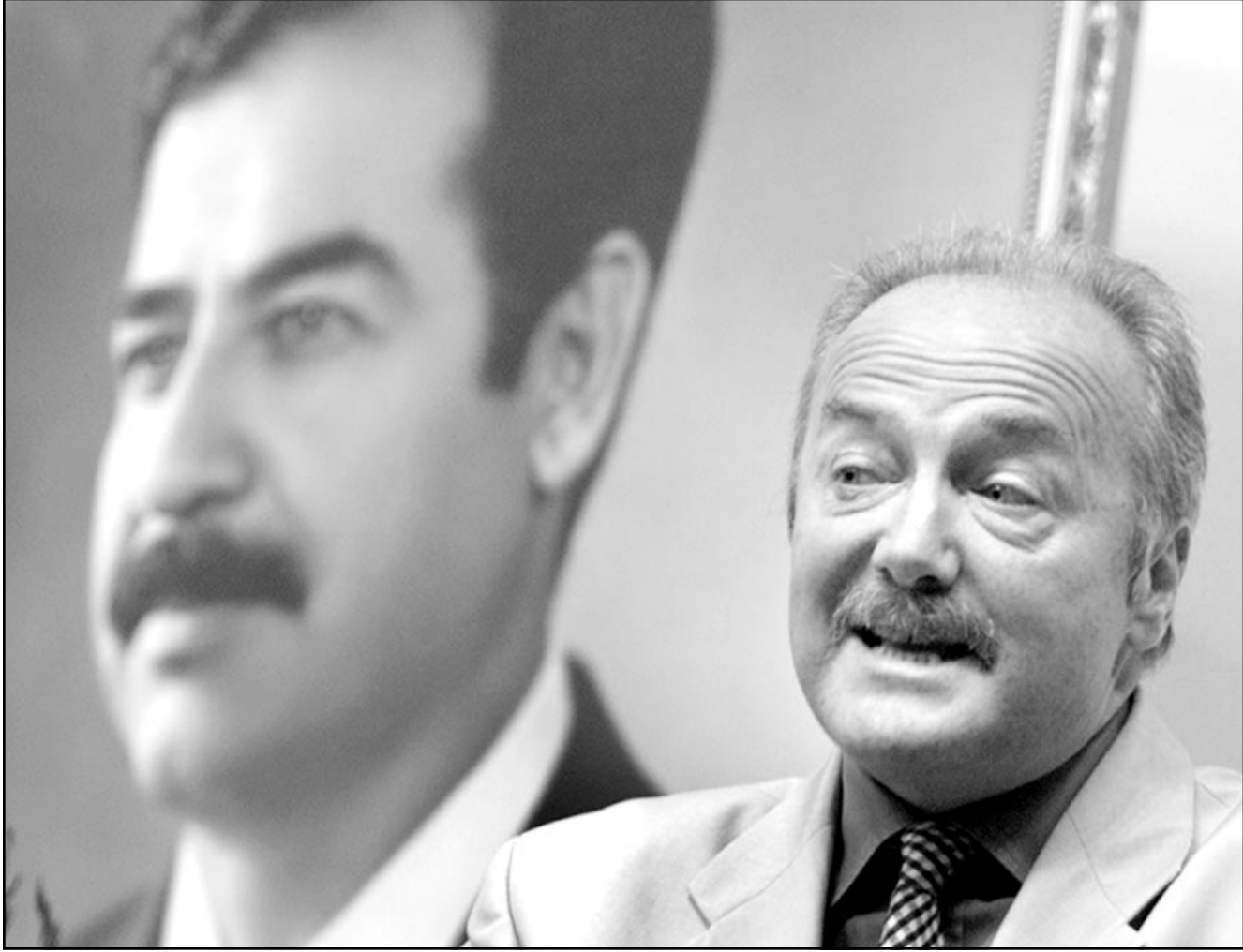
صورة من الارشيف لغالوي في العراق

وقال سيدون ان زريقات نفسه تعرض للاعتقال من قبل الخابرات اردنية طوال فترة الحرب، وتم اعتقاله بعد يوم واحد من ظهوره في برنامج «بابالامام» عندما انتقد التحالف الامريكي- البريطاني. وقال سيدون ان غالوي ليس قديساً، الا ان صوته ضروري في برلمان «يمتلئ بالحمير التي تهرز رؤوسها باحترام». وتفتق معظم التعليقات الصحافية على امكانية وجود مراسلات لغالوي، خاصة ان غالوي اعترف بكتابة بعضها، وذلك لاغراض بيروقراطية لا غير. كما تحدث عن مصادر دعم حملة مريم، وبحسب سيدون، فزريقات الذي التقى مع غالوي للدفاع عن قضية الحصار لم يكن الا متبرعاً صغيراً للحملة، مقارنة مع دول عربية. ذات علاقة جيدة مع الغرب رأت ان الحصار يضر بالعراق وبالشعب العراقي على وجه العلاقات التجارية مع النظام العراقي. ويشير محللون ان الطريقة التي تم فيها اكتشاف الوثائق من بين مئات الملفات، التي احترقت، تطرح الكثير من الاسئلة. خاصة انها جاءت من صحيفة معروفة بانتقادها للنائب غالوي الذي وجهت له الاتهامات. وعبر بعضهم عن دهشتهم من اكتشافها من بين كومة من الأوراق المحروقة في مكتب وزارة الخارجية العراقية التي تعرضت للنهب. ومراسل الصحيفة بلير، البالغ من العمر ثلاثين عاماً وخريج جامعة اوكسفورد والذي مثل الجريدة في زيمبابوي واسلام اباد يقول انه الناقد بلير وعلاقته ببوش، تظل من اكثر المواقف تشدداً.