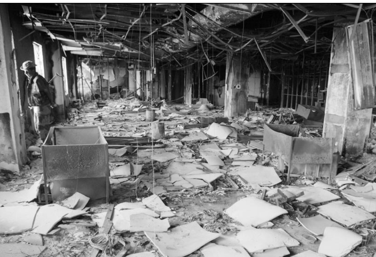
مقر وزارة الخارجية العراقية كما بدا بعد سقوط بغداد

كما انتشرت تعليقات ساخرة من جانب جمهور النادي الأهلي الساخط على فريقه، الذي كان قريبا من الفوز بدرع مسابقة الدوري الكروي قبل هزيمته، تصف لاعبي الأهلي بانهم «علوج» وكتب بعض مشجعي فريق الزمالك الفائز على جدران في أحياء شعبية تعبيرات تقول «علوج الأهلي انهزموا»، وهم الآن ينتحرون» في