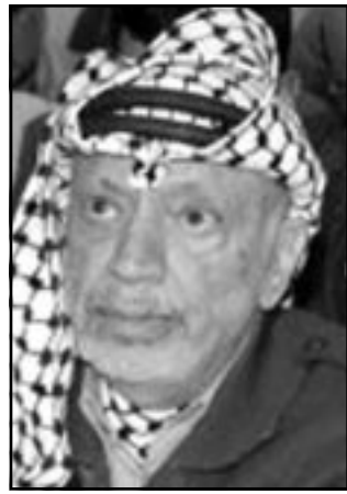
الرئيس ياسر عرفات

الغربية زارة ليس، اصوات انهيار وتحطم فرصة أخرى سانحة. ذلك لأن عرفات لم يخطط ابدا بأن يكون رئيس الوزراء الفلسطيني أكثر من ممثل له على وجه البسيطة، ولو لم يكن الامر كذلك فلماذا اصغر على تقليص صلاحيات محمد حنانيا؟ ولماذا سارح الى انشاء مجلس أعلى للامن القومي للسيطرة على ثلاثة أو أربعة من الأجهزة الامنية الهامة؟ وبماذا تعنى الاتهامات اللفظية المتبادلة بينه وبين أبو مازن؟ عرفات يعتقد ان أبو مازن يستطيع ان يكون رئيس وزراء حسب النموذج القائم في الدول العربية طالما يريد في هذا المنصب، مئة مثل على أبو الراءف في الاردن وعاطف عبيد في مصر. موظفين تنفيذيين كبار لارادة القائد الحقيقي. ومن اعتقد ان انقلابا قد حدث في بلاط المقاطعة، وانه العائق الذي يخلق طريق السلام قد زال أخيرا، من الأفضل له أن ينكر ان من الضروري اقامة دولة فلسطينية من أجل التوقيع على اتفاق سلام مع الفلسطينيين من عرفات. وذلك حتى تقوم هذه الدولة وليس منظمة التحرير الفلسطينية بالتوقيع على ذلك الاتفاق. وطالما بقيت منظمة التحرير الفلسطينية هي الجسم التقني المعترف به سيواصل عرفات توزيع الأوراق. لشدة السخافة واللامنطق، اسرائيل تعترف بالحكومة الفلسطينية ورئيسها، ولكنها لا تعترف بعد بالدولة الفلسطينية، ولكن العملية السياسية ستواصل في الواقع الانخاف على عرفات تماما مثلما تلتف على شارون حيث يراهن كل واحد منهما ورفيقه بأن العملية ستواصل المواجهة في المكان، أهلاً وسهلاً بك يا كولين باول.