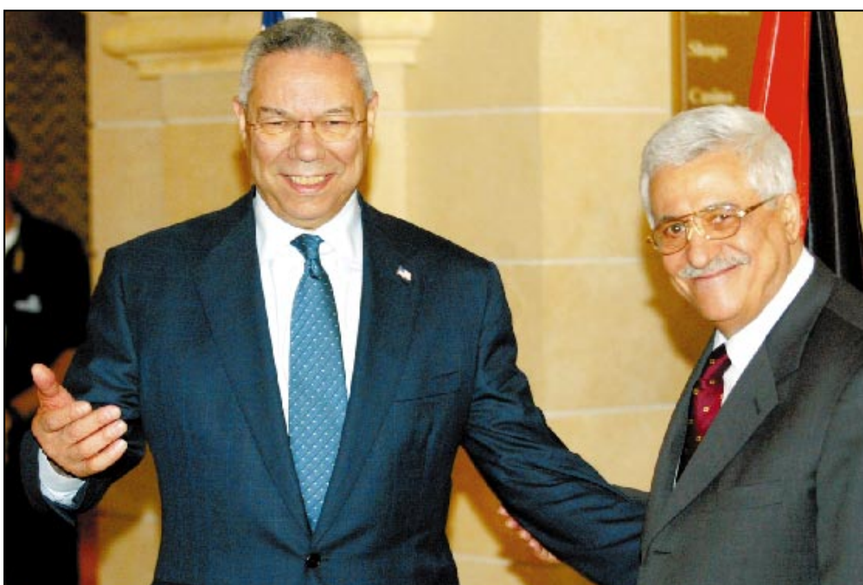
رئيس الوزراء الفلسطيني محمود عباس مستقبلا وزير الخارجية الامريكي كولن باول امس

وقالت وسائل الاعلام الاسرائيلية ان حكومة شارون اشترطت ذلك تنازل الفلسطينيين عن حق العودة، لكن باول رد قائلا ان هذه القضية يمكن بحثها في مرحلة لاحقة أثناء المفاوضات الثنائية.