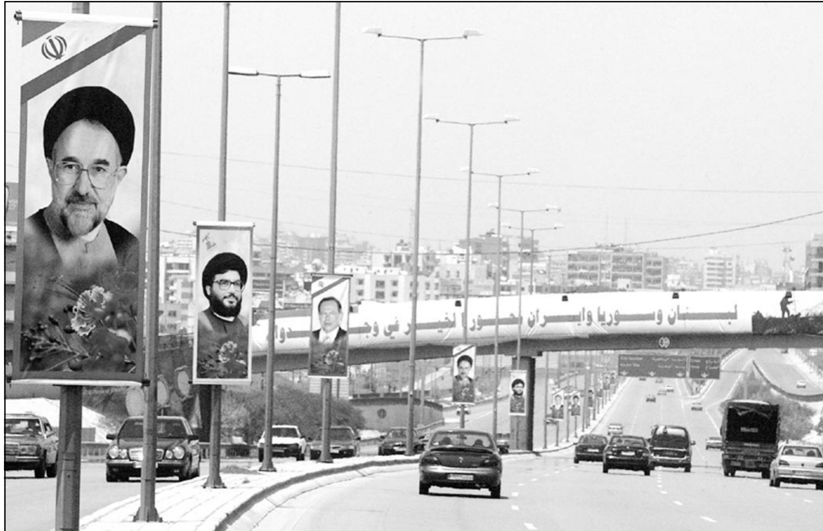
شعارات في بيروت تحث بزيارة الرئيس الايراني محمد خاتمي الزعامة اليوم للبنان

ويحسب صحيفة «نيويورك تايمز»، رفض تجريد حزب الله من اسلحته وان الولايات المتحدة بعثت بعد الحادي عشر من ايلول (سبتمبر) عام 2001 برسائل الى الحزب تعرض رفعه من قائمة الجماعات الارهابية، وتزويده بمعونات اقتصادية مقابل وقف النضال والتعاون سرا معها ضد الجماعات الارهابية وان ذلك مرفوض من قبل الحزب ايامها كما هو مرفوض اليوم.