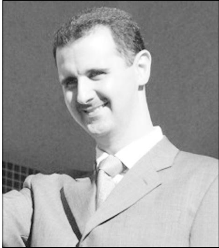
الرئيس السوري بشار الاسد

«القدس العربي»: أكد الرئيس السوري بشار الاسد ان سورية سمحت لعائلات قادة عراقيين في نظام صدام حسين السابق بدخول سورية خلال الحرب الامريكية-البريطانية على العراق لكنها لم تسمح بدخول القادة انفسهم. وقال الرئيس السوري في حديث لصحيفة «واشنطن بوست» ومجلة «نيوز ووك» امريكيتين نشرته الصحف اللبنانية: «جاء بعضهم (القادة العراقيون) الى الحدود ولم يسمح لهم بالدخول. قبض الامريكيون على البعض». واضاف «سمحتنا لبعض العائلات من النساء واطفالهن الى سورية. ولكن تملكنا الشكوك في شأن بعض اقارب الذين كانوا في مناصب عليا في الماضي وسؤؤلون عن قتل اشخاص في سورية في الثمانينات». وأكد الاسد ان سورية «لم تكن مقربة من صدام حسين وليس لها سفارة في بغداد». وقال «لم نلق مطلقا ولم اتكلم معه على الهاتف. كانت لنا علاقات اقتصادية بالعمالة». ونفى ان تكون السلطات السورية قد سمحت بمرور اسلحة للعراق عبر سورية. وقال «الاسلحة مررها افراد ولم يكن للحكومة اي علاقة بذلك». وعن مكاتب الجماعات الفلسطينية في دمشق، قال الاسد ان سورية طلبت من