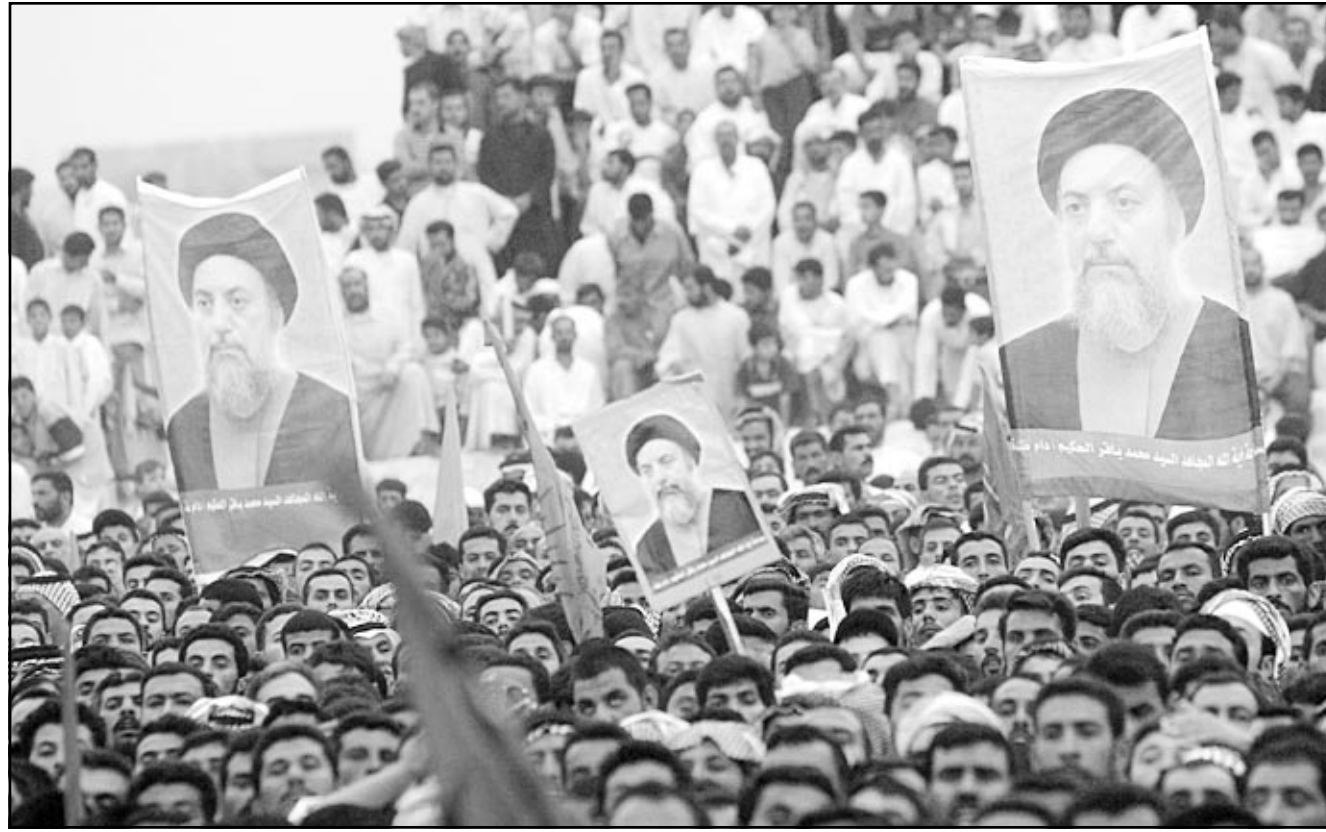
عراقيون يحملون صور السيد محمد باقر الحكيم في مظاهرة بالناصرية