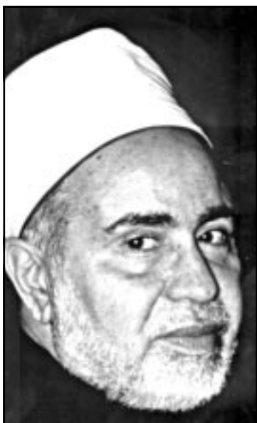
شيخ الازهر محمد سيد طنطاوي

ويتهمونني بانني «واخذ فلوس من الكويت او متزوج من كويتية»، كما قال امام و شيخ السنة شيخ الازهر، ولهذا ارجو من سعد ان يقرر موقفي ويعذرني ان اشرت مضطرا ودفعا للثمة التي اقصيدة في «الاسبوع» لاحمد قابيل تحت عنوان «التي التهججين على عمرو موسى»، وقال فيها: يا اياها الخرافي يا وقت جوار الهرب تدم ضئلا فلا تقل لعمرو موسى رمز المصرية عيلا ولا تهاجوا رمزا لن ينفكي لكم غلبا تستمدون قوتكم في الهجوم عليه تحت حماية دخيل ما موقعك في الاعراب ثرثرة ديوانية ام نار خبر؟ يا اخ العرب ان كان لا يروق شعوبنا فك شاكرا تهاجون مصريا ايا كان فتمتحت ابواب السعي تألمون ويحرسكم اجنبي فاشبع يصنع شخيرا بطون علت وادراف اعرضت وزفيرك تغيرا فيقعدا لك عاصمة الخلافة وتضحكون تحقرا يا اهل الكف كفكم تشفي فامو لكم لا تكفي لتصنعوا تاريخا فصحب عمرو موسى فكر واعلا ومضونا يا بكلمك من ريب بيت يفكر المستحلا تتشرعن الان انكم فتمتحت عكا وهو عليكم وبلا صبرا جيلا يصعب علينا ان نتصلح لا اولا ولا اخيرا.