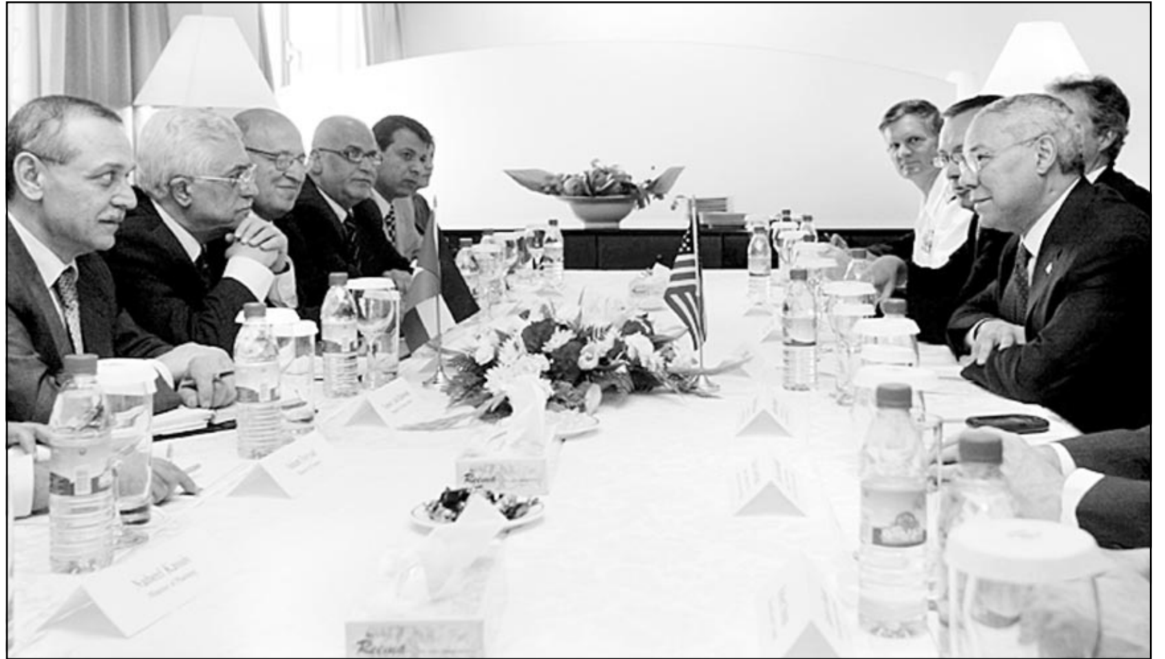
باول ومحمود عباس يترأسان جلسة المباحثات