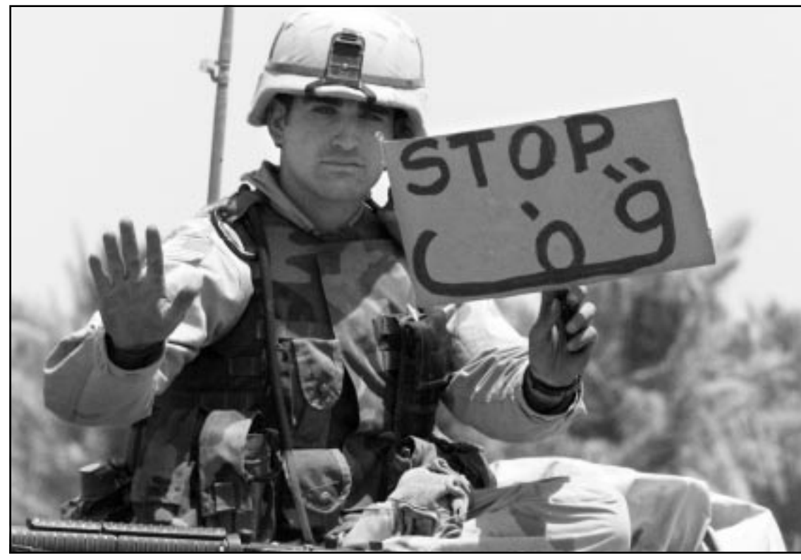
جندي امريكي ينظم حركة المرور في بغداد

الحديث مع، بل ويروجون الاشاعات عنه، ويعضهم يريد قتله.. ويقول حقى انه توقف عن كتابة الشعر قبل عقد من الزمن، بعد ان قتر حماسا كويتا بعد صدام، خاصة عندما احتل العراق، ويقول حقى، «قد يظن الناس اني اتحدث الان لابرئ نفسي، من ذلك فقد كنت اقول ان بناء القصور في الوقت الذي كان الشعب فيه يجمع امر خطأ.. اما الان فقد دفع الشمن، ويشير حقى الى اثار الدماء التي تركها اعتداء عليه عندما هاجمته مجموعة قاتلة «ابن الاخخاص العراقي، وهذه الذنب كانوا يجمونه»، وحصلت امام بيته معركة استمرت عشر دقائق، حيث تعرض فيها عدد من المهاجمين للجرح، ويقوم سقيبه بالمساعدة في حمايته، ويحاول تخفيف التوتر الذي يعاني منه، بالقاء عدد من النكات، عن عمليات النهب التي تدور في بغداد. وعلى الرغم من احتسارمه للرئيس العراقي صدام حسين الا انه يحمل كراهية لنجله عدي الذي يعتقد انه لم يقدم للبلد الا