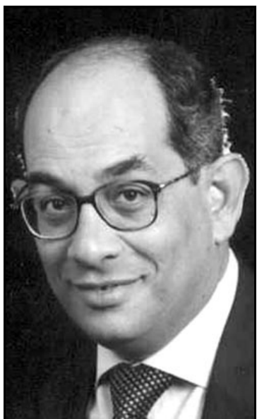
يوسف بطرس غالي