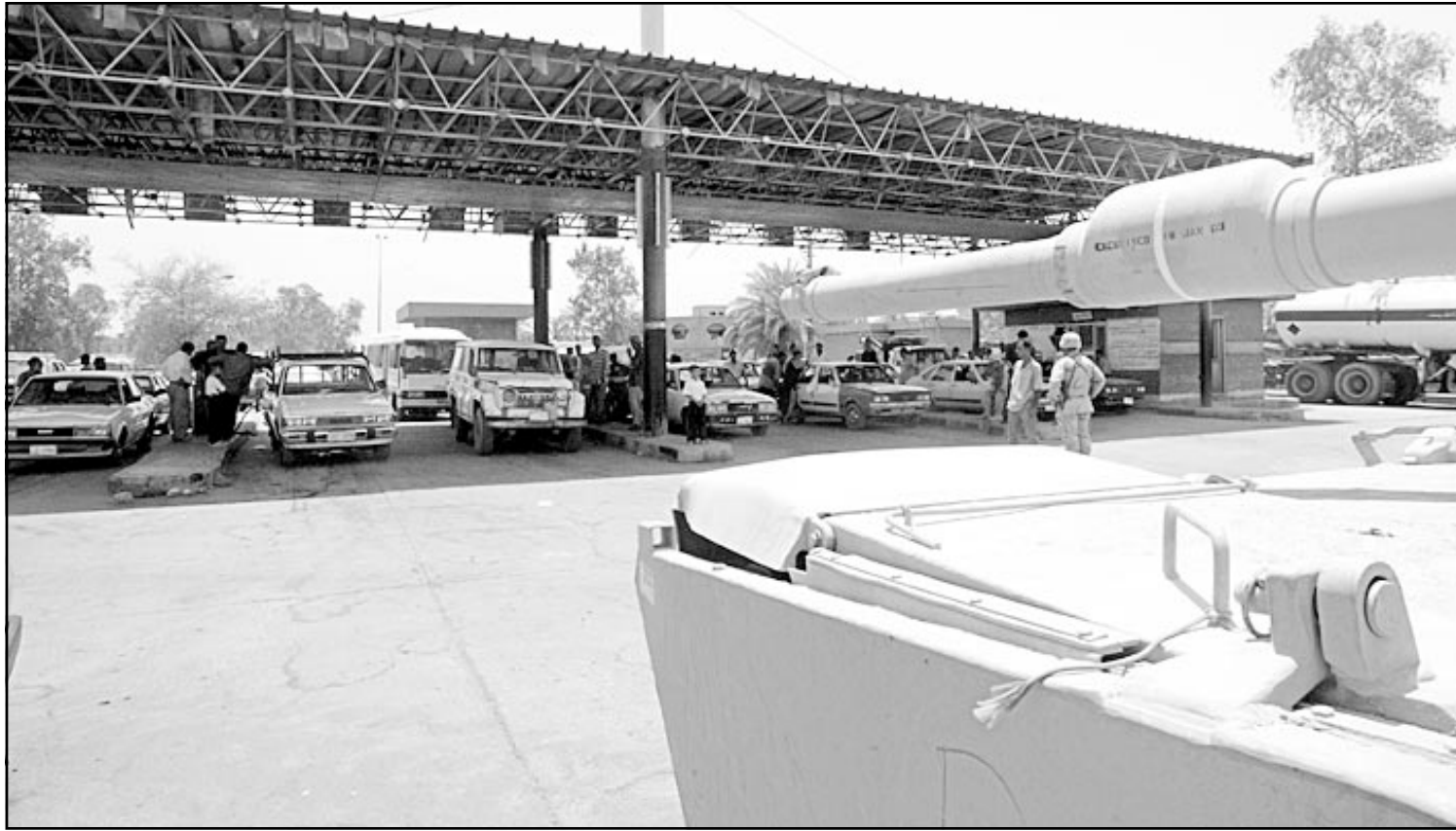
دبابة امريكية تنقل في محطة وقود في العاصمة العراقية بغداد، التي تعاني من نقص في وقود السيارات منذ الاحتلال الأمريكي البريطاني للبلاد

وقال «نأمل انه خلال يونيو ستجاوز طاقة التكرير في العراق 500 الف برميل يوميا، وسيتم ان مع ذلك تجاوز انتاج النفط مليون برميل يوميا».