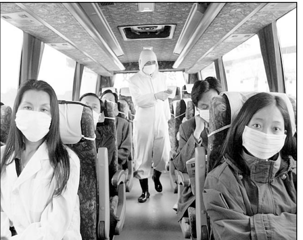
عامل طبي يفحص مسافرين على متن حافلة في الصين للتأكد من عدم اصابتهم بمرض «سارس» الذي أدى الى انخفاض حاد في حجوزات السفر والفنادق في جميع انحاء العالم

الاتهاب الرئوي شكل سببا لاختلاص للسفر. وقالت مجموعة «امادوس» العالمية للسفر الاسبوع الماضي ان الحجوزات في كافة انحاء العالم انخفضت بنسبة 16 % في الاسبوع الثلاثة الاولى من نيسان (أبريل) مقارنة بالفترة نفسها من العام الماضي بسبب مخاوف من انتشار المرض. وقد انخفضت حجوزات السفر الى بلدان اسيا الاكثر تضررا بهذا المرض بنسبة ستين بالمئة حسبما ذكرت شركة امادوس التي تتخذ من مدريد مقرا لها وتدير ثاني اكبر نظام عالمي لحجوزات الطيران. وقالت الوكالة الدولية للطيران والسفر التي تضم حوالي 280 شركة طيران تمثل اكثر من 95 % من شركات الطيران العالمية، ان الخوف من الطيران سيستبب في خسارة قطاع الطيران والسفر الذي يعاني من مشاكل، حوالي عشرة مليارات دولار (8,9 مليار يورو) في 2003. وكانت خطوط الطيران في اسيا الاكثر تضررا. فقد انخفض عدد الركاب على خطوط «كاتي باسيفيك» في هونغ كونغ حوالي 75 % مقارنة مع الفترة نفسها من العام الماضي بينما انخفض عدد الرحلات نحو 45 %.