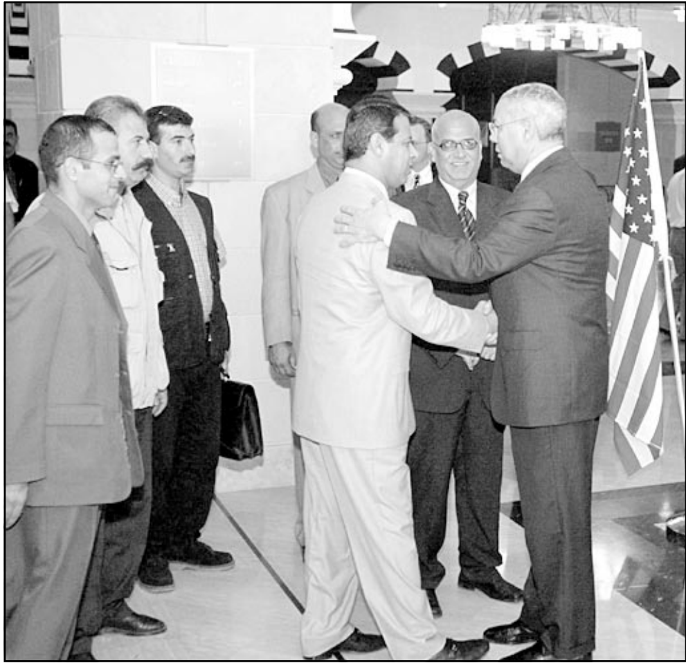
باول يصافح العقيد محمد دحلان بيهو فندق كوتيننتال