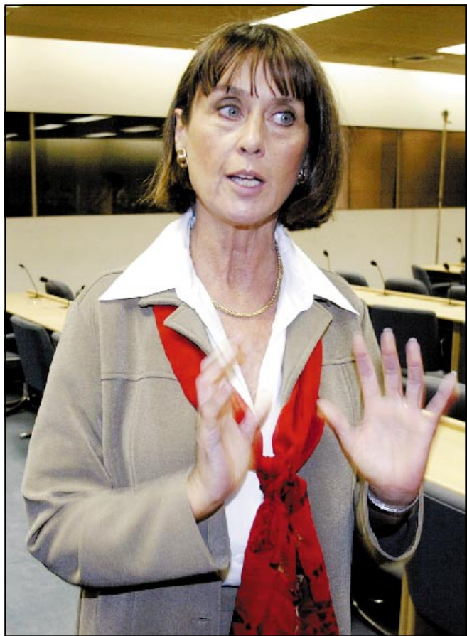
السفيرة الامريكية باربارا بودين المنسقة السابقة لوسط العراق

وانحل حزب البعث فعليا منذ ان اقتحمت القوات التي تقودها الولايات المتحدة بغداد واسقطت صدام حسين في التاسع من نيسان (ابريل) الماضي. وقال فرانكس ايضا ان الاجهزة الامنية الخفيفة لحكومة صدام لم يعد لها أي سلطة، ولكنه شدد على ان الاحزاب السياسية التي لم تحض على العنف سيسمح لها بالمساهمة في الحياة السياسية في عهد ما بعد صدام. ويبلغ عدد اعضاء حزب البعث في العراق نحو ثلاثة ملايين عضو. على صعيد آخر وجهت رسالة خطية ثالثة لفرانكس في رسالة تليبت بالعربية عبر اذاعة تديرها الولايات المتحدة تبث في العراق «تم حل حزب البعث الاشتراكي». وازدادت الرسالة «اي شخص يمتلك وثائق تخص حزب البعث او الحكومة العراقية لا بد ان يصون هذه الوثائق ويسلمها للمتحالف».