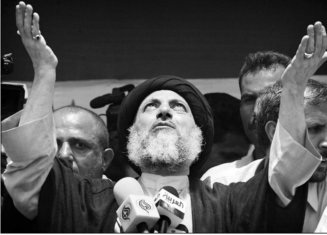
الحكيم يخاطب آلاف الشيعة الذين حضروا لاستقباله في الناصرية

كان متواجدا فيه في افتتاح العمليات الجوية، سيهيب الجواء لظهور جنرال سني يقود الرحلة بعد صدام الطلبة عليها عام 1979 حيث احتج كاخد الرهائن، ومن مسؤولون في ادارة الخارجية والخبارات المركزية الأمريكية ان الجليبي العائد من الخارج لن يكون قادرا على مواجهة جنرالات الجيش الذين يتنمون الى السنة، ولدى عدد من اعضاء الادارة الامريكية اعتقاد بضرورة بقاء التركيبة السياسية السابقة مع تغيير الوجوه والابقاء على الشيعة تحت السيطرة خشية دخول ايران على الخط.