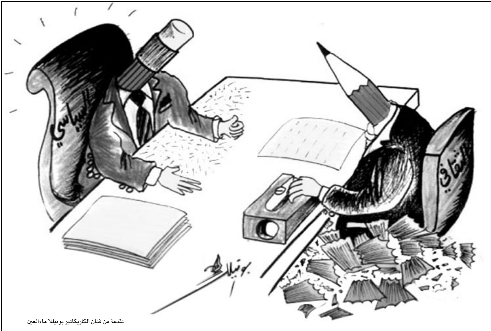
تقدمة من فنان الكاريكاتير بونيللا ماء العين