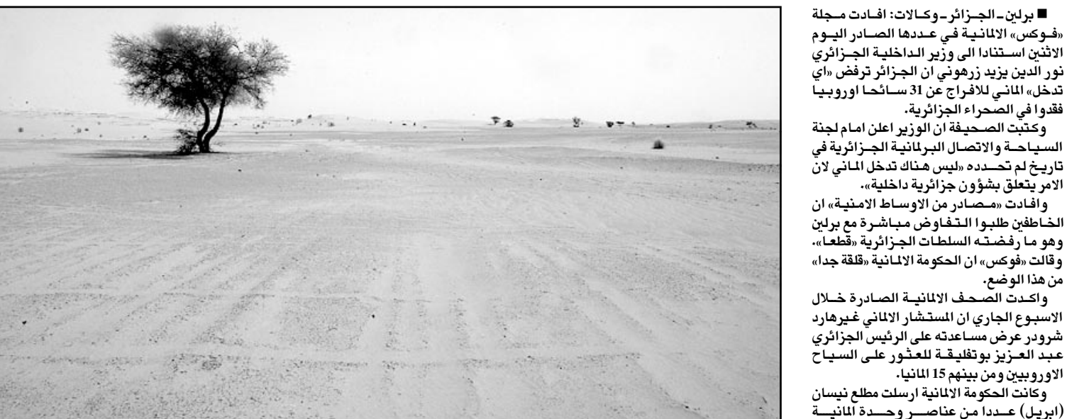
الصحراء الجزائرية قرب اليزي حيث تاها السياح ال31

بعدات للرؤية الليلية. وتشهيه الحكومة ومصادر دبلوماسية ان محتجزو السياح هم عناصر اسلامية متشددة او عناصر محلية مرتبطة بالمعاملات بها. وتشير بعض تقارير وسائل الاعلام الى ان «الجماعة السلفية للدعوة والقتال»، ربما تكون مسؤولة عن عمليات الاختطاف. ولكن ريتشارد لايبيغفيسر الصحافي والمؤلف الفرنسي السويسري الذي كتب في مجلة «هيبو»، قال ان السياح محتجزون لدى زعيم مجموعة اسلامية اسمه مختار بلخضار، وهو معروف جيدا لسلطات الجزائرية ويعمل ايضا في تهريب السيارات والسلاح والسجائر. حسب مزاعم الصحف المحلية. وقال لايبيغفيسر ان الرهائن محتجزون في ثلاث مجموعات في جبال تاملوكيد على بعد 1800 كيلومتر جنوب العاصمة، وليس معروفا من اين اسقلى لايبيغفيسر معلوماته.