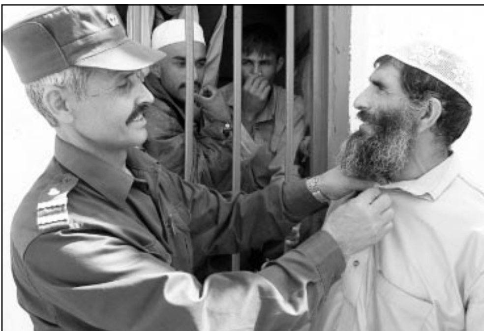
جندي افغاني يحضر معتقلا كان في كوربا للافراج عنه بعد استلامه من الامريكيين

واوضح الجيش الامريكي ان الجنود الافغان اقربوا ليليا للمنطقة المنطقتا عندما احمدهم برصاص العدو. وبعد الفجر بقليل واقتت وحده من القوات الخاصة الجنود الافغان في داخل المزرعة. واكد البيان «عندما كنا نقوم بعملية التفتيش خرج اثنان من الاعداء من احد المباني واطلقا النار من سلاح خفيف واصابا جنديا امريكيا بجروح قبل ان يقتلا». واضاف ان القوات الخاصة الامريكية والافغانيتين انسحبت من المنطقة لنقل الجرحى الذي تلقى الإسعافات الأولية في قاعدة ساليبرنو (شرق) ثم نقل الى قاعدة باغرام على بعد اربعين كلم شمال كابول حيث ادخل المستشفى. وتدخلت الطائرات والرومحويان لتقصف المزرعة، مما أدى الى جرح اثنان ومقتلي العدو ومقتل بقية افراد المجموعة».