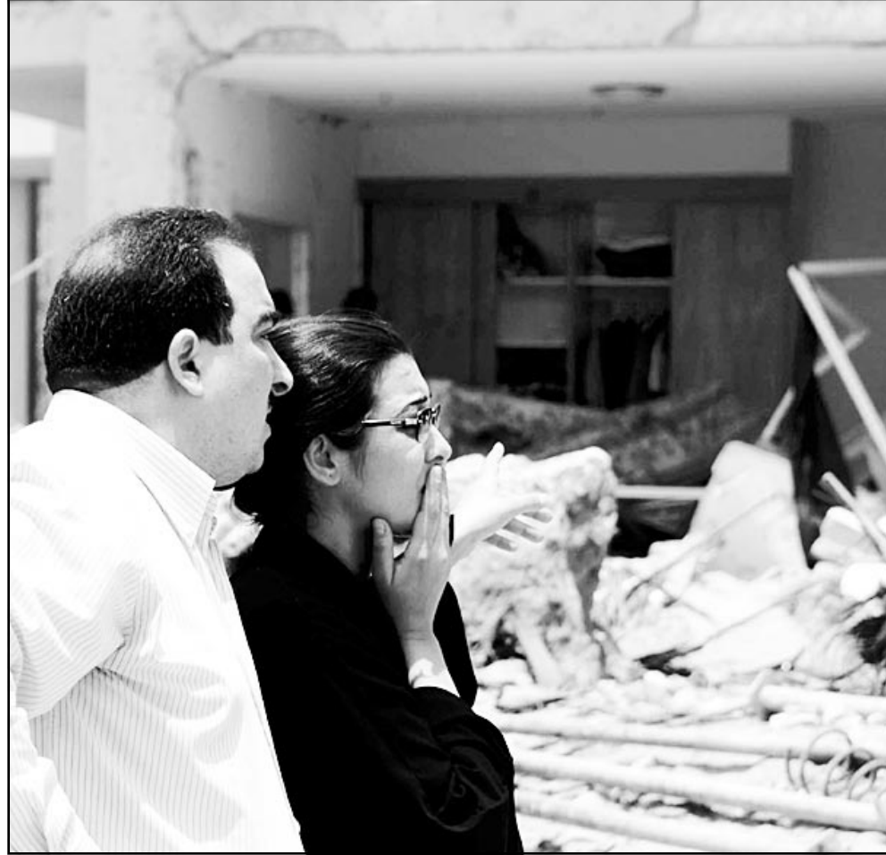
لبنانيان يبيحان عن صديق لهما كان بين سكان المجمع في الرياض