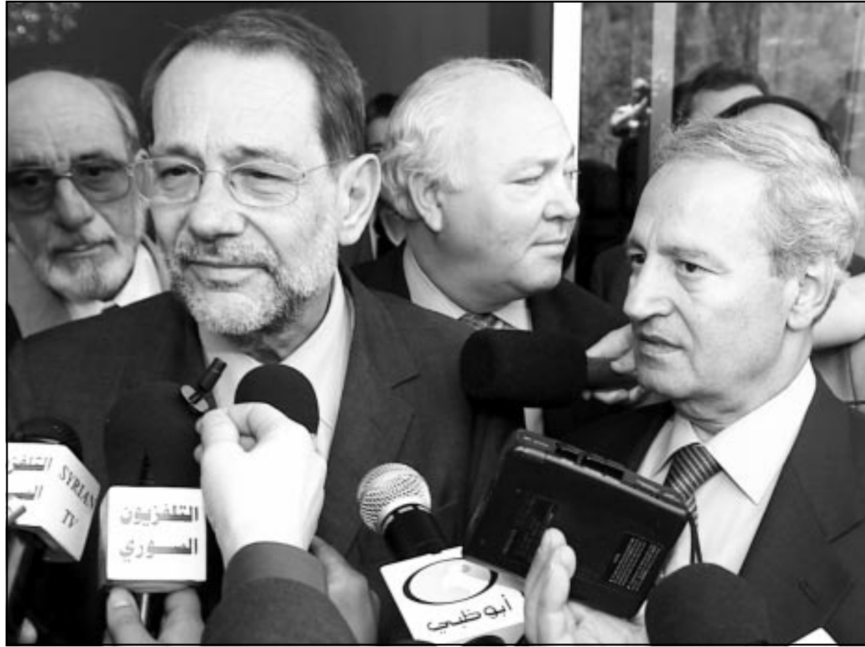
الشرع وسولانا يتحدثان للصحافيين في دمشق أمس

■ غزة - «القدس العربي» - ا ف ب: احيا عشرات آلاف الفلسطينيين في قطاع غزة أمس الخميس ذكرى «النكبة» التي حلت بالفلسطينيين قبل 55 عاماً مع قيام دولة اسرائيل في 1948، مؤكداً على حق العودة الى بلدانهم التي هجروا منها، على ما افاد مراسل وكالة «فرانس برس». وانطلقت تظاهرات عدة في انحاء مختلفة من قطاع غزة وتلبية لدعوة اللجنة العليا للوقاية والاسلامية، وكان اكبرها في مدينة غزة التي يشارك فيها أكثر من عشرة آلاف شخص، بينهم مئات النساء والاطفال. ورفع المظاهرون لافتات حملت عبارات تشدد على حق العودة للاجئين الفلسطينيين، ومنها «حق العودة مقدس» و«لا بديل عن قيام الدولة الفلسطينية المستقلة وعاصمتها القدس»، وردد المشاركون في التظاهرة هتافات تدعو الى مواصلة الانتفاضة والمقاومة «حتى زوال الاحتلال».