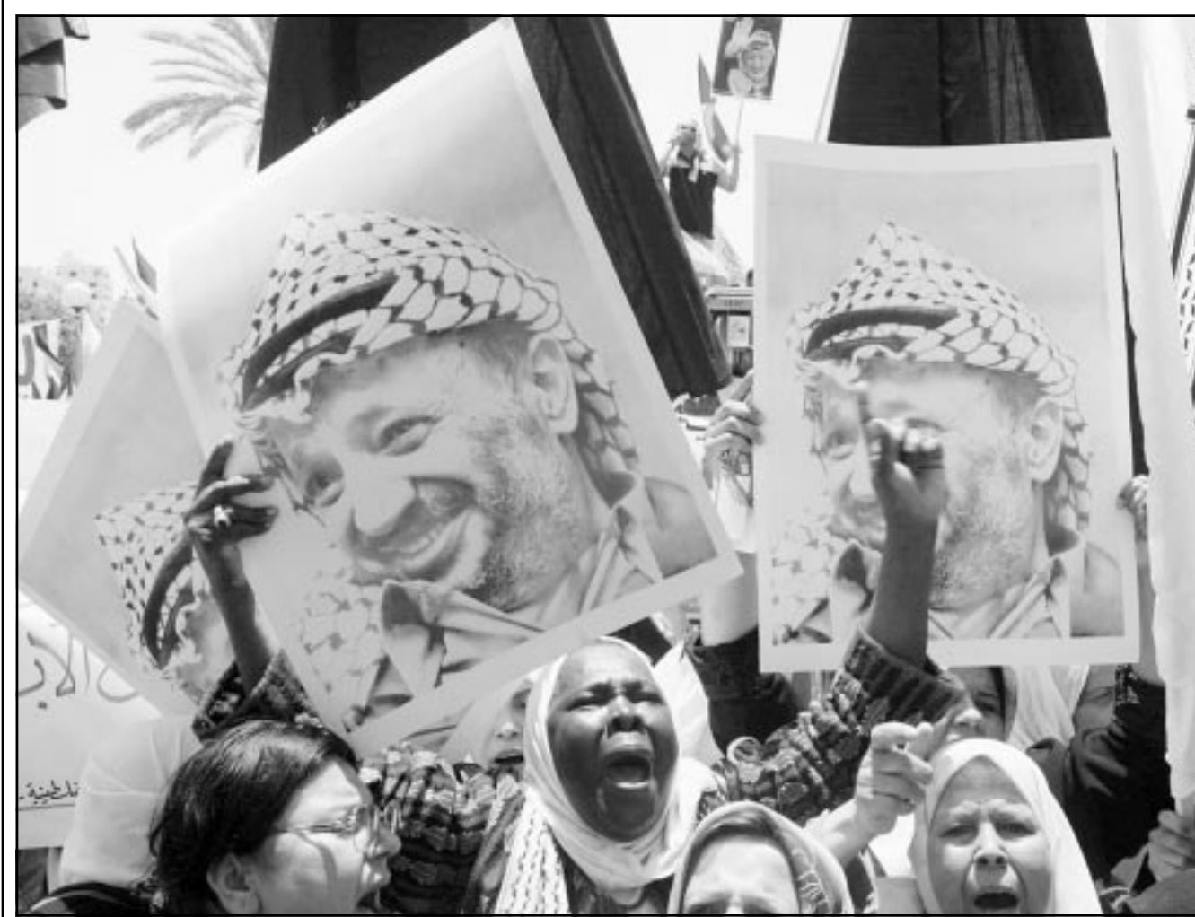
فلسطينيات يتظاهرن بتأييد الرئيس ياسر عرفات امام مقر المجلس التشريعي في غزة أمس (ا ف ب)