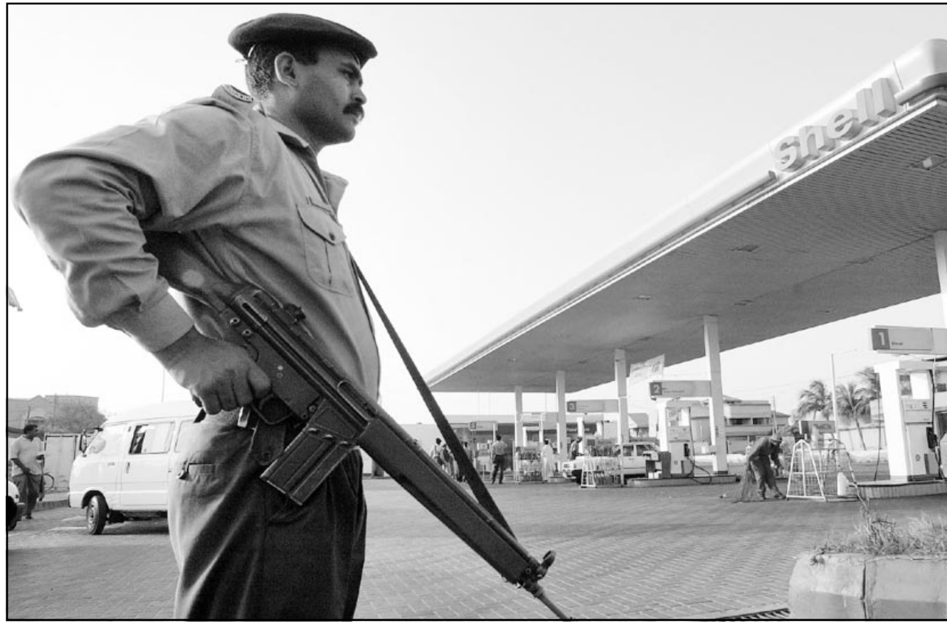
شرطي باكستاني يحرس محطة بنزين في كراتشي بعد انفجارات استهدفت 18 محطة في المدينة