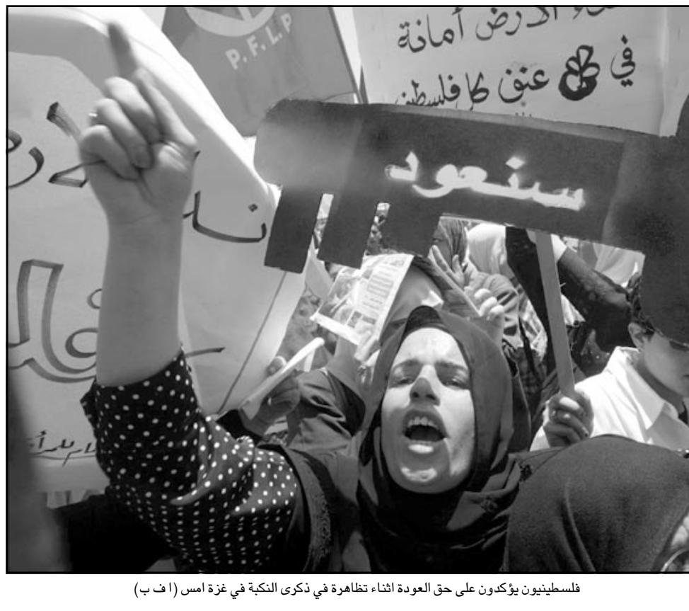
فلسطينيون يؤكدون على حق العودة اثناء تظاهرة في ذكرى النكبة في غزة أمس

قال وزير خارجية قطر الشيخ حمد بن جاسم بن جبر آل ثاني انه لا مانع لدى بلاده من رفع مستوى العلاقات الدبلوماسية مع اسرائيل في حال تطور العملية السلمية في المنطقة. وكان الوزير القطري يتحدث للسفيرة «الجزيرة» في اطار اسئلة طرحت عليه بعد لقائه في باريس امس الاول مع وزير الخارجية الاسرائيلي سلمان شالوم، واذاف ان البعثة التجارية الاسرائيلية في الدوحة كانت افتتحت عام 1996 واغلق عام 2000، قبل القبة الاسلامية التي استضافتها قطر في ذلك العام، لكن الدوحة ما زالت تقيم علاقات مع اسرائيل. وكان اجتماع حمد بن جاسم وسلفان شالوم قد عقد في مقر اقامة الوزير القطري في العاصمة الفرنسية يوم الثلاثاء، وذكرت وكالة الانباء القطرية ان المباحثات تناولت أزمة الشرق الاوسط وسبل حلها، وفي مؤتمر صحافي مشترك تبع اللقاء قال حمد بن جاسم ان قطر تحاول ان تلعب دوراً لاعادة الطرفين الاسرائيلي والفلسطيني الى عرب واجانب (-) ووفوداً عدة من الكونغرس الامريكي وصحافيين امريكيين». واكدت ان «الفهم الحقيقي للتغيرات (في المنطقة) يتلزم مع عقلانية واقعية تتمثل في التأكيد على القواعد القانونية والشريعة للقيام «العلمي» من ناحيتها وصدفت صحيفة «تشرين» الحكومية المباحثات التي اجراها الاسد مع خاتمي الاربعة اثر وصوله الى العاصمة السورية بانها «شكلت محطة كبيرة في العلاقات السورية وايران وفي سعيها الجاد والحثيث لراساء عوامل الاستقرار في المنطقة».