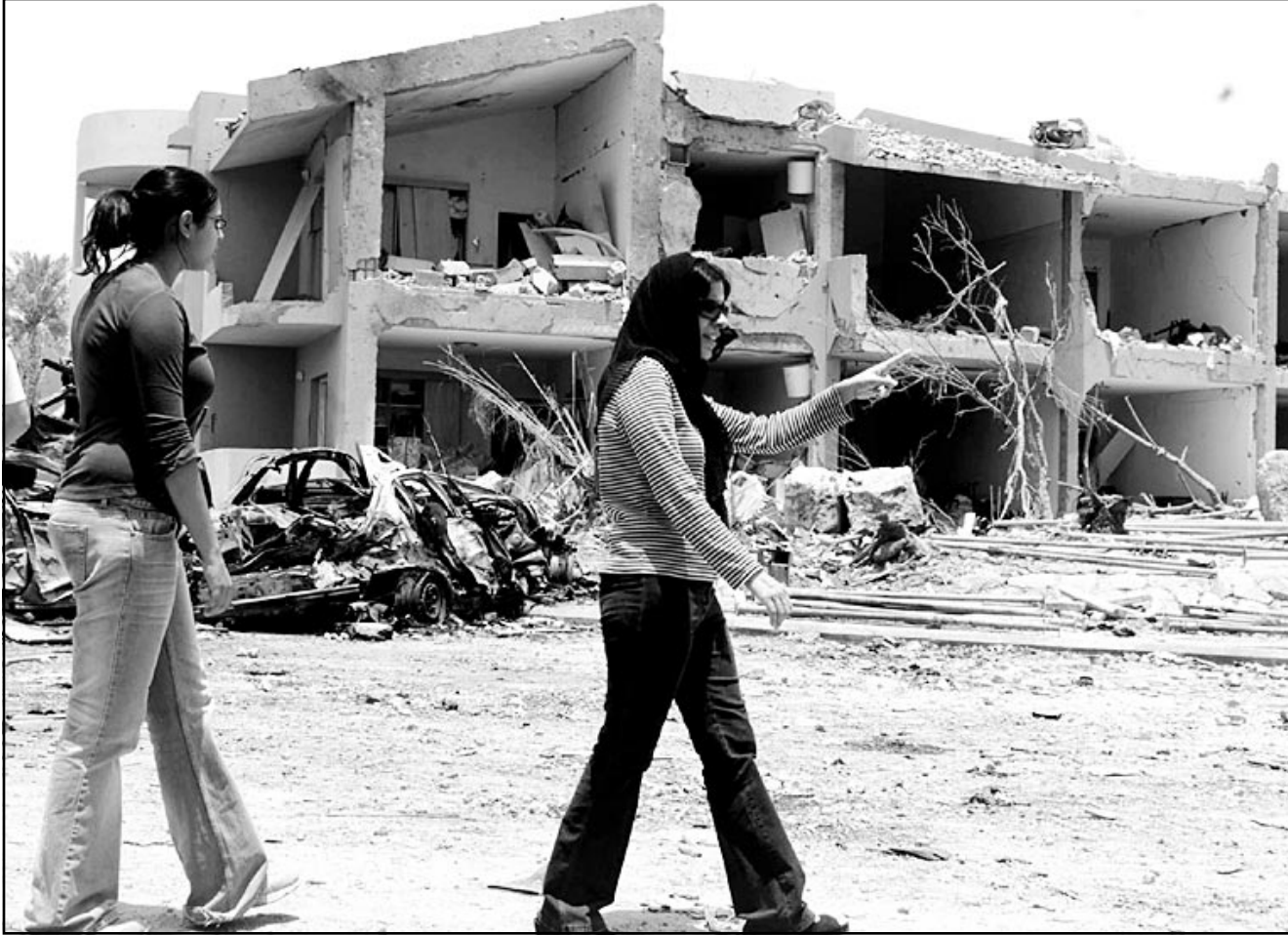
فتاتان سعوديتان تتفقدان موقع الهجوم في مجمع الحمراء بالرياض