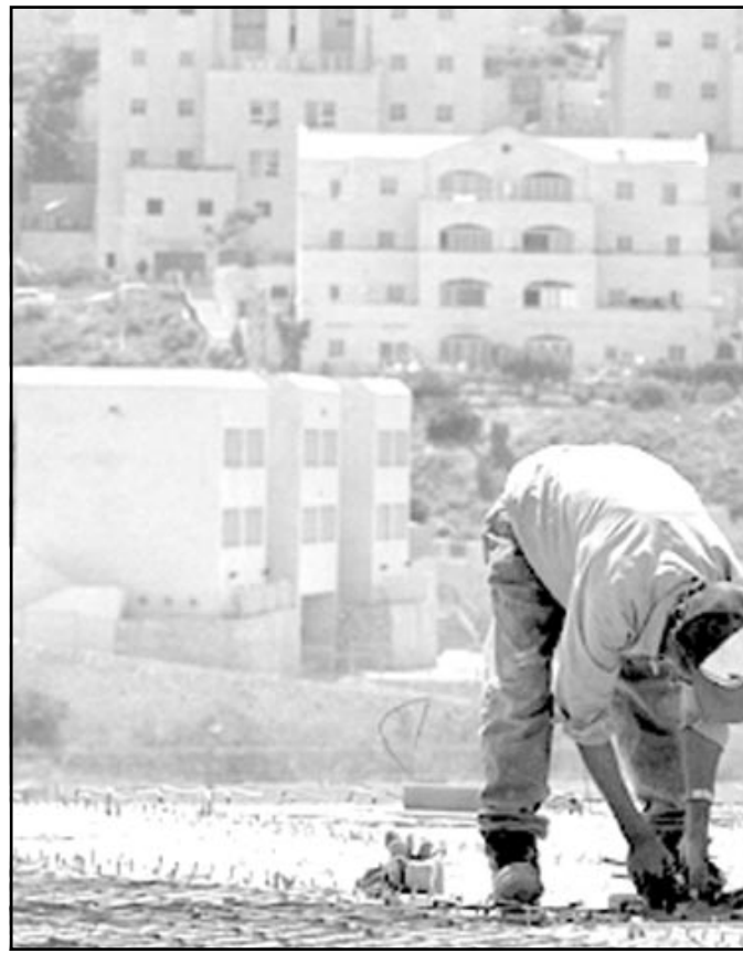
عمال يعملون في مستوطنة معالية اوديم قرب مدينة القدس المحتلة

على حكومة اسرائيل ان تفهم ان الفلسطينيين اعلناو