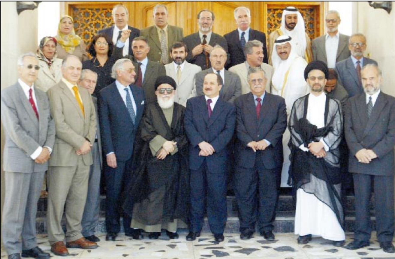
اعضاء مجلس الحكم العراقي الجديد من اليمين في الصف الاول ابراهيم الجعفري، السيد عبد العزيز الحكيم، جلال الطالباني، مسعود البارزاني، السيد محمد بحر العلوم، عدنان الباجه جي، نصير الجابري، احمد الجلبي، سمير محمود، وفي الصف الثاني من اليمين محمد عبد الحميد، غازي الياور، حميد مجيد موسى، محمود علي عثمان، صلاح الدين بهاء الدين، يونس يوسف، قبيلة الهاشمي، شكنول حبيب عمر. وفي الصف الثالث يقف الشيخ احمد البراك البوسلماني، دارا نور الدين، موفق الربيعي، اياد علاوي، والدكتور رجاء الخزاغي

«مجلس الحكم» الذي افتتح بول بريمر الحاكم السامي الأمريكي في العراق اعماله امس هو محاولة بائسة لـ«تشريع» الاحتلال الأمريكي، واضفاء صفة «وطنية» عراقية عليه، ولذلك لم يكن مفاجئا رفض العراقي الشعبي له الذي نقلته معظم وكالات الانباء والتلفزة العالمية عبر برقياتنا وتقاريرها الصحافية. فهذه هي المرة الأولى في التاريخ التي يعتبر فيها «مجلس حكم وطني» سقوط عاصمة بلاده تحت الاحتلال الاجنبي عيدا وطنيا، وعطلة رسمية، يجب ان يحتفل بها الشعب، ويرقص طربا، كلما حلت ذكرا كل عام. تمنينا ان نسمع كلمة «احتلال» تتردد على السنة المشركين، في كلماتهم التي القوها، عبر شاشات التلفزة، ولكن خاب ظننا، وكل ما سمعناه، خاصة على لسان الدكتور احمد الجلبي، هو شكر للرئيس الامريكى جورج بوش، ورئيس الوزراء البريطاني توني بلير، واطراء لسياستهما الحكيمه في الوقت الذي يواجهان عاصفة من النقد في بلديهما، وتراجع شعبيتهما بشكل مرعب في استطلاعات الرأي، لأنهما زجا بلديهما في حرب على أساس اكاذيب مفصولة حول اسلحة دمار شامل غير موجودة. العراق الديمقراطية الجديد الذي بشرنا به الرئيس بوش وصقور ادارته جاء عراقا طائفيا بكل معنى الكلمة، يضيق بحرية الرأي، ويمارس السياسات نفسها التي مارسها النظام السابق، اي اقصاء الآخر ونفي وجوده، وسط اجواء تشف وانتقام ليس فيها اي مكان للتسامح والانفتاح وبدء صفحة جديدة لعراق يتسع للجميع من ابناؤه. تصفحتنا وجوه الاعضاء المختارين للمجلس الجديد، فلم نجد الا المحاصصة الطائفية، والقبول بالاحتلال، والتعايش معه، كقوة شرعية. الوجه نفسه تقريبا التي كانت تجتمع في لندن وواشنطن، مع اولبرايت وريتشاردسوني وزاد وغيرهم، بينما العراق الصامد في وجه الحصار والدكتاتورية لم يحظ ! لا بالحد الأدنى من التمثيل.