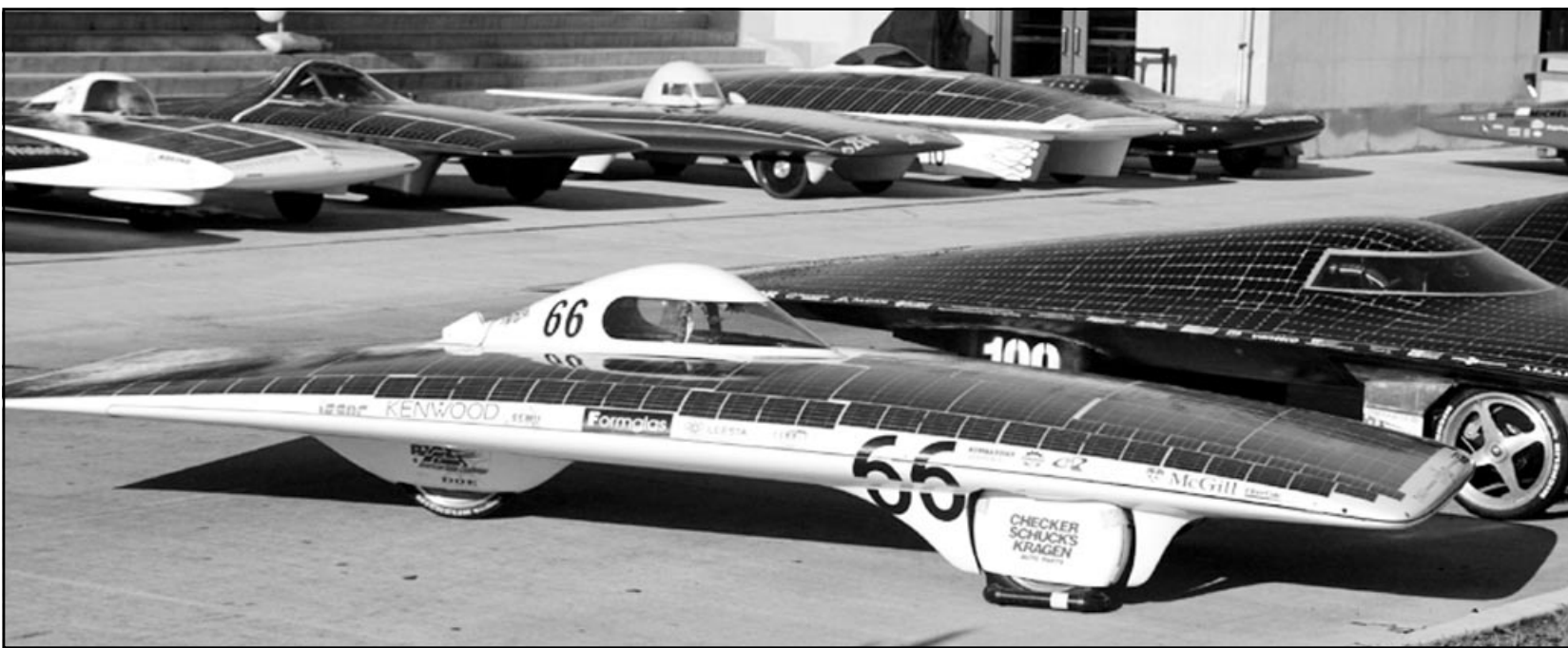
سيارات تسير بغوة الطاقة الشمسية في ساحة امام متحف شيكاغو للعلوم والصناعة. وتشارك هذه السيارات في سباق بدأ أمس ويتتهي في الـ 23 من الشهر الحالي في كاليفورنيا

وشدد الامير طلال على ان قسما كبيرا من مشكلة المياه في المنطقة العربية يعود الى غياب الادارة الرشيدة للموارد المائية، ليعود الى فقر الموارد الطبيعية نفسها. وقال ان ادارة الدول العربية لصهارها من المياه تفقر الى الكفاءة، وتعاني من غياب النظرة الكلية التي تتعامل مع المسألة المائية من جميع الجوانب: الاقتصادية والسياسية والبيئية، ناهيك عن غياب كامل للتخطيط المستقبلي لعدد امرا لا غنى عنه في اي سياسة رشيدة لادارة الموارد المائية. ودعا الى ترشيد استخدام المياه وتوعية المواطنين بذلك واتباع سياسات متنوعة مثل فرض رسوم على استهلاك المياه في الأغراض المنزلية او زيادة هذه الرسوم اذا كانت مفروضة من قبل بحيث تكون رسوما تصاعدية بما يحقق التوازن بين مختلف فئات المجتمع، إضافة الى