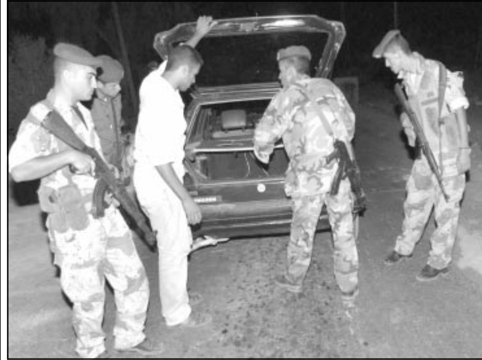
رجال شرطة فلسطينيون يتفحصون سيارة مواطن في خان يونس امس

القدس - ا ف ب: تقوم الشرطة والجيش الاسرائيليان منذ مساء السبت بعمليات بحث عن سائق سيارة اجرة اسرائيلي باحت اجهزة الامن الاسرائيلية تزعم فرضية اختفائه على يد فلسطينيين كما ذكرت اذاعة الجيش الاسرائيلي أمس الأحد. وقالت اذاعة الجيش ان اجهزة الامن الاسرائيلية تعيل أكثر فأكثر الى فرضية اختطاف سائق سيارة الاجرة الاسرائيلي المفقود منذ الجمعة في القدس الشرقية على يد فلسطينيين، وتتركز عمليات البحث عن السائق الناهو غوريل البالغ 61 عاما والمقيم في ارامات غان بشمال تل ابيب، على منطقة رام الله بالضفة الغربية. فنح هذا القطاع من الضفة الغربية اتصل السائق السبت بواسطة هاتفه الخليوي ليقول انه على ما يرام قبل