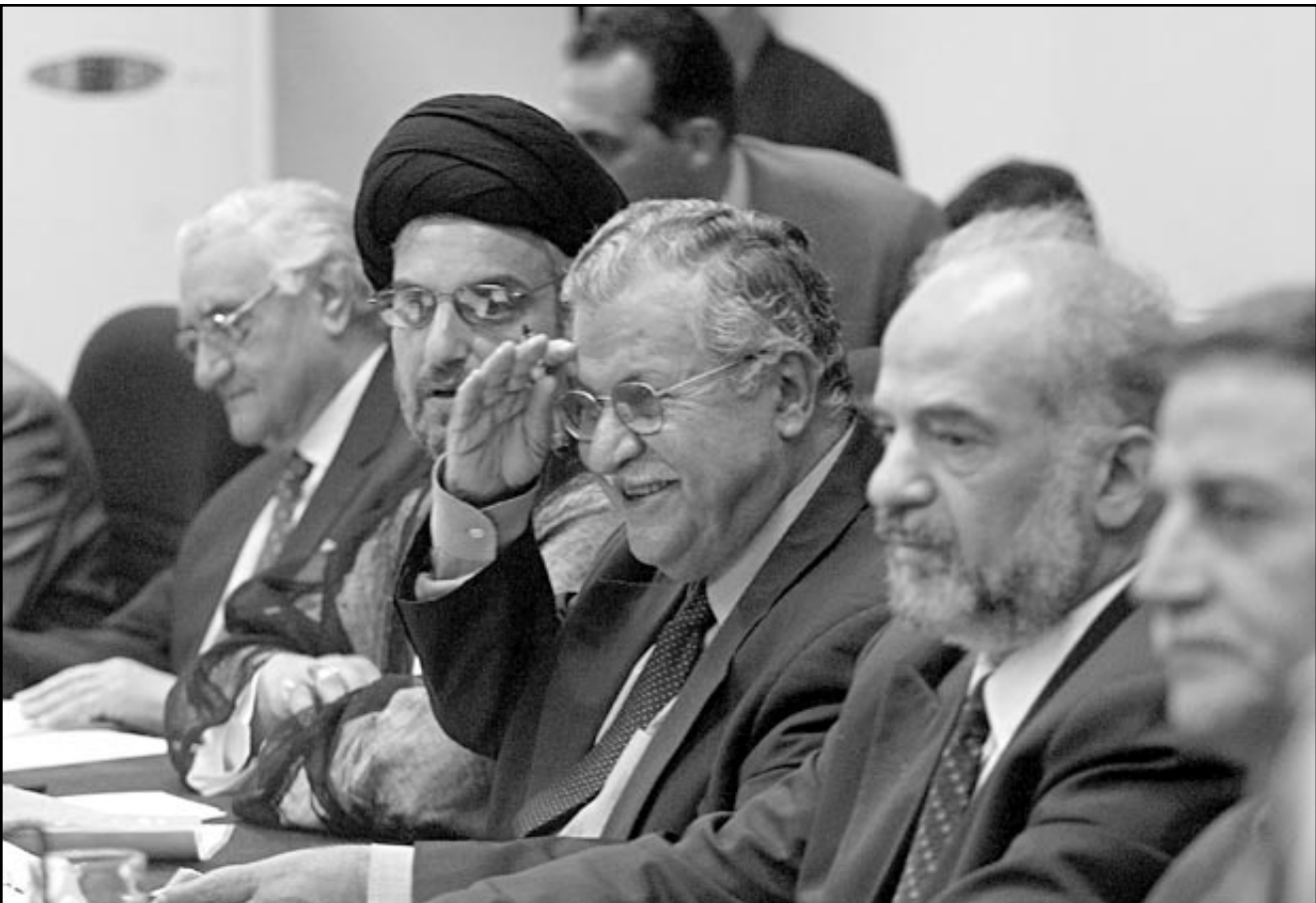
الاعضاء في مجلس الحكم العراقي من اليسار عدنان الباجه جي والسيد عبد العزيز الحكيم وجلال الطالباني وابراهيم الجعفري ويونادم يوسف اثناء الاجتماع امس (رويترز)

سكب سكان بغداد ماء باردا على مجلس الحكم الجديد في العراق اليوم الأحد وقالوا أنهم لن يدعموا هيئة تدعّمها أمريكا ولن يؤيدوا سياسيين عاشوا بالخارج بينما عانى الشعب تحت حكم صدام حسين. وعقد المجلس جلسته الأولى المنتظرة في بغداد فيما تعتبره واشنطن خطوة أولى تجاه حكومة ديمقراطية في عراق ما بعد الحرب. وأشاد المسؤولون الأمريكيون ومسؤولو الأمم المتحدة بالاجتماع باعتباره تاريخيا لكن العراقيين لم يأبهوا به كثيرا بل ولم يسمع بعضهم به على الإطلاق. وقال صباح كاظم الذي يكسب ثلاثة دولارات يوميا من بيع الثلج «لا يمكن أن ندعم المجلس. أمريكا تدعمه وهو لن يغير أي شيء. أمريكا تقدم وعودا فارغة فقط». وأضاف «اعتدت الاقرا الصفح كي لا اضطر للقرارة عن صدام. والآن لا اريد أن أقرأ عن الأمريكيين». ورغم أن العراقيين يتذوقون طعم الحرية السياسية لأول مرة بعد سقوط صدام فهم يريدون أن يروا انتخابات ديمقراطية حقيقية قريبا لا يلوئها النفوذ الأمريكي أو مشاركة عراقيين دخلاء. وكثير من العراقيين بالمجلس كانوا يقيمون بالخارج. وقالت عادة عبود الخياطة في حي تسكة الطبقة المتوسطة في بغداد «يجب أن تتم الانتخابات بسرعة ولا أفستحسر السراقات وانعدام الأمن في الشوارع». وأضافت «لا تريد زعماء عراقيين عاشوا بالخارج لسنوات ولا يرون مشاكلنا داخل العراق. يجب أن يعرفوا كيف عشنا ليحكمونا». وتساءل البعض عما إذا كان الأمريكيون سيغادرون العراق يوما ما.