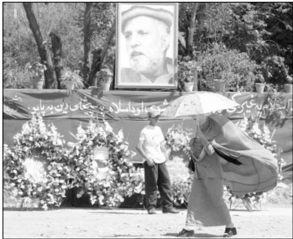
افغانية تسيير امام نصب للوزير افغاني الراحل لشؤون الاشغال العامة الحاج عبدالقادر

وقال مسؤول بمكتب الرئيس الاسبوع الماضي ان اصلاحات ستستضم تغيير نحو ثمانية يشغلون مناصب مهمة. وسيستمر البرنامج الذي تموله دول