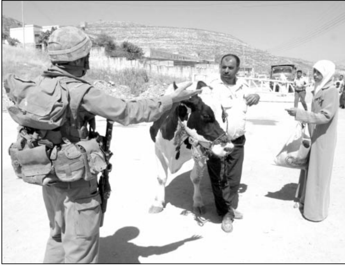
جندي اسرائيلي يمتنع عائلة فلسطينية وبقرتها من عبور حاجز عسكري في قرية بيت فوريك قرب نابلس أمس

في مقابلة أخرى نشرت السبت مع «ديلي تلغراف» الفلسطينية، جاء فيها أن جيله الذي ساهم في انشاء دولة اسرائيل هو الاقدر على صنع السلام. ولكنه أكد انه لن تقدم اي تنازلات اذا ما استمر «الارهاب»، ويرى «للمرة الأولى أن هناك املا» بعد تولي رئيس الوزراء الفلسطيني محمود عباس منصبه. وطالب بصوررة القضاء على جماعات مثل حركة المقاومة الاسلامية «حماس» والجهاد الاسلامي والجيبة الشعبية لتحرير فلسطين والجيبة الديمقراطية لتحرير فلسطين. وحول ما اذا كان عرفات يمتلك القوة الكافية لإعانة عملية السلام قال شارون ان الزعيم الفلسطيني يقوم بذلك بالفعل وهو يسيطر على جزء كبير من الجماعات المسلحة والموارد المالية. وأردف قائلا «أعتقد ان من الخطا الجسيم مواصلة الاتصال بعرفات لان عرفات يقوض حكومة مازن». وتابع ان عرفات «يتلقى مكالمات هاتفية من زعماء اقليميا في اوربا ويستقبل رسائل ووزراء خارجيين واخرين... كل هذه الزيارات والمكالمات الهاتفية ترجى الحل».