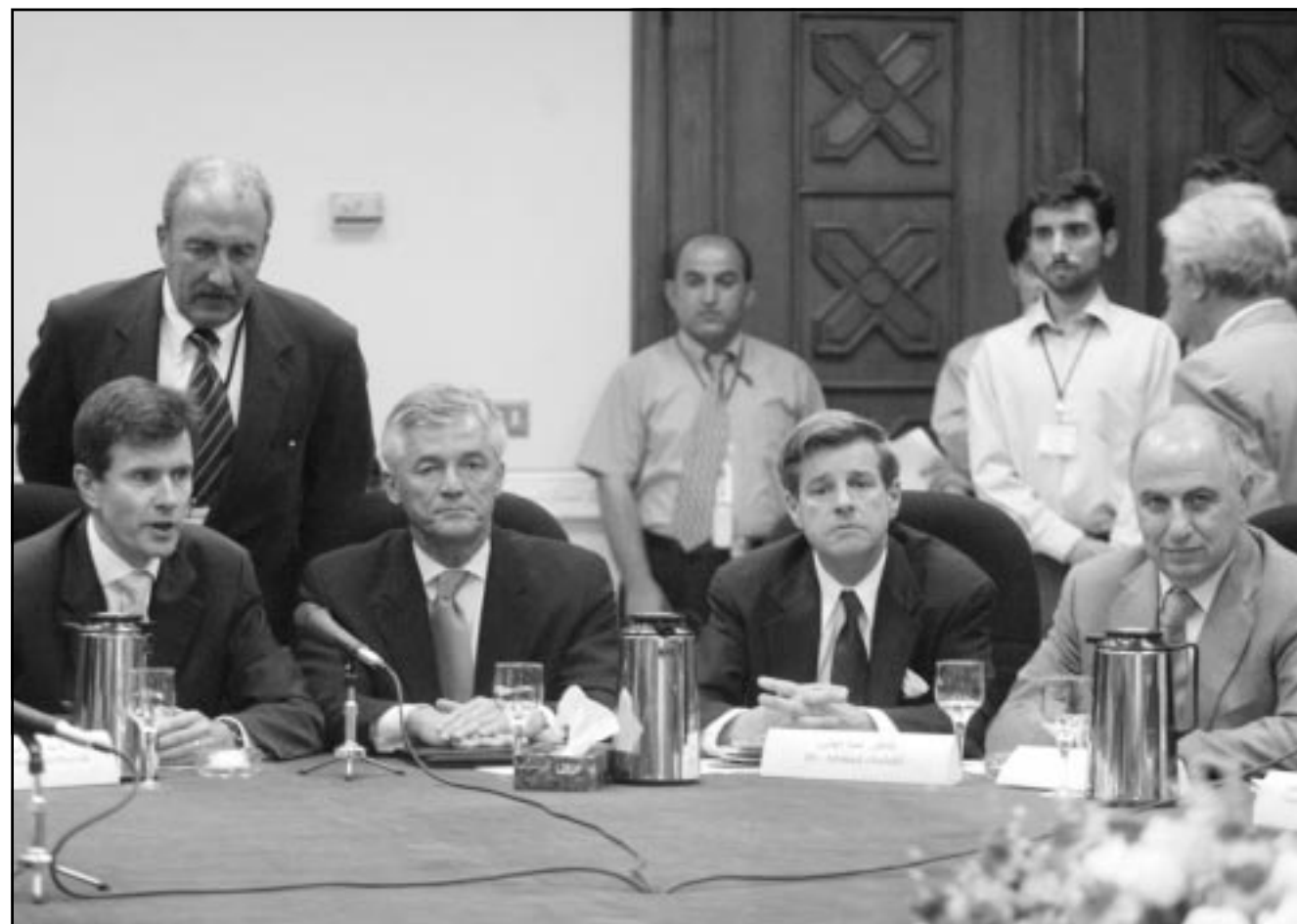
المبعوث البريطاني الخاص، جون سوزيز مع مبعوث الامم المتحدة سيرجيو فييرا دي ميلو يجلسان الى جانب الحاكم الأمريكي على العراق بول بريمر ويظهر في الصورة ايضاً احمد الجبلي رئيس المؤتمر الوطني العراقي والذي اختير كعضو في مجلس الحكم المحلي، الذي تسديته احزاب شعبية وجماعات عائدت من الخارج

يوم السبت تقريراً عبر فيه العديد من الحرفيين وحملة الشهادات الجامعية عن رغبتهم بمغادرة البلاد بحثاً عن مستقبل أفضل. وأشارت الصحيفة إلى أطباء ومهندسين راغبين بالسفر والعمل في دول الخليج. ويعتبر هذا التفكير تحولاً في تفكير هؤلاء الذين كانوا يعارضون ترك البلاد ويقول بعضهم «إن الأوضاع الآن لم تعد كما كانت عليه من قبل» وفي هذا السياق تحاول إيران على حشد زعم العسكريين، خاصة الذين عملوا منهم في المشاريع العسكرية أو ساهموا في البرامج النووية السابقة.