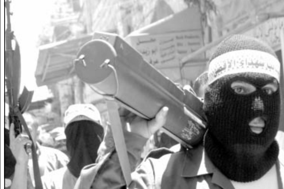
مقاومون من كتائب الأقصى يشاركون في مظاهرة تضامن مع الاسرى في نابلس امس

متزامن مع الانسحاب منها، يكون لهذا الانسحاب معنى على الارض. ويشأن للجانب المشترك بين الجانبين الفلسطيني والاسرائيلي واعرب عمرو عن امله ان تحسول