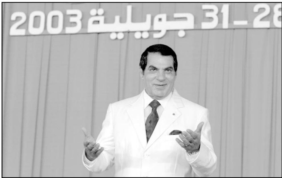
الرئيس بن علي يعان أسن ترشحه لولاية رئاسية رابعة، وفي الصورة الثانية زوجته ليلي (الثانية من اليسار) تتابع خطابه باهتمام