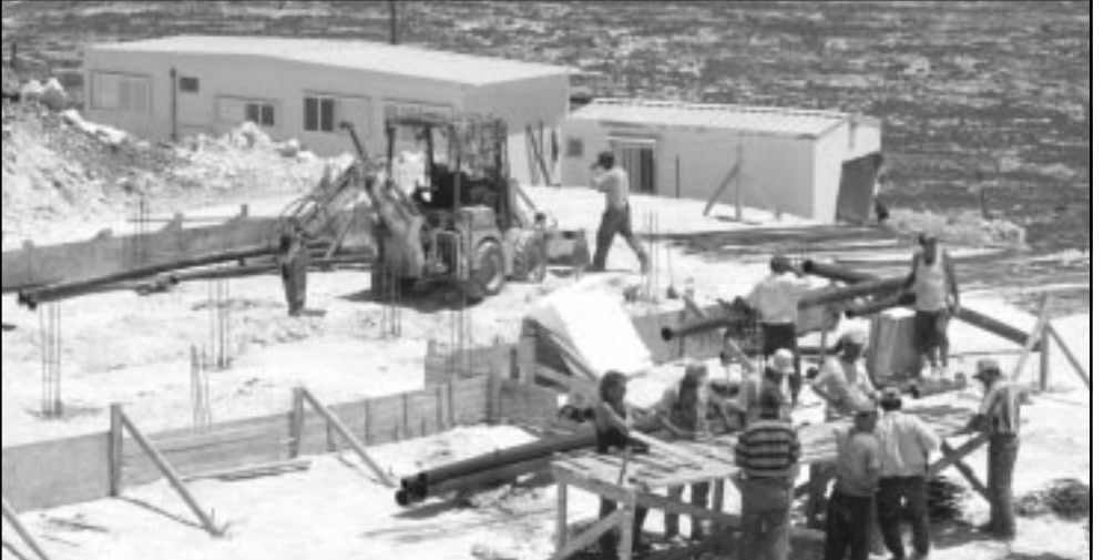
عمال يعملون أمس في إنشاء مستوطنة «معالية مرؤية» اليهودية بالقرب من مدينة نابلس الفلسطينية في الضفة الغربية

القدس - أف ب: أظهر تقرير مكتب الإحصاءات الوطني الإسرائيلي نشر أمس الاثنين أن معدل النمو السكاني لدى المستوطنين اليهود في الضفة الغربية وقطاع غزة تضاعف ثلاث مرات في العام 2002 أكثر مما سجل بالنسبة للتعداد الإجمالي للسكان. فزياداً زاد عدد المستوطنين اليهود بنسبة 5.7% في العام 2002، لم يزد التعداد الإجمالي للسكان سوى 1.9% في العام نفسه، مقابل 2.2% في 2001 و2.6% في 2000. وبلغ التعداد السكاني الإجمالي في إسرائيل في أواخر العام 2002 حوالي