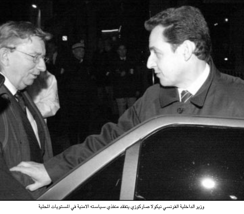
وزير الداخلية الفرنسي نيكولا صاركوزي يتفقد بنغدي سياسته الأمنية في التسويات المحلية

■ باريس - «القدس العربي» من عادل قسطل: عندما بدأ نيكولا صاركوزي عمله كوزير للداخلية في حكومة جون بيير رافاران، قام بزيارات ميدانية إلى احياء «الصعبة» في ضواحي باريس ليطمئن الفرنسيين على أمنهم. وكان حي «با سولان» في بلدة «داماري ليليس» الواقعة على بعد 50 كلم جنوب باريس واحدا من تلك الأحياء التي وصفها بمناطق «اللاتون». وسبقت زيارة صاركوزي للحل حملة بوليسية تجند لها 200 شرطي قاموا بتفتيش الأشخاص والمنازل، ولم يجنوا سوى 400 غرام من الحشيش. قال ضابط شرطة حينئذ متعجبا: «هذه ليست قضية القرن، ولكن صاركوزي الذي يعول كتحسيرا على الاعلام في تركاته، ازادها ضربة قوية ورمزية ضد الانحراف والرعب الذي شكل واحدا من اهم المواضيع التي توصلت اليها في الحكم». ولكن هل ترمز «داماري ليليس» فعلا لانحراف الخفيف في فرنسا؟ اختارت بضع دقائق، ولكنها بقيت هناك أياما زيارة صاركوزي وارسلت إليه بعثة تلفزيونية لم تصور حدثا عابرا في بضع دقائق، ولكنها بقيت هناك أياما لتتحقق في واحدة من أخطر القضايا