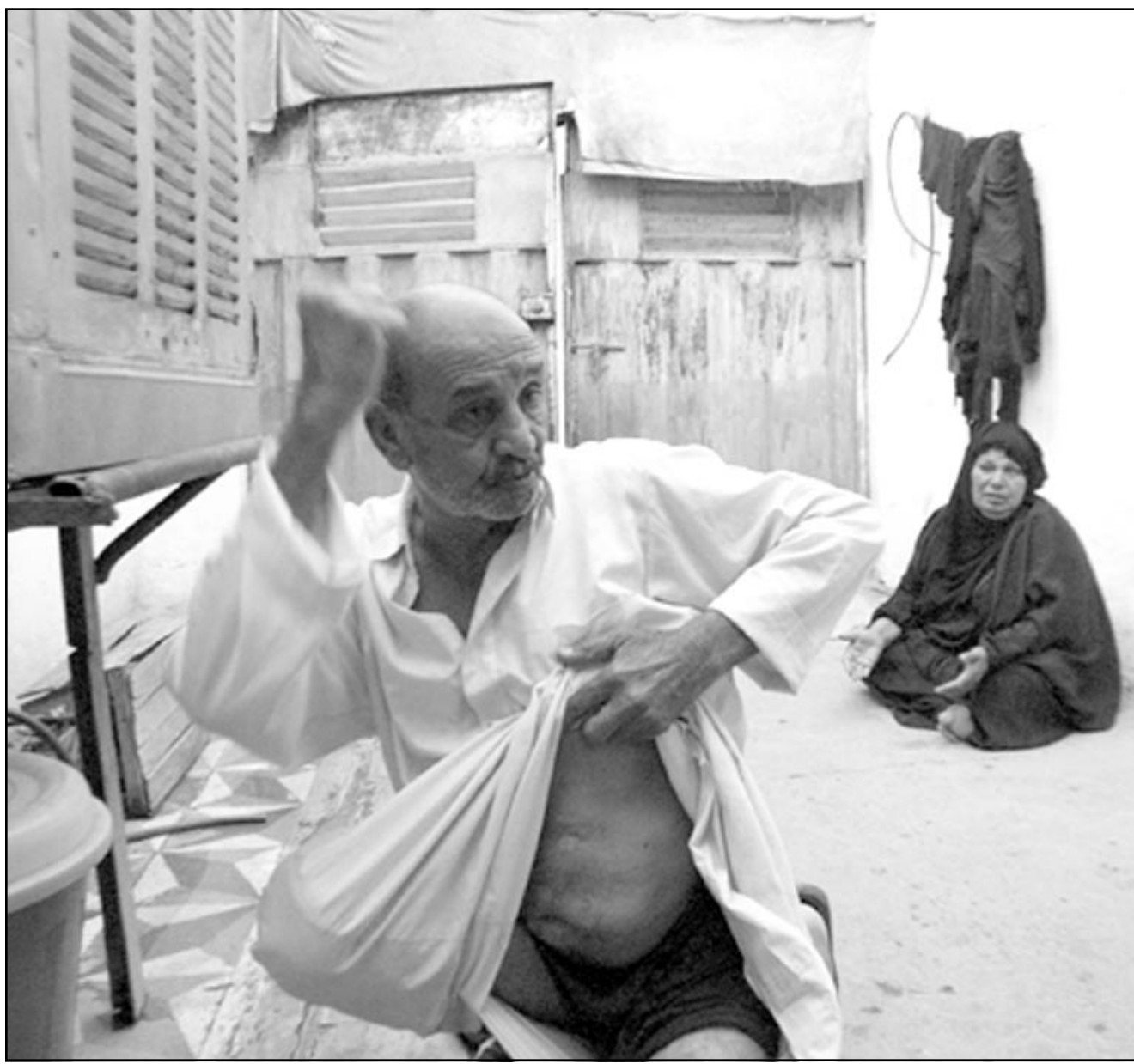
مواطن عراقي يعرض الاصابات التي تعرض لها على ايدي قوات الاحتلال الامريكية بعد اعتقاله في بغداد (ا ب ب)

وقال سانشيز «علينا ان نذكر ان لدينا صراعا متشعبا الأوجه هنا في العراق. لدينا نشاط ارهابي ولدينا قيادة النظام السابق ولدينا مجرمون ولدينا بعض القسلة المأجورين يهاجمون جنودنا بشكل يومي».