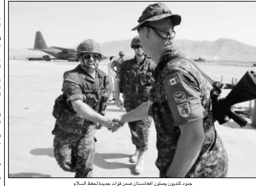
جنود كتيبون يصلون افغانستان ضمن قوات جديدة لحفظ السلام

وتوعدت ارويو بان حكومتها ستطارد المؤيدين السياسيين لمحاولة التمرد الفاشلة التي قام بها ضباط صغار من الجيش الفلبيني. وتكررت ارويو في خطابها انها ستشكل لجنة مستقلة للتحقيق في جذور التمرد والاستقراوات التي تسببت به». وانتهى التمرد الذي استمر 20 ساعة بشكل سلمي يوم الاحد.