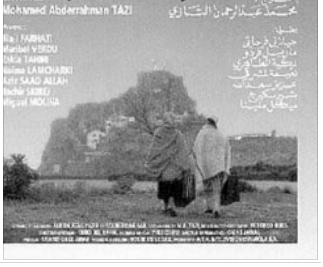
ملصق فيلم «باديس» ل محمد عبد الرحمن التازي

وتحقق في عهد العاهل محمد السادس الذي أكد أنه يفتح دائما مجاله للفنان، سواء بما يتبعه أعماله أو خلال بعض المناسبات الإنسانية التي يقوم بها لتخفيف من المعاناة المرصية التي تقع لبعض الفنانين.