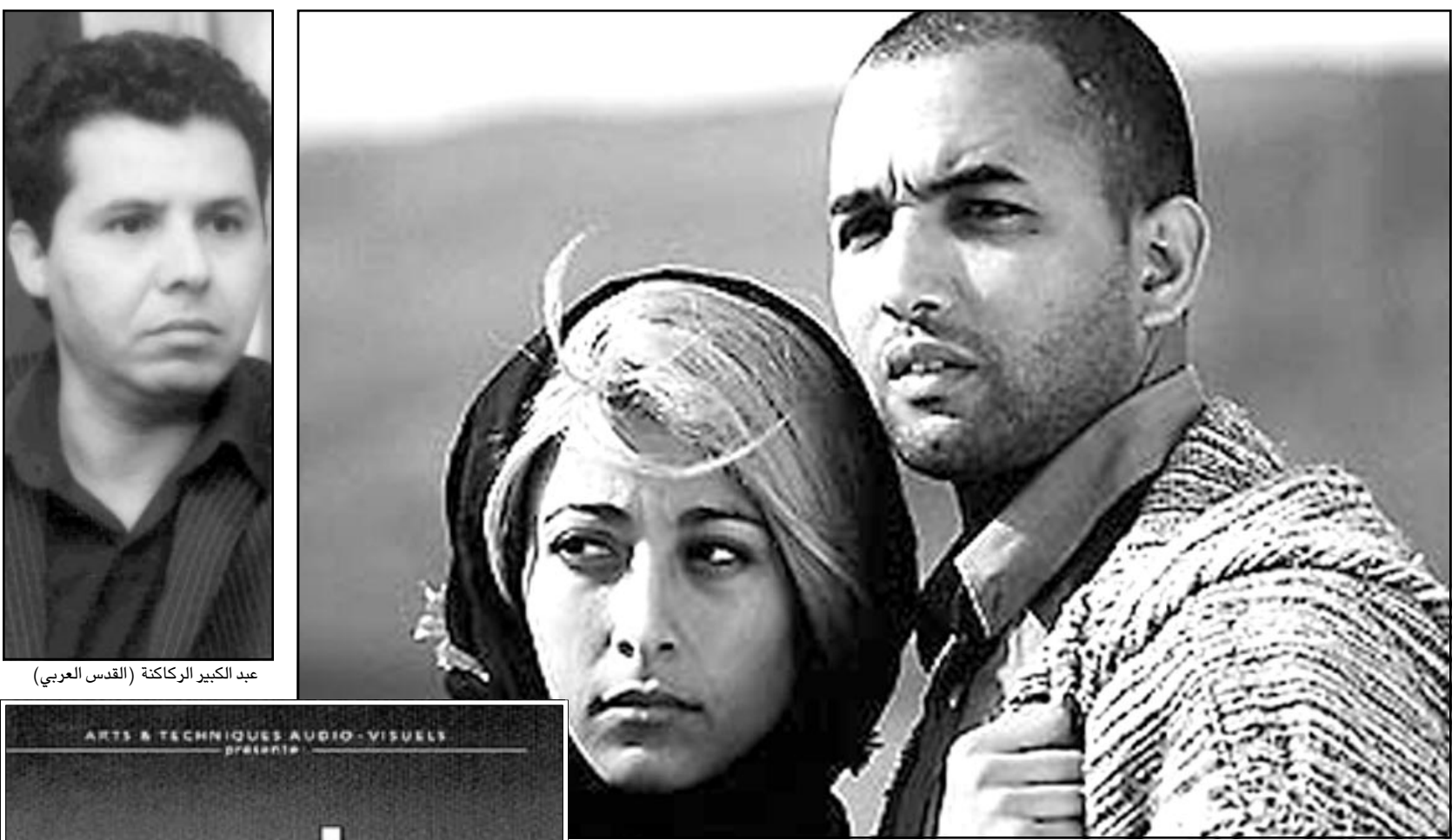
لقطة من فيلم «مكتوب» المغربي

■ لو حظ أنك قليل الخضور في الأعمال السينمائية، فهل ذلك راجع إلى محض اختيار، أم أن لأن الخرس قلما نتاح لك في الأفلام؟