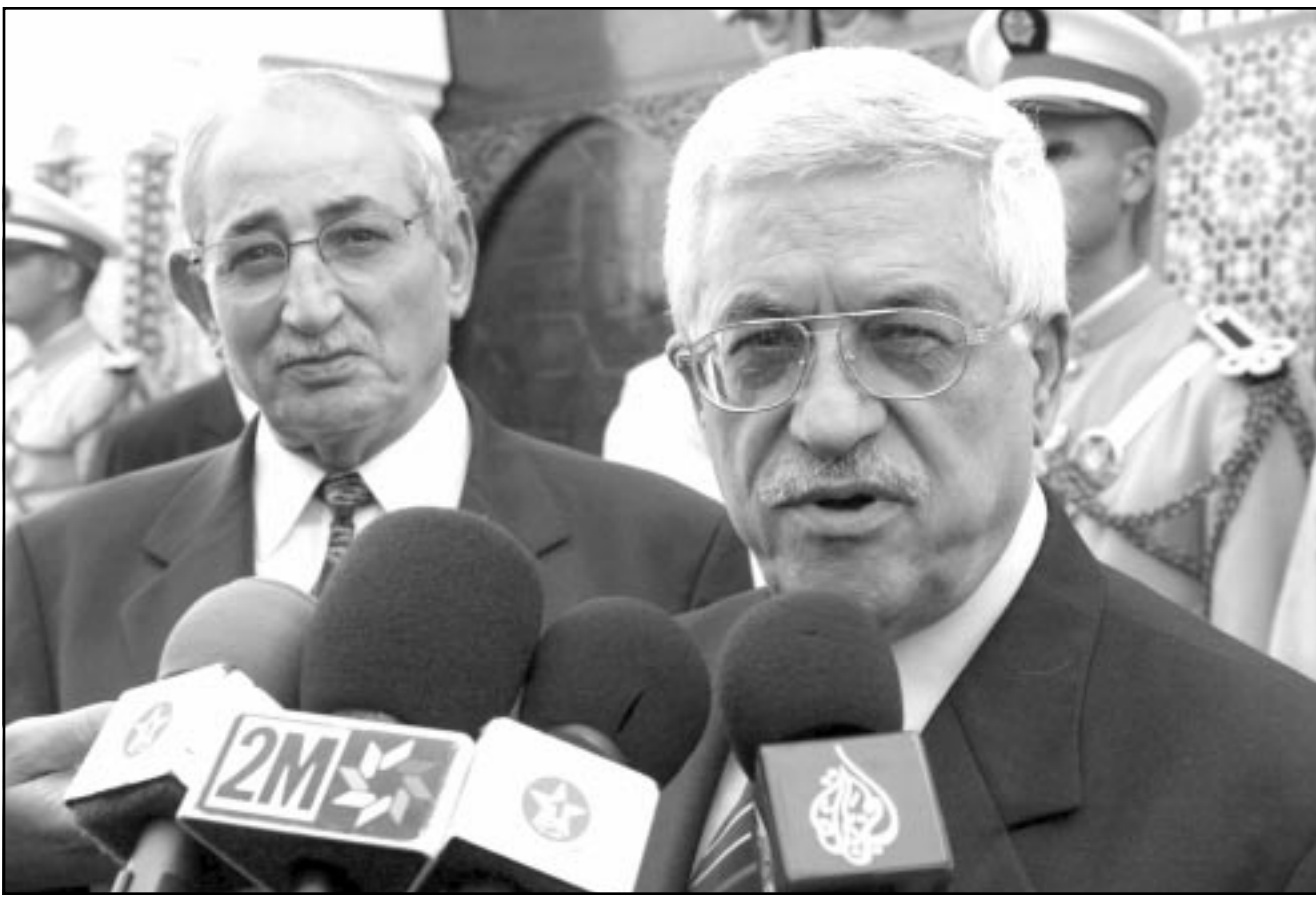
رئيس الوزراء الفلسطيني محمود عباس يعقد مؤتمراً صحفياً بعد لقائه العاهل المغربي الملك محمد السادس في تطوان شمالي المغرب

الولايات المتحدة، ومن جانبها أعلنت الفصائل الفلسطينية هدنة لمدة ثلاثة اشهر اعتباراً من 29 حزيران (يونيو).