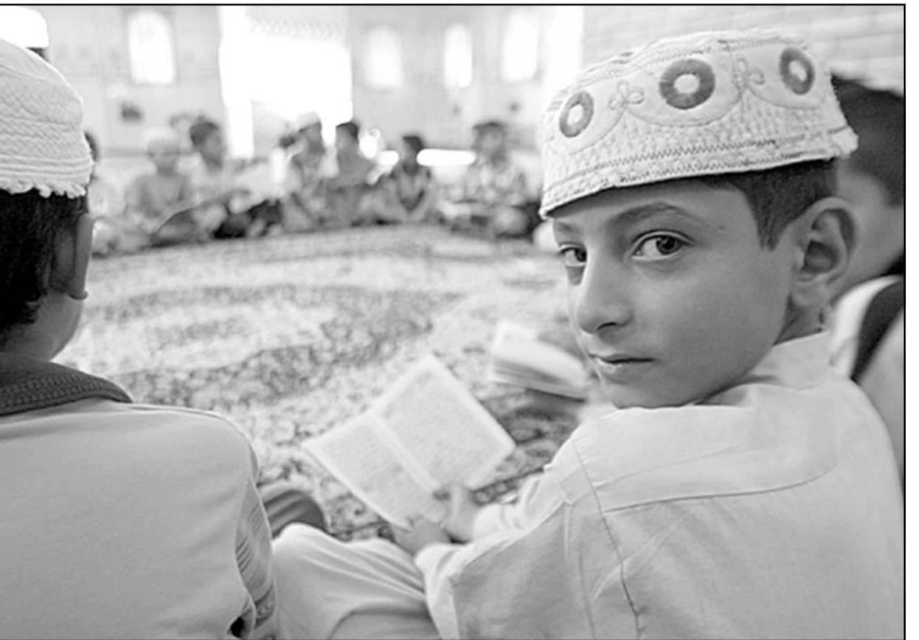
اطفال عراقيون يقرأون القرآن في مسجد شاكرا العبود ببغداد

النجف (العراق) - اف ب: زار الشرفي علي بن الحسين امس الاثنين مدينة النجف في جنوب العراق حيث تجمع مئات الاشخاص للاقائه مطالبين بعودة الملكية الى العراق.