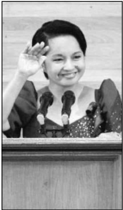
الرئيسة الفلبينية تلقي خطابها في البرلمان

الواهي على قواتها هو مقدمة لنصر مرجح في عام 2004. وعادت الحياة إلى طبيعتها في العاصمة الفلبينية مانيلا أمس الاثنين بعد ساعات من انتهاء مجموعة من العسكروين المتمردين تمردا بشكل سلمي تحسنا خلافا داخل مجمع تجاري فاخر.