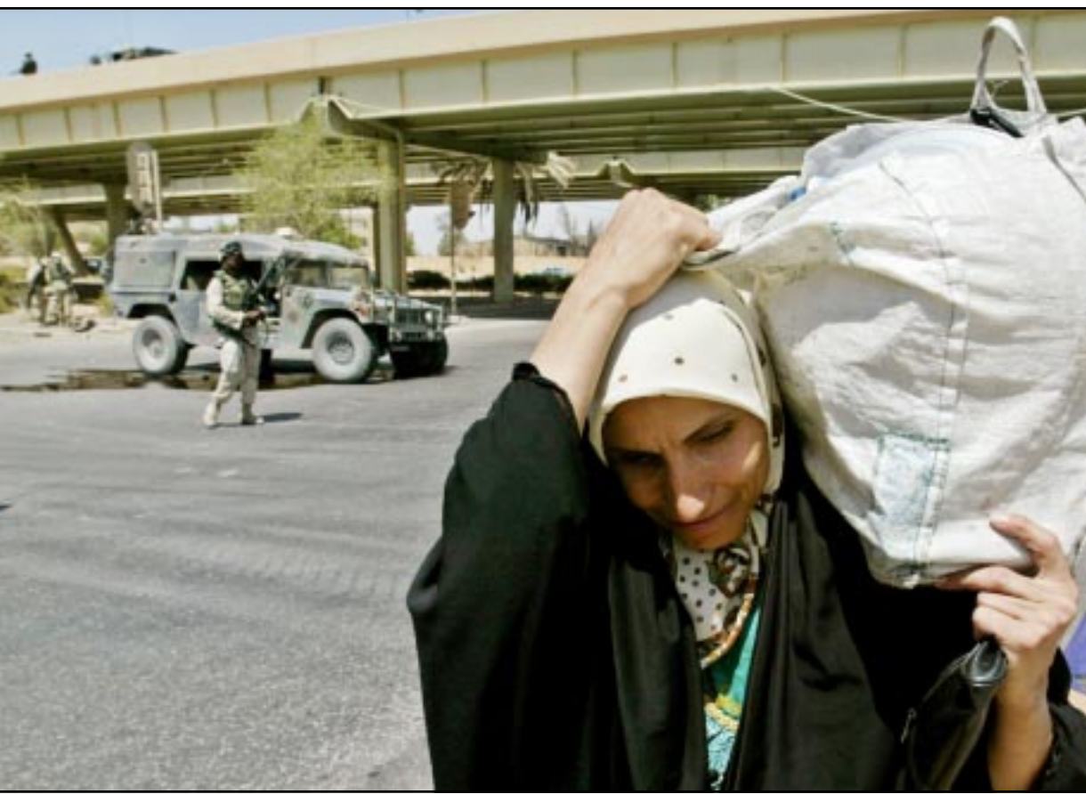
سيدة عراقية امام مرقع الهجوم الذي شنته المقاومة العراقية امس في وسط بغداد

من منصبه قبل شهرين في اطار عزل الكوادر البغذية. وكان مسلحون اغتالوا مؤخرًا عميد كلية التربية في الجامعة المستنصرية الدكتور صباح محمود قسي اطار تصاعد الفوضى الأمنية في البلاد. (تفاصيل ص 3 و 4)