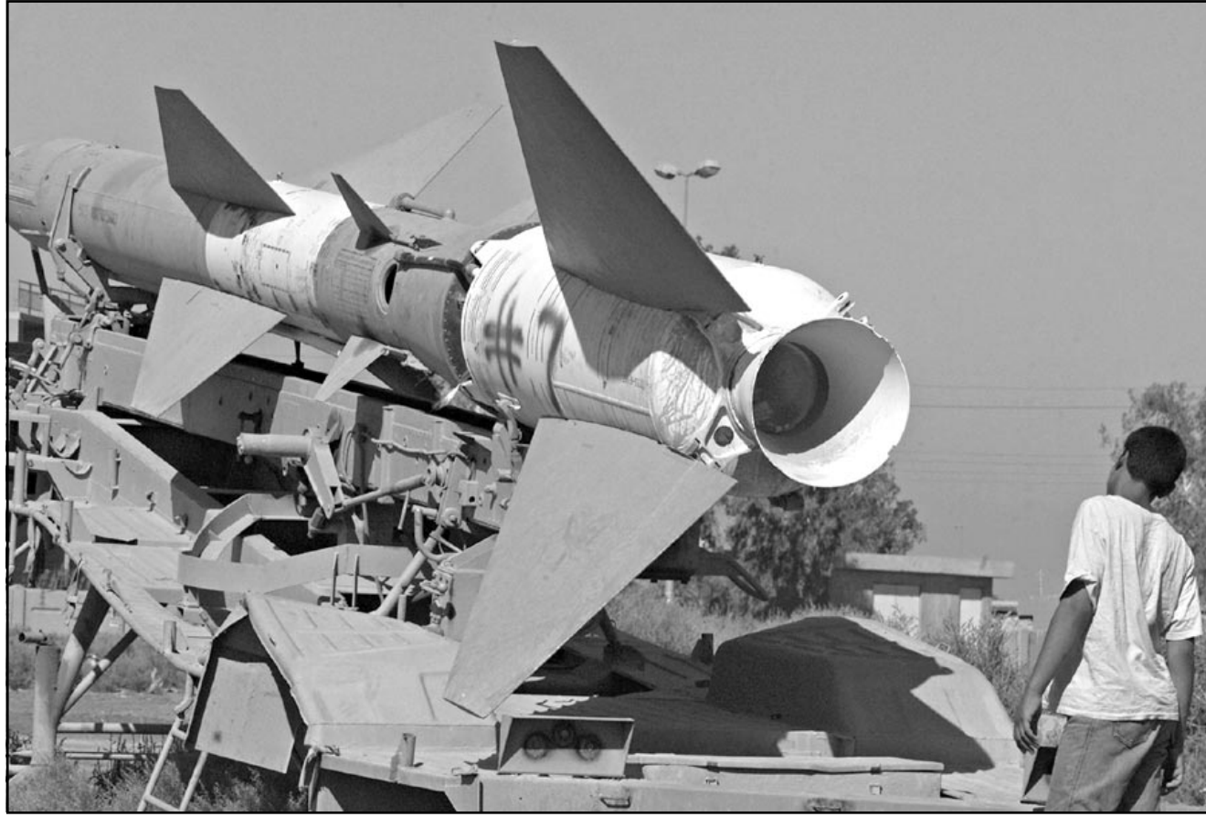
صبي عراقي امام صاروخ أرض جو تركته القوات العراقية في غرب بغداد

والصفت منشأ شريف ليل السبت الاحد على جسر ان تكريت وضواحيها تدعو الى المشاركة في مجلس العزاء الاثنين في الجامع.