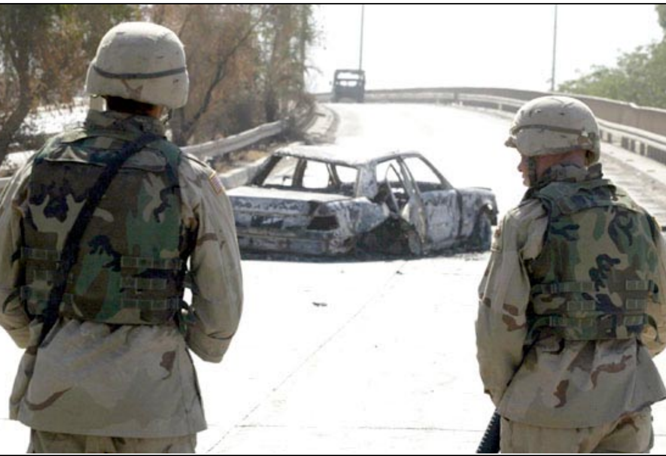
جنديان امريكان امام سيارة محترقة اثر تعرضها لانفجار لغم بطريق المطار (أ ب)