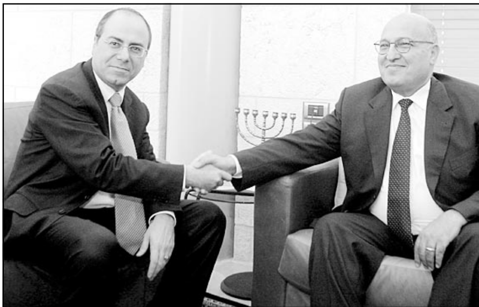
شعث اثناء لقائه بشالوم في القدس الغربية أمس