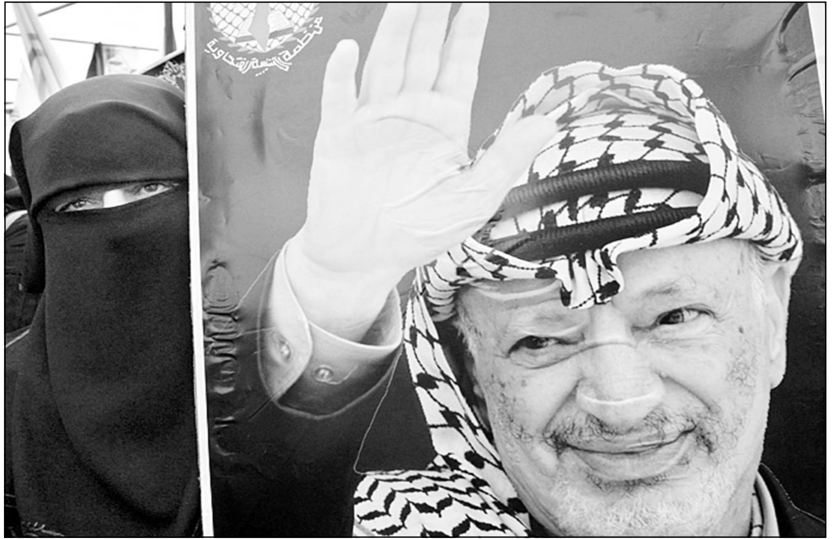
قناة منقبة تحمل صورة عرفات خلال مسيرة تأييد الرئيس الفلسطيني في مخيم خان يونس امس