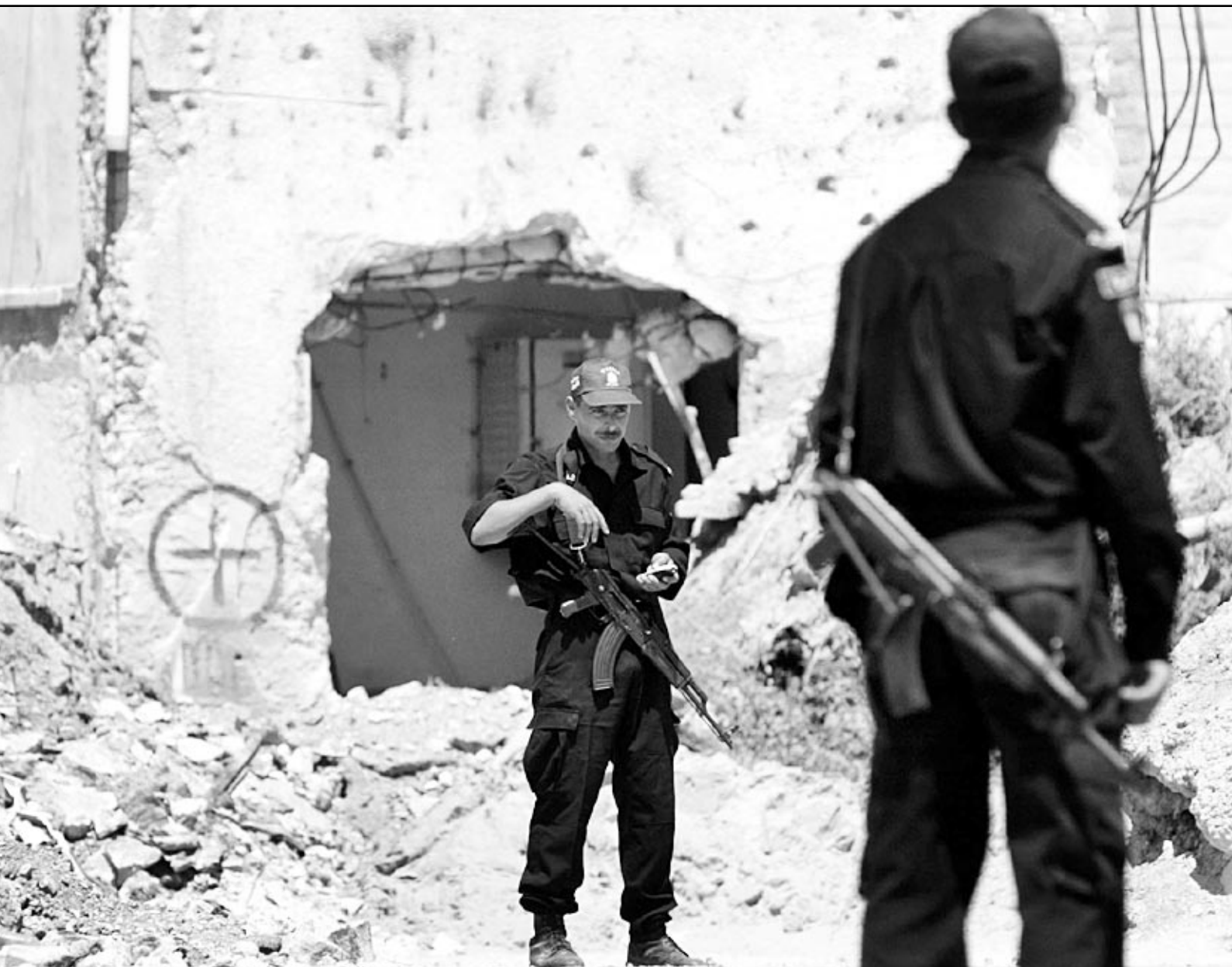
شريطان فلسطينيان يقفان امام مقر الرئيس الفلسطيني حيث يحتجز نشطاء كتائب الاقصى

رام الله - «القدس العربي» - من وليد عوض: