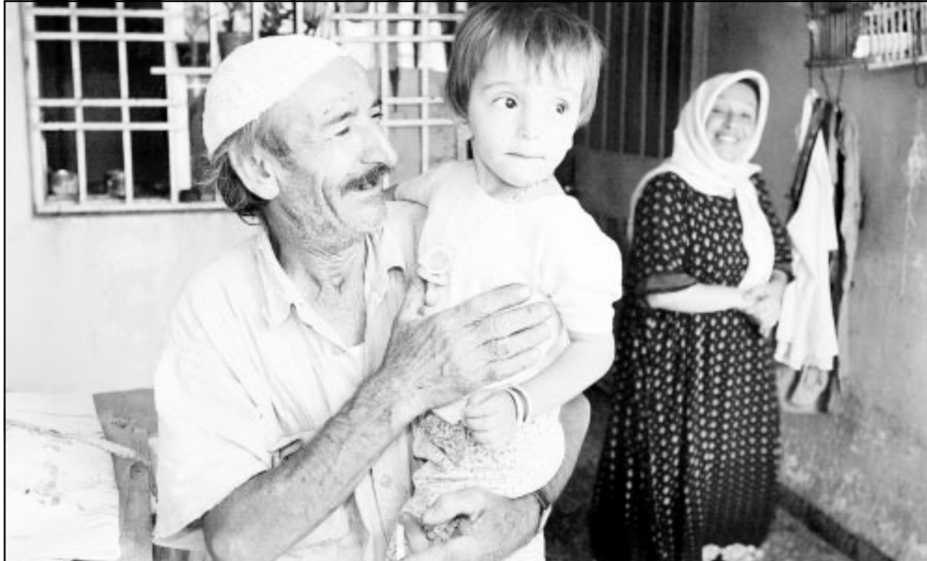
عائلة تركمانية في كركوك

«بعض المعلومات متناقض مع المعلومات التي قدمتها ايران سابقاً... وكانت دعت الولايات المتحدة ايران من جديد للثناء الى القبول بمزيد من التفحيش الدقيق على متنصلاً بالموضوع». «بعض المعلومات متناقض مع المعلومات التي قدمتها ايران سابقاً... وكانت دعت الولايات المتحدة ايران من جديد للثناء الى القبول بمزيد من التفحيش الدقيق على متنصلاً بالموضوع». «بعض المعلومات متناقض مع المعلومات التي قدمتها ايران سابقاً... وكانت دعت الولايات المتحدة ايران من جديد للثناء الى القبول بمزيد من التفحيش الدقيق على متنصلاً بالموضوع». «بعض المعلومات متناقض مع المعلومات التي قدمتها ايران سابقاً... وكانت دعت الولايات المتحدة ايران من جديد للثناء الى القبول بمزيد من التفحيش الدقيق على متنصلاً بالموضوع».