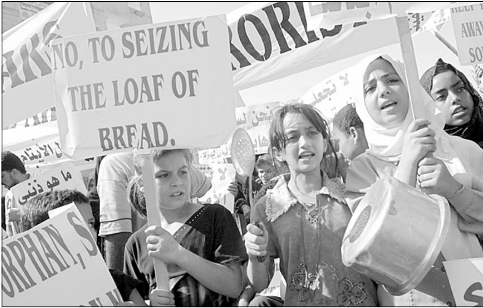
اطفال غزة يهتجون على الحملة الأمريكية - الإسرائيلية - الفلسطينية الرسمية ضد مؤسسات الإغاثة الإسلامية أمس

■ غزة - «القدس العربي» - وكالات - تظاهر الآلاف، معظمهم من النساء والأطفال في غزة أمس، استنكاراً لقرار السلطة بتجميد أرصدة الجمعيات الإنسانية التي تزعم واشتغل أنها تقدم الدعم المالي لحركة حماس.