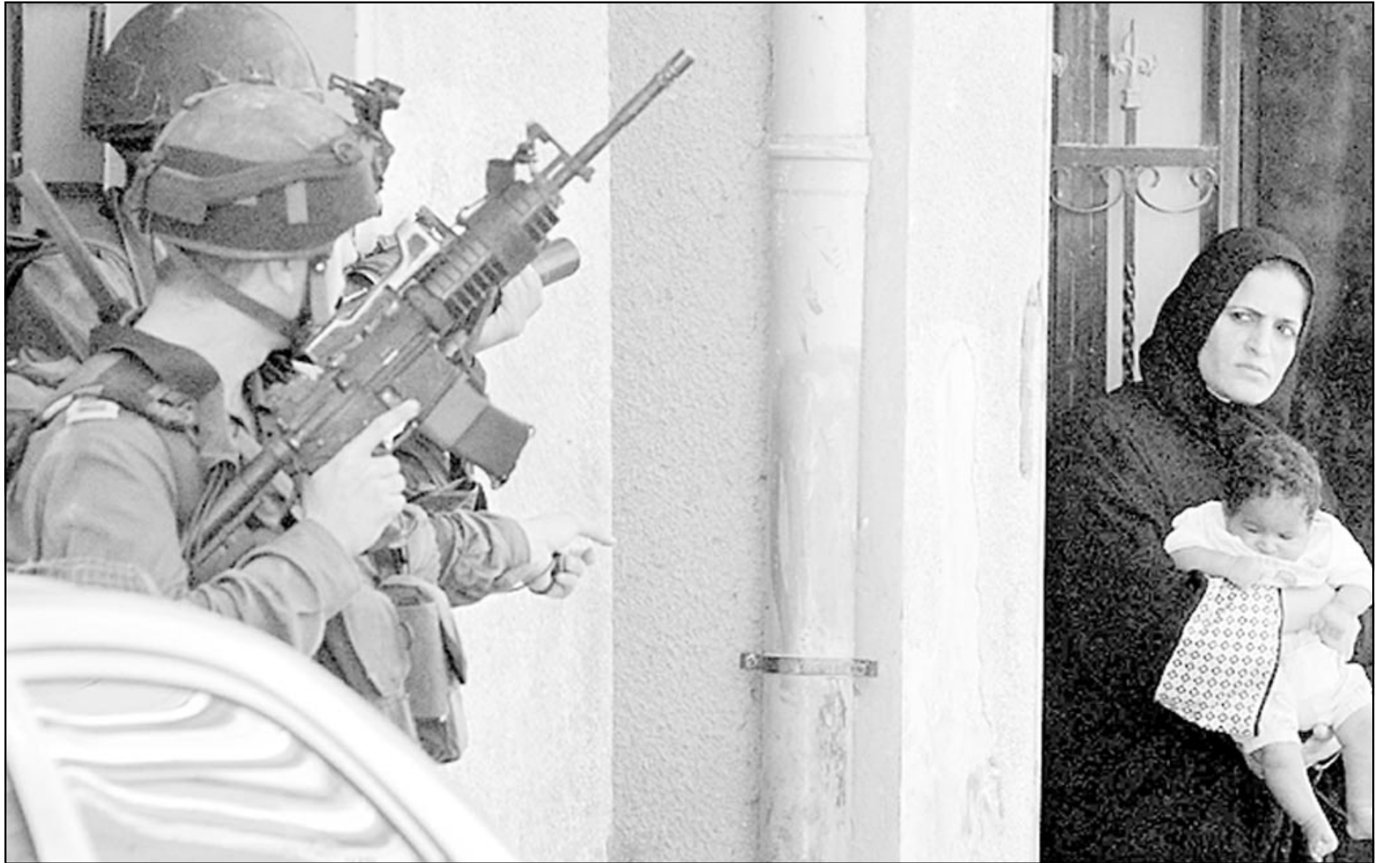
مشهدان من ممارسات جيش الاحتلال الاسرائيلي في مدينة نابلس بالضفة الغربية المحتلة أمس (1 آب وروبيرتز)