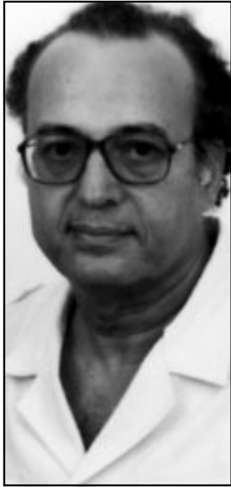
عبد الوهاب المسيري