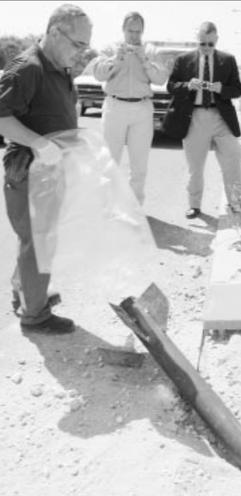
طاقم من السفارة الأمريكية في تل أبيب يعاين الصاروخ الذي أطلقه مفاعل من حماس على منطقة صناعية في مدينة عسقلان أمس

أكدت مصادر أمنية فلسطينية أن الجيش الاسرائيلي يحشد قوات وتعزيزات عسكرية مكثفة شمال قطاع غزة، استعدادا لاقتحام القطاع في أي لحظة، في حين قالت مصادر اسرائيلية ان القوات الاسرائيلية اصبحت جاهزة للبدء بعمليات عسكرية برية واسعة النطاق في قطاع غزة، الذي تعتبره اسرائيل معقلا لحركتي «حماس والجهاد الاسلامي».