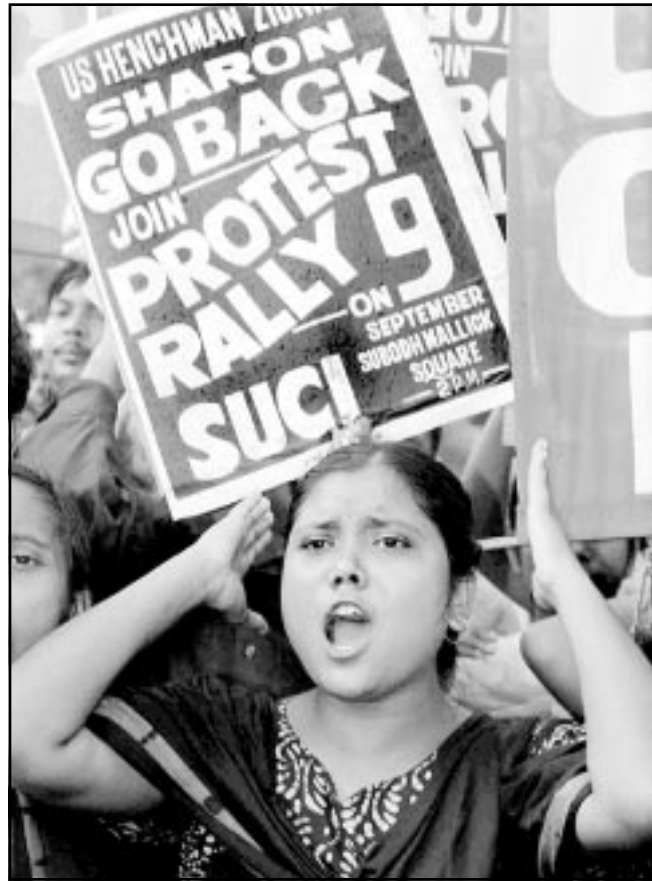
فتاة هندية تشارك في الاحتجاجات على زيارة شارون في نيودلهي امس

نيودلهي - وكالات: تظاهر الآلاف امس الثلاثاء في جميع أنحاء الهند احتجاجاً على زيارة رئيس الوزراء الاسرائيلي ارييل شارون الذي استقبلته السلطات الهندية مع ذلك بسفارة تربية.