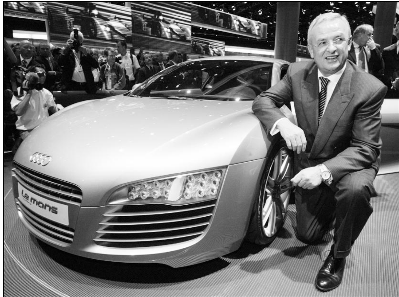
مارتن وتنكهورن الرئيس التنفيذي لشركة فولكسفاغن إلى جانب سيارة أودي (لي مانس) الرياضية الجديدة لدى الكشف عنها لأول مرة في معرض فرانكفورت الدولي للسيارات امس

ستحقق «زيادة حادة» في ارباح تشغيلها عام 2004 بالمقارنة مع العام الحالي، مشيراً إلى زيادة المبيعات أيضاً في ضوء توقعات الشركة بحادث «توسع طفيف» في سوق السيارات. ويعتبر معرض فرانكفورت الذي بدأت فعالياته امس وسيفتتح ابوابه للجمهور غداً لأول مرة في اجنحة شركات متعددة.