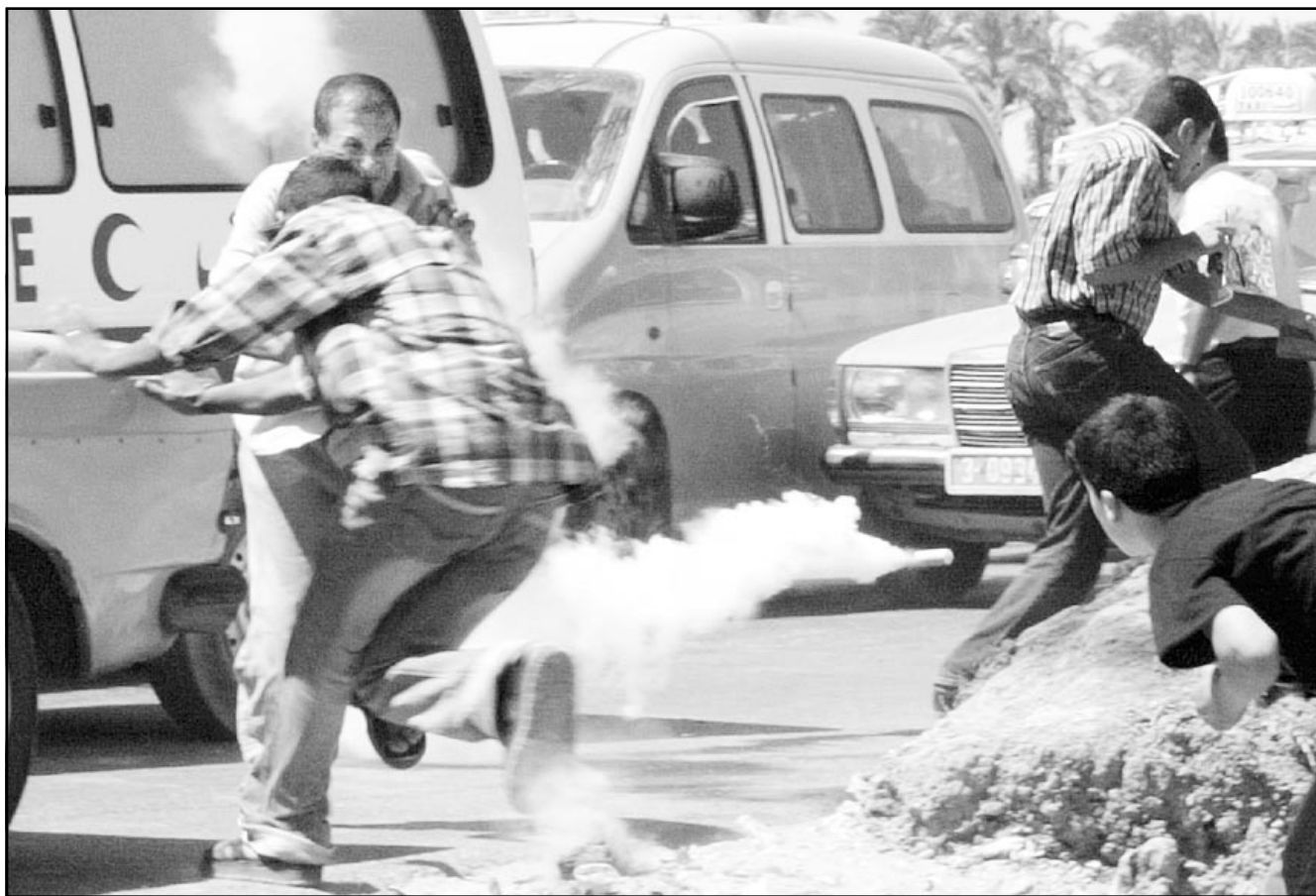
شبان فلسطينيون يركضون بحثاً عن سائر من نيران اطلاقها جنود اسراييليين على الحفالات والمارة في غزة أمس

الناصرة - «القدس العربي» - من زهير اندراوس: