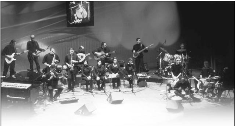
فرقة «دم» الأردنية

رغم الطبيعة المتوسطية للدول المشاركة إلا ان ادارة المهرجان حرصت على توسيع نطاق استضافة الوفود العالمية، فقد استقطبت دولاً من وسط وشرق أوروبا إضافة إلى حضور دول من جنوب امريكا اللاتينية - وقد شارك في المهرجان عدد واسع من الدول منها: اليونان، اسبانيا، رومانيا، انجيا، كوبا، الأردن، مصر، تونس، سورية، العراق، لبنان، صربيا وكان التوقيع حضور وفود من الكويت والإمارات العربية والمغرب، ولكن حالت ظروف المشاركين دون الحضور. وقد توزعت فعاليات المهرجان بين عدد مختلف من الأنشطة الثقافية فاشتملت على المسرح والغناء