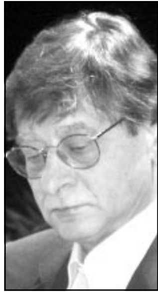
محمود درويش (القدس العربي)

والموسيقى والفن التشكيلي والقراءات الشعرية إلى جانب عرض للفديو بعنوان «فلسطين: 52 عاماً على الاحتلال» أعدت التحضيرات المصري د. احمد نوار المستشار الفني في مجلس الشعب والرئيس السابق لقطاع الفنون التشكيلية بوزارة الثقافة المصرية، كما وشهد المهرجان قراءات شعرية لوحيد من أهم وأشهر شعراء إيطاليا المعاصرين وهو ادوارد سانغونوتي (73 عاماً) والذي يتداول اسمه منذ سنوات في اروقة جائزة نوبل العالمية.