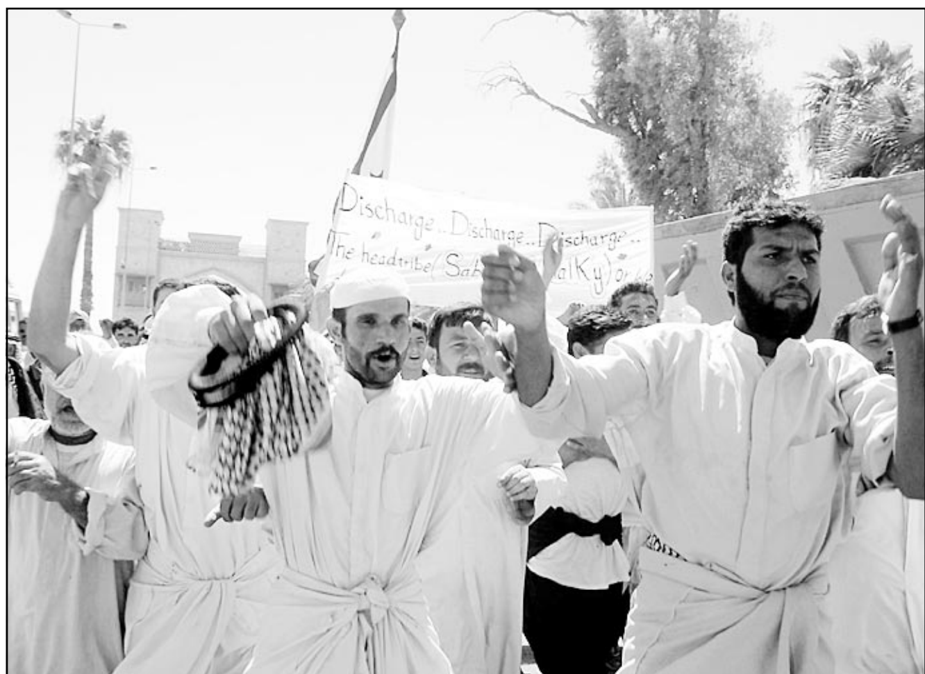
عراقيون يتظاهرون احتجاجا على اعتقال زعيم عشيرتهم في جنوب العراق (اسم (ورينز)

وحسب مصادر قضائية فان القاضي غارثون استجوبه حول