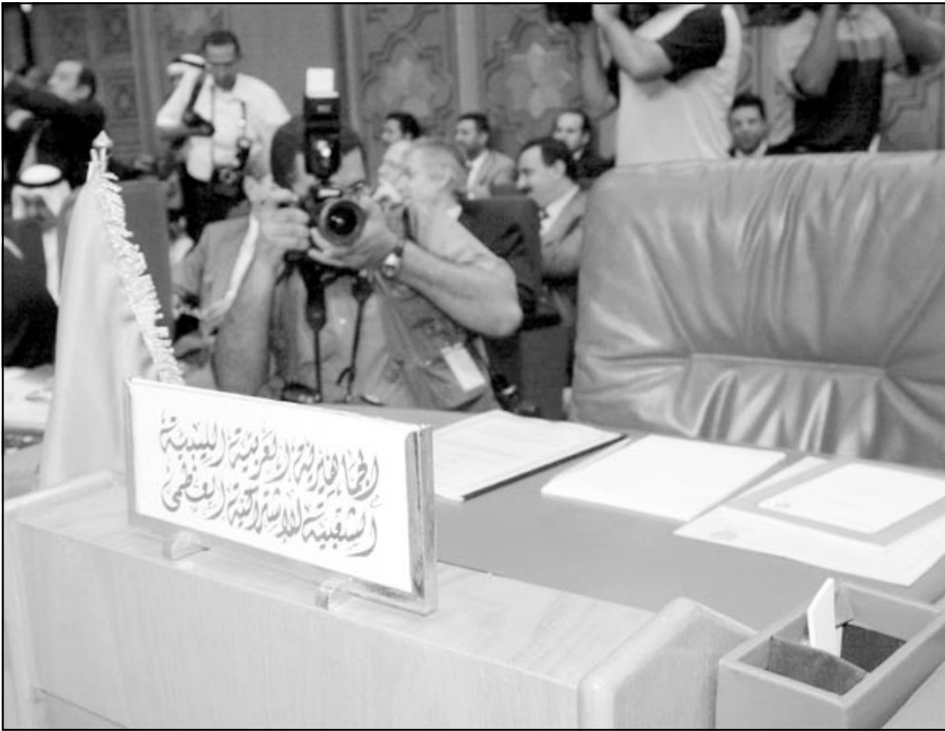
مقعد ليبيا شاغر في اجتماع وزراء خارجية الدول العربية امس الاول

وقد عارضت ليبيا بقوة مشاركة وزير الخارجية العراقي الجديد هوشيار زيباري في الاجتماع الوزاري.