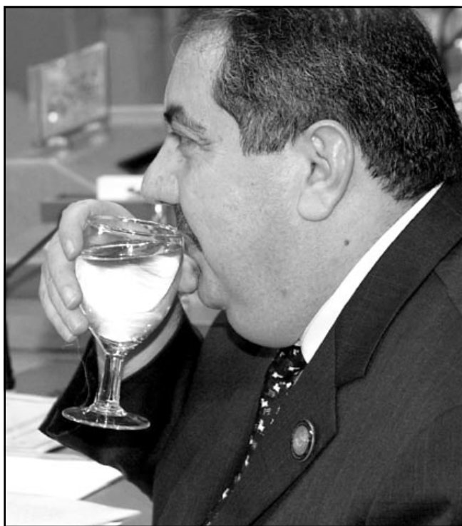
وزير خارجية العراق هوشيار زبيباري ووزير خارجية الامير سعود الفيصل اثناء الاجتماع الوزاري للجامعة العربية في القاهرة أمس

أكد وزير الخارجية العراقي هوشيار زبيباري أمس الثلاثاء ان «العراق الجديد، يريد فتح صفحة جديدة في العلاقات مع اشقائه العرب الذين وافقوا على ضم المئتين الجند للعراق اليهم مع مطالبتهم بوضع جدول زمني يفضي الى انهاء الاحتلال الامريكي البريطاني للعراق. وشارك زبيباري في القاهرة في اجتماع مجلس وزراء الخارجية العرب الذي قاطعته ليبيا احتجاجاً على حضوره. وافق وزراء خارجية الدول العربية مساء الاثنين على قبول ممثلي السلطات العراقية الجديدة في الجامعة العربية «بصورة مؤقتة، حتى تشكل حكومة تتمتع بالسيادة. وقال زبيباري في كلمته امام الاجتماع «أكد لكم ان العراق سوف يعيد بأسرع وقت ممكن، بمساعدة اشقائه، دوره في محيطه العربي وسيعمل على استقرار المنطقة من خلال اعتماد سياسة خارجية جديدة تماماً واقامة افضل العلاقات مع الدول العربية والجوار وتبذ الحروب».