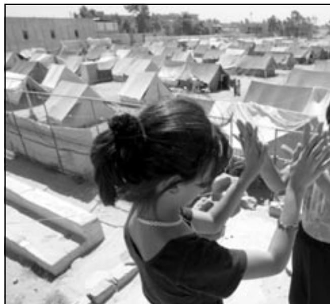
اطلاق فلسطينيين في مخيم في بغداد

وقال لافروف لصحيفة «ايفستيا» ان «صمان ان العراق غير ممكن بدون اتفاق حول مهل ومراسل اعادة السيادة الى هذا البلد». وعبر عن تأييده لتبني «خارطة طريق للعراق»، في اشارة الى خطة التسوية التي اعدها اللجنة الرباعية لتسوية النزاع بين اسرائيل والفلسطينيين. وبشكل اقترح لافروف خطة متقدمة بالمقارنة مع مشروع القرار الامريكي الذي عرض الاسبوع الماضي