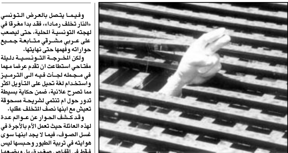
عمل لاجد نوار (القدس العربي)

طابع عصري، واستطاع الموسيقى الأردني طارق الناصر ان يظل رؤيته الجديدة التي تجمع بين الأصالة والحداثة.