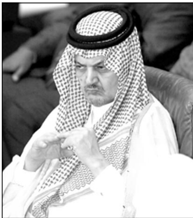
وزير خارجية العراق هوشيار زبيباري ووزير خارجية الامير سعود الفيصل اثناء الاجتماع الوزاري للجامعة العربية في القاهرة أمس

■ بغداد - اف ب: رحب مسؤولون عراقيون امس الثلاثاء، مع بعض الحذر، بعودة العراق «المشروطة» الى صفوف الجامعة العربية على انها «خطوة مهمة لتطبيع العلاقة» بين العراق والمداوالات. وقد رحب وزير التخطيط مهدي الحافظ بالقرار على انه «خطوة مهمة لتطبيع العلاقة مع العراق». وقال «القضية الاهم هي استعادة العراق لمقعده الطبيعي في الجامعة العربية مهما كانت الظروف». وحمل الحافظ جهات عربية لم يسلمها مسؤولية وضع شروط لاستعادة العراق مقعده في المنظمة العربية. وقال «ان الاشتراطات التي تضمنها