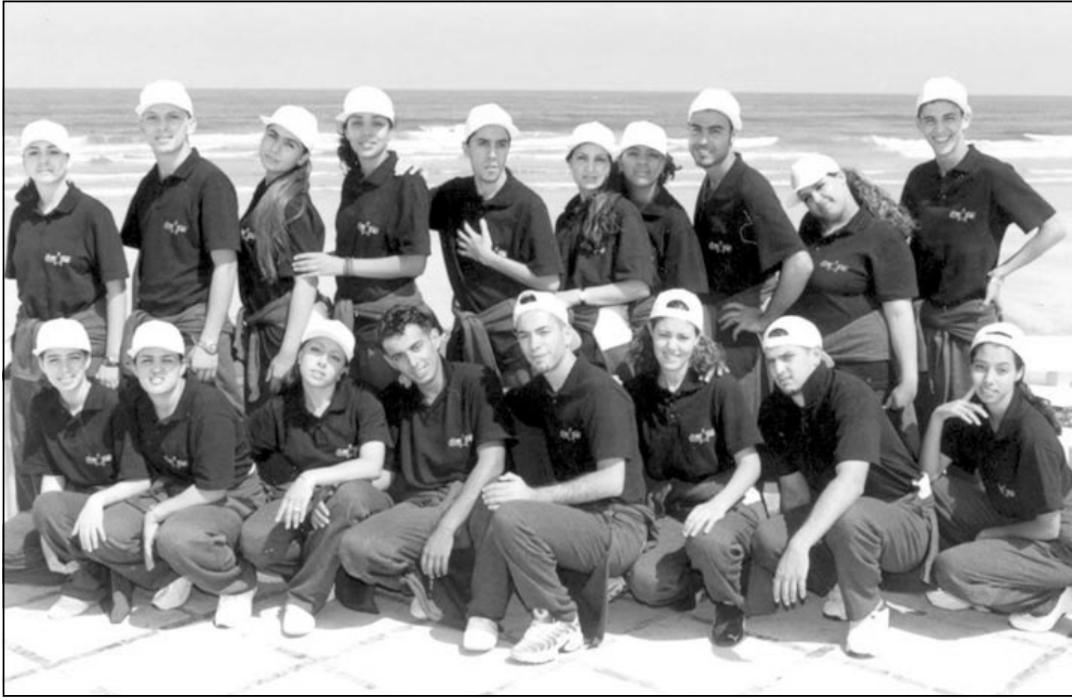
ثمانية عشر نجماً اختارتهم اللجنة من ضمن الآلاف منهم، سيقى عشرة، ثم خمسة فقط هم الذين سيذهبون إلى فرنسا ليصبحوا نجوماً، حيث ستوفر لهم كل الامكانيات والظروف للنجاح

اعتمد في مرحلته الأولى على ما يسمى بالتلغزة الحقيقية، الطبيعية وهو البرنامج الفني الأول في العالم الذي اعتمد هذه الصيغة، بمعنى أنها لا تعتمد ديكوراً أو رتوشات معينة، واختتم كلامه قائلاً أن برنامج «كاستين ستار» هو برنامج فني لاكتشاف المواهب الشبابية باختلاف أذواقها الفنية مع متابعتها وتوجيهها داخل المغرب، وفيه حق في بداية المرحلة الأولى نتاج مرضية ويدفع بالمشاهدين إلى التثقيب ببعده مستتبعا البرنامج بكل حماس.