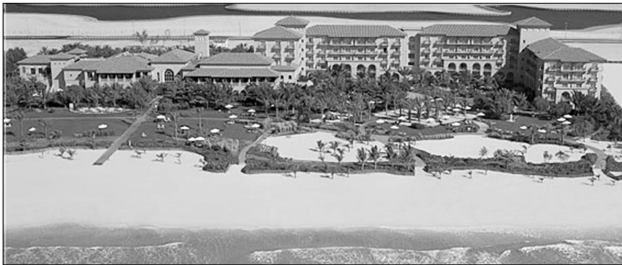
صورة بانورامية لفندق ريتز كارلتون دبي

يقدم فندق الريتز - كارلتون دبي خلال شهر رمضان المبارك، وكل يوم عند المغيب، على شرفات مطعم سبلنديو، خيارات اليوفيه الخاصة بالأفطار من وجبات باردة وساخنة وسلطات تقليدية وحلويات شهية افطار يوفيه مقابل 95 درهما للشخص الواحد، بينما يستمتع الضيوف بمنظر الغروب والشمس تغسل في مياه الخليج العربي لتتنسج بهدوء عند الافق البعيد.