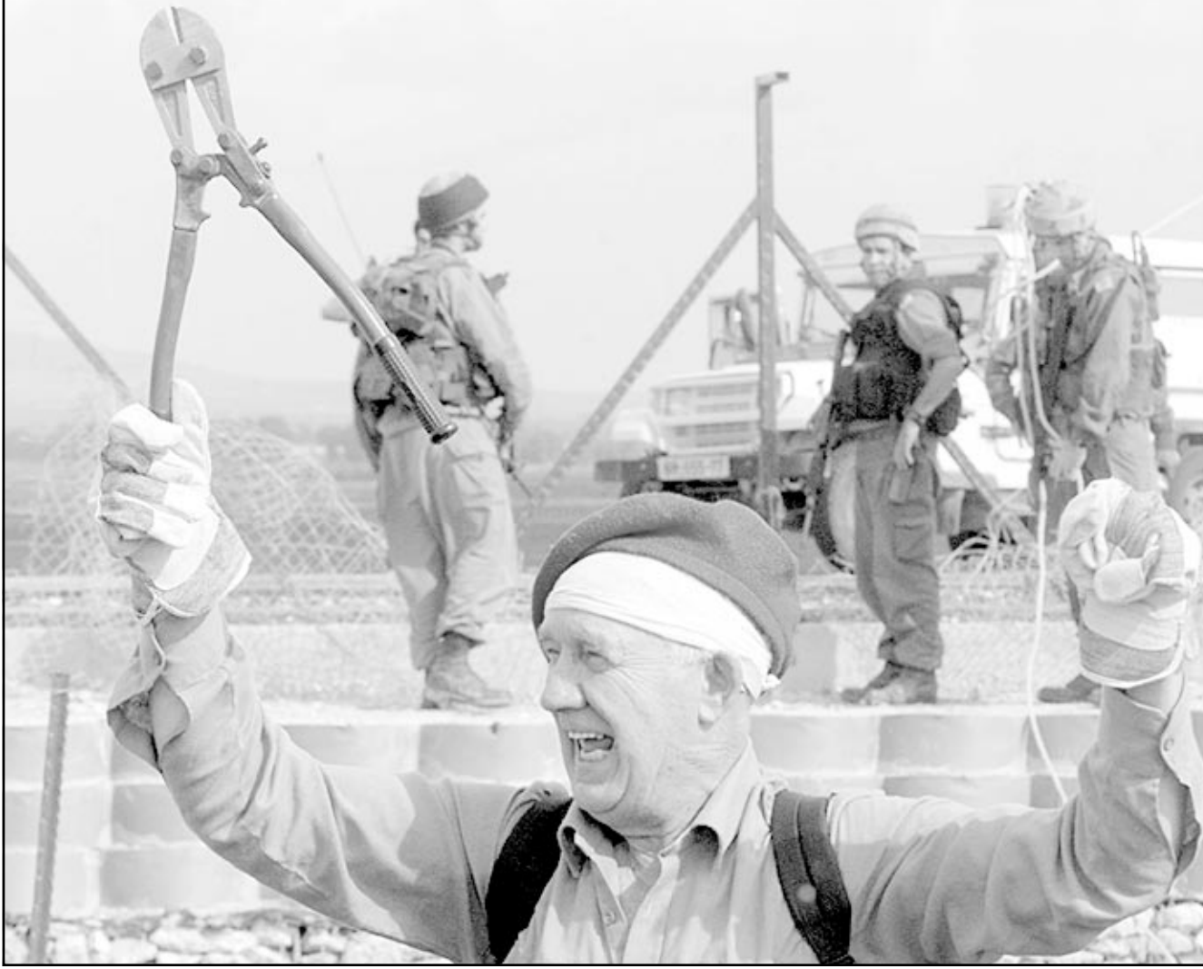
ناشط سلام غربي حاملا ألة قطع استخدمها في تقطيع اجزاء من السياج الاسرائيلي قرب جنين امس