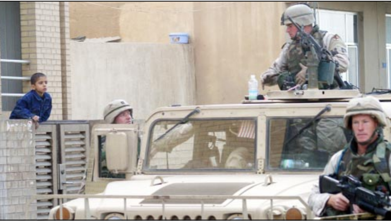
طل عراقي يتابع من شرفة منزله في بغداد سيارة عسكرية للاحتلال الأمريكي عشية العيد