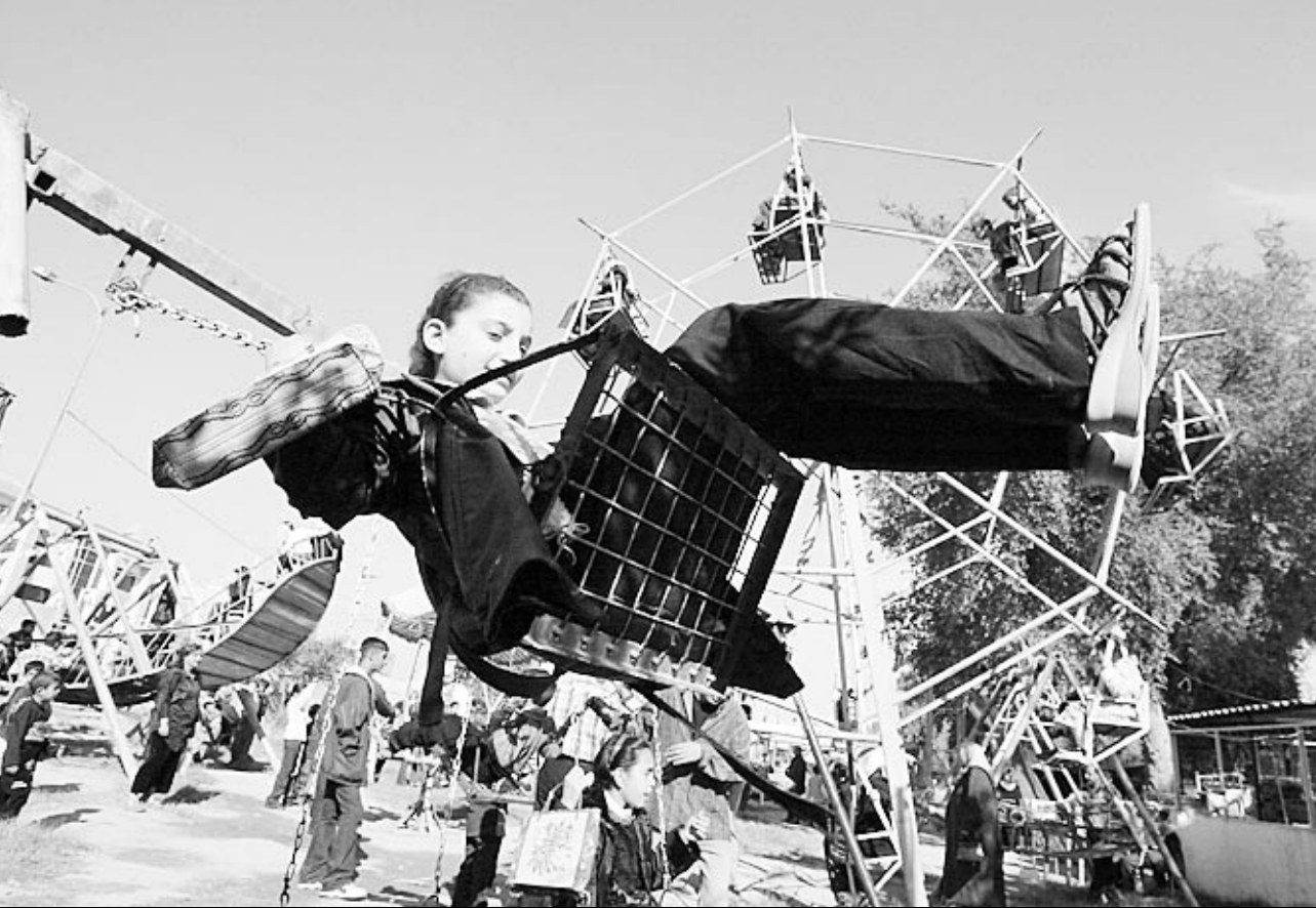
فيلة عراقية على الارجوحة في ساحة الملاهي في بغداد

رحل الامريكيون وشكلت حكومة جديدة وقرر النظام في بغداد الامريكية على اهية الاستعداد تحسبا لتكثيف الهجمات بعد انتهاء شهر رمضان. واحتفل اغلب السنة بعيد الفطر امس الاثنین في حين سيجتفل الشيعة الذين يمثلون 60 في المئة من سكان العراق بالعيد اليوم. وقال شهود عيان ان جنديين امريكيين اصيبا بالرصاص في مدينة الموصل الشمالية الأحد