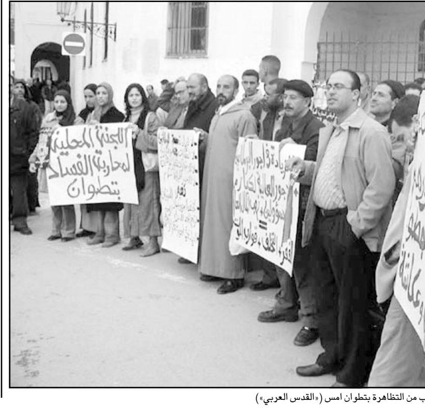
جانب من المتظاهرين بتظوان امس