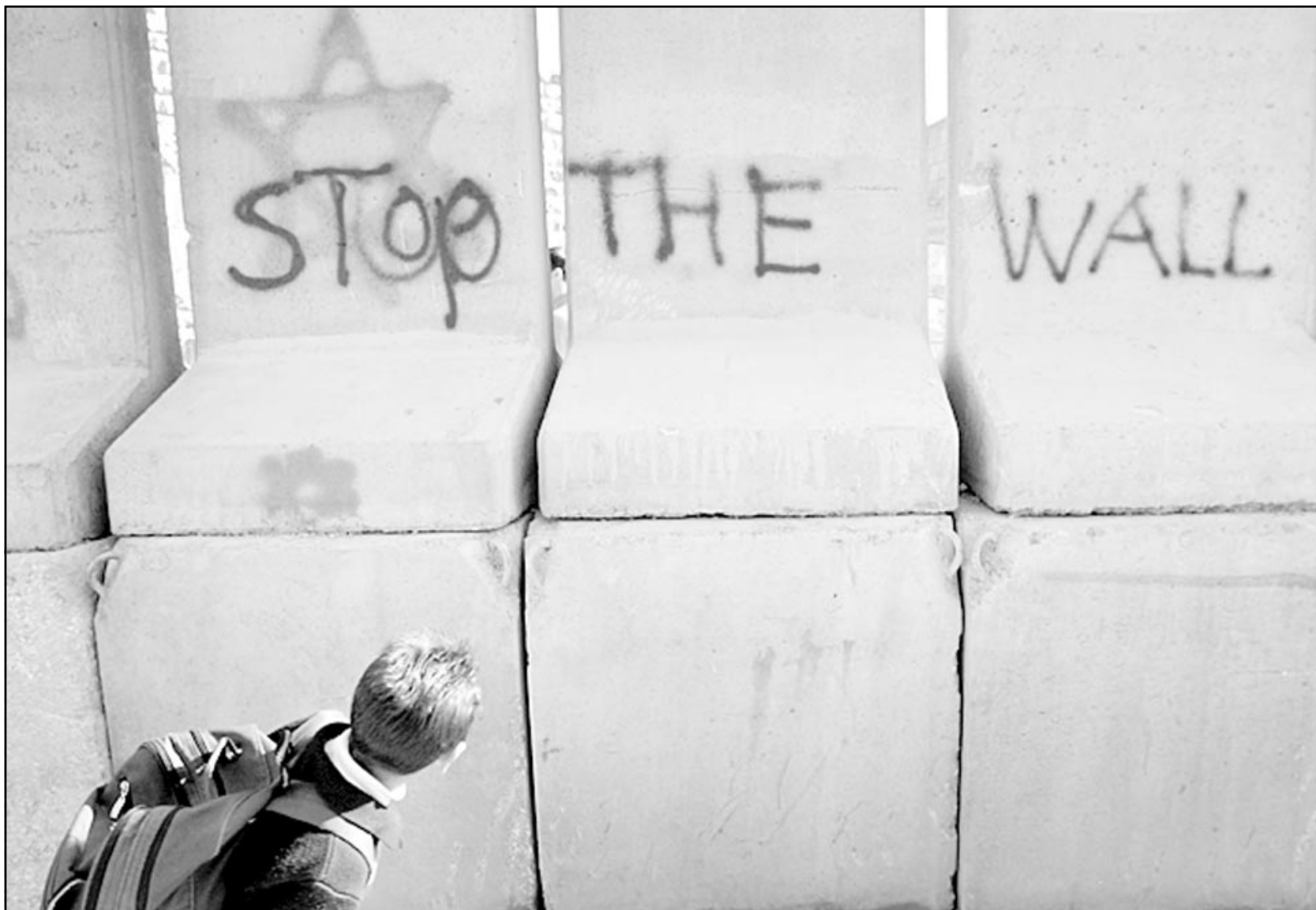
طفل فلسطيني يتطالع عبارة بالانكليزية على الجدار الذي يفصل القدس عن ابو ديس، تطالب بوقف بناءه (رويتز)

ورأى ان «من الجهدي ان الطريقة الامن والجمعية العامة ذات الصلة».