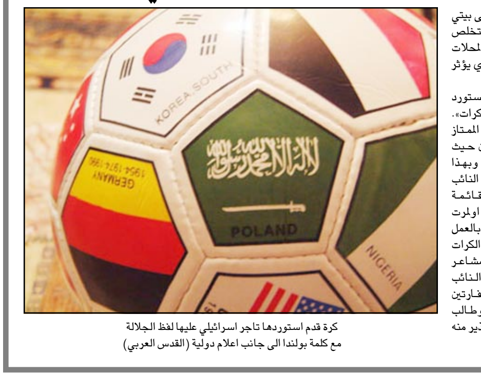
كرة قدم استوردتها تاجر اسراييلي عليها لفظ الجلالة مع كلمة بولندا الى جانب اعلام دولية

فأعلن خبير دفع ثمنها، وقمنا بنقلها الى بيتي لنحضر مكانية لأهلنا بلون آخر أو التلخص منها لان وجود مثل هذه الكرات في المجلات التجارية تعرضها لخطر البيع والذي يؤثر على مشاعر المسلمين». وتابع الشيخ محمود «طلبنا من المستورد عدم استيراد كمية أخرى من هذه الكرات، بقي ان تشير ان الكرات هي من النوع الممتاز والغالي الثمن مستوردة من الصين حيث كتب عليها انها صناعة صينية. وبهذا الخصوص بعث عبد الملك بهامشة النائب عن الحركة الاسلامية ورئيس القائمة العربية الموحدة برسالة الى اليهود اولمرت وزير الصناعة والتجارة يطالبه فيها بالعمل على منع استيراد وتسويق مثل هذه الكرات والالعاب التي من شأنها ان تفسد بشاعر وعقيدة المسلمين. كما وبعث النائب بهامشة برسائل مماثلة الى السفارتين المصرية والاردنية في تل أبيب وطلب المسؤولين بتعميم هذا الأمر والتحذير منه أيضا في الدول العربية نفسها.