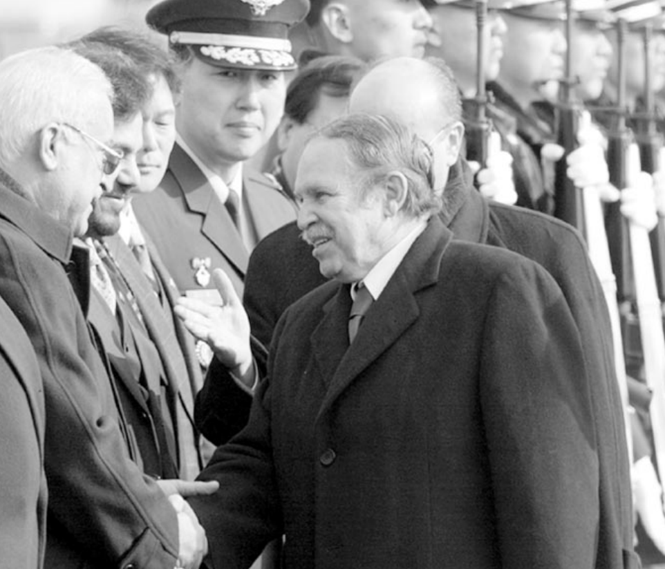
بوتفليقة لدى وصوله الى سيول امس

سيول - اف ب: ذكر مصدر رسمي ان الرئيس الجزائري عبد العزيز بوتفليقة وصل امس الاثنين الى سيول في زيارة رسمية تستمر اربعة ايام هي الاولى التي يقوم رئيس دولة جزائري الى كوريا الجنوبية.