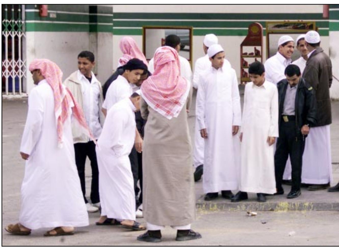
سعوديون جمهوراً يحيي السويد الذي شهد اشتباكات مسلحة بين قوات الامن وناشطين اسلاميين أمس

تدرب قوات أمريكية في صحراء النقب على اساليب عسكرية اسرائيلية متبعة في الاراضي الفلسطينية المحتلة، للتاهل في «الحرب على الارهاب»، وقمع المقاومة في العراق. وأكدت مصادر اسرائيلية ان الجيش الاسرائيلي صمم نموذجاً لمدنية فلسطينية في صحراء النقب لتدريب الجيش الاسرائيلي والقوات الخاصة التابعة له على اقتحام المدن الفلسطينية، ووضعها تحت تصرف القوات الأمريكية للتدريب عليها. وقال عن قائد عسكري أمريكي في تل أبيب قوله ان ضباطاً أمريكيين يزورون اسرائيل بشكل دوري مسند العدوان الأمريكي على العراق للاطلاع على الأساليب التي يتتبعها الجيش الاسرائيلي في الأراضي الفلسطينية المحتلة. وقال ان قوة من كبار الضباط الاسرائيليين يتابعون التدريبات الأمريكية في هذه المدينة، ويكرزون بشكل خاص على تأهيل ضباط ميدانيين قبيل توجيههم إلى العراق. وذكرت مصادر صحافية ان الجيش الأمريكي في العراق يتبنى اساليب عسكرية اسرائيلية لمواجهة المقاومة العراقية، حيث بدأت القوات الأمريكية بدم البناي التي يشبهه بأنها استخدمت من قبل المهاجمين العراقيين، كذلك بدأ الأمريكيون السيطرة على كامله بأسبججة من الاسلاك الشائكة، بهدف العسكرية وفحص الهويات الشخصية. وعقد دورات شبيهة لقوات أمريكية في اسرائيل قبل الحرب على العراق، وأكدت مجلة «نيويوركر» ان القوات