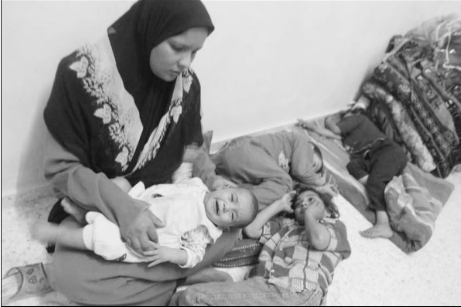
في آليات نظام الاستبعاد