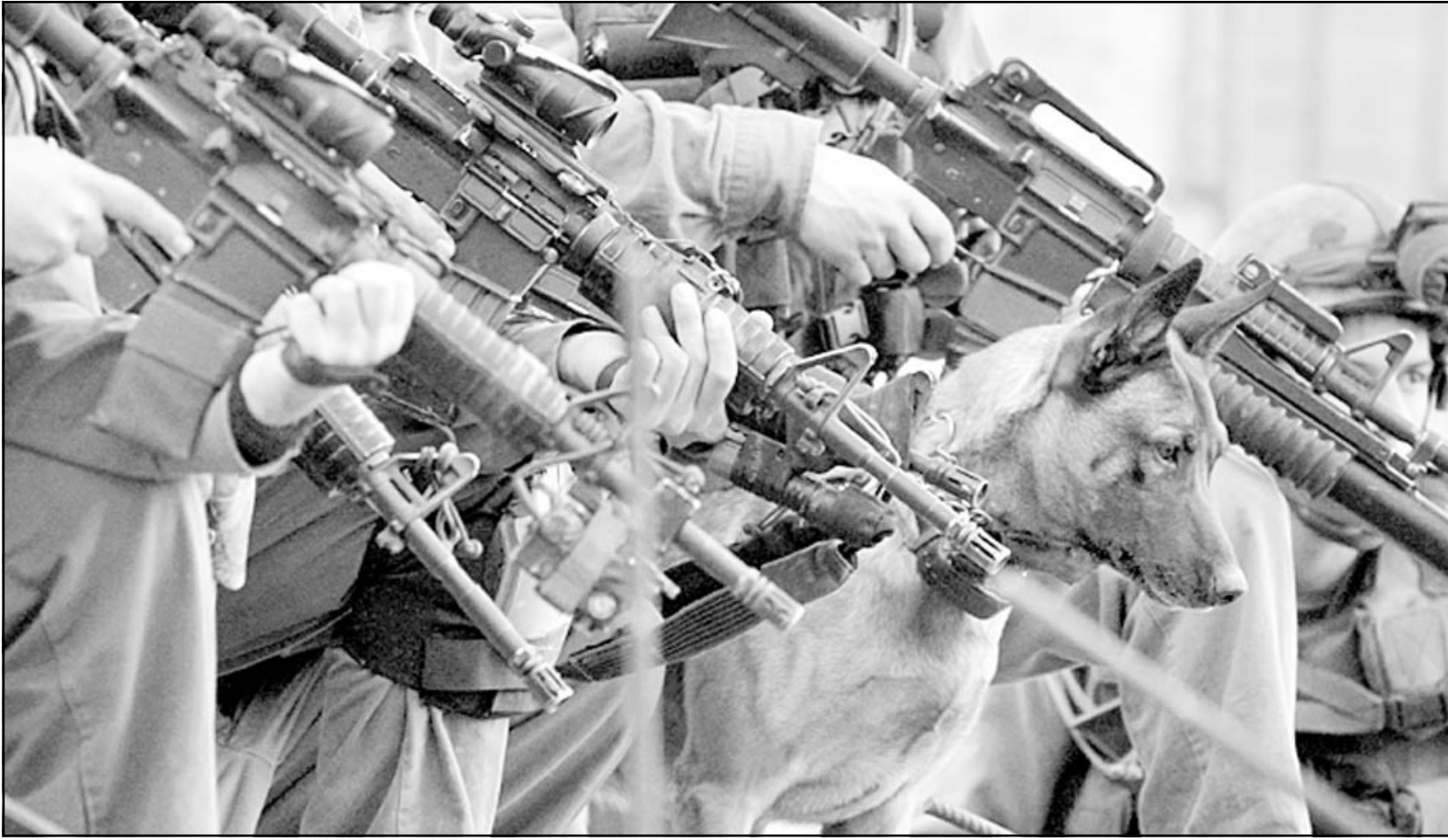
جنود اسرئائليون باسلحتهم وكلابهم يعيدون اقتحام مدينة نابلس بعد ساعات من الانسحاب منها

■ القدس - ا ف ب: يؤكد الفلسطينيون الباقون في القدس القديمة تعرضهم لمضايقات يومية من قبل المستوطنين بهدف حملهم على الرحيل من مساكنهم لمصادرتها والاستيلاء عليها.