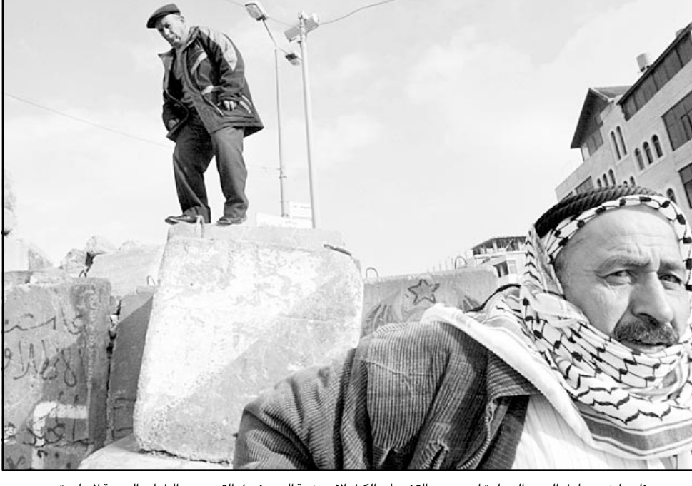
فلسطيني يحاول العبور إلى بلدة أبو ديس بالقرب من الكتل الاستعمارية التي تفصل القدس عن البلدات العربية المجاورة

■ فتي كنت عندما إحتلتنا، بل وشخت في ظل الاحتلال. أنكرت شجيرة الزيتون الاولى التي اقلعت، والحقل الاول الذي أبعد، كانت جلية، اما اليوم فهذا امر عادي. أنكرت البساتين الاول الذي هدم دون محكمة، كان هناك بعض الضجيج، اليوم تدمير البيوت عمل يومي، ليس حتى لأغراض العقاب، فقط من أجل البحث عن شيء ما أو أحد ما. أنكرت المظاهرات الفلسطينية الاول الذي قتل بالشار في مظاهرة، كانت فحوصات، تحقيقات، واصوات، اليوم يفتلون بالناجسة، يوجد اجراءات، يوجد عاده. أنكرت المظاهرات الاسرائيليين الـ 13 الاوائل الذين قتلوا في المظاهرات، كانوا عربياً، والسماح لم تستفد، كانت لجنة تحقيق، في صفحات استنتاجاتها لا ينقص سوى الإرقام في الهوامش وذلك لتسهيل النزع والاستخدام، ومن يوم الجمعة الماضي، وحتى تتشوش ذكريتي نهائياً، سأذكر المظاهر الاسرائيلي عبر العري الذي اطلقت فواتنا النار عليه، هو، مثل مئات العرب، لم يعرض حياً أحد للخطر، مجرد السالمة للوليا لخطيب حديدي عرضها للخطر، بل ورموا الاقفاً ومحور البوابة، باتدبير سيكون تحقيق، ستستخلص استنتاجات، ستخفيها ايضاً، ولكن السبيل الى العادة قد شق، مظاهره، لكن رصاصة اخرى، قتلوا اول، قتلوا آخر، واجراء اعتقال مشبوه، على نطق المناطق سيكون اخيراً متساوي للكمية: حكم المظاهر الاسرائيلي سيكون لغاية المظهر الفلسطيني، بدون تمييز في الظاهر، العنصر أو القومي.