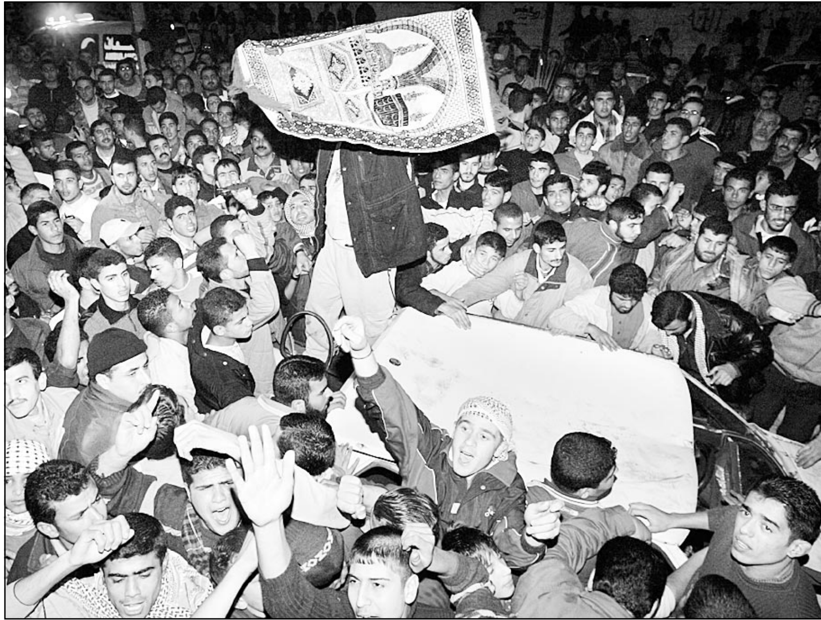
عشرات الفلسطينيين يتجمعون حول السيارة المحطمة بعد نجاها وكابها من قصف اسرائيلي بالمدروحيات الحربية مساء الثلاثاء في غزة