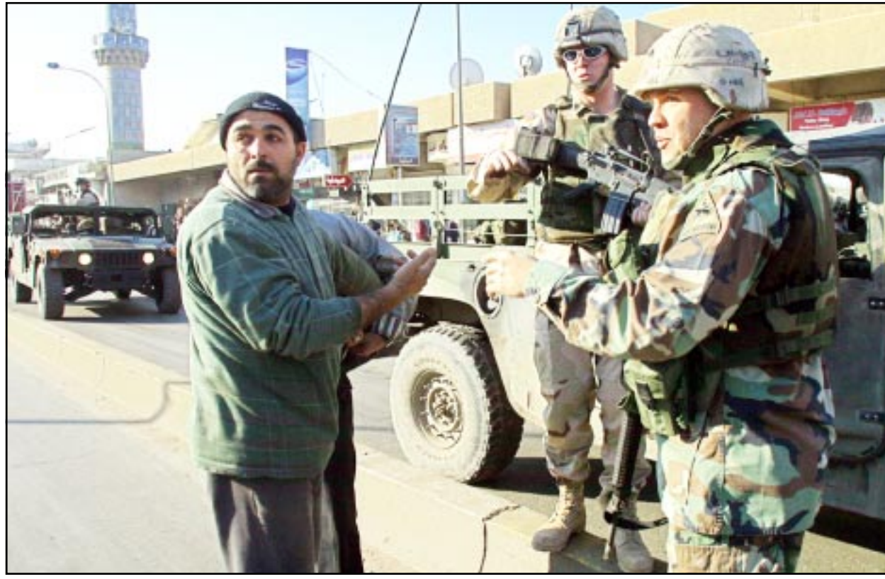
جنديان امريكيان في حي الكركوة الذي شهد انفجارا جديدا الثلاثاء

الوطني العراقي» الذي يتزعمه احمد الجليلي اقليم كردستان يتضمن كل المناطق التي تتكون غالبيتها من الاكراد حسب التعداد السكاني لعام 1957.