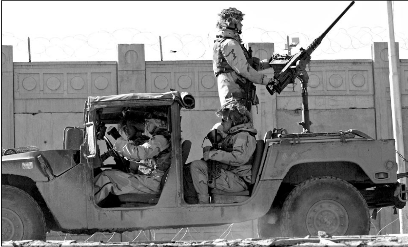
سيارة عسكرية امريكية في بغداد الثلاثاء

عودة الجائمين ومرافقتها في رحلة العودة الى الوطن.