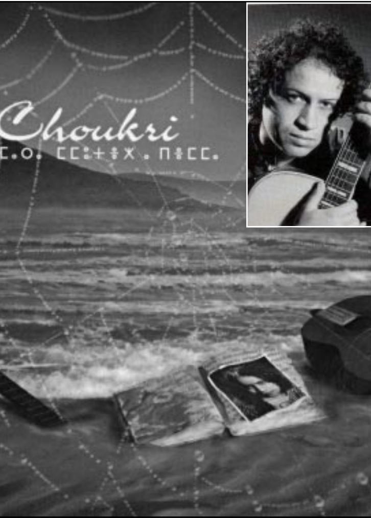
غلاف CD، لومت يا امي، وفي الاطار صورة الفنان

■ نعمتني ان يكون النهج الموسيقي يساهم في ذلك.