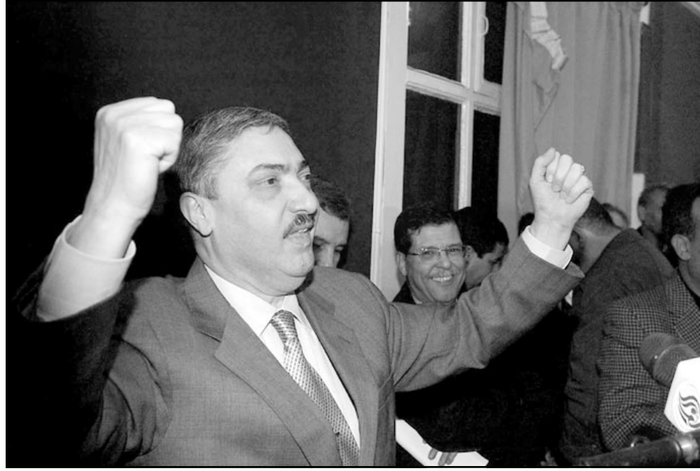
علي بن فليس يخبط امام انصاره عقب صدور قرار المحكمة امس

ابولوسبتمبر الماضي ان الرئيس الجزائري عبد العزيز بوتفليقة الذي في المرتبة الاولى بـ 43% في الورى الأول من نسبة 42% من المسجلين الذين يتون المشاركة في الاقتراع، ويلي عليه بن فليس منافسه القوي رئيس الحكومة السابق والأمين العام لجبهة التحرير الوطني صاحبة الأغلبية في البرلمان 19%، ثم سعد عبد الله جباب الله رئيس حركة الإصلاح الوطني الإسلامية الحائزة على 43 مقعداً في البرلمان 9.8%، وكان الراحل محفوظ خناتج رئيس حركة مجتمع السلم الرئاسية المشاركة في الائتلاف الحاكم حصل على المرتبة الثانية في انتخابات الرئاسة سنة 1995 بـ 2%. وأرجع غالبية المستجوبين اختيبارهم للرئيس بوتفليقة لدوره في تسيير صورة الجزائر في الخارج، والسياسة واليوم المدني الخاصة بالجماعات المسلحة التي تمكن من خلالها تخفيف التوتر الأمني الذي تعيشه البلاد منذ 1992 تاريخ لخص العسكر لنتائج الانتخابات التشريعية التي اعطت الفوز للجبهة الإسلامية للإنقاذ المحظورة حالياً، وفي المقابل ابدوا استياءهم من اداء الرئيس في الأربع سنوات الاخيرة في مجال محاربة الفقر والمبطالة والرشوة ونقص فرص العمل. ويتهم على بن فليس ومن خلفه من الاحزاب المصنوية على التيار العلماني الذين تبغوا بعناية وقائع المحاكمة، «بمطلة بالترزوير» وعلى اساس انه اعتقل قبل التمكن من تقديم طعنه في صحته. ووصف تجمع المحامين الموريتانيين المدافعين عن ولد هيدالة ومجموعته في بيان امس محاكمة الرئيس السابق بانها مهزلة مؤكداً انها نظمت على اساس «ملف فارغ لتصفية حسابات سياسية» مع الرئيس السابق قصد