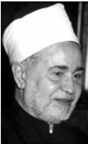
الشيخ محمد سيد طنطاوي

من جهته دعا مفتي مصر الشيخ علي جمعة الذي شارك في استقبال ساركوزي في شبيخة الأزهر ولكنه لم يحضر اجتماعه مع الشيخ طنطاوي المسؤول الفرنسي في مراجعة قرارهم مخذرا من اضطرابات قد تقع إذا صدر هذا القانون. وقال ان من حق أي دولة «اصدار القوانين بطريقتهم الديمقراطية» ولكن «على سبيل التصحیح القول واكرر لاخواننا الفرنسيين، ونحن نعتز بهم وهم يفقون معنا في كثير من المواقف، اننا نرجو منهم ان يقعوا في مثل هذا الخطأ الذي يؤدي الى نفض العلمانية والى تقويض السلام الاجتماعي داخل المجتمع الفرنسي».