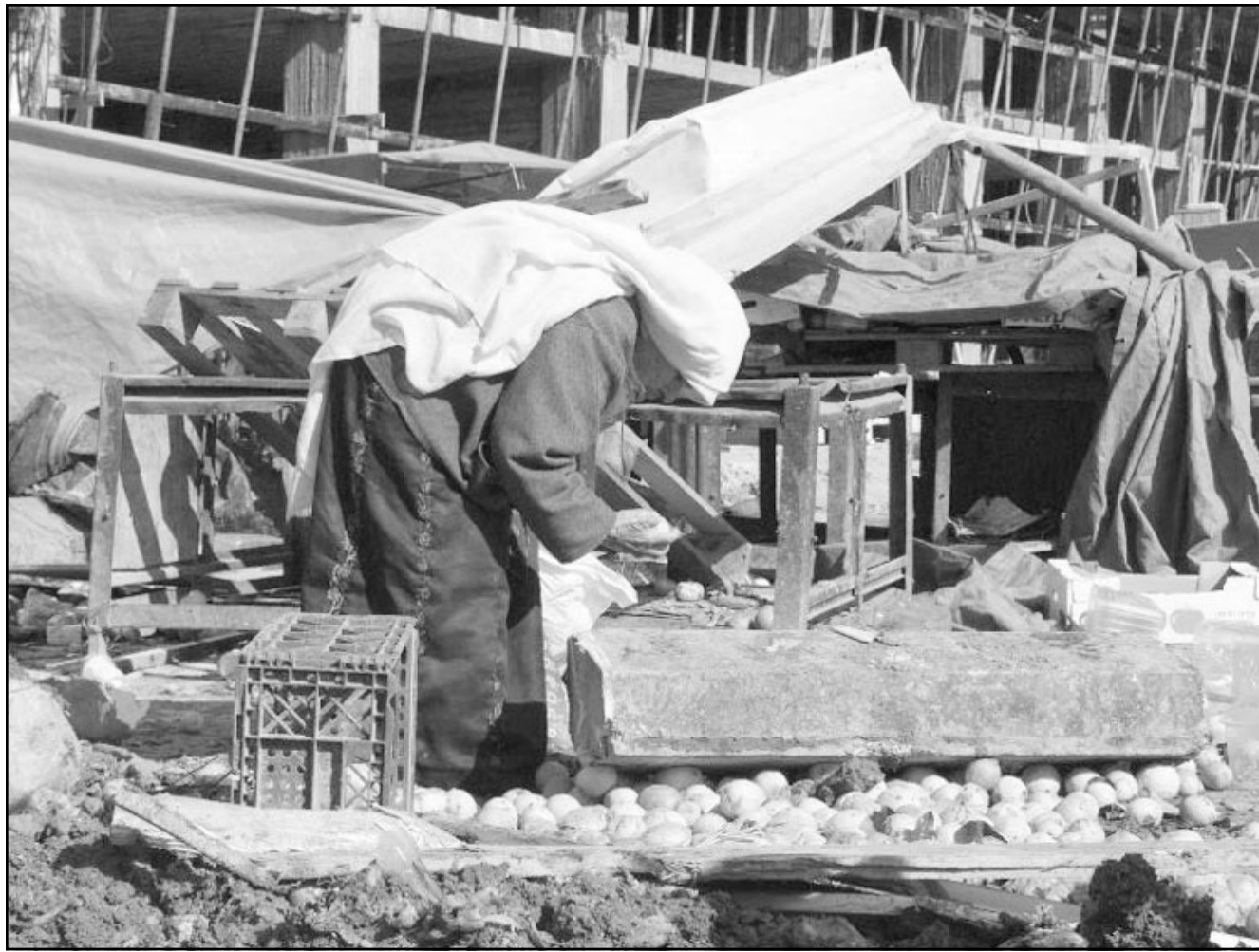
سيدة فلسطينية تجمع ما تبقى من بضاعتها بعد تدمير جيش الاحتلال الاسرائيلي لسوق الخليل المركزي

غزة، ففي الوقت الذي أفادت فيه النتائج بتحسّن ظروف الحركة خلال الشهر الماضي مقارنة بالشهور السنة الماضية في قطاع غزة، حيث أفاد 93,5% من أصحاب المنشآت الاقتصادية حول الأوضاع الاقتصادية خلال شهر تشرين الثاني (نوفمبر) كانت سهلة مقارنة بما نسبته 89,2% في الشهور السنة الماضية، يرى 75,2% من