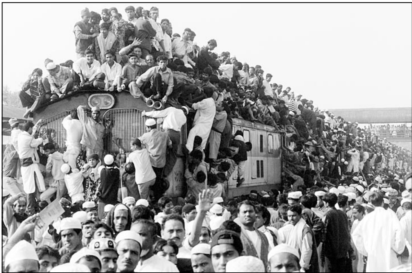
قطار قرب العاصمة النيجلاديشية عشية رأس السنة (رويتز)