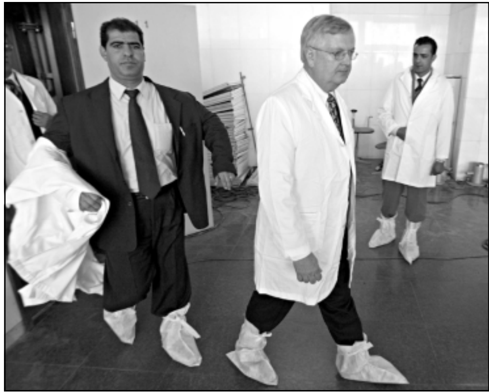
الناشط كرت ولدن يتقدم مشاة ثورية ليبية امس الاول