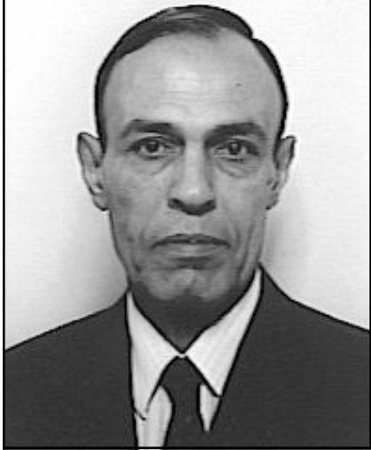
عبد الجبار الكبيسي

ينظام حكم، يقوم على اساس ديمقراطي تعددي، (وتقوم على اساس الوطنية والإنتماء للعراق) فالعراق لكل العراقيين.