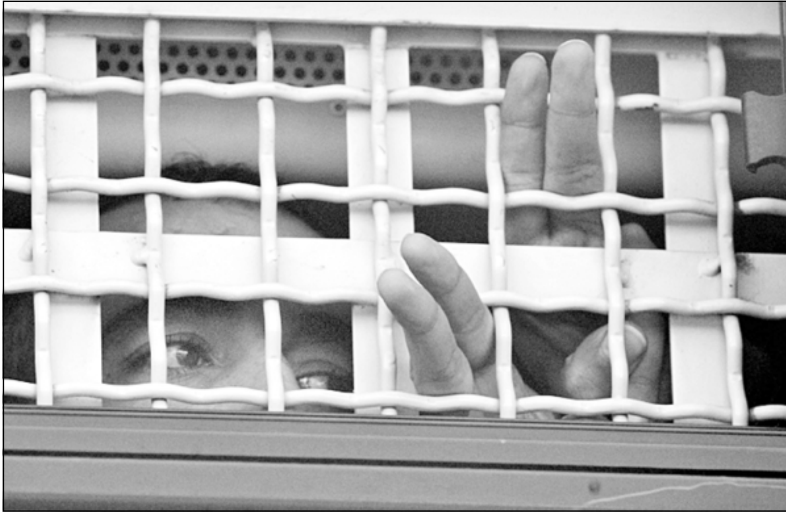
أحد الاسرى المتوفع اطلاق سراحه يحاول اخراج يده من نافذة حافلة اقلت مجموعة من المعتقلين في تانانيا (س)