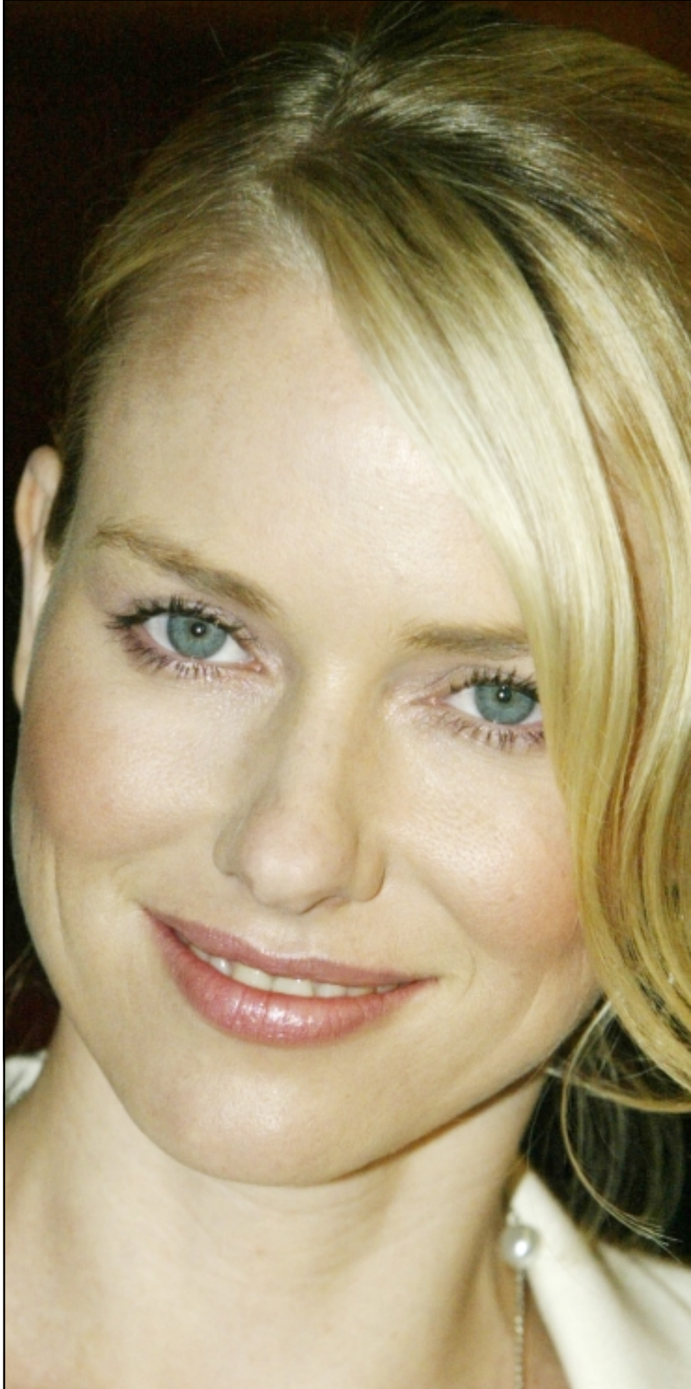
النجمة الاسترالية ناومي واتس حصلت على جائزة جمعية نقاد السينما في لوس انجليس عن دورها في فيلم «21 غراما»

لندن - رويترز: قال براين ماي عازف الجيتار في فرقة كوين الذي استخدم احد الصان في اعلان لبيبيسي تشترك فيه نجومات البوب الشهيرات بريتي سبيرز وبيونسبه ونول وبيبيك مع المزيكي اجلاسياس ان تصور كل هؤلاء النجوم مجتمعين على مسرح في العاصمة الايطالية روما يجعله يشعر بسعادة غامرة. هجم العجبون في حماس على النجمات الثلاث في ميدان الطرف الاغر في العاصمة البريطانية لندن حيث اذيعت الاغنية. حظي الاعلان الذي يقوم فيه اجلاسياس بدور الامبراطور الشرير بعرض اول في العرض الوطني بلندن مثل عروض افلام عاصمة السينما الأمريكية هوليود. وصرح ماي بان العمل ليس مجرد اعلان تجاري، وقال لرويتزر «اعتقد في نهاية الامر انه سيكون عملا فنيا جيدا. تنفق اموال اكثر وتبذل موهبة اكبر في كل ثانية من الاعلان التجاري بالمقارنة باي عمل اخر».