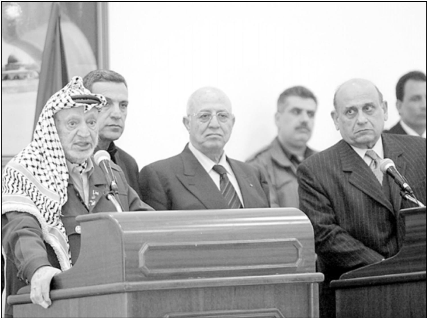
عرفات وماهر يتحدثان للصحافيين عقب لقائهما في رام الله امس

وتطالب خطة خارطة الطريق الفلسطينيين بكبح جماح الشنطة الذين يشنون عمليات ضد اسرائيل. وتطالب الخطة اسرائيل بازالة عشرات من المراكز الاستيطانية اليهودية القائمة في اراض محتلة وان تتوقف عن بناء 150 مستوطنة اكبر في الضفة الغربية وقطاع غزة وتخفف المضاعب التي يعاني منها الفلسطينيون بسبب الحصار العسكري. ويتهم كل من الجانبين الآخر بعدم الانعاز للخطة التي تدعو الى اقامة دولة فلسطينية بحلول عام 2005 جنبا لجنب مع اسرائيل. وهذه هي الزيارة الاولى لماهر للمنطقة منذ ان هاجمه فلسطينيون داخل المسجد الاقصى الشهر الماضي اثناء اول زيارة له لاسرائيل منذ بدء الانتفاضة الفلسطينية ضد الاحتلال الاسرائيلي عام 2000. واصدر وفد الخارجية الامريكية الى وولف.