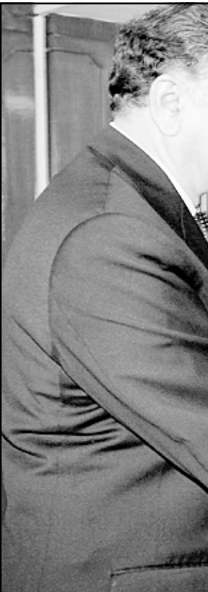
مسؤول وزارة الخارجية الباكستانية ريانز كوهار يصافح نظيره ارون كومار سين خلال اجتماعهما في اسلام اباد

توصلت الهند وباكستان امس الثلاثاء «تفاهم واسع، بشأن اطار محادثات السلام بعد يومين من الاجتماعات في اسلام اباد». وقالت الخارجية الباكستانية في بيان بعد محادثات اجراها مسؤولي وزاري الخارجية الهندي والباكستانية «ممكن التوصل الى تفاهم واسع بشأن شكل الحوار المركب والاطار الزمني لبيده». ومن المقرر ان يجتمع وزيراً خارجية البلدين في العاصمة الباكستانية اليوم الاربعاء، وجاء في البيان ان المفاوضات سيرضون عليهما توصيات للموافقة عليها. وهناك اتفاق عام على احياء «حوار مركب» يغطي ثمانية نقاط للنزاع في اطار عملية سلام تعثرت عام 1998 ثم انهارت تماما في قمة فاشلة عقدت في مدينة اجرا بالهند في نومز (بوليو) عام 2001. ولا تزال الخلافات قائمة بين الجانبين حول الاطراف التي ستشارك في المحادثات التي تحدد منطقة كشمير التي تقطنها غالبية مسلمة والواقعة في جبال الهمالايا والتي كانت سببا في حربين من بين ثلاث حروب نشبت بين الجانبين. وتطالب باكستان بان يكون الحوار حول كشمير على المستوى السياسي للحفاظ على قوة الدفع التي تحققت خلال اجتماع تاريخي عقد الشهر الماضي بين الرئيس الباكستاني سديق بريز مشرف ورئيس وزراء الهند اتال بيهساري فاجباني، بينما فضل الهند تلك المحادثات كشمير لوزارتي الخارجية ووزير الخارجية الباكستاني خورشيد محمود قسوري بتسريع المحادثات لتحقيق انفراج قبل ان يتخلى الرئيس الباكستاني