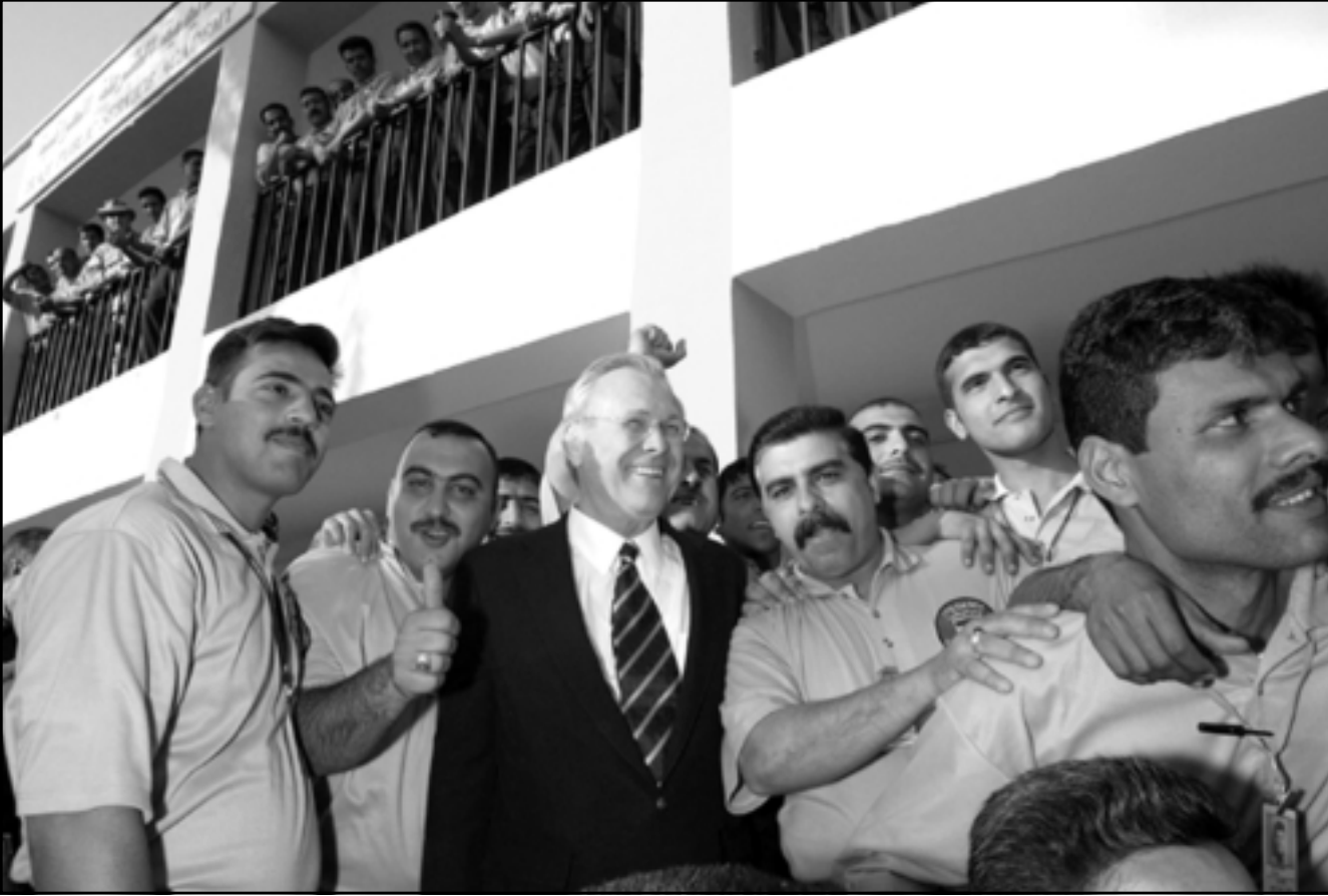
وزير الدفاع الامريكي الجنرال رامسفيلد بين جنود عراقيين في بغداد امس