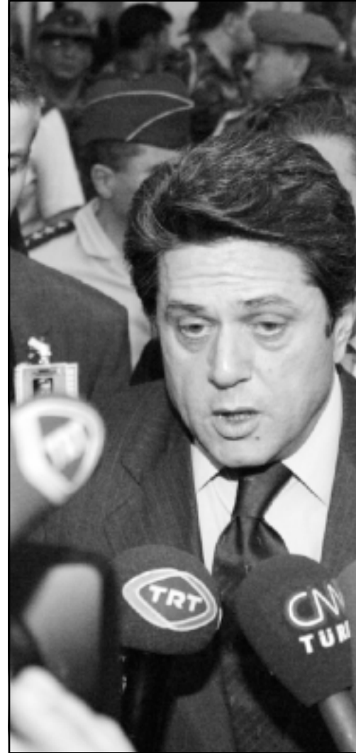
وزير الدفاع الاسباني فديريكو تريليو

وهناك من فسر ذلك برغبة المغرب عدم إثارة تعويض على اوبواب الحملة التي تعيش على ايداع الحملة الانتخابية وبالتالي قد يسقيف الحزب الشعبي من هذه الأزمة، خاصة وأنه تعود على استراتيججة التخفيف من المغرب.