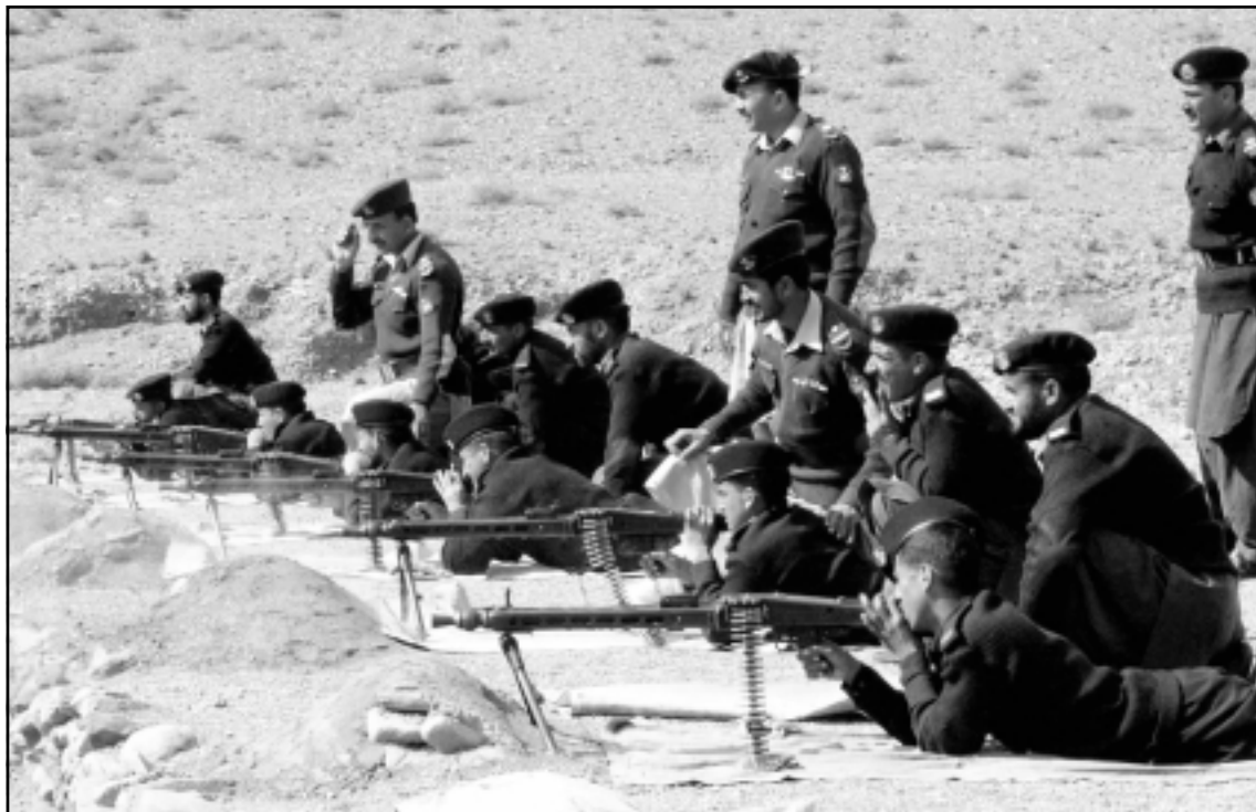
تدريبات باكستانية على الحدود الافغانية لتحصير الملمة واسعة ضد طالبان

السابقين. وقد تصاعد هذا الخلاف بخلافات تتعلق بعقوبات بين منظمات من المسؤولين السابقين في نظام نجيب الله الذي طردوا من مناصبهم بعد سقوط النظام في 1992 ويطالبون اليوم باستعادتها. وتؤكد جمعيات محلية ان عددا كبيرا من الاسر القريبة من المهجرين كبرت ايضا بتأمين سكن للشيوخين السابقين.