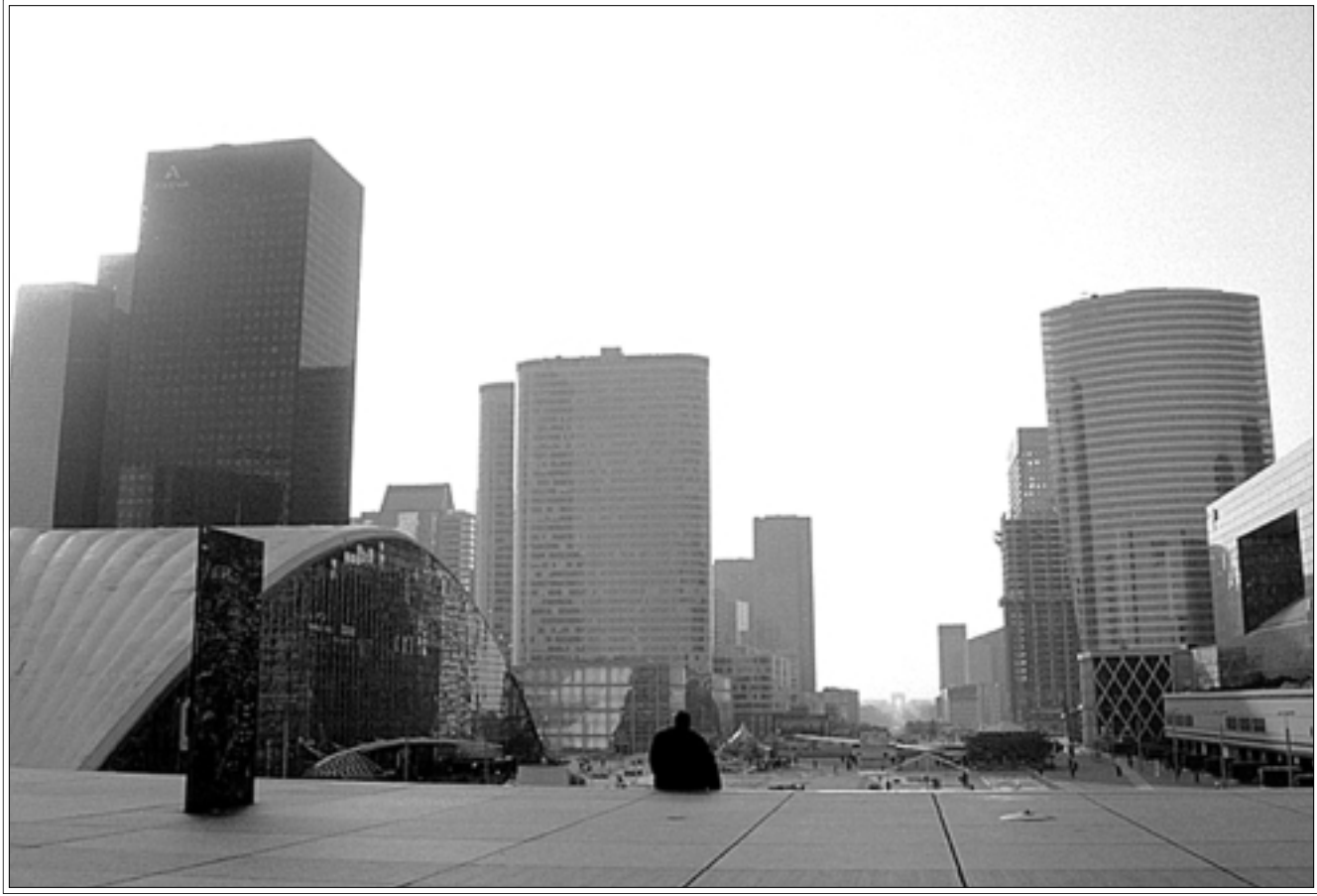
حي لايفانس بباريس (القدس العربي)

وفي حي لايفانس بالذات، انطلق مشروع برجين سيتانفسان برج مونتياناس من حيث العلو، فهل بنيا على حين غرة؟ قال المهندس لوكير: «وجود أبراج في ذلك الحي عائد لضغوط مالية وعقارية، وظهور البرجين لن يصدد أحداً لأنهما سيضافان إلى أبراج أخرى، وحي لايفانس منسجم مع نفسه، وتخضع المشاريع الهندسية لتقاش جماعي يشارك فيه خبراء ومصممون ولجان وظيفية وجمعيات، وتسجم الأنظمة الجديدة ووسائل التعبير الجسمة والبصرية الرقمية باختبار