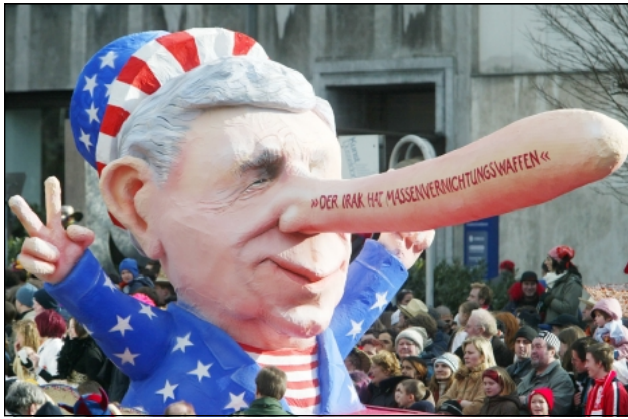
دمية تمثل الرئيس الامريكى جورج دبليو بوش في مهرجان في ألمانيا وقد كتب على انفه «العراق يملك أسلحة دمار شامل»

جدد وزير الدفاع الامريكى دونالد رامسفيلد تهديداته لسورية وايران، اثناء زيارته لبغداد امس، مؤكدا انها يسبحان للمتسللين بعبور حدودهما الى داخل الأراضي العراقية. وقال رامسفيلد متحدثا لصحافيين في العاصمة العراقية «ان سورية وايران لم تساعد الشعب العراقي». وتابع ان هذين البلدين «سبحا لشخص بالعبور من اراضيهم الى العراق» لتنفيذ هجمات ارهابية ضد الشعب العراقي. وقال رامسفيلد «اننا نأمل ان يكون العراق من اجل ان يتبدل سلوكهما هذا».