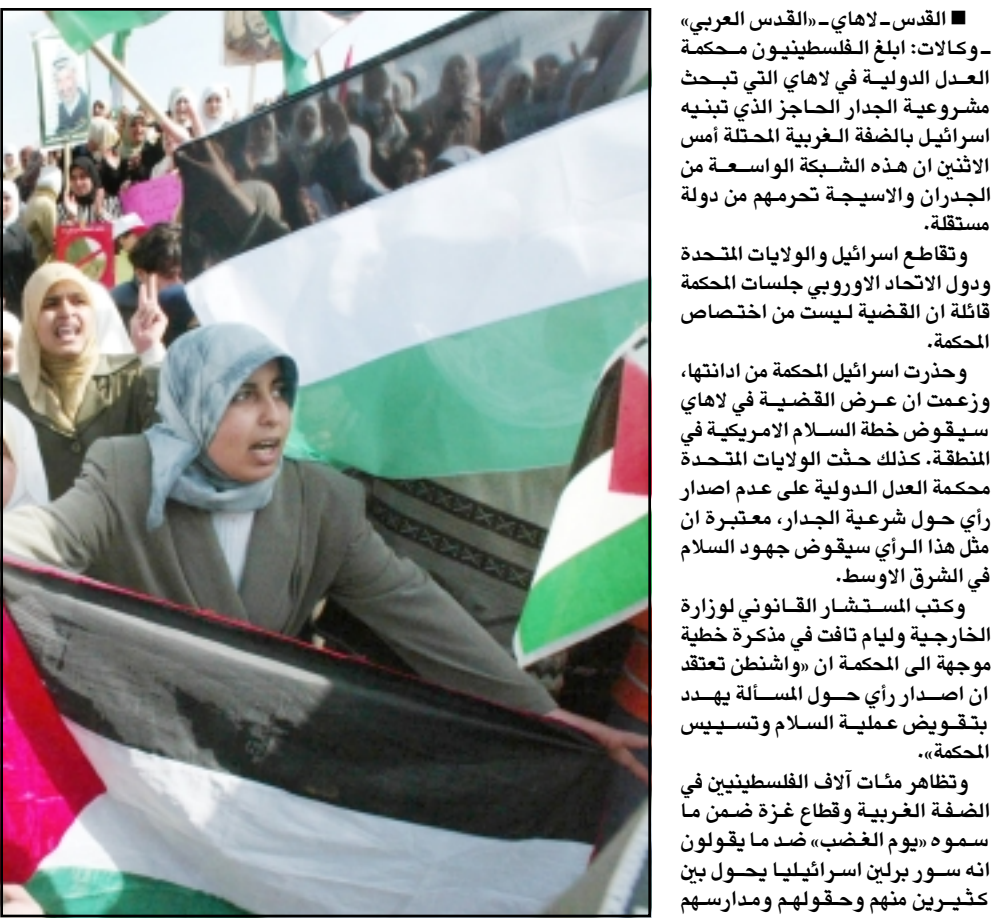
فلسطينيات يتظاهرن احتجاجا على بناء الجدار الفاصل

اعلنت الحركة الشعبية لتحرير السودان التي يتزعمها الدكتور جون قرنق عن تكوين اتحاد نساء السودان الجديد واتحاد شباب السودان الجديد. جاء هذا الاعلان خلال المؤتمر الصحافي الذي عقدهته مجموعة قيادية برئاسة رمضان عبد الله الذي ظهر كممثل للحركة لأول مرة عند زيارة وفدنا للحزب الوطني الديمقراطي. وقد تم استناد رئاسة اتحاد نساء السودان الجديدة اشيا وبتنسيق ورئاسة شباب السودان الجديد الذي عقدهته مجموعة قيادية برئاسة رمضان عبد الله الذي ظهر كممثل للحركة لأول مرة عند زيارة وفدنا للحزب الوطني الديمقراطي. وقد تم استناد رئاسة اتحاد نساء السودان الجديدة اشيا وبتنسيق ورئاسة شباب السودان الجديد الذي عقدهته مجموعة قيادية برئاسة رمضان عبد الله الذي ظهر كممثل للحركة لأول مرة عند زيارة وفدنا للحزب الوطني الديمقراطي.