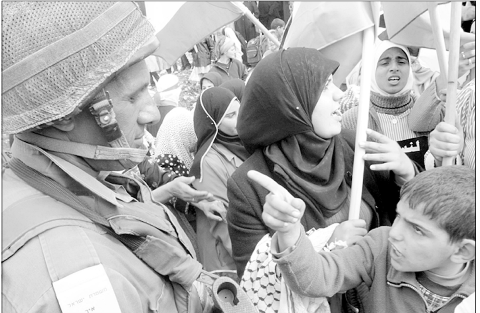
طل فلسطيني يجادل جنديا اسرائيليا اثناء مظاهرة ضد بناء الجدار العازل في قرية يدوس بالضفة الغربية المحتلة امس

وقال عرفات في كلمته التي ألقاها صباح امس قبيل بدء جلسات محكمة العدل الدولية في لاهي للنظر في مشروعية الجدار الفاصل: «إن شعبنا الفلسطيني الضامد، للرابط في وطنه، وفي أرض آبائه وأجداده، يعلن اليوم للعالم كله، أن جدار الضم والتوسع والفصل العنصري، قد حول مدننا إلى معقلات وسجون جماعية، وصادر أرضنا واقتلع أشجارنا،