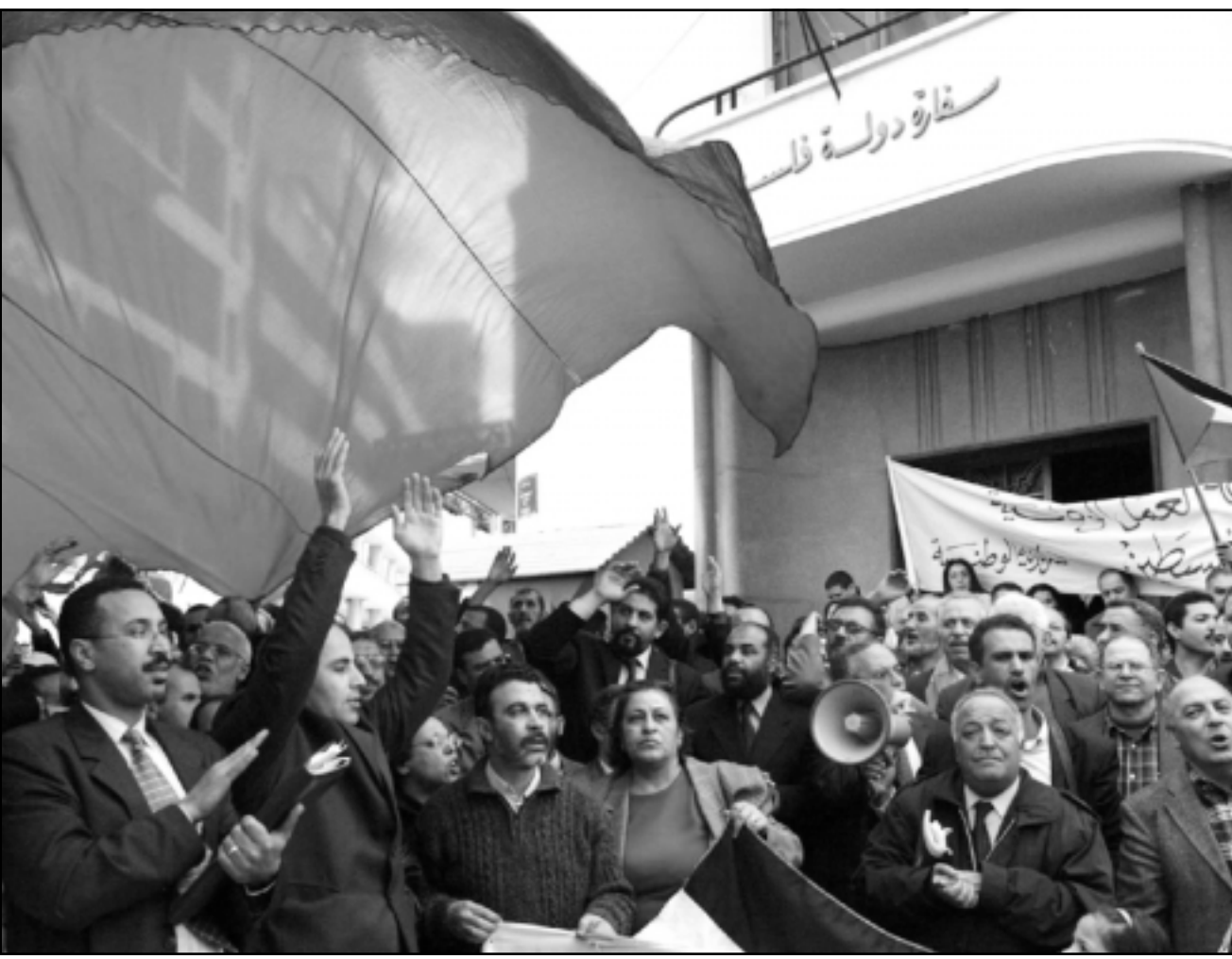
جانب من المظاهرة امام سفارة فلسطين بالرباط أمس

على هامش اجتماع أوروبي ان والنتافضة ضد المحتل.