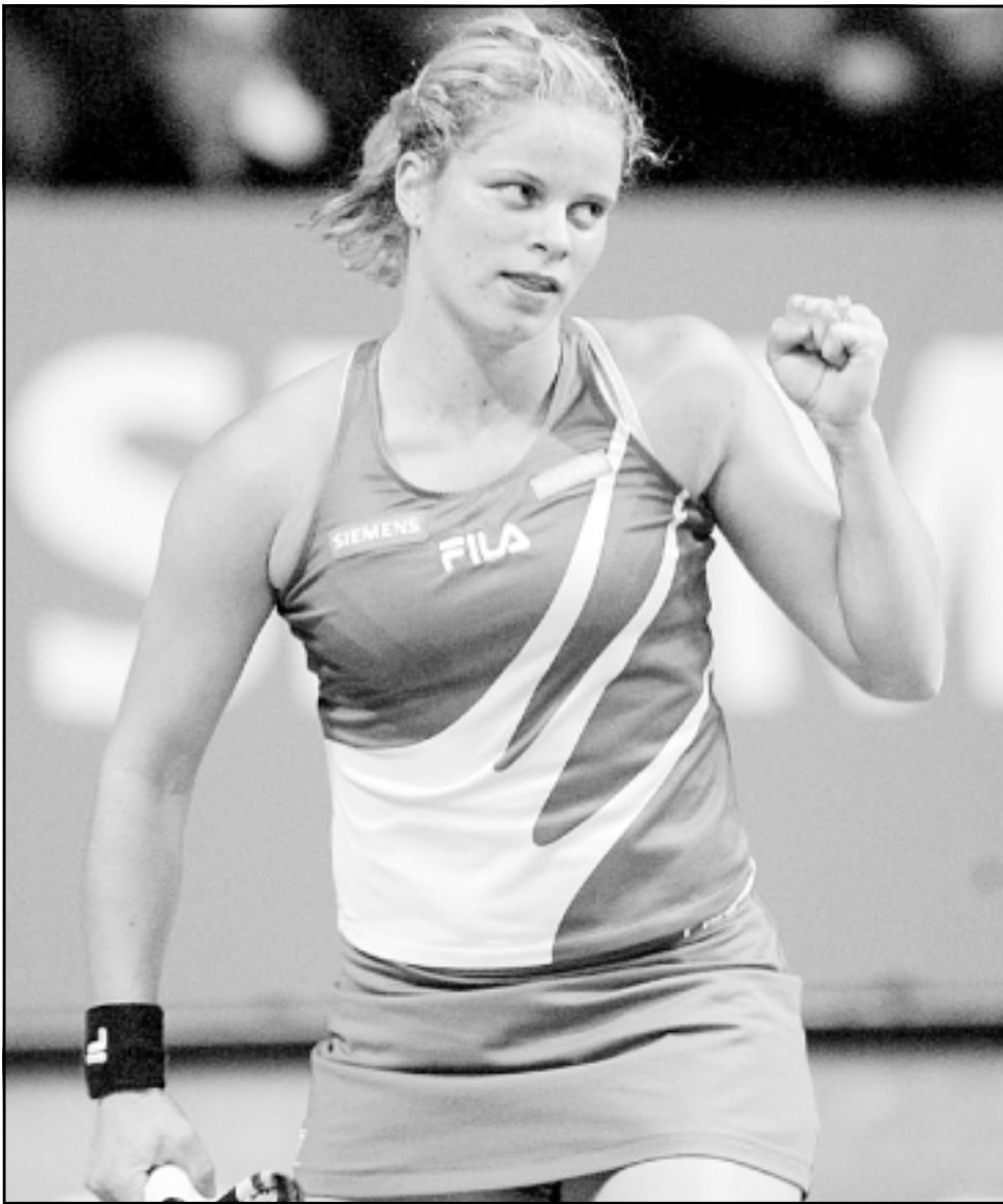
اللاعبة البلجيكية كيم كليسترز

وتنافس خمس دول أفريقية على استضافة كأس العالم 2010 وهي المغرب وجنوب أفريقيا ومصر وليبيا وتونس. ووجه المغرب الدعوة لسكولاري لزيارة البلاد وهي أول زيارة له للدولة الأفريقية لاستضافة من نصاعته وابعادها بخصوص منشآت البلاد الرياضية بصفته «الرجل الذي درب بطل العالم لكرة القدم».