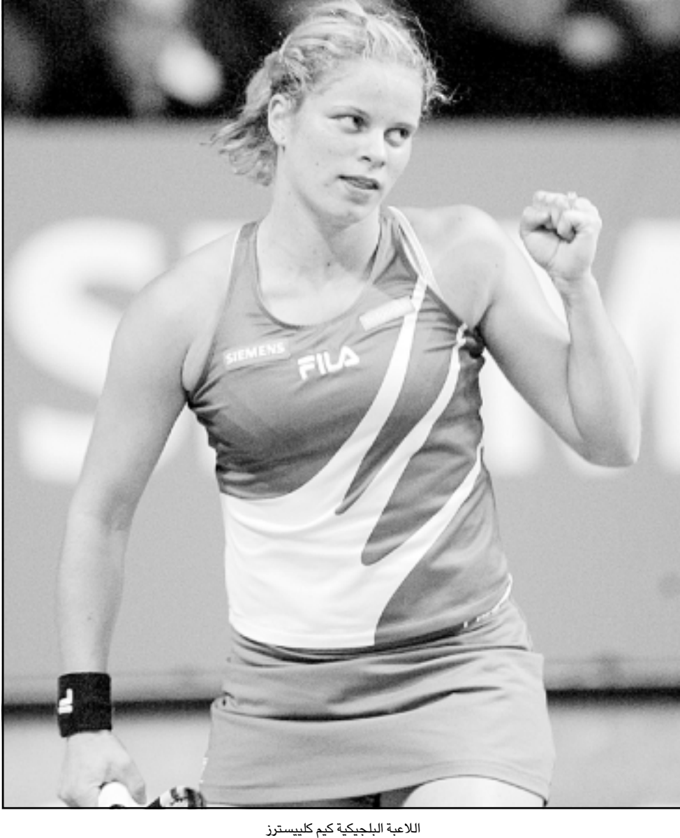
اللاعبة البلجيكية كيم كليسترز

■ الرباط- أ ف ب: اعتبر الأمريكي الـ روتنبرغر رئيس اللجنة المنظمة لكأس العالم عام 1994 في الولايات المتحدة والذي عين مستشاراً للملف المغربي لاستضافة مونديال 2010 بأن المغرب يمكنه منافسة فرنسا وإيطاليا في جاهد أكثر من أي وقت مضى على استضافة كأس العالم 2010 الأولى في القارة الأفريقية، ويتنافس المغرب مع