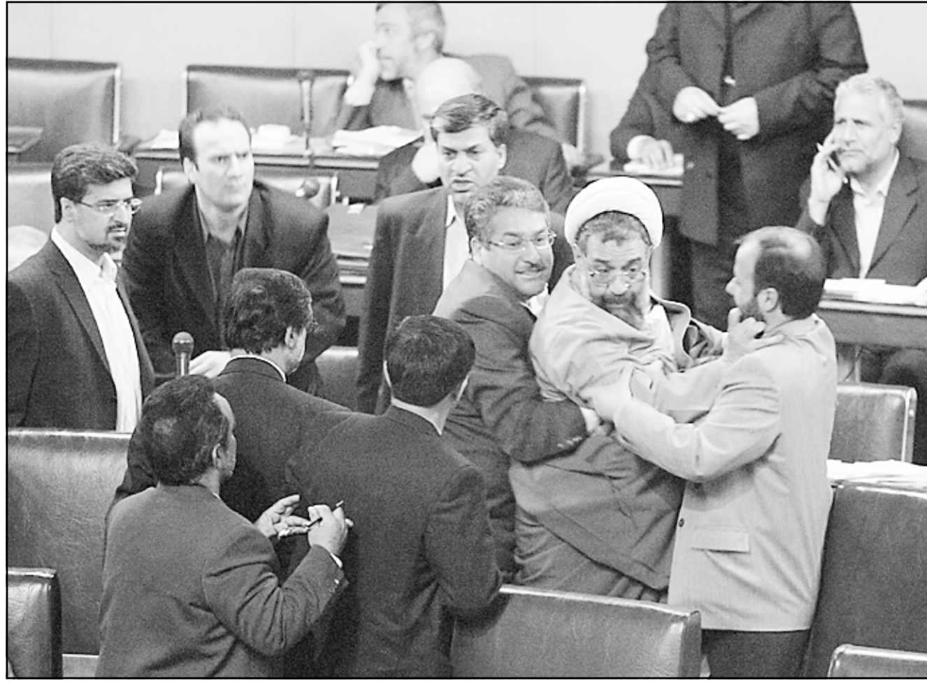
مشاهدة بين نواب إيرانيين في مجلس الشورى أمس

طهران - «القدس العربي» - من قاطمة البديري: