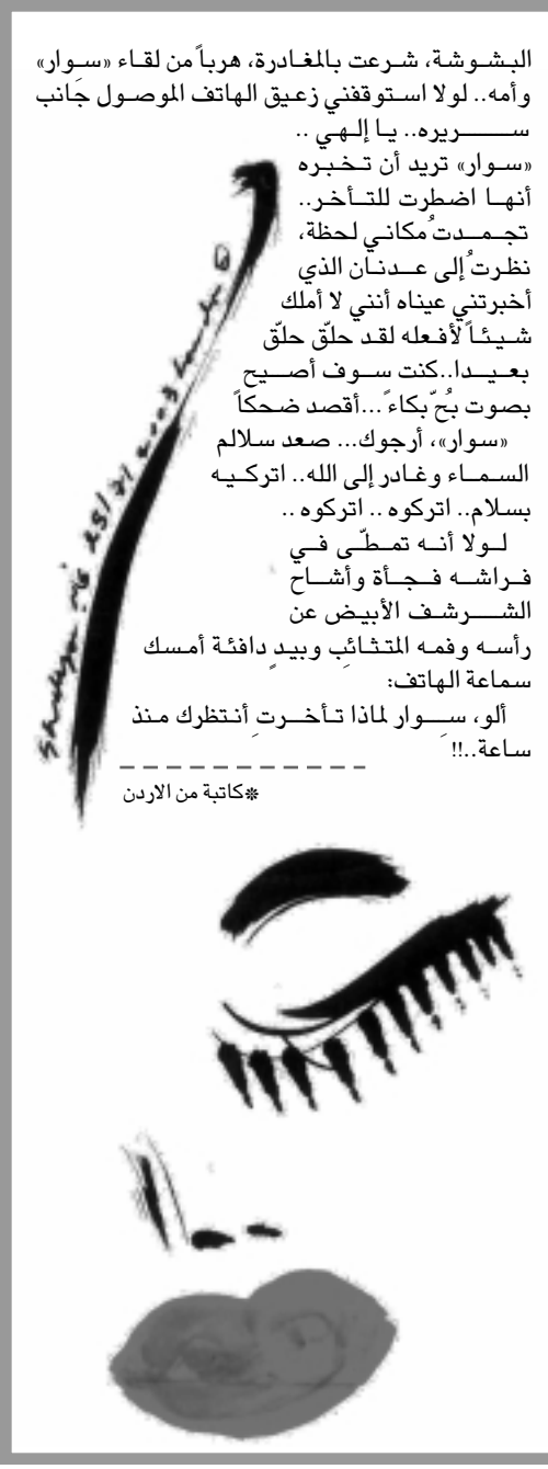
كاتبه من الاردن

وهل هناك مسوغ آمن لا يشير الشوك أكثر من الضحك؟ بدأت التحرش بالضحك. الضحك فبقهته حتى الوقوع في الكياء...!! الأطفال، تبع الضحك الصافي المقهق.. لذلك تحرشت بما فعله طفل أختي المشاغب الملهق... ضحك جميعاً.. وضحكنا وقهقهت حتى كيت...!!