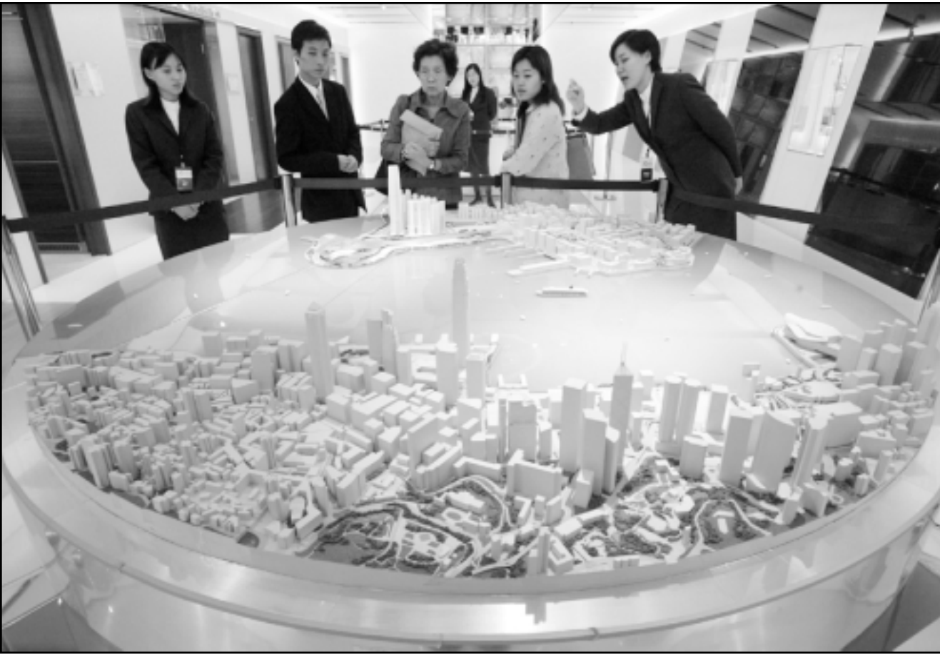
مشترون محتملون يتطلعون الى مجسم لمشروع عقاري جديد في هونغ كونغ حيث توقع ارتفاع اسعار العقارات بما يصل الى 20 في المئة هذا العام بعد هبوط طويل قادمه مرض السارس

وقال أنتون ان هذه «الصفقات ذات الطابع المالي المحض» التي بلغت حصيلتها 1,6 مليار درهم كانت مخططة منذ أشهر قبل أن تشتري أونا شركة الوفاء للتأمين وبنك الوفاء في كانون الاول (ديسمبر) الماضي. وأضاف أن شركته تعمل على تكيف أصولها الصافية مع أنشطتها موضحا أن حصيله البيع سيحصل عليها المساهمون كتوزيعات استثنائية. وفي وقت سابق من الشهر الجاري باعت أكسا المغربية عشرة في المئة من أسهم البنك المغربي لتتجارة