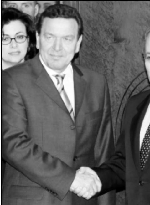
الاستشار الاثاني لدى لفته من الرئيس التركي في انقرة امس

انقره - هامبورغ - اف ب: اعلن المستشار الاثاني غيرهار شرودر امس الاثنين في خطاب محادثات مع رئيس الوزراء التركي رجب طيب اردوغان ان تركيا «على الطريق الصحيح» للانضمام الى الاتحاد الاوروبي، مستغبرا ان الفرصة جيدة، في ان يصدر الضوء الانضصر في نهاية 2004 لبدء مفاوضات الانضمام مع هذا البلد.