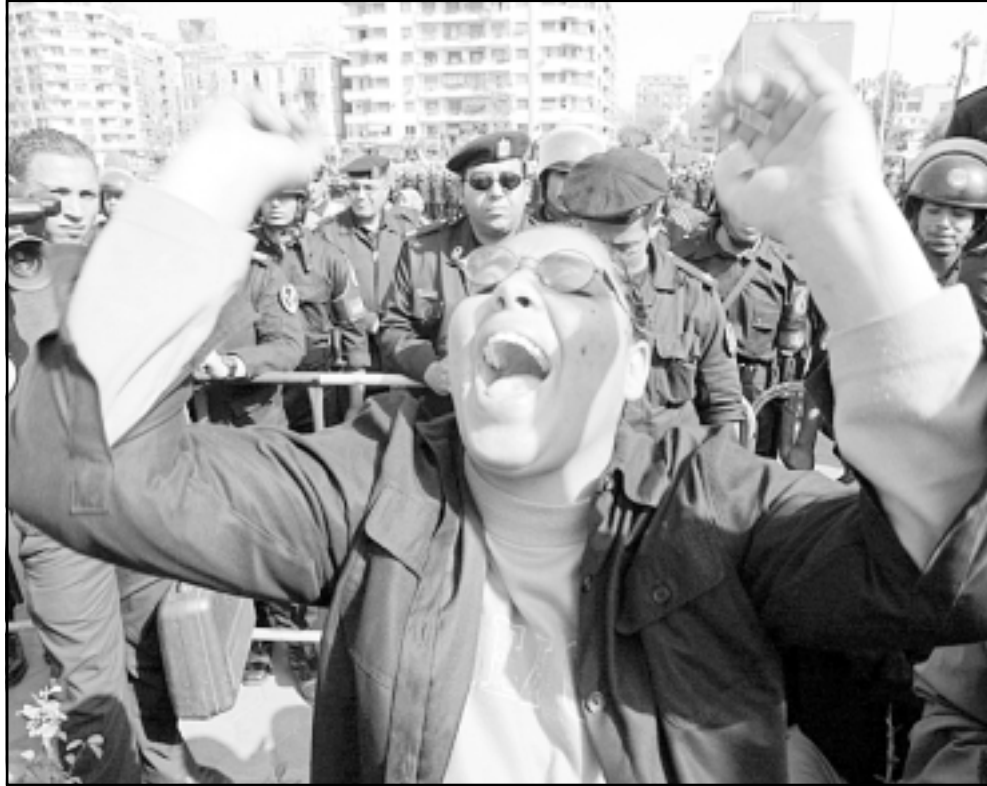
قناة مصرية تهتف ضد اسرائيل امام عدد ضخم من قوات مكافحة الشعب في ميدان التحرير في القاهرة امس

المتظاهرون الذين احاط بهم مسؤولو منظمة التحرير الفلسطينية صوروا لرئيس السلطة الفلسطينية ياسر عرفات وردوا بشعارات ضد «جدار الفصل العنصري». وسار المتظاهرون تحت يافطة كبيرة كتب عليها باللغة الانجليزية «اهدموا الجدار».