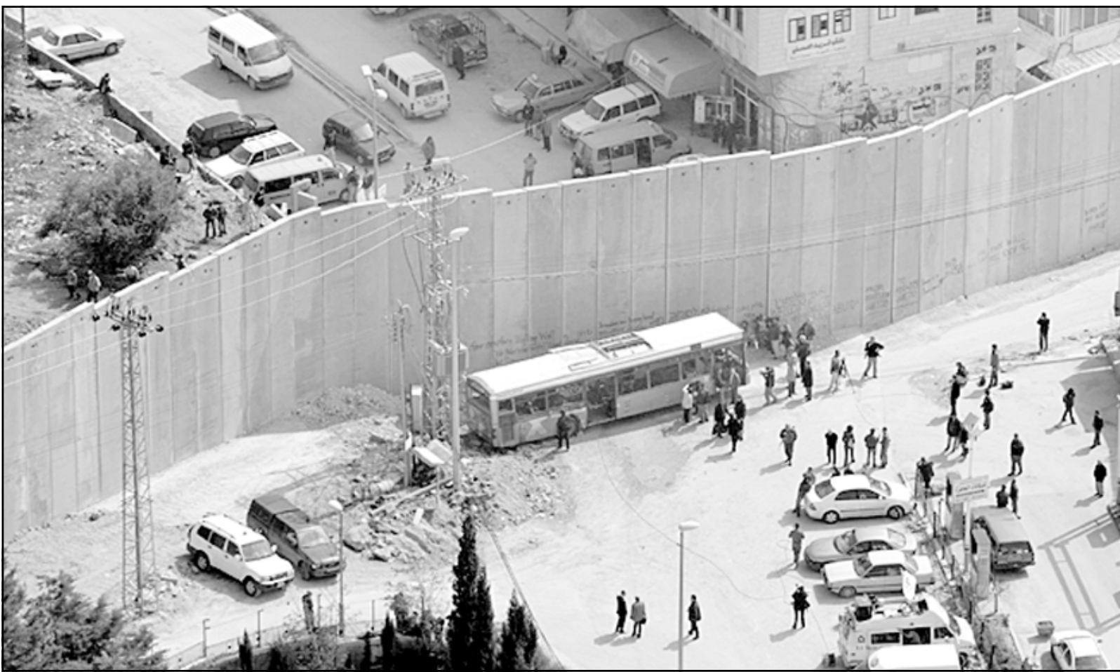
صورة لجزء من الجدار الفاصل الذي يقسم بلدة أبو ديس الى جزئين

قانونيو اكسفورد. هذا الجدار ضار بالفلسطينيين لاسباب غير مبررة وقد يصل الى مستوى الابرتهايد (التفرقة العنصرية). أخيرا قررت وجهة نظر مجموعة اكسفورد ان الجدار لا يتلامح مع حق الفلسطينيين بتقرير المصير ومع التزامات اسرائيل الدولية مثل معاهدة لاهاي. العائق الأمني الإسرائيلي يخرق التزام اسرائيل في الاتفاق الانتقالي (أوسلو) مع السلطة الفلسطينية في عام 1995 بالحفاظ على بقاء سلامة مكانة الضفة الغربية وعزلة كوحدة جغرافية واحدة حتى التسوية الدائمة.