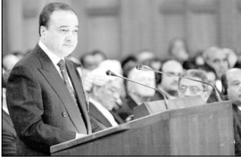
رئيس الوفد الفلسطيني ناصر القدوة يلقي كلمته امام المحكمة

أراضيه، وأشار الوفد الفلسطيني الذي كان اول وفد يتولى الكلام ان صدور رأي عن المحكمة قد يؤدي إلى تطورات ايجابية.