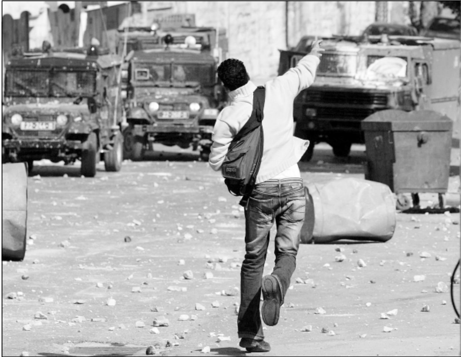
فتى يرشق دوريات الاحتلال بالحجارة لدى مدامتها مدينة رام الله أمس (ا ف ب)

رام الله - «القدس العربي» - رويترز: أغارت قوات اسرائيلية وهي تطلق غازات مسيلة للدموع واعيرة نارية على أربعة بنوك فلسطينية أمس الاربعاء وسرقت منها أجهزة كمبيوتر ووثائق وأكثر من 3 ملايين دولار، فيما زعمت مصادر أمنية بأنه محاولة لحصاد أموال أرسلت من الخارج لجماعات تنفذ هجمات ضد الاسرائيليين.