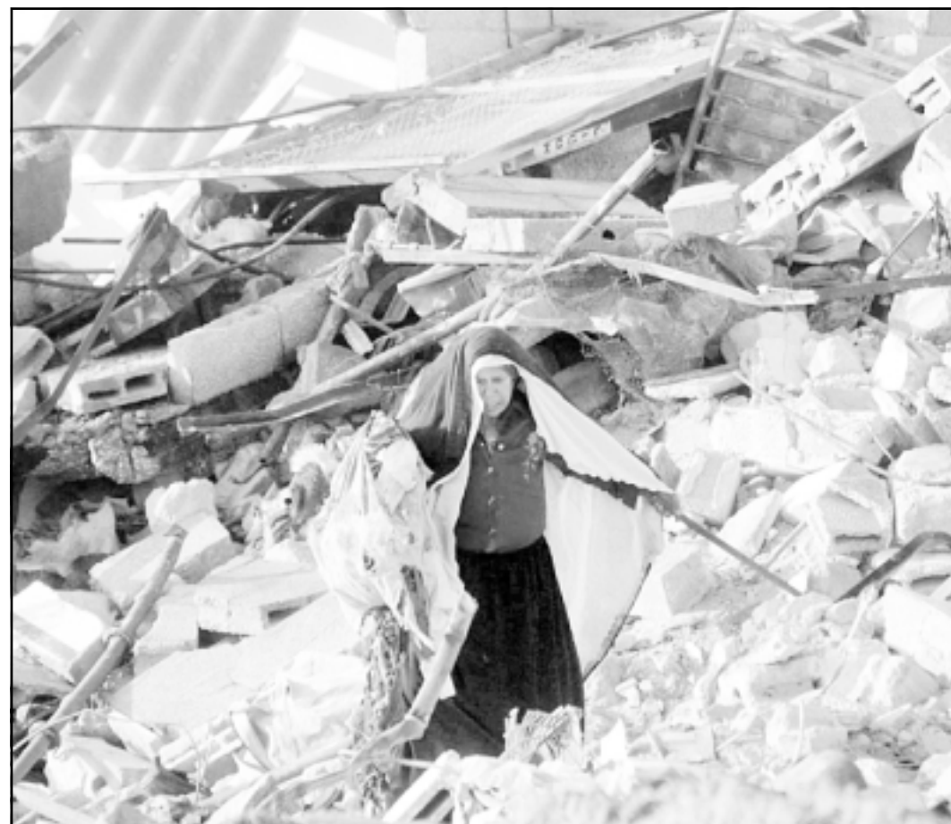
سيدة فلسطينية بين ركام منزلها الذي نسفه الاسرائيليون في مخيم خان يونس أمس

السلام في الشرق الاوسط المتعثرة منذ فترة طويلة، وبدأ شارون مشاورات امس لتعديل خطته بما يضمن كسب تأييد المستوطنين. واجتمع مع وزير العدل يوسف لايد من حزب شينوي الذي يقبل 15 مقعدا في البرلمان المؤلف من 120 عضوا. وكان لايد هدس بسحب حزبه من الحكومة ما لم تلغ خطة الانسحاب.