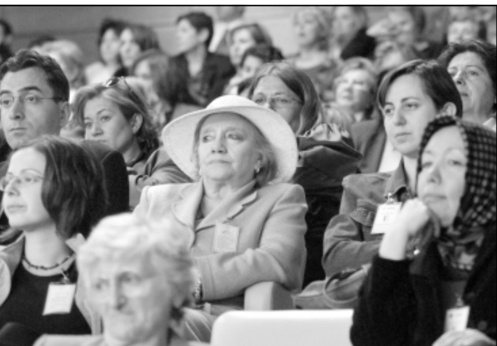
تركبات يستعمل في البرلمان في مشاريع قوانين لتعديل الدستور بهدف دعم البلد للترشيح لعضوية الاتحاد الاوروبي

وفي نيويورك صدر حكم بالسجن 32 عاماً على مساعد كبير سابق لاسامة بن لادن لفته حارساً في عينة بالة حادة فيما كان ينظر المثل للمحاكمة بتهمة التامر مع تنظيم القاعدة لقتل أمريكيين. وخلال جلسة التفتيش بالحكم الاثنتين واجه ممدوح محمود سليم ضحيتة التي سبب له تلفاً في الخ والاعراض على ظروف احتجازهم في سجن سيبيء السمعة بشمال أفغانستان يقع فيه كثير منهم منذ اواخر 2001. وقال المتحدث باسم الداخلية الأفغانية امس الثلاثاء ان حكومة الرئيس الافغاني حميد كرزاي أرسلت فريقاً لتقييم الأوضاع في السجن في شيرغان حيث يسرب الثلاثة عن الطعام ويفرضون أيضاً تناول الدواء خلال الايام الاربعة الاخيرة. وقال لطف الله مشعل «هناك اسباب عديدة لهذا الاحتجاج.. الاحوال المزرية للسجن والضعف وصعوبات اخرى ووفق كل شيء في مصير السجناء». وقال المتحدث ان الفريق الحكومي سيحاول ترتيب نقل السجناء الى كابل، وقد وقع هؤلاء السجناء في ايدي قوات الجنرال الاوزبكي محمد الرشيد دوسم الذي كان معقله في شيرغان ابان الحملة الامريكية التي ادت الى سقوط طالبان. واستسلم كثيرون لدوسم في قندوز التي كانت مسرحاً لاشتباكات عنيفة في تشرين الثاني (نوفمبر) 2001 ثم نقلوا الى شيرغان واول قطة خارج مزار الشريف كبرى مدن الشمال. ونفى دوسم اعداءات بان قواته حشرت اعداءا كبيرة من اسرى طالبان في شاحنات دون تهيؤ مما ادت الى اختناق مئات منهم اثناء نقلهم. وقتل مئات من السجناء خلال انتفاضة دموية في