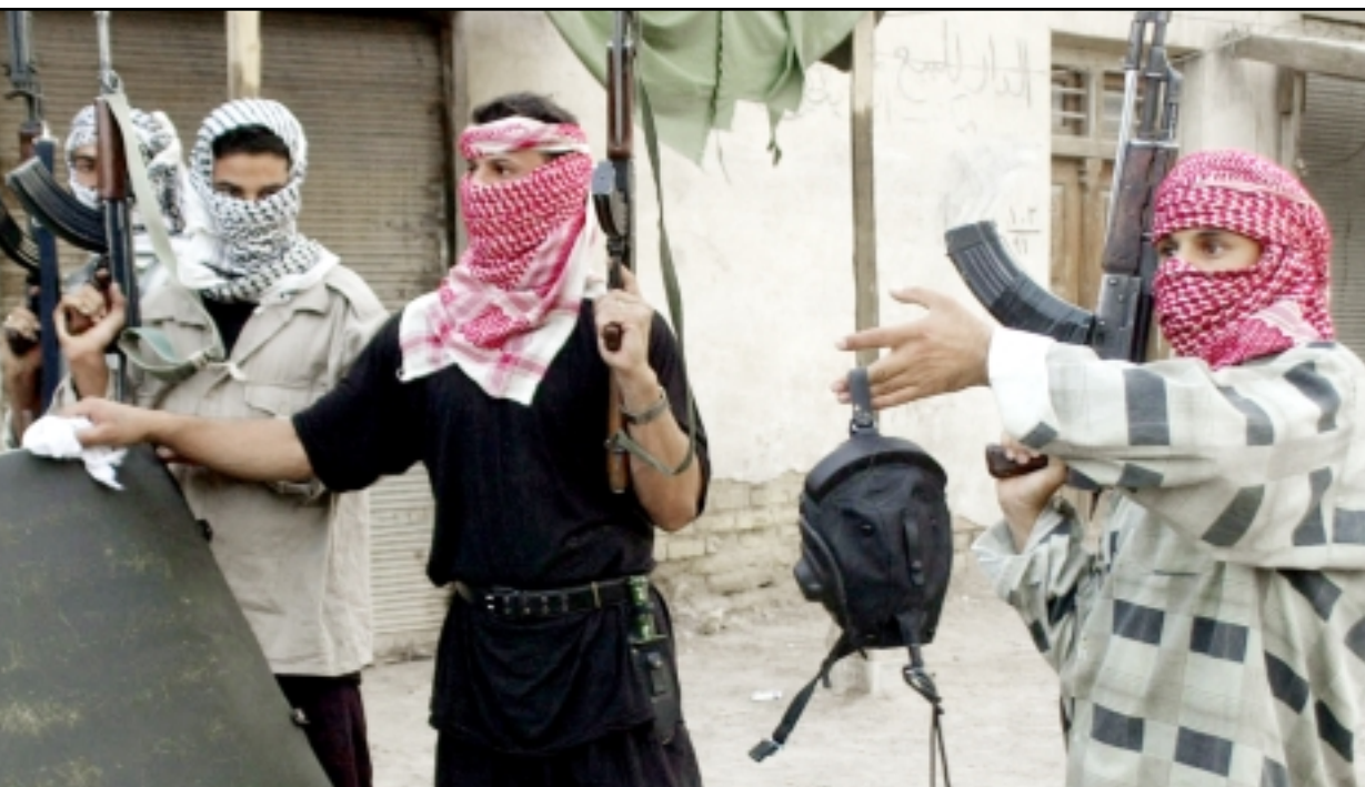
مسلحون تابعون لجيش المهدي يعرضون جزءا من مروحية امريكية قالوا انهم اسقطوها قرب النجف