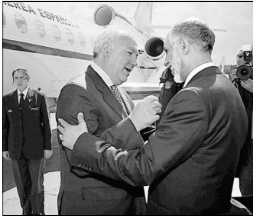
موراتيوس وبلخادم خلال لقائهما بالجزائر مساء الاثنين