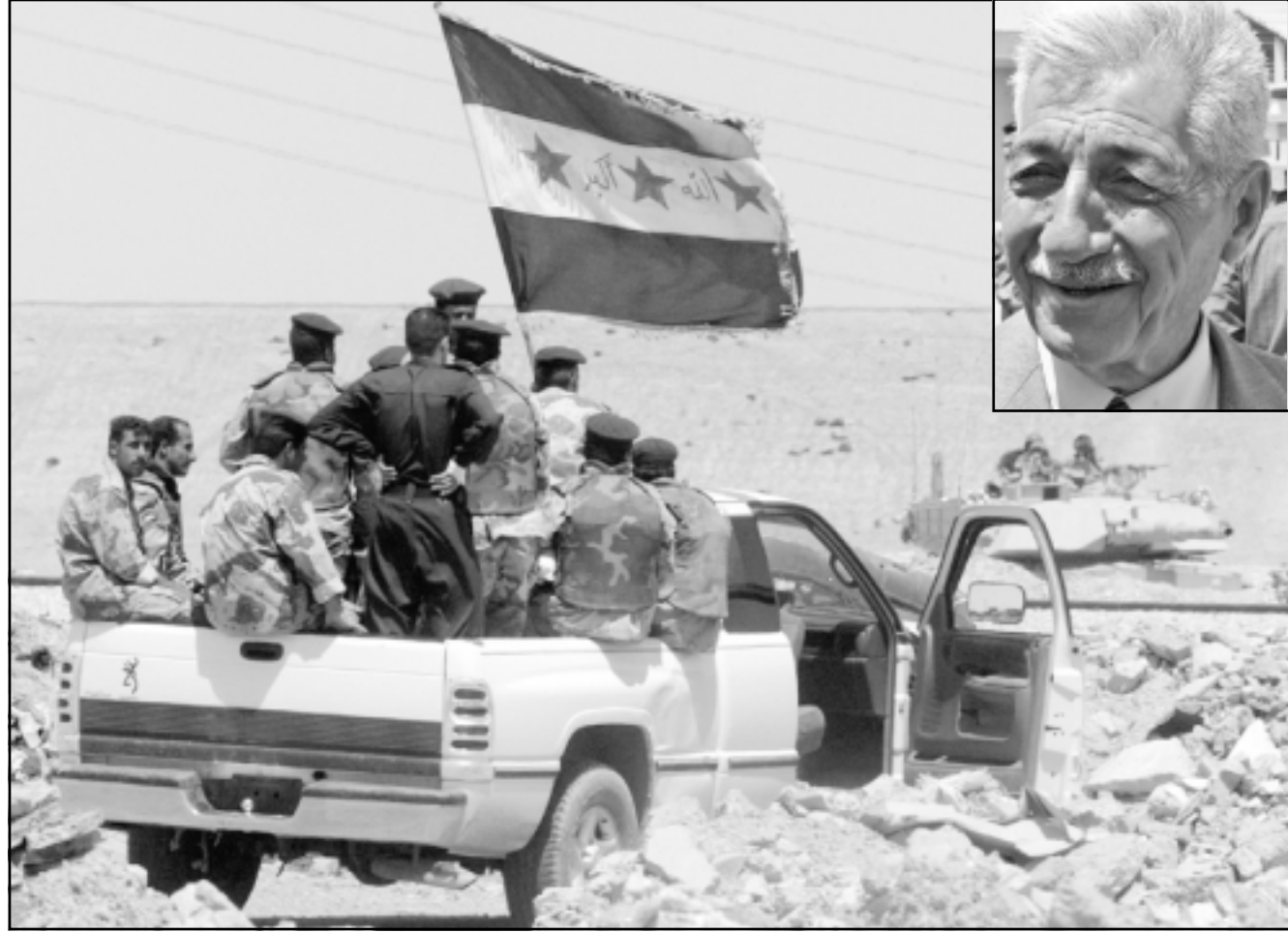
جنود عراقيون ضمن لواء الفلوجة يستلمون نقطة تفتيش من القوات الأمريكية المنسحبة وفي الاطوار اللواء محمد عبد الطيف القائد الجديد للقوات الفلوجة