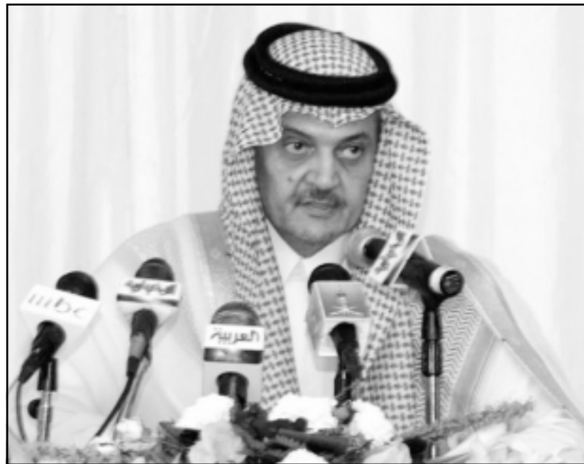
رعيا امريكويون في يهو فندق بمدينة بنبع استعدادا لغامرة السعودية، وفي الصورة الثانية وزير الخارجية الامير سعود الفيصل في مؤتمر صحافي امس

واضاف في رسالة وجهها إلى رئيسي جمعية الصحافيين التونسيين وجمعية مديري الصحف التونسية بمناسبة اليوم العالمي لحرية الصحافة ان القانون في تونس «اصبح يكفل الحق في التعبير والاتصال» مضمنا في ما وصفه «التطور النوعي والكمي في الخطاب الاعلامي المكتوب والمرئي والمسعود في تونس وما يتميز به من ثراء في المضامين وتنوع في المشهد».