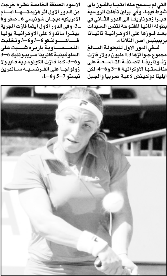
اللاعب الروسية سبيلانا كوزنتسوا

واستسلم جينيري الذي شعر بالاحباط للهزيمة في المجموعة الثالثة