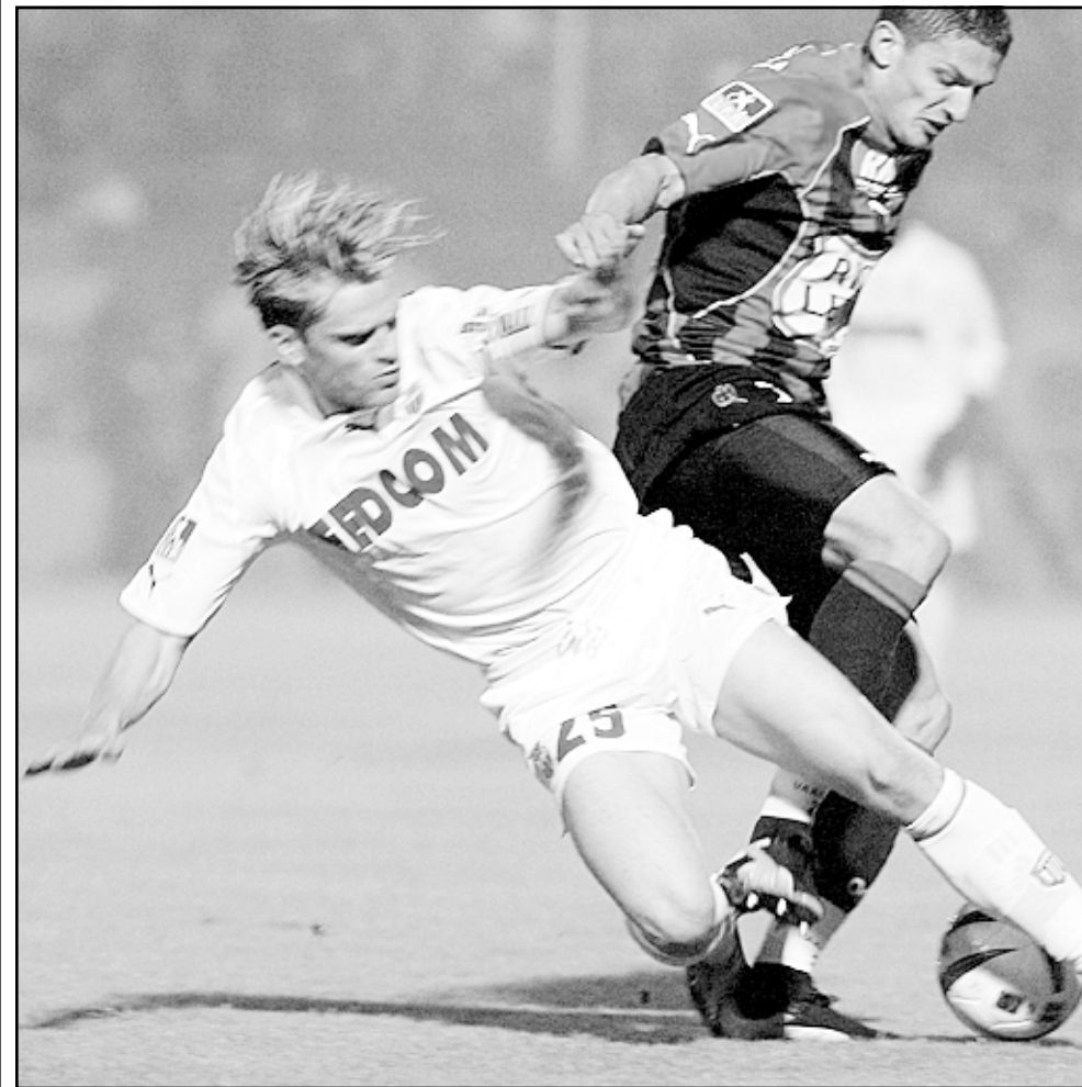
لقطة من احدى مباريات موناكو

وسجل موناكو 25 هدفا في اوروبا الموسم الحالي بفضل كابيتن الفريق الهوب لوبوفيتش جيلي، واطافة الى جيلي يتحمس على تشيلسي فرفض رقابة لصيقة أيضا على موريتتيس هدف البطولة الاوروبية برصيد ثمانية اهداف والذي يلعب للفريق على سبيل الاعارة من ريال مدريد الاسباني. وزادت مهمة تشيلسي