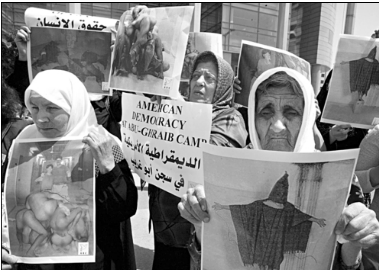
سيدات لبنانيات يحملن صور الاسرى العراقيين في مظاهرة امام مبنى الامم المتحدة في بيروت

وقال بول هنت المقرر الخاص للامم المتحدة انه في الوقت الذي يصعب فيه الحصول على معلومات موثوقة فان هناك مزاعم ذات مصداقية بان القوات التي تقودها الولايات المتحدة في العراق، كانت مذنبه بارتكاب انتهاكات خطيرة للقانون الانساني الدولي والحقوق الانسان في الفلوجة خلال الاسابيع الاخيرة. وقال هنت في بيان مكتوب انه طبق لبعض التقارير بين 90 بالمئة مما يقدر بنحو 750 قتلا من سكان المدينة خلال الحصار كاتوا من قبل المقاتلين، ويعد هذا مسؤوفاً بحكم منصبه الرسمي كعضو بلجنة التحقيق الانساني التابعة للامم المتحدة ومقرها جنيف عن المساعدة في حماية الحق في الصحة، وشتت القوات الامريكية حملة على مدينة الفلوجة في اوائل شهر ابريل نيسان ردا على قلق والتفتيح بالاربعة