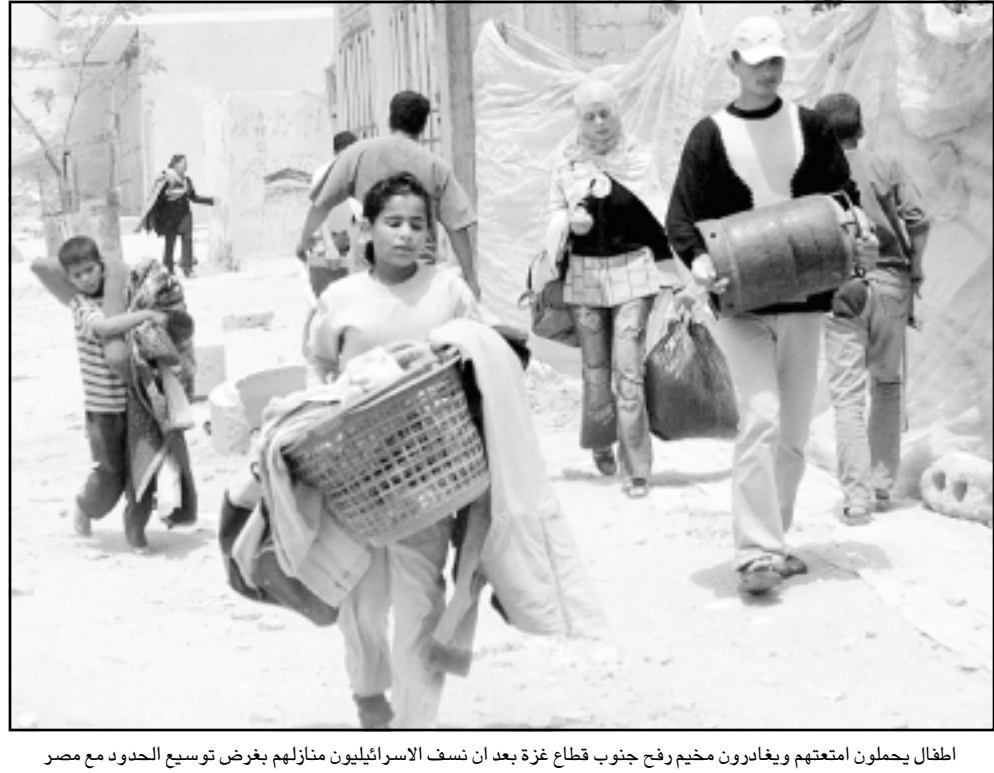
اطفال يحملون امتعتهم ويغادرون مخيم رفح جنوب قطاع غزة بعد ان نسف الاسرائيليون منازلهم بغرض توسيع الحدود مع مصر

بوش خطة ارييل شارون رئيس الوزراء الاسرائيلي الجديدة للاستحباب من غزة، ولكن من الإحتفاظ بمعظم المستوطنات اليهودية في الضفة الغربية، وأثار غضب الفلسطينيين بقوله انه من غير المتوقع ان تنتسب اسرائيل من كل الضفة الغربية أو تعيد اللاجئين في إطار أي اتفاق للسلام، وتقول اسرائيل ان أي تدفق للاجئين