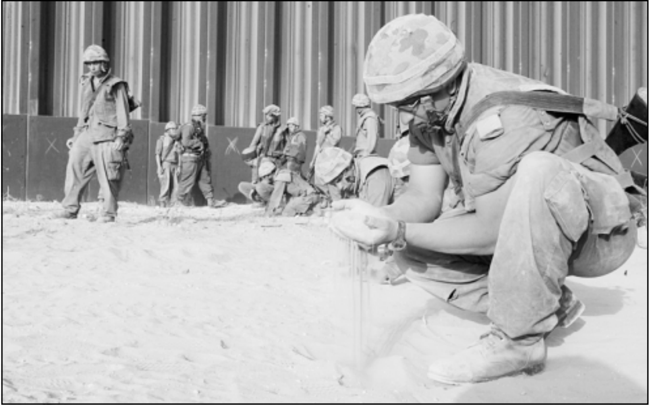
جنود اسرائيليون يبيتون عن اشلاء زملائهم الخمسة الذين سقطوا من خلال انفجار مجنزرة في رفح