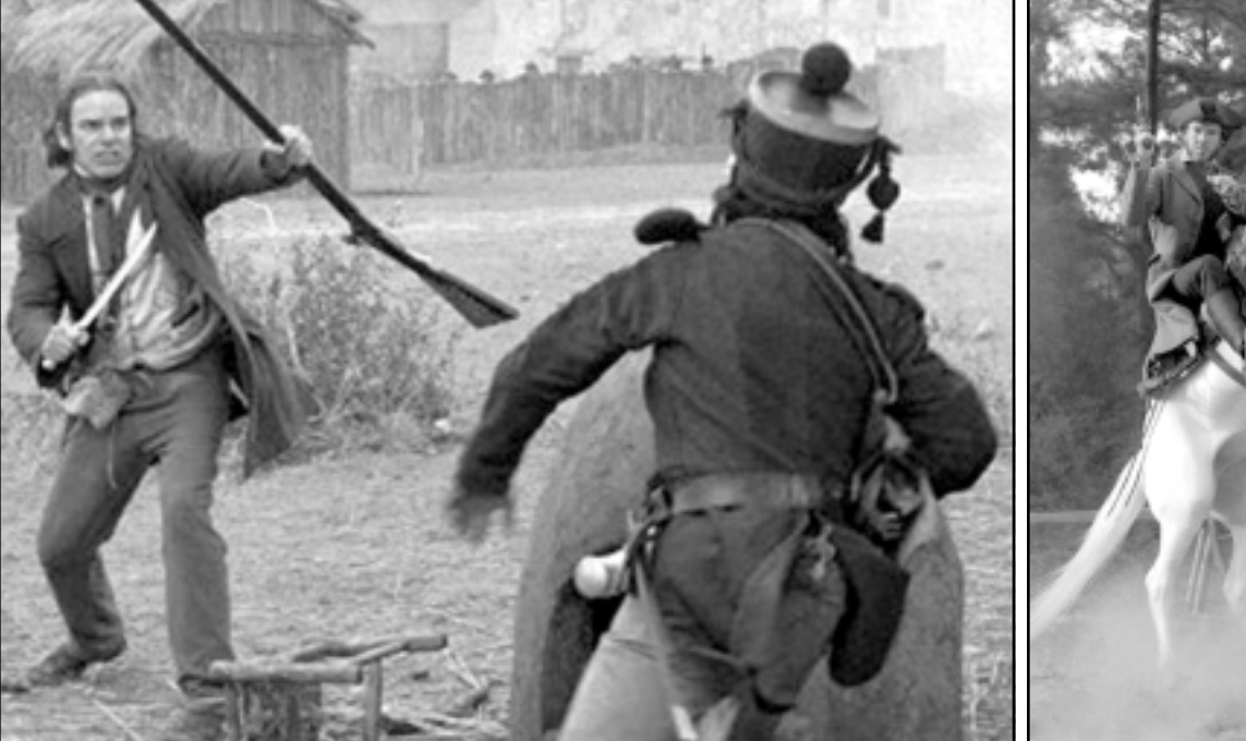
لفلتان من فيلم «ذي الامو»

ليبحث عن مغامرات جديدة، ولكنه وصل إلى الامو في وقت غير مناسب، ويقول كرويكيت عند وصوله: «لقد فهمت ان الحرب انتهت، فهل هذا صحيح.. ولكن ابنتاسمه سرعان ما تخفي عندهما ايمن انه قد دخل منطقة حربيه». لقد استطاع هاتوك ان يجلسد صورة رائعة الكشش والاشاع في الفيلم، من انه يتماذى في تقديم مشاهد خرافية. مثل الاجسام المعلقة من اشجار جرداء والهندية القليل المرمي ووجه الى اسفل في النهر تحيط به هالة من الدم. وهذا نايك عن مشاهد المعارك المرعدة رغم ان مدافع وبنادق القرن التاسع عشر لم تكن قادرة على اطلاق