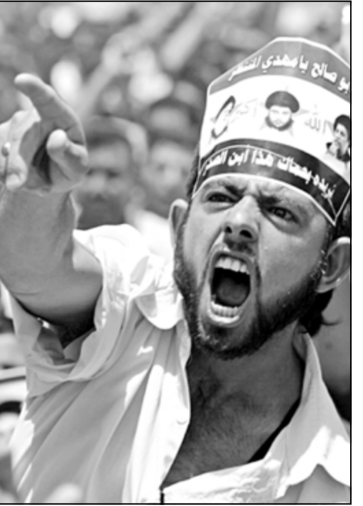
أحد انصار مقتدى الصدر اثناء صلاة الجمعة في البصرة

وقام المتحدث اخر باسم الصدر قوات التحالف في باقلاq الازر على قبة مرقد الامام علي حيث تتشاهد