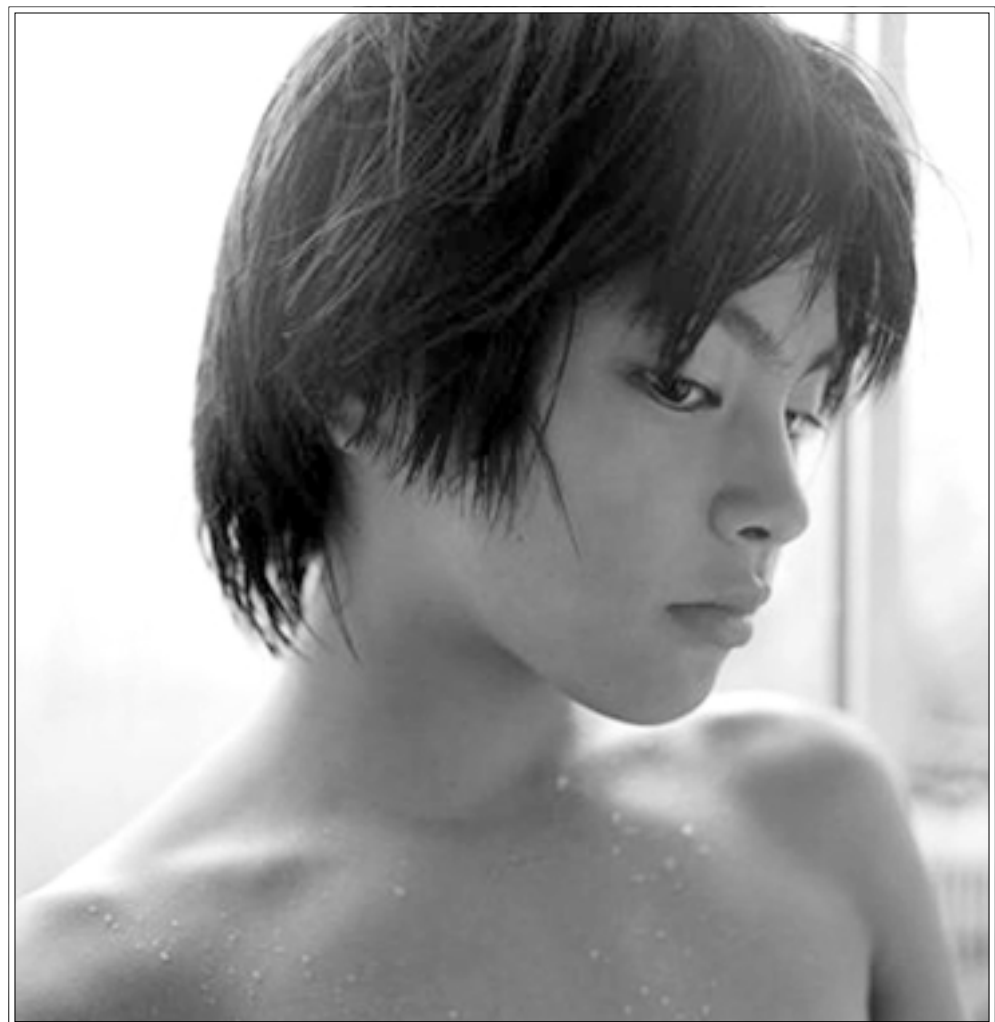
لقطة من فيلم «لا احد يعرف» لكوري. ايدا هيروكازو

مفهوم السلطوية متوافر بخفاء ذكي في شريط «لا أحد يعرف» للياباني كوري - ايدا هيروكازو (ولد في طوكيو عام 1962 وله «مايوروسي» 1995، وما بعد 1992) و«مسافة» 2001 بعد عمادها الحياة نفسها بشروطها القاسية ومفارقاتها اللثيمة، فالام كيكو الشابة تغلف انانيتها بامر على اولادها الاربعة الصغار الذين انجبت كل واحد منهم، من اب مختلف، وحين تقرر الاختفاء لسبب شخصي غامض تترك اولادها لصيرهم وشروطهم المعيشي الاخذ بالتعقيد والايقاص، انها نموذج لفردية ناقصة الامة، نتاج المجتمع القاصر في عواطفه والتزامه، ان