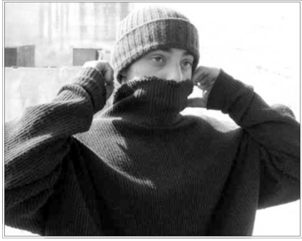
لقطة من فيلم «عطش» لتوفيق ابو ائلل

القاسية (جميلة تقراً دائما نص المغربي محمد شكري «السطار» التي تفسلف بدورها مفهوم العزلة، انها الحدود - كما موقع قرية ام الفحم - تتجاوز التوقع فتعبر استنهاها اطراف ملايب الشخصية في تحريم أو توجه لهم الاثذار يتوقع الاسوء، فشكري الشاب (الممثل احمد عبد الغني، يتعرض إلى عساف والده الذي يرغمه على تركه المدرسة «مسيره متلي». بحرق فحم، وبيع فحم، ولا يزال يحرقه: «أذا ما يتقدر اذافع عن نفسه احسن كل تبقي مع النسوان»، و«فرغ منه عليه حماية انيسوب الماء الذي قرر الاب، ضد اعتراضات الجميع -لانه يعني تكريس التمسب في «تمونج» قرية ام الفحم. يقول المخرج الشاب في كتبه الفيلم جوابا على سؤال: اين هو الصراع؟ اين هم الاسرائيليون، «الصراع هو بين الشخصية والعلاقات والواحه وعواطفهم، في الفتح حيث ان الالصائر، فيلي عن ام بالنسبة لنا فاسرائيل هي الدولة، صاحب العمل الذي يوظفنا والجامعة التي ندرس فيها». هذا سيسهل من فهم الكثير من مشاهد «عطشي»، فالالفران البيدانية لا تحرق خشبا حسب، بل ضماثر الشخصية، انها نيران سلطنتي على الدوام في بروة العزلة الاجتماعية