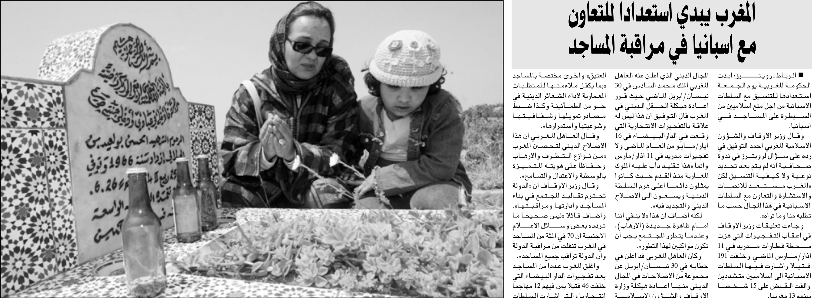
سيدة مغربية وابنتها أمام ضريح زوجها الذي كان بين ضحايا تفجيرات الدار البيضاء قبل سنة من الآن

في فرنسا وودانيا شيك مدير الإقليم الأوربي في وزارة الخارجية الإسرائيلية، ولن يشارك حسب رزم الوثيقة إلا المعروفين بتوجهاتهم «نحو السلام ودفاعهم عنه.» وحسب ذات الوثيقة، فإن أيام الملتقى الأربعة ستقسم على ثلاث مراحل، يتم تخصيص الأولى منها لاجتماعات الأئمة والحاخامات ونقاشاتهم فيما سيعمل «الخبراء والشخصيات الهامة» في اليوم الثالث صباحاً «مقترحات عملية» بناء على المناقشات التي سادت في اليومين الأولين، فيما سيتم خلال اليوم الرابع نشر النتائج التي تم التوصل إليها في حفل يخص لهذا الغرض. وسيعهد بالتغطية الإعلامية إلى «فريق من المتخصصين مدموم بآريعة صحافيين وخبراء دوليين من اللجنة العلمية»، فيما ينشط الاجتماع «وسطيين دوليين»، هما مارشال روزنبرغ ونافذ السبيل. وتشرف على هذا المؤتمر مؤسسة «لاتيتيود دي بايه» التابعة للجمعية الفرنسية «هوم دي بارول»، وهي الجمعية التي ستقدم نفسها منظمة غير حكومية تشغل من أجل السلام، وسبق لها أن نظمت في حزيران/يونيو 2003 في مدينة كوس السويسرية لقاء حول الصراع الفلسطيني الإسرائيلي جمعت خلاله أربعين شخصاً من منضمين فلسطينيين لاجسدون حرساً في الجلولس إلى السفبان ونافذوا خلال اللقاء سبل إحلال السلام بين الطرفين. وتعتبر المؤسسة أن جمع مئة إمام وحاخام ليعلموا «توحدهم أمام التلفزيون والصحف والكاميرات العالم بأسره» من شأنه أن يشكل لحظة استثنائية للسلام.