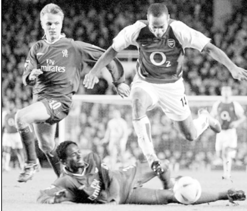
لقطة من إحدى مباريات ارسنال

يذكر ان فالنسيا المظلم على ضيفا على فياريال في افتتاح المرحلة، وفي المباريات الاخرى، يلعب ديبورتيفو كورونيا مع