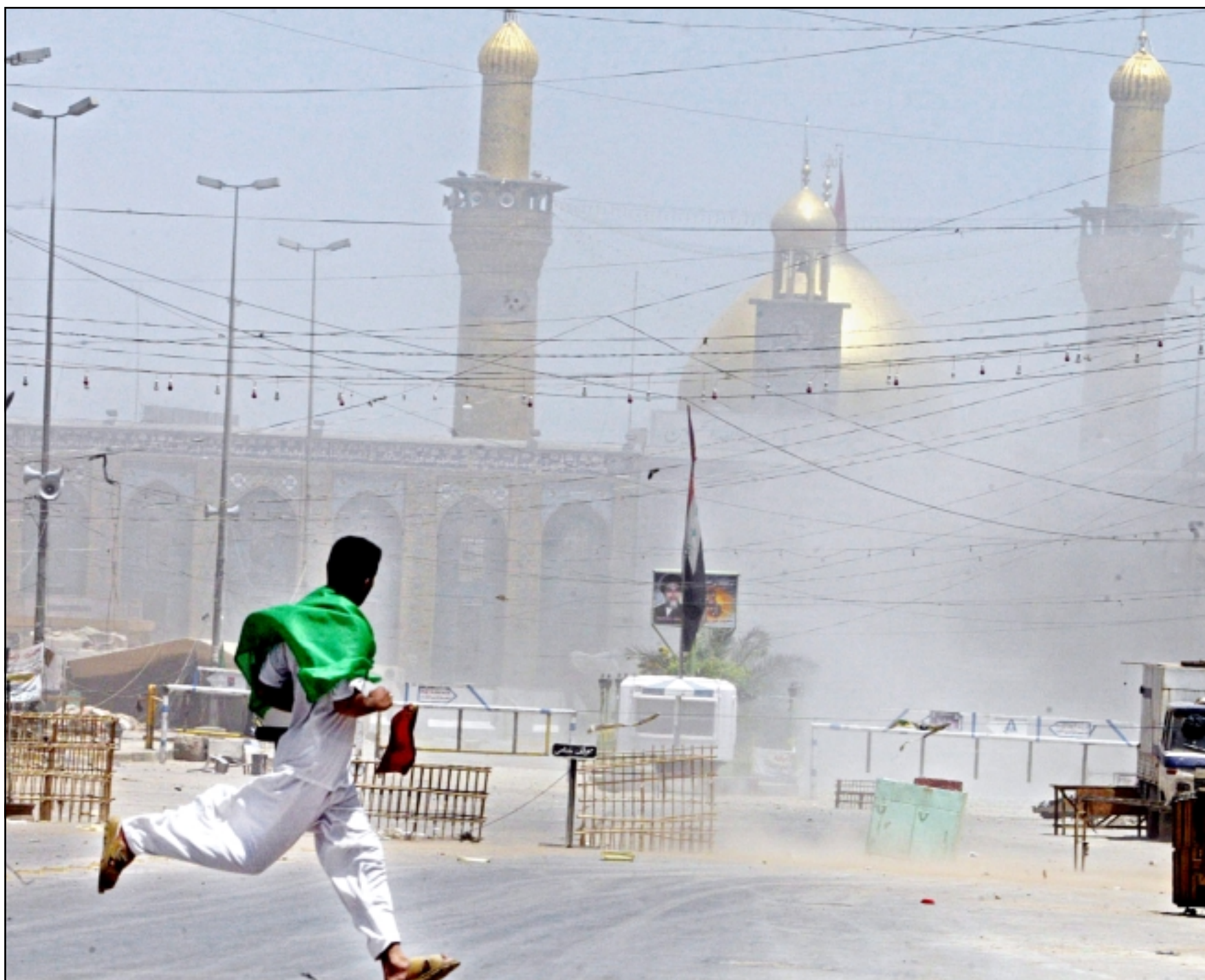
ساحة ضريح الامام الحسين وقد تحولت الى ميدان حرب بين القوات الامريكية وجيش المهدي الجمعة