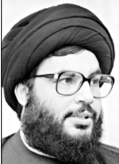
الشيخ حسن نصرالله