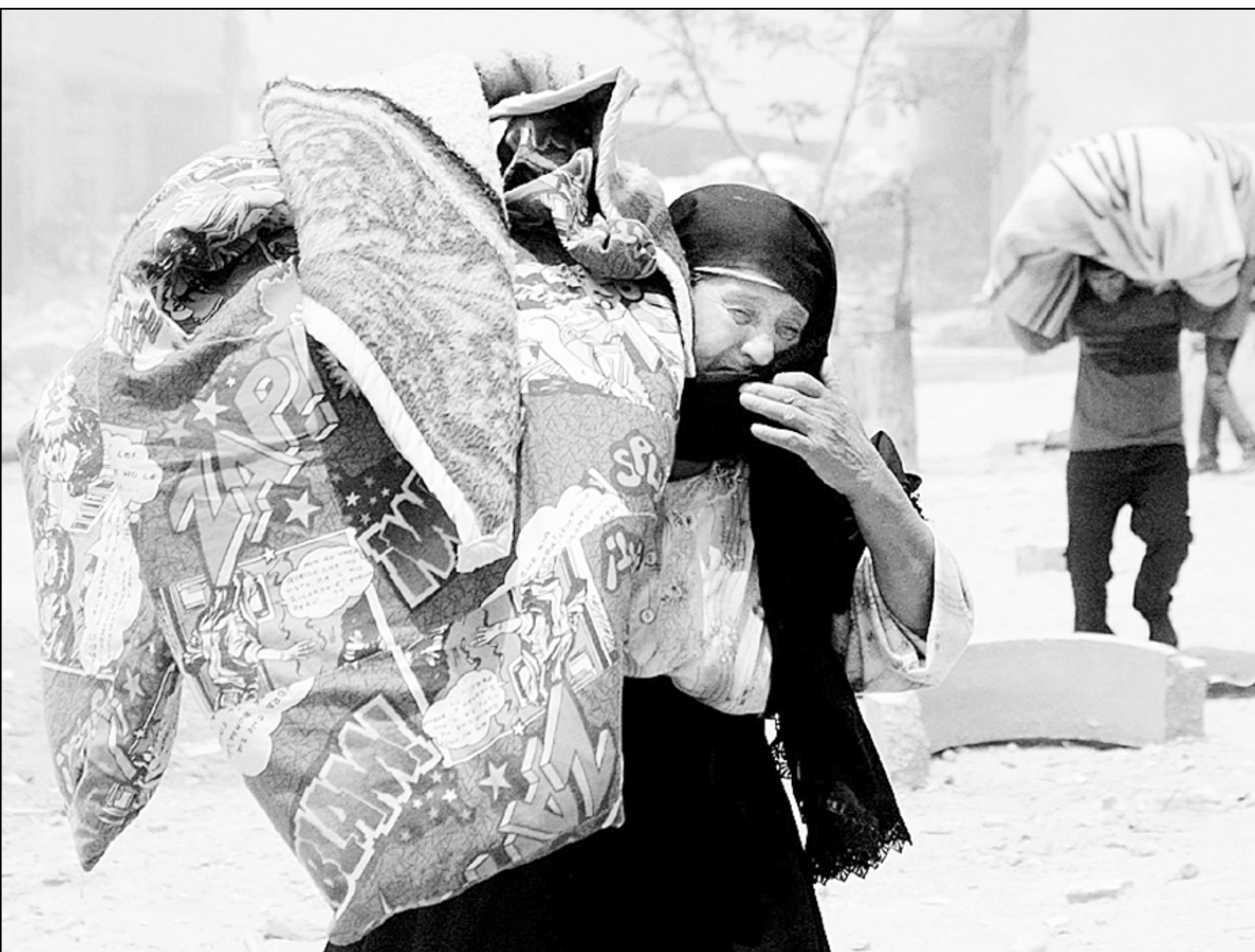
فلسطينيون يحملون امتعتهم ويعبرون من رفح بعد ان شرع الجيش الاسرائيلي مدعوما بالطائرات والجرافات بنسف منازلهم