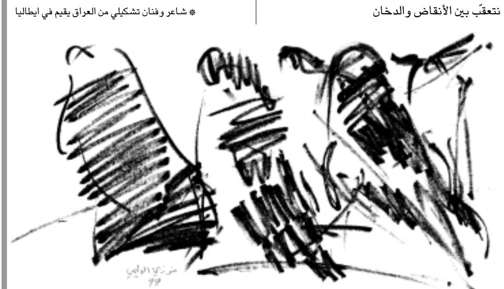
✽ شاعر وفنان تشكيلي من العراق يقم في إيطاليا

كيف نجلي غبار الموت الذي تراكم على عظماؤنا؟ ها نحن نضع كهيكل متشظية في تخوم لم نعد نعرفها، نستنطق الوقت و الأسرة التي تركناها فارغة ومشاجب خالية إلا من قميص تركناه على عجل نمسك بأنفاس نهار يربز في وحشة النخيل غرباء، لا إرث لنا، تتعقب بين الأتقاض والدخان