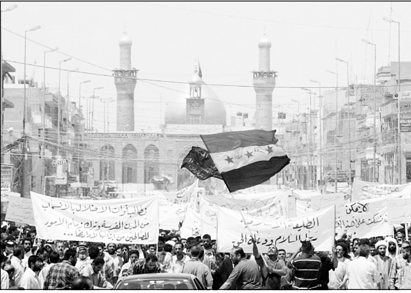
عراقيون يتظاهرون ضد الاحتلال الامريكى امام ضريح الحسين في كربلاء امس (اف ب)

انعكاسات سلبية على المستوى الامني لكن رأى بان الحل ليس ببقائهم وانما بتشكيل حكومة «ذات مصداقية» وقال «صحيح هناك تخوف من انعكاسه على الاوضاع الامنية لكن الاشكال ليس فقط انبيا، حل الموضوع يكون بتشكيل سلطة سياسية مقبولة من الشعب العراقي بمعنى ان تتوافق على الحكومة المقبلة كل اطراف الشعب العراقي حتى القائمة المسلحة». واثاف «على ان تشكل من اشخاص ليسوا جزءا من النظام السابق ولا من المرشحين بالاحتمال». ويجري المبعوث الدولي الاخضر الايراهيمي حاليا مشاورات واسعة مع مختلف اطراف العراقية وسلطة