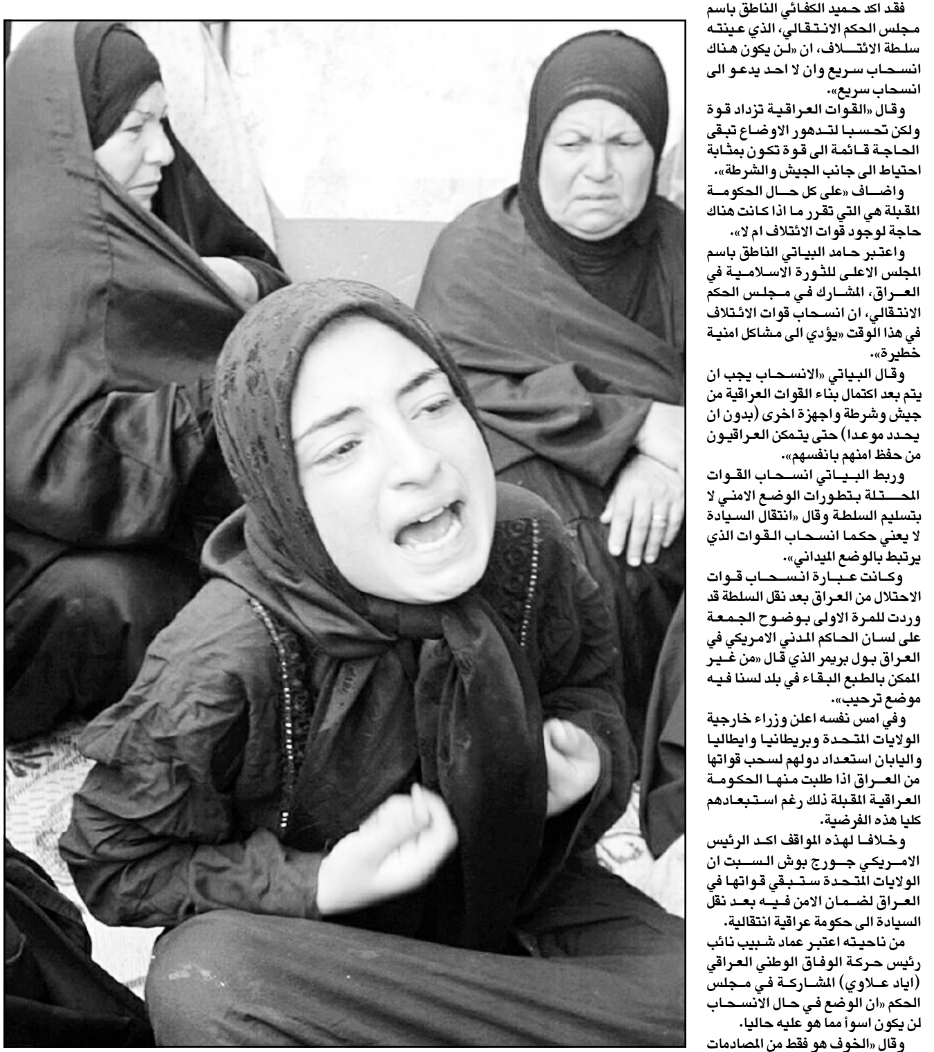
سيدة عراقية تنكي اربعة من اقاربها قتلوا بهجوم صاروخي استهدف فندقا يشغله الجيش البريطاني في البصرة

ورغم ان القمة التشاورية لن تخرج بقرارات فقد وصفها العطية بانها «همة» بسبب الظروف العربية والاقليمية التي تعقد فيها فهناك القمة العربية التي ستعقد بعد اسبوع (22 و23 ايار-مايو) في تونس وهناك تداعيات الاحداث في العراق وهناك ايضا ارتفاع الجنوني لاسعار النفط».