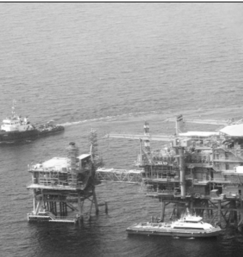
صورة من الماترة لمنطقة ثابتة في حقل بلال البحري

طهران - اف ب: ذكرت الصحف الايرانية أمس الأحد انه تم ارجاء التوقيع على عقد ايراني الماني لتجميع سيارات المرسيدس في طهران. واوضحت الصحف ان شركة مرسيدس بنز هي التي قررت ارجاء التوقيع مع شركة ايران خوردو الايرانية بعد الضغوط التي تعرضت لها الشركة الألمانية من شركة الصانع الامريكي ديمر كرايسلر. وكانت الولايات المتحدة فرضت منذ منتصف التسعينات عقوبات اقتصادية وتجارية تمنع على الشركات الامريكية اي مباداة مع ايران. وطاولت القوانين الامريكية في هذا المجال ايضا الشركات غير الامريكية. لكن وزير الصناعة والمنتجات ايراني اسحق جهانغيري نفى ان يكون وراء ارجاء التوقيع على العقد «اي سبب سياسي». وقال الوزير ايراني «كانت هناك جملة مشاكل حالت دون وصول مسؤولي مرسيدس الى ايران وهذه المشاكل سويت وسيوقع العقد» من دون ان يشير الى موعد محدد لذلك. وكان العقد ينص على تجميع التي سيارة من نوع مرسيدس بنز 320 - إي