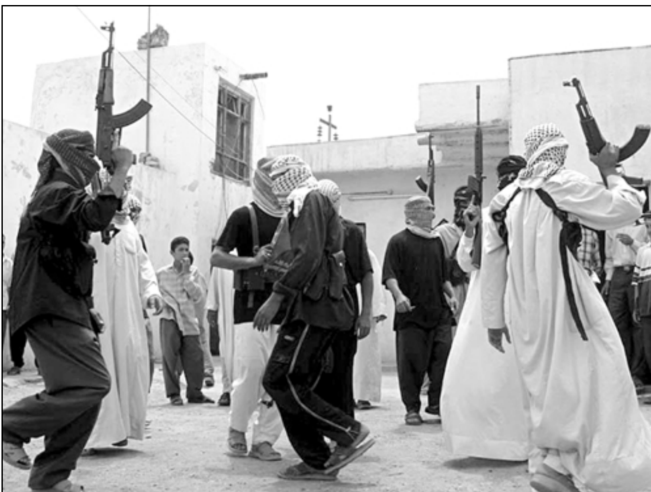
اعضاء في جيش المهدي يحتفلون بما اعتبروه انتصارا على قوات بريطانية في العمارة

ويبدو ان الضغط الامريكي الكبير على كربلاء والنجف دفع انصار مقتدى الصدر الى توسيع مواجهاتهم لتشمل مدينة الناصرية جنوب العراق بين القوات الامريكية والايطالية من جهة وعناصر جيش المهدي حيث دارت معارك شرسة ليلة امس قرب الجسر الرئيس في المدينة على نهر الفرات بينما تمكن انصار الصدر من الاستيلاء على عدد من المباني الحكومية، وقصف مقر قوات الاحتلال بالهاونات في رشقات متعددة، وفي وقت بدأت مدينة النجف تعيش هدا موجهاً بين جيش المهدي وموجهات بين الحين والاخر، ومع استمرار التوتر في كربلاء والنجف وفشل جهود الوساطات بسبب التعتت الامريكي الذي يصير