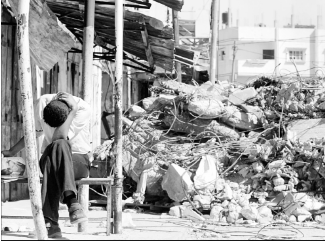
شاب يجلس امام ركام منازل هدمها الاحتلال في رفح

قال 96,2 بالمئة من الاسرائيليين ان «حق العودة هو لليهود فقط»، وشددوا على ان الدولة العبرية يجب ان تكون دولة لليهود فقط، وقد كشف عن هذا الامر ضمن يوم دراسي نظمته جامعة حيفا حول «مؤشر العلاقات بين المواطنين اليهود والعرب في اسرائيل» استناداً علم الاجتماع الاسرائيلي البروفيسور سامي سموحة، واظهر الاستطلاع الجسدي عن تورط الاسرائيليين بالمزيد من التطرف السياسي والانغلاق ودلل على ازدياد الهوة بين فلسطينيي الداخل وبين الدولة العبرية وازدياد شعورهم بالاغتراب. ومن ابرز نتائج الاستطلاع، الذي اجري في شهري ايلول وتشرين الاول (سبتمبر) وتشرين اول (أكتوبر) العام الماضي تأكيد 70 بالمئة من المواطنين اليهود رفضهم لاقامة مواطن عربي في احيائهم وامتناع 73,9 بالمئة منهم من دخول الجماعات السكنية العربية، وخوف 74,5 بالمئة منهم من تزايد نسبة الكفار الطبيعي للعرب، كما عبر 84,9 بالمئة منهم عن خوفهم من قيام عرب الـ48 بدعم الشعب الفلسطيني، وقال 77,3 بالمئة من المستطلعين انهم يخافون من نشوب انتفاضة شعبية عربية داخل اسرائيل. كما أكد 80,7 بالمئة من المستجوبين اليهود تأييدهم لاجراء الحركة الاسلامية بقيادة الشيخ رائد صلاح من نطاق القانون و60 بالمئة منهم يؤيدون الاجراء الجبهة الديمقراطية للسلام والمساواة عن القانون، وأشار الاستطلاع ايضا الى ان 73 بالمئة من المواطنين الاسرائيليين يعتبرون ان الفلسطينيين وحدهم يتحملون مسؤولية التكبئة الشؤومة عام 1948، كما أكد 96,2 بالمئة منهم على رغبتهم بالحفاظ على الغلبة اليهودية في