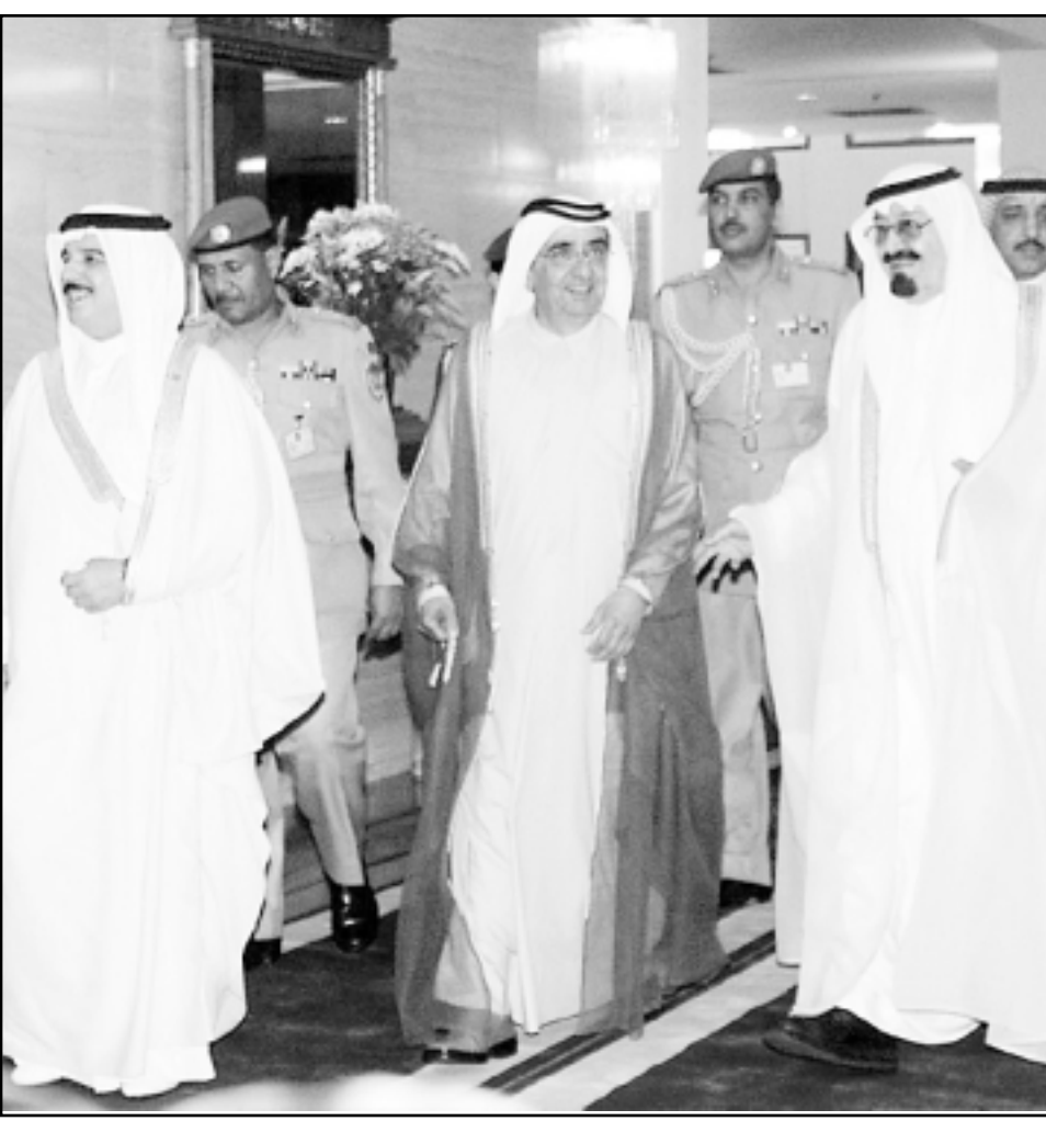
ولي عهد السعودية ونائب رئيس دولة الامارات وملك البحرين اثناء القمة امس (اف ب)

جدة - اف ب: افتتحت القمة التشاورية لمجلس التعاون لدول الخليج العربية مساء السبت في جدة، على البحر الاحمر، في ظل اجراءات أمنية مشددة. فقد قطعت الطرقات المحيطة بقصر المؤتمرات في جدة وشوهدت زواجر تابعة لقوات الامن تجوب الشاطئء ومروحية تلحق في سماء المدينة. وكان الامن العام لمجلس التعاون الخليجي عبد الرحمن العطية قال ان القمة التشاورية ستقتصر على عقد جلسة واحدة يتبادل خلالها الرؤساء الخليجيون وجهات النظر بشأن مستجدات الاحداث في المنطقة الخليجية والعربي.