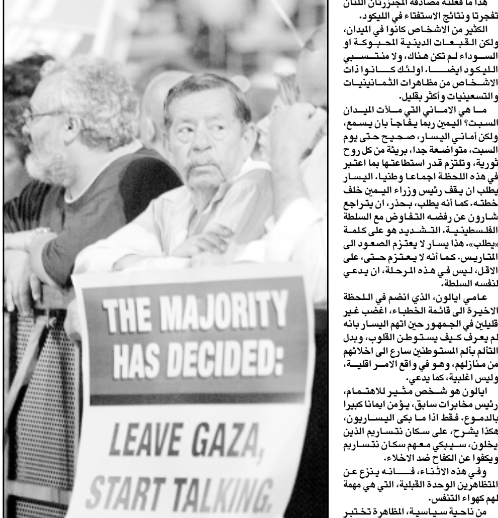
مظاهرات يساريون اسرائيليين يطالبون بشارون بالانسحاب من غزة

بعض ناخبيه، اولئك الناخبون الذين هجروا احزاب اليسار واتخذوا السبوت، «سبوتوي»، كما كانوا هناك، او شعروا وكانهم هناك حين شاهدوا صور المظاهرة على التلفزيون، وعندما يتوجه الناخبون، سبارا، فان لبيد يسارع الى اليسار، وعندما يسارع لبيد الى اليسار فان شارون يتأزم، هذا أثر دومينو من شانه ان يكون لحجوم المظاهرة السبت، صحيح حتى يوم السبت، الاثر لم