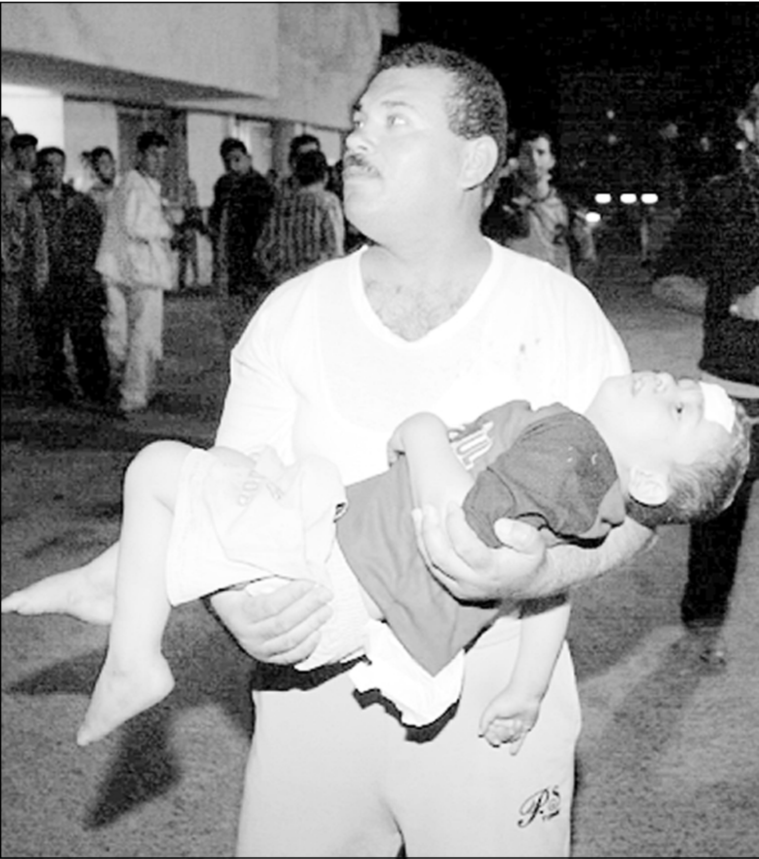
مواطن يبرح بطفله الذي اصيب بقذائف الاحتلال الى مستشفى غزة فجر أمس

ومضى قائلا انه في الاسبوع الذي يقفل فيه 13 من جنود جيش الاحتلال الاسرائيلي تختار رئاسة الاتحاد التركي، ويشكل حصري، على هدم المنازل، كما تختار اقتباسات انتقائية من بيانات اللجنة الرباعية للوساطة. وتابع شالوم مزاعمه قائلا انه انسجاما مع هذا التوجه فقد امتنعت الرئاسة قبل بضعة اسابيع عن وصف الفدائي الفلسطيني الذي نفذ عملية في مستوطنة احتلالية في قطاع غزة اسفرت عن مقتل خمسة اسرائيليين بالعمل الإرهابي الأكثر انحطاطا، على حد قوله، كما امتنعت الرئاسة، حسب اقوال الوزير الاسرائيلي، عن شجب انتهاك حرمة جنود الجيش الإسرائيلي الذين قتلوا في عملية تفجير المدرعة الإسرائيلية في حي الزيتون في مديرة غزة الثلاثاء الفائت. ولفت الوزير شالوم الى ان بيان اللجنة الرباعية يتحدث بوضوح عن حق اسرائيل في الدفاع عن نفسها، ويدعو الفلسطينيين الى وقف العنف، وادف قائلا ان نشر مقتبسات انتقائية تنطرق الى بعض ما جاء في بيان اللجنة الرباعية لن يسهم في ايجاد حل حقيقي في المنطقة، زعم الوزير الاسرائيلي، ويدعو البيان الذي نشره وزير الخارجية الإيرلندي بريان كاون، حكومة شارون الى وقف فوري لجرائم هدم المنازل الفلسطينية في مدينة رفح. واكد كاون انه تمت دعوة الدولة العبرية في اجتماع اللجنة الرباعية الذي عقد في الرابع من ايار (مايو) الجاري الى اتخاذ خطوات تفر بكرامة ابناء الشعب الفلسطيني، ويكون من شأنها تحسين ظروف حياتهم، كما شددت اللجنة الرباعية على وجوب امتناع اسرائيل عن هدم المنازل وتدمير المستوطنات الفلسطينية كوسيلة لعقاب الفلسطينيين، و بهدف القيام بأعمال بناء اسرائيلية.