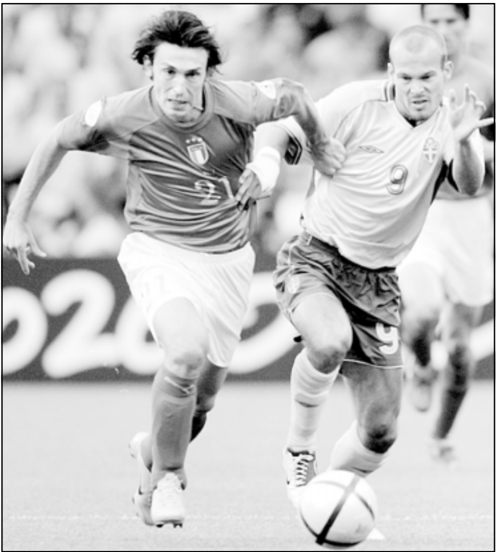
لقطة من احدى مباريات منتخب ايطاليا

وتاهلت بفشارق الاهداف عن الكاميرون قبل ان تتوج بطولة للعالم على حساب المانيا. وفي مونديال 1986 تعادلت في مباراتيها الاوليين مع بلغاريا والارجنتين بنتيجة واحدة (1/1)، قبل ان تفوز بصعوبة على كوريا الجنوبية 2/3. وتكرر الامر ذاته في مونديال 1994 بديفار 1/2 باستاند الاسكندرية بالجملة الثانية من تصفيات جمهورية ايرلندا صفر/1، ثم فازت على التروج 1 - صفر، وتعادت بصعوبة التي لم يمن سرماها باي هدف حتى الان.