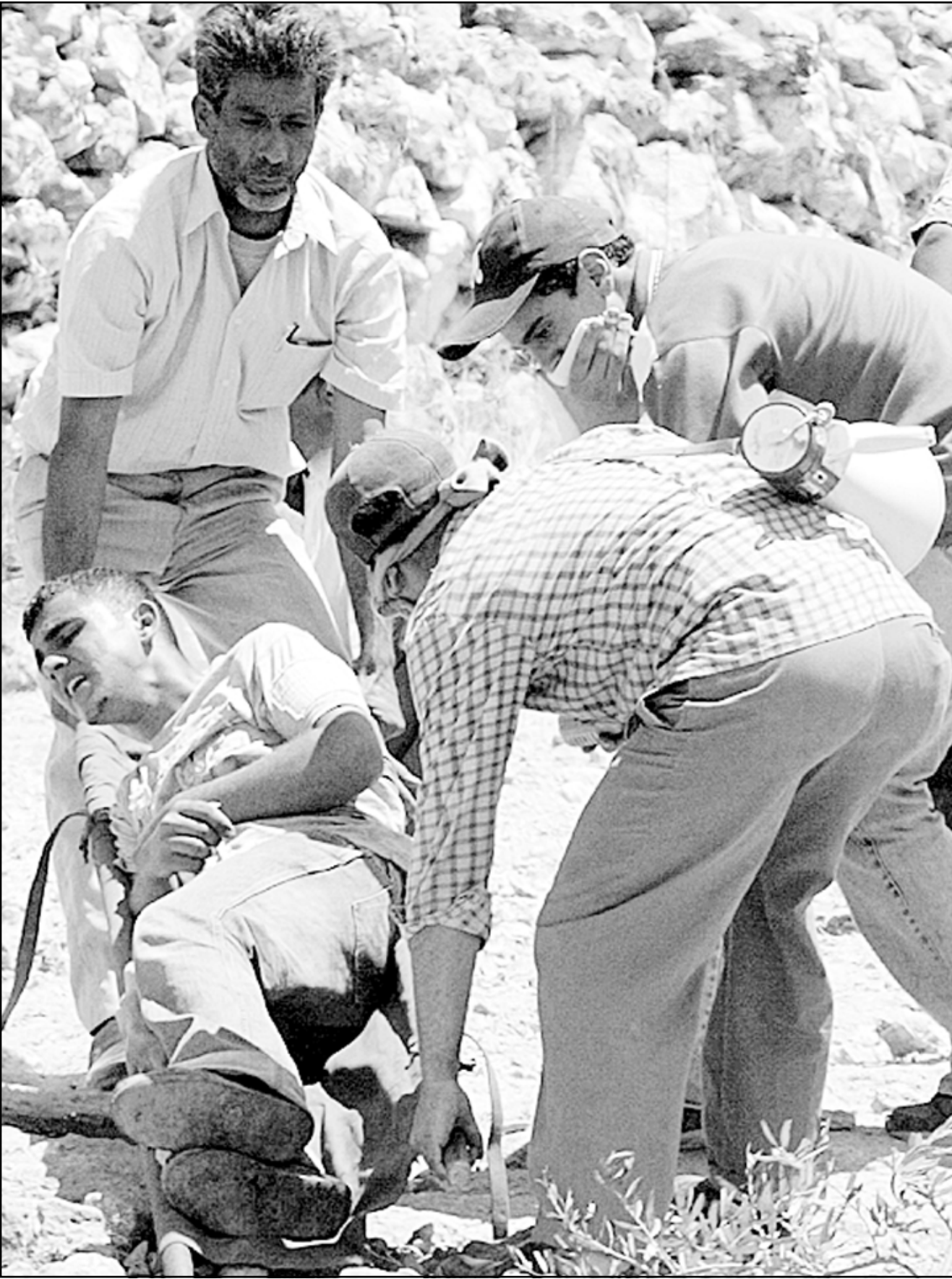
فلسطينيون يتلقون جرحيا اصيب برصاص الاحتلال اثناء مظاهرات ضد الجدار في الضفة اس