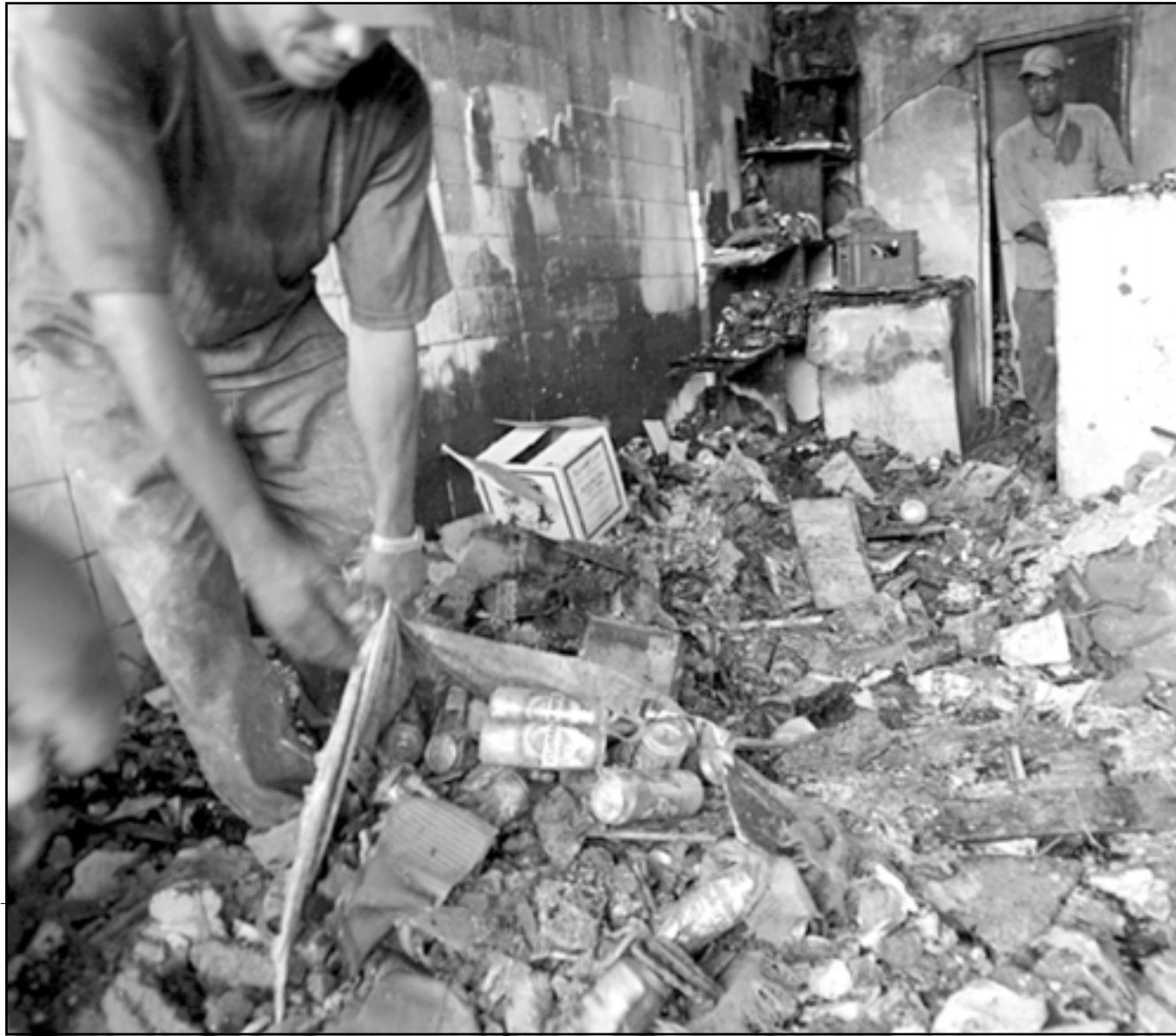
عامل عراقي ينظف حلاب ملجأ المحرمين في بغداد بعد تعرضه لهجوم من اسلاميين

وتبديد المخاوف بين الطرفين والامتناع الكردي من الموقف الشيعي حيث جرت مناقشات صريحة ومستفيضة بين الجانبين.