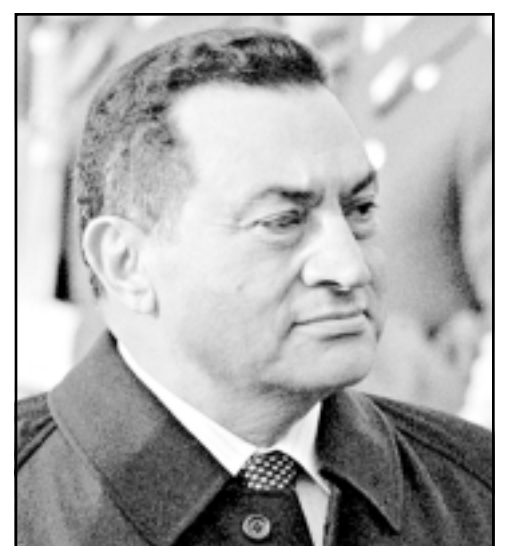
ميوينج - اف ب: اكد مستشفى خاص لجراحة العظام في ميونخ (جنوب المانيا) امس ان الرئيس المصري مبارك موجود فيه حيث ستجري له عملية في فقرات الظهر في موعد لم يحدد.

مستشفى الماني يؤكد استقباله مبارك استعدادا لاجراء عملية بالعمود الفقري