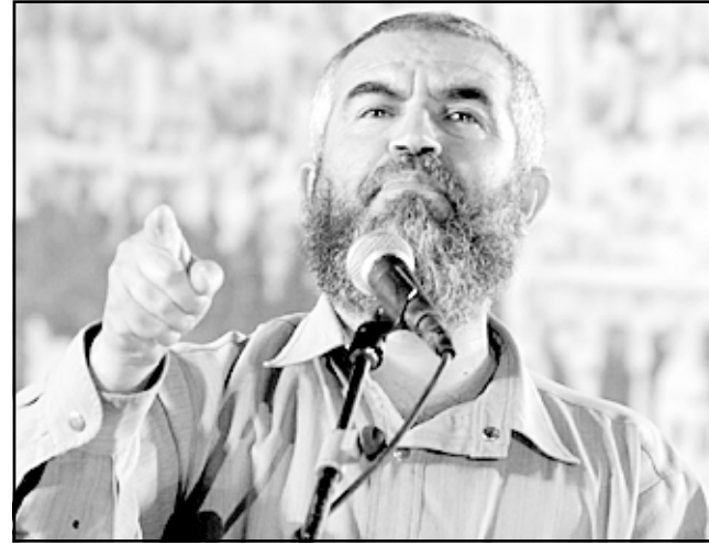
الشيخ راند صلاح

العربية في مناطق الـ 48، وقامت الحركة الاسلامية بتسيير حافلات خاصة للمشاركة في هذه التظاهرة ومن ثم التوجه للمسجد الأقصى للصلاة فيها تأكيدا على الترابط بين الاعتقال قادة الحركة الاسلامية وقضية المسجد الأقصى ودورهم في الحفاظ عليه، وكانت سكرتارية لجنة المتابعة العليا للجماهير العربية قد استمعت الى تصريحات شامل من محاميه الدفاع عن الشيخ راند صلاح واخوانه المعتقلين في قيادة الحركة الاسلامية، حول المستجدات والتطورات القانونية في هذه القضية، اضافة الى رؤية الحاميين المستقبلية بالنسبة للتعاقب القانونية والقضائية لهذه القضية، بجميع ابعادها. وقررت سكرتارية لجنة المتابعة العليا ما يلي: التأكيد على اعتبار قضية اعتقال الشيخ راند صلاح واخوانه الآخرين من قيادة الحركة الاسلامية، بأنها قضية سياسية، وما يجري في المحاكم هو محاكمة سياسية منهجية ومخطط لها، تهدف ايضا الى تقييض ما تبقى من مساحة العمل السياسي الديمقراطي للجماهير العربية في اسرائيل. ضرورة التمرك العملي الجدي والبرمج في مسارين أساسيين، بموصلة العمل في المسار القانوني والقضائي بكل جوانبه، وتفعيل المسار الشعبي والاعلامي على مختلف المستويات، تنظيم مظاهرة جماهيرية مركزية احتجاجية، خلال شهر تموز (يوليو) القادم، باسم لجنة المتابعة العليا، أمام الزامات المركزية في