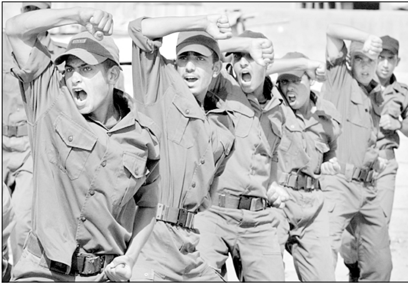
رجال من فلسطينيون يتلقون تدريبات في غزة أمس

وحسب مصادر صحافية في قطاع غزة فإن حالة اللبس التي يعيشها المواطنون هناك سببها عدم معرفة المواطن الفلسطيني طبيعة المقترحات الأمنية المصرية التي تم