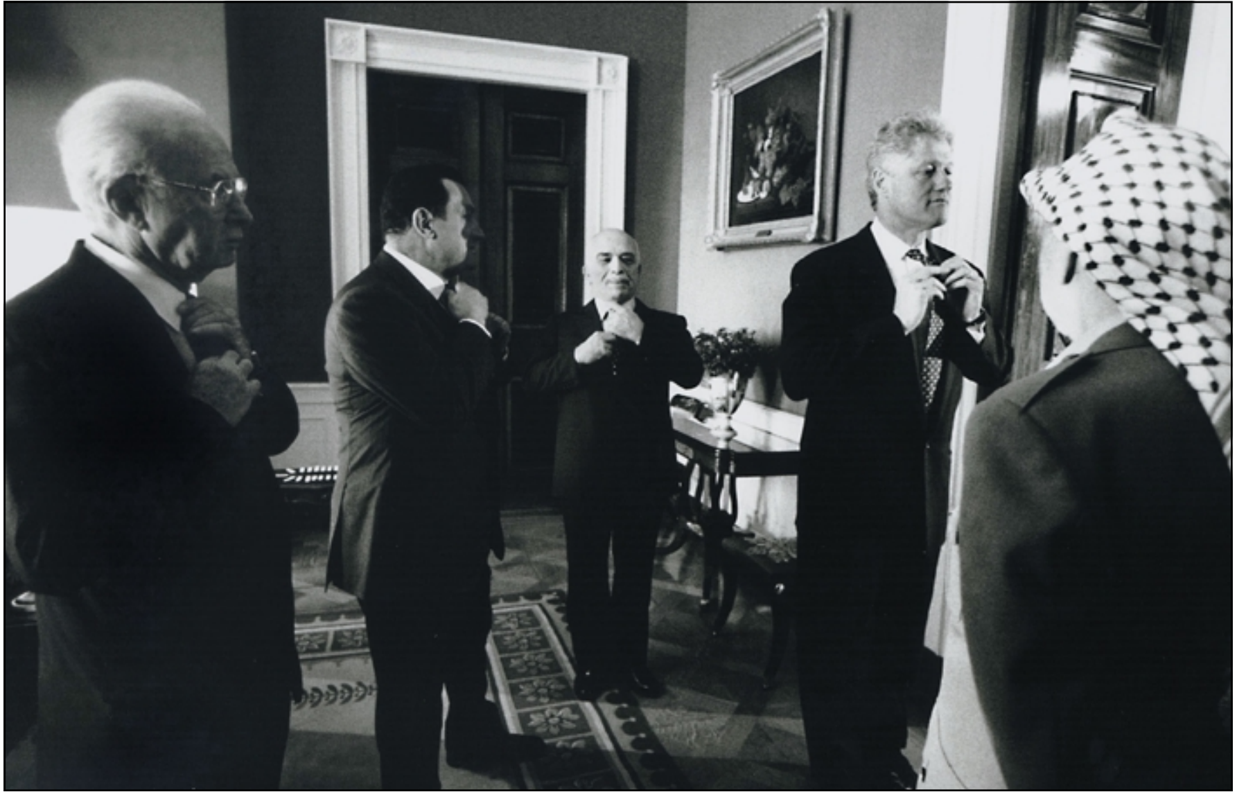
صورة تجمع الملك الاردني الراحل حسين وحسني مبارك الرئيس المصري واسحق رابين رئيس الوزراء الاسرائيلي السابق وياسر عرفات الزعيم الفلسطيني وبيل كلينتون قبل دقائق من حفل توقيع اتفاقية اوسلو في باحة البيت الابيض، ايلول (سبتمبر) 1993

علاقته بمونيكا لوينسكي كانت نتيجة الجانب المظلم من شخصيته الذي ظل يطارده طوال حياته وعاش في شبابه مرارا «حياة موازية» وتصرفاته الواثقة امام الجمهور كانت تخفي شعورا دفينيا بعدم الامان وكان شعاع اسرته «لا تطرح اسئلة، لا تخبرنا احدا»، ويتذكر انه شاهد زوج امه مدمن الخمر يضربها بل ويصوب يوما سلاحه الى رأسها لكنه كان يذهب في اليوم التالي الى المدرسة وكان شيئا لم يكن