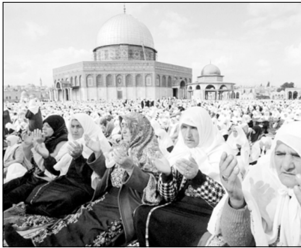
فلسطينيات يصلين بساحة المسجد الأقصى في مدينة القدس

الفرق هو ان لديهم استعداد لتقديم تنازلات في قضية العودة والتوصل الى تسويات، كما قال ياسر عرفات في مقابلة مع صحيفة (هارتس) يوم الجمعة، أما بالنسبة للأقصى فلا يوجد أي استعداد