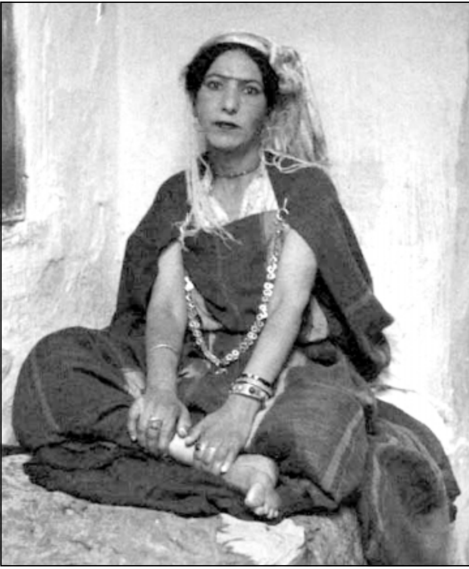
امرأة في مكان محظور - تونس