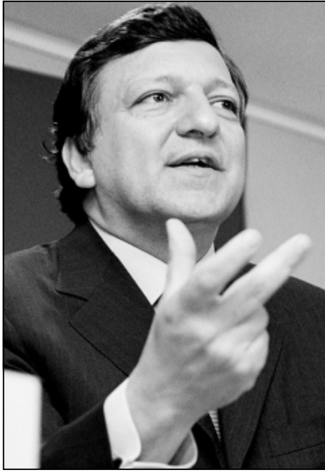
خوسيه مانويل دوراو باروسو الرئيس الجديد للمفوضية الأوروبية

بالتفاهم على تعيين البرتغالي، خوسيه مانويل دوراو باروسو رئيساً للمفوضية الأوروبية، ليكون قادة الاتحاد الأوروبي قد تجاوزوا أزمة موعودة واقتفوا على أول رئيس لهذا الجهاز بعد توسيع الاتحاد نحو الشرق. لكن اختيار باروسو ضمن المحافظة على اهتمام خاص بمنطقة المغرب العربي، وجاء اختيار باروسو الذي تخلى عن رئاسة حكومة لشبونة لينفي أزمة عصفت بالاتحاد الأوروبي خلال الأسابيع الماضية عندما رفقت فرنسا والمانيا المرشح البريطاني كريستيان فريدلند برفضت رئيس الحكومة البلجيكية فيرهادت. في الوقت نفسه، ترك باروسو بلاده في أزمة سياسية حقيقية، فالحزب الاشتراكي المعارض يطالب بانتخابات مبكرة يؤديه 60% من البرتغاليين. وكتبت جريدة «البوليفيكو» البرتغالية أمس الأربعاء أن على رئيس البلاد جورجي سامبايو أن يتخذ قراراً صعباً، بعد مرشح الحزب الاجتماعي الديمقراطي يوتويجا سبينا، وإذا استحال منصب رئاسة الحكومة، أو أن يدعو إلى انتخابات مبكرة.