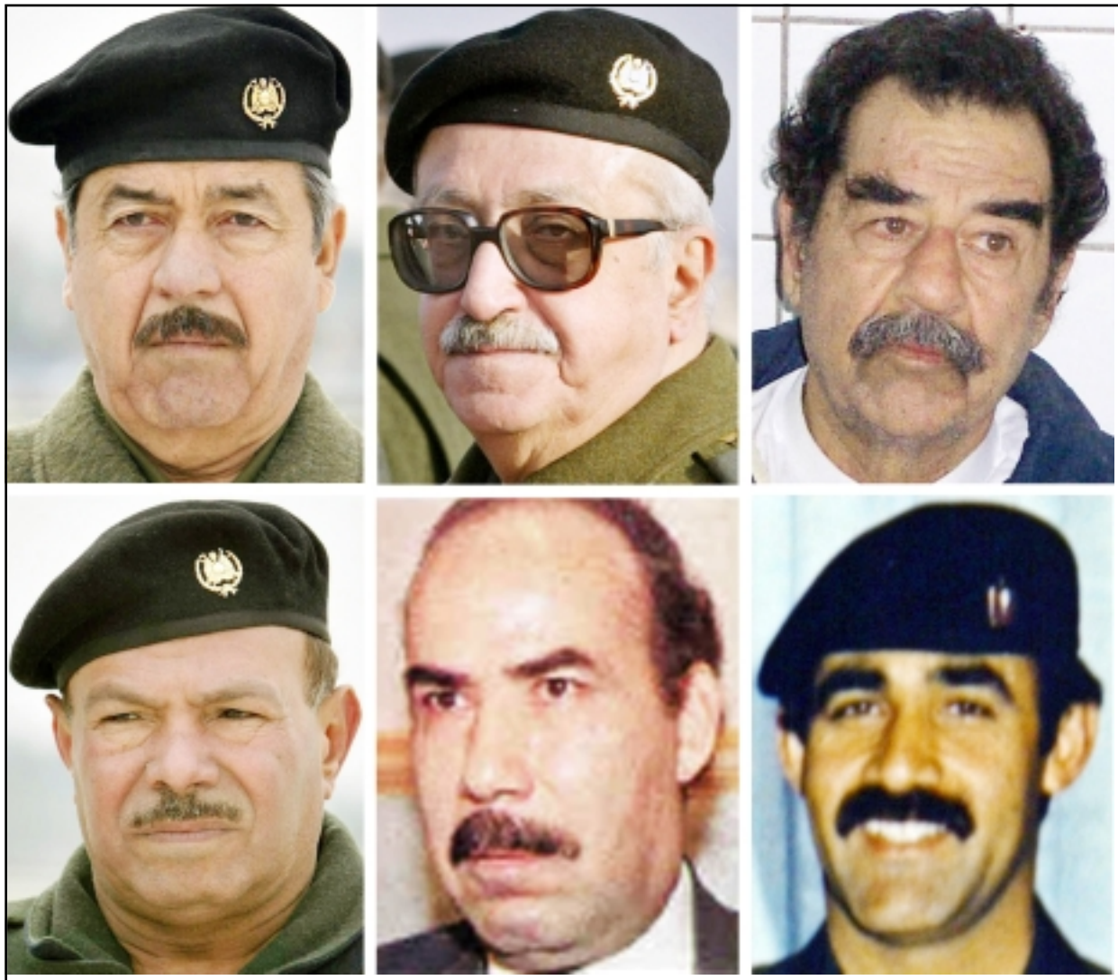
الرئيس العراقي السابق صدام حسين وبعض كبار معاونيه من سيمثلون اليوم امام المحكمة وهم من اليمين: طارق عزيز، علي حسن الجبلي، عبد حسن حمود، بوزان التكريتي وعزيز صالح نعمان

قوله الشهادة، وصرخ عبد حمود السكرتير السابق للرئيس الخلع الذي اعتقل في 16 حزيران (يونيو) 2003، انا بريء، سيأتي يوم وتعلمون كلتم انني بريء». وسيوافق صدام حسين «تهدمنا كثيرة» منها المقابر الجماعية والمفقودون وحملة الانفال ضد الكرد، وهم فساد واعتداءات شخصية» وفق السؤال ذاته. (تفاصيل ص 3 و4)