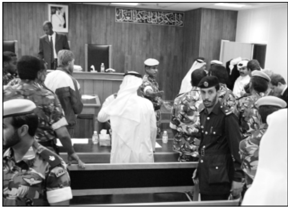
عناصر من الشرطة القطرية تقود المتهمين بغتيال الرئيس الشيشاني الاسبق بعد صدور الحكم ضدھما

الروسي سيرغي لافروف نفى اس الاربعة تورط مواطنين روسيين في اغتيال زعيم شيشاني بقطر، ونقل الوكالة عن لافروف قوله في اندونيسيا «موقف موسكو ما زال يقول بان الوكالة الروسية المنحجزين في قطر ليس لهم اي صلة بالهجوم على (سليم خان) بندرباييف»، (رويترز، اف ب)