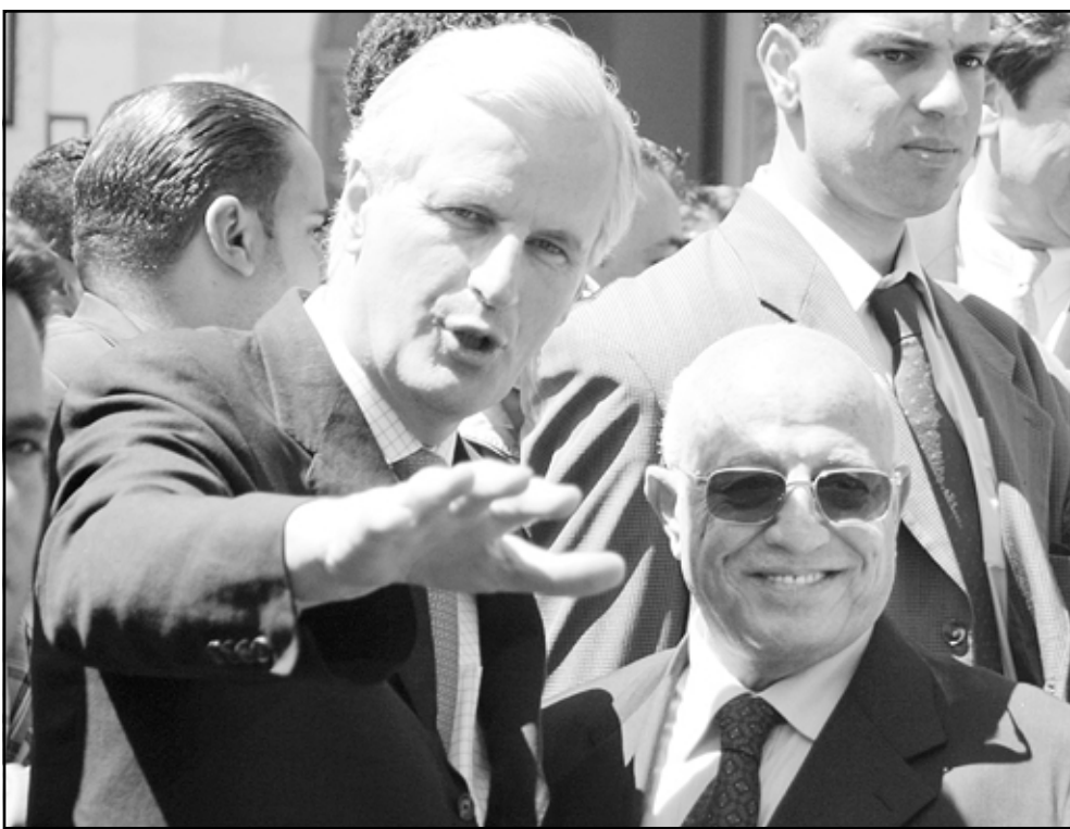
رئيس الوزراء الفلسطيني قريع لدى استقباله وزير الخارجية الفرنسي بارنيه في رام الله أمس

وصف الوزير الفرنسي الانسحاب الاسرائيلي المزمع من قطاع غزة بأنه «مفيد»، داعياً الى ادراسه في إطار «خارطة الطريق»، خطة السلام الدولية التي تنص على انسحاب إسرائيل من قطاع غزة واقامة دولة فلسطينية. وقال بعد محادثات استمرت ساعة ونصف مع عرفات في مقره العام ان «السلام يبني معاً ومن خلال طرفين وهو يتطلب جهوداً متوازية ومتبادلة ويتطلب ايضا مبادرات اسرائيلية تقوم على رفع الاغلاق ووقف القمع ووقف بناء الجدار الفاصل ومساعدة ارباب الضعفاء». وبعد ان اعرب عن «تأثره العميق بوجوده في قلب الاراضي الفلسطينية»، التي يزورها للمرة الاولى منذ تعيينه،