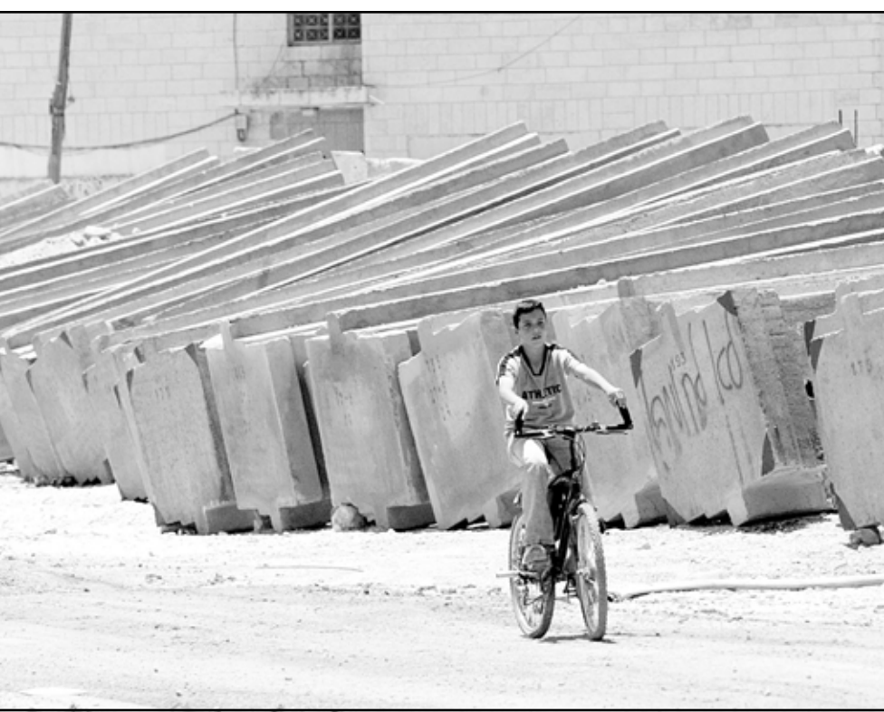
مطل فلسطيني يستقل دراجته بجوار الواح من الاسمنت التي سيتم استخدامها لبناء الجدار العازل

رام الله - غزة - القدس - رويترز - أف ب: أكد رئيس الوزراء الفلسطيني أحمد قريع امس الأربعاء تعليقا على قرار المحكمة الاسرائيلية العليا التي امرت بتعديل مسار الجدار الفاصل شمال القدس، انه يجب ازالة هذا الجدار في الضفة الغربية. وقال قريع امام الصحافيين ان «المسألة لا تتعلق بمعرفة مسار الجدار (...) انه جدار الفصل يبني على اراض فلسطينية (...) جدار الفصل العنصري ويجب هدمه لهذا السبب. ولا خيار آخر». من جهته اعتبر نائب عريقات وزير شؤون المفاوضات في السلطة الفلسطينية امس الأربعاء ان المصالح الانسانية للشعب الفلسطيني تقضي «ان لا يبني الجدار، في الضفة الغربية المحتلة». وقال عريقات لوكالة فرانس برس تعليقا على قرار محكمة الاسرائيلية العليا التي امرت امس بتعديل جزء من مسار الجدار، ان الطريقة الوحيدة للاخذ بعين الاعتبار المصالح الانسانية للشعب الفلسطيني هي ان لا يبني الجدار الاستيطاني». وتابع ويقول «اما اذا تم اعادة احياء الجدار الفاصل على بنائه فليكن على حدود عام 1967» (تاريخ احتلال اسرائيل للضفة الغربية وقطاع غزة). وأمرت المحكمة العليا باسرائيل امس الأربعاء بادخال تعديلات على مسار الجدار الذي تقيمه اسرائيل بالضفة الغربية على نحو يحد من معاناة الفلسطينيين القرويين بالمنطقة. وياتي قرار المحكمة العليا باسرائيل قبل قرار قريع في التاسع من تموز (يوليو) من محكمة العدل الدولية في لاهاي التي طلبت منها الامم المتحدة بحث مشروعية الجدار، وقالت المحكمة العليا هذا المسار تتسبب في معاناة للسكان المحليين بدرجة يتعين معها هذه الدولة ايجاد تدبير حل يحقق درجة أقل من