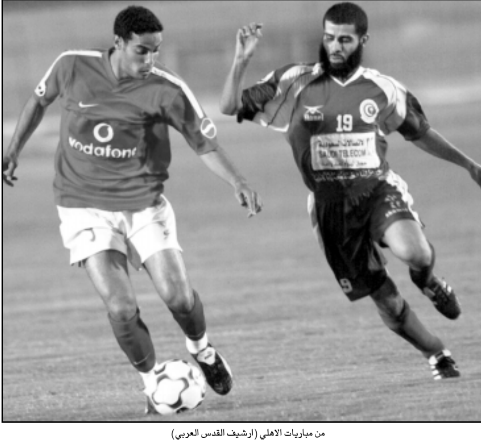
من مباريات الاهلي

توقفت تماماً نظراً للمغادرة المادية من جانب اللاعب، وانتهى الأمر. وحول الاتجاه للعب بمباريات مع اندية اوروبية كبرى خارج مصر قال رئيس لجنة التسويق ان الاهلي سيواجه فريق أوساسونا الاسباني بعد انتهاء معسكر الفريق في ألمانيا نهاية الشهر القادم وسيواجه بعدها إلى اسبانيا لأداء المباراة الودية. وأضاف انه أمر جيد ان يصبح الاهلي مطلوباً من الأندية اوروبية إضافة للحصول على مقابل مادي مجز نظير أداء المباراة. وكان الاهلي قد نظم ثلاثة مباريات ناجحة باستاد القاهرة أمام ريال مدريد الاسباني وفاز 1- صفر ثم لعب مع فريق روما اليطالي وهزمت 4/6 و2/6 وخسر الفريق أمام اياكس الهولندي بالنتيجة 2/اهما ثم واجه الاهلي فريق ريال سوسيدا الاسباني بملعب الأخير الصيف الماضي وخسر بركلات الجزاء بعدما تعادلا 1/1 في الوقت الإضافي.