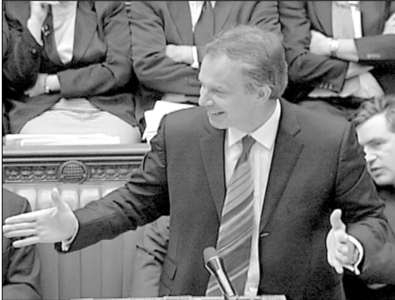
رئيس الوزراء البريطاني توني بليز اثناء مناقشة مجلس العموم امس تقویر پتلر (ا ف ب)

لندن - يو بي أي: أظهر استطلاع جديد للرأي نُشرت نتائجه امس الثلاثاء ان نسبة 55 في المئة من الناخبين البريطانيين يعتقد ان رئيس الوزراء توني بليز كذب بشأن العراق. وقال الاستطلاع الذي أجرته صحيفة الغارديان بالاشتراك مع مؤسسة (آي سي إم) ان معارضة البريطانيين للحرب على العراق «ارتفعت بمعدل 13 نقطة خلال الشهرين الماضيين وصولا الى 56 في المئة من الناخبين الذين وافقوا على هذا الاستطلاع». وقال استطلاع الرأي ان 77 في المئة من الناخبين يعتقدون ان بليز كذب بشأن العراق. وفي حين سجلت معارضة بليز هبوطا من 44 في المئة الى 38 في المئة، فقد ارتفعت معارضة بليز على العراق من 58 في المئة الى 77 في المئة. وقال الاستطلاع ان 38 في المئة من الناخبين يعتقدون ان بليز كذب بشأن العراق. وقال الاستطلاع ان 38 في المئة من الناخبين يعتقدون ان بليز كذب بشأن العراق. وقال الاستطلاع ان 38 في المئة من الناخبين يعتقدون ان بليز كذب بشأن العراق.