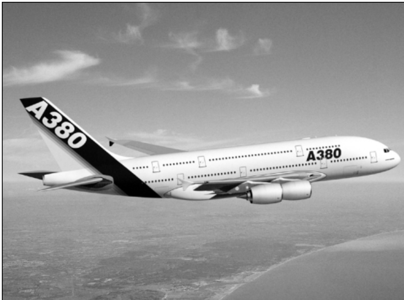
صورة افتراضية لطائرة ايه 380 العملاقة من صنع ايرباص

وقالت شركة رولزرويس لصناعة محركات الطائرات لرويترز ان صفقة امداد المحركات لطائرات ايه - 340 التي ستشترتها طيران الاتحاد تبلغ قيمتها 400 مليون دولار. ولم تختار طيران الاتحاد بعد موردا للمحركات للطائرات الاخرى.