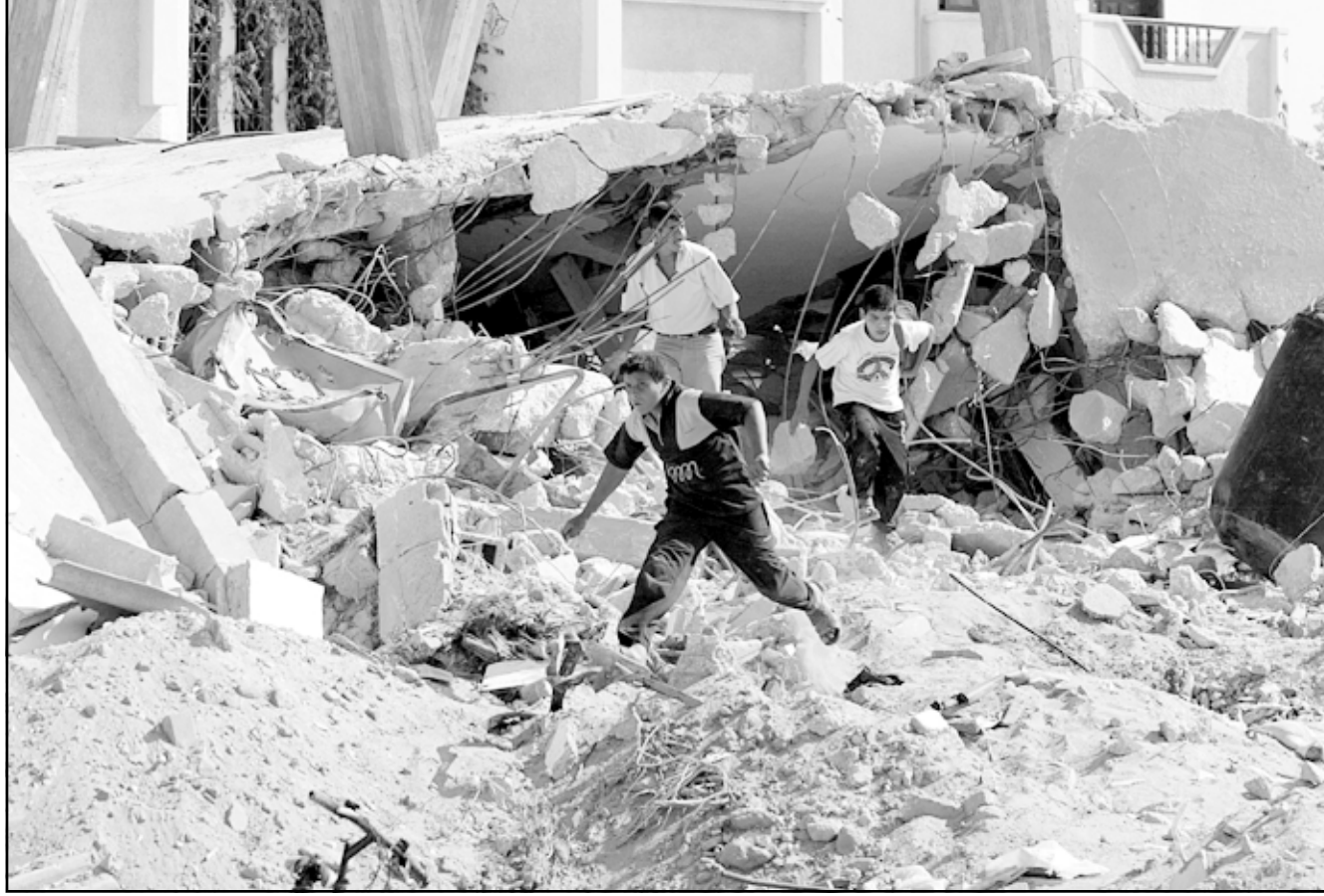
فتية يتفقدون الدمار الذي خلفه الاسرائيليون في مخيم رفح الجمعة

وقال «العراق يخربق في نهر الدم من جديد بالقتل الامريكي بالطائرات المتطورة والمدافع والصواريخ على المدنيين من جهة وعلى الرافضين للاحتلال المغطى بالغطاء الرسمي من جهة اخرى وضد اقدس ارض في