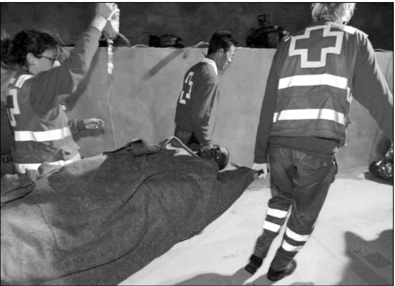
هذا المهاجر المحطوط، لأنه لم يمت غرقاً يوم الخميس جاء من السودان بحثاً عن الحلم الاوروبي، فانتبهته في الماطح على هذه الحال