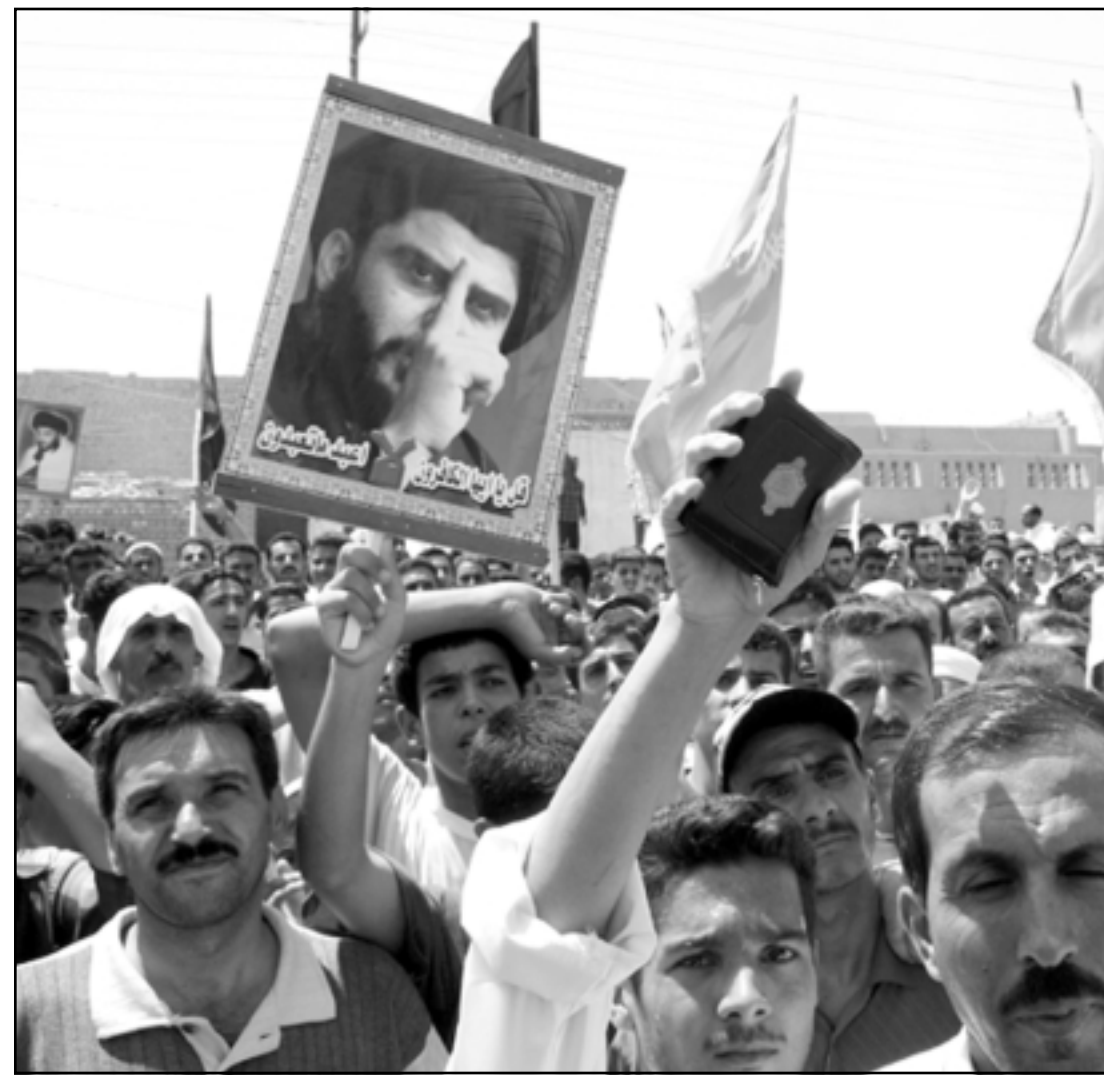
اهالي الفلوجة يتظاهرون تضامنا مع السيد مقتدى الصدر و احتجاجا على اقتحام النجف

وقام علاوي يرافقه عدد من الوزراء الاحد الماضي بزيارة لم يعلن عنها مسبقا الى مدينة النجف الاشراف التي تشهد قتالا عنيفا بين القوات العراقية والامريكية من جهة وانصار الزعيم الشيعي المتشدد مقتدى الصدر. وطلب علاوي من عناصر الميليشيا ان يتلقوا اسلحتهم ويغادروا المدينة.