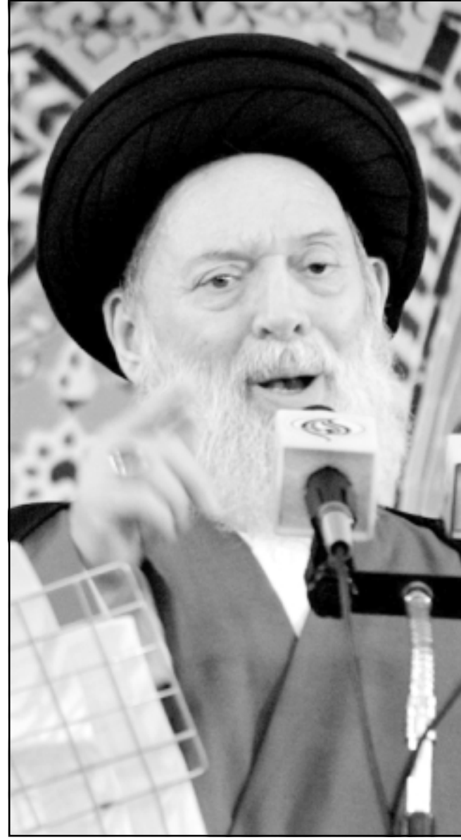
الشيخ فضل الله يلقي خطبة الجمعة في مسجد الحسين

وقال عبد الجواد صالح لـ«القدس العربي» انه يتامل من ان الدعوى المرفوعة امام المحكمة قد توصل رسالة للمفسدين مفادها «ان هناك من يتابع قضايا الفساد» خاصة فضيحة تهريب الاسمنت المصري.