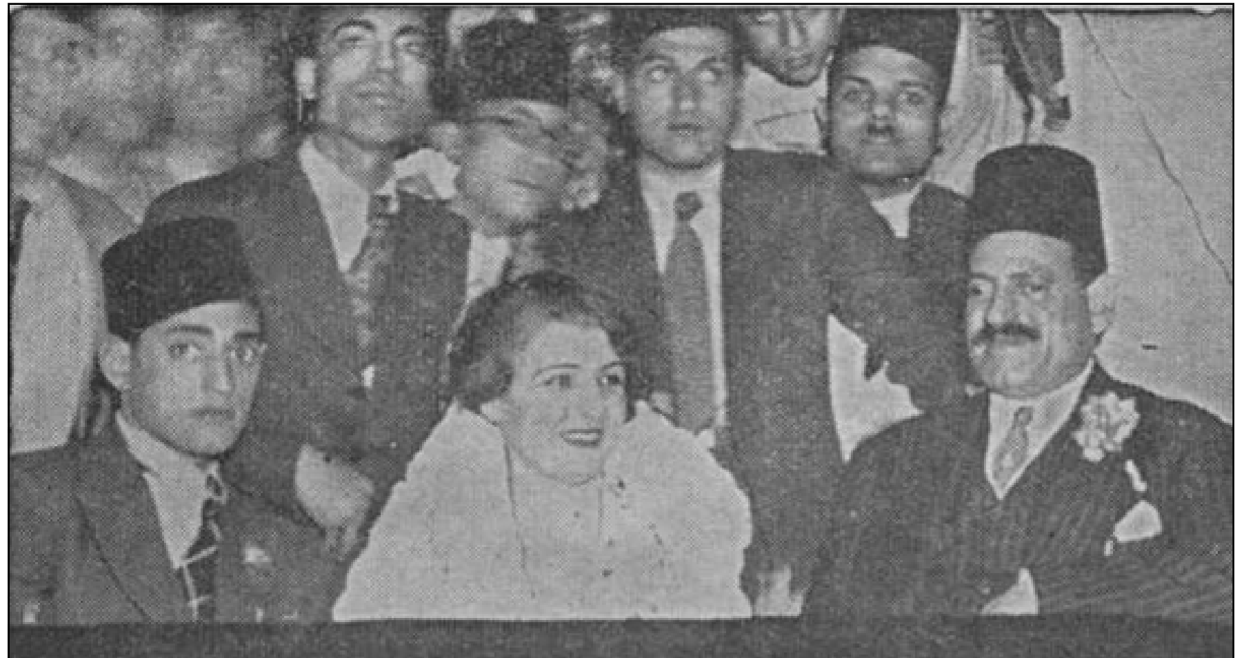
مع مصطفى النحاس 1934

لم تطلق النيابة سراح ابراهيم خليل، بل قبضت على التابعي، وانزتهما معا في زنزانة السجن. وكان رئيس الوزارة في ذلك الوقت هو عبد