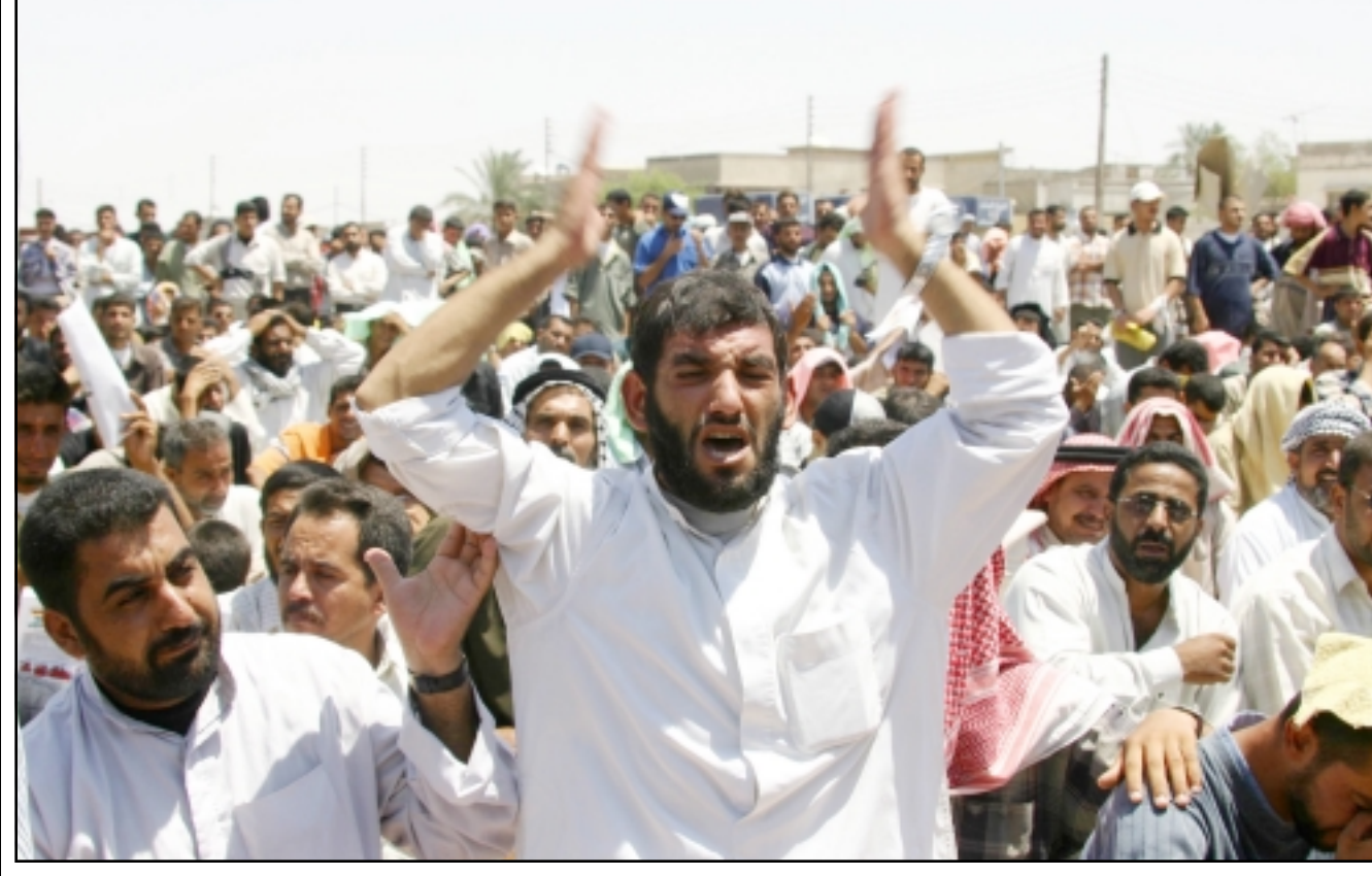
عراقيون في مسيرة غاضبة خرجت من مدينة البصرة باتجاه النجف اثر توراد الانباء عن اصابة السيد مقتدى الصدر

قال الاردن الجمعة ان الدعوى القضائية التي رفعها السياسي العراقي البارز أحمد الجلبلي ضده هي مانورة للخروج من مأزقه السياسي الراهن وتحويل الانتظار عن ملاحظته قضائيا. وقالت اسمى خضر وزيرة الدولة والناطق الرسمي باسم الحكومة في تصريحات نشرت في الصحف الجمعة ان الدعوى التي رفعتها عائلة الجلبلي في واشنطن يوم الاربعاء ضد الاردن «امر مستغرب وهي مانورة من قبل الجلبلي للخروج من المأزق السياسي الذي يعانيه». وكانت عائلة الجلبلي رعتت دعوى قضائية في المحاكم الامريكية ضد الاردن زاعمة ان الملكة سعت لقتله وتمير مصالحه التجارية، ويقول الجلبلي ان محافظ البتاك المركزي الاردني وحكومة الاردن سعيا لتلطيح بنك البتراء حتى يستنك من الحديث عن صفقات اسلحة لنظام الرئيس العراقي السابق صدام حسين، وادين الجلبلي غايبيا في عام 1992 بتهمة اخلاص اموال بنك البتراء وصدور بحقه حكم غيابي بالسجن 22 عاما ولا يزال بلاحق لاقراء هذه العملية. وقالت مصادر طبي ان العملية استغرقت نحو 45 دقيقة، وتم خلالها توسيع احد الشرايين الدقيقة في عضلة القلب. ويأمل الاطباء ان تحسن صحته، والا يضطروا الى اجراء عملية جراحية كبرى.