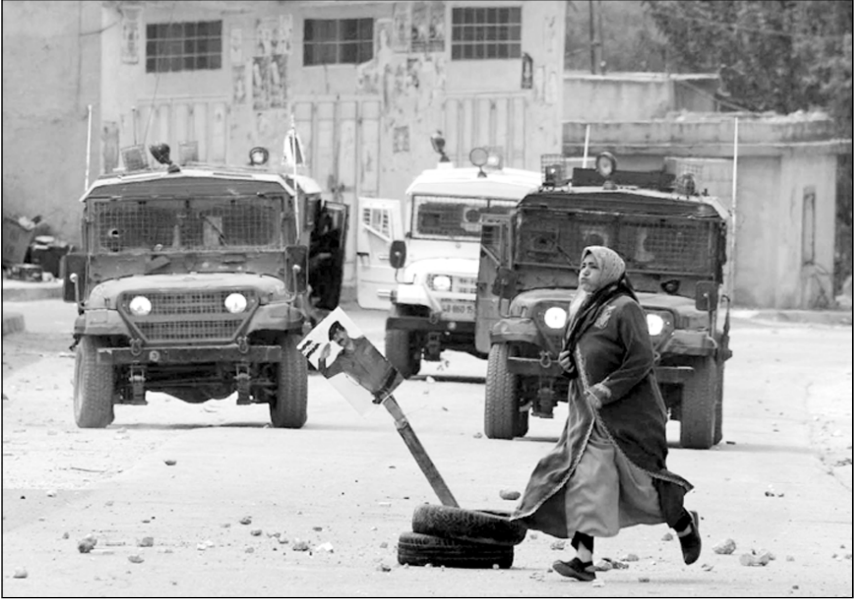
سيدة تركض بسرعة امام سيارات الجيش التي اقتحمت بلدة بيت فوريك امس، وقد نصبت وسط الشارع صورة صدام حسين

وأدين الديمسي وزميله خالد عبد القصاب في آيار عام 1970 وحكم عليهما بالسجن لمدة 31 عاما واطلق سراحهما عام 1979 وظلا على ما يبدو مقيدان في تلك الدولة. ونصت قائلة: لم تحظ هذه الرواية في حينها بالإبظاظ الاعلامية هامشية في إسرائيل، وبدت في ذلك الوقت كما