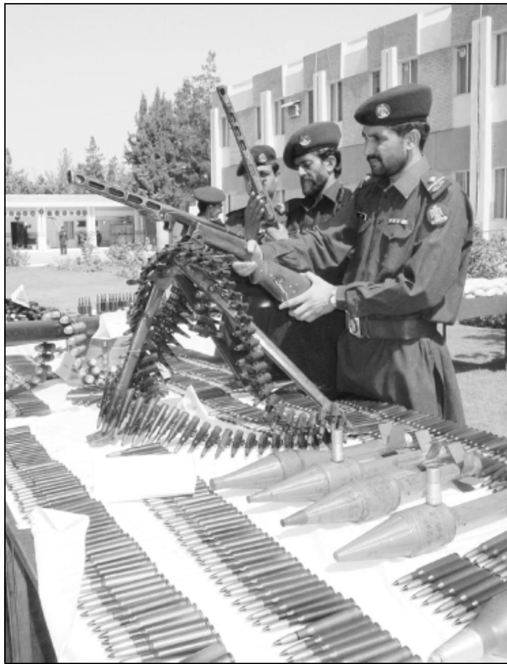
عسكر باكستانيون يتفقدون أسلحة واحتجزوها خلال داهمات على معازل إسلاميين بمغلفة كويتا (غرب)

■ واشنطن- يوب بي أي: قالت مصادر مطلعة في أجهزة الاستخبارات الباكستانية أن باكستان تدرس بجدية اقتراحاً بملاحقة الجماعات الإسلامية الجهادية التي ترتبط بالوسط السياسي الديني الرئيسي في البلاد. وتأتي على رأس لائحة المجموعات المعرضة للملاحقة، الجماعة الإسلامية، وهي أكثر الأحزاب الدينية تنظيماً في باكستان وتحظى بشعبية واسع في صفوف الطبقة المتوسطة المثقفة الباكستانية. وقال النائب في البرلمان الباكستاني فاروق الستار زعيم الحزب العرقي حرس الذي ينتمي إلى التحالف الحكومي القائم «نحن أنفاجاً إذا بدأت حملة عسكرية قريباً تقوم باستهداف كوادر الأحزاب الدينية المختلفة». ويحتل بعض أعضاء حرس مناصب قيادية في الحكومة الباكستانية بما في ذلك الحكومة الفيدرالية. وأضاف الستار الذي يتزعم حزبا يعتبر من ألد الأعداء السياسيين للجماعة الإسلامية «يجب أن يسحق هؤلاء الذين يعرضون مصالح الدولة للخطر».