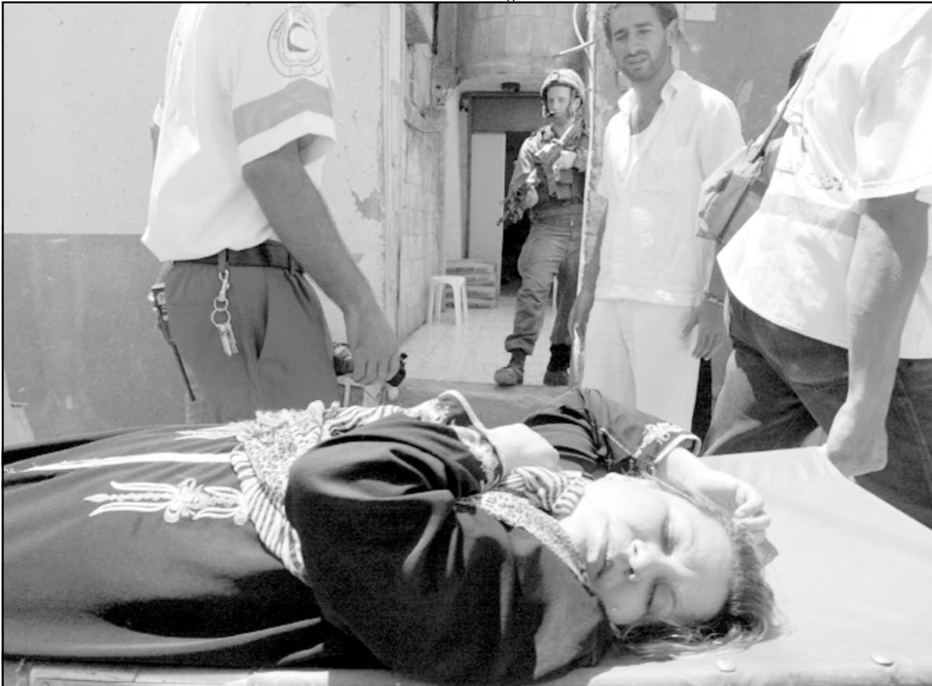
مسعفون ينقلون سيدة أصيبت برصاص الاحتلال في نابلس