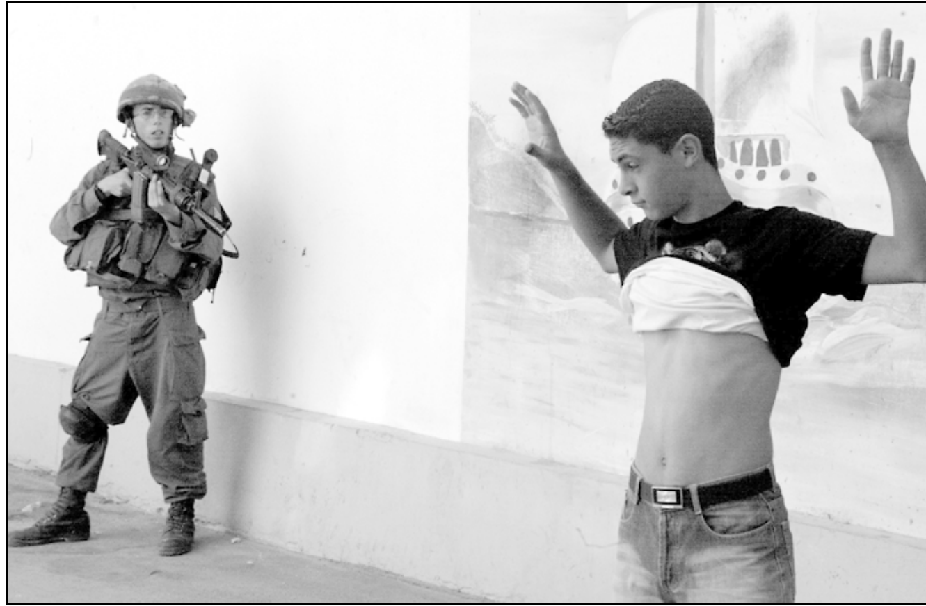
جندي اسرائيلي يشهر سلاحه باتجاه طفل فلسطيني في مخيم عسكر امس

الناصرة - «القدس العربي» - من زهير اندراوس: