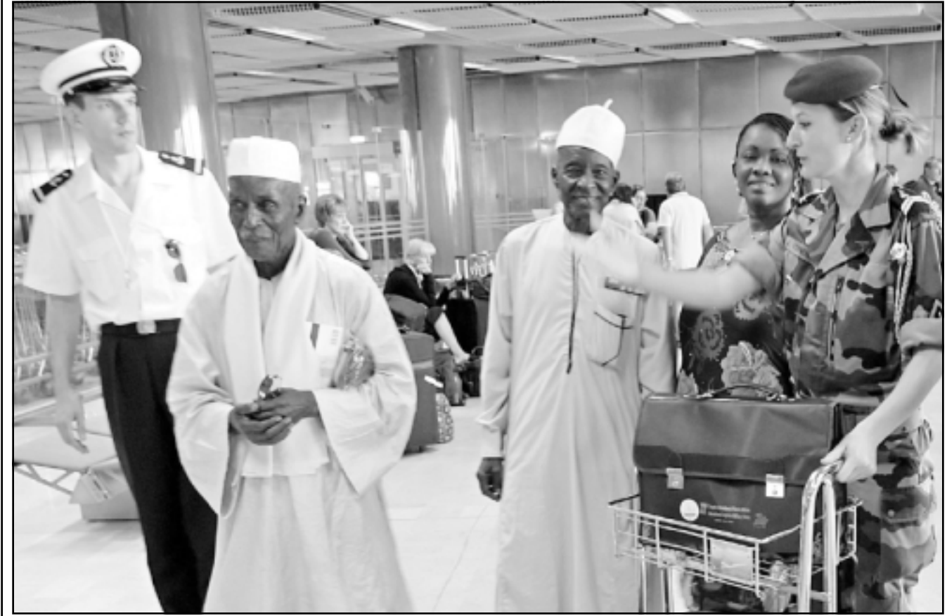
بضعة جنود افارقة سابقون وصلوا الاسبوع الماضي الى تولون لتكريمهم فرنسا في ذكرى لـ 60 انزال بروفانس،

■ الجزائر - «القدس العربي»: تجتاح مناطق شمال الجزائر منذ الاثنين موجة حرارة غير مسبوقة يتخللها هبوب رياح ساخنة وضغط في الجو زادت حدته امس الثلاثاء حيث فاقت درجات الحرارة 44 درجة تحت الظل في الجزائر العاصمة والمدن الساحلية الأخرى، وأكثر من 46 درجة في الولايات الداخلية.