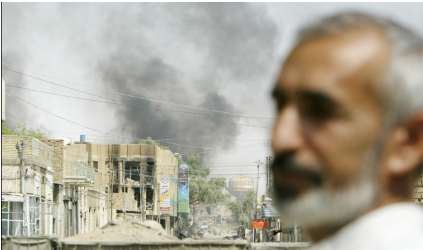
الدخان يتصاعد من محيط الصحن الحيدري الشريف في النجف امس اثر الهجوم الامريكي