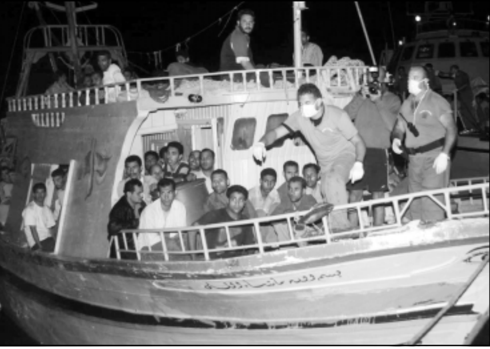
مركب مهاجرين وصلوا الليبية قبل الماضية الى لمبيدورا الإيطالية

كتبنا ابني حفص المصري على برلوسكوني انه لم يعبأ بالانذار الاخير لسحب القوات الإيطالية المنتشرة في العراق وعديدها ثلاثة الاف رجل، من العراق.