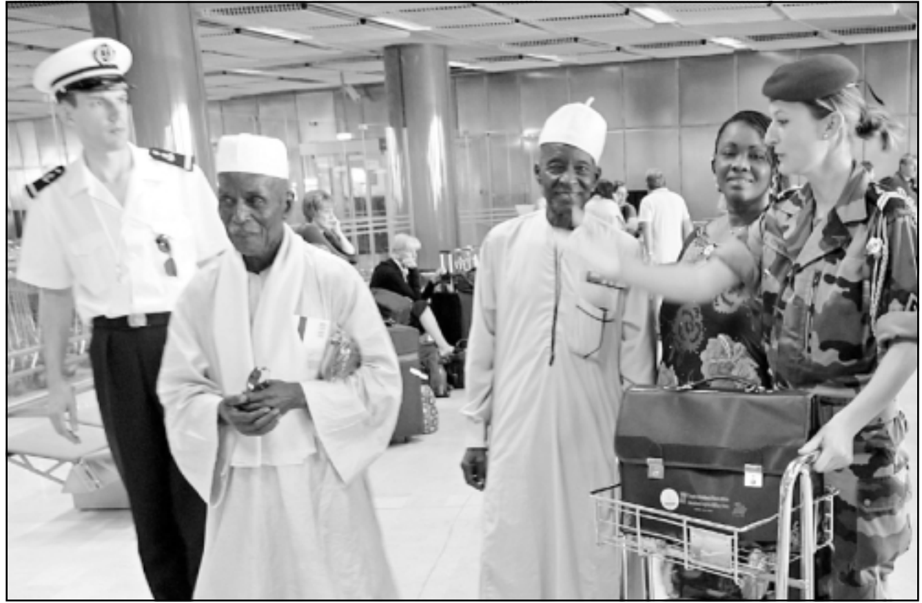
بضعة جنود افارقة سابقون وصلوا الاسبوع الماضي الى تولون لتكريمهم فرنسا في ذكرى لـ 60 انزال بروفانس،

مبارته «بهدف اعادة تقييم دور افريقيا في احلال السلام بالعالم المتقدم عبر مشاركتها في حربي عايلتين، ليس من العسل عدم تعريف الاطفال الفرنسيين بان حربي فرنسا ترجع ايضا لحقيقة أننا شاركنا في ذلك مثلنا مثل دول أخرى، يتعين ان يستقر ذلك في ضمير الافارقة والفرنسيين والمجتمع الدولي».