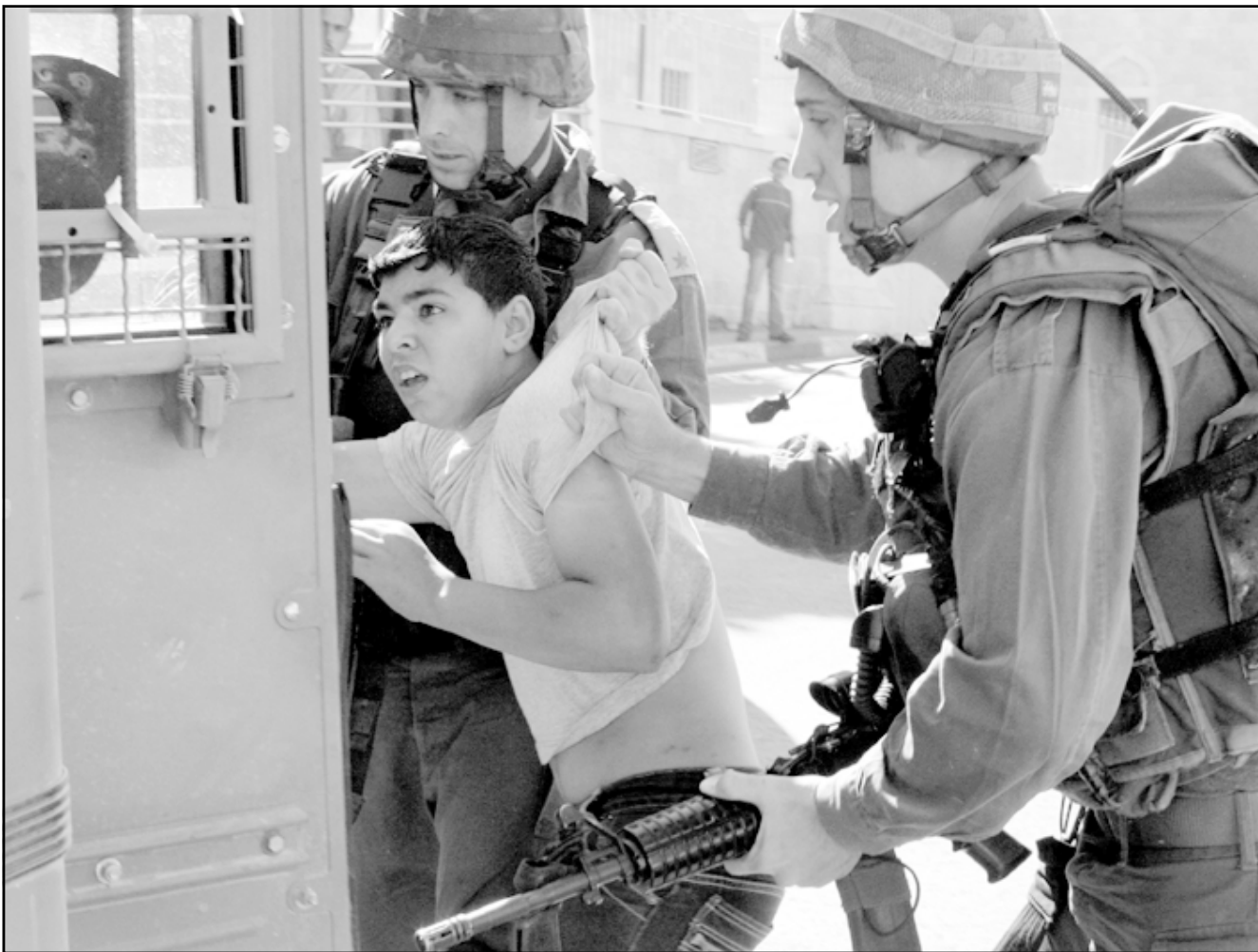
جنود اسرائيليون يعتقلون طفلا في بيت لحم

رام الله - وكالات: خرج آلاف الفلسطينيين أمس الثلاثاء في مسيرات بالضفة الغربية وعم الاضراب العام المدن تضامنا مع الاسرى الفلسطينيين المضربين عن الطعام في المعتقلات الاسرائيلية. ودخل الاسرى يومهم الحادي عشر في الاضراب عن الطعام احتجاجا على ظروفهم داخل السجون. واعرب ذوو المعتقلين ومسؤولون فلسطينيون عن قلقهم الشديد حيال الوضع الصحي للاسرى المضربين خاصة بعد سحب ملح الطعام من رزاقهم.