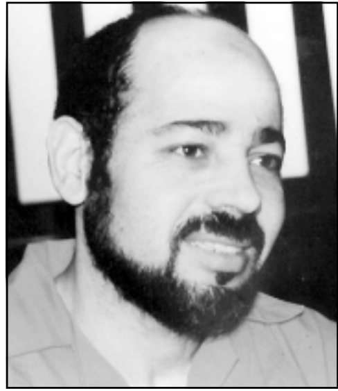
موسى ابو مزورق

■ دمشق - عمان - رويترز - ق. ب: سخر أحد كبار قادة «حماس» أمس الثلاثاء من اتهامات بـ «تمويل الإرهاب» وجهتها الولايات المتحدة إليه والى فلسطينيين آخرين بوصفها «اتهامات قديمة»، نقضت عنها واشتظن الغيار لتعزير صورتها في عام الانتخابات.