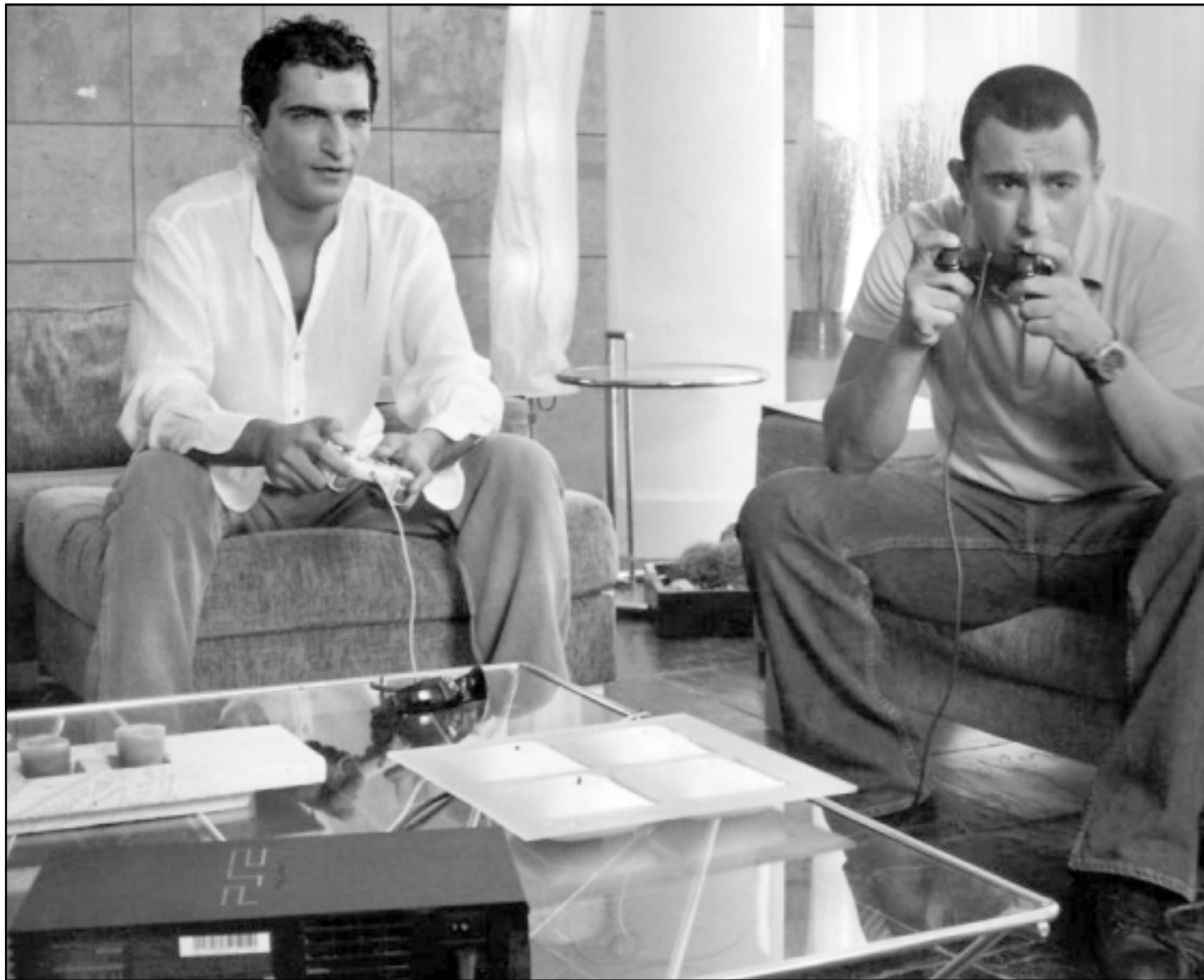
لقطة من فيلم «تيتو»