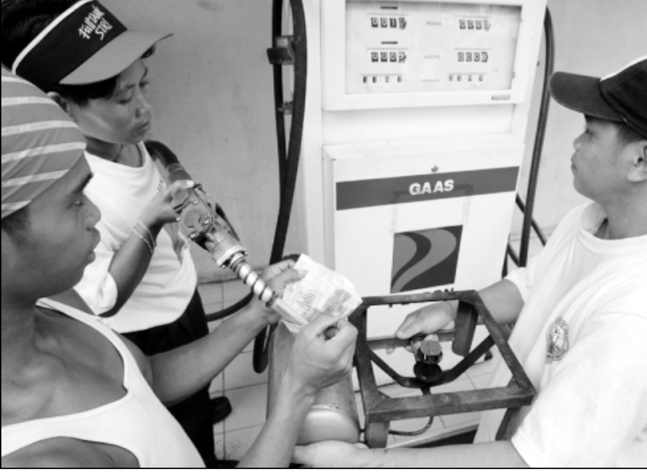
مطل قلبيبي ووالده ميانلن خزان فرن الطهي بالكهربوسين في محطة وقود في العاصمة مانيلا

■ مانيلا - رويترز: أوقفت الفلبين المشتريات الحكومية من السيارات أمس الثلاثاء وأمرت بإغلاق أجهزة التكييف في الإدارات الحكومية بعد الظهور في إطار خططها لخفض نفقات استيراد النفط بعد ارتفاع أسعاره إلى مستويات قياسية.