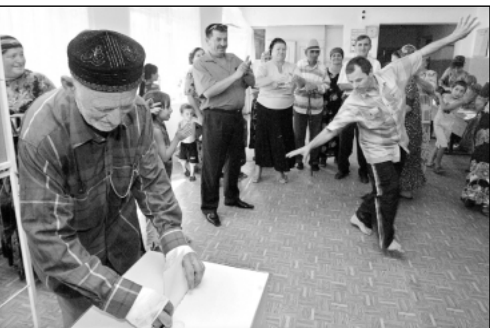
شيشانيون يدلون بأصواتهم بأحد مراكز التصويت في غروزني