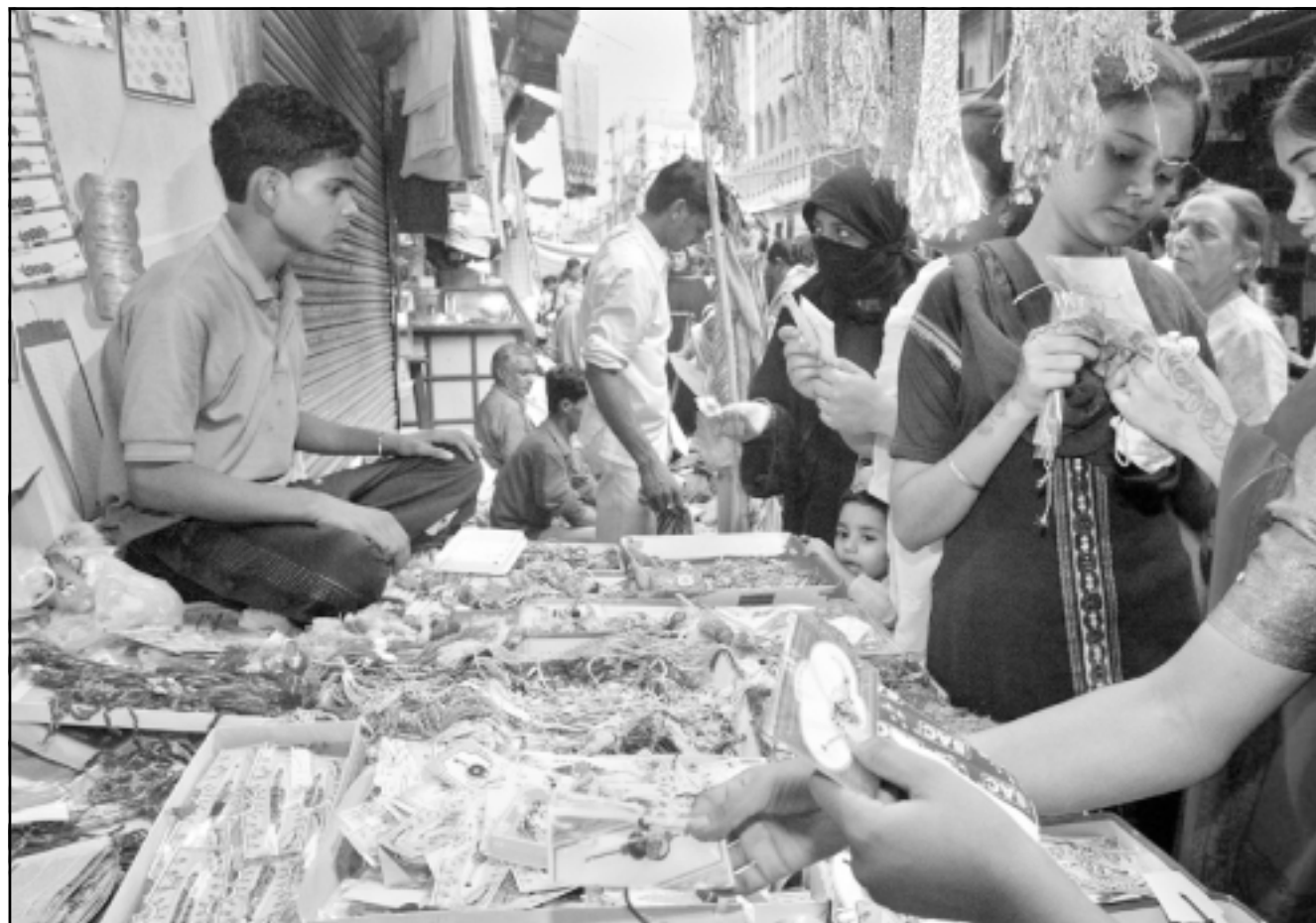
سوق للسلع التقليدية في نيودلهي العاصمة الاقتصادية للهند

وقال دبلوماسي غربي «يبدو الامر كما لو كان سينغ وزير المالية وسونيا غاندي وزيرة كل شيء احر». وتابع «لا اعتقد ان هذه الاتفاقية بصيغتها الحالية ستدوم حقا، يتعين على رئيس الوزراء ان يثبت نفسه».