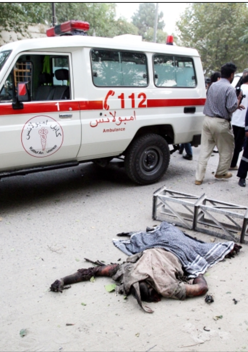
مسعفون ينقلون جثامين قتلى الانفجار الذي وقع في كابول امس

كابل - «القدس العربي»: بيان نشره موقعها على «الانترنت» وزير الدفاع الامريكي دونالد رامسفيلد وتوعدت فيه بمواصلة «الجهاد». فقد اكد «المتكب الاعلامي في امارة افغانستان لتدريب قوات الشرطة افغانية، وقتل فيه 15 شخصا على الاقل بينهم امريكيون واجانب آخرون. وقال مسؤول بوزارة الدفاع افغانية ان ثلاثة امريكيين على الاقل ممن يعملون في تدريب قوة الشرطة افغانية الجديدة واثنين من أفراد الشرطة قتلوا في الانفجار. وقال متحدث باسم «طالبان» ان مفعرا انتحاريا من طالبان نفذ التفجير باستخدام سيارة ملغومة وقتل في الهجوم، وأضاف «اتصلت بزميلنا وقالوا انه هجوم انتحاري نفذه مقاتل من طالبان».