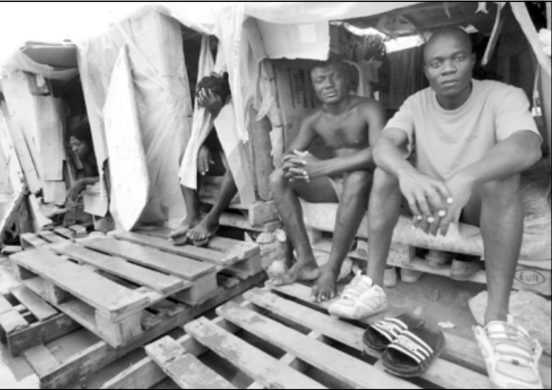
مهاجرون افارقة بغابات في شمال المغرب ينتظرون فرصة للتسلل الى اسبانيا

الرباط - رويترز: قالت مصادر رسمية أمس الأحد أن البحرية المغربية أوقفت 65 مغربيا كانوا يحاولون التسلل لاسبانيا بشكل غير قانوني في من قرب مطاطي بحرك من نوع «ياماها» عبر شواطئ الحسيمة في شمال شرق المغرب. وكانت البحرية المغربية قد أوقفت السبت 33 مغربيا آخرين كانوا يحاولون التسلل من المنطقة نفسها. وأفاد بلاغ للبحرية المغربية أن الأشخاص الموقوفين «تلقوا المساعدة والعلاجات الضرورية قبل تسليمهم إلى رجال الدرك الحسيمي للتحقيق معهم وتطبيق القانون في حقهم». كما اعترضت البحرية المغربية تعمل بنفس المنطقة أربعة قوارب لمطاطية من نوع «زودياك»، وعلى متنها 180 مغربيا من المرشحين للهجرة السرية من بينهم أربع نساء. وقال بيان لوزارة الداخلية المغربية أمس أن المغرب أوقف خلال الأسبوع المنتهى في 27 آب/أغسطس الحالي أكثر من 400 متسلل حاولوا العبور بطرق غير شرعية إلى السواحل الاسبانية عبر الشواطئ المغربية. وأضاف البيان أنه في الفترة الممتدة من كانون الثاني/يناير وحتى آب/أغسطس «تمكنت مصالح الامن المغربي من إيقاف أكثر من 3700 مرشح للهجرة السرية في منطقة العيون» على الساحل الأطلسي. وتحاول أعداد من الافارقة والغاربة التسلل عبر المياه المغربية بواسطة قوارب بدائية رغبية في الوصول إلى الشواطئ اسبانيا. ويتزايد عددهم خلال فصل الصيف نظرا لتحسن حالة الطقس. ويسعى المغرب جاهدا للحد من هذه الظاهرة بسبب الضغوط التي تمارسها الدول الأوروبية عليه وعلى جيرانه لمنع الافارقة الذين لا يحملون تأشيرات دخول من التسلل للسواحل الأوروبية. وكان المغرب قد انشا في وقت سابق ادارة للهجرة ومراقبة الحدود كما سن قوانين متشددة لمكافحة الهجرة غير الشرعية.