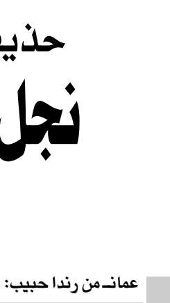
عمانمن رندا حبيب:

رأى حذيفة عزام، نجل عبد الله عزام، مرشد زعيم تنظيم القاعدة أسامة بن لادن، في حديث مع وكالة فرانس برس، أن «اعداد كبيرة» من معظم أنحاء العالم الإسلامي «يتدفقون» الى العراق من أجل المشاركة في الجهاد ضد الاحتلال.