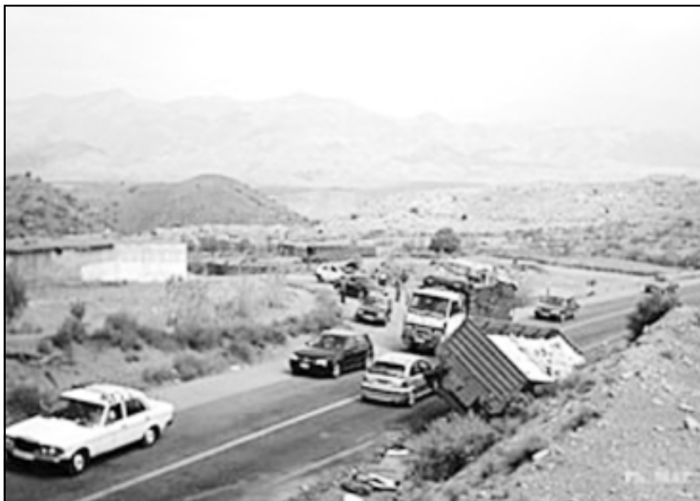
مشهد من الحادث المساسي الذي وقع السبت بالقرب من إيمينشانتون ضحية 29 شخصا

لقي عشرات المواطنين المغاربة حتفهم وأصيب مئتهم بجروح في حوادث سير وقعت بالمغرب في اليومين الماضيين، أهمها حادث وقع بجنوب البلاد أسفر عن مقتل 29 مسافرا. ولقي 29 مصرعهم وأصيب حوالي 20 آخرين بجروح في الحادثة التي وقعت السبت بمدينة إيمينشانتون القريبة من مراكش بجنوب البلاد، وتنتج الحادث عن اصطدام بين حافلة ركاب وشاحنة وسيارة أجرة. وأوضحت الشرطة المغربية أن الحادثة وقعت اثر اصطدام حافلة الركاب القادمة من أكادير (أقصى الجنوب) بشاحنة مقطورة محملة بالزجاج وسيارة أجرة كبيرة كانتا قادمين من الاتجاه المعاكس. وعزت المصادر ذاتها سبب الحادثة إلى كون سائق الحافلة حاول التجاوز في وضعية غير قانونية مما أدى إلى اصطدام الحافلة التي لقي 27 من ركابها مصرعهم مع الشاحنة، ثم بعد ذلك مع سيارة الأجرة التي لقي اثنتان من ركابها مصرعهما على الفور.