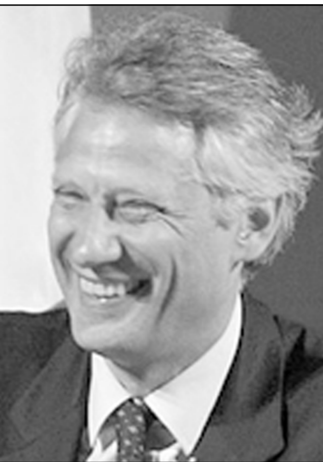
وزير الداخلية الفرنسي دومينيك دوفيلبان

باريس - «القدس العربي» من شوقي أمين: أكد وزير الداخلية الفرنسي دومينيك دوفيلبان رفضه «الخلط بين الإسلام والإرهاب»، مشيرا إلى أن «التعاظم مع الإسلام متطرف، هو انحراف ديني يهدف إلى جلب العقول الضعيفة». وعرج دوفيلبان على السبل الكفيلة بمحاصرة الإرهاب مقترحا الحل إلى علم القياس بهدف التعرف على الأشخاص والحد من ظاهرة تزوير وثائق الهوية وغيرها. وأشار في حديث ليومية «لوموند» إلى أن حوالي مليون بطاقة هوية سرقت خلال سنة 2003، وأوضح دوفيلبان أن «الإرهابيين يستعملون وسائل متباينة تمكنهم من الانتقال وحيات ليست لهم». وفي حديثه عن السياسة التي تنتهجها فرنسا في صد الهجرة غير الشرعية، قال دوفيلبان أن الموضوع يشكل «هانا وألوية» لدى السلطات الفرنسية كون «ضغط الهجرة على أبواب فرنسا مقلق للغاية». وأضاف أن صد المهاجرين عند الحدود الفرنسية ارتفع بنسبة 50 بالمئة في النصف الأول من السنة مؤكدا على ضرورة «مراعاة الجانب الإنساني» في التعامل مع ملف الهجرة.