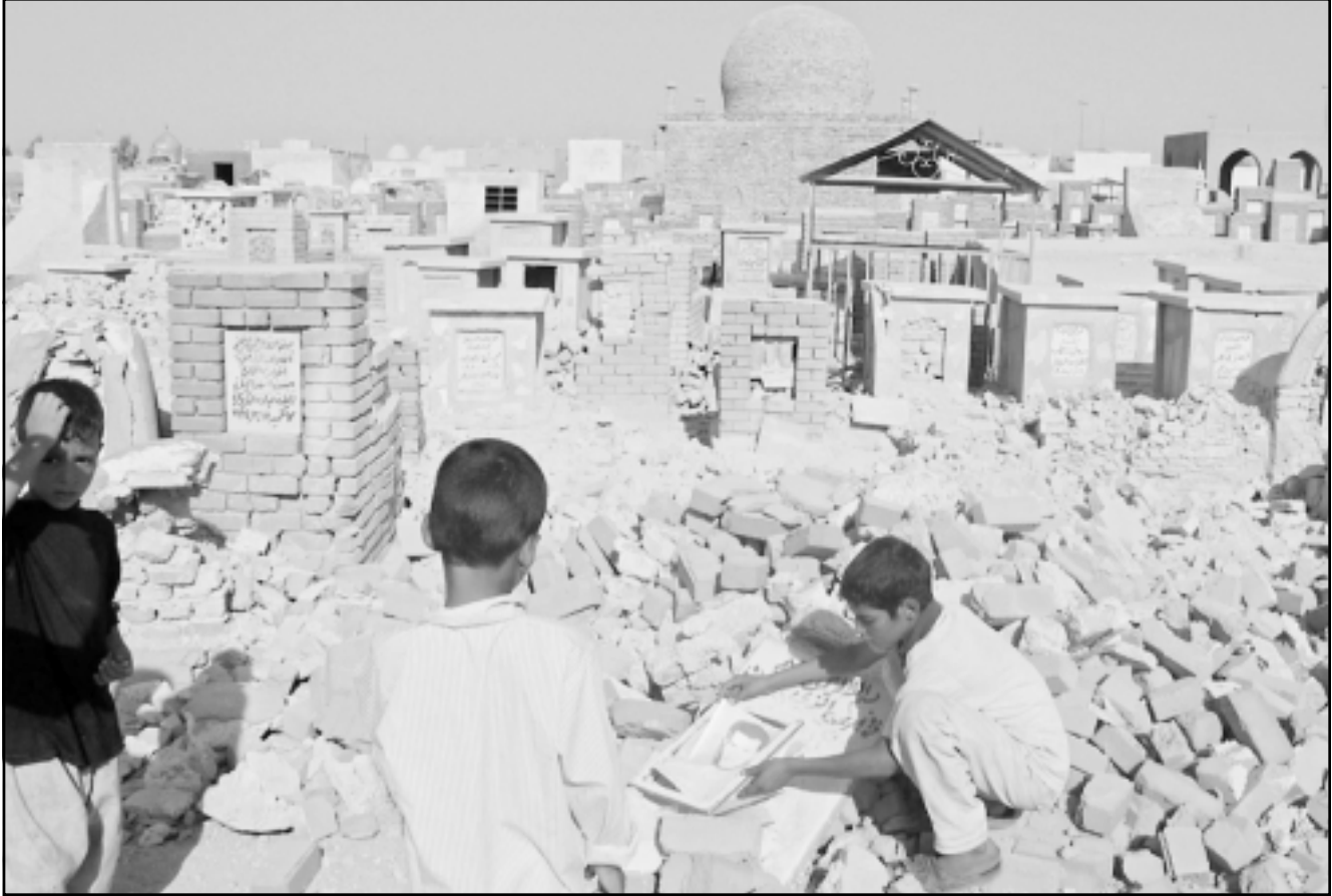
اطفال عراقيون يلعبون فوق حطام أحد المقابر في النجف القديمة التي تعرضت لقصف امريكي عنيف

وقال سكارليت، تحديدا انه قلق من الطريقة التي قام الاعلام من خلالها بتفسير الملف. ويقول دايف انه اجبر على الاستقالة على منصبه بعد ان فشل مجلس ابناء او حكام بي بي سي، بدعمه بعد نشر ملف هاتون. ويقول ان ستة من حكام الهيئة، بمن فيهم بولان نيفيل-جونز