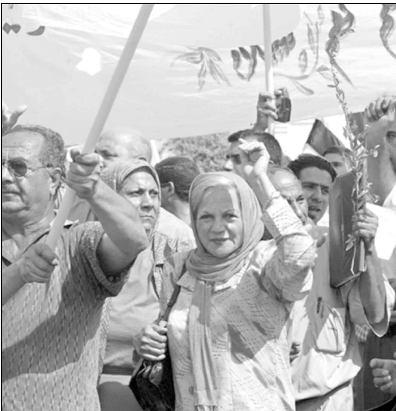
عراقيون في مظاهرة ضد الإرهاب في بغداد