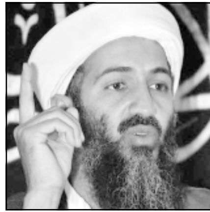
اسامة بن لادن

بشدة العمليات الارهابية الأخيرة التي شنتها القاعدة في السعودية. في البداية، وعلى الاصح ما تبقى منها بعد عمليات التصفية الإسرائيلية، لن تسمح في تدخل القاعدة في كفاها، وهي مثل م.ت.ف والجهاد الإسلامي (التابع ليران) ترى في هذا التفاح كفاها قويا ضد الاحتلال وليس جزءاً من الصراع الدولي ضد غن الغرب الفاسد. حكومة اسرائيل التي تقاطع حكم الوطني الفلسطيني ولا ترى فيه شريكا للحوار السياسي وتهدد الآن بضره قاده حماس في سورية، قد تتسبب في وضع تثبت فيه اعشاب ضالة، أكثر خدر وقسوة بأضعاف المرات، على انقراض الفصائل القائمة حاليا.