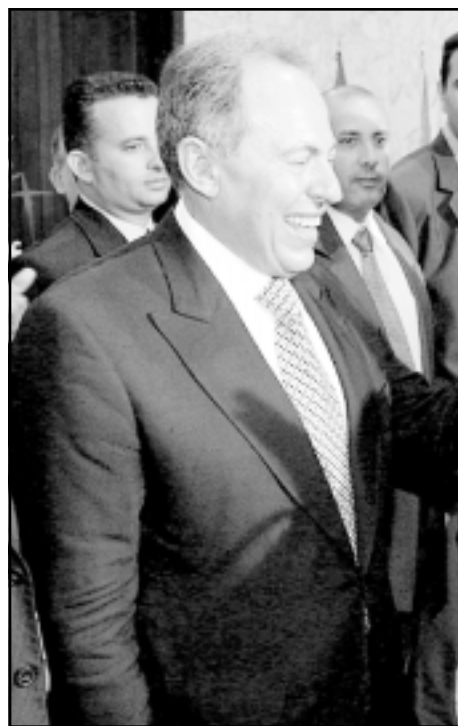
سيدة لبنانية تهنيئ لحود وتمديد ولايته

بيروت - ا ف ب: طلب لبنان بحث قرار مجلس الامن الدولي، الذي دعا الى احترام سيادته وسحب جميع القوات الاجنبية من اراضيه في اشارة ضمنية الى سورية، في الجامعة العربية للحصول على الدعم في مواجهة القرار الذي اعتبره تدخلا في شؤونه الداخلية كما افاد اليوم الاثنين مصدر في وزارة الخارجية اللبنانية. وأوضح المصدر ان وزير الخارجية جان عبيد طلب التي قدمت بالاشراك مع فرنسا هذا القرار الى مجلس الامن ان سورية مارس صغطا على النواب لاعتماد تعديل دستوري تمديد ولاية لحود كما وصفت ما جرى بانه «مسح» للديمقراطية، علما بان موسى ابي «دشنة» من القرار واكد السبت ان هذا القرار «صدر في قضية غير عادلة وغير منزدة بتطورات تهدد السلم والاستقرار وهو ما يثير علامات استفهام حوله وحول مدى احقية المجلس في التدخل في الشؤون الداخلية في حالة مثل حالة لبنان».