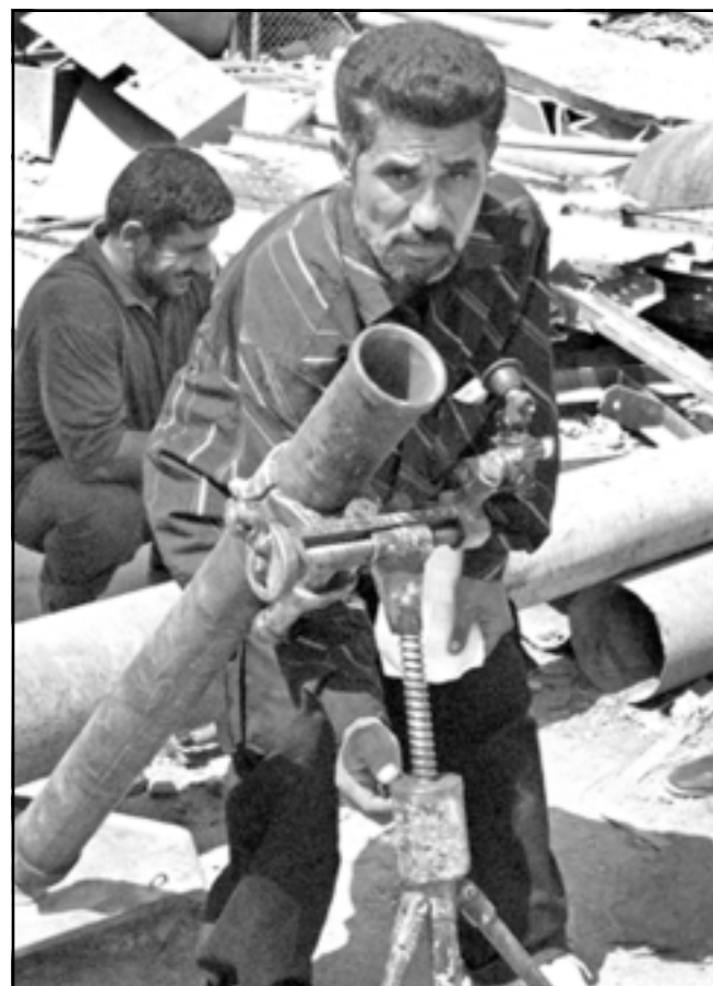
مقاتل من اتباع مقتدى الصدر أثناء مواجهات مع القوات الأمريكية في بغداد

■ الكويت- يو بي آي: أعلن الوزير العراقي لحقوق الإنسان بختيار أمين أمس أنه تم اكتشاف 262 مقبرة جماعية في العراق من مخلفات نظام الرئيس المخلوع صدام حسين. وأوضح أمين للصحافيين لدى وصوله إلى مطار الكويت للمشاركة في اجتماع للدول التي فقدت مواطنيها في العراق، ان الظروف الأمنية السائدة لم تساعد على استمرار البحث عن مزيد من المقابر الجماعية وتحديد هويات الضحايا الذين تم العثور على جثثهم. وشدد أمين على ان «العمل مستمر في العراق لكشف جرائم النظام العراقي السابق كالمقابر الجماعية