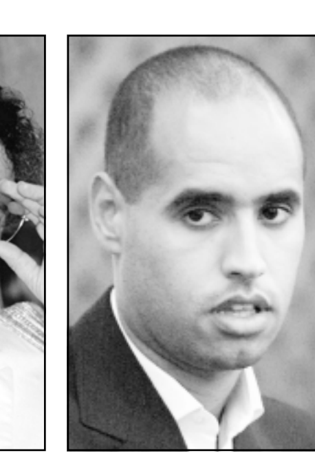
سيف الاسلام القذافي