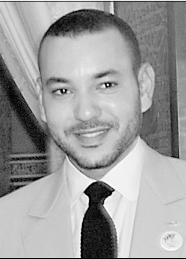
الملك محمد السادس