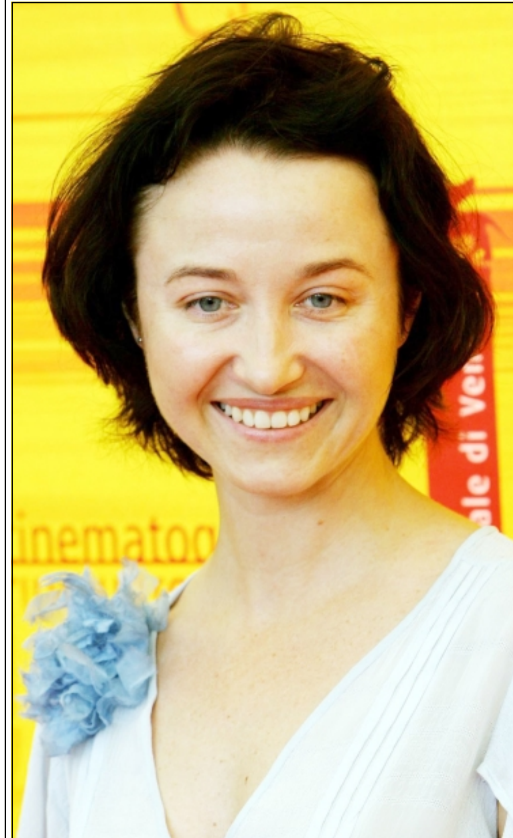
النجمة الفرنسية غابرييل موسكالا بطلة فيلم «كل الشتاء بدون ناء» المشارك في المسابقة الرسمية لمهرجان البندقية

● يفتتح بمصر غداً الأربعاء مهرجان الإسكندرية السينمائي الدولي الذي يراسه الناقد السينمائي رؤوف توفيق ويعرض في الافتتاح الفيلم الإيطالي «مكان الروح».