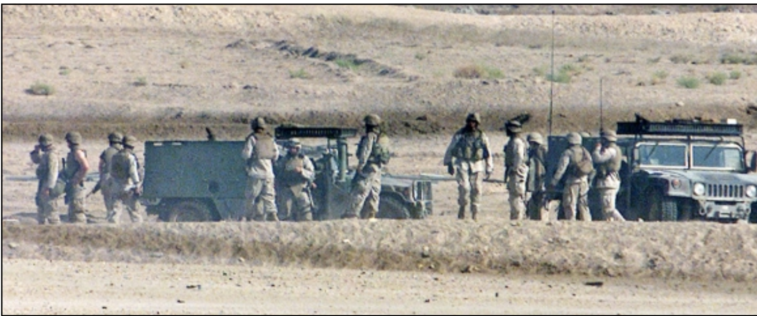
جنود امريكيون يجمعون جثث زملاتهم في موقع هجوم على موكب عسكري امريكي قرب الفلوجة (مس) (رويترز)

وقال احمد الشيباني احد مساعدي الصدر ان السيد مقتدى الصدر توجه بنفسه الى مكتب السيستاني وطالبه بارجاع قوات الشرطة حسب الاتفاق وان السيد عبد العزيز الحكيم قائد المجلس الاعلى للثورة الاسلامية في العراق كان حاضرا زيارة السيد الصدر وقد تدخل لمنع حدوث ازمة جديدة، فيما كان عدد 16 آخرون يسقطون قذائف هاون في القاعدة، ويقتل هؤلاء الجنود يرتفع عدد القتلى الامريكان في العراق الى 988 قتلتوا منذ اجتاح القوات الامريكية في آذار (مارس) 2003 بحسب حصيلة الثناغون.