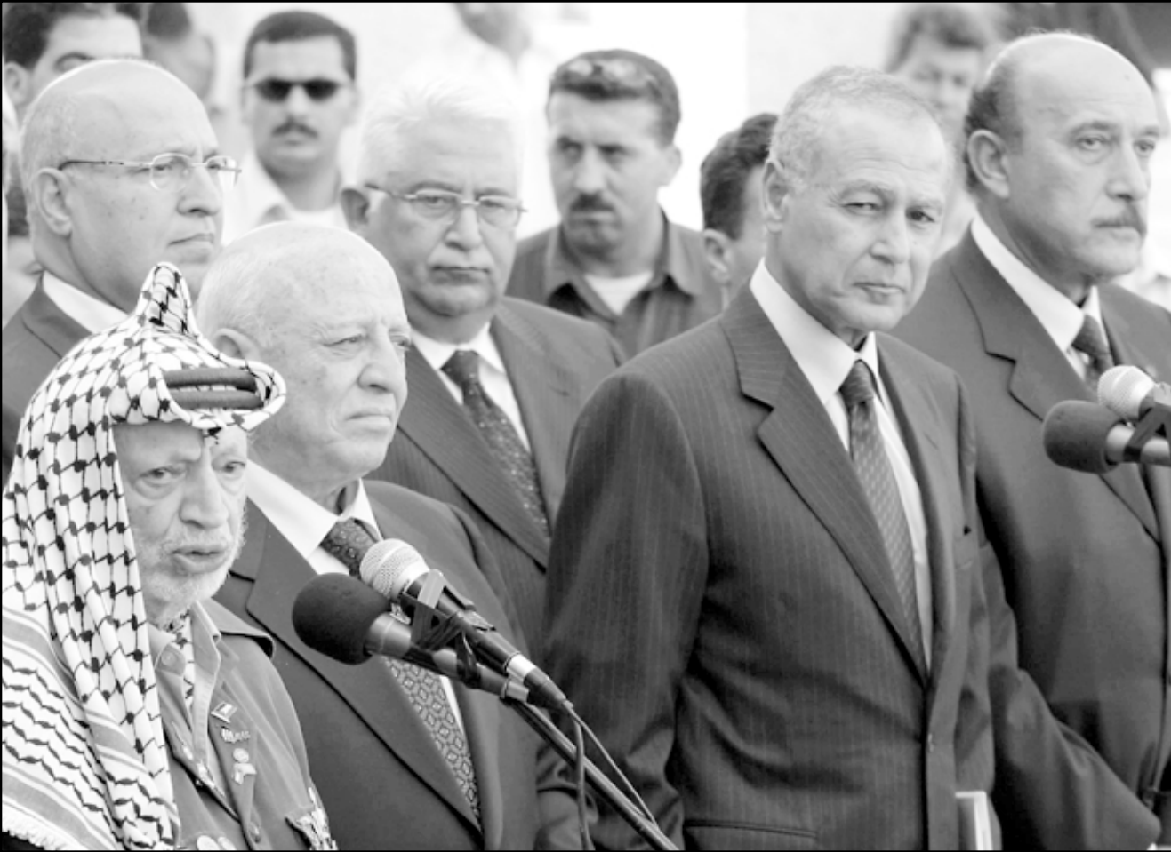
الرئيس عرفات يتحدث للصحافيين في رام الله امس بحضور قريع والمسؤولين المصريين احمد ابو الغيط وعمر سليمان (ا ف ب)

الدمر. وكانت الزيارة مقررة الاربعة الايام الماضية لكنها تأجلت بسبب العملية الفدائية المزبوجة التي وقعت في بنتر السبع وادت الى مصرع ستة عشر إسرائيلياً وإصابة العشرات، وهذه المرة الأولى التي تهبط فيها طائرات مروحية في ذلك المهبط منذ الهجوم الإسرائيلي على مقر عرفات قبل نحو عامين.