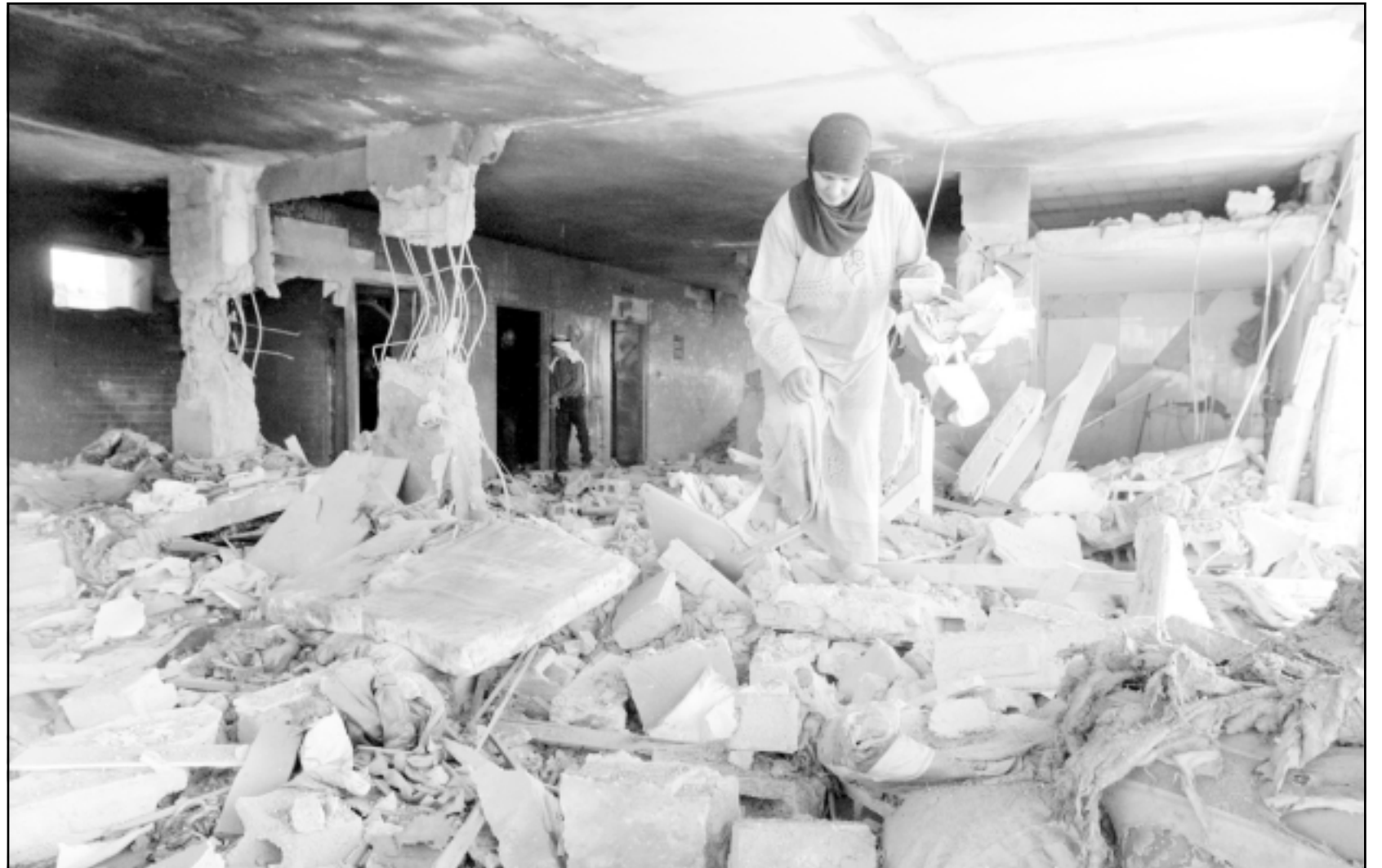
سيدة تتفقد ركام العمارة السكنية الذي دمرها الإسرائيليون في مخيم الدهيشة امس

على مجموعة من راشقي الحجارة في القرية، وفقاً للمصدر نفسه. وفي طوباس جنوب جنين جرح اربعة فلسطينيين في تبادل لاطلاق النار خلال مواجهات مع مجموعة من الجنود دخلوا المدينة، حسب ما أفادت مصادر أمنية فلسطينية. فرض سمس في قرية سيلة الظهر قرب جنين بعد عرض حظر التجول فيها، كما أفادت مصادر أمنية. وجرح طفل فلسطيني في الثانية عشرة من العمر برصاصة في كتفه عندما فتح الجنود النار