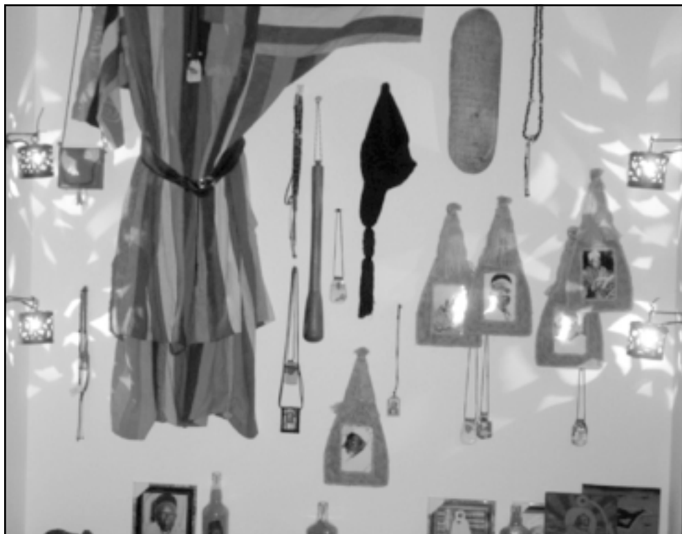
لقعتان من المعرض

الرائع للمعرض، كما أنها استطاعت أن تقف عند محطات مهمة في حياة المسلمين بشكل عام، بعيداً عن الأفكار الساذجة، ولغة وسائل الاعلام، والوصف التي وصلت حد الابتذال، وثقافة الارهاب والافصاء».