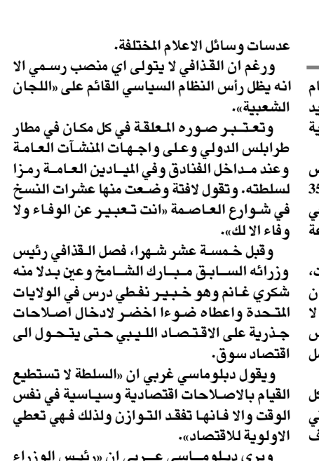
العقيد عمر القذافي

دعوات وسائل الاعلام المختلفة. ورغم ان القذافي لا يتولى اي منصب رسمي الا انه يظل رأس النظام السياسي القائم على «اللجان الشعبية».