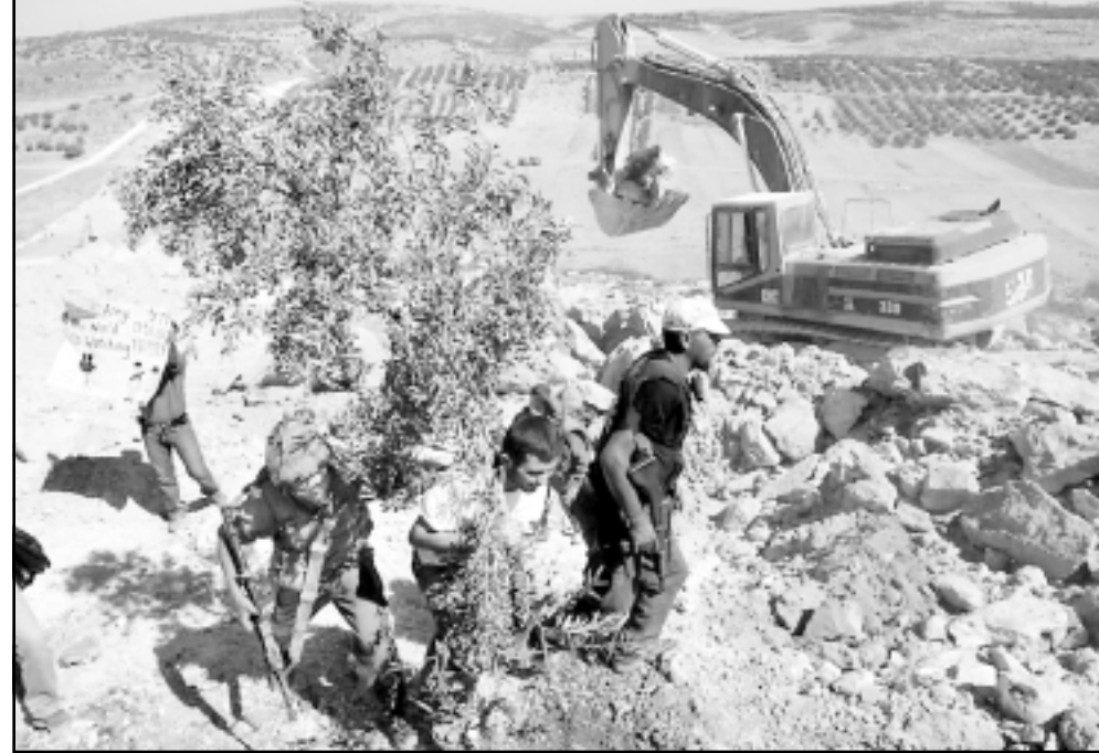
فلسطيني ينقل شجرة زيتون اقتلعته جرافة اسرائيلية أثناء ارضية فلسطينية صودرت لبناء الجدار العازل قرب الخليل

■ راحة القهوة اجذبنا الى «ميتي ماركت السلام» في ضاحية السلام في عناتا في شرقي القدس. هذا الحي ضم الى اسرائيل في عام 1967 واغلبية سكانه تحولوا الى سكان «القدس الموحدة». وحصلوا على بطاقات هوية زرقاء. في ليلة 8/31 المتصدم اجتاحت القوات الاسرائيلية المكان وانزعت الرجال من سن 16-80 من أسرة نومهم واقتادتهم الى قاعدة حرس الحدود الغربية. الجنود دخلوا الى الغرف وقتشوا الخزائن وحتى لا يتحركوا الأطفال المدعورين وحدهم تركوا معهم النساء في البيت وهناك بأن يتم اقتياد كل من يكون هناك من دون هويات اسرائيلية الى السجن والتحقيق في المدة القادمة.