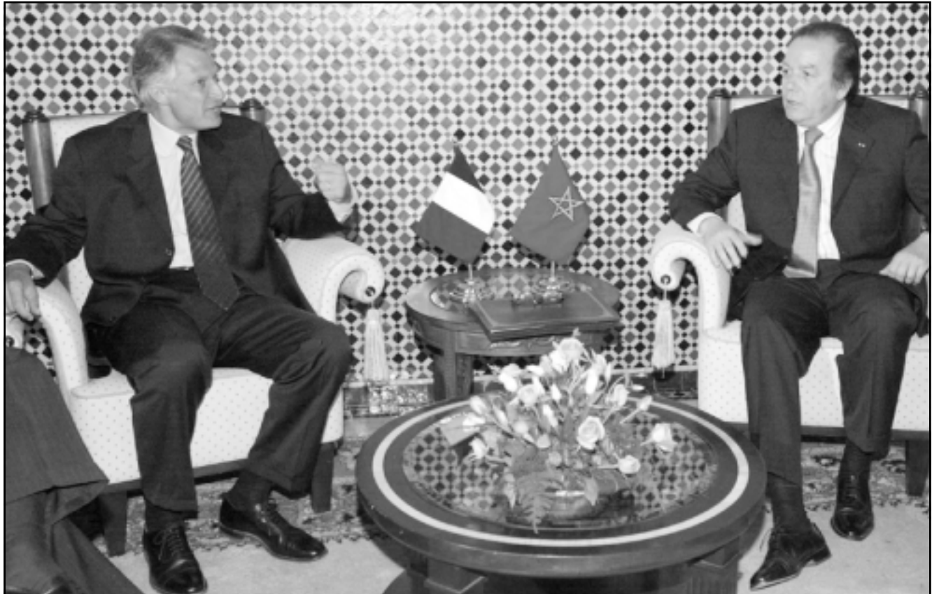
وزير الداخلية المغربي مصطفي الساهل (يمين) لدى استقباله نظيره الفرنسي دومينيك فويليان في فاس

روما - أف ب: اعتبر المفوض الأوروبي القادم روكو بوتفليوني انه من الضروري مساعدة ليبيا لتكثيفها من وقد موجة الهجرة غير المشروعة انطلاقا من اراضيها الى ايطاليا. وقال بوتفليوني في حديث نشرته صحيفة «كورييري ديل سيرا» ان «على ليبيا التي تستقبل مليون باش من جميع انحاء افريقيا ان تشتر بالاطمئنان». ودعا بوتفليوني المفوض الأوروبي القادم لشؤون العمل والحرية والقضايا والهجرة الى اقامة خصومات استقبال للاجئين في ليبيا بمساعدة من أوروبا. وقال «إذا اذرت الليبيين ان كلفة استقبالهم الجموع اليائسة لن تقع على اكتافهم وحدها فانهم سيصبحون أكثر تعاونًا، كما دعا بوتفليوني الى تعديل مرسوم قانون ايطالي يمتن الهجرة لثلاثة اشياء مراكز استقبال مشددة على «عملها الانساني»، وكانت الحكومة ايطالية قد عدلت عن اقتراح هذا الاجراء في مطلع الشهر الحالي بسبب معارضة بعض الشركاء في الائتلاف الحكومي. واعتبر المفوض القادم ايضا انه «يحتاج تشجيع برامج للنمو الاقتصادي الليبي بمساعدة اوروبية»، وقال ان «ليبيا التي تملك إمكانات كبيرة يمكنها ان تستوعب قسما كبيرا» من رافعي الهجرة.