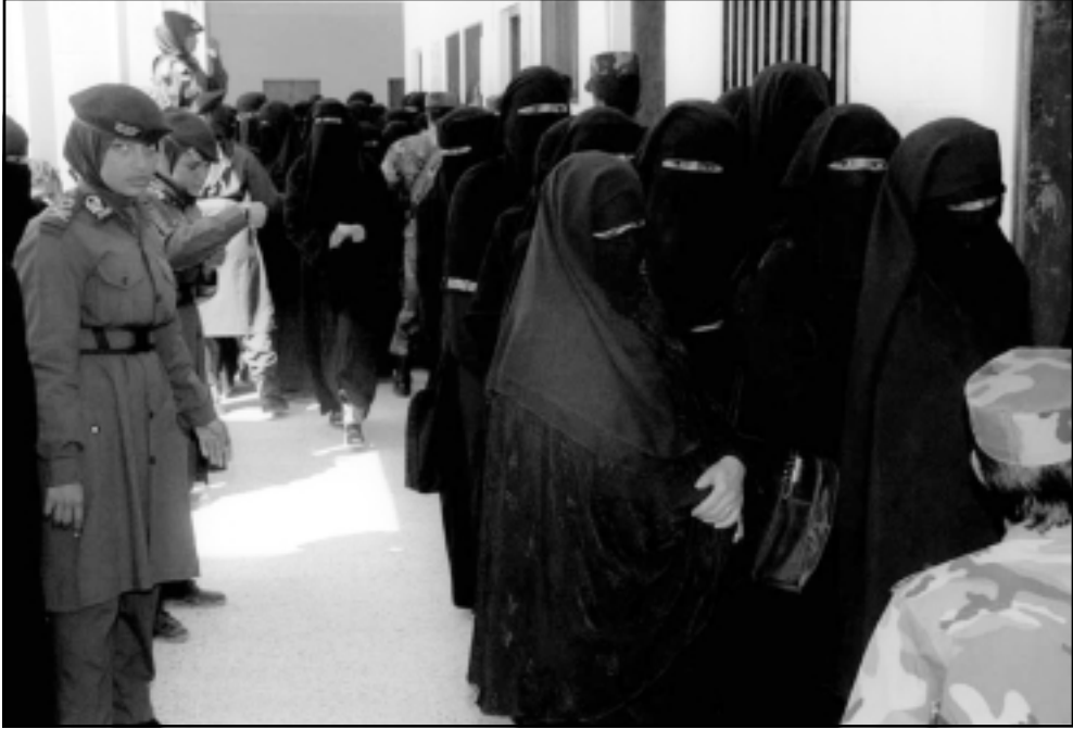
سيدات يعينيات يشاركن في الانتخابات الاخيرة

مطالب بالتضامن من أجل الاتفاق على تعزيز المشاركة السياسية للمرأة في إطار الأحزاب السياسية، بالإضافة إلى المطالبة بتحديد كوتا للنساء من عدد المقاعد النسائية والمحلية وتعديد الدستور وقانون الانتخابات بما يتكفل الحصول على هذه النسبة النسوية، بالإضافة إلى تخصيص دائرة للمرأة في اللجنة العليا للانتخابات ولجانها الفرعية وتمثيلها التمثيل العادل في كافة القطاعات الحزبية والرسمية وإشراكها الفعلي في صناعة القرار داخل الأحزاب وفي أجهزة السلطة. وطالبت القيادات النسوية في الأحزاب اليمنية بالتوزيع العادل للموارد بين الرجال والنساء، بحيث يضمن دعما مماثلا للقطاعات النسوية