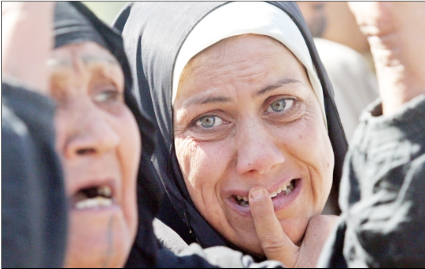
سيدات عراقيات يبكين اقارب لهن من ضحايا الهجوم بالسيارة المفخخة في شارع حيفا ببغداد امس