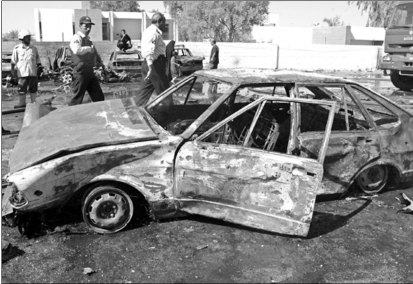
سيارة دمرها الانفجار في بغداد

■ دبي- اف ب: تبنت مجموعة «التوحيد والجهاد» التي يستزعمها الاردني ابو مصعب الزرقاوي امس الثلاثاء على موقع اسلامي على الانترنت الهجومين الداميين للسذين وقعا في بعقوبة وبغداد ووقعا عشرات القتلى والجرحى.