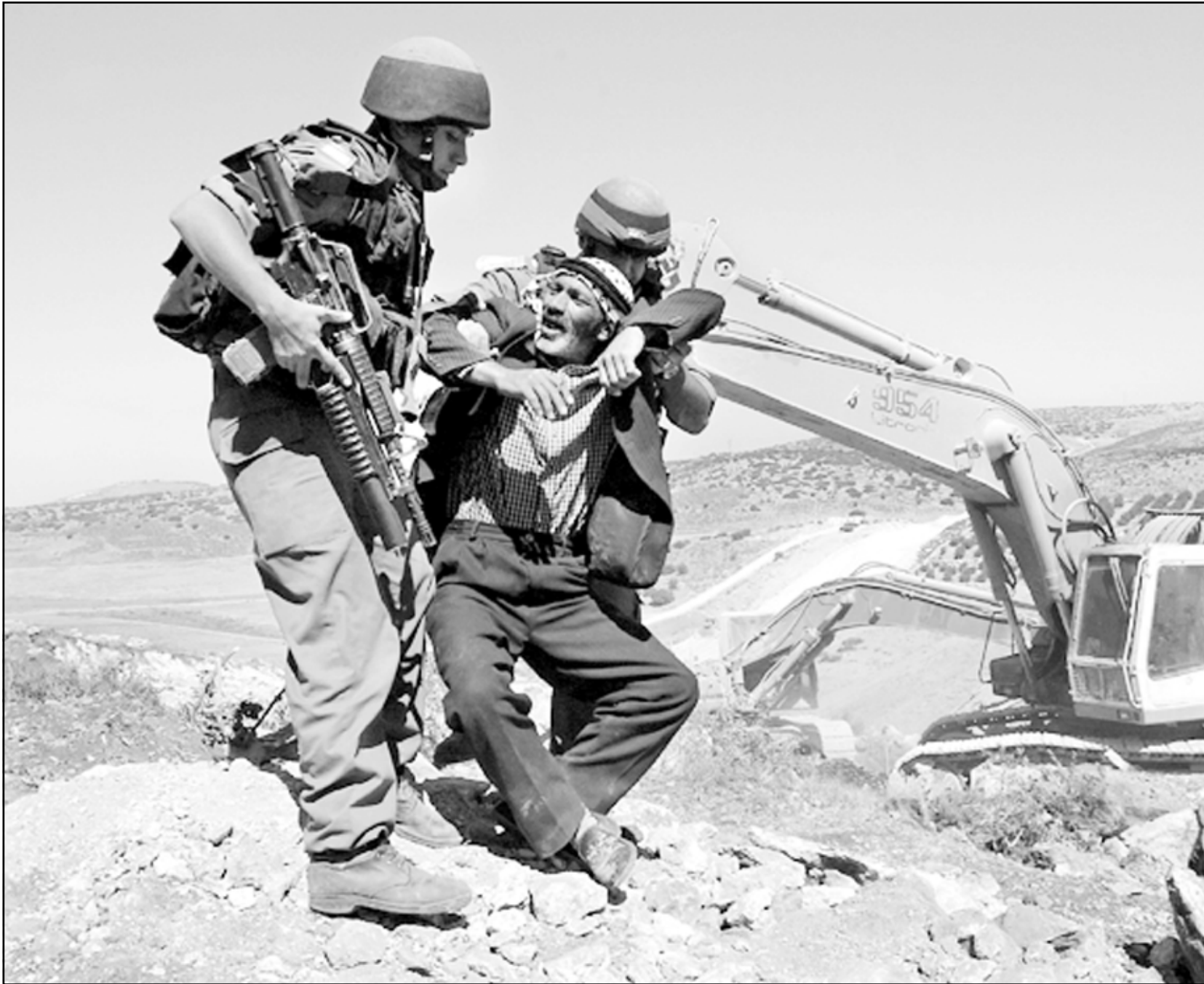
جنديان يبعدان مزارعاً عن أرضه لإكمال أعمال الحفر في أراضي محافظة الخليل وبناء الجدار العازل

وترسيم الحدود مسألة جديدة على المستوى العلني بين عمان ودمشق ولم تكن لاعلامياً على الأقل مطروحة في الماضي لكن في اطار تدقيقات «القدس العربي»، تبين انها مسألة طرحت لأول مرة