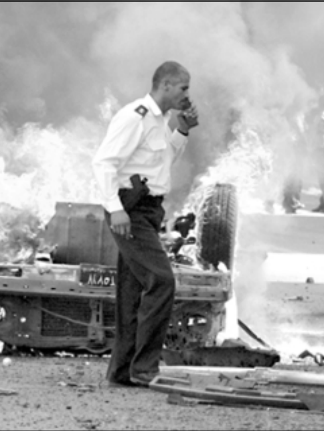
شرطي عراقي امام سيارة دمرها انفجار في وسط بغداد

«نظريا» لدولة ديمقراطية وبرلمان منتخب لا يعيش في ذهن الحالمين. فالوضع الامني يفرض اجندة السياسة في البلاد، وهناك مشاكل في الفلوجة، والمثلث السني، كما ان حكومة علاوي تعاني من «ثورتين» حول بغداد ومع اتباع مقتدى الصدر. وفوق هذا فحكومة العراق المؤقتة تفتقد قسامة السلطة، فهي لا تستطيع على الميليشيات وغير قادرة على دمجها في الجيش العراقي لان اي فصلين من هذه الفصائل لن يوافق على نزع اسلحتها ما لم يضمن حماية واحترام مطالبه. وعليه يرى فرانسيس فوكوياما، احد اطراف اليمين المحافظ في مقال له في «الفايننشال تايمز» ان سيناريو الغاء او تأجيل الانتخابات سيضيع الادارة الامريكية الجديدة امام محك من الخيارات، ففي غياب السياسة الواضحة تجاه العراق، فان هذا يعني شرذمة البلاد والبحث عن تحالفات مع اطراف الصراع او مواصلة العمل على ابقاء وحدة البلاد.