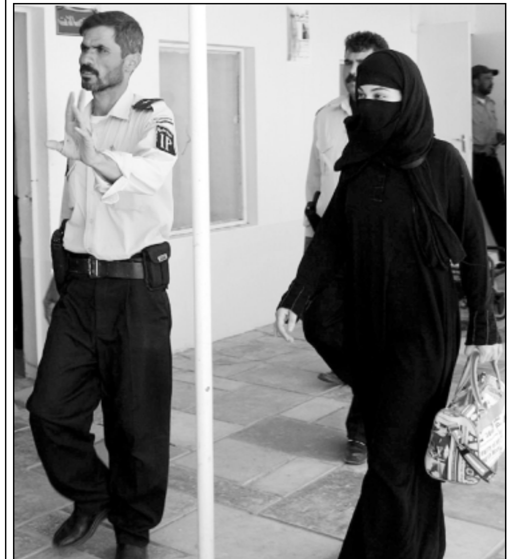
شروطي عراقي مع سيدة تم تحريرها من الكويت بعد خروجها من السجن هناك اثر ادانتها بالاشتراك في محاولة اغتيال جورج بوش الاب عام 1993

الدوحة في سبيل انجاح مهمته. وفي مؤتمر صحافي مقتضب، أعلن فراطو فراطيني انه قابل الداعية الاسلامي الشيخ يوسف القرضاوي في منزله بالدوحة، حيث وعد ببذل جهوده في سبيل الافراج عن الرهينتين. وقال الوزير الايطالي انه خرج من اجتماعه بالقرضاوي بانطباع مؤده ان عمليات الخطف لا علاقة لها بالدين الاسلامي او مبادئه وقيمه. وكان القرضاوي قد أعلن في عدة مناسبات في الالة الاخيرة ادانته لجميع عمليات الخطف والقتل محذرا منها انها تسيء الى الاسلام والسلمين، ومناشدا الخاطفين الافراج عن الرهينتين الايطاليتين والصحافيين الفرنسيين وبقية الرهائن المحتجزين في العراق. وكشف الوزير الايطالي عن اتصالاته بتسليم جرم مع الجانب الفرنسي لتبادل المعلومات «والخبرات» في قضية الخطف رهائتهم، وعندما ستل عام اذا كانت ايطاليا تفكر في سحب قواتها من العراق، تهرب من الرد المباشر مكتفيا بالقول انها ستفعل ذلك اذا طلب منها الرهينتين.