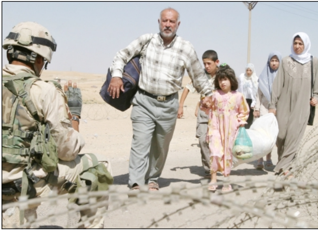
عائلة عراقية تقرب من حاجز امريكي محاولة العودة الى مدينة تلعفر في شمال العراق