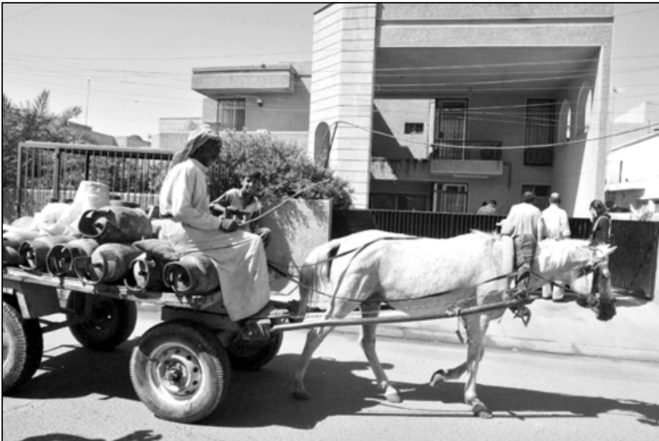
عراقي ينقل اسلوانات الغاز الى منطقة المنصور في بغداد

واكد جيران انهم سمعوا اوامر كانت تصدر باللغة العربية. وقالوا ان الخاطفين كانوا يقولون «امشوا، توفقوا»، ثم وضعوا الاشخاص الثلاثة في سياراتهم الخاصة.