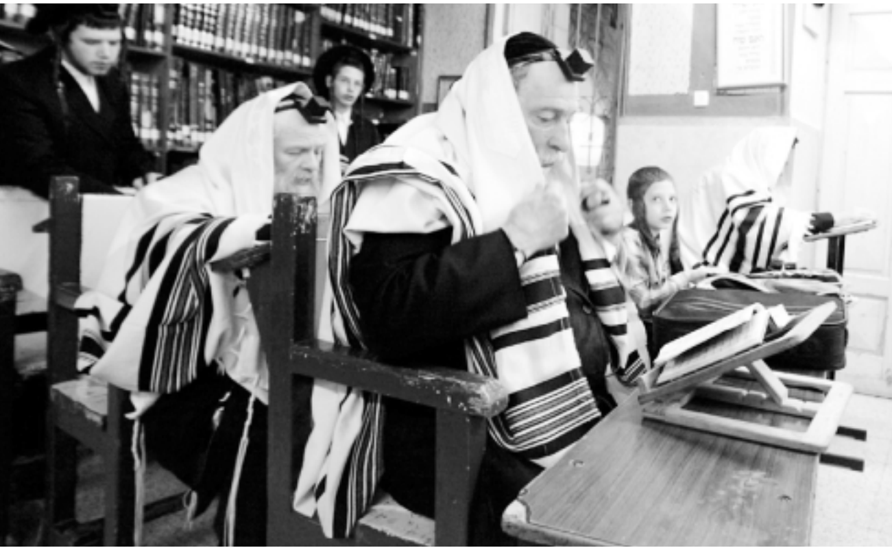
اسرئائليون يحتفلون بعيد راس السنة اليهودي

غير انه في السنة الماضية التي تمسك فيها برئانه