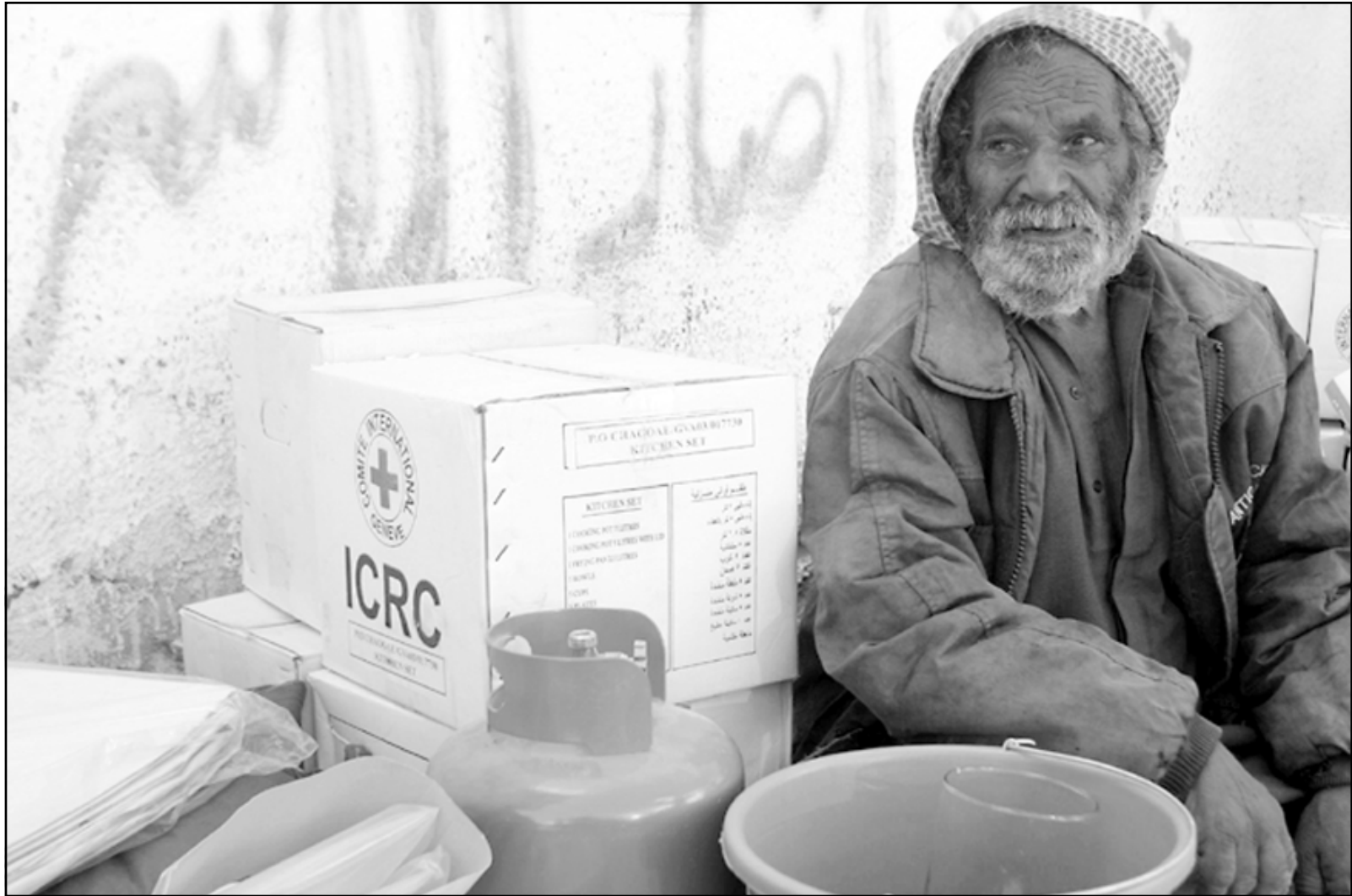
فلسطيني يجلس قرب مساعدات تلقاها من الصليب الاحمر الدولي في غزة أمس (أ ف ب)

رام الله - «القدس العربي» - من وليد عوض: