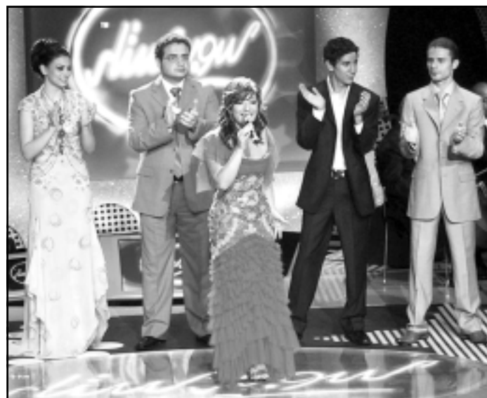
نجوم «سوبر ستار» يحيطون بالفنانة السورية أصالة خلال إحدى سهرات البرنامج

سيكون الجمهور الحب للفن على موعد مع نجوم برنامج سوبر ستار 2 الذي يقدم للمشاهدين نسخة عربية عن أميركان آندول و بوب آندول البريطاني، والذي صنف في دورته الأولى في العام الماضي كأفضل برنامج منوعات في العالم العربي، الساعة الثامنة مساء يومي 23 و 24 سبتمبر الجاري على شاطئ فندق انتركونتيننتال ابوظبي برعاية قناة ميوزك بلاس ومجلة المنارة ومجهرات المنارة والشركة الوطنية للمواصلات والامارات للخدمات الهاتفية، بعد النجاح الذي شهده الحفل الأول على مسرح ميلاء السلاطيم بجميلة الجيرة في دبي؟ وسيكون في مقدمة النجوم المشاهدين لسوبر ستار 2 الوهبة الإماراتية الواعدة رانيا شعبان وكل من أمين الأعتز، وعمار حسن، وهادي أسود، ومهند مشعل، وعبد الرحمن محمد، وحسن الشامي، ووعد البحري، وزاهي صافي، وياسمين الحسيني؟ كما ستحل الفنانة الكبيرة صباح ضيفة شرف على الحفل وسيتم تكريمها لتاريخها الفني الطويل، وسيقوم النجوم بجولة سياحية في مركز مارينا التجاري حيث يلتقون