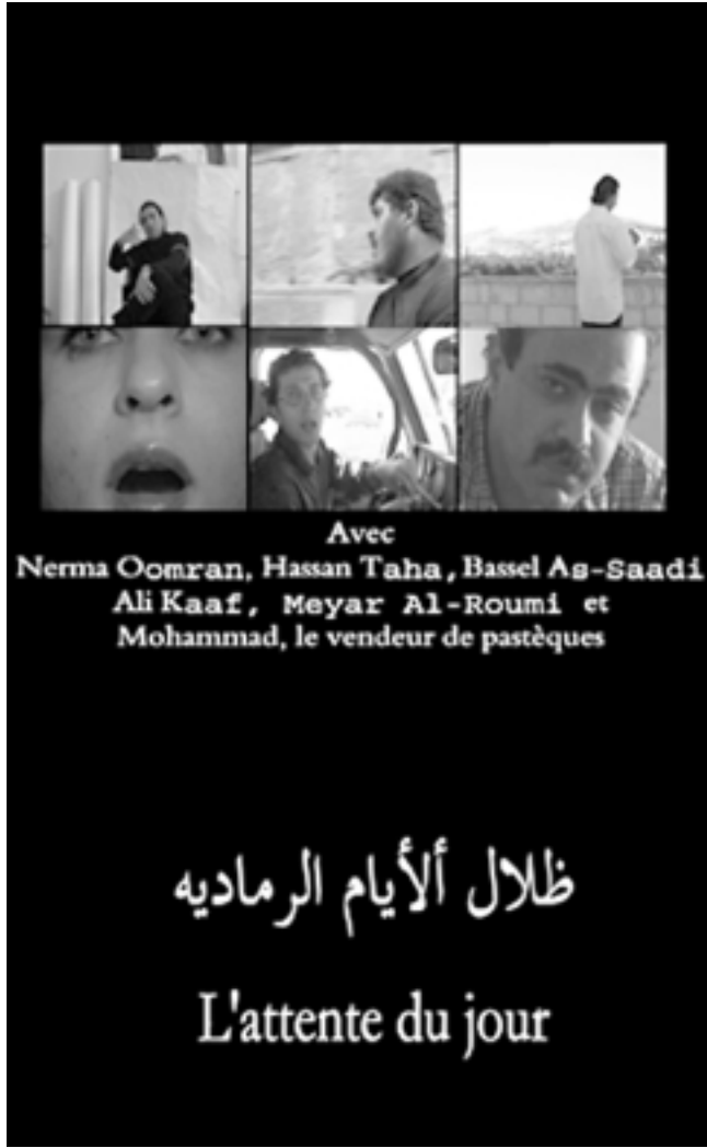
ملصق الفيلم «القدس العربي»

الفيلم أن من الناحية التوثيقية قدم توصيفا لها دون بحث عن المتبقة من الواقع الفني في سورية عبر هؤلاء الفنانين، ولكن يمكن ملاحظة أن الفيلم عانى أحيانًا من اللقطات غير المبررة مثل التقريب الكثير لوجه عمران وشفتيها، رغم أن الغناء أوغريًا يخرج من الحجره بالأساس، وسقط لقطات لوجوه المشاركين بدت مجانبية ولم تصل دلالاتها للمتلقي، ومجانبة لعل صوت سائكة في مكان واحد لكل فنان، ما عدا عمل قاف الذي قدم مشروع لوحة أمام الكاميرا، ولكن التعاطف مع هذا الفنان ربما يأخذ بعدا سلبيًا نتيجة مشاهدة طريقة انجازها الملامية